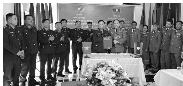
● Lãnh đạo Công an tỉnh Savannakhet và Bộ Chỉ huy Bộ đội Biên phòng Quảng Trị ký kết biên bản hội đàm thường niên 2024.

Tại TP Kaysone Phomvihane, tỉnh Savannakhet (Lào) vừa diễn ra hội đàm thường niên năm 2024 giữa Công an tỉnh Savannakhet và Bộ Chỉ huy Bộ đội Biên phòng tỉnh Quảng Trị.