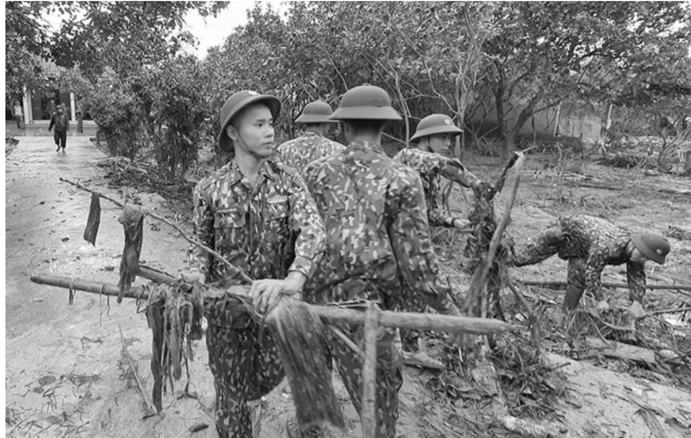
● Đề xuất các hình thức, biện pháp cứu trợ, hỗ trợ khi tình trạng khẩn cấp xảy ra.

Về hỗ trợ trung và dài hạn, dự thảo nêu rõ, hỗ trợ trung hạn được thực hiện tiếp theo cứu trợ khẩn cấp, tập trung vào hỗ trợ giống cây trồng, vật nuôi, vật tư, trang thiết bị, nhiên liệu thiết yếu khác để phục hồi sản xuất; cung ứng vật tư, hàng hóa thiết yếu và thực hiện các biện pháp quản lý giá, bình ổn thị trường; sửa chữa, khôi phục trụ sở, công trình phòng,