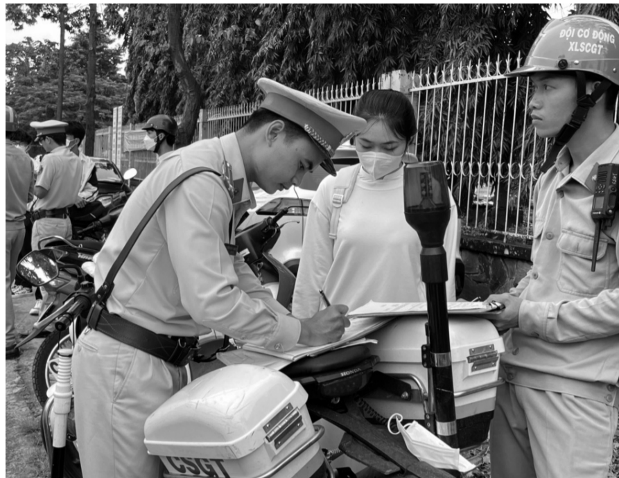
● Việc một bộ phận học sinh, sinh viên thiếu hiểu biết về pháp luật là một thực trạng đáng báo động.

Thực tế hiện nay cho thấy đang có một số “lỗ hổng” trong nhận thức về pháp luật của một bộ phận học sinh,