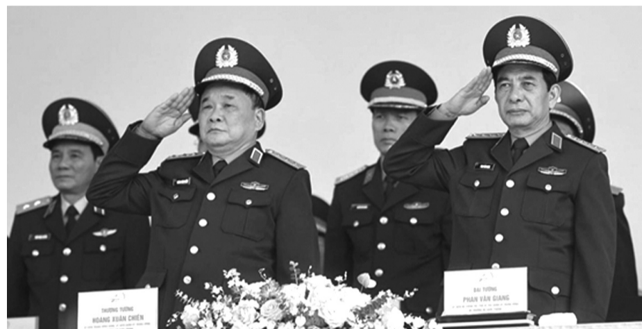
● Đại tướng Phan Văn Giang (ngoài cùng bên phải) tại buổi hợp luyện.

quân Việt Nam, trình diễn võ thuật của Bộ đội Đặc công và huấn luyện quân khuyến của Bộ đội Biên phòng. Số lượng máy bay trình diễn tại Triển lãm lần này sẽ nhiều hơn so với Triển lãm QPQTVN lần thứ nhất năm 2022. Dự kiến 10 máy bay SU-30MK2 sẽ bay theo đội hình 3-4-3 và 10 trực thăng bay theo đội hình 3-4-3 tại Lễ khai mạc.