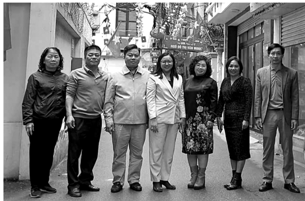
● Bí thư Chi bộ, Ban Công tác mặt trận và các chi hội tổ dân phố số 2, phường Quảng An, quận Tây Hồ chụp ảnh lưu niệm tại tuyến ngõ văn minh (ngõ 34 đường Âu Cơ).