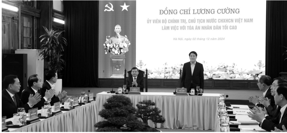
● Chủ tịch nước Lương Cường đề nghị ngành Tòa án tiếp tục làm tốt hơn công tác phối hợp với các ban, Bộ, ngành.