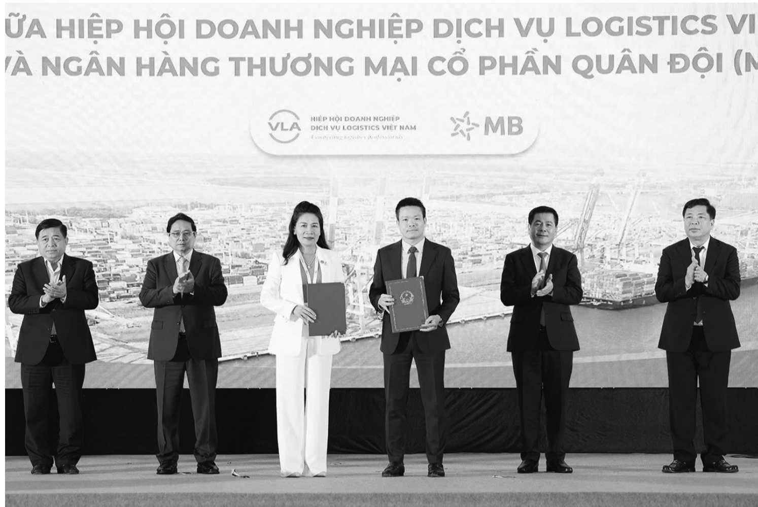
Thủ tướng Phạm Minh Chính chứng kiến Lễ trao biên bản hợp tác giữa một số đơn vị.