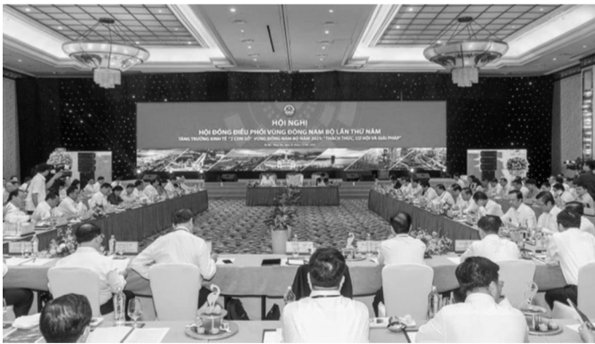
● Hội nghị có chủ đề “Tăng trưởng kinh tế “2 con số” vùng Đông Nam Bộ năm 2025: Thách thức, cơ hội và giải pháp”.

Tăng cường ứng dụng công nghệ thông tin và chuyển đổi số trong lĩnh vực THADS. Coi đây là nhiệm vụ chính trị quan trọng và ưu tiên của toàn hệ thống. Quan tâm hơn tới việc bảo đảm nguồn lực kinh phí đầu tư công, kho vật chứng, trụ sở cơ quan THADS. K.QUY