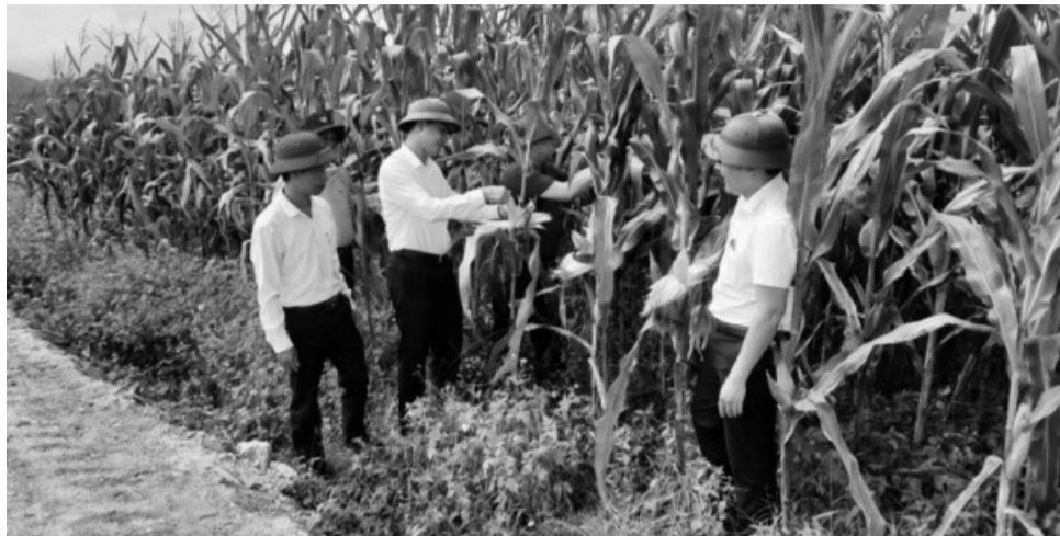
● Cán bộ NHCSXH huyện Anh Sơn thăm mô hình kinh tế của hộ gia đình đã vươn lên thoát nghèo, làm giàu nhờ nguồn vốn vay của NHCSXH huyện Anh Sơn.