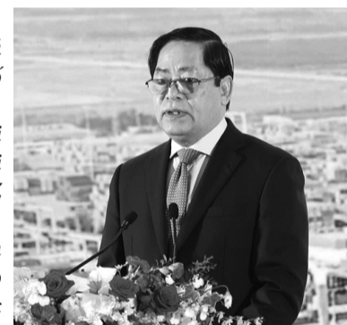
Bí thư Tỉnh ủy BR-VT Phạm Viết Thanh phát biểu tại Diễn đàn.

Đến nay, BR-VT đã thu hút gần 1.200 dự án đầu tư trong và ngoài nước với tổng vốn đầu tư đạt khoảng 50 tỷ USD. Trong đó, có hơn 490 dự án có vốn đầu tư nước ngoài (FDI) với tổng vốn đầu tư khoảng 34 tỷ USD. Tỉnh có nguồn nhân lực trẻ, có năng suất lao động cao gấp 2,8 lần bình quân chung cả nước. Đây chính là những thế mạnh và điều kiện để BR-VT phát huy tốt những tiềm năng sẵn có, để phát triển mạnh ngành Logistics hơn nữa, phục vụ FTZ.