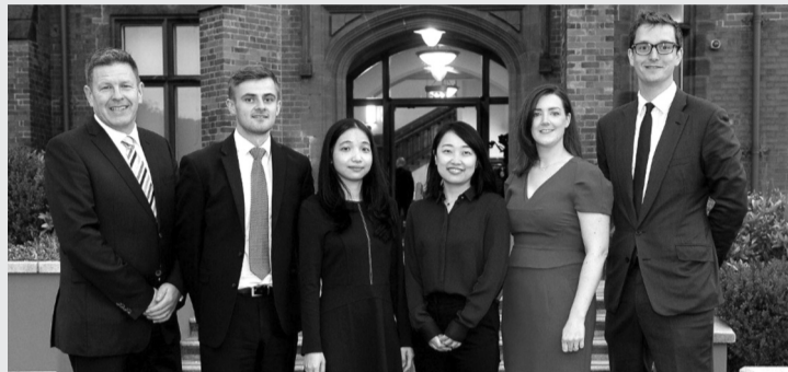
● Các luật sư trong nước và nước ngoài hoạt động tại thị trường Trung Quốc có thể được Chính phủ huy động tham gia giải quyết tranh chấp thương mại và đầu tư quốc tế. (Ảnh minh họa: irishlegal.com)

Là nước láng giềng với Việt Nam, Trung Quốc đã thực hiện nhiều chính sách xây dựng và phát triển đội ngũ luật sư tư vấn cho Chính phủ về thương mại và đầu tư quốc tế từ khi mở cửa nền kinh tế, nhất là thực thi khá tốt chính sách hợp tác công - tư. Qua đó, giúp giải quyết tốt những vấn đề về thương mại và đầu tư quốc tế phát sinh.