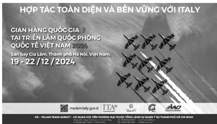
● Triển lãm Quốc phòng quốc tế Việt Nam 2024.

Việt Nam và Ý chính thức thiết lập quan hệ ngoại giao vào ngày 23/3/1973. Trong hơn 50 năm qua, quan hệ hợp tác hữu