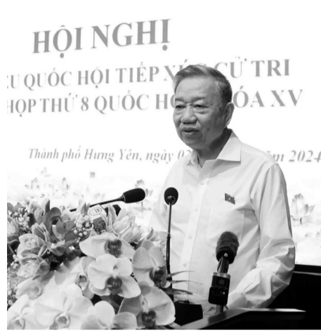
● Tổng Bí thư Tô Lâm phát biểu tại buổi tiếp xúc cử tri.

Vui mừng nhận thấy, nhiều chỉ số phát triển của tỉnh Hưng Yên đã đạt và vượt kế hoạch đề ra, Tổng Bí thư nhấn mạnh, những năm gần đây, Hưng Yên là