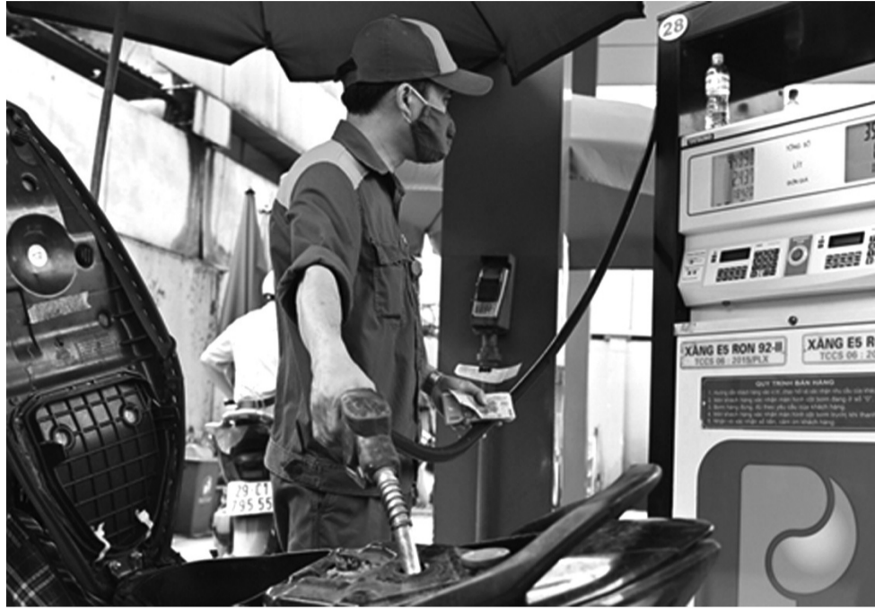
● Cần sửa nghị định để xăng dầu có thị trường đúng nghĩa.

Đại diện TNPP cho rằng, quy định mới chưa thực sự thay đổi khi vẫn quy định chi phí tạo nguồn, chi phí kinh doanh định mức, lợi nhuận định mức... là một mức cụ thể. Tức là, vẫn theo công thức là Nhà nước định giá, nhưng chỉ khác quy định cũ là DN thay Nhà nước thực hiện phép tính cộng.