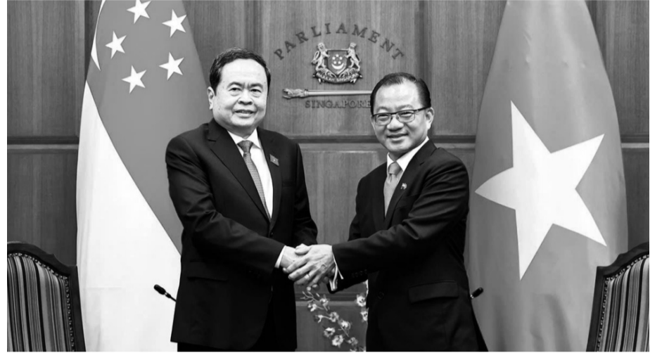
● Chủ tịch Quốc hội Trần Thanh Mẫn và Chủ tịch Quốc hội Seah Kian Peng.

Trong khuôn khổ chuyến thăm chính thức Singapore, sáng 2/12, sau Lễ đón chính thức, Chủ tịch Quốc hội (QH) Trần Thanh Mẫn đã hội đàm với Chủ tịch QH Singapore Seah Kian Peng. Hai bên đã trao đổi sâu rộng về các định hướng lớn và các biện pháp nhằm tăng cường hợp tác và nâng tầm quan hệ trong thời gian tới.