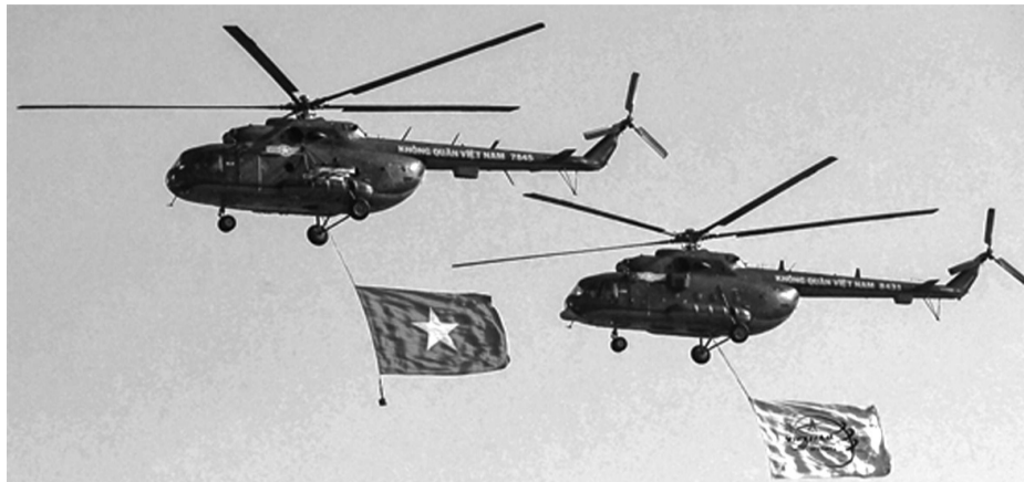
● Trực thăng treo cờ Tổ quốc bay qua khán đài trong buổi hợp luyện.

Điểm nhấn của Lễ khai mạc là hoạt động bay chào mừng của lực lượng Không