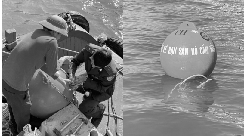
● Hoạt động thả phao khoanh vùng bảo vệ rạn san hô tại Vườn Quốc gia Cát Bà.