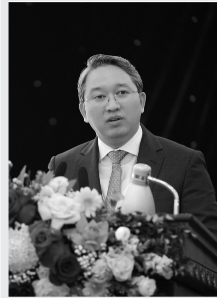
● Bộ trưởng Nguyễn Hải Ninh phát biểu kết luận Hội nghị.

Đây là một trong những nhấn mạnh của Bộ trưởng Bộ Tư pháp Nguyễn Hải Ninh tại Hội nghị triển khai thực hiện chỉ tiêu, nhiệm vụ thi hành án dân sự (THADS), thi hành án hành chính (THAHC) năm 2025 diễn ra sáng 2/12.