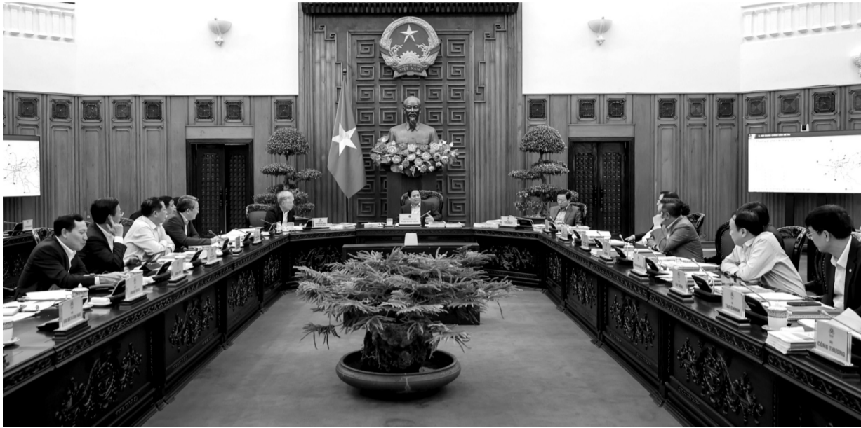
● Thủ tướng Phạm Minh Chính lưu ý, phải phòng, chống tiêu cực, tham nhũng trong suốt quá trình triển khai Đề án.

Yêu cầu trên được Thủ tướng Phạm Minh Chính, Trưởng Ban Chỉ đạo Nhà nước các công trình, dự án quan trọng quốc gia, trọng điểm ngành Giao thông vận tải đặt ra khi chủ trì họp Thường trực Chính phủ với Bộ Giao thông vận tải, UBND TP Hà Nội, TP Hồ Chí Minh (TP HCM) và các Bộ, ngành liên quan về Đề án hệ thống đường sắt đô thị tại hai thành phố chuẩn bị trình cấp có thẩm quyền, diễn ra ngày 5/12.