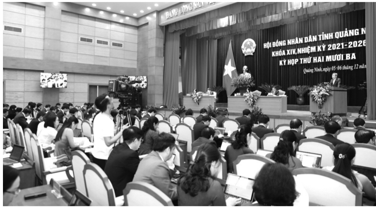
● Quang cảnh phiên họp.

Tốc độ tăng trưởng kinh tế của tỉnh tuy có sụt giảm so với cùng kỳ, song vẫn cao hơn bình quân chung cả nước. Thu ngân sách nhà nước phân đầu đạt 100% kế hoạch; thu hút đầu tư trực tiếp nước ngoài đạt trên 2 tỷ USD, nằm trong nhóm các địa phương dẫn đầu cả nước. Công nghiệp chế biến, chế tạo tiếp tục là động lực tăng trưởng chính, tăng 20,45%, cao hơn 4,05 điểm % cùng kỳ. Tổng khách du lịch đạt 19 triệu