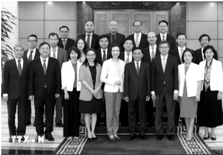
● Đổng chí Trần Cẩm Tú với các Trưởng cơ quan đại diện Việt Nam ở nước ngoài.

Thường trực Ban Bí thư Trần Cẩm Tú đề nghị các Đại sứ, Trưởng Cơ quan