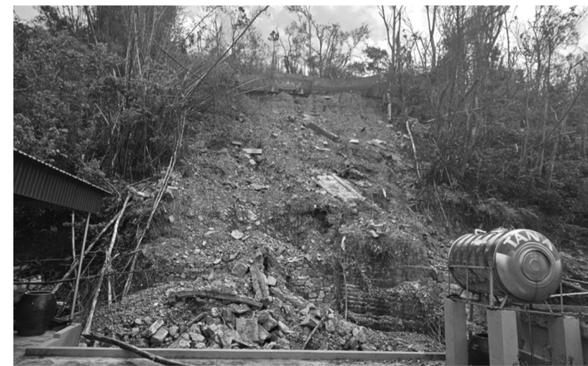
● Một điểm sạt lở tại quận Đồ Sơn sau bão số 3.

công trình thủy lợi, Sở đã báo cáo đề xuất TP bố trí kinh phí nghiên cứu xây dựng đề án bảo vệ cải thiện chất lượng nước sông Giá và sông Đa Độ; đầu tư hạng mục thủy lợi phục vụ phát triển sản xuất nông