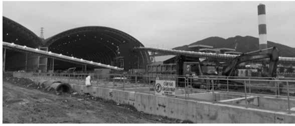
● Một góc công trình Nhà máy Nhiệt điện Vũng Áng 2.

Cty 319 đã nhiều lần có văn bản gửi Tân Nhật Minh phản ánh các vấn đề trên. Để bảo đảm tiến độ chất lượng công trình, Tân Nhật Minh đã tạm dừng thi công, yêu cầu Hoàng Nguyễn quyết toán gần 33 tỷ đồng đã tạm ứng; đồng thời chấm dứt hợp đồng thuê phương tiện; yêu cầu di chuyển các phương tiện ra khỏi hiện trường để đưa phương tiện, thiết bị khác vào thi công.