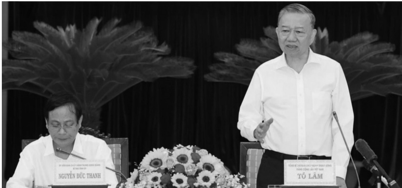
● Tổng Bí thư Tô Lâm yêu cầu chuẩn bị tốt các điều kiện để khởi động lại Nhà máy điện hạt nhân Ninh Thuận.

Sáng 5/12, Tổng Bí thư Tô Lâm và Đoàn công tác của Trung ương đã đến thăm và làm việc với Ban Thường vụ Tỉnh ủy Ninh Thuận về kết quả thực hiện Nghị quyết Đại hội đại biểu toàn quốc lần thứ XIII của Đảng và Nghị quyết Đại hội Đảng bộ tỉnh lần thứ XIV nhiệm kỳ 2020 - 2025; kết quả triển khai thực hiện Chỉ thị 35-CT/TW của Bộ Chính trị về Đại hội Đảng bộ các cấp tiến tới Đại hội đại biểu toàn quốc lần thứ XIV của Đảng; quá trình triển khai chủ trương đầu tư Dự án điện hạt nhân Ninh Thuận thời gian qua.