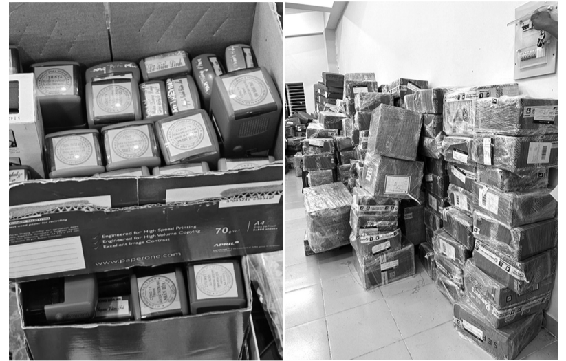
● Tang vật trong một vụ mua bán trái phép hóa đơn.