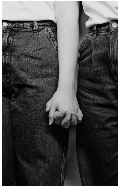
● Một số trẻ vị thành niên có hành vi tình dục đồng giới dẫn đến các nguy cơ bệnh tật, tổn thương tâm lý.

Vấn đề trở nên nghiêm trọng hơn khi các em không được giáo dục đầy đủ về sức khỏe sinh sản và tình dục an toàn. Nhiều bạn trẻ tin rằng mối quan hệ đồng giới không thể lây lan các bệnh qua đường tình