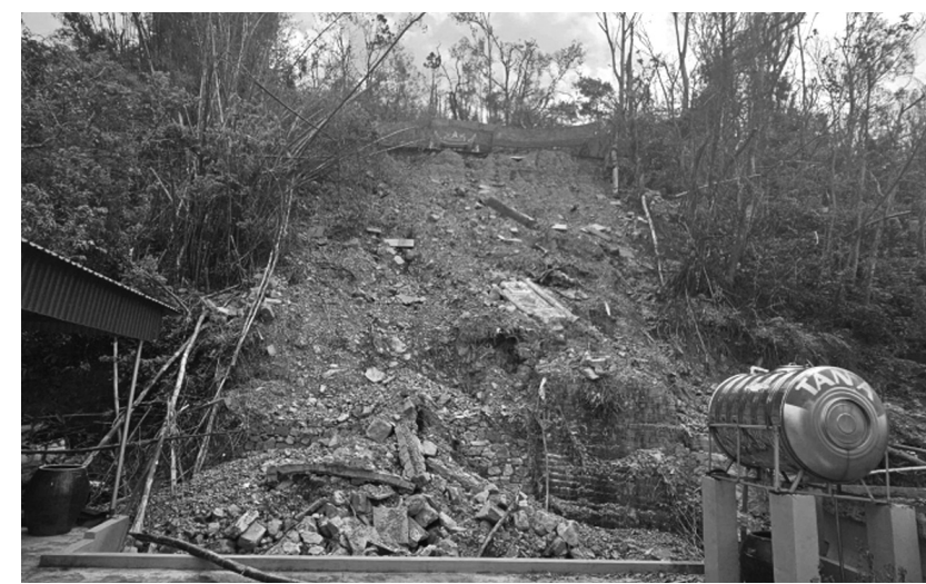
● Một điểm sạt lở tại quận Đồ Sơn sau bão số 3.

Ông Tùng cho biết, TP sẵn sàng giải quyết thủ tục nghỉ công tác cho các cán bộ công chức dôi dư, cán bộ, công chức cấp xã và người hoạt động không chuyên trách cấp xã dôi dư có nguyện vọng nghỉ công tác trước 1/1/2025 để bảo đảm giữ được một số chế độ chính sách tốt hơn so với nghỉ sau ngày 1/1/2025.