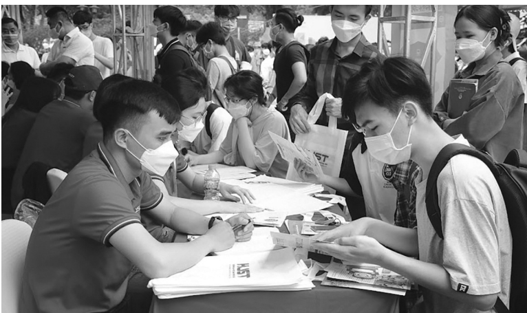
● Tuyển sinh năm 2025 có nhiều thay đổi theo CTGDPT 2018. (Ảnh minh họa: PV)

Hiệp hội các trường ĐH, CĐ cho rằng, số môn thi và việc HS biết trước môn thi hoàn toàn giống với thi THPT cách đây hơn 40 năm. Tuy nhiên, việc thi 4 môn năm 2025 có điểm đặc biệt mới với 36 cách lựa chọn các môn thi, thay vì 4 tổ hợp như trước đây. Nếu tổ chức thi theo từng môn thi độc lập,