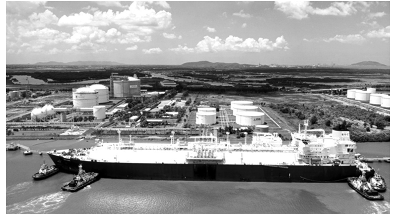
● Tính đến tháng 11/2024, PV GAS LNG đã nhập khẩu thành công 4 chuyến tàu LNG.

Trong công tác chuẩn bị nguồn cung định hạn cho giai đoạn vận hành thương mại Kho LNG Thị Vải 1 MMTPA, PV GAS LNG đã tích cực làm việc với các nhà cung cấp uy tín để tìm kiếm các cơ hội hợp tác dài hạn, hướng đến việc