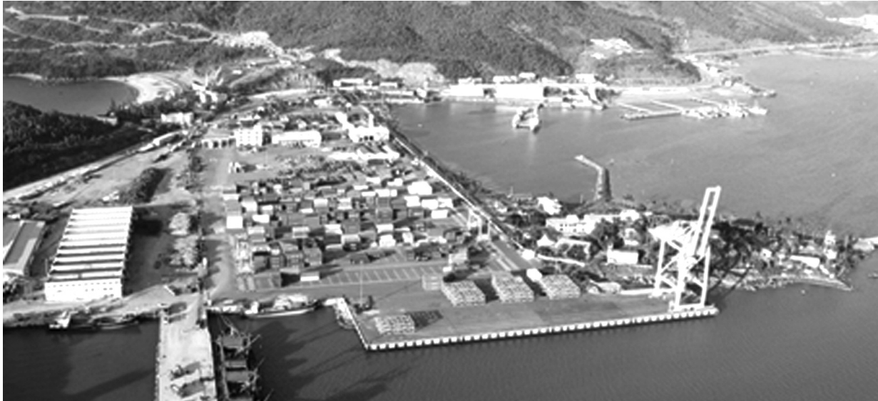
● Khu thương mại tự do Đà Nẵng sẽ được hình thành gắn với cảng Liên Chiểu.

Khu thương mại tự do (FTZ) đóng vai trò quan trọng trong tạo động lực phát triển kinh tế. FTZ mang lại nhiều lợi thế như giúp doanh nghiệp giảm chi phí và tăng cường khả năng cạnh tranh trên thị trường quốc tế (thông qua việc tạo điều kiện thuận lợi cho việc nhập khẩu và xuất khẩu hàng hóa mà không phải chịu thuế ngay lập tức); Đồng thời là một trong những công cụ mạnh mẽ để thu hút đầu tư nước ngoài.