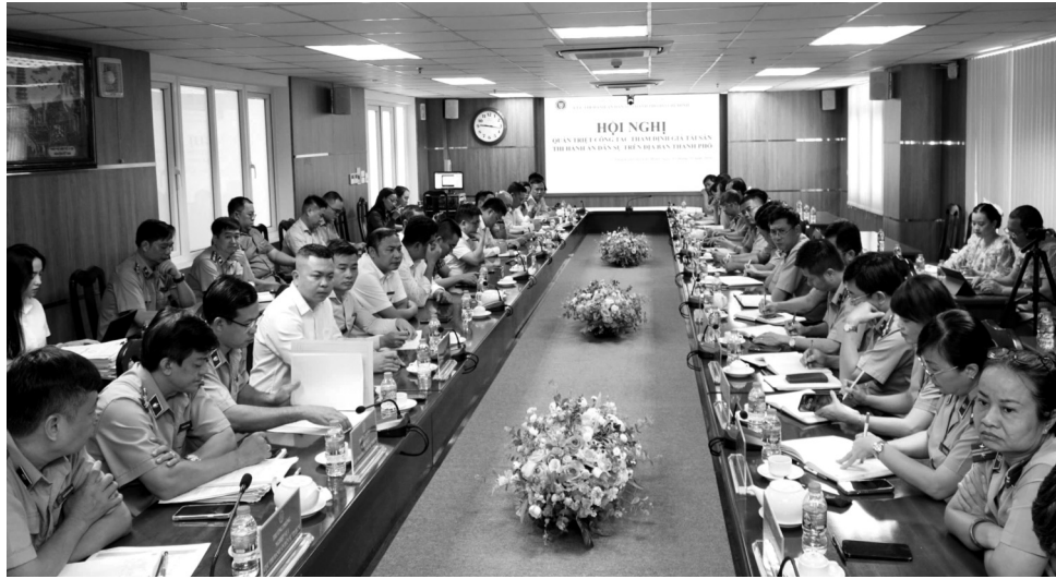
● Hội nghị quán triệt công tác thẩm định giá tài sản thi hành án dân sự trên địa bàn TP Hồ Chí Minh.

Cục THADS Thành phố Hồ Chí Minh (TP HCM) là đơn vị có khối lượng công việc lớn nhất cả nước. So với 63 tỉnh, thành phố khác, công tác THADS tại TP HCM luôn có tổng số thụ lý phải thi hành về việc và về tiền lớn nhất. Năm