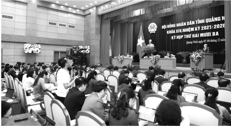
● Quang cảnh phiên họp. (Ảnh: PV)

Tốc độ tăng trưởng kinh tế của tỉnh tuy có sụt giảm so với cùng kỳ, song vẫn cao hơn bình quân chung cả nước. Thu ngân sách nhà nước phân đầu đạt 100% kế hoạch; thu hút đầu tư trực tiếp nước ngoài đạt trên 2 tỷ USD, nằm trong nhóm các địa phương dẫn đầu cả nước. Công nghiệp chế biến, chế tạo tiếp tục là động lực tăng trưởng chính, tăng 20,45%, cao hơn 4,05 điểm % cùng kỳ. Tổng khách du lịch đạt 19 triệu