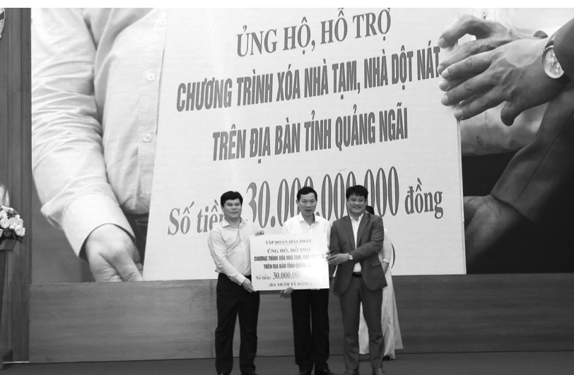
● Quảng Ngãi vừa phát động phong trào ủng hộ xóa NT, NDN.

Cáo trạng nêu, với việc BV Đa khoa TP Cần Thơ trả 412 triệu đồng phần chênh lệch giữa xét nghiệm bằng phương pháp “tách chiết tay và tách chiết tự động” cho Cty Việt Á là có dấu hiệu vi phạm pháp luật khác, CQĐT sẽ tiếp tục làm rõ. ĐÌNH THƯƠNG