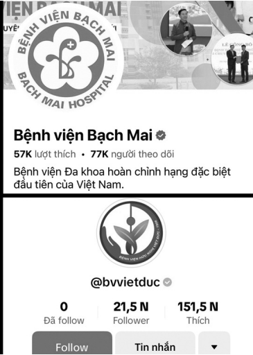
● Người dân nên tiếp cận thông tin trên mạng xã hội từ các nguồn uy tín.

ra tranh cãi mà còn khiến nhiều người bắt chước làm theo.