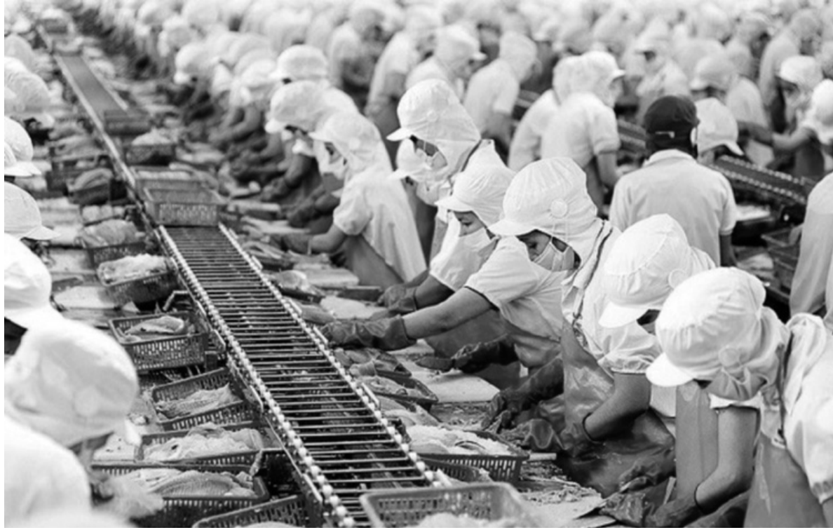
● Thủy sản là một trong những lĩnh vực chủ lực ghi nhận sự tăng trưởng mạnh mẽ.

Nếu tiếp tục duy trì đà xuất khẩu tháng 12 như các tháng trước, dự kiến xuất khẩu nông, lâm, thủy sản Việt Nam của năm 2024 sẽ đạt con số kỷ lục - khoảng 60 - 61 tỷ USD.