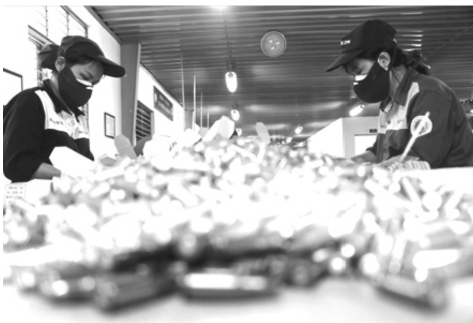
● Công nhân Nhà máy xếp đạn vào hộp giấy nhỏ trước khi bảo quản trong hộp sắt chuyên dụng.