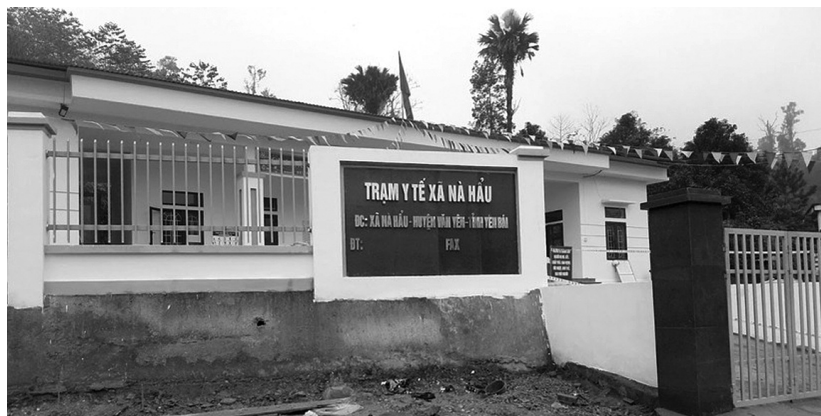
● Trạm Y tế xã Nà Hẩu (huyện Văn Yên, tỉnh Yên Bái) nằm trong dự án hỗ trợ của WB.

Mục tiêu của đề án đề ra 439 TYT áp dụng bảng kiểm chất lượng, thì thực tế số trạm áp dụng là 1.040