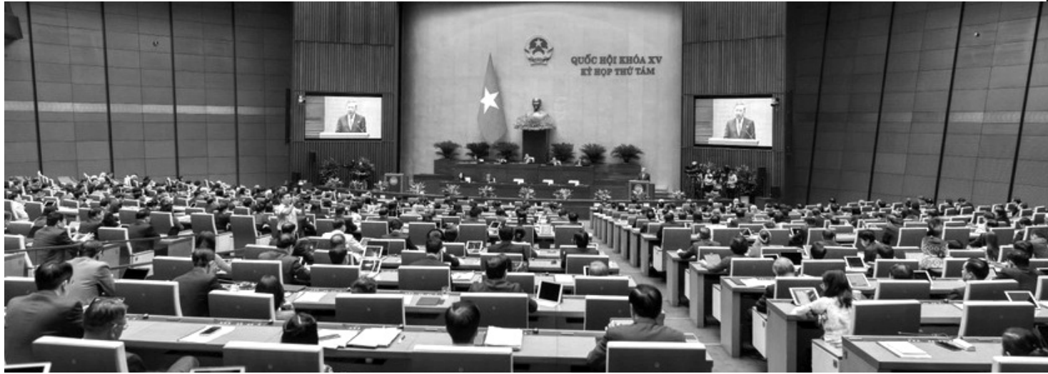
● Hình ảnh Phiên khai mạc Kỳ họp thứ 8, Quốc hội khóa XV.

Trong những năm qua, công tác xây dựng pháp luật đã có bước tiến rất dài, hệ thống pháp luật của chúng ta đã cơ bản đồng bộ, hoàn thiện và đóng góp rất tích cực vào sự phát triển kinh tế - xã hội. Tuy nhiên, bước sang giai đoạn mới, tư duy xây dựng pháp luật cần phải có sự đổi mới có tính bứt phá để đáp ứng yêu cầu phát triển của đất nước.