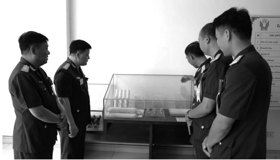
● Lãnh đạo Tổng cục CNQP và Đoàn công tác kiểm tra, xem xét một số sản phẩm quốc phòng trưng bày do Z114 sản xuất.

Cùng với đó, đơn vị tích cực triển khai thực hiện quy hoạch phân khu chức năng cụm CNQP phía Nam; đầu tư dây chuyền sản xuất các sản phẩm quốc phòng; triển khai thực hiện dự án và đưa vào sản xuất các sản phẩm kinh tế hiệu quả, bảo đảm việc làm, nâng cao đời sống cán bộ, công nhân viên, người lao động (CB, CNV, NLD).