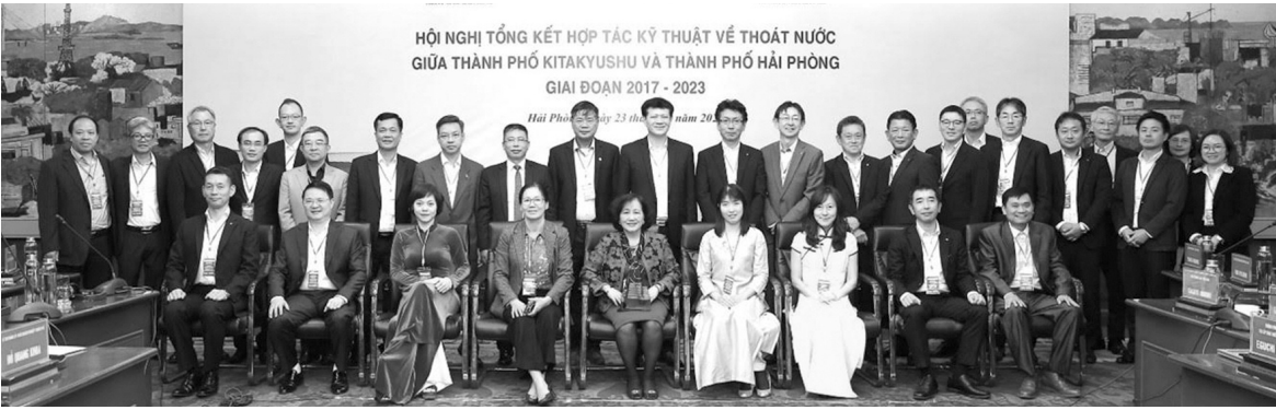
● Chương trình hợp tác kỹ thuật về thoát nước với Kytakyushu.

Xuyên suốt hàng chục năm qua, Công ty TNHH MTV Thoát nước Hải Phòng đã luôn khẳng định vai trò, vị trí là đơn vị chuyên ngành lớn nhất và đi đầu trong thành phố về lĩnh vực thoát nước và xử lý nước thải.