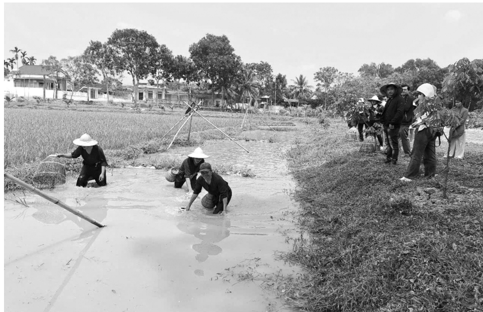
● Du khách hồ hởi khi được trải nghiệm làm nông dân trong tour du lịch nông nghiệp.

Tại Tọa đàm “Phát huy giá trị tích hợp của du lịch nông thôn” vừa diễn ra vào tháng 6 năm nay, Phó Cục trưởng Cục Du lịch Quốc gia Việt Nam Nguyễn Lê Phúc cho hay, trên cơ sở báo cáo của 63 Sở quản lý nhà nước về du lịch các tỉnh, thành phố, cả nước hiện có 488/1.731 khu, điểm du lịch đã được công nhận theo quy định của Luật Du lịch 2017, trong đó, có 382 điểm, tức là khoảng 80% nằm trên địa bàn nông thôn.