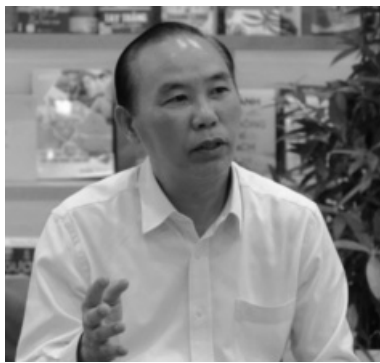
● Thứ trưởng Bộ NN&PTNT Phùng Đức Tiến thông tin về sự tăng trưởng vượt bậc của ngành Nông nghiệp trong 11 tháng năm 2024.

chiếm 48,2% tổng kim ngạch, tiếp theo là châu Mỹ với 23,7% và châu Âu khoảng 11,3%. Mỹ, Trung Quốc và Nhật Bản là ba thị trường lớn nhất với tỷ trọng lần lượt 21,7%, 21,6% và 6,6%. Trong đó, XK sang Mỹ tăng mạnh gần 25%, Trung Quốc tăng 11% và Nhật Bản tăng 5,5% so với cùng kỳ năm trước.