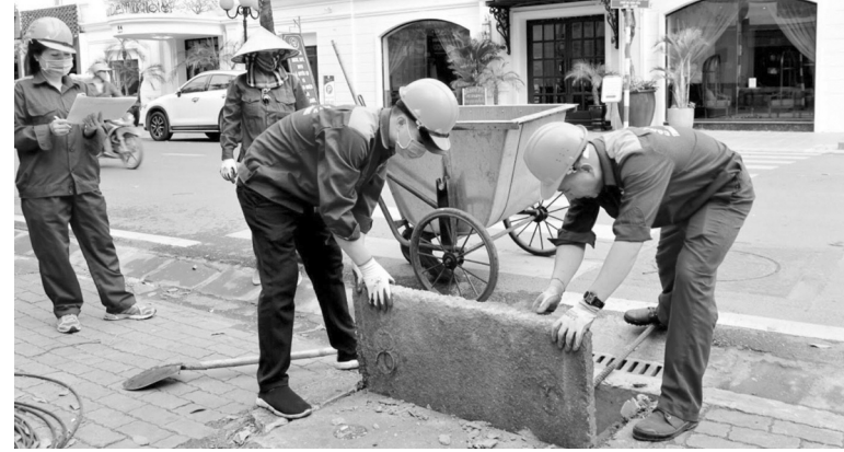
● Công tác nạo vét bùn ga hầm ếch hàng ngày của công nhân Công ty Thoát nước Hải Phòng.