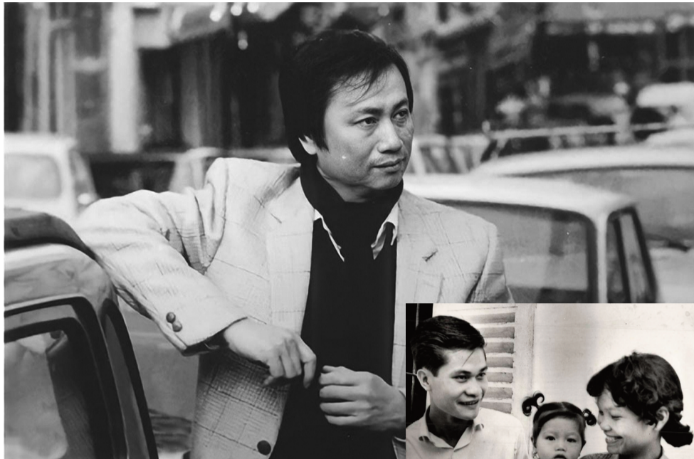
● Nhạc sĩ Lam Phương là một nghệ sĩ tài hoa, nhưng có cuộc đời đầy thăng trầm.