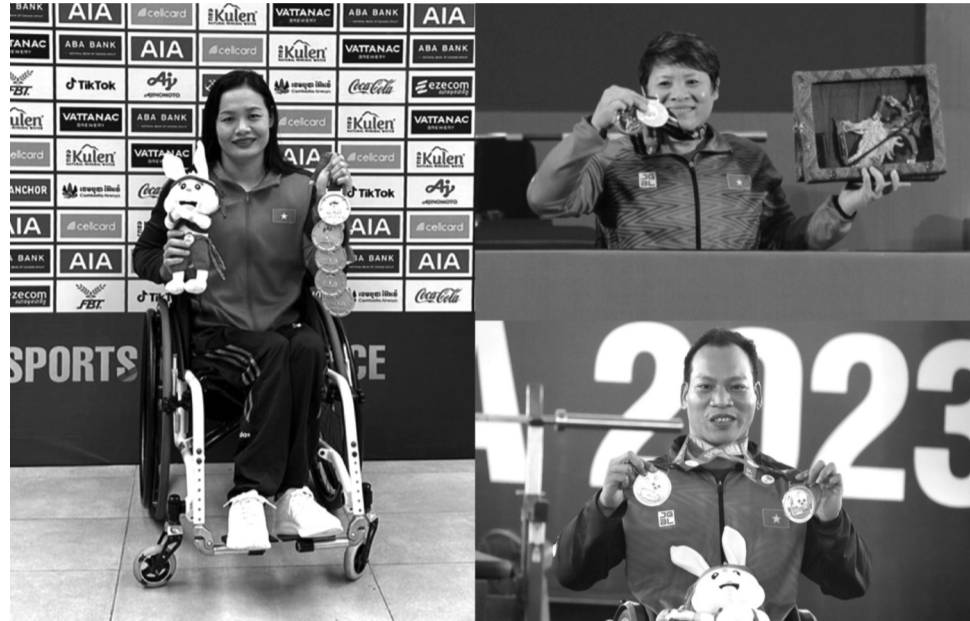
● Những gương mặt vàng của làng thể thao người khuyết tật Việt Nam.

Thời gian qua, thể thao người khuyết tật đã đóng góp không nhỏ vào bảng vàng thành tích của thể thao Việt Nam. Rất nhiều gương mặt vận động viên người khuyết tật đã được vinh danh trên các đấu trường thể thao khu vực và quốc tế. Trong số đó, nhiều tài năng nổi bật đã được phát hiện thông qua các câu lạc bộ văn hóa thể thao và các giải đấu dành cho người khuyết tật tại cơ sở.