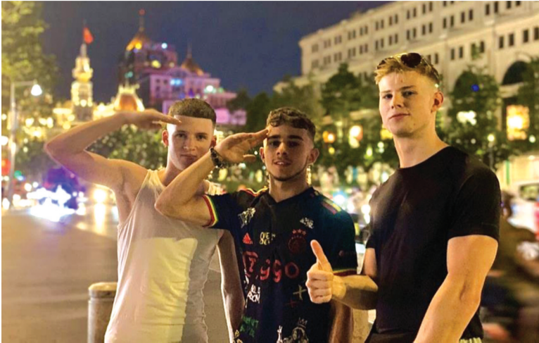
● Du khách nước ngoài thích nhịp sống nhộn nhịp ở các thành phố lớn ở Việt Nam.