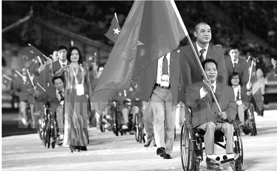
● Đoàn thể thao Việt Nam tại một kỳ Đại hội Thể thao Người khuyết tật Đông Nam Á.

Người khuyết tật (NKT) là bộ phận không thể tách rời của xã hội. NKT cũng có những nhu cầu và quyền lợi giống như những người không khuyết tật. Tuy nhiên, tình trạng khuyết tật và định kiến trong xã hội thường khiến họ bị tổn thương kép, gặp nhiều khó khăn trong việc thực hiện các quyền của mình để hòa nhập xã hội. Do đó, trong thời gian tới cần nâng cao vai trò của pháp luật trong bảo đảm quyền của NKT cũng như tạo điều kiện tối đa để họ hòa nhập xã hội.