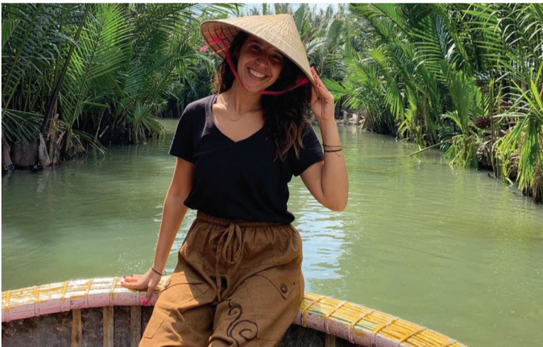
● Vị khách Mỹ trải nghiệm ngồi thuyền thúng ở rừng dừa nước Bảy Mẫu. (Ảnh: Latifah Al-Hazza)