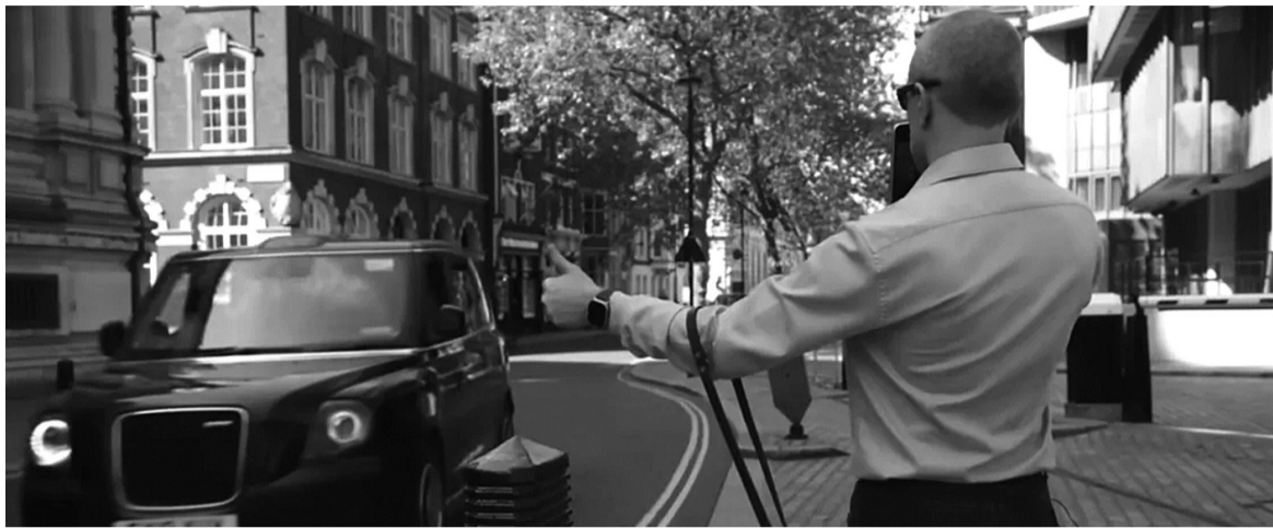
● Một người khiếm thị đang sử dụng phiên bản AI của Be My Eyes để gọi taxi.