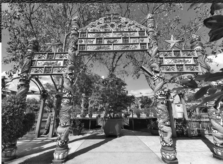
● Di tích về đạo Dừa còn lại đến ngày nay trên "còn" Phụng. (Ảnh: TL)

Khó có thể tính hết miền Tây có bao nhiêu còn, bởi qua bao năm bồi đắp, nhiều "còn" đã biến mất, nhưng cũng có không ít "còn" được bồi đắp lên. Trong đó, có những "còn" khá nổi tiếng bởi là "còn" lớn, có những nét đặc sắc riêng, có ảnh hưởng không nhỏ đến đời sống người miền Tây. Có thể kể đến các "còn" như "còn" An Bình (Vĩnh Long) nằm giữa dòng sông Cổ Chiên và sông Hàm Luông với vẻ đẹp yên ả của những vườn cây trái sum suê, những con đường làng rợp bóng mát và những ngôi nhà cổ kính nép mình bên bờ sông. "Còn" Mây hay còn được gọi là cù lao Lục Sĩ Thành, nằm giữa dòng sông Hậu, thuộc huyện Trà Ôn, tỉnh Vĩnh Long với diện tích khoảng 4.000ha, có làng nghề làm bánh tráng truyền thống lâu đời. "Còn" Tân Lộc (Cần Thơ), còn được gọi là "cù lao Tam Tỉnh" vì nằm giáp ranh giữa ba tỉnh Cần Thơ, Đồng Tháp và An Giang, nơi lưu giữ nhiều di tích lịch sử và văn hóa như đình Tân Lộc, chùa Phước Hậu, nhà cổ Trần Bá Thế... "Còn" Ông Hồ (An Giang) với nhiều truyền thuyết lạ kì. Nơi đây chính là quê hương của Chủ tịch Tôn Đức Thắng, vị lãnh tụ kính yêu của dân tộc Việt Nam. Ngôi nhà sàn đơn sơ nơi Bác sinh ra và lớn lên đã trở thành khu di tích lịch sử quan trọng, thu hút đông đảo du khách đến tham quan và tưởng niệm. Ngoài ra còn có Tứ Linh còn