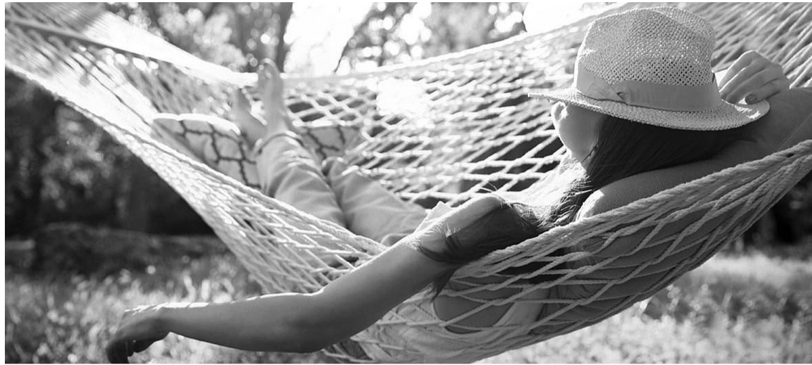
● Nhiều người phải chi hàng chục triệu đồng để tìm lại giấc ngủ ngon. (Ảnh minh họa - Nguồn: Tạp chí Mẹ và Con)

Áp lực học hành, thi cử, công việc, cuộc sống, khiến nhiều người trẻ ngày nay dễ bị mất ngủ sớm. Căn bệnh mất ngủ không chỉ ảnh hưởng đến sức khỏe, mà còn cả tinh thần của giới trẻ. Vì vậy, nhiều người đã chi cả chục đến cả trăm triệu đồng để tìm lại giấc ngủ sâu, yên bình.