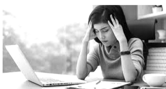
● Thiếu ngủ khiến người trẻ làm việc kém hiệu quả. (Ảnh minh họa)

Để chữa căn bệnh mất ngủ, nhiều người đã chi hàng chục, hàng trăm triệu. Như Linh Trang, sau