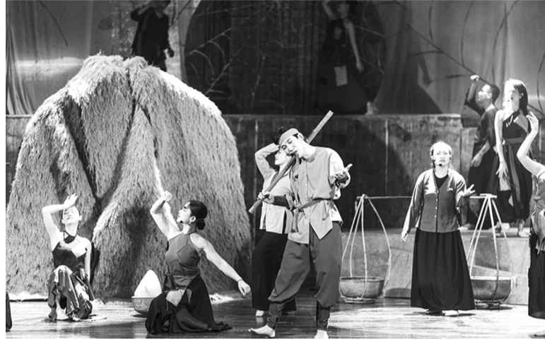
● Văn học Việt là mỏ vàng màu mỡ của nhạc kịch.

Sau nhiều năm vắng bóng tại Việt Nam, hàng loạt chương trình nhạc kịch đặc sắc mang đậm văn hóa Việt được đầu tư công phu với những tâm huyết của các nghệ sĩ nhằm thu hút khán giả yêu nghệ thuật và thực hiện hóa giấc mơ nhạc kịch Việt Nam vươn ra thế giới.