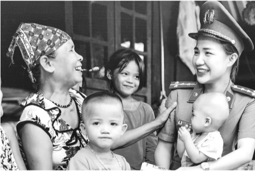
● Công an tỉnh Quảng Trị thường xuyên gần gũi chia sẻ với bà con dân bản tại cơ sở, năm 2021.