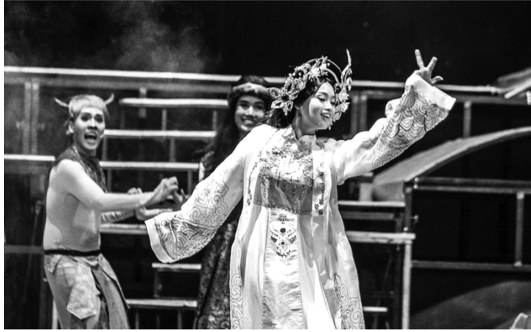
● Vở nhạc kịch Tấm Cám.