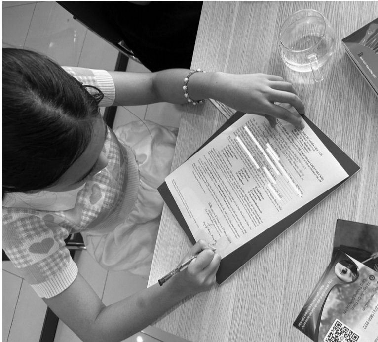
● Nhiều bạn trẻ ở lứa tuổi học sinh, sinh viên đã đăng kí hiến tạng với sự ủng hộ của gia đình.

Hoa hậu Thùy Tiên cũng đăng kí hiến tạng vào năm 2020, khi trào lưu hiến tạng chưa lan rộng trong giới trẻ. Khi ấy, cô đã tìm hiểu về hiến mô, hiến tạng và đăng kí với tâm niệm làm thế nào để những bộ phận trên cơ thể mình còn có thể giúp ích cho nhiều người ngay cả khi mình không còn