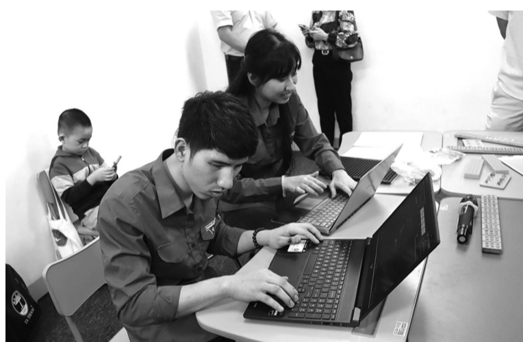
● Thanh niên khuyết tật Việt không chỉ tự lập lo cho bản thân mà còn tạo công ăn việc làm cho cộng đồng người khuyết tật.

Theo chị Vân, thực tế tại Việt Nam hiện nay, có đến 6,2 triệu người khuyết tật, nhưng trong đó rất ít người sở hữu việc làm với