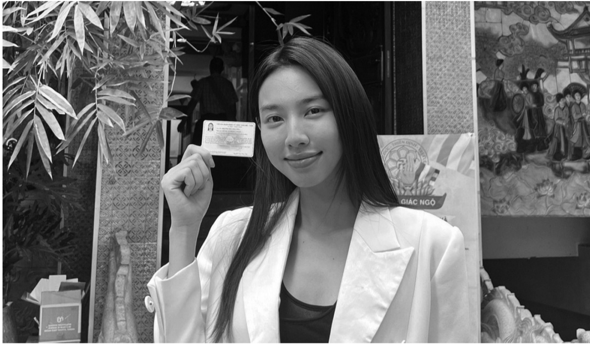
● Hoa hậu Thùy Tiên đã đăng kí hiến mô, hiến tạng từ năm 2020 và luôn tích cực kêu gọi cộng đồng tham gia hoạt động ý nghĩa này.

Hiến tạng - một hành động từng là điều xa lạ với nhiều người, giờ đây đã trở thành một trào lưu tích cực trong giới trẻ. Những câu chuyện cảm động về việc hiến tạng cứu người, những tấm thẻ đăng kí hiến mô tạng được khoe trên mạng xã hội và những cuộc trò chuyện sôi nổi về giá trị của hành động này đã góp phần lan tỏa một thông điệp đầy nhân văn: Hiến tạng là trao đi sự sống.