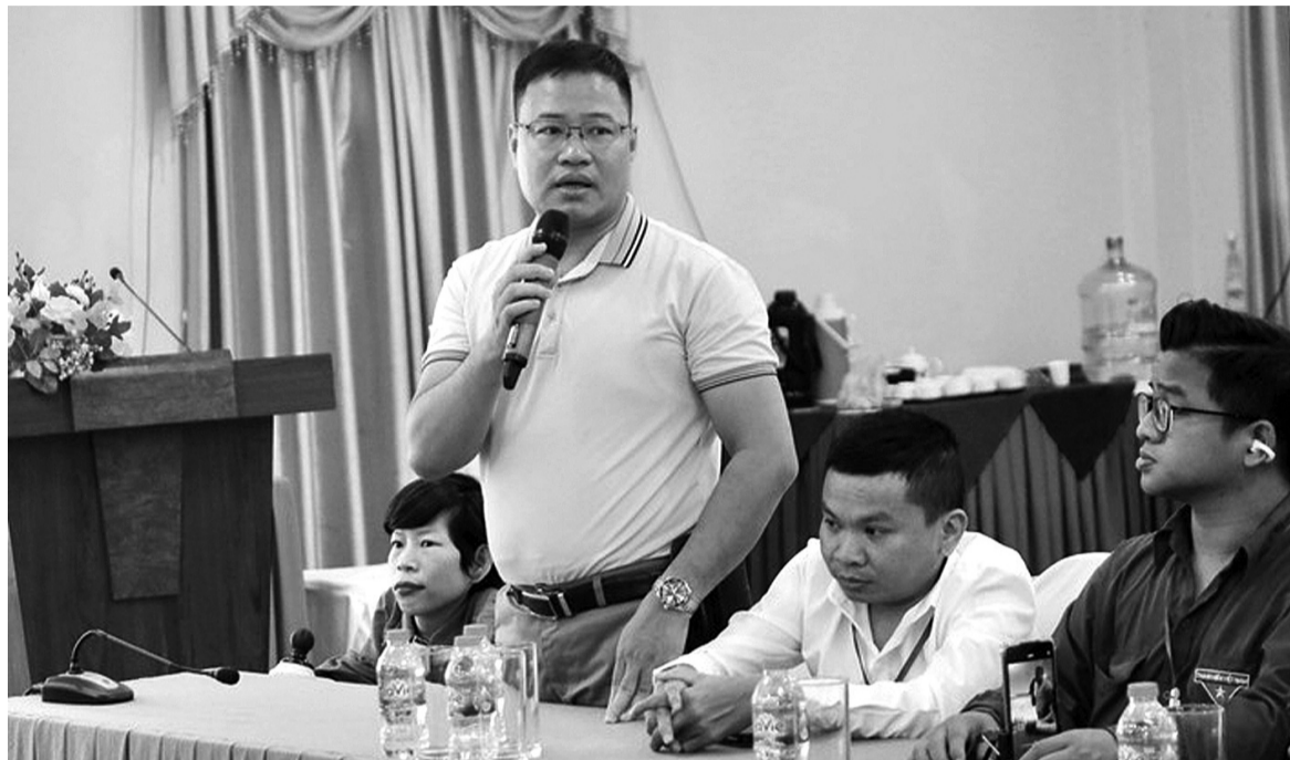
● Người khuyết tật cần nhiều hơn nữa những chính sách mang tính mở đường.