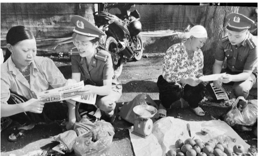
● Công an tỉnh Cao Bằng tuyên truyền pháp luật phòng chống mua bán người cho chị em phụ nữ tại phiên chợ vùng cao, năm 2024.

Lần đầu tiên tại Việt Nam có triển lãm ảnh không chỉ mang ý nghĩa tuyên truyền pháp luật về bình đẳng giới mà còn truyền tải thông điệp về vai trò và trách nhiệm của lực lượng Công an nhân dân Việt Nam trong bảo vệ phụ nữ và trẻ em khỏi bạo lực trên cơ sở giới, cũng như khuyến khích phụ nữ và trẻ em gái bị bạo lực tìm kiếm sự hỗ trợ của ngành Công an.