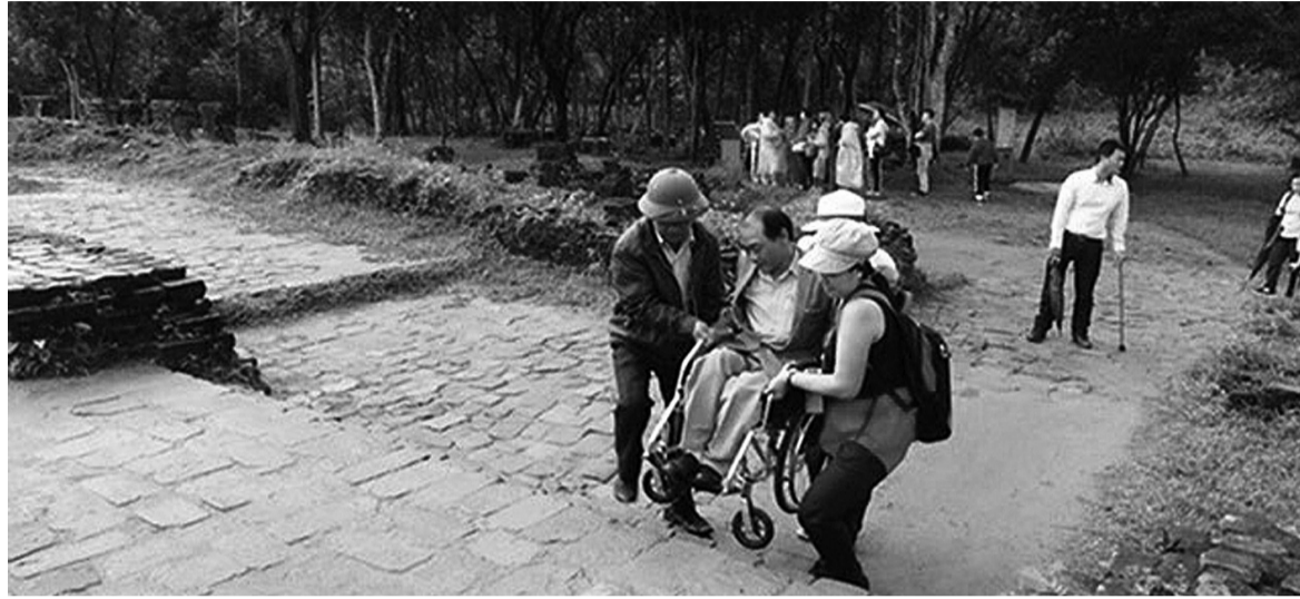
● Những người khuyết tật mong có nhiều điểm du lịch tiếp cận thân thiện để họ dễ dàng đi du lịch, trải nghiệm.

Việt Nam đang tích cực phấn đấu trở thành một trong những điểm đến du lịch thân thiện hàng đầu thế giới. Để thực hiện được mục tiêu này, ngành du lịch Việt khó thể bỏ sót một số lượng lớn du khách tiềm năng là người khuyết tật (NKT) và cả người cao tuổi cần hỗ trợ.