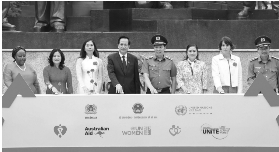
● Các đại biểu tham gia nghi thức nhấn nút phát động Tháng hành động vì bình đẳng giới và phòng ngừa, ứng phó với bạo lực trên cơ sở giới năm 2024.

Theo ông Đào Ngọc Dung, Ủy viên Ban Chấp hành Trung ương Đảng, Bộ trưởng Bộ LĐ-TB&XH, Chủ tịch Ủy ban quốc gia vì sự tiến bộ của phụ nữ Việt Nam, những năm qua Đảng, Nhà nước, Chính phủ Việt Nam đã luôn nỗ lực trong việc thực hiện các biện pháp nhằm đảm bảo an sinh xã hội, thúc đẩy bình đẳng giới và phòng ngừa, ứng phó với bạo lực trên cơ sở giới, đặc biệt là bạo lực với phụ nữ và trẻ em. Nghị quyết số 42-NQ/TW ngày 24/11/2023, Hội nghị lần thứ tám Ban Chấp hành Trung ương Đảng khóa XIII về tiếp tục đổi mới, nâng cao chất lượng chính sách xã hội, đáp ứng yêu cầu sự nghiệp xây dựng và bảo vệ Tổ quốc trong giai đoạn mới đã xác định chính sách xã hội là chính sách chăm lo cho con người, vì con người, lấy con người làm trung tâm, là chủ thể, mục tiêu, động lực để phát triển bền vững đất nước. “Vấn đề an sinh xã hội, các biện pháp để thúc đẩy bình đẳng, quan tâm đến nhu cầu, lợi ích chính đáng của phụ nữ và trẻ em, tiến tới bình đẳng giới thực chất vẫn cần được ưu tiên trong thời gian tới. Với chủ đề “Đảm bảo an sinh xã hội, tăng quyền năng và tạo cơ hội cho phụ nữ và trẻ em gái nhằm thực hiện bình đẳng giới và xóa bỏ bạo lực trên cơ sở giới”, Tháng hành động năm nay nhấn mạnh tới tầm quan trọng của các biện pháp duy trì xã hội ổn định, công bằng, dân chủ, đảm bảo an sinh xã hội và an ninh, an toàn cho người dân, nhất là phụ nữ và trẻ em gái”, Bộ trưởng Đào Ngọc Dung khẳng định.