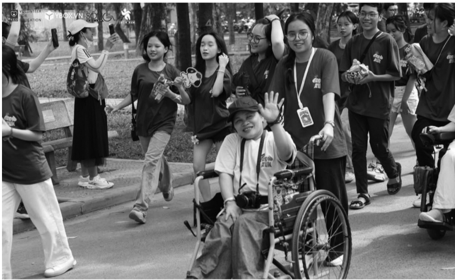
● Giải chạy marathon có tên "Ánh Dương" do Iron Run tổ chức đã chạm đến trái tim mọi người.