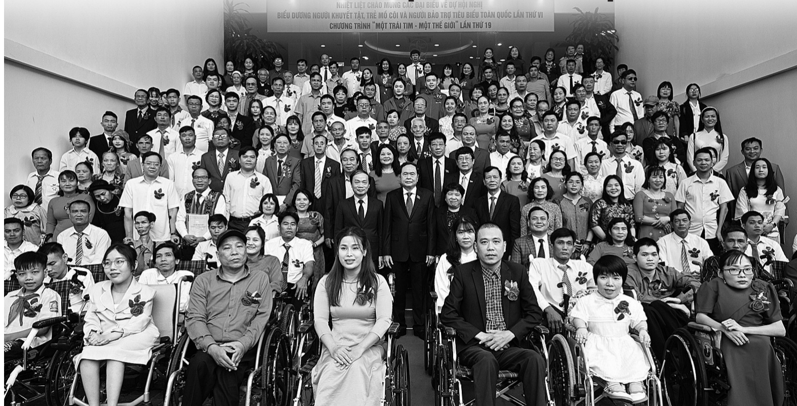
● Hội nghị biểu dương NKT, trẻ mồ côi và người bảo trợ tiêu biểu toàn quốc lần thứ VI, năm 2024, nhấn mạnh nhiều đóng góp của NKT với xã hội.

Người khuyết tật chiếm một tỷ lệ đáng kể trong dân số Việt Nam, việc thúc đẩy vai trò lãnh đạo của họ trong mọi lĩnh vực của cuộc sống không chỉ là vấn đề công bằng xã hội mà còn là động lực quan trọng cho sự phát triển bền vững. Tuy nhiên, người khuyết tật vẫn phải đối mặt với nhiều rào cản trong việc tham gia và đảm nhận vai trò lãnh đạo.