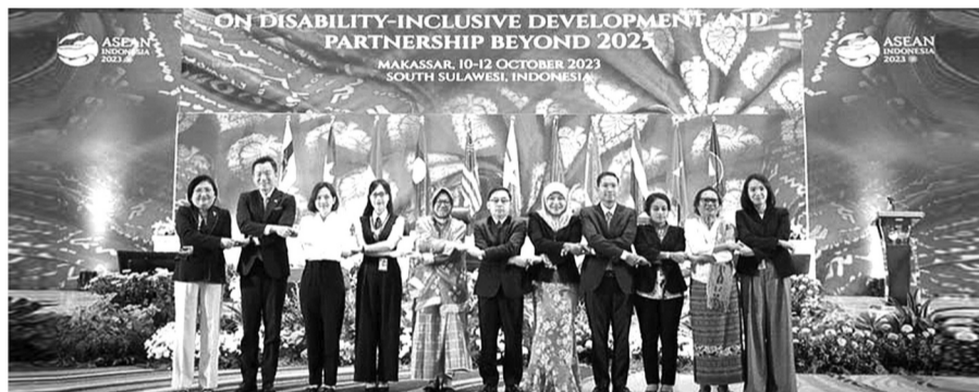
● Diễn đàn NKT ASEAN 2023 đã đưa ra “Khuyến nghị Makassar” nhằm tăng cường cam kết trao quyền cho NKT, thực hiện tinh hòa nhập và nâng cao năng lực cho NKT.

Thúc đẩy vai trò lãnh đạo của NKT là một cam kết đối với sự công bằng và nhân văn trong xã hội. Khi được tạo điều kiện và hỗ trợ đúng mức, NKT không chỉ có thể thay đổi cuộc sống của chính mình mà còn góp phần quan trọng vào sự tiến bộ chung, phát triển bền vững của đất nước. ĐỖ TRANG