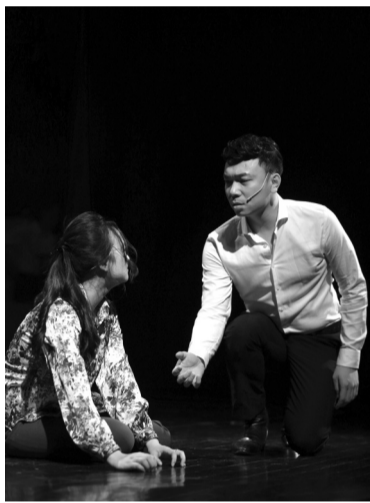
● Vở nhạc kịch Sóng.

Sau nhiều năm vắng bóng tại Việt Nam, hàng loạt chương trình nhạc kịch đặc sắc mang đậm văn hóa Việt được đầu tư công phu với những tâm huyết của các nghệ sĩ nhằm thu hút khán giả yêu nghệ thuật và thực hiện hóa giấc mơ nhạc kịch Việt Nam vươn ra thế giới.