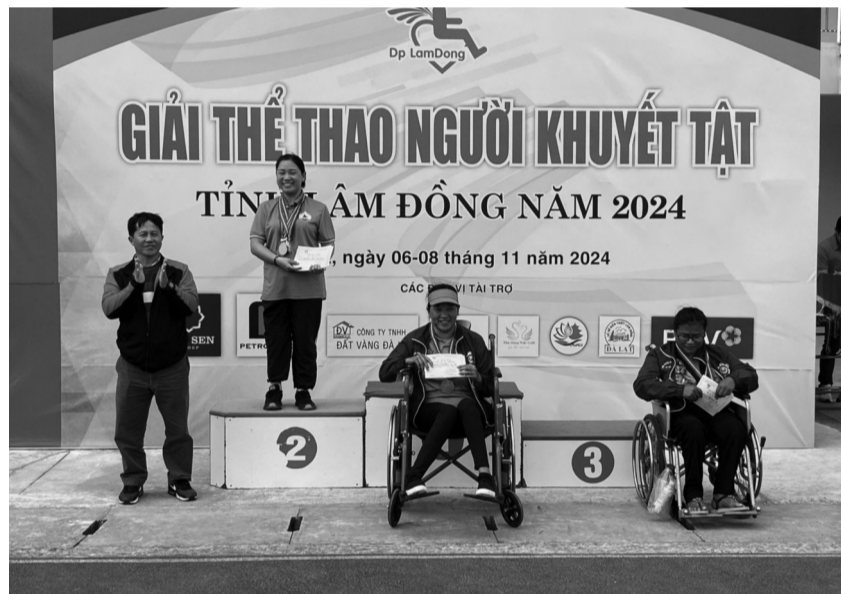
● Phong trào thể dục, thể thao cơ sở - "cái nôi" đào tạo nhân tài cho thể thao người khuyết tật Việt Nam. (Nguồn: Lâm Đồng online)

Theo Ủy ban Paralympic Việt Nam, hiện cả nước có gần 40 vận động viên NKT đang được hưởng chế độ dinh dưỡng, tập luyện theo chính sách của Nhà nước. Đây là con số còn khá khiêm tốn và lực lượng vận động viên NKT theo thể thao đỉnh cao cần được nhân rộng hơn nữa, qua đó giúp phong trào thể thao NKT tại Việt Nam ngày càng phát triển mạnh mẽ.