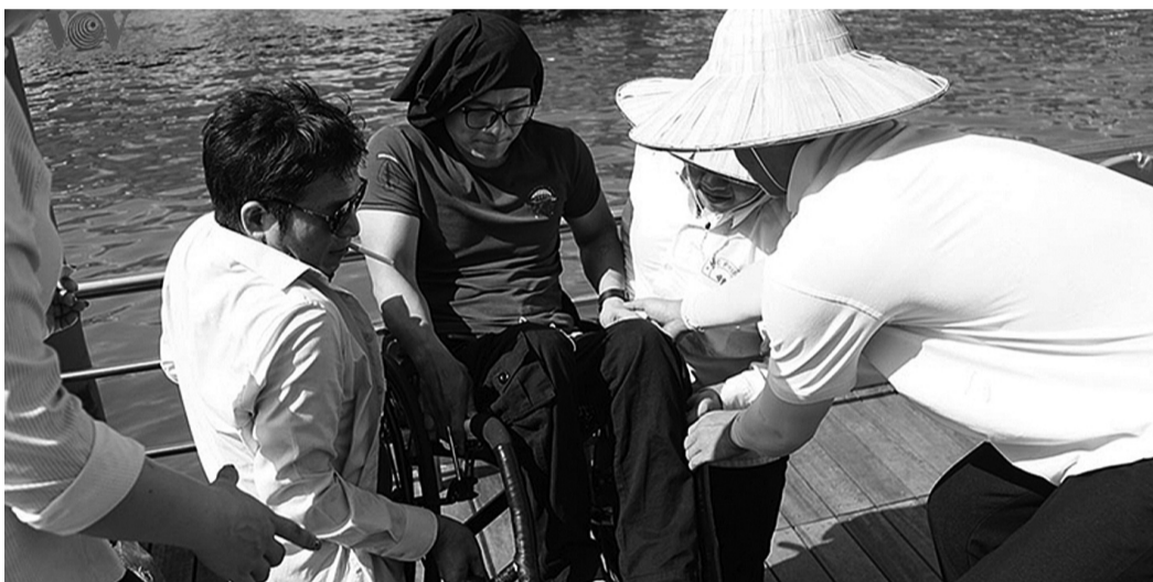
● Không có thang nghiêng chuyên dụng, việc đưa người đi xe lăn lên tàu phải cần nhiều người trợ giúp.