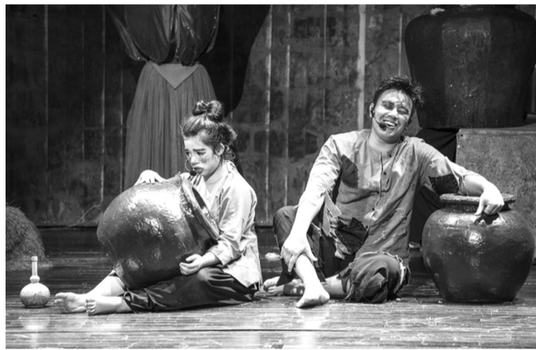
● Vở nhạc kịch Giấc mơ Chí Phèo.