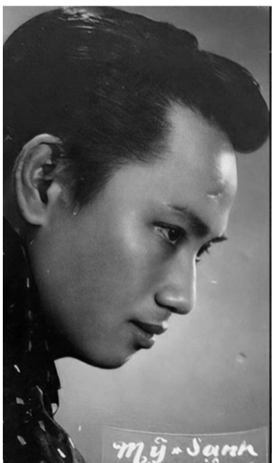
● Nhạc sĩ Lam Phương sáng tác nhiều bản nhạc nổi tiếng.