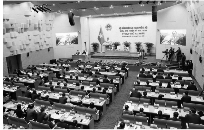
● Kỳ họp của HĐND Hà Nội sẽ xem xét 55 nội dung.

Các lĩnh vực văn hóa, giáo dục, y tế và tôn tạo di tích được đặc biệt quan tâm đầu tư. Giáo dục và đào tạo, thể dục thể thao tiếp tục khẳng định