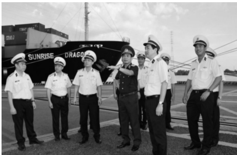
● Đại tướng Phan Văn Giang, Bộ trưởng Bộ Quốc phòng thăm TCSG.

Đến nay, TCSG đang quản lý và khai thác hệ thống cảng biển, cảng cạn, kho bãi trải dài khắp