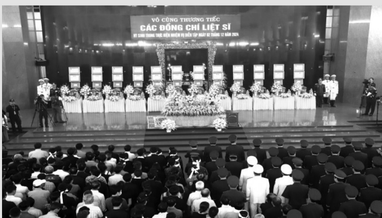
● Lễ viếng 12 liệt sĩ Quân khu 7 hy sinh khi diễn tập.

Chủ tịch nước Lương Cường, Thủ tướng Phạm Minh Chính