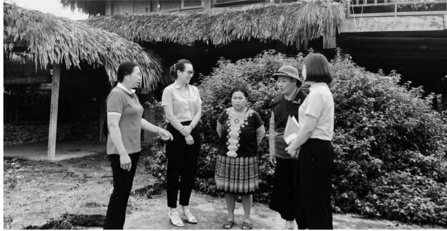
● Cán bộ tín dụng NHCSXH Mộc Châu thăm hộ gia đình đồng bào DTTS sử dụng vốn chính sách để giảm nghèo, ổn định đời sống.