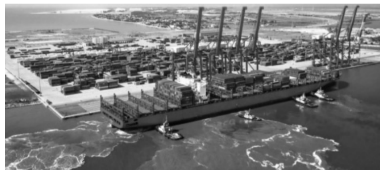
● Cảng container Quốc tế Tân Cảng Hải Phòng là cảng nước sâu lớn nhất miền Bắc với các tuyến dịch vụ trực tiếp đi châu Mỹ và châu Âu.

TCSG hiện xếp thứ 17 trong nhóm 20 cụm cảng container có sản lượng lớn nhất thế giới, 1 trong 5 DN logistics uy tín, hàng đầu Việt Nam; là DN nhà nước tiên phong trong đầu tư trang thiết bị hiện đại, ứng dụng sâu rộng công nghệ thông tin, chuyển đổi số, dịch vụ trực tuyến trong quản lý, điều hành; đẩy mạnh xây dựng “cảng xanh”, “dịch vụ thông minh”, năng động, hiện đại.