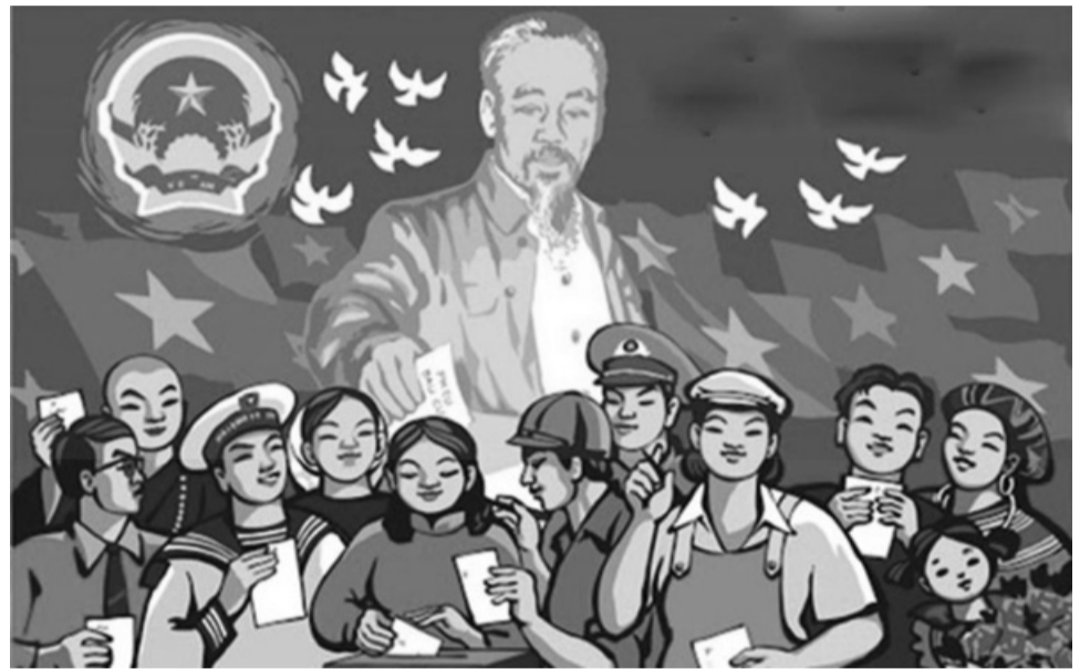
● Việt Nam luôn tôn trọng, bảo đảm, bảo vệ quyền con người, quyền và nghĩa vụ công dân.

Nhiều quyền mới của con người, của công dân được Hiến pháp ghi nhận như: “Quyền được sinh sống trong môi trường trong lành” (Điều 43), “Quyền hưởng thụ và tiếp cận các giá trị văn hoá, tham gia vào đời sống văn hoá, sử dụng các cơ sở văn hoá” (Điều 41); “Công dân có quyền được đảm bảo an sinh xã hội” (Điều 34); “Quyền sở hữu tư nhân và quyền thừa kế được pháp luật bảo hộ” (khoản 2 Điều 32)... Tất cả điều đó là thành quả đáng ghi nhận về việc thể chế hoá chủ quyền nhân dân trong xây dựng Nhà nước pháp quyền XHCN ở nước ta.