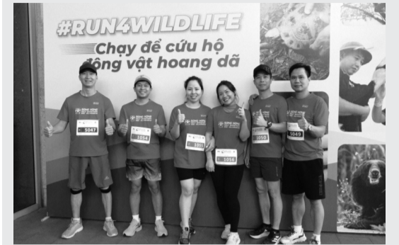
● Giải chạy thu hút hơn 300 vận động viên đến từ 26 quốc gia.