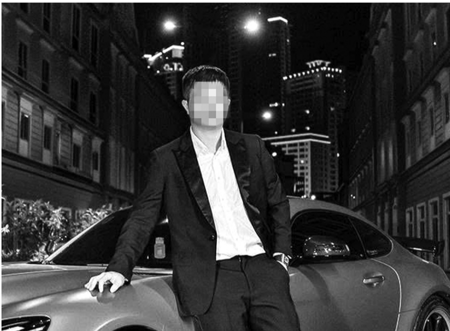
● Dưới lớp vỏ thành đạt, Mr Pips cùng đồng bọn đã gây ra vụ lừa đảo tài chính lên đến hàng nghìn tỉ đồng.

Lừa đảo trực tuyến từ lâu đã trở thành một vấn nạn toàn cầu, với những chiêu trò tinh vi nhằm đánh lừa sự cảnh giác của người dùng mạng. Bên cạnh những kẻ lừa đảo sử dụng danh tính giả để thực hiện các hành vi phạm pháp, thì một hình thức lừa đảo khác còn đáng lo ngại hơn: lừa đảo “không ẩn danh”, núp sau những vỏ bọc hào nhoáng trên mạng ảo.