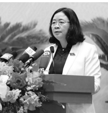
● Bí thư Thành ủy Hà Nội Bùi Thị Minh Hoài phát biểu chỉ đạo tại phiên khai mạc.

Tập trung triển khai Đại hội Đảng bộ các cấp tiến tới Đại hội đại biểu toàn quốc lần thứ XIV của Đảng. Trước mắt phải quyết tâm hoàn thành việc tổng kết Nghị quyết 18-NQ/TW và sắp xếp, kiện toàn tổ chức bộ máy hệ thống chính trị.