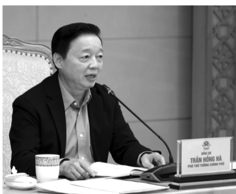
● Phó Thủ tướng Trần Hồng Hà cho rằng, việc tinh gọn bộ máy sẽ đáp ứng tốt hơn nhiệm vụ quản lý nhà nước trong tình hình mới.

Trong đó, 2 ĐHQG cần đánh giá một cách hệ thống quá trình hình thành, phát triển; chỉ rõ những ưu điểm, bất cập, tồn tại, hạn chế, giải pháp khắc phục. Từ đó, xây dựng Đề án sắp xếp, tinh gọn bộ máy bảo đảm dân chủ, khoa học, có sự kế thừa tên tuổi, vị thế của 2 ĐHQG cũng như trách nhiệm đối với tương lai phát triển của đất nước trong lĩnh vực đào tạo, nghiên cứu, đổi mới, sáng tạo khoa học công nghệ. Đề án kiện toàn, sắp xếp, đổi mới bộ máy