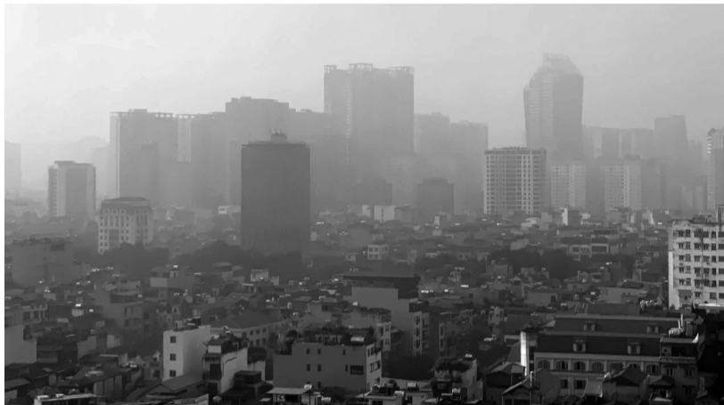
● Sáng 8/12/2024, bầu trời một số khu vực ở Hà Nội trắng đục mịt mù vì sương và khói bụi.

Hôm qua (9/12), HỌND TP Hà Nội khóa XVI khai mạc Kỳ họp thứ 20. Theo báo cáo, qua hoạt động tiếp xúc cử tri trước kỳ họp của các đại biểu HỌND TP, đã có trên 160 ý kiến, kiến nghị của cử tri được gửi tới UBND TP.