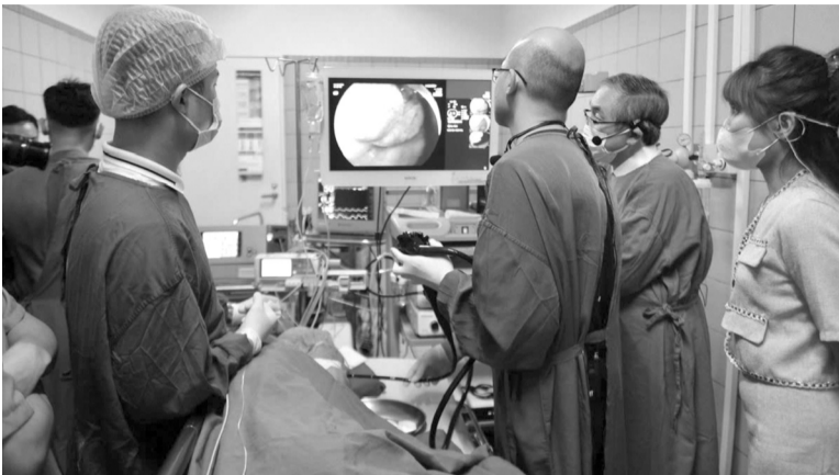
● Tại Bệnh viện Bạch Mai, trung bình mỗi ngày các bác sĩ thực hiện khoảng 2.000 ca nội soi đường tiêu hóa, trong đó khoảng 20% bệnh nhân bị viêm loét dạ dày.

Trong những năm gần đây, tỉ lệ mắc bệnh lý dạ dày không ngừng gia tăng, theo ước tính, khoảng từ 10 - 15% dân số mắc trào ngược dạ dày thực quản và khoảng từ 15 - 20% bị viêm loét dạ dày. Đặc biệt, người mắc bệnh