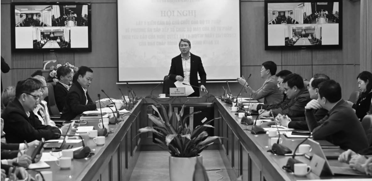
● Bộ trưởng Bộ Tư pháp Nguyễn Hải Ninh kết luận Hội nghị.

Ngày 9/12, Bộ trưởng Bộ Tư pháp Nguyễn Hải Ninh đã chủ trì Hội nghị lấy ý kiến cán bộ chủ chốt của Bộ Tư pháp về phương án sắp xếp tổ chức bộ máy của Bộ Tư pháp theo yêu cầu của Nghị quyết số 18-NQ/TW ngày 25/10/2017 của Ban Chấp hành Trung ương khóa XII.