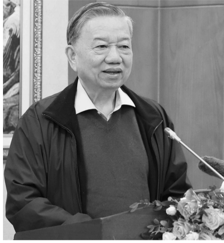
● Tổng Bí thư Tô Lâm phát biểu chỉ đạo tại buổi làm việc với Ban Kinh tế Trung ương.

Tại buổi làm việc, Tổng Bí thư đã gợi mở nhiều nội dung đề nghị Ban Kinh tế Trung ương tập trung nghiên cứu sâu, toàn diện để tham mưu, đề xuất với Trung ương trong thời gian tới. Tổng Bí thư nhấn mạnh, muốn có một bộ máy hiệu lực, hiệu quả, hiệu năng đáp ứng yêu cầu phát triển của giai đoạn mới, buộc phải thực hiện cuộc cách mạng về tổ chức bộ