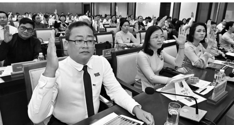
● Các đại biểu biểu quyết thông qua chương trình kỳ họp.

Song song đó, việc thẩm tra quyết toán các dự án đầu tư công cũng giúp tiết kiệm đáng kể cho ngân sách. Năm 2024, thành phố đã thẩm tra quyết toán 81 dự án với tổng mức đầu tư gần 5.773 tỉ đồng, tiết kiệm được 30,969 tỉ đồng so với giá trị do chủ đầu tư đề nghị.