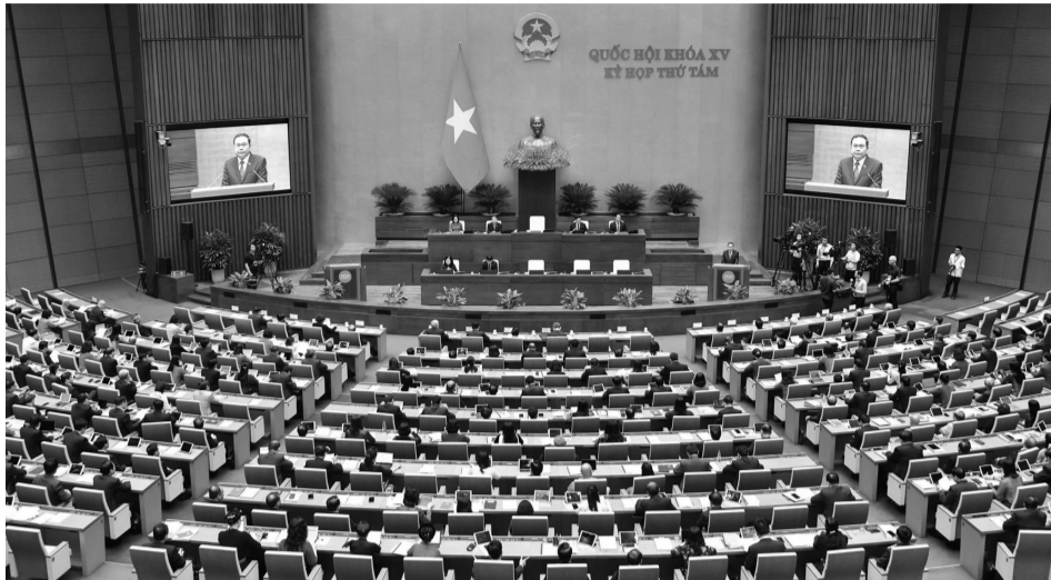
● Hình ảnh tại Kỳ họp thứ 8, Quốc hội khóa XV.