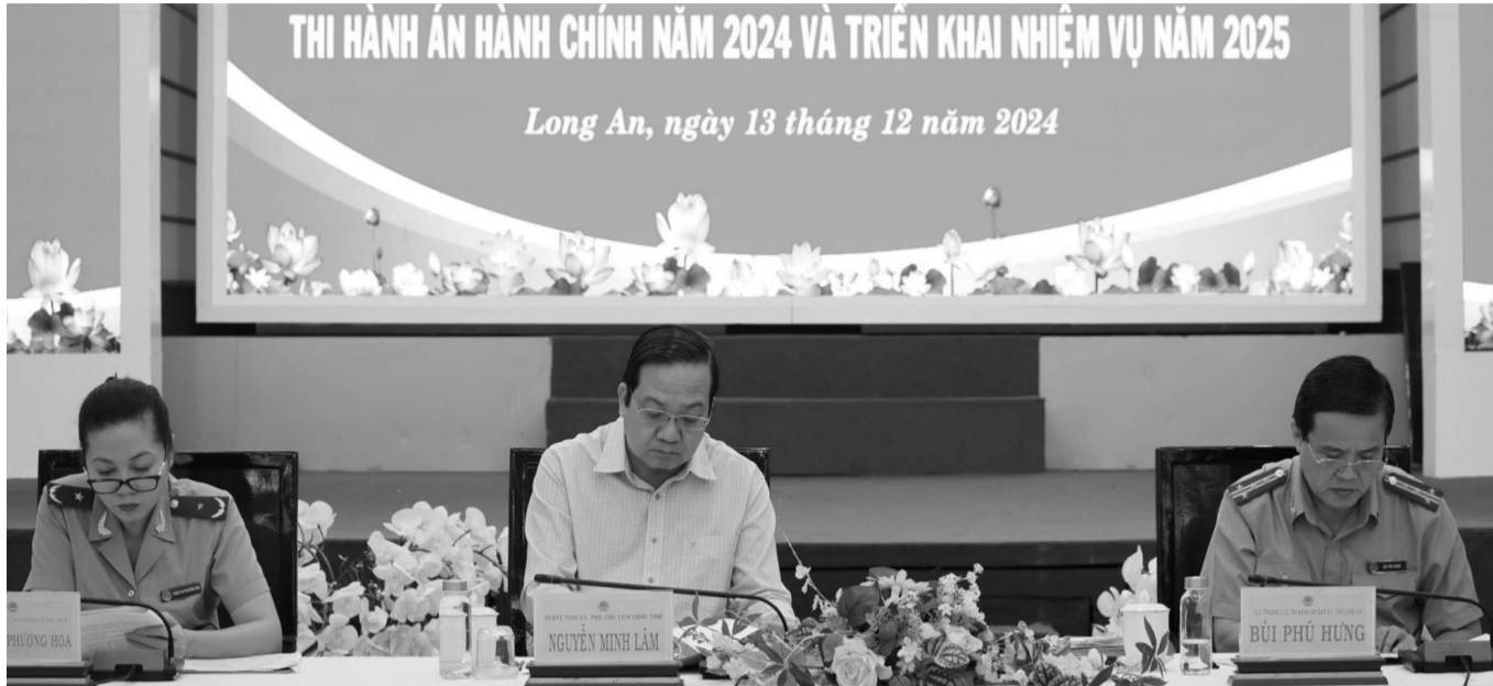
● Hội nghị tổng kết công tác thi hành án dân sự, thi hành án hành chính năm 2024 và triển khai nhiệm vụ công tác năm 2025 tại Long An.