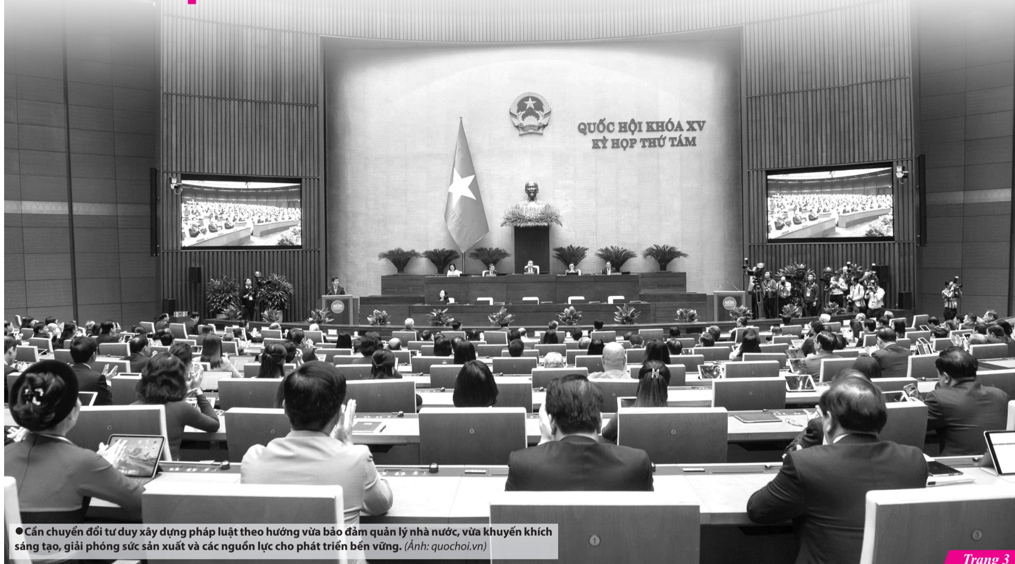
● Cần chuyển đổi tư duy xây dựng pháp luật theo hướng vừa bảo đảm quản lý nhà nước, vừa khuyến khích sáng tạo, giải phóng sức sản xuất và các nguồn lực cho phát triển bền vững. (Ảnh: quochoi.vn)