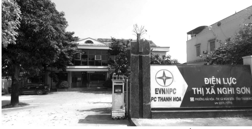
● Cty Điện lực TX Nghi Sơn là đơn vị quản lý vận hành lưới điện.

Quá trình khám nghiệm, xác định hiện trường và các tài liệu có liên quan đủ căn cứ xác định khoảng cách từ dây dẫn điện 22kV đến mặt đất và mặt nước được thực hiện theo quy định của Quy chuẩn kỹ thuật quốc gia về kỹ thuật điện.