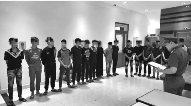
Công an tổng đạt quyết định khởi tố một nhóm thanh, thiếu niên vi phạm.

bộ phận thanh, thiếu niên thiếu sự quản lý của gia đình, hoàn cảnh gia đình khó khăn. Qua rà soát ban đầu, Công an Đà Nẵng xác định 771 em thanh, thiếu niên hư. Theo tướng Viên, trong số thanh, thiếu niên vi phạm pháp luật chỉ có số ít là đang đi học, còn lại số đông bỏ học. Đây là vấn đề rất đáng lo vì hiện nay nhóm đối tượng này dễ bị ảnh hưởng tiêu cực bởi mạng xã hội, phim ảnh, các trò chơi. Hơn nữa tâm lý đặc điểm của