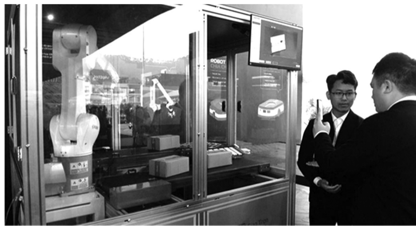
● Robot tự động chia chọn hàng hóa. (Ảnh trong bài: Quang Phương)

Công viên gồm các phân khu chính: Nhà liên ngành - Trung tâm điều hành (NOC); Công thông minh