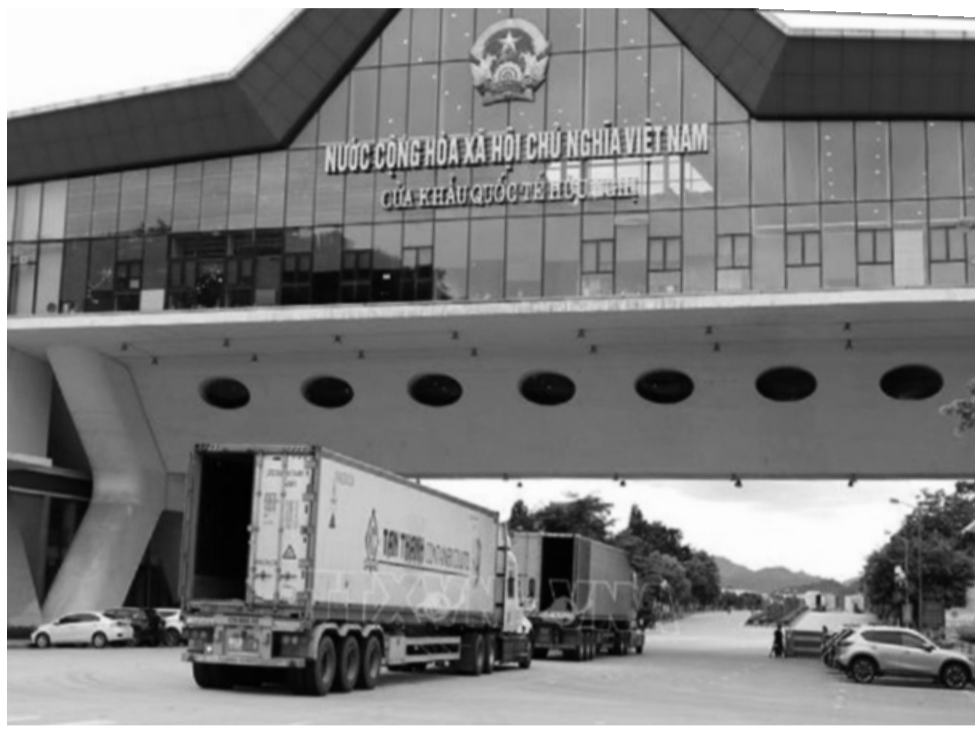
● Khi hoàn thành cửa khẩu thông minh hàng hóa thông quan sẽ không bị gián đoạn.

Tại Hội nghị tổng kết năm 2024 Kế hoạch hành động giai đoạn 2024 - 2026 triển khai Bản ghi nhớ về tăng cường hợp tác kinh tế thương mại Việt Nam - Trung Quốc (Quảng Tây) mới được tổ chức,