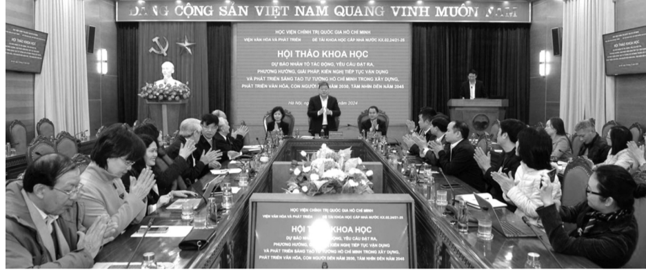
● Toàn cảnh Hội thảo.

Tư tưởng Hồ Chí Minh về văn hóa, con người vẫn còn nguyên giá trị, là những chỉ dẫn quý báu trong sự nghiệp xây dựng và