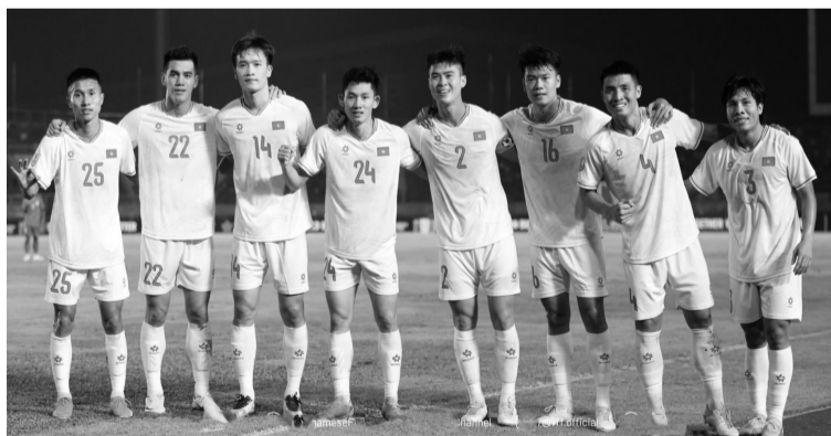
● Công chúng và giới chuyên môn cho rằng đội tuyển Việt Nam có khả năng lớn sẽ thắng Indonesia.

Trận “thư hùng” nhiều duyên nợ của Đông Nam Á giữa đội tuyển Việt Nam và Indonesia trên sân Việt Trì (20 giờ ngày 15/12) trong bối cảnh bảng B lúc này sẽ rất hấp dẫn. Công chúng và giới chuyên môn cho rằng đội tuyển Việt Nam có khả năng lớn sẽ thắng Indonesia.