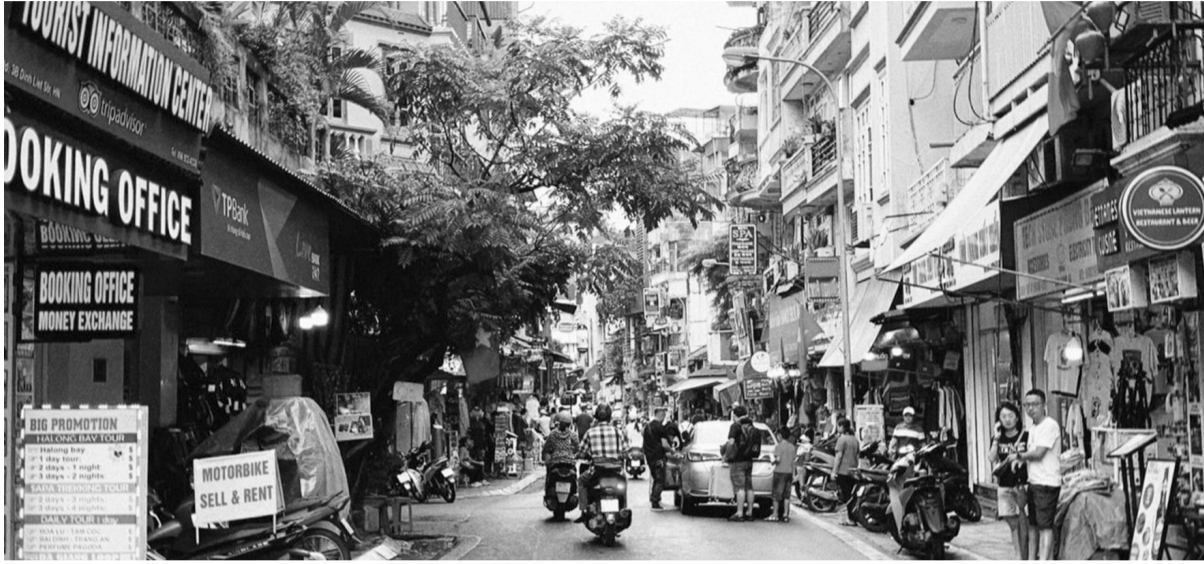
● Quận Hoàn Kiếm dự kiến chọn khu vực không gian đi bộ hồ Gươm và vùng phụ cận, khu vực phố cổ để thí điểm vùng LEZ.

Ngày 12/12, tại Kỳ họp thứ 20, HĐND TP Hà Nội khóa XVI, HĐND TP Hà Nội đã thông qua Nghị quyết Quy định thực hiện vùng phát thải thấp (LEZ) trên địa bàn TP Hà Nội. Theo đó, từ năm 2025 đến năm 2030 sẽ thí điểm lập vùng phát thải thấp ở một khu vực trên địa bàn quận Hoàn Kiếm và Ba Đình.