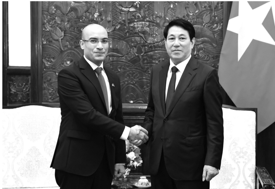
● Chủ tịch nước Lương Cường tiếp Đại sứ Cộng hòa Algeria Dân chủ và Nhân dân Sofiane Chaib đến chào từ biệt.

Chủ tịch nước đánh giá cao những đóng góp của Đại sứ trong thời gian công tác tại Việt Nam, góp phần vun