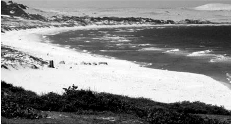
● Một góc dự án South Fork.