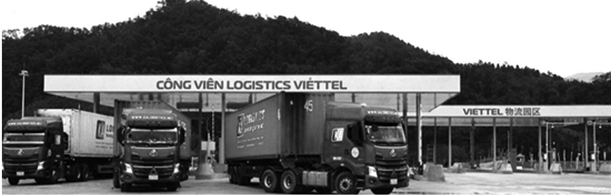
● Những xe hàng đầu tiên vào Công viên Logistics Viettel.

Khi Công viên logistics Viettel (ở cửa khẩu Đồng Đăng, Lạng Sơn) hoàn thành đầu tư các hạng mục và đi vào hoạt động, hứa hẹn sẽ mang lại hiệu quả tối ưu cho vận tải hàng hóa Việt Nam xuất khẩu, giải quyết tình trạng quá tải tại cửa khẩu, rút ngắn thời gian thông quan.