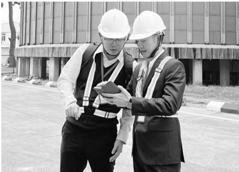
Đại diện BH PVI làm việc với khách hàng để nhanh chóng thực hiện các thủ tục bồi thường.

Theo các chuyên gia, A/E (Actual/Expected - chỉ số thực tế/kỳ vọng) không chỉ là thước đo hiệu quả tài chính, mà còn phản ánh khả năng thích nghi của DN trước những thay đổi nhanh