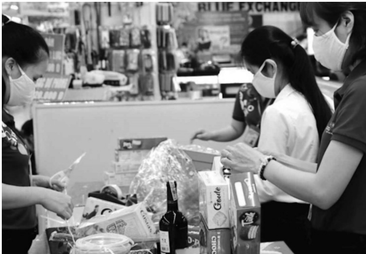
• Các công việc đóng gói quà Tết, bán hàng tại các khu chợ, làm giúp việc nhà, dọn dẹp theo giờ... phù hợp với chị em nội trợ dịp cuối năm.

Cuối năm là thời điểm nhu cầu tuyển dụng lao động thời vụ tăng cao, mang đến cơ hội kiếm thêm thu nhập cho nhiều chị em phụ nữ nội trợ đang cần việc để vừa đỡ dần kinh tế, vừa góp phần trang trải chi phí, giúp gia đình có một cái Tết ấm no hơn.