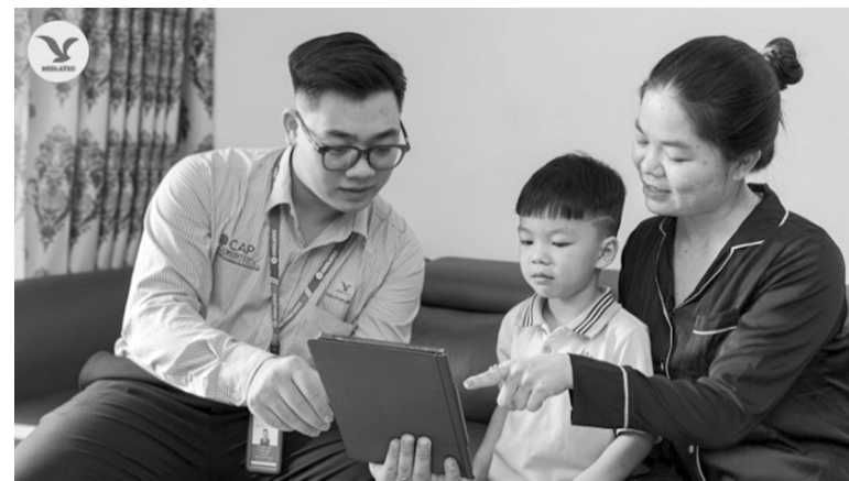
● Kiểm tra định kỳ giúp kiểm soát chặt chẽ tình trạng sức khỏe.

Hiện chưa có thuốc chữa khỏi bệnh viêm gan mạn nên để hạn chế tổn thương gan và ngăn chặn tình trạng virus bùng phát, BSNT. Trần Tiến Tùng khuyến cáo