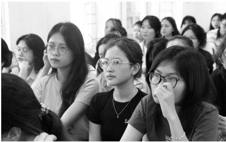
● Những năm gần đây, thí sinh lựa chọn khối ngành xã hội luôn áp đảo khối tự nhiên. (Ảnh minh họa - Nguồn: ĐHKHXNNV- ĐHQGHN)

Năm 2025 là năm đầu tiên triển khai kỳ thi tốt nghiệp THPT theo chương trình giáo dục phổ thông 2018. HS thi 2 môn bắt buộc là Toán, Ngữ văn và 2 môn tự chọn trong số 9 môn tính điểm của chương trình mới gồm: Ngoại ngữ, Vật lý, Hóa học, Sinh học, Lịch sử, Địa lý, Giáo dục kinh tế và pháp luật, Tin học,