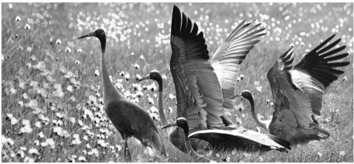
● Sếu đầu đỏ là một nét đặc trưng của tỉnh Đồng Tháp.