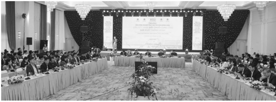
● Toàn cảnh Diễn đàn.

Tại Diễn đàn, VCCI công bố “Báo cáo kinh tế tiêu vùng trực cao tốc phía Đông” cung cấp một phân tích toàn diện về tình hình kinh tế, môi trường kinh doanh, cơ sở hạ tầng và các nỗ lực phát triển bền vững của khu vực VEHEC. Báo cáo này đóng vai trò cung cấp thông tin dành cho các bên