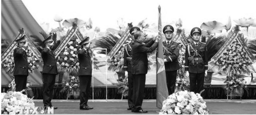
● Tổng Bí thư Tô Lâm gắn Huân chương Độc lập hạng Nhất lên lá cờ truyền thống của Tổng Cục Chính trị Quân đội nhân dân Việt Nam.

Hôm qua (12/12), tại Hà Nội, Tổng cục Chính trị Quân đội nhân dân Việt Nam tổ chức Lễ kỷ niệm 80 năm Ngày truyền thống (22/12/1944 - 22/12/2024) và đón nhận Huân chương Độc lập hạng Nhất. Tổng Bí thư Tô Lâm, Bí thư Quân ủy Trung ương dự và phát biểu tại Lễ kỷ niệm.