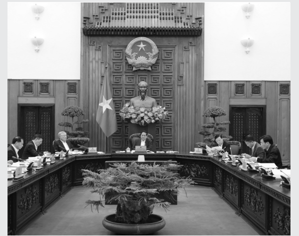
● Thủ tướng Phạm Minh Chính yêu cầu các Bộ, ngành, cơ quan đề cao trách nhiệm, đặt lợi ích quốc gia, dân tộc lên trên hết, trước hết.

Ngày 12/12, Thủ tướng Phạm Minh Chính, Trưởng Ban Chỉ đạo của Chính phủ tổng kết việc thực hiện Nghị quyết số 18-NQ/TW của Hội nghị Trung ương 6 khóa XII "Một số vấn đề về tiếp tục đổi mới, sắp xếp tổ chức bộ máy của hệ thống chính trị tinh gọn, hoạt động hiệu lực, hiệu quả" (Ban Chỉ đạo) đã chủ trì Phiên họp thứ hai của Ban Chỉ đạo.