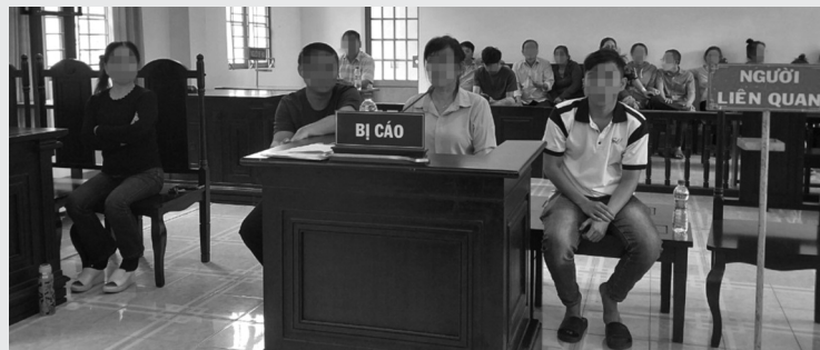
● VKS đề nghị HĐXX phạt tiền các bị cáo về tội "Trốn thuế".

Theo cáo trạng, giao dịch giữa bà Dung và Huệ, theo hợp đồng thì bà Huệ phải nộp thuế TNCN, lệ phí; nên việc ghi giá thấp hơn thực tế dẫn đến bà Huệ trốn thuế TNCN, lệ phí 267,5 triệu đồng (sau khi trừ đi số tiền đã nộp). Bà Huệ bị xác định là chủ mưu, ông Tài bị xác định giúp sức.