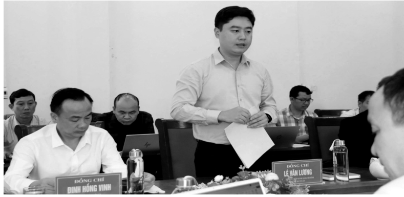
● Bí thư Huyện ủy Tương Dương đề nghị chủ đầu tư thực hiện đúng cam kết.

Ban Thường vụ Huyện ủy Tương Dương (Nghệ An) vừa có cuộc làm việc với chủ đầu tư thủy điện Bản Vẽ để làm rõ một số tồn tại, vướng mắc liên quan đến bồi thường, hỗ trợ và tái định cư (TĐC) tại dự án này.