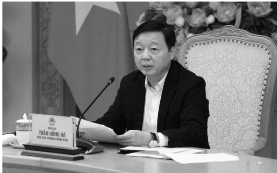
● Phó Thủ tướng Trần Hồng Hà chủ trì cuộc họp phân ban Việt Nam của Ủy ban liên Chính phủ Việt Nam - Liên bang Nga về hợp tác kinh tế - thương mại và khoa học - kỹ thuật.

Theo Biên bản Khóa họp lần thứ 25 của Ủy ban liên Chính phủ Việt Nam - Liên bang Nga về hợp tác kinh tế - thương mại và khoa học - kỹ thuật, hai