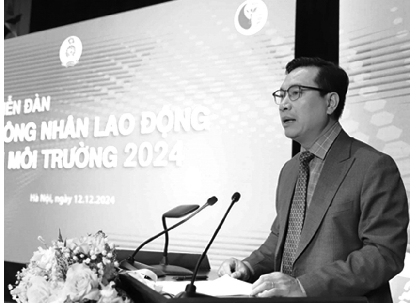
● Ông Hồ Kiên Trung - Phó Cục trưởng Cục Kiểm soát ô nhiễm môi trường (Bộ Tài nguyên và Môi trường) phát biểu tại Diễn đàn.

Hiện nhiều nước trên thế giới không còn bãi chôn lấp vì đều xử lý được chất thải trong khi ở Việt Nam, khoảng 65% tổng lượng CTRSH tại Việt Nam được xử lý bằng phương pháp chôn lấp trực tiếp; Khoảng 16% tổng lượng chất thải được xử lý tại các nhà máy chế biến phân compost