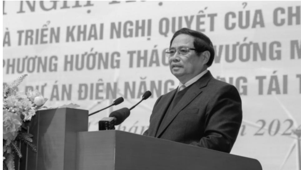
● Thủ tướng Phạm Minh Chính có nhiều chỉ đạo quan trọng nhằm triển khai các giải pháp tháo gỡ cho các dự án năng lượng tái tạo.

Nêu rõ nội dung quan điểm, giải pháp tháo gỡ mà Chính phủ đã thông qua, Thủ tướng nhấn mạnh, xử lý hình sự là biện pháp cuối cùng để tạo điều kiện tháo gỡ các vướng mắc cho các dự án bằng các giải