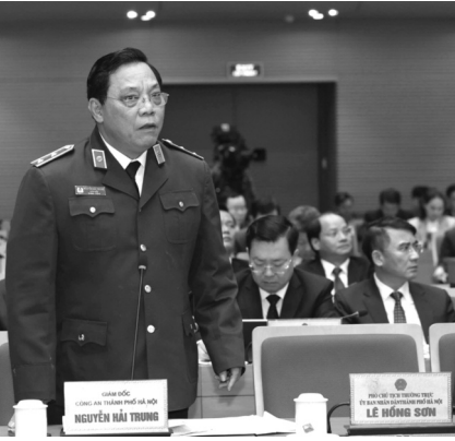
● Trung tướng Nguyễn Hải Trung trả lời một số nội dung đại biểu quan tâm tại phiên chất vấn HĐND.

an TP đã xử lý trên 17.180 trường hợp, phạt tiền ước hơn 8,4 tỷ đồng, tạm giữ hơn 7.800 phương tiện. Trung tướng Trung đánh giá tình trạng này vẫn chưa được giải quyết triệt để, đã tồn tại nhiều năm.