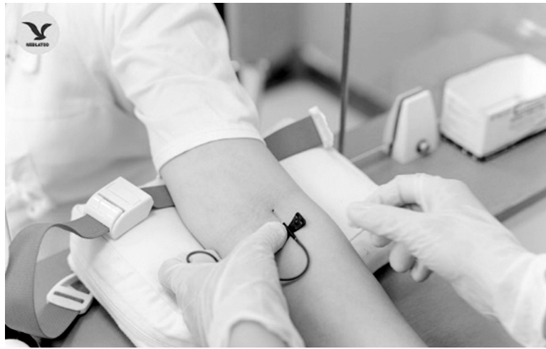
● Tự ý “điều trị” bằng “tiết thực”, bệnh nhân xét nghiệm kiểm tra “tá hóa” phát hiện men gan tăng gấp nhiều lần.

Cô N. đến Bệnh viện Đa khoa MEDLATEC thăm khám, do thấy cơ thể mệt mỏi, chán ăn, vàng mắt, vàng da tăng dần và nước tiểu sẫm màu. Bệnh nhân cho biết tự ý bỏ thuốc kháng virus