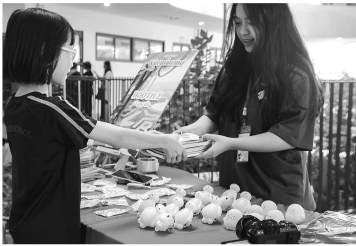
● Hoạt động "Đổi sách - Lấy quà" tại sự kiện "Vết màu mơ".