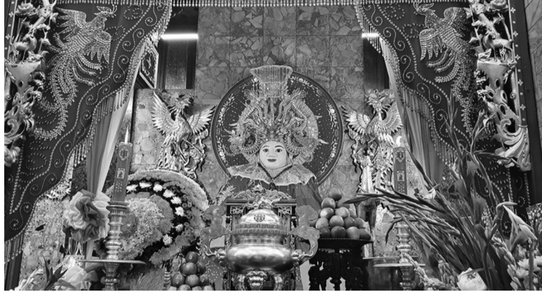
● Tượng Bà Chúa Xứ núi Sam.

Lễ hội vía Bà Chúa Xứ núi Sam đã trở thành nét văn hóa cộng đồng đặc sắc của các dân tộc, nét hành hương tâm linh, tín ngưỡng đặc trưng của Nam Bộ, thu hút hàng triệu lượt người dân và du khách thập phương mỗi năm.