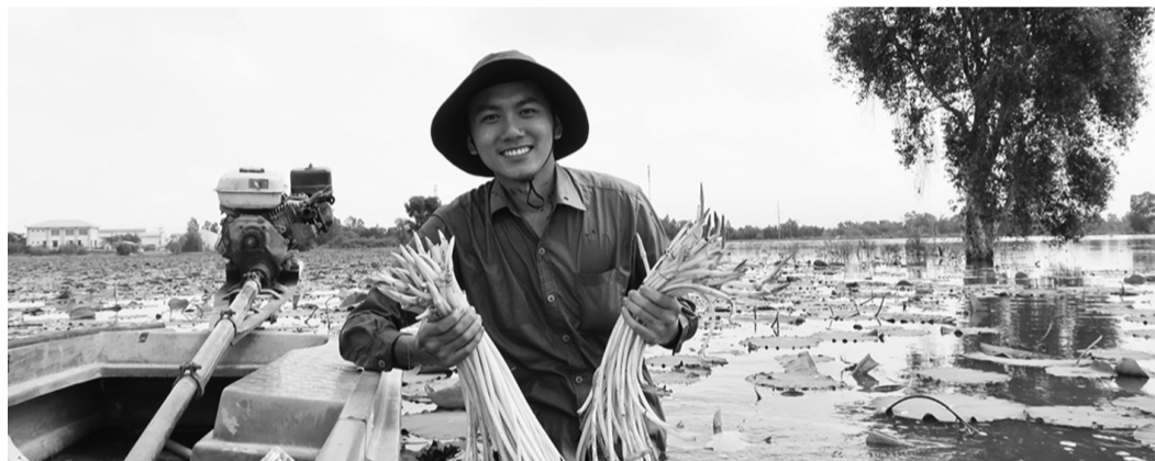
● Khoai Lang Thang lan tỏa văn hóa Việt.

người Việt Nam khi họ tích cực lan tỏa những điều tích cực đến với cộng đồng, quảng bá văn hóa, hình ảnh đất nước và con người Việt Nam đến với bạn bè quốc tế.