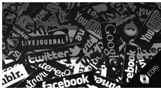
● Mạng xã hội đã và đang trở thành “nơi cư trú” cho sự độc hại.

Trong kỷ nguyên kỹ thuật số, mạng xã hội không chỉ là nơi kết nối mà còn trở thành trung tâm phát tán thông tin. Tuy nhiên, bên cạnh những lợi ích to lớn, không gian này cũng trở thành “bãi rác” khổng lồ với những nội dung độc hại, tin giả và lời nói căm thù. Việc kiểm soát và “dọn rác” mạng xã hội đã trở thành thách thức không nhỏ đối với nhiều quốc gia trên thế giới.