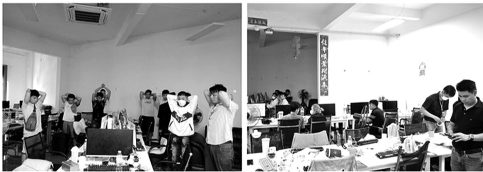
● Hang ổ của một đường dây lừa đảo trên mạng vừa bị Công an triệt phá.