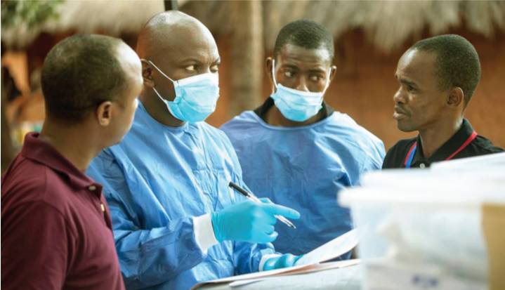
● Đã có hơn 100 trường hợp mắc bệnh X thiệt mạng ở Congo được ghi nhận.