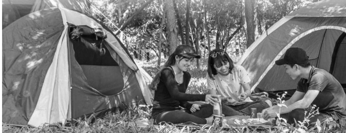
● Cần phải tách bản thân ra khỏi “thế giới ảo”, gắn gũi với thiên nhiên, cuộc sống thực để chữa bệnh do mạng xã hội gây ra. (Ảnh minh họa)