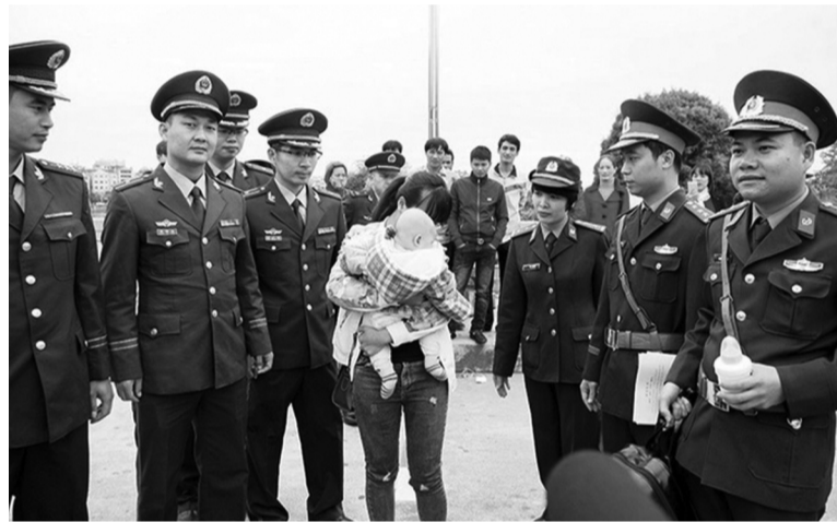
● Lực lượng chức năng tiếp nhận nạn nhân là phụ nữ và trẻ em bị buôn bán trở về.