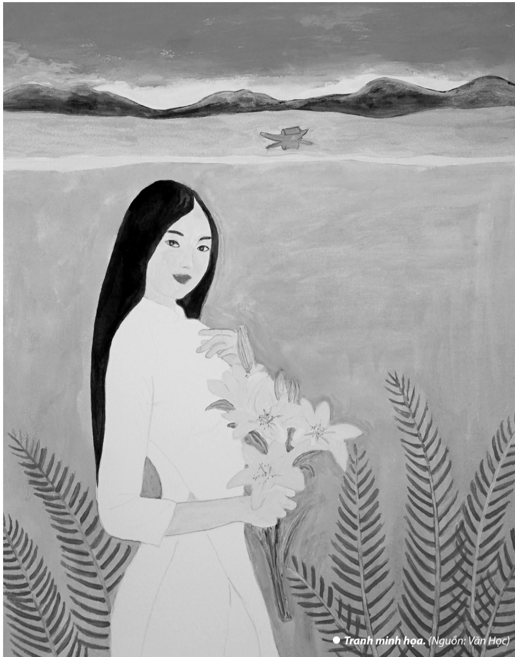
Tranh minh họa.

trong làn nước của sông, thì sông cũng nhuộm màu nhan sắc. Sông trong ngần và thơm hương hơn.