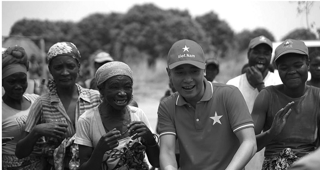
● Quang Linh nhận nhủ các bạn trẻ khi còn trẻ nên làm những việc gì mình cảm thấy tốt, lan tỏa được đến nhiều người.

Rất nhiều hoạt động của các KOLS, Influencer trên mạng xã hội làm cho giới trẻ thêm tự hào về văn hóa, đất nước và con