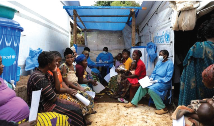
● Bệnh lạ có những triệu chứng như sốt, nhức đầu, ho, sổ mũi và đau nhức cơ thể.