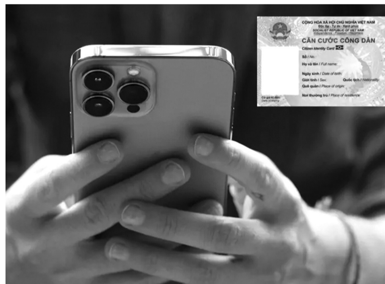
● Pháp luật hiện hành quy định chính danh sử dụng mạng xã hội.

Bên cạnh đó, tổ chức, doanh nghiệp, cá nhân nước ngoài cung cấp dịch vụ mạng xã hội phải có trách nhiệm phân loại và hiển thị cảnh báo các nội dung không phù hợp với trẻ em, triển khai giải pháp bảo vệ trẻ em trên môi trường mạng