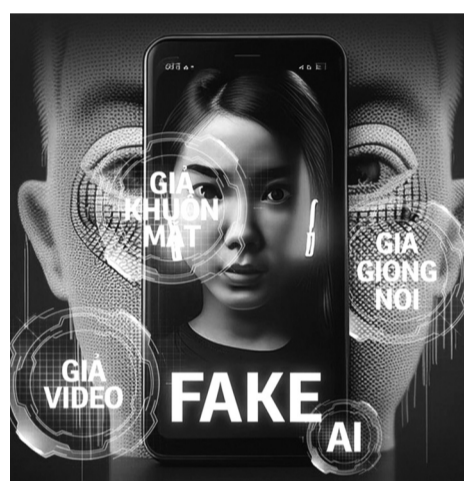
● Tội phạm lừa đảo bằng công nghệ cao là một “mặt trái” của kỷ nguyên số.

Tội phạm về xâm nhập, đánh cắp dữ liệu cũng đang là một “vấn nạn” làm đau đầu người dân, doanh nghiệp lẫn cơ quan chức năng. Chỉ tính riêng trong năm 2023, Bộ Công an đã phát hiện, điều tra, xác minh 16 vụ việc liên quan đến rao bán thông tin, bí mật nhà nước và dữ liệu nội bộ trên không gian mạng. Theo số liệu báo cáo của TANDTC từ năm 2018 đến năm 2023 các tội phạm trong lĩnh vực công nghệ thông tin, mạng viễn thông chủ yếu bị xét xử chủ yếu là các tội phạm liên quan đến bảo vệ dữ liệu cá nhân.