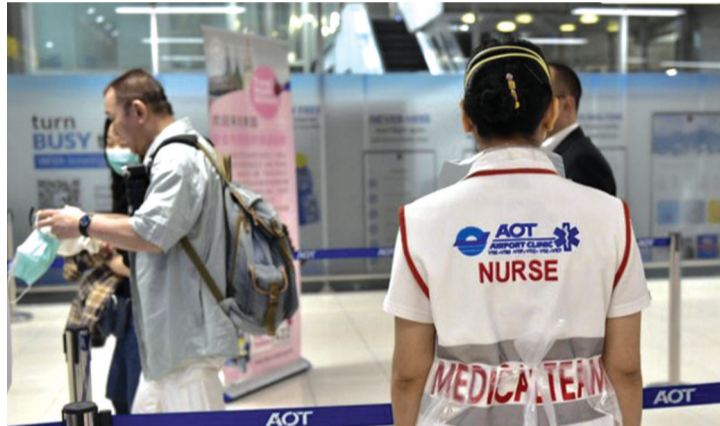
● Bệnh X đang khiến nhiều quốc gia lo ngại.

Cộng hòa Dân chủ Congo đang phải đối mặt với một dịch bệnh bí ẩn, được gọi là bệnh X. Tính đến ngày 11/12, có 416 ca bệnh được báo cáo, trong đó có hơn 100 ca tử vong. Có hơn 50% số ca tử vong là trẻ em, đặc biệt là trẻ suy dinh dưỡng. Căn bệnh này bùng phát từ khu vực y tế Panzi, tỉnh Kwango, vào cuối tháng 10/2024 và đang trở thành tâm điểm chú ý trên toàn cầu.