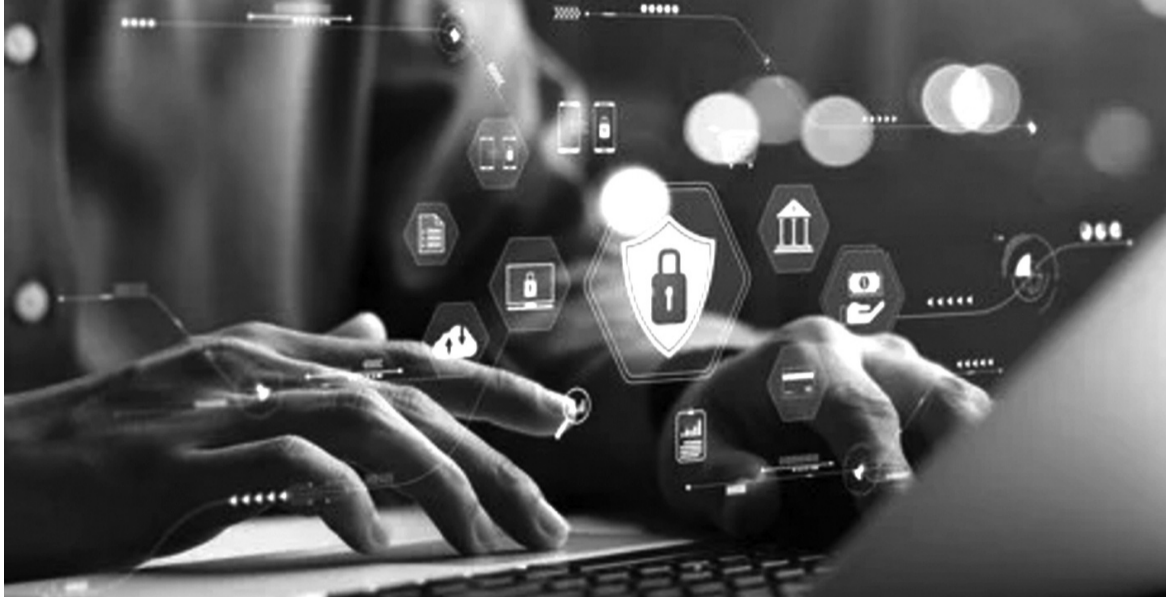
● Các đạo luật mới ra đời nhằm ngăn ngừa, giảm thiểu các hành vi tiêu cực của người dùng trên mạng xã hội.