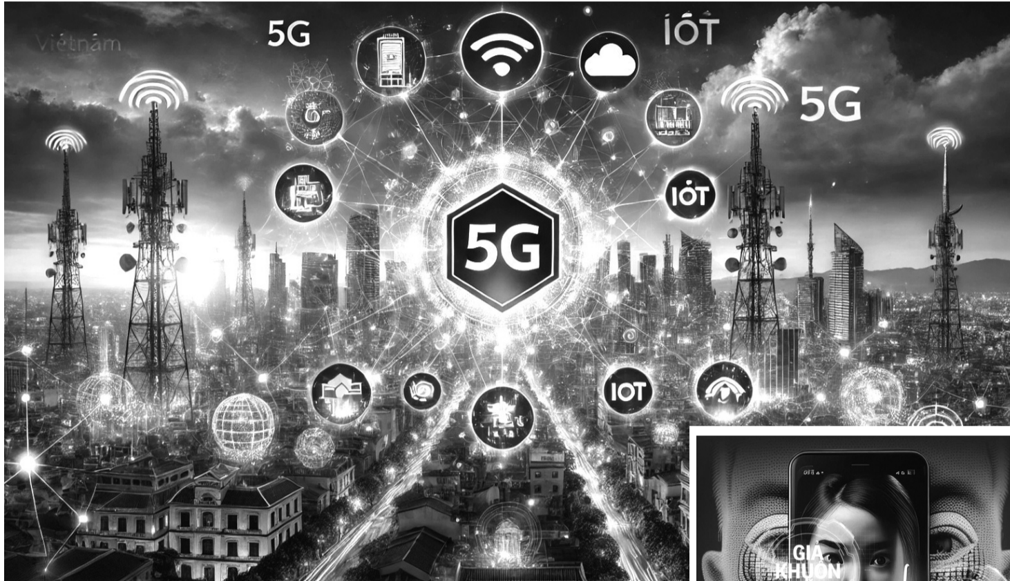
● Thời đại 5G và IoT đang mở ra một kỷ nguyên mới nhưng cũng tạo ra những thách thức nghiêm trọng về an ninh mạng.

Thời đại 5G và Internet vạn vật (IoT) đang mở ra một kỷ nguyên mới, hứa hẹn những bước tiến vượt bậc trong công nghệ và cuộc sống. Tuy nhiên, cùng với cơ hội, 5G và IoT cũng là “con dao hai lưỡi” khi tạo ra những thách thức nghiêm trọng về an ninh mạng.