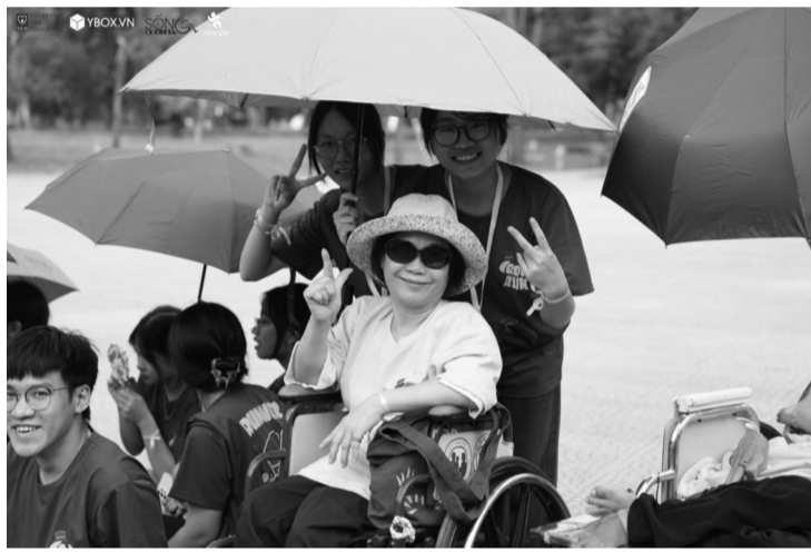
● Sự kiện "Ánh dương" có sự tham gia của những người khuyết tật đến từ trung tâm "Sống độc lập" Hà Nội.