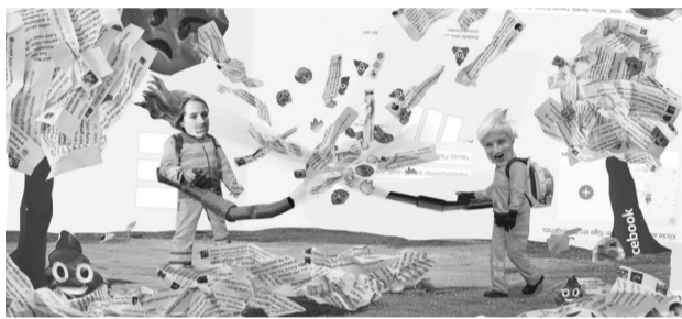
● Đạo luật NetzDG của Đức có một “cây gậy” rất mạnh mẽ, buộc các nhà mạng phải tự “dọn rác” trên nền tảng của mình.