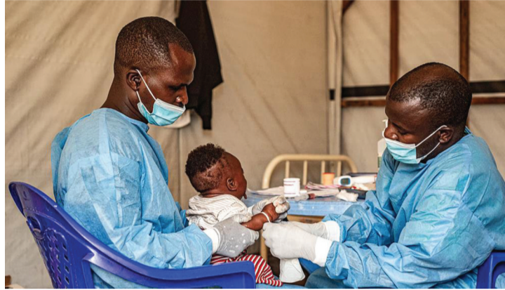
● Có hơn 50% số ca tử vong là trẻ em, đặc biệt là trẻ suy dinh dưỡng.