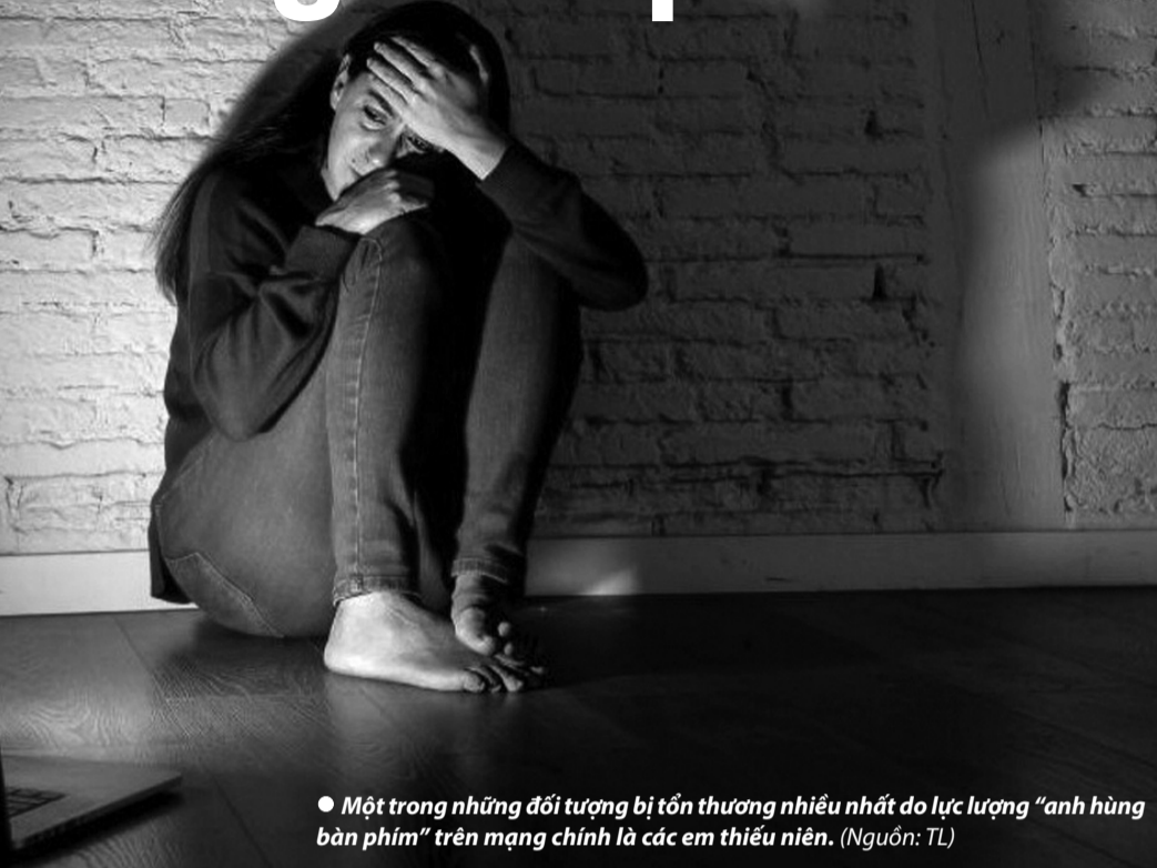
● Một trong những đối tượng bị tổn thương nhiều nhất do lực lượng “anh hùng bàn phím” trên mạng chính là các em thiếu niên.

Trong thời đại số hóa, mạng xã hội đã trở thành một phần không thể thiếu trong cuộc sống. Tuy nhiên, mặt trái của không gian ảo đang lộ rõ qua vấn nạn bạo lực mạng. Những lời chỉ trích, mỉa mai, hay công kích vô căn cứ từ những “anh hùng bàn phím” không chỉ gây tổn thương mà còn để lại những hậu quả khủng khiếp đối với tâm lý, tinh thần và sức khỏe của nạn nhân, đặc biệt là các bạn trẻ.