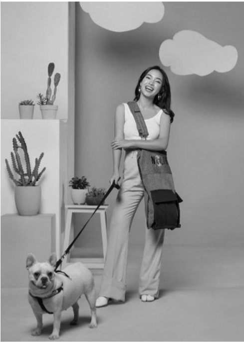
● KOL Châu Bùi mang thông điệp bảo vệ môi trường đến gần hơn với giới trẻ.

Một số người nổi tiếng, KOL, Influencer đã có trách nhiệm trong việc lan tỏa văn hóa giao tiếp văn minh trên mạng xã hội. Với tầm ảnh hưởng lớn, họ truyền cảm hứng tích cực tới mọi người, đặc biệt là giới trẻ.