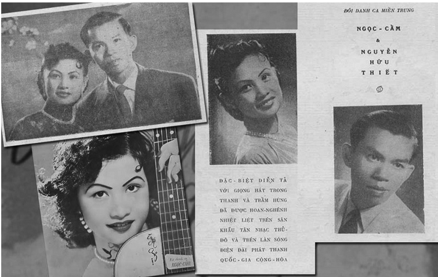
● Ngọc Cẩm - Nguyễn Hữu Thiết được biết đến với mối tình thùy chung.

Vào thập niên 50, 60, cặp đôi danh ca Ngọc Cẩm - Nguyễn Hữu Thiết là một trong những “ngôi sao” của làng tân nhạc Việt Nam. Gần 60 năm bên nhau, cặp đôi Ngọc Cẩm - Nguyễn Hữu Thiết không chỉ ghi dấu trong lòng người hâm mộ bằng những câu hát rung động lòng người, mà còn bằng mối tình sắt son, thủy chung của cả hai.