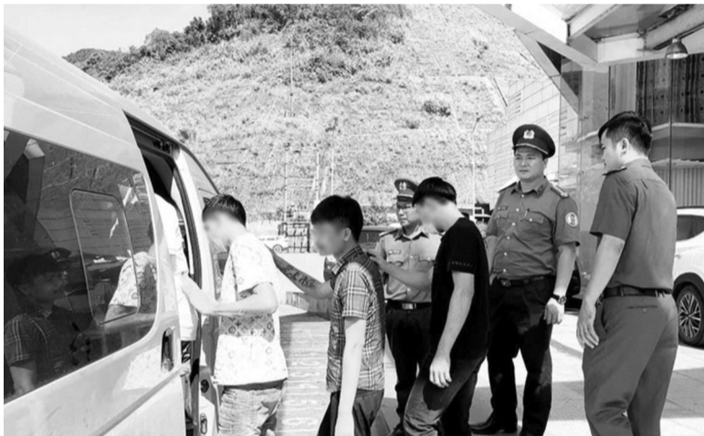
● Các nạn nhân nam giới bị mua bán được lực lượng chức năng giải cứu, đưa về nước an toàn.