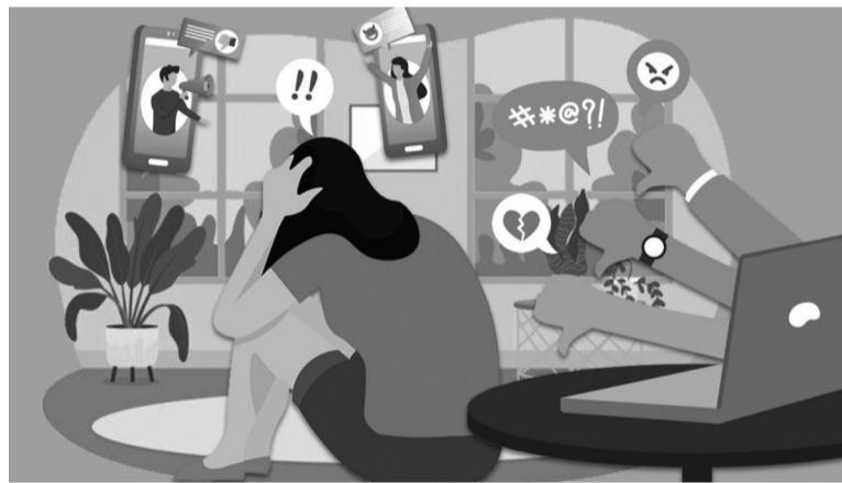
● Sự thiếu kiểm soát cảm xúc, cộng thêm hiệu ứng đám đông biến mạng xã hội thành một “phiên tòa” đầy định kiến, nơi mà “anh hùng bàn phím” sẵn sàng làm “quan tòa” kết tội bất kỳ ai.