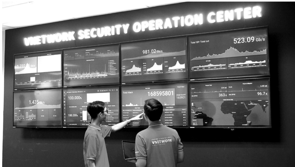
● Đội ngũ chuyên gia giám sát và ứng cứu tấn công mạng tại Vnetwork https://www.vnetwork.vn . (Ảnh minh họa - Nguồn: Vnetwork.vn)

Có hiệu lực thi hành từ ngày 25/12/2024, so với Nghị định 72 năm 2013, Nghị định 147 đã bổ sung, hoàn thiện nhiều quy định pháp luật về quản lý Internet và thông tin trên mạng, với mục đích khắc phục những vướng mắc, bất cập phát sinh