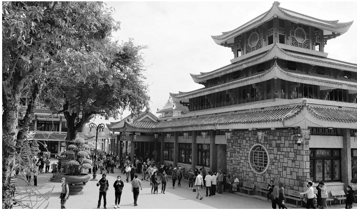
● Miếu Bà Chúa Xứ núi Sam thu hút hàng triệu du khách mỗi năm.

Dân làng thấy vậy, có ý muốn "thỉnh" tượng xuống núi để gìn giữ và phụng thờ. Bao nhiêu tráng đinh lực điền được huy động, nhưng không sao nhấc pho tượng lên được. Khi các bộ lão trong làng cầu khẩn, thì được mách "Hãy chọn 9 cô gái đồng trinh để đưa Bà xuống núi". Lạ thay, 9 cô gái khiêng tượng Bà đi một cách nhẹ nhàng. Xuống đến chân núi, tượng bỗng nặng