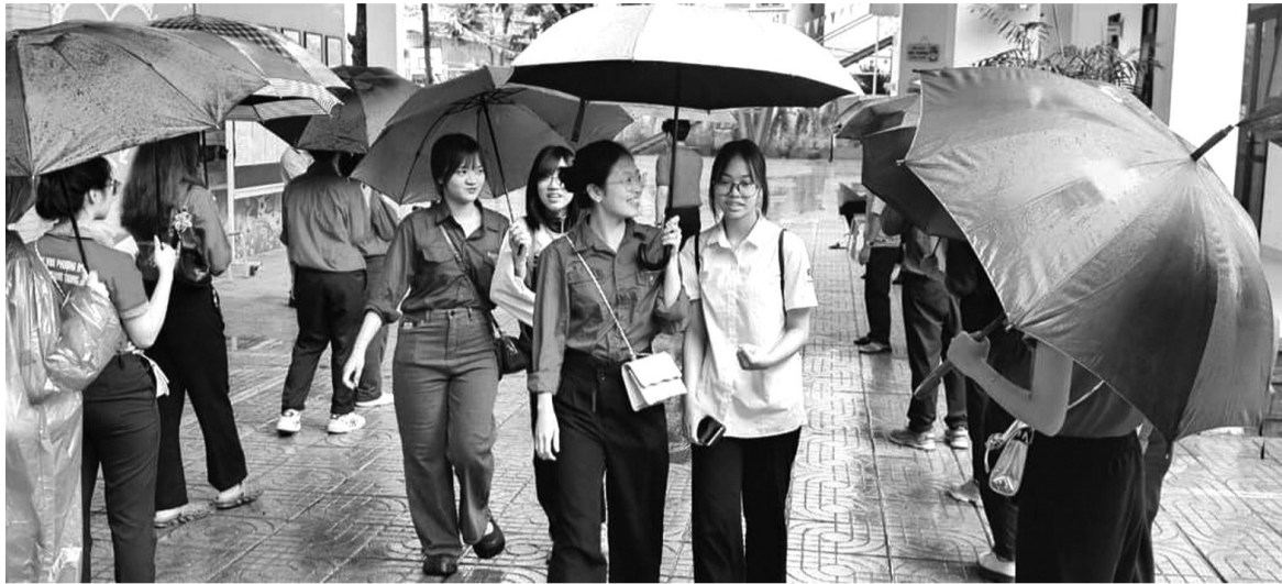
● Kỳ thi tốt nghiệp THPT, tuyển sinh ĐH, CĐ luôn là mục tiêu của HS, phụ huynh.