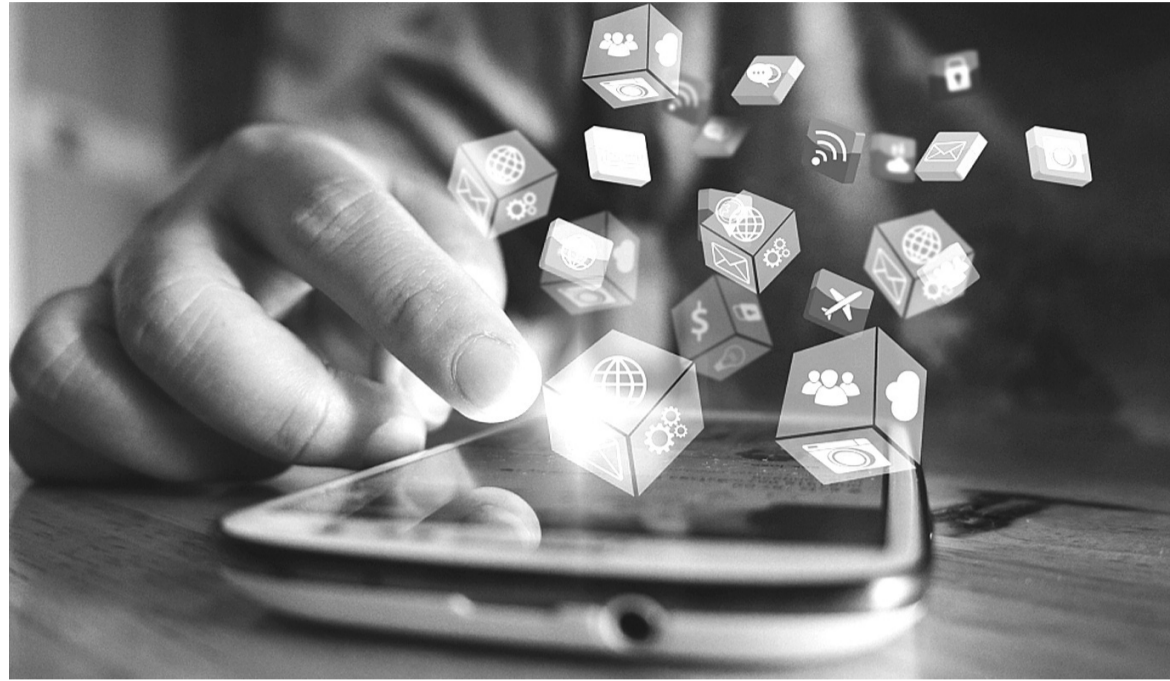
● Mỗi người dùng mạng xã hội cần có thói quen suy nghĩ cẩn thận trước khi gõ phím.

Một văn bản pháp luật đáng chú ý thời gian qua là Nghị định số 147/2024/NĐ-CP ngày 09/11/2024 quy định về quản lý, cung cấp, sử dụng dịch vụ internet và thông tin trên mạng, bổ sung các quy định mới nhằm thay đổi thói quen của người sử dụng mạng xã hội. Cụ thể, Nghị định này quy định về trách nhiệm cho những tổ chức, doanh nghiệp, cá nhân nước ngoài cung cấp thông tin xuyên biên giới vào Việt Nam, có sử dụng dịch vụ cho thuê lưu trữ dữ liệu tại Việt Nam hoặc có tổng số lượt truy cập từ Việt Nam thường xuyên trong một tháng