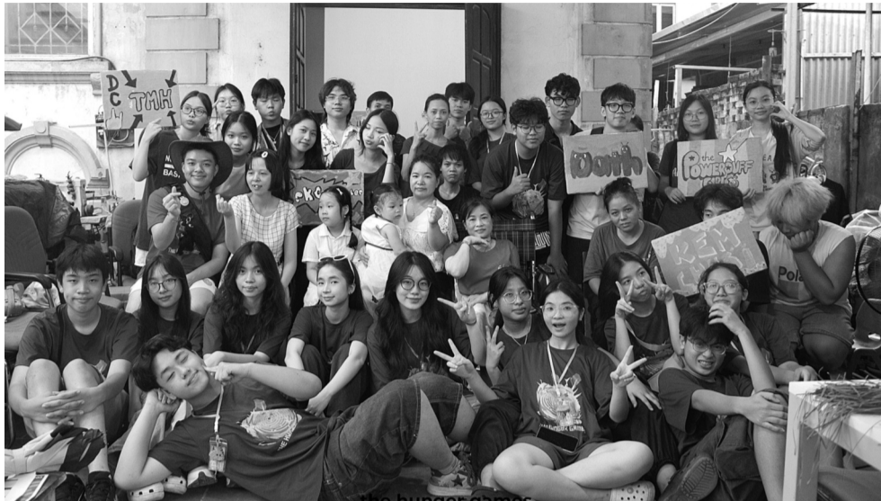
● Người tham gia "The Hunger Games 2024" giao các suất ăn tới CLB Thanh, thiếu niên khuyết tật vườn Hướng Dương.

Với lòng nhiệt huyết và trái tim đầy yêu thương, các bạn học sinh Thủ đô đã cùng nhau chung tay thực hiện nhiều hoạt động cộng đồng ý nghĩa. Những hoạt động này không chỉ góp phần xây dựng một xã hội tốt đẹp mà còn lan tỏa niềm vui tới mọi người xung quanh, đồng thời khiến các bạn học sinh tìm thấy hạnh phúc từ chính những việc làm của mình.