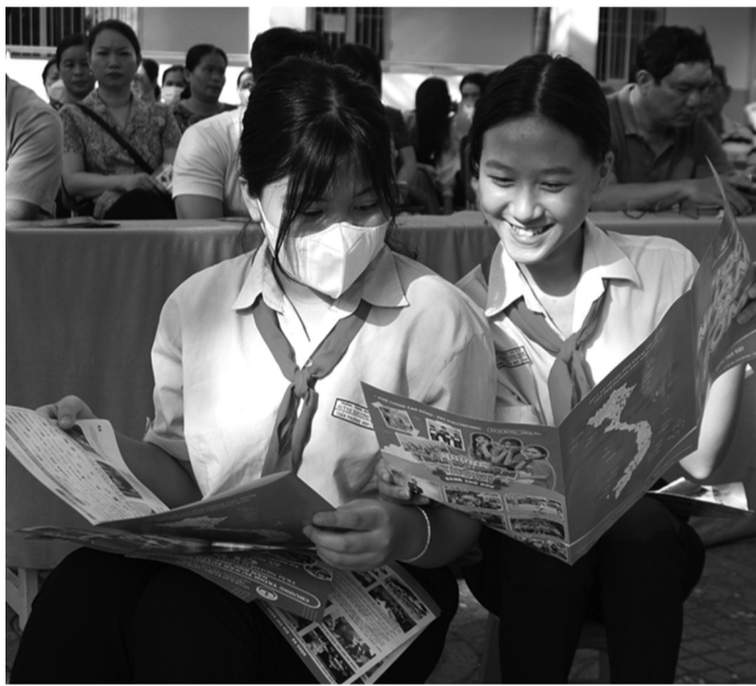
● Học sinh TP Vũng Tàu tham gia chương trình tuyển sinh, hướng nghiệp sau THCS.

hội nhập quốc tế” do Bộ Giáo dục và Đào tạo chuẩn bị, học sinh hoàn thành chương trình giáo dục tiểu học vào trung học cơ sở đạt 94,3%, học sinh hoàn thành Chương trình giáo dục trung học cơ sở đạt 90,7% và phần lớn các tỉnh/thành đều có hơn 70% học sinh tốt nghiệp trung học cơ sở học tiếp lên trung học phổ thông, thậm chí có địa phương hơn 80%. Nhìn vào số liệu trên có thể thấy, chủ yếu học sinh đổ xô vào trung học phổ thông, tỷ lệ học sinh tốt nghiệp trung học cơ sở vào học nghề và trung cấp còn rất thấp.