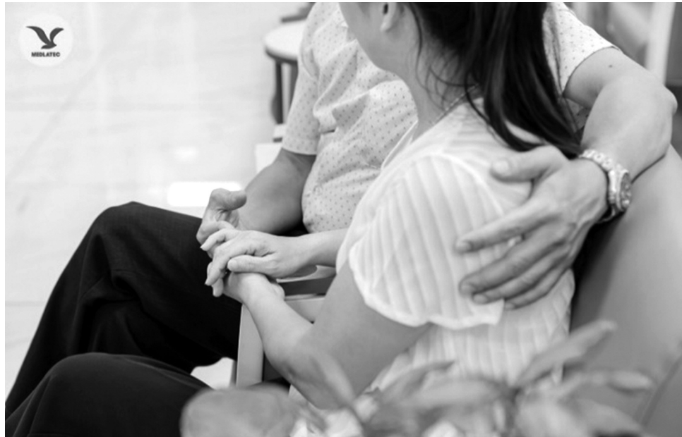
● Tìm con trở thành niềm khát khao cháy bỏng với những cặp vợ chồng vô sinh, hiếm muộn.

Sau 10 năm dài dang đẳng mong chờ, tưởng chừng hạnh phúc mỉm cười với vợ chồng chị, nhưng lại phủ phàng vụt tắt khi tuần thai thứ 10 thực hiện xét nghiệm NIPT phát hiện bất thường ở thai nhi và mẹ bầu.