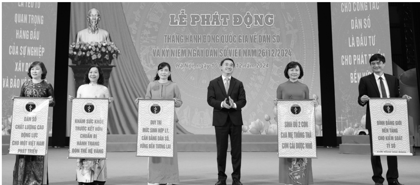
● Một trong những thông điệp được đưa ra nhân Ngày Dân số Việt Nam (26/12) năm nay là "Sinh đủ hai con, cha mẹ thông thái, con cái được nhờ".

Việt Nam đã xuất hiện xu thế mức sinh xuống thấp, thậm chí thấp nhất trong lịch sử từ trước đến nay vào năm 2023 khi mức sinh ước tính là 1,96 con/phụ nữ và dự báo tiếp tục giảm.