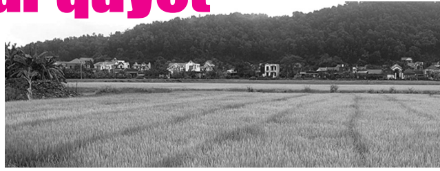
● Một phần khu vực được quy hoạch dự án.

Thực hiện ý kiến chỉ đạo của Giám đốc Công an tỉnh Thanh Hóa về việc kiểm tra, giải quyết phản ánh của Báo PLVN về sự việc tại dự án Khu dân cư Thành Lộc (huyện Hậu Lộc). Phòng Cảnh sát kinh tế (CSKT) Công an tỉnh đã có Thông báo kết quả giải quyết 25/TB-CSKT gửi Báo PLVN.