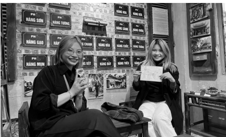
● Các bạn trẻ hào hứng khi được tự tay làm những tấm bưu thiếp, tấm thiệp theo phong cách Hà Nội xưa. (Ảnh: PV)

36 phố phường Hà Nội không chỉ là biểu tượng văn hóa, mà còn