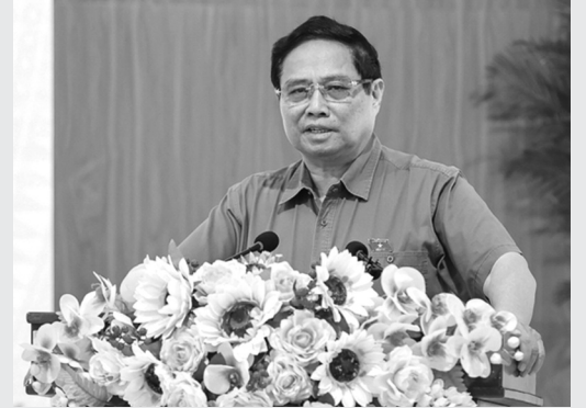
● Thủ tướng Phạm Minh Chính ghi nhận, đánh giá cao và chúc mừng kết quả đạt được của Đảng bộ, chính quyền, quân và dân Cần Thơ trong thời gian qua.

Sáng 15/12, Thủ tướng Phạm Minh Chính cùng Đoàn đại biểu Quốc hội thành phố Cần Thơ đã tiếp xúc cử tri huyện Cờ Đỏ để thông báo kết quả Kỳ họp thứ 8, Quốc hội khóa XV; các hoạt động của Đoàn đại biểu Quốc hội thành phố Cần Thơ tại Kỳ họp; lắng nghe, giải đáp các ý kiến, kiến nghị của cử tri.