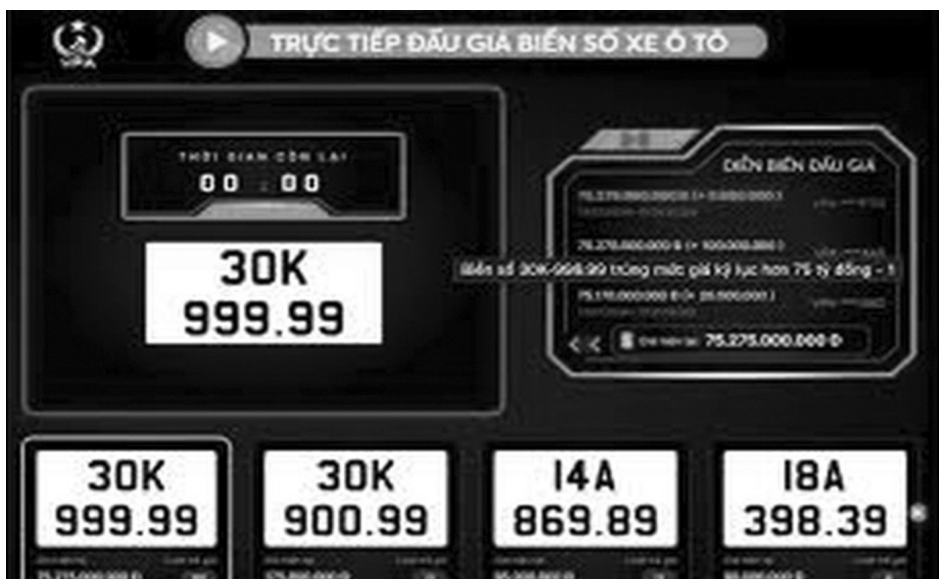
● Từ 1/1/2025, giá khởi điểm đấu giá biển số xe ô tô là 40 triệu đồng.

Chính phủ vừa ban hành Nghị định 156/2024/NĐ-CP quy định về đấu giá biển số xe; trong đó quy định giá khởi điểm của một biển số xe ô tô đưa ra đấu giá là 40 triệu đồng, của một biển số xe mô tô, xe gắn máy đưa ra đấu giá là 5 triệu đồng.