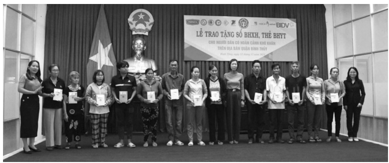
● Trao tặng sổ BHXH, thẻ BHYT cho người dân có hoàn cảnh khó khăn trên địa bàn quận Bình Thủy.

BHYT cho người dân có hoàn cảnh khó khăn trên địa bàn quận Bình Thủy, TP Cần Thơ.