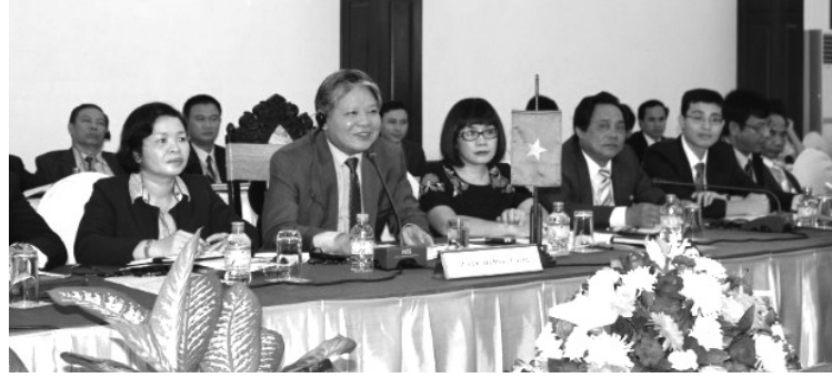
● Lãnh đạo Bộ Tư pháp Việt Nam phát biểu tại Hội nghị Tư pháp các tỉnh đường biên Việt Nam - Lào lần II năm 2014.