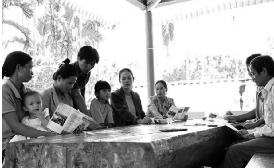
● Mô hình “Địa chỉ tin cậy cộng đồng” đến tận nhà tuyên truyền kiến thức pháp luật về phòng, chống bạo lực gia đình.