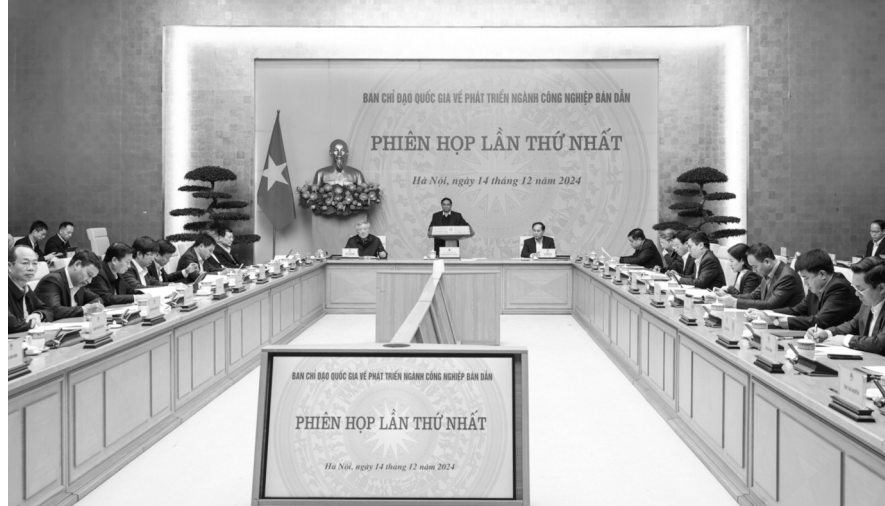
● Thủ tướng Phạm Minh Chính chủ trì Phiên họp Ban Chỉ đạo quốc gia về phát triển ngành công nghiệp bán dẫn.

Về chủ trương, chính sách, Đảng ta đã xác định tiếp tục phát triển toàn diện nguồn nhân lực, khoa học, công nghệ, đổi mới sáng tạo. Nghị quyết số 52-NQ/TW ngày 27/9/2019 của Bộ Chính trị về một