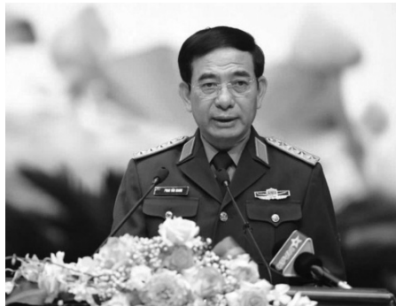
● Bộ trưởng Bộ Quốc phòng Phan Văn Giang phát biểu khai mạc Hội thảo.

Cuối tuần qua, tại Hà Nội, Bộ Quốc phòng đã chủ trì, phối hợp với Ban Tuyên giáo Trung ương, Bộ Công an và tỉnh Cao Bằng tổ chức Hội thảo khoa học cấp quốc gia với chủ đề “Quân đội nhân dân Việt Nam - Truyền thống hào hùng, sự nghiệp vẻ vang, lực lượng nòng cốt xây dựng nền quốc phòng toàn dân vững mạnh”.