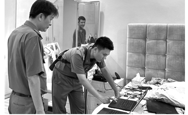
● Cảnh sát khám xét nơi làm việc của các Cty vi phạm.