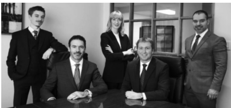
● Các luật sư ở Canada.

Bộ Tư pháp hoạt động như: Một bộ phận chính sách có trách nhiệm rộng lớn trong việc giám sát mọi vấn đề liên quan đến việc quản lý tư pháp thuộc phạm vi liên bang - với tư cách này, Bộ giúp bảo đảm một hệ thống tư pháp công bằng, phù hợp và dễ tiếp cận cho tất cả người dân Canada; Một cơ quan Trung ương chịu trách nhiệm hỗ trợ Bộ trưởng trong việc tư vấn cho Nội