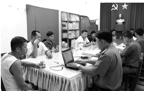
●CQĐT đã khởi tố 29 đối tượng trong vụ án.