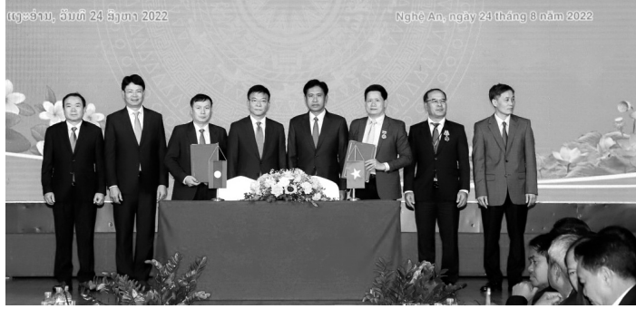
● Lãnh đạo Bộ Tư pháp Việt Nam và Bộ Tư pháp Lào chứng kiến ký kết Chương trình hợp tác năm 2023.