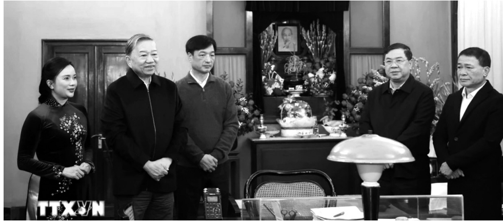
● Tổng Bí thư Tô Lâm nói chuyện với cán bộ, nhân viên Ban Quản lý Khu di tích Chủ tịch Hồ Chí Minh tại Phủ Chủ tịch.

Tròn 70 năm kể từ ngày Bác Hồ về sống và làm việc tại Khu Phủ Chủ tịch (1954 - 2024), Khu di tích vẫn vang mãi bàn hùng