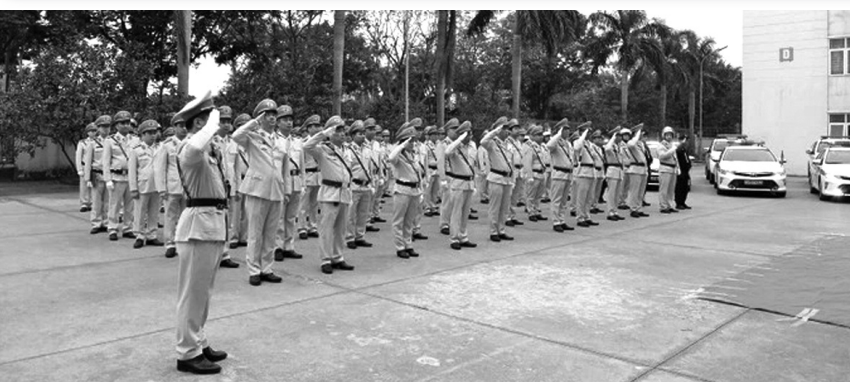
●CBCS Cục CSGT tại lễ ra quân.

Huy động và bố trí lực lượng tập trung xử lý: Nhân viên đường sắt, lái tàu vi phạm nồng độ cồn, ma túy; vi phạm quy trình tác nghiệp; người điều khiển phương tiện đường bộ qua đường ngang, lối đi tự mở không chấp hành hiệu lệnh của nhân viên gác chắn, đèn tín hiệu, biển báo hiệu, vạch kẻ đường; dừng, đỗ, quay đầu xe trong phạm vi an toàn đường ngang, trường hợp kiểm tra phát hiện dấu hiệu vi phạm nồng độ cồn, ma túy thì phải xử lý theo quy định...; kiểm tra, xử lý các điểm vi phạm hành lang, lối đi tự mở trên tuyến đường sắt Hà Nội - TP HCM.