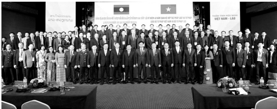
● Đại biểu hai nước tham dự Hội nghị công tác tư pháp các tỉnh có chung đường biên giới Việt Nam - Lào mở rộng lần thứ V. (Ảnh trong bài: PV)

Hội nghị cũng đã thống nhất rà soát lại Hiệp định Tương trợ tư pháp Việt Nam - Lào để bổ sung, đổi mới; phối hợp chặt chẽ trong quá trình tham gia các Hiệp định ASEAN và Lahay về tư pháp quốc tế; thực hiện hiệu quả thỏa thuận 2011 - 2015.