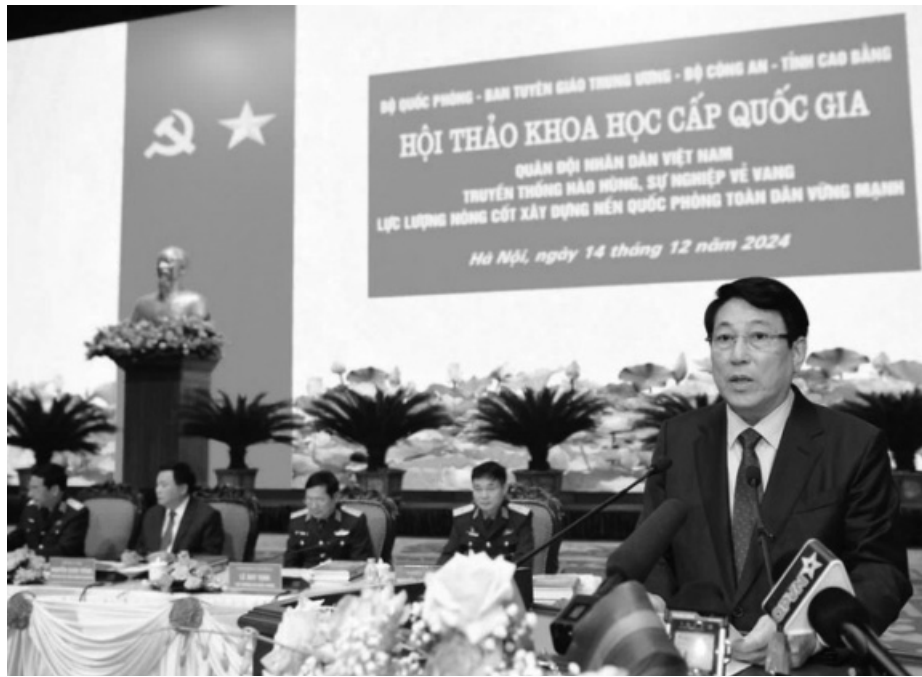
● Chủ tịch nước Lương Cường phát biểu chỉ đạo tại Hội thảo.

“Hội thảo khoa học hôm nay có ý nghĩa rất quan trọng nhằm tiếp tục nghiên cứu toàn diện, sâu sắc, đầy đủ hơn về tầm nhìn chiến lược, đường lối lãnh đạo đúng đắn của Đảng Cộng sản Việt Nam và Chủ tịch Hồ Chí Minh đối với QĐND Việt Nam và sự nghiệp quân sự, quốc phòng; về quá trình xây dựng, trưởng thành, chiến đấu và chiến thắng, truyền thống hào hùng, sự nghiệp vẻ vang của Quân đội và Nhân dân ta. Trên cơ sở đó, rút ra những kinh nghiệm và bài học lịch sử để vận dụng, phát huy trong xây dựng Quân đội “cách mạng, chính quy, tinh nhuệ, hiện đại”, phát huy vai trò nòng cốt của Quân đội trong xây dựng nền quốc phòng toàn dân, thế trận quốc phòng toàn dân gắn với xây dựng thế trận an ninh nhân dân vững chắc, đáp ứng yêu cầu xây dựng và bảo vệ Tổ quốc trong giai đoạn cách mạng mới” - Đại