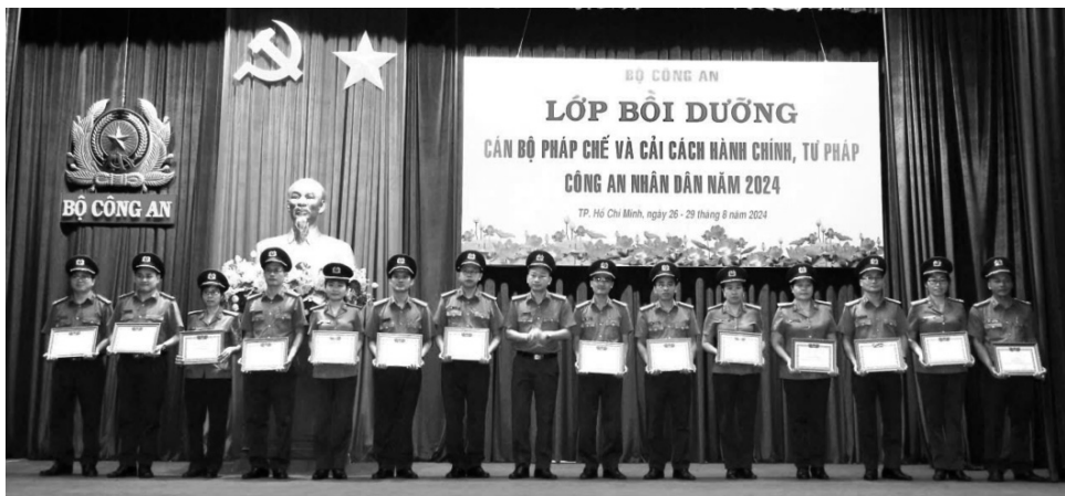
● Bộ Công an tổ chức bồi dưỡng nâng cao trình độ cho cán bộ pháp chế.

Theo nghiên cứu của Viện Chiến lược và Khoa học pháp lý (Bộ Tư pháp), trong tổ chức bộ máy các cơ quan hành chính Việt Nam hiện nay đã hình thành các cơ quan, đơn vị, đội ngũ pháp chế thực hiện các chức năng liên quan đến công tác pháp luật, trong đó có các nhiệm vụ của "luật sư Nhà nước".