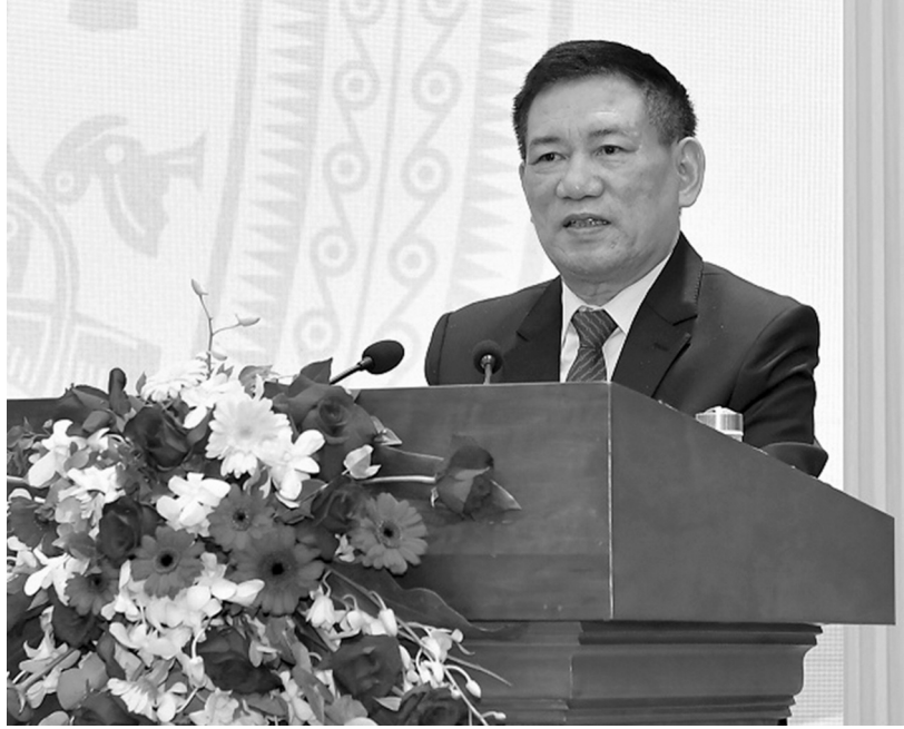
● Phó Thủ tướng Hồ Đức Phớc phát biểu tại Hội nghị.

Tiếp tục triển khai các biện pháp hỗ trợ vốn cho phát triển