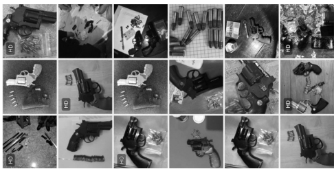
●Một phần tang vật vụ án.

Lê Chí Hào khai, từ khoảng tháng 9/2023 đến khi bị bắt, đã lên mạng xã hội đặt mua 19 khẩu súng mô hình (ZP-5, SKY, súng bút) giá chỉ từ vài trăm nghìn đồng. Nhận hàng, Hào tháo nòng súng, mua ống inox đặc, mang đến tiệm cơ khí trên địa bàn thuê gia công theo yêu cầu. Sau đó, đối tượng đem về nhà tự chế tạo, lắp đặt, sửa chữa nòng súng, ô quay thành khẩu súng hoàn chỉnh.