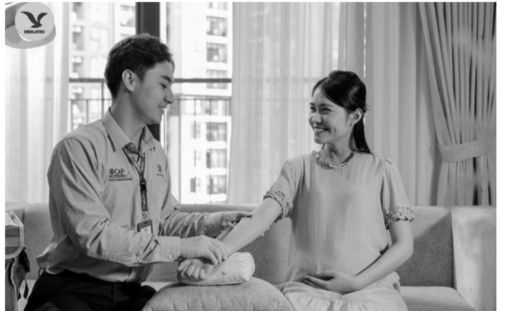
● Thực hiện xét nghiệm NIPT, mẹ bầu an tâm thai kỳ khỏe mạnh.