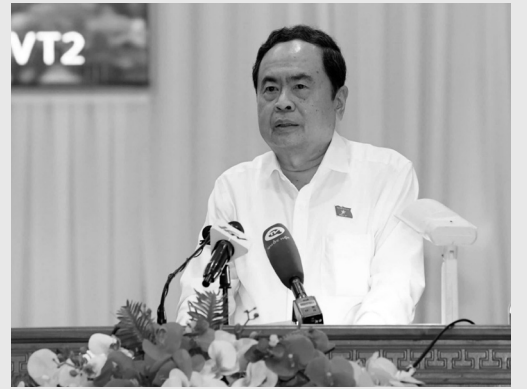
● Chủ tịch Quốc hội Trần Thanh Mẫn phát biểu tại buổi tiếp xúc cử tri.

Tại buổi tiếp xúc, cử tri Hậu Giang đánh giá cao và bày tỏ phần khởi khi Kỳ họp thứ 8, Quốc hội khóa XV đã có nhiều quyết định quan trọng. Cử tri cũng bày tỏ đồng tình với chủ trương tinh giản biên chế, tinh gọn bộ máy và nâng cao chất lượng hoạt động của bộ