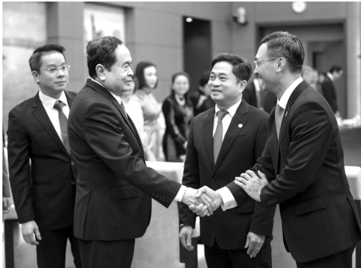
● Chủ tịch Quốc hội Trần Thanh Mẫn gặp gỡ các Đại sứ, Trưởng cơ quan đại diện ngoại giao Việt Nam ở nước ngoài trước khi lên đường làm nhiệm vụ.

Lưu ý năm 2025, đất nước ta có nhiều sự kiện quan trọng và để thực hiện được các mục tiêu đã đề ra, Chủ tịch QH đề nghị các Đại