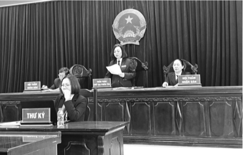
● HĐXX nhận định nguyên nhân sự việc xuất phát từ mâu thuẫn chơi thể thao giữa các học sinh, tuổi trẻ bong bột.