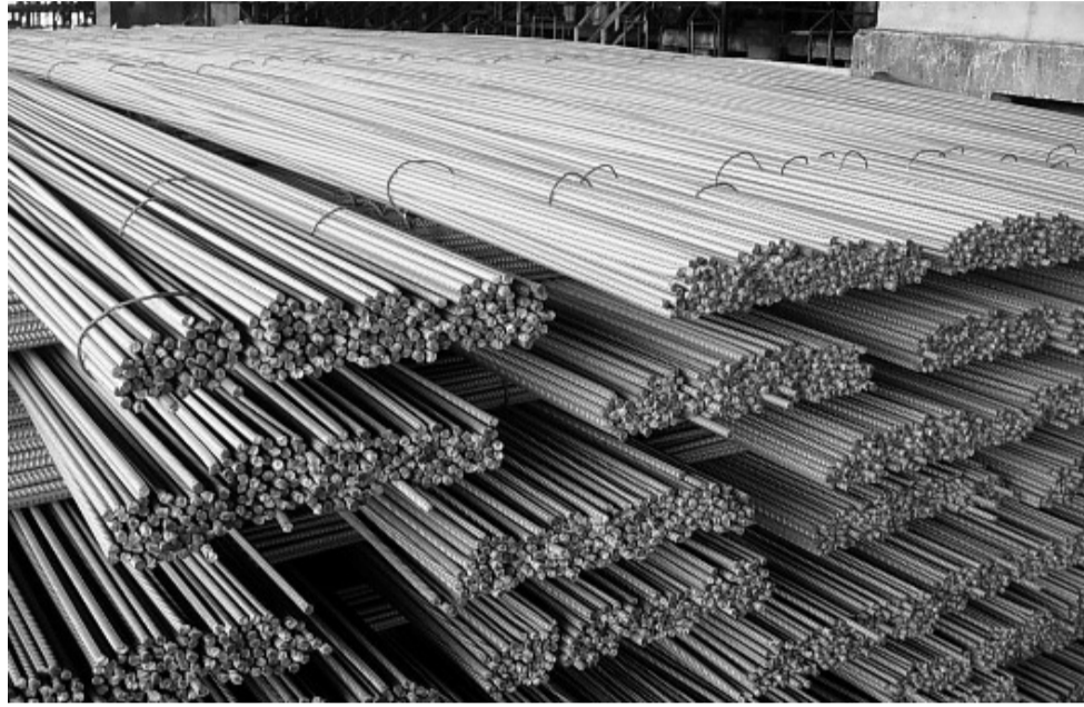
● Thép là mặt hàng có tần suất bị điều tra phòng vệ thương mại lớn nhất.

Đại diện Vụ Thị trường châu Âu - châu Mỹ (Bộ Công Thương) cho biết, Hoa Kỳ cũng là quốc gia áp dụng nhiều nhất các biện pháp PVTM đối với hàng hóa XK của Việt Nam, bao gồm điều tra chống trợ cấp và chống bán phá giá, tập trung vào các mặt hàng XK chủ lực như đồ gỗ, thủy sản, dệt may, da giày... Các cuộc điều tra nhằm xác định liệu các sản phẩm này có được trợ cấp từ chính phủ hay bán với giá thấp hơn giá trị thực tế, gây thiệt hại cho ngành sản xuất Hoa Kỳ hay không. Bên cạnh đó, Hoa Kỳ cũng siết chặt các quy định nhằm ngăn