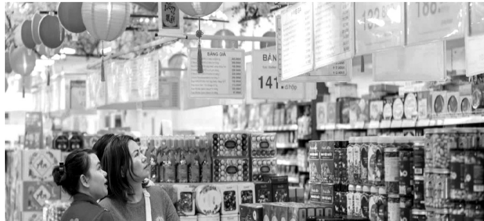
● Các chương trình khuyến mại cũng được triển khai mạnh mẽ để kích cầu tiêu dùng.

Đặc biệt, năm nay, Saigon Co.op còn cung cấp các loại giỏ quà Tết hướng đến