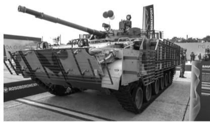
● Xe chiến đấu bộ binh BMP-3ME do Nga sản xuất.

quân sự, Tập đoàn Công nghiệp - Viễn thông Quân đội Viettel) và các công ty thương mại, dịch vụ của BQP nghiên cứu, chế tạo.