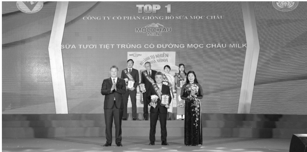
● Mộc Châu Milk được vinh danh tại buổi lễ.

Lễ tôn vinh năm nay ghi nhận 150 sản phẩm, dịch vụ từ 142 DN thuộc 18 nhóm ngành được trao danh hiệu “Hàng Việt Nam được người tiêu dùng yêu thích”. Đây là kết quả của quá trình bình chọn minh bạch và nghiêm túc, kéo dài suốt ba tháng, với sự