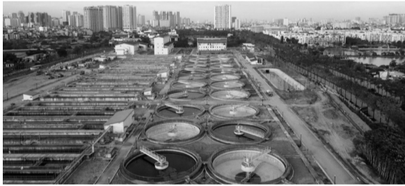
● Nhà máy xử lý nước thải Yên Xá bước vào giai đoạn 6 tháng vận hành thử nghiệm.