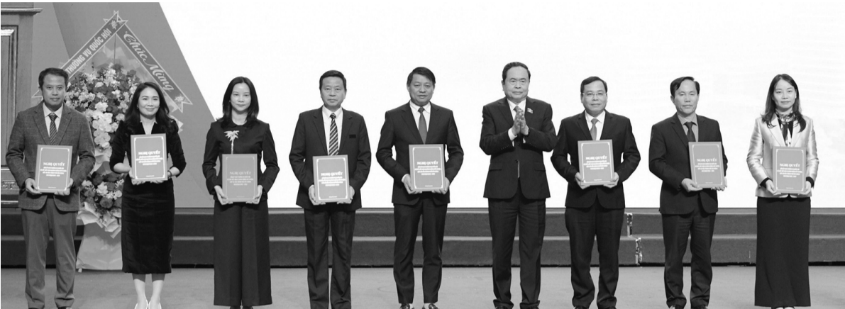
● Chủ tịch Quốc hội Trần Thanh Mẫn trao Nghị quyết của Ủy ban Thường vụ Quốc hội về sắp xếp đơn vị hành chính cấp huyện, cấp xã của TP Hải Phòng.

Chiều 18/12, tại Cung Văn hóa lao động hữu nghị Việt Tiệp, Ủy viên Bộ Chính trị, Chủ tịch Quốc hội Trần Thanh Mẫn dự và phát biểu chỉ đạo tại Hội nghị công bố Nghị quyết của Quốc hội về tổ chức chính quyền đô thị TP Hải Phòng và Nghị quyết của Ủy ban Thường vụ Quốc hội về sắp xếp đơn vị hành chính cấp huyện, cấp xã của TP Hải Phòng giai đoạn 2023 - 2025.