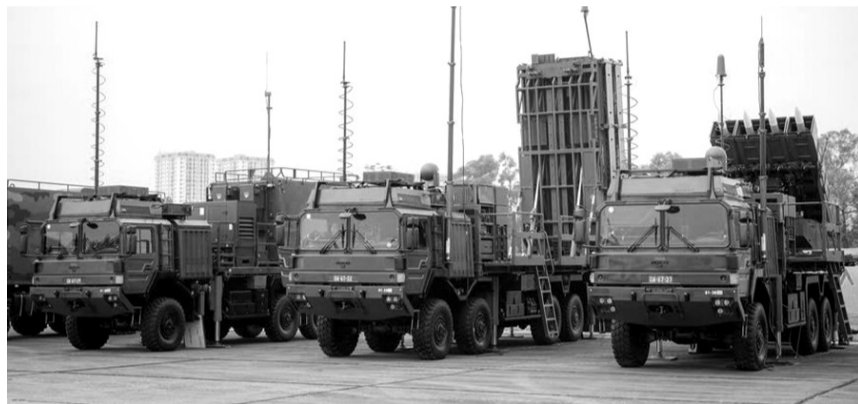
● Một số sản phẩm của Tập đoàn Viettel.

Các sản phẩm của Việt Nam trưng bày, giới thiệu tại triển lãm gồm các sản phẩm do các cơ quan, đơn vị của Bộ Quốc phòng (BQP - gồm Tổng cục CNQP, Quân chủng Phòng không - Không quân, Quân chủng Hải quân, Học viện Kỹ thuật Quân sự, Trung tâm Nhiệt đới Việt - Nga, Binh chủng Tăng - thiết giáp, Binh chủng Hóa học, Viện Khoa học và Công nghệ