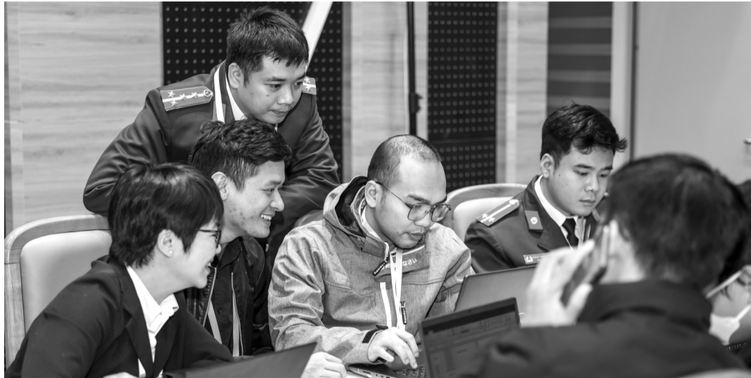
● Các đội diễn tập từ chính những tình huống có thật. (Ảnh: A05)

Thực hiện kế hoạch hoạt động của Ban Chỉ đạo An toàn, An ninh mạng quốc gia và kỷ niệm Ngày An ninh mạng Việt Nam, Bộ Công an phối hợp với Hiệp hội An ninh mạng quốc gia lần đầu tiên tổ chức diễn tập an ninh mạng quốc gia năm 2024 với chủ đề “Ứng phó khắc phục sự cố tấn công APT vào hệ thống thông tin quan trọng về an ninh quốc gia”.