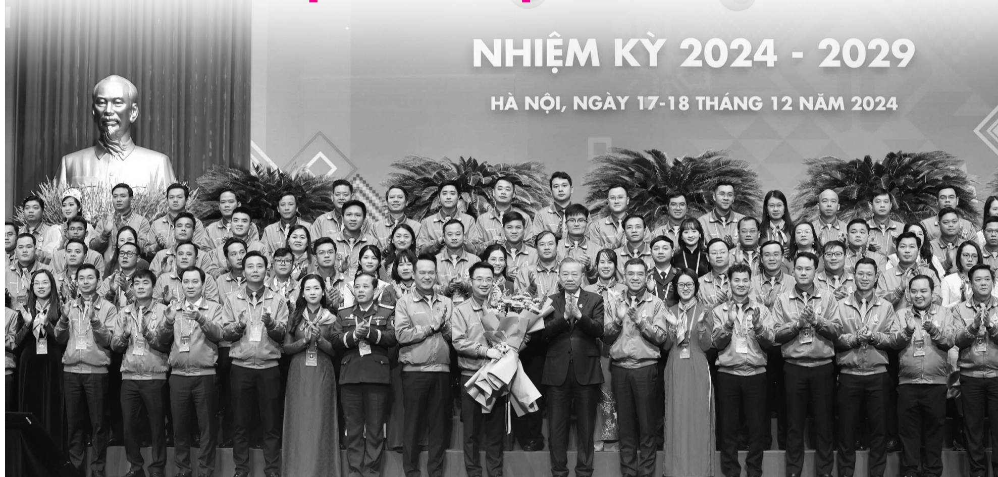
● Tổng Bí thư Tô Lâm tặng hoa chúc mừng Ủy ban Trung ương Hội Liên hiệp Thanh niên Việt Nam khóa IX, nhiệm kỳ 2024 - 2029.