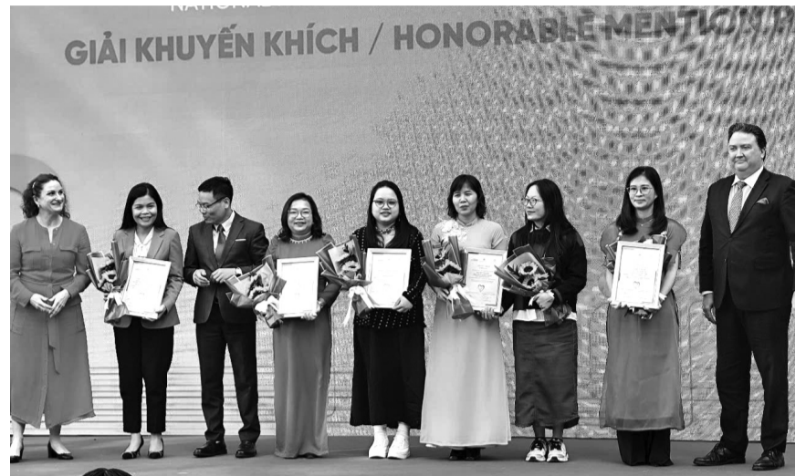
● Ban Tổ chức trao giải Khuyến khích các thể loại báo chí cho tác giả/nhóm tác giả đoạt giải.

Ngày 18/12/2024, tại Hà Nội, Trung ương Hội Liên hiệp Phụ nữ (LHPN) Việt Nam, Cơ quan Liên hợp quốc về Bình đẳng giới và Trao quyền cho Phụ nữ (UN Women) phối hợp với Hội Nhà báo Việt Nam tổ chức Lễ trao giải Báo chí toàn quốc về Bình đẳng giới năm 2024. Giải Báo chí toàn quốc về Bình đẳng giới năm 2024 được tổ chức nhằm hưởng ứng Tháng hành động vì bình đẳng giới và phòng ngừa, ứng phó bạo lực trên cơ sở giới. Sự kiện hướng tới kỷ niệm 30 năm Tuyên bố và Cương lĩnh