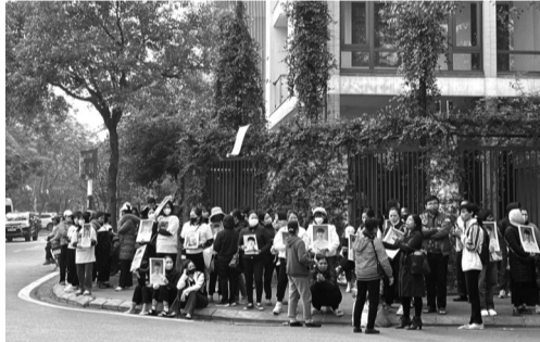
● Nhiều người cầm di ảnh người đã khuất đến theo dõi phiên xử. (Ảnh trong bài: Hồng Mây)