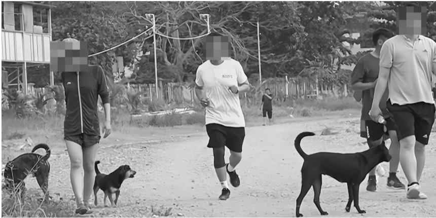
● Thực trạng chó không đeo rọ mõm, thả rông nơi công cộng.

Những vụ việc liên quan tới chó cắn chết người hay mắc bệnh dại do chó, mèo cào dù đã được cảnh báo nhiều lần, song vẫn liên tục xảy ra. Một số ý kiến cho rằng nguyên nhân đến từ mức xử phạt hiện nay chưa đủ sức răn đe, giáo dục, trong khi việc thực thi đôi khi còn mang tính hình thức, thiếu hiệu quả.