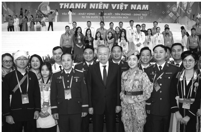
● Tổng Bí thư Tô Lâm với các đại biểu phiên trọng thể Đại hội IX Hội Liên hiệp Thanh niên Việt Nam.

"Lòng yêu nước luôn thường trực trong trái tim mỗi bạn trẻ cần phải được khơi dậy mạnh mẽ; khát vọng về một đất nước Việt Nam giàu mạnh hùng cường từng ngày, từng giờ thôi thúc mỗi bạn thanh niên cần phải được hiện thực hóa bằng mồ hôi và trí tuệ; sức mạnh nền tảng từ tinh thần