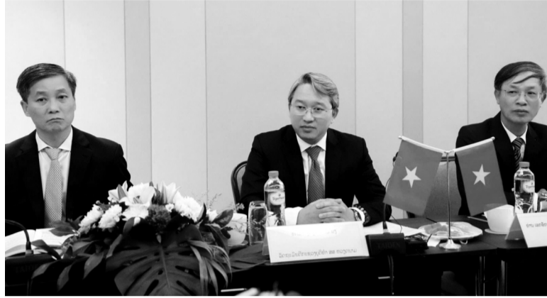
● Bộ trưởng Nguyễn Hải Ninh trao đổi về tình hình hợp tác giữa hai Bộ Tư pháp nói riêng và hợp tác pháp luật và tư pháp Việt Nam - Lào nói chung trên 7 lĩnh vực.