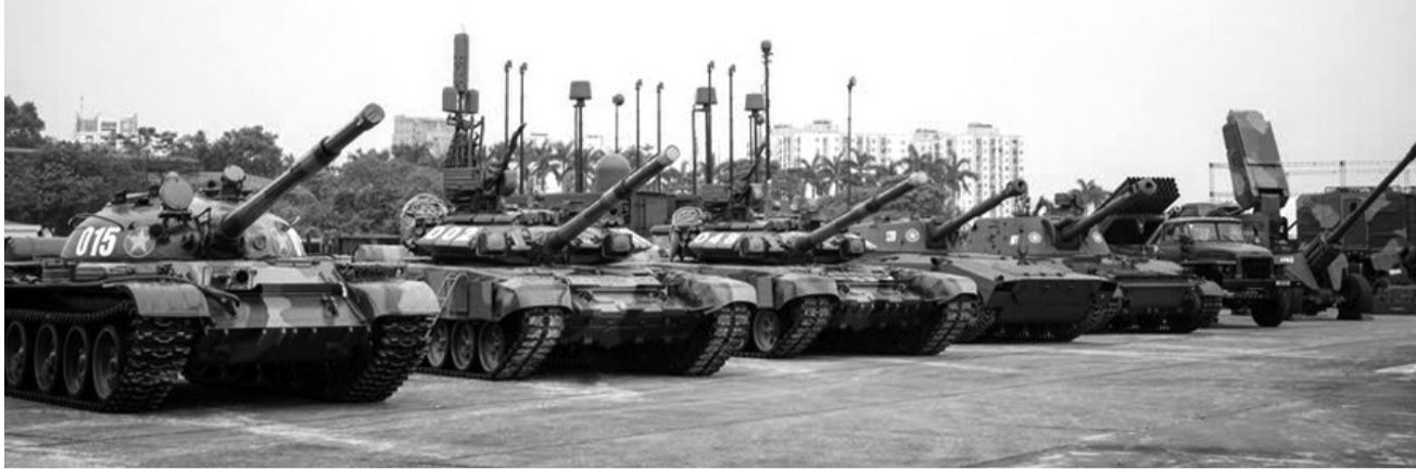
● Một số chủng loại xe tăng tại Triển lãm.

9h sáng nay (19/12), Triển lãm Quốc phòng quốc tế (QPQT) Việt Nam lần thứ hai năm 2024 chính thức khai mạc. Triển lãm được tổ chức nhằm tăng cường, mở rộng quan hệ hợp tác quốc tế, đối ngoại quốc phòng, tạo dựng lòng tin giữa Việt Nam và các nước trên thế giới; chia sẻ chính sách, đường lối đối ngoại quốc phòng; chủ trương xây dựng quân đội và phát triển nền công nghiệp quốc phòng (CNQP) Việt Nam.