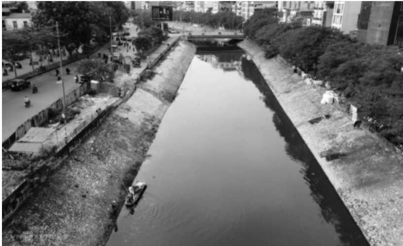
● Một đoạn sông Tô Lịch hiện tại.

Mới đây, lãnh đạo Thành ủy và UBND TP Hà Nội đã có những chỉ đạo kiên quyết trong việc xử lý tận gốc nguồn gây ra ô nhiễm sông Tô Lịch, sớm đưa con sông trở lại trong sạch vào dịp 2/9/2025.