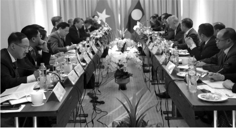
● Toàn cảnh hội đàm. (Ảnh trong bài: PV)