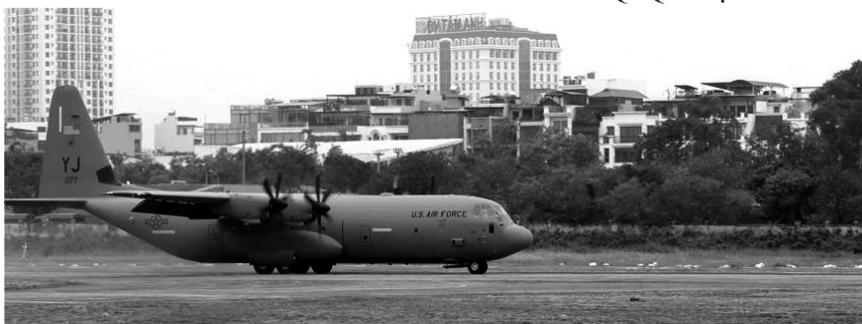
● Máy bay vận tải quân sự hạng trung C-130J Super Hercules của Mỹ.