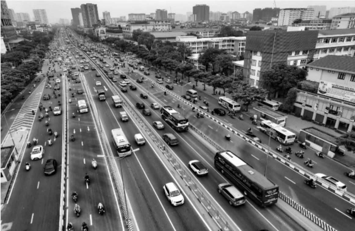
● Vào dịp lễ, Tết, phương tiện từ các tỉnh khác đổ về Hà Nội nhiều.

Tại nút giao Vực Vòng trên cao tốc Pháp Vân - Cầu Giẽ,