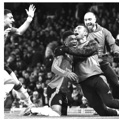
● Bóng đá là môn thể thao rất nhiều người đặt cược và được nhiều quốc gia cho phép.

Ở Việt Nam, Chính phủ đã cho phép kinh doanh đặt cược đua ngựa, đua chó và thi đấu đặt cược bóng đá quốc tế. Điều này được thể hiện rõ trong Nghị định 06/2017/NĐ-CP quy định về việc kinh doanh, quản lý hoạt động kinh doanh và xử phạt vi phạm hành chính trong hoạt động