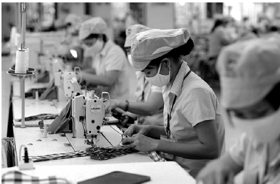
• Dệt may Việt Nam cần cải thiện vị trí trong chuỗi sản xuất toàn cầu.

Trước các xu hướng thuận lợi, cũng như những cơ hội từ các hiệp định thương mại tự do (FTA), năm 2025 toàn ngành dệt may đặt mục tiêu XK khoảng 47 - 48 tỷ USD. Theo ông Trương Văn