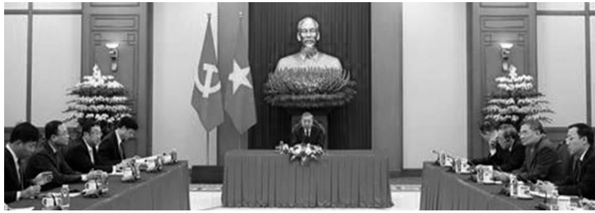
● Tổng Bí thư Tô Lâm điện đàm với Tổng Thư ký Đảng Hành động Nhân dân, Thủ tướng Singapore Lawrence Wong.

Thủ tướng Singapore Lawrence Wong cảm ơn và đánh giá cao cuộc điện đàm với Tổng Bí thư Tô Lâm, nhất trí với những đánh giá và ý kiến của Tổng Bí thư về phương hướng