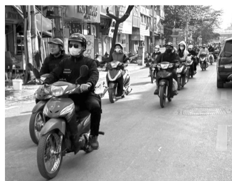
● Yêu cầu kiểm định khí thải xe máy bắt buộc góp phần vào các mục tiêu bảo vệ môi trường, phát triển bền vững quốc gia.

Bộ GTVT cho biết sẽ phối hợp chặt chẽ với Bộ TN&MT trong việc xây dựng và hoàn thiện lộ trình áp dụng kiểm tra khí thải xe máy để trình Thủ tướng Chính phủ