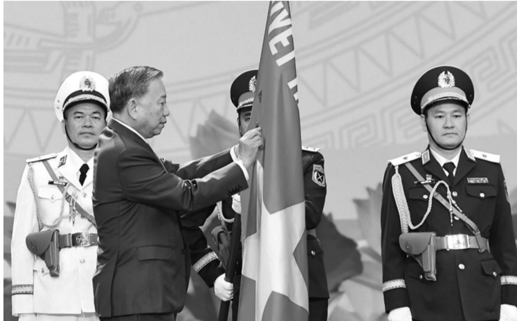
Thay mặt lãnh đạo Đảng, Nhà nước, Tổng Bí thư Tô Lâm trao Huân chương Hồ Chí Minh tặng QĐND Việt Nam.