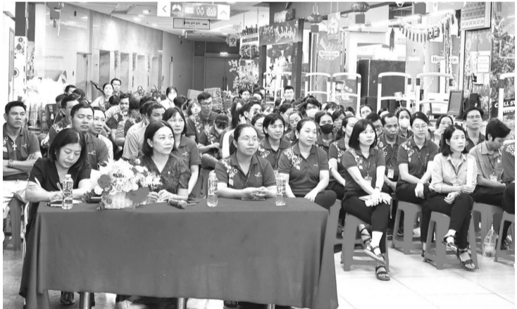
● Người lao động tại Siêu thị Co.op mart Cần Thơ được tuyên truyền chính sách BHXH, BHYT và những điểm mới của Luật BHXH, Luật sửa đổi, bổ sung một số điều của Luật BHYT.