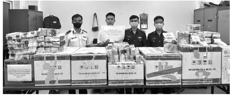
● Tang vật một vụ vận chuyển mua bán trái phép ma túy.

Về công tác đấu tranh với tội phạm ma túy, Cục CSĐTTPMT đã triển khai thực hiện hiệu quả công tác phòng ngừa, đấu tranh với tội phạm ma túy trên các tuyến, địa bàn trọng điểm, trọng tâm là tuyến Tây Bắc, Đông Bắc, Bắc miền Trung - Tây Nguyên và Tây Nam. Chỉ đạo các phòng nghiệp vụ thuộc Cục và Phòng CSĐTTPMT Công an các tỉnh,