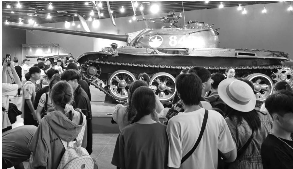
● Khách tham quan chiêm ngưỡng chiếc xe tăng T-54 số hiệu 843.

Bảo tàng Lịch sử Quân sự Việt Nam sở hữu không gian rộng lớn với diện tích hàng chục ngàn mét vuông, chia thành nhiều khu vực trưng bày theo từng giai đoạn lịch sử. Nơi đây lưu giữ hơn 150.000 hiện vật và 4 bảo vật quốc gia cùng nhiều khí tài