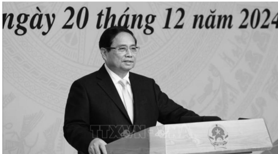
Thủ tướng Phạm Minh Chính chủ trì Hội nghị về tổng kết công tác ngoại giao kinh tế năm 2024 và trọng tâm năm 2025.

Cùng với đó đẩy mạnh đa dạng hóa thị trường, đa dạng hóa đối tác, bên cạnh việc tiếp tục khai thác hiệu quả các thị trường truyền thống, triển khai quyết liệt việc tạo đột phá ở các thị trường mới, tiềm năng như khu vực Mỹ Latinh, Trung Đông - châu Phi, Trung Đông Âu, chúng ta đã thúc đẩy ngoại giao kinh tế với các đối tác quan trọng. Phát huy vai trò chủ động, tham gia tích cực, đóng góp thực chất tại các diễn đàn đa phương quốc tế và khu vực, góp phần nâng cao uy tín và vị thế của đất nước, thu hút nguồn lực phục vụ phát triển.