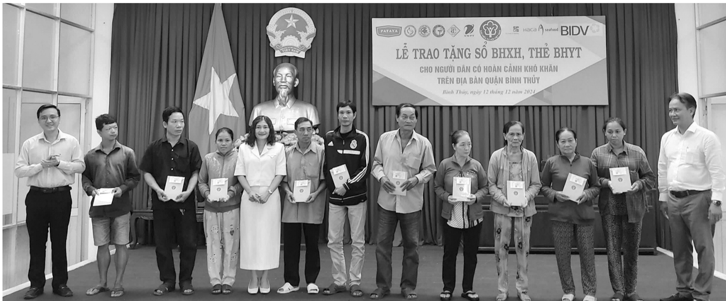
● Bảo hiểm xã hội TP Cần Thơ tổ chức Lễ trao tặng sổ bảo hiểm xã hội, thẻ bảo hiểm y tế cho người có hoàn cảnh khó khăn trên địa bàn quận Bình Thủy.

Qua trao đổi, các doanh nghiệp chia sẻ rằng việc đảm bảo quyền lợi về BHXH, BHYT cho người lao động không chỉ là trách nhiệm pháp lý mà còn là yếu tố quan trọng để duy trì môi trường làm việc tích cực. Một đơn vị quan tâm đến phúc lợi của nhân viên sẽ thu hút nhân tài, hạn chế tình trạng nghỉ việc và tăng cường sự cạnh tranh trên thị trường lao động. Những doanh nghiệp làm tốt công tác này không chỉ đạt được sự tin tưởng của người lao động mà còn góp phần xây dựng văn hóa doanh nghiệp bền vững, lành mạnh.