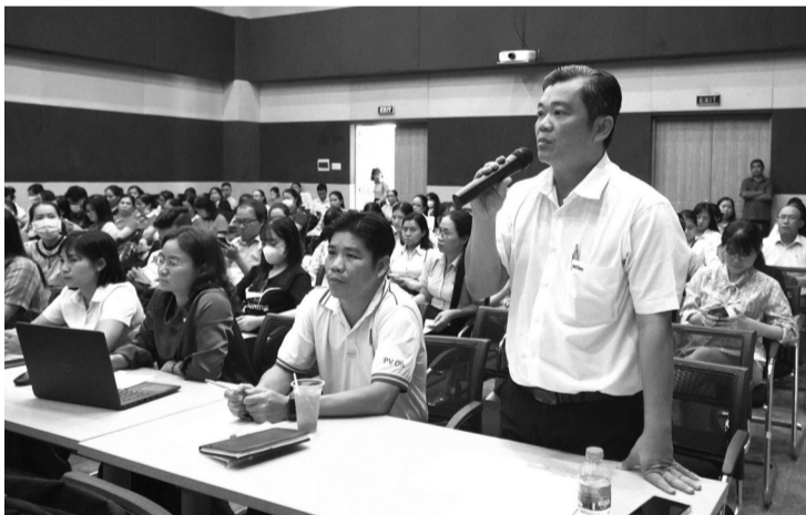
● Đại diện người lao động đặt câu hỏi tại Hội nghị đối thoại, tư vấn, hỗ trợ, giải đáp chính sách BHXH, BHYT, BHTN.