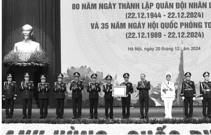
Lãnh đạo BQP đón nhận Huân chương Hồ Chí Minh.

Sáng qua (20/12), Ban Chấp hành Trung ương Đảng Cộng sản Việt Nam, Quốc hội, Chủ tịch nước, Chính phủ, Ủy ban Trung ương Mặt trận Tổ quốc Việt Nam và Quân ủy Trung ương (QUTƯ), Bộ Quốc phòng (BQP) trọng thể tổ chức Lễ kỷ niệm 80 năm Ngày thành lập Quân đội nhân dân (QĐND) Việt Nam (22/12/1944 - 22/12/2024) và 35 năm Ngày hội Quốc phòng toàn dân (22/12/1989 - 22/12/2024).