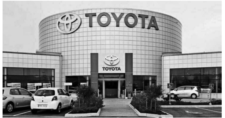
● Trụ sở Tập đoàn Toyota.

Hiện Nhật Bản phân chia keiretsu thành keiretsu ngang và keiretsu dọc. Keiretsu ngang là một liên minh của các công ty cổ phần chéo do một ngân hàng