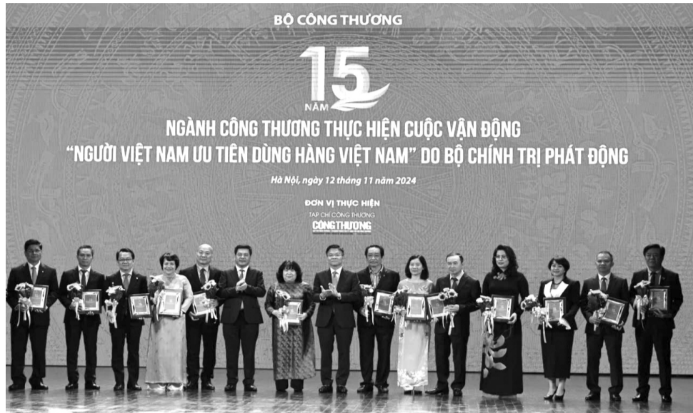
● Cuộc vận động “Người Việt Nam ưu tiên dùng hàng Việt Nam” là một trong những sự kiện khẳng định tinh thần yêu nước và ý thức dân tộc của các doanh nghiệp, doanh nhân và người tiêu dùng. (Trong ảnh: Phó Thủ tướng Lê Thành Long trao Kỷ niệm chương cho các đơn vị, doanh nghiệp tham gia Cuộc vận động.

Phải có tầm nhìn dài hạn và có chiến lược kinh doanh rõ ràng để thực hiện mục tiêu “Go Global”. Cùng với đó, DN phải