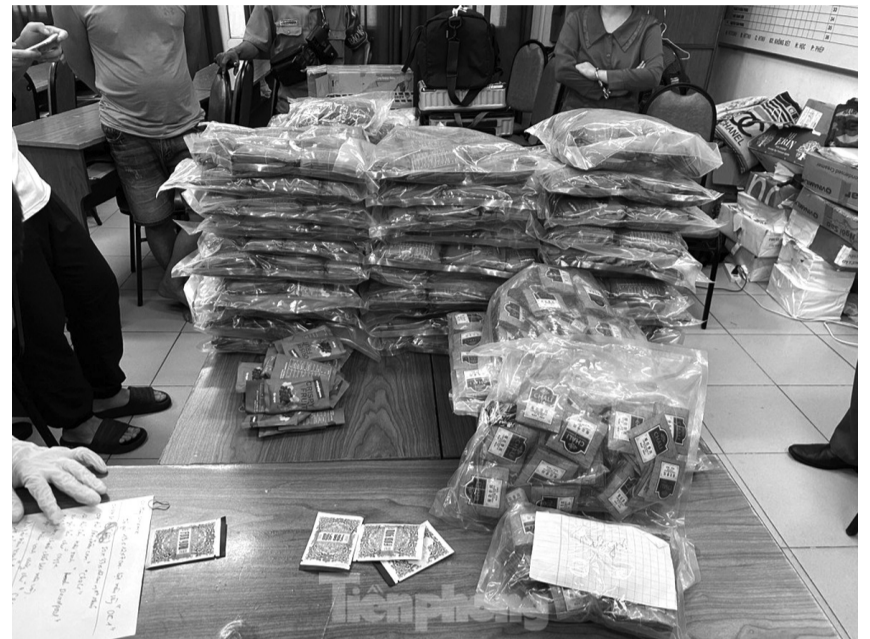
● Một phần tang vật vụ án.

Hai năm sau, bị can Hoài biết Zin đóng gói ma túy gọi là "nước vui". Zin cho bị can Hoài làm nhiệm vụ cộng sổ sách việc đóng gói, vận chuyển ma túy của Zin tại kho ở Campuchia và trả công 50 triệu đồng/tháng.