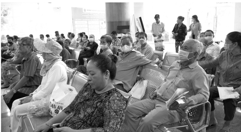
● Năm 2024, có 22.944 lượt dữ liệu giấy chuyển tuyến và 328.524 lượt dữ liệu giấy hẹn khám lại được liên thông, góp phần đơn giản hóa thủ tục hành chính, tạo thuận lợi cho người dân khi khám, chữa bệnh BHYT.

BHXH TP Cần Thơ còn phối hợp mạnh mẽ việc khám, chữa bệnh bằng CCCD gắn chip, liên thông dữ liệu khám sức khỏe lái xe, giấy chứng sinh, giấy báo tử qua hạ tầng của BHXH Việt Nam triển khai Sổ sức khỏe điện tử, tạo điều kiện thuận lợi cho hơn 120 cơ sở y tế trên địa bàn. Điều này không chỉ giảm thời gian chờ đợi mà còn tối ưu hóa quy trình tiếp nhận và xử lý thông tin bệnh nhân, góp phần chuyển đổi số trong công tác khám, chữa bệnh BHYT. Đặc biệt, việc liên thông dữ liệu khám, chữa bệnh và BHYT qua CCCD gắn chip đã nâng cao sự kết nối giữa các hệ thống quản lý, mang lại lợi ích lớn cho cả người dân và cơ sở y tế. Đồng thời, có 62.662 giấy khám sức khỏe lái xe, 119 giấy báo tử và 21.297 giấy chứng sinh được các cơ sở khám, chữa bệnh ký số đưa lên Cổng tiếp nhận khám, chữa bệnh BHYT và dữ liệu Sổ sức khỏe điện tử đã liên thông là 1.969.960 lượt. Việc phối hợp còn là minh chứng rõ nét