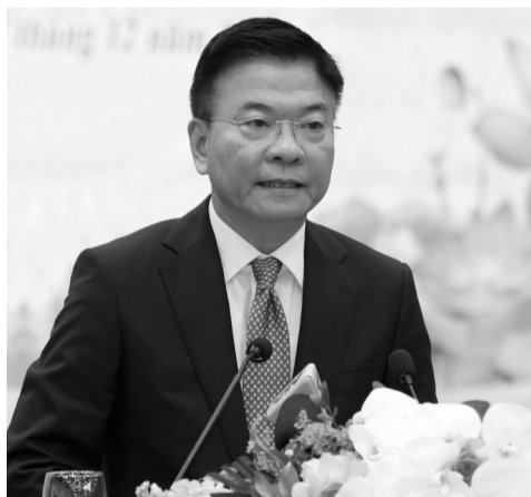
● Phó Thủ tướng Lê Thành Long phát biểu chỉ đạo tại Hội nghị.

Phát biểu tại Hội nghị, Phó Thủ tướng Chính phủ Lê Thành Long nhận định, Hội nghị năm nay của ngành LĐ-TB&XH mang rất nhiều cung bậc cảm xúc. Qua phóng sự khái quát về sự phát triển của ngành suốt 80 năm, mọi hoạt động của ngành đều gắn với những truyền thống văn hóa hết sức tốt đẹp của dân tộc, đó là tình trong thân, tương ái, nghĩa tình, nhân văn. Ngành LĐ-TB&XH cũng gắn bó chặt chẽ