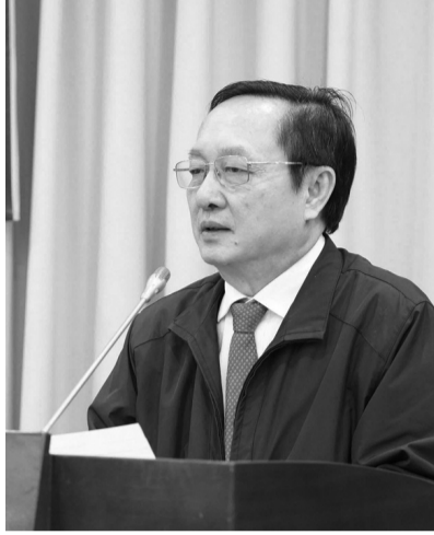
●Bộ trưởng Bộ KH&CN Huỳnh Thành Đạt, Trưởng ban soạn thảo Dự án Luật KH, CN, ĐMST

Vừa qua, tại Hà Nội, Bộ Khoa học và Công nghệ (KH&CN) đã chủ trì phiên họp Ban soạn thảo, Tổ biên tập về Luật Khoa học, Công nghệ và Đổi mới sáng tạo (KH&CN&ĐMST). Việc xây dựng Luật cần bám sát, thể chế hóa kịp thời các chủ trương, đường lối của Đảng, chính sách, pháp luật của Nhà nước với các quy định mạnh mẽ phù hợp với thực tiễn của Việt Nam và tiến gần tới thông lệ quốc tế.