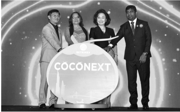
● Nghị thức khai mạc Hội thảo.