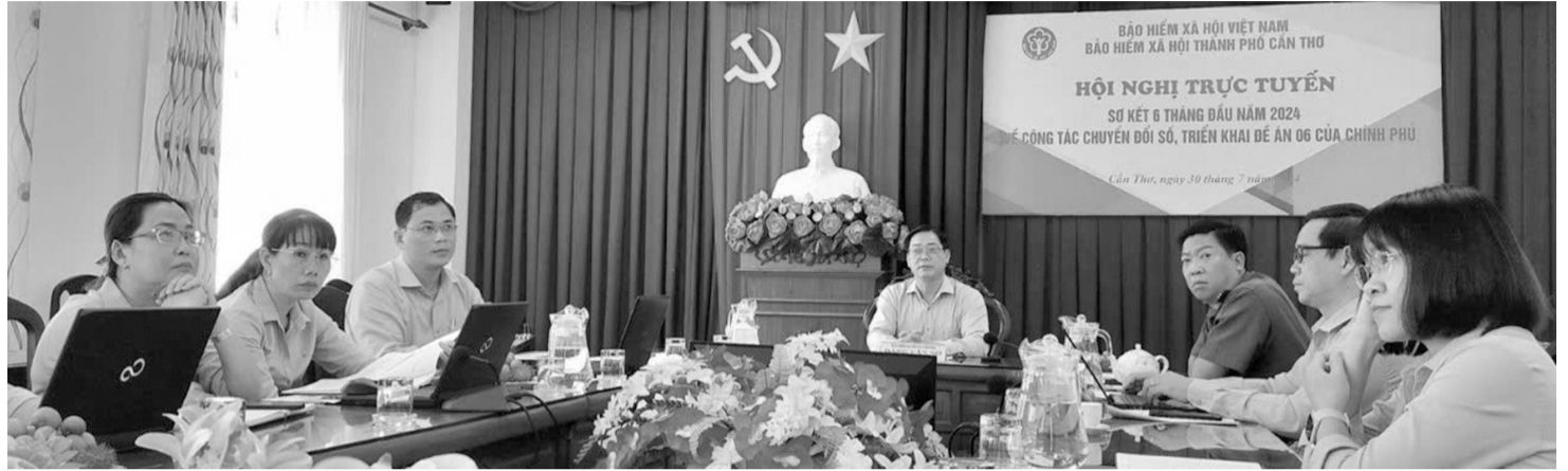
● BHXH TP Cần Thơ họp trực tuyến về công tác chuyển đổi số, triển khai Đề án 06 của Chính phủ.