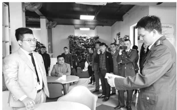
● Công an đọc lệnh khám xét Cty Triệu Nữ Cười.