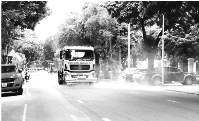
Thời gian qua, URENCO đã tăng tần suất rửa đường giảm bụi mịn.

Để giảm ô nhiễm bụi mịn, thời gian gần đây, URENCO đã tăng cường rửa đường. Trước mắt, Cty này đề nghị UBND TP, Sở TN&MT, UBND các quận Ba Đình, Đống Đa, Hai Bà Trưng, Nam Từ Liêm, UBND huyện Thanh Oai, Mỹ Đức xem xét, phê duyệt bổ sung tăng cường khối lượng, tần suất các tuyến duy trì tưới nước rửa đường vào các hợp đồng duy trì vệ sinh môi