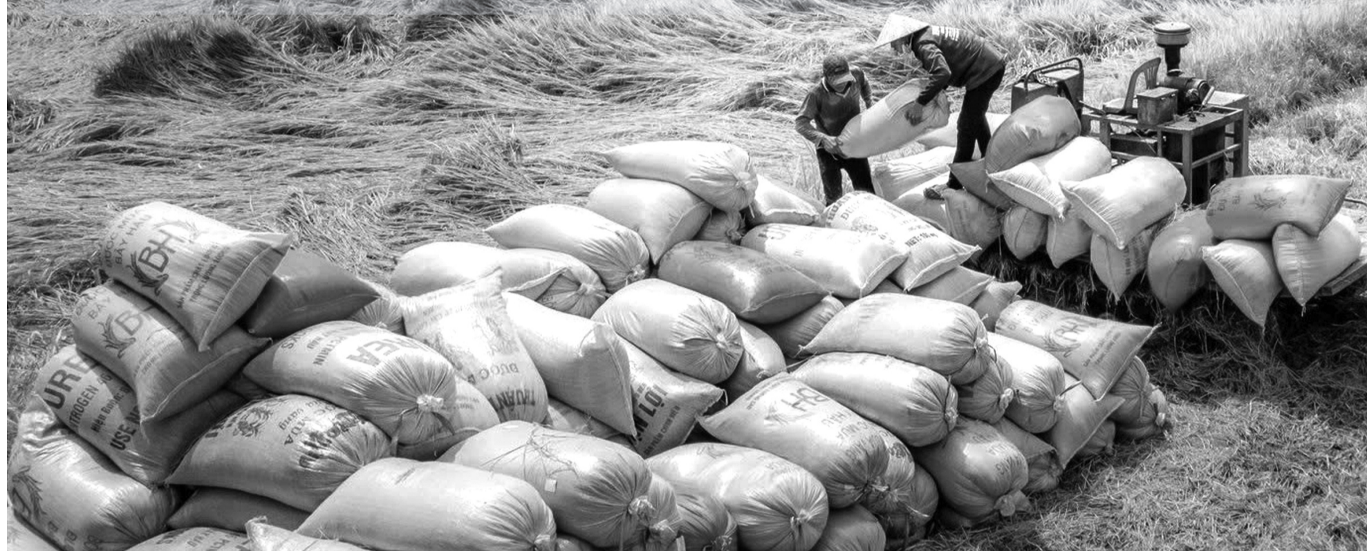
● Năm 2024, dù phải đối mặt với nhiều khó khăn, thử thách do biến động thị trường, biến đổi khí hậu, thiên tai, dịch bệnh nhưng ngành Nông nghiệp đã đạt và vượt các chỉ tiêu Thủ tướng Chính phủ giao từ đầu năm. (Ảnh minh họa: Hiền Thanh)