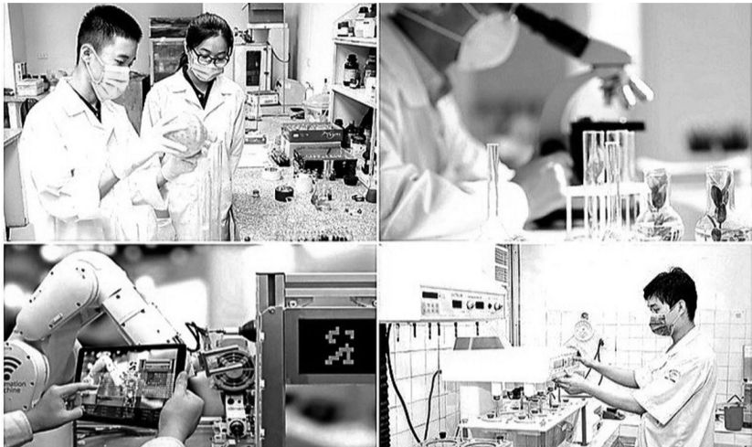
●Đưa Khoa học, Công nghệ và Đổi mới sáng tạo thực sự trở thành động lực để hoàn thành công nghiệp hóa, hiện đại hóa đất nước. (Ảnh: MOST)