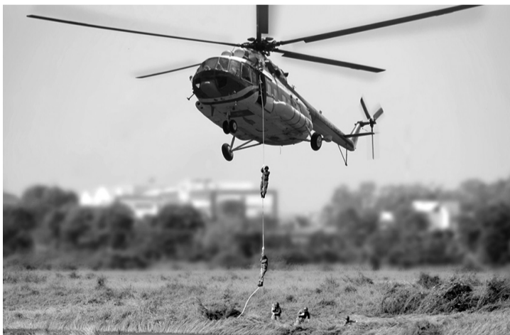
● Máy bay Binh đoàn 18 tham gia diễn tập đổ bộ đường không.

Binh đoàn tiếp tục làm tốt công tác quán triệt, giáo dục để cán bộ, chiến sĩ, công nhân viên, người lao động nhận thức rõ yêu cầu nhiệm vụ, nỗ lực vượt qua khó khăn, thử thách, vươn lên hoàn thành tốt mọi nhiệm vụ được giao. LAM HẠNH