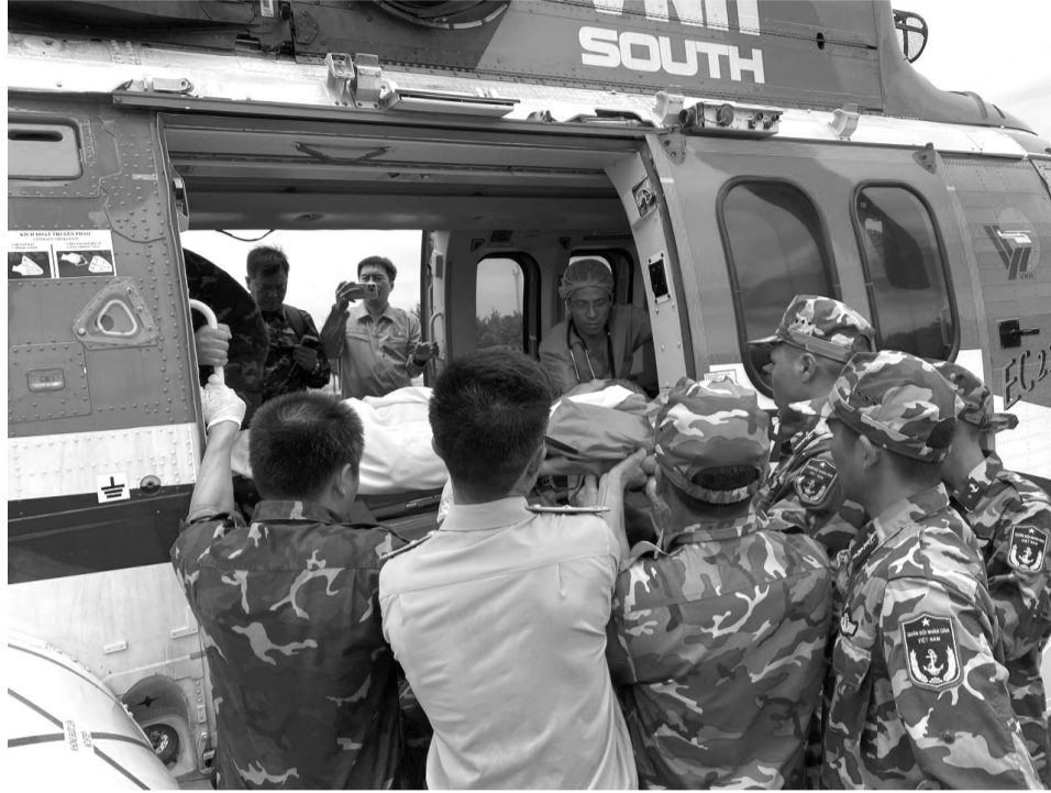
● Bệnh nhân ở Trường Sa được trực thăng của Binh đoàn 18 vận chuyển về đất liền điều trị.

TCty Trực thăng Việt Nam hiện có trong biên chế hàng chục máy bay trực