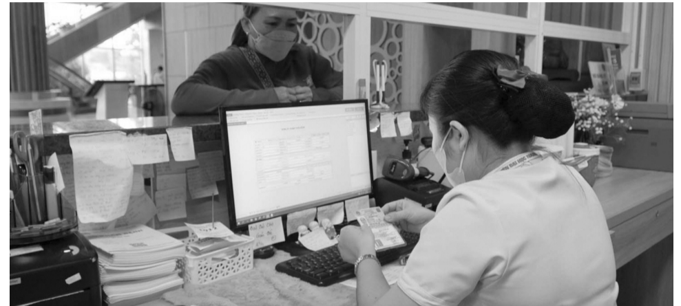
● Người dân khám, chữa bệnh BHYT bằng CCCD gắn chip tại Bệnh viện Đại học Nam Cần Thơ.

trong việc hướng tới nền hành chính hiện đại, Chính phủ số, tạo điều kiện tối đa cho người có thẻ BHYT về các thủ tục khám, chữa bệnh BHYT, không phát sinh bất kỳ thủ tục giấy tờ, thời gian thực hiện thủ tục khám, chữa bệnh được tiết giảm tối đa.