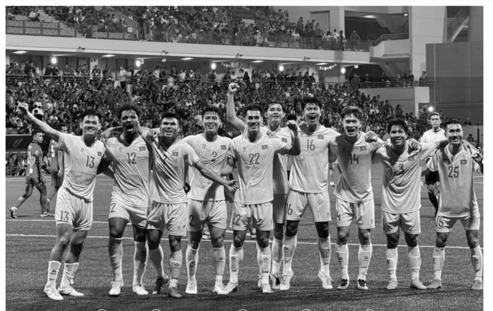
● Đội tuyển Việt Nam đang rộng cửa vào chơi trận chung kết AFF Cup 2024.

Đức, Hai Long và cả Ngọc Tân đang là những cái tên nổi trội. Ở đây, Hoàng Đức vẫn chưa ghi bàn, nhưng là người "chia bài" và kiến tạo rất tốt cho các đồng đội. Trong lúc Quang Hải, Hai Long và Ngọc Tân đều có cho mình những bàn thắng quan trọng, đặc biệt là Quang Hải.