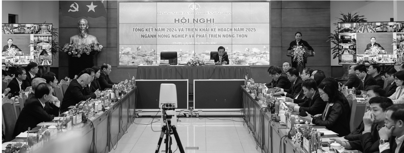
● Thủ tướng yêu cầu phấn đấu tốc độ tăng trưởng GDP toàn ngành Nông nghiệp và Phát triển nông thôn 3,5 - 4%.