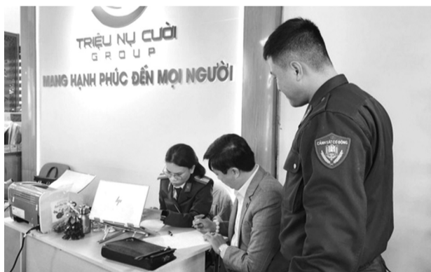
● Công an cho biết, sự việc có dấu hiệu lừa đảo chiếm đoạt tài sản thông qua bán đồng QFS.

đồng QFS. Nếu vì bất kỳ lý do nào, cá nhân, DN không muốn tiếp tục tham gia cùng thì sẽ được trả lại tiền và được hưởng lãi suất.