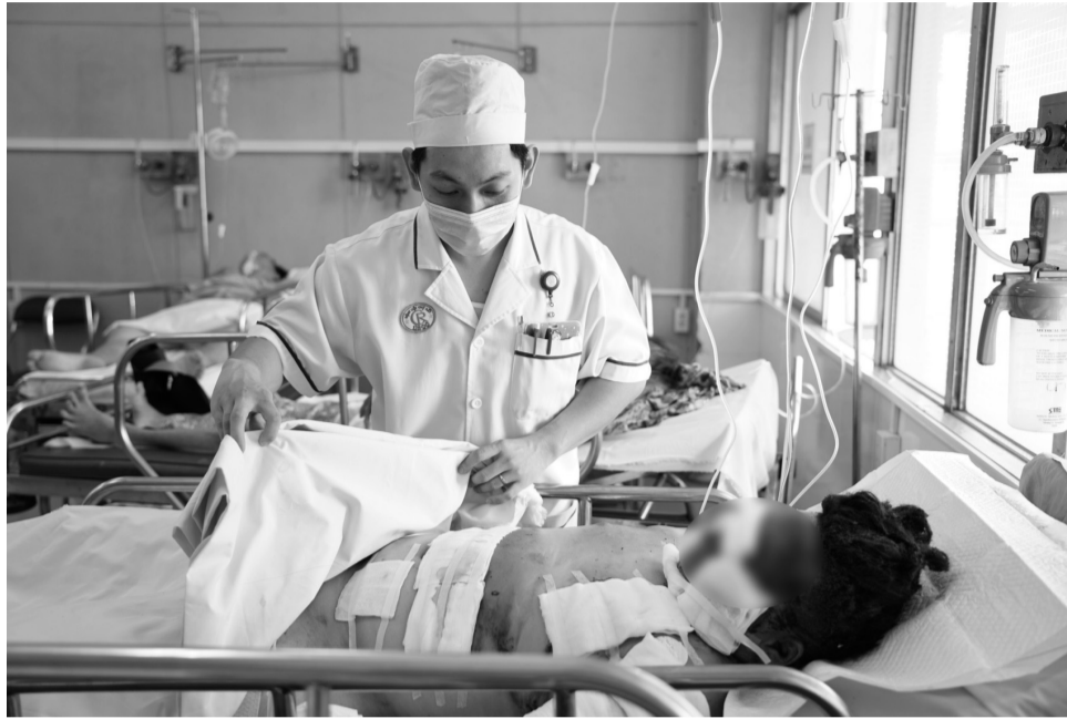
● Học sinh bị tổn thương thể chất nghiêm trọng do pháo tự chế.

Trên đây là hai trong số nhiều vụ tai nạn thương tâm liên quan đến pháo nổ tự chế, xảy ra ở đối tượng học sinh và thanh, thiếu niên trong thời gian qua. Có thể thấy, pháo tự chế gây ra những tổn thương nghiêm trọng về thể chất, tinh