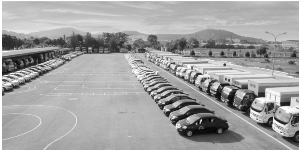
● Trung tâm đào tạo lái xe ô tô phải có cơ sở vật chất diện tích tối thiểu 1.000m 2 .

Đối với hệ thống phòng học chuyên môn, Nghị định 160/2024/NĐ-CP quy định cụ thể như sau: Phòng sử dụng học lý thuyết có các trang thiết bị làm công cụ hỗ