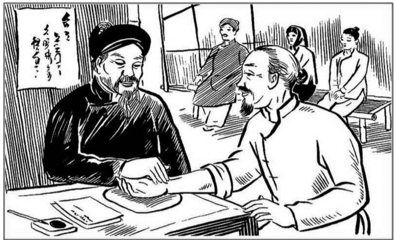
● Ảnh minh họa.