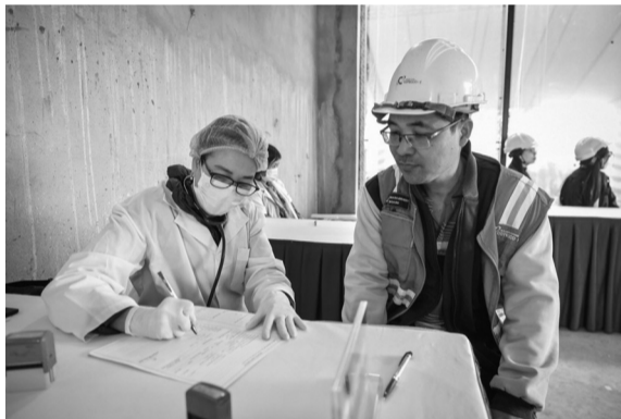
● Các công nhân được khám bệnh miễn phí.