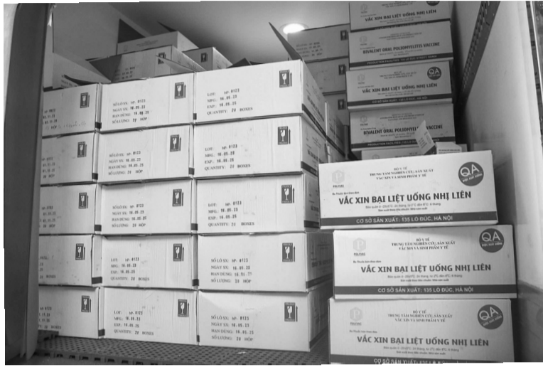
● Bộ Y tế đẩy mạnh các hoạt động đảm bảo nguồn cung vaccine trong Chương trình TCMR. (Ảnh minh họa - Nguồn: CTTTCMR)

Được đánh giá là một trong những chương trình về chăm sóc và bảo vệ sức khỏe cộng đồng thành công nhất hiện nay ở Việt Nam, Chương trình tiêm chủng mở rộng (TCMR) đã góp phần quan trọng trong việc bảo vệ, nâng cao sức khỏe trẻ em cũng như người dân trên cả nước. Thành quả này có được nhờ vào sự nỗ lực không ngừng của ngành Y tế, đặc biệt trong việc thực hiện các giải pháp đảm bảo nguồn cung vaccine ổn định cho người dân, ngay cả trong bối cảnh khan hiếm vaccine.