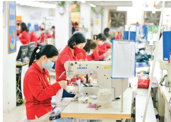
● Người lao động là nguồn tài nguyên quý của Tập đoàn Dệt may Việt Nam.