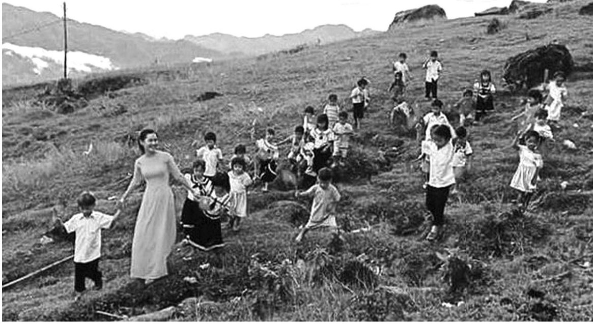
● Cô giáo xuất hiện trong bức ảnh đẹp nhất mùa khai giảng.