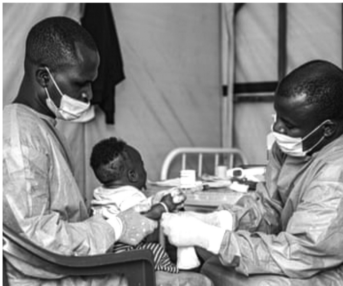
● Hàng loạt quốc gia, vùng lãnh thổ cảnh báo về bệnh X, một căn bệnh bí ẩn bùng phát tại Congo với tỷ lệ tử vong cao.