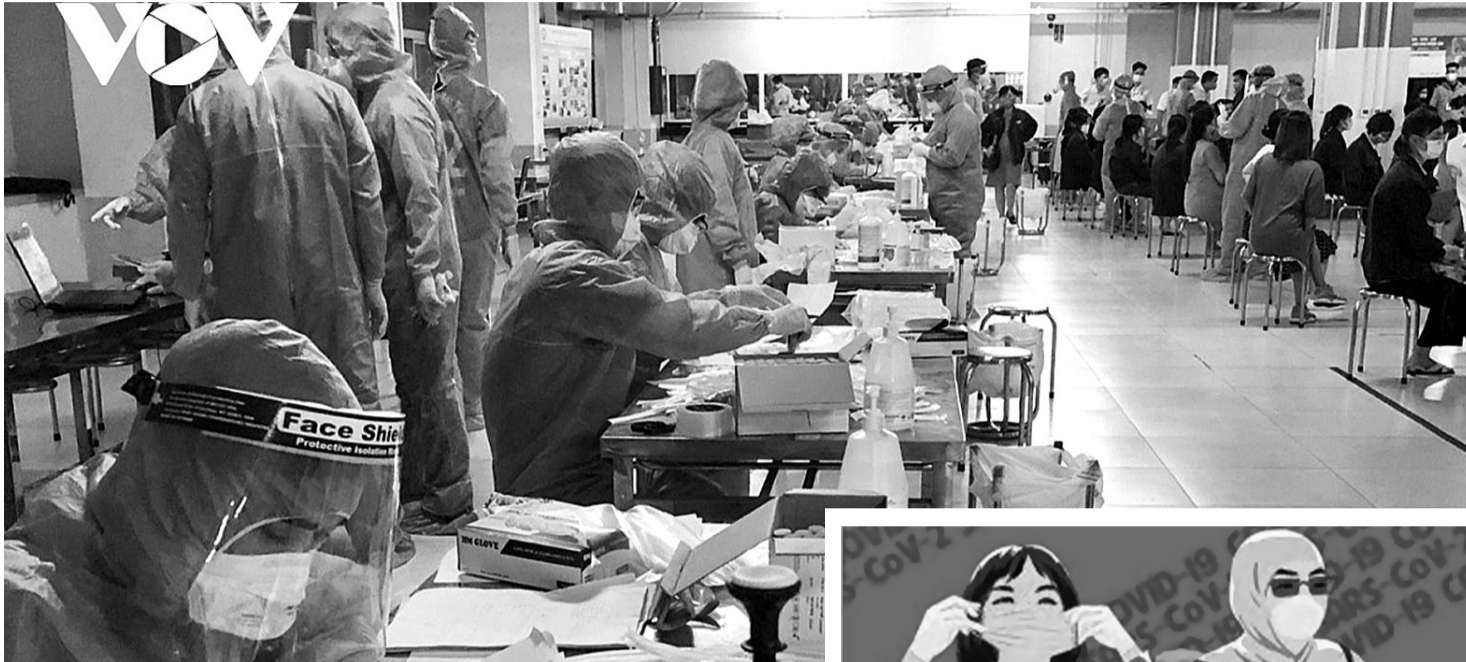
● Cán hoàn thiện thể chế, cơ chế, chính sách để tháo gỡ khó khăn, vướng mắc trong công tác phòng, chống dịch bệnh.

Cách đây hơn 4 năm, ngày 7/2/2020 đã đánh dấu cột mốc đáng nhớ về ngoại giao đa phương của Việt Nam, khi Đại hội đồng Liên hiệp quốc (LHQ) thông qua Nghị quyết A/RES/75/27 thành lập “Ngày Quốc tế phòng, chống dịch bệnh” vào ngày 27/12 do Việt Nam chủ trì đề xuất.