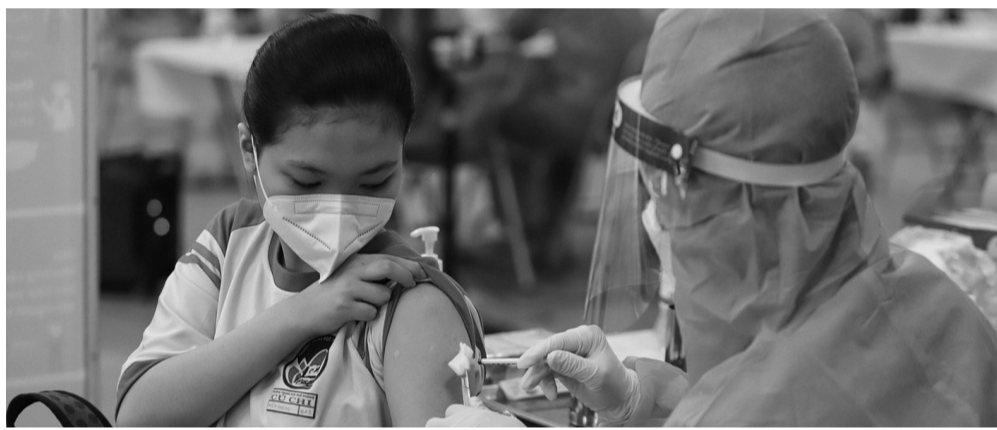
● Ngược lại, có những phụ huynh e ngại việc cho con tiêm vaccine. (Ảnh minh họa)