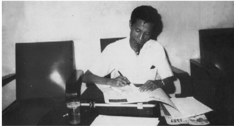
● Nhạc sĩ Y Vân có nhiều bài hát lay động hàng triệu trái tim của khán giả.

Phải nói rằng nhạc sĩ Y Vân có tâm hồn nhạy cảm, bay bổng, tràn ngập tình yêu thương. Nhạc sĩ Y Vũ (em trai của nhạc sĩ Y Vân) đã từng có đôi lời nhận xét về anh trai