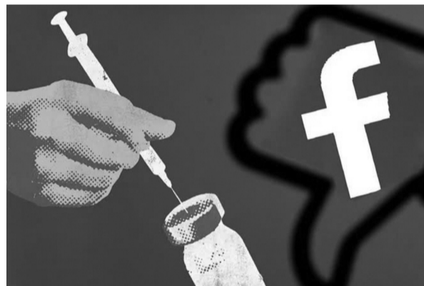
●Thông tin sai lệch về vaccine thường xuất hiện trên mạng xã hội. (Ảnh minh họa - Nguồn: ST)

Quả thật, trong bối cảnh tình hình bệnh truyền nhiễm vẫn diễn biến phức tạp, nhiều bệnh đã có xu hướng gia tăng số ca mắc tại nhiều quốc gia, việc tiêm chủng đầy đủ không chỉ giúp bảo vệ sức khỏe cá nhân mà còn góp phần tạo ra miễn dịch cộng đồng, ngăn chặn sự lây lan của dịch bệnh. Vì vậy, nâng cao nhận thức về vai trò thiết yếu của tiêm chủng và đẩy lùi thông tin sai lệch là nhiệm vụ cấp bách để giảm thiểu các nguy cơ bùng phát dịch bệnh trong tương lai. TUỆ ANH