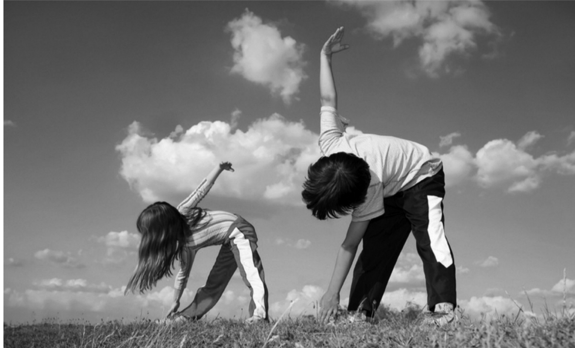
● Sống lành mạnh, khoa học chính là cách để nâng cao khả năng “tự chữa lành” của cơ thể.

Nói đến “cơ chế tự chữa lành” của cơ thể không phải là những luận điểm phản khoa học, trào lưu “thuận tự nhiên” cực đoan đang lan truyền như từ chối can thiệp y tế, thuốc men, vaccine để tự khỏi bệnh. Đây là nguyên lý kì diệu của cơ thể trong quá trình thích ứng với tự nhiên và những liệu pháp khoa học, tôn trọng tự nhiên, không lạm dụng thuốc để cơ thể có điều kiện phát huy hết vai trò “tự chữa lành” của mình.