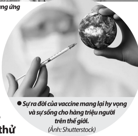
Sự ra đời của vaccine mang lại hy vọng và sự sống cho hàng triệu người trên thế giới.

Sau khi vaccine được phê duyệt, một câu chuyện khác bắt đầu: làm thế nào để đưa vaccine đến với hàng tỷ người trên khắp thế giới? Theo báo cáo của WHO, đây là một thách thức chưa từng có, không chỉ vì số lượng vaccine khổng lồ cần được sản xuất mà còn vì yêu cầu đặc biệt trong bảo quản và phân phối. Một sai sót nhỏ trong khâu sản xuất có thể ảnh hưởng đến hiệu quả hoặc gây hậu quả nghiêm trọng cho sức khỏe cộng đồng.