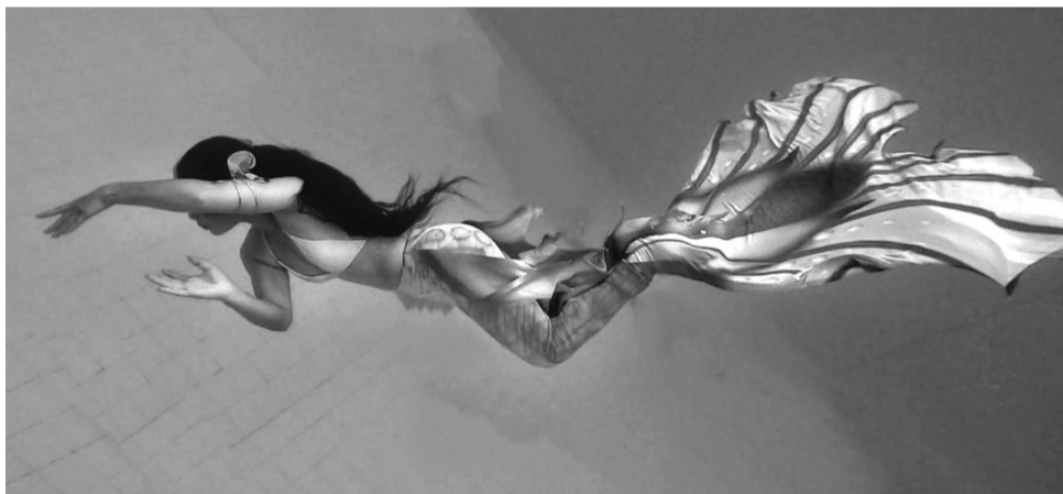
● Trở thành một “nàng tiên cá” giúp cuộc sống của chị Vương Thùy Linh vui khỏe, tràn đầy năng lượng tích cực.

Để thực hiện được những màn bơi lặn đẹp mắt, các “nàng tiên cá” đã phải luyện tập vô cùng chăm chỉ. Cô giáo Linh Lâm cho biết: “Để thực hiện bộ môn lặn tiên cá, người học vừa phải rèn luyện thể lực, độ linh hoạt của các cơ, ý chí và lòng kiên trì. Việc thực hiện đúng kỹ thuật khi học bộ môn lặn tiên cá rất quan trọng”. Lấy ví dụ, uốn sóng thân phải bằng cơ bụng, lưng trên làm giãn cơ lưng, đồng thời giúp săn chắc cơ thể, hạn chế chấn thương.