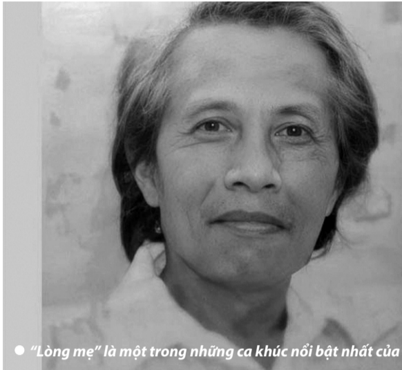
● “Lòng mẹ” là một trong những ca khúc nổi bật nhất của nhạc sĩ Y Vân.