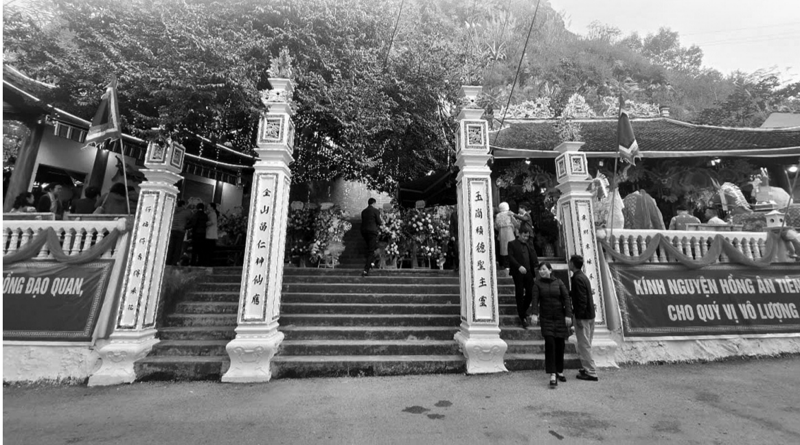
● Di tích văn hóa đền Châu Đệ Tứ (đền Cây Thị) đã được công nhận di tích văn hóa cấp tỉnh từ năm 1992.