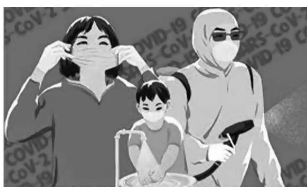
CHUNG SỨC ĐỒNG LÒNG CHỐNG DỊCH COVID - 19

● Việt Nam phòng, chống dịch Covid-19 hiệu quả vì cả nước đồng lòng, chung sức và đặt sức khỏe, tính mạng của nhân dân lên trên hết.