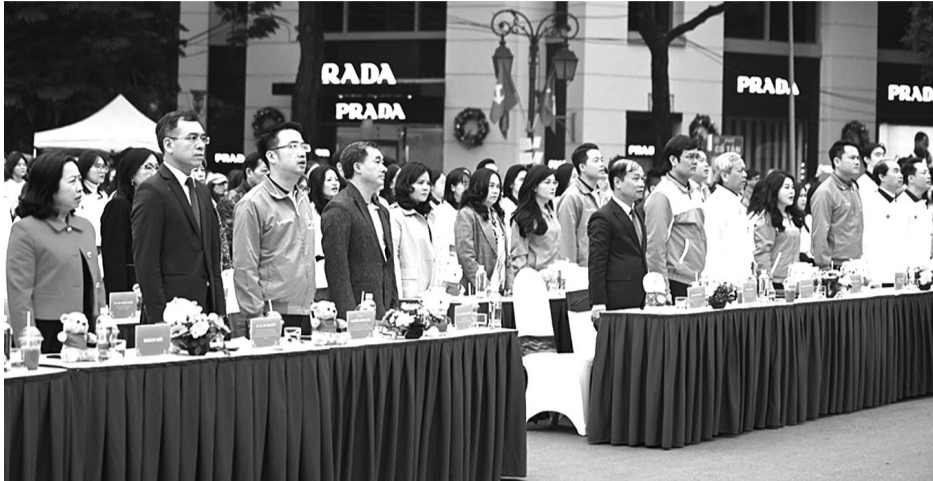
● Các đại biểu tham dự lễ mít tinh.