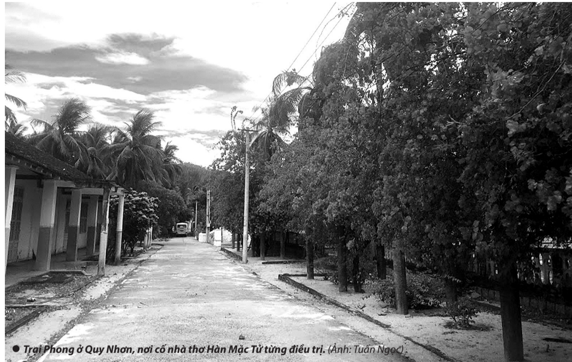
● Trại Phong ở Quy Nhơn, nơi cố nhà thơ Hàn Mặc Tử từng điều trị.

Trong cuốn “Một chiến dịch ở Bắc Kỳ” của bác sĩ Hocquard do NXB Hà Nội ấn hành đã ghi nhận về hoạt động thầy thuốc ở nước ta, ông cho biết: “Các thầy thuốc An Nam có cuốn sách hướng dẫn hành nghề của Trung Hoa: trước hết là cuốn “Y học” trình bày những dấu hiệu bệnh lý và những khác biệt về khí chất,