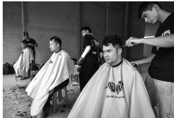
● Các công nhân được cắt tóc miễn phí.

Tết cổ truyền đang đến gần, nhiều chương trình: “Xây Tết”, “Tắm vé nghĩa tình - Xuân đoàn viên”, “Chuyến tàu mùa xuân”, “Tết sum vầy - Xuân gắn kết”, “Ngày hội công nhân - Chợ Tết công đoàn”... đã góp phần gieo niềm vui, ấm áp một mùa Tết Nguyên đán đủ đầy cho những người công nhân, lao động khắp các tỉnh, thành.