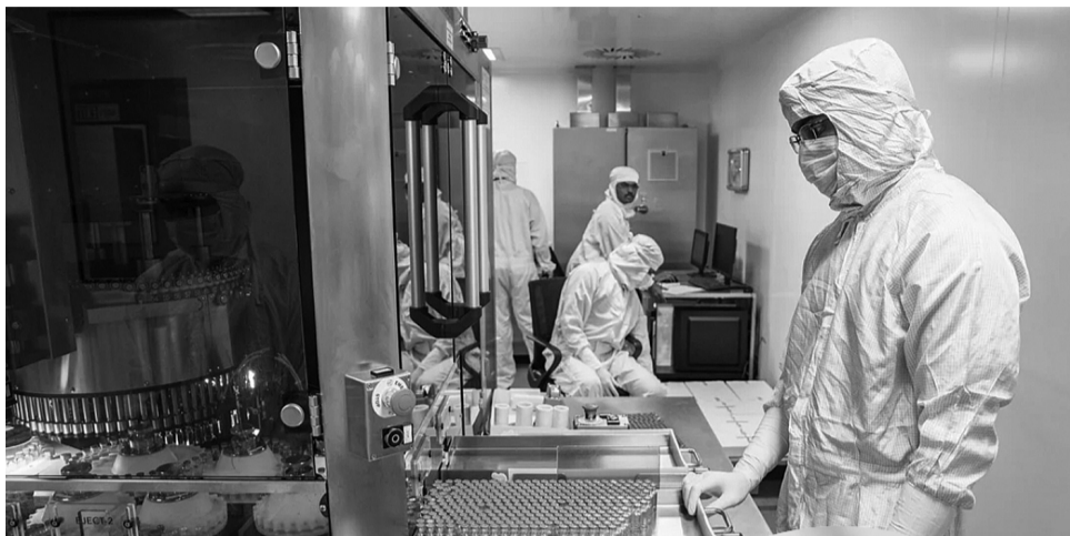
Ấn Độ đã trở thành trung tâm quan trọng trong chuỗi cung ứng vaccine toàn cầu. (Ảnh: Viện Huyết thanh Ấn Độ - npr.org)

Từ đại dịch cúm Tây Ban Nha năm 1918 đến đại dịch Covid-19, sự ra đời của vaccine là một trong những thành tựu vĩ đại nhất của y học, mang lại hy vọng và sự sống cho hàng triệu người trên thế giới. Dù vậy, ít ai hiểu rõ câu chuyện đằng sau mỗi liều vaccine là những năm tháng nghiên cứu, thử nghiệm và sản xuất miệt mài. Đó là một quá trình dài hơi, đòi hỏi không chỉ sự chính xác khoa học mà còn cả những cam kết về an toàn, đạo đức và hợp tác quốc tế.