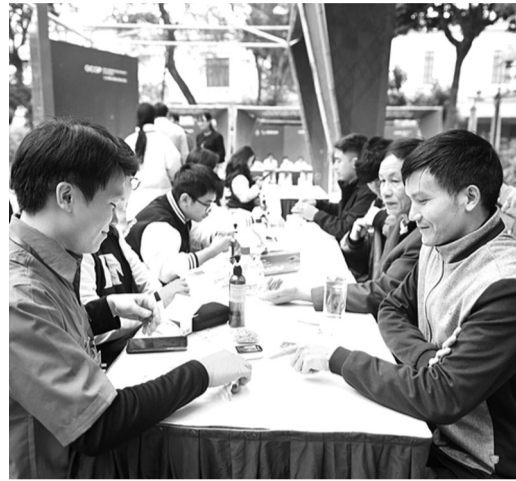
● Chương trình khám sức khỏe miễn phí tại lễ mít tinh.

Chương trình “Tiếp cận y tế toàn diện” là sáng kiến không chỉ thể hiện khát vọng nâng cao chất lượng chăm sóc sức khỏe mà còn khẳng định vai trò trung tâm của thế hệ trẻ. Đặc biệt là các thầy thuốc trẻ, trong sự nghiệp phát triển bền vững của ngành Y tế Việt Nam.