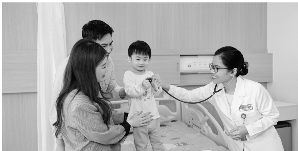
● Mỗi năm, có khoảng 2,5 triệu trẻ em không bị tử vong do các bệnh truyền nhiễm nhờ có vaccine.