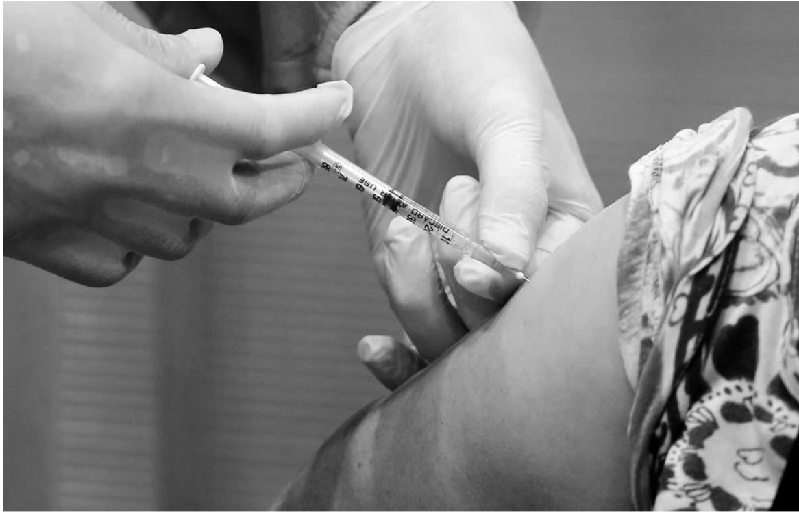
●Tiêm vaccine đầy đủ được xem là biện pháp hiệu quả nhất để bảo vệ sức khỏe cá nhân và cộng đồng.

Trong bối cảnh các bệnh truyền nhiễm như sốt xuất huyết, sởi, bạch hầu và ho gà đang gia tăng, tiêm chủng đầy đủ được xem là biện pháp hiệu quả nhất để bảo vệ sức khỏe cá nhân và cộng đồng. Tuy nhiên, những thông tin sai lệch về vaccine đã gây ra không ít lo ngại, khiến công tác tiêm chủng, nâng cao sức đề kháng cho người dân gặp nhiều khó khăn.