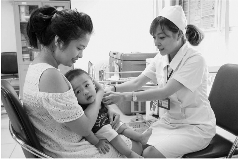
● Chương trình TCMR làm thay đổi về cơ bản cơ cấu bệnh tật ở trẻ em Việt Nam.