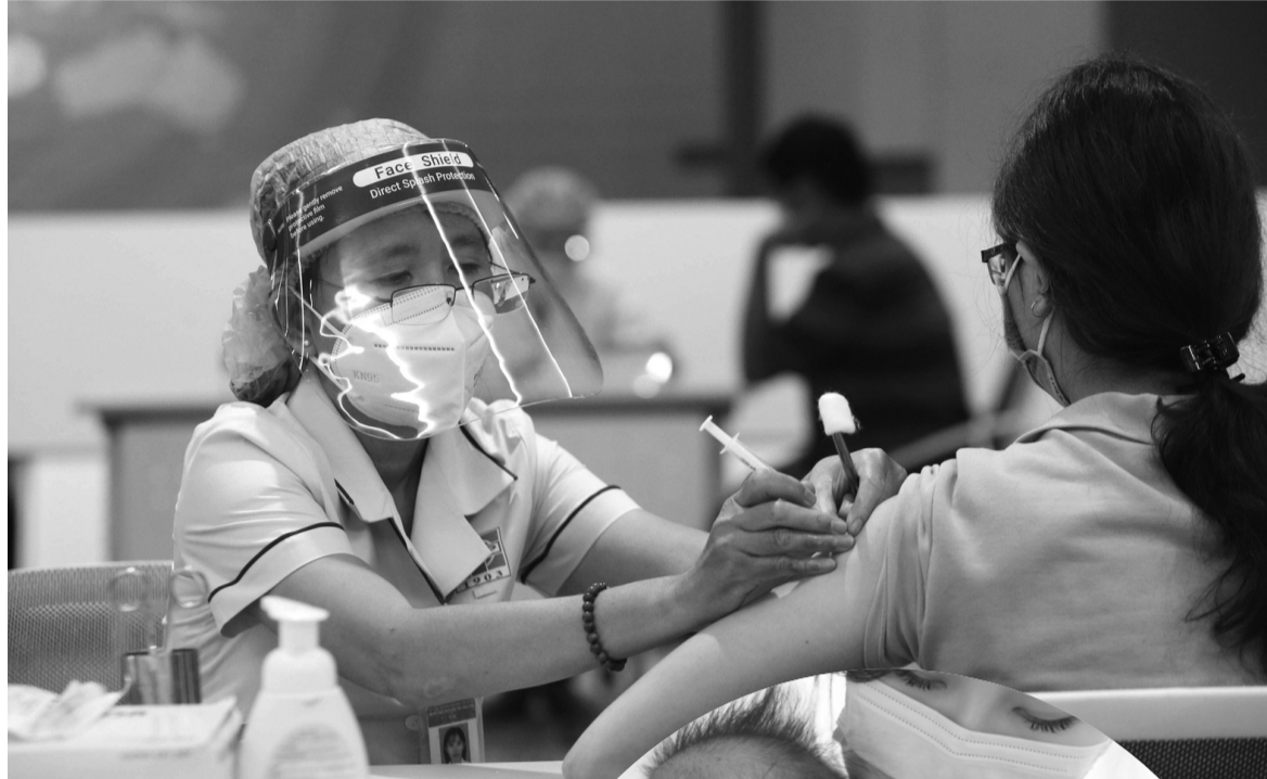
● Tiêm vaccine không chỉ là quyền lợi cá nhân, đó còn là nghĩa vụ xã hội. (Ảnh: CP)

Những năm qua, trào lưu sống thuận tự nhiên lan rộng, thu hút một bộ phận người tin rằng cơ thể con người có khả năng “tự chữa lành”, không cần đến thuốc hay can thiệp y tế. Biến tướng nguy hiểm nhất của xu hướng này chính là việc bài trừ vaccine một cách cực đoan, lan truyền những kiến thức y tế lệch lạc trong cộng đồng.