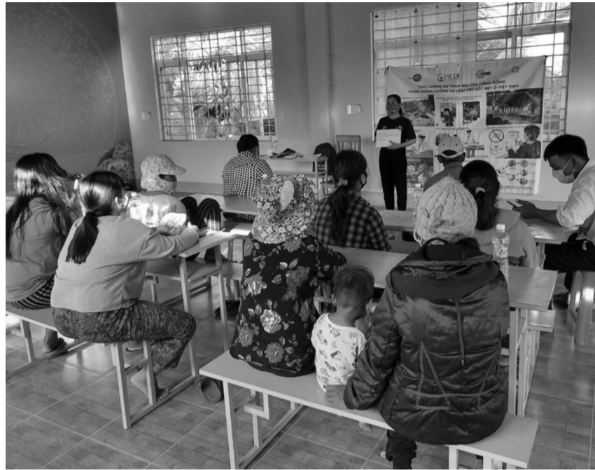
● Tuyên truyền về thẻ BHYT cho bà con.