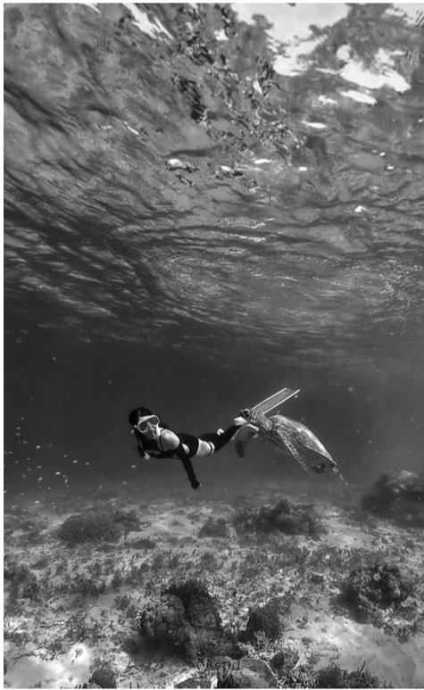
● Việc học bộ môn lặn tiên cá giúp Vũ Thị Bạch Dương có thêm kiến thức cơ bản bảo vệ môi trường biển.

Ngày xưa ngày xưa, có những nàng tiên cá đã đổi giọng hát của mình để lấy đôi chân nhíp bước trên bờ cát trắng. Vẻ đẹp thần tiên, nên thơ uyển chuyển của các nàng đã in hằn vào ký ức mỗi người trên khắp thế giới từ thuở thơ ấu. Để đến ngày nay, đã có không ít cô gái, chàng trai sẵn sàng đặt đôi chân vào những chiếc đuôi cá tạo ra các vũ khúc dưới mặt nước sâu thẳm.