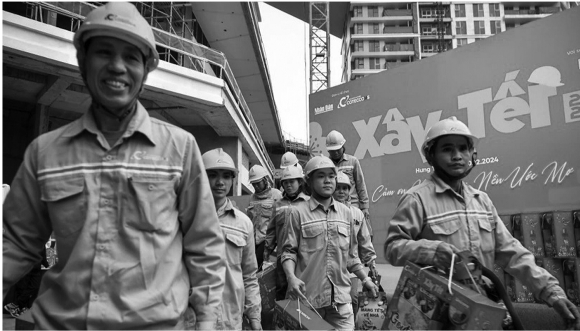
● Niềm vui của các công nhân khi nhận quà Tết.