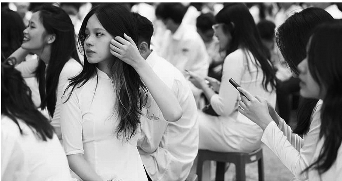
● Thấy hạnh phúc mới có trò hạnh phúc. (Ảnh minh họa: PV)