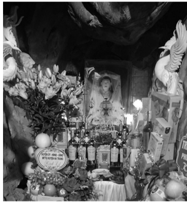
● Ngôi đền thờ Châu Đệ tứ có tòa thạch động niên đại 600 năm.