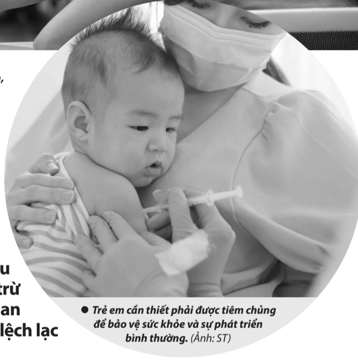
● Trẻ em cần thiết phải được tiêm chủng để bảo vệ sức khỏe và sự phát triển bình thường.

Chính vì thế, mỗi người cần nhận thức rõ vai trò và trách nhiệm của mình trong việc đảm bảo sức khỏe cộng đồng. Hãy tôn trọng khoa học y học, lan truyền những thông tin đúng đắn, đừng ngần ngại đầu tư cho tương lai bằng việc tiêm vaccine đầy đủ. Lối sống thuận tự nhiên có thể tích cực nếu được áp dụng đúng cách, nhưng bài trừ vaccine lại là một biến tướng độc hại, cần được nhận diện và loại bỏ. TRẦN TRẦN