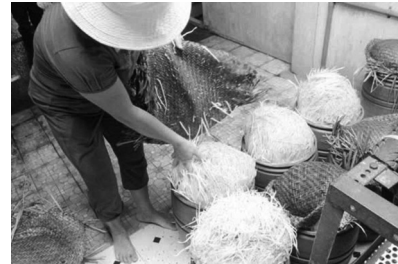
● Một phần tang vật trong vụ án.

Bị can Đạo khai được truyền nghề làm giá đỡ từ nhiều người, sử dụng "nước kẹo" ngâm giá đỡ để ít rễ, thân cây mập, đẹp mắt. Người này ký hợp đồng cung cấp cho một hệ thống siêu thị từ đầu tháng 5/2024. Trên bao bì được in nhãn mác Cty, hạn sử dụng 2 ngày, khuyến cáo không sử dụng hàng đã qua hư hỏng. "Do thị trường cạnh tranh em mới dùng "nước kẹo", chứ thị trường mà sạch hết với nhau, thì