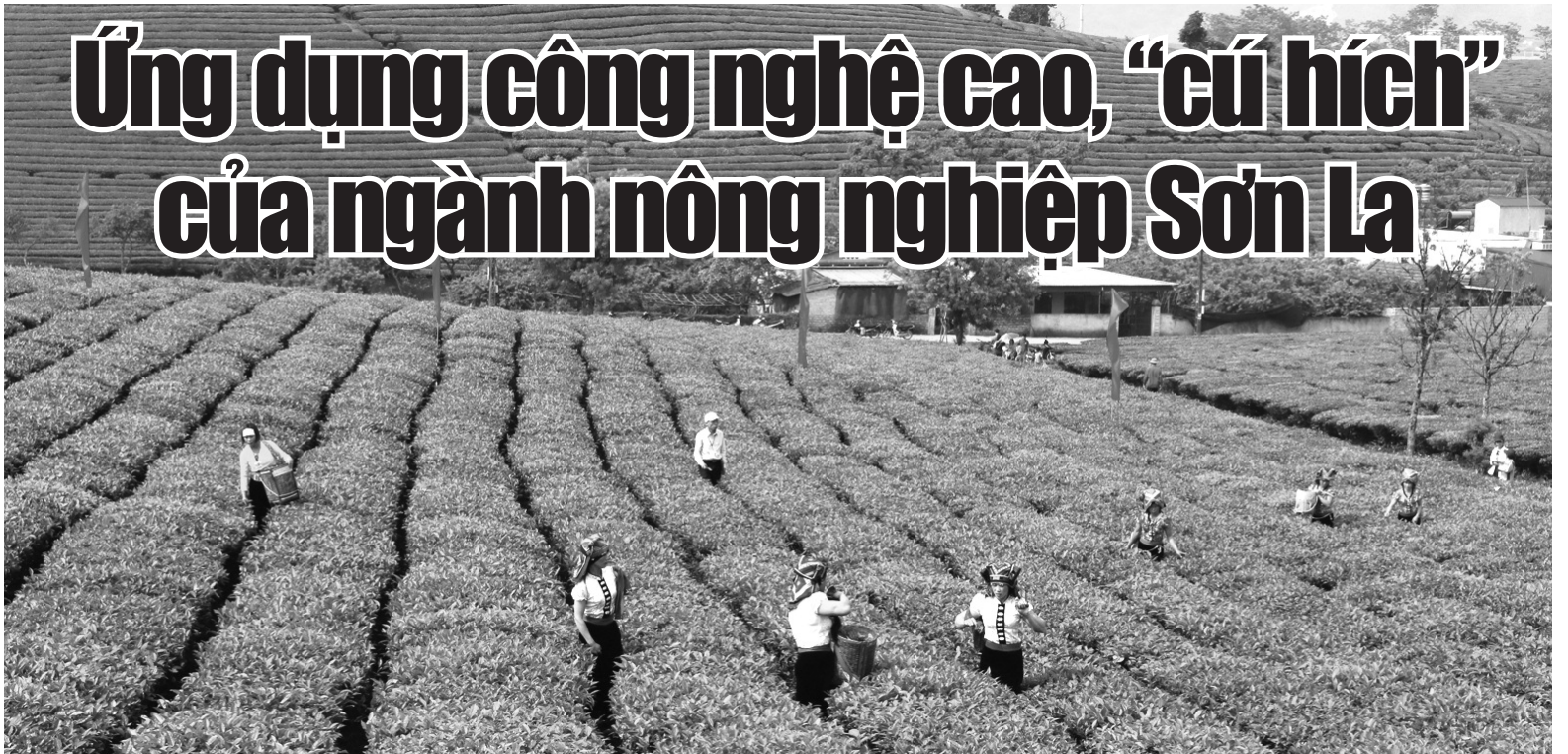
● Trồng chè ứng dụng công nghệ cao ở Mộc Châu.

Hiện nay, việc phát triển nông nghiệp ứng dụng công nghệ cao là một trong những hướng đi hiệu quả được nhiều địa phương áp dụng nhằm nâng cao năng suất, chất lượng, giá trị sản phẩm. Với tiềm năng, thế mạnh lớn, tỉnh Sơn La xác định nông nghiệp là “trụ đỡ” quan trọng trong cơ cấu kinh tế địa phương, bằng những giải pháp đồng bộ trong thời gian qua, nông nghiệp Sơn La đã bứt phá phát triển mạnh mẽ, trở thành “hiện tượng nông nghiệp” của cả nước.