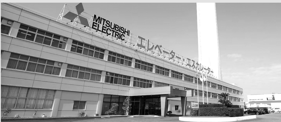
● Trụ sở Mitsubishi ở Nhật Bản.

Sau tàn phá của Thế chiến II, Nhật Bản đã nhanh chóng vực dậy để trở thành siêu cường kinh tế lớn thứ hai thế giới (sau Hoa Kỳ) trong một nỗ lực được gọi là “Phép màu kinh tế”. Các nhà quan sát phương Tây ghi nhận sự chuyển đổi chưa từng có này là có phần đóng góp của keiretsu. Tuy nhiên, quá trình toàn cầu hóa đã khiến Nhật Bản phải liên tục ban hành các quy định cải cách keiretsu.