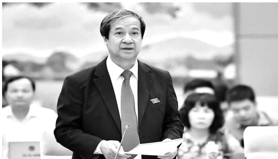
● Bộ trưởng Bộ GD&ĐT Nguyễn Kim Sơn trao đổi về dự thảo Luật Nhà giáo tại Quốc hội.

Sau gần 20 năm áp dụng, hơn một năm gấp rút chuẩn bị, dự thảo Luật Nhà giáo trình lần đầu tại Kỳ họp thứ 8, Quốc hội khóa XV, nhận được sự ủng hộ, đồng thuận cao của đại biểu Quốc hội. Tổng Bí thư Tô Lâm đã chỉ đạo trong phiên thảo luận tại tổ Quốc hội: "Phải làm sao để Luật Nhà giáo ra đời sẽ được các thầy cô chào đón. Phải làm sao để người thầy đón nhận Luật Nhà giáo thực sự phấn khởi, thực sự là tôn vinh, thực sự tạo điều kiện thuận lợi cho người thầy". Theo dự kiến, dự thảo Luật Nhà giáo sẽ được xem xét, thông qua tại Kỳ họp thứ 9, Quốc hội khóa XV này.