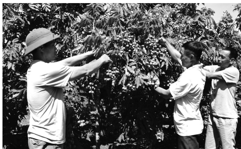
● Mô hình trồng nhân ứng dụng khoa học kỹ thuật ở huyện Sông Mã.

Đối với chăn nuôi, cải tạo giống và chuyên giao kỹ thuật, mở rộng mô hình doanh nghiệp, hợp tác xã liên kết với các hộ gia đình, ứng dụng công nghệ xử lý chất thải chăn nuôi bằng công nghệ khí sinh học, chế phẩm sinh học... nhằm giảm thiểu nguy cơ gây ô nhiễm môi trường. Ứng dụng công nghệ mô, hom trong chọn, tạo, nhân giống các giống cây lâm nghiệp và ứng dụng công nghệ GIS trong bảo vệ rừng trong lĩnh vực lâm nghiệp. Còn trong lĩnh vực thủy sản, ứng dụng công nghệ sinh học trong chọn lọc đàn cá bố mẹ, công nghệ sản xuất cá giống bằng phương pháp đẻ vuốt và ấp trứng bằng bình vôi, ứng dụng phương pháp lai xa hoặc sử dụng hóa chất để tạo giống đơn