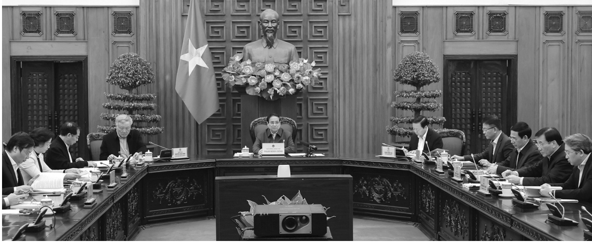
● Thủ tướng đề nghị các thành viên Ban Chỉ đạo phát huy tinh thần trách nhiệm, tập trung thực hiện, đảm bảo tiến độ, chất lượng theo yêu cầu đã đề ra.

Hôm qua (29/12), tại Trụ sở Chính phủ, Thủ tướng Chính phủ Phạm Minh Chính, Trưởng Ban Chỉ đạo của Chính phủ tổng kết việc thực hiện Nghị quyết số 18-NQ/TW “Một số vấn đề về tiếp tục đổi mới, sắp xếp tổ chức bộ máy của hệ thống chính trị tinh gọn, hoạt động hiệu lực, hiệu quả” đã chủ trì Phiên họp thứ sáu của Ban Chỉ đạo.