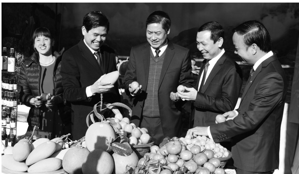
● Lãnh đạo tỉnh Sơn La thăm quan các gian hàng trưng bày nông sản của tỉnh.