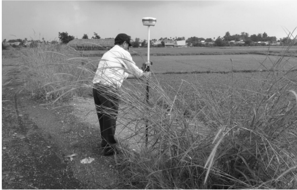
● Quy định mới về xác định ranh giới thửa đất trên thực địa từ ngày 15/01/2025.

Ranh giới thửa đất được xác định theo hiện trạng quản lý, sử dụng đất tại thực địa; do người sử dụng đất, người quản lý đất và người sử dụng đất liền kề, người quản lý đất liền kề cùng thỏa thuận để xác định. Đối với thửa đất đã có Giấy chứng nhận quyền sử dụng đất hoặc Giấy chứng nhận quyền sở hữu nhà ở và quyền sử dụng đất ở hoặc Giấy chứng nhận quyền sử dụng đất, quyền sở hữu nhà ở và tài sản khác gắn liền với đất hoặc Giấy chứng nhận quyền sử dụng đất, quyền sở hữu tài sản gắn liền với đất (sau đây gọi là Giấy chứng nhận) hoặc quyết định giao đất, cho thuê đất, cho phép chuyển mục đích sử dụng đất hoặc các