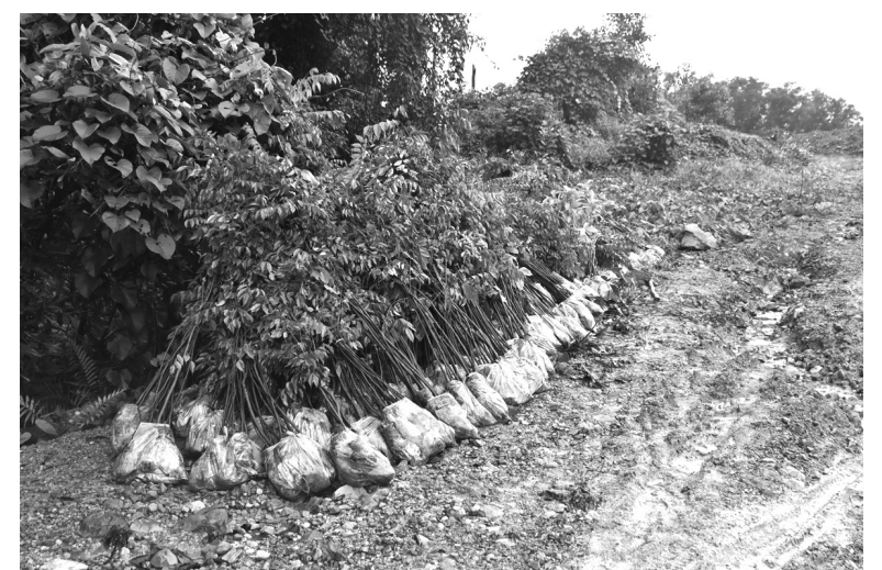
Năm 2024, Trung tâm Bảo tồn Thiên nhiên Gaia đã trồng thành công gần 300.000 cây tại 7 khu rừng đầu nguồn trên cả nước.

Bà Huyền Đỗ - Giám đốc Trung tâm Bảo tồn Thiên nhiên Gaia cho biết: "Gaia rất tập trung vào tính hiệu quả của việc triển khai trồng rừng. Chúng tôi chỉ trồng ở các khu rừng đầu nguồn có giá trị sinh thái lớn và được bảo vệ nghiêm ngặt như các vườn quốc gia và khu bảo tồn. Các chương trình đều được lên kế hoạch tỉ mỉ với sự phối hợp của các ban quản lý vườn quốc gia và khu bảo tồn để xác định khu vực đất cần phục hồi, loài cây và nguồn cây bản địa phù hợp. Tùy