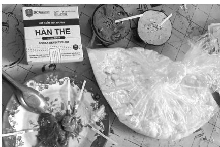
Cả 9 mẫu chả đều phát hiện hàn the trong sản phẩm.