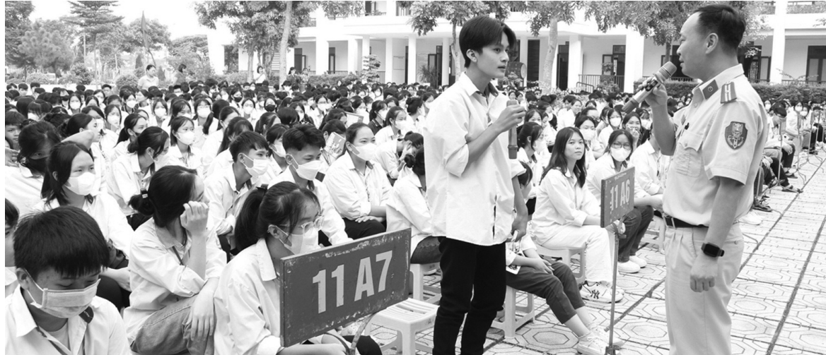
● Công an huyện Vĩnh Tường tuyên truyền, phổ biến pháp luật về an toàn giao thông cho học sinh. (Ảnh: Báo VP)

Cùng với đó, Hội đồng phối hợp PBGDPL tỉnh đã kịp thời ban hành các kế hoạch, văn bản chỉ đạo về phổ biến các luật, nghị quyết mới được Quốc hội thông qua. Nội dung tuyên truyền, phổ biến theo hướng đổi mới, sát thực với nhu cầu của xã hội và điều kiện thực