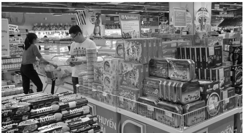
● Hệ thống phân phối bán lẻ của Doanh nghiệp Việt có nhiều phát triển nhưng vẫn còn không ít khó khăn. (Ảnh minh họa - Nguồn: Báo Người lao động)