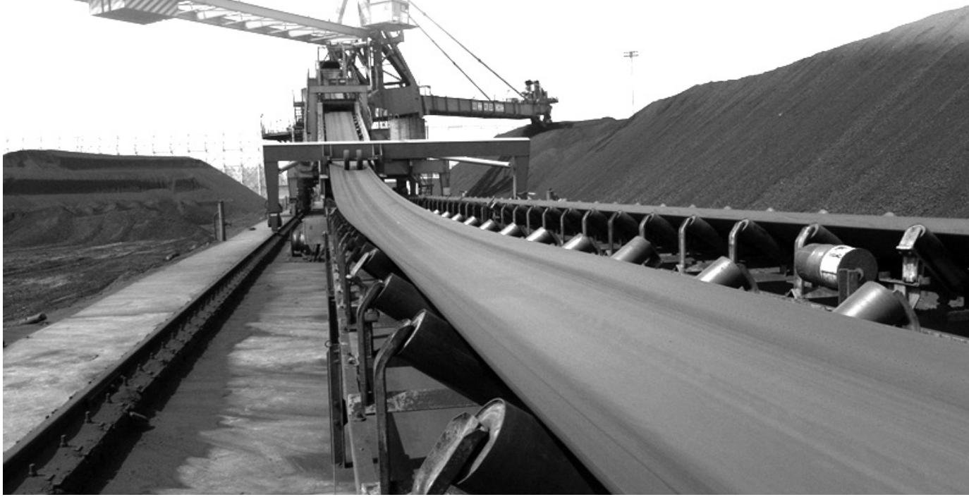
● Nhiều dây chuyền sàng tuyển, bốc rót than tại Công ty Tuyển than Cửa Ông đã được tự động hóa. (Ảnh: NLVN)

Doanh nghiệp dân tộc (DNDT) là nền tảng quan trọng của nền kinh tế Việt Nam, không chỉ góp phần thúc đẩy tăng trưởng kinh tế mà còn đại diện cho bản sắc văn hóa và niềm tự hào dân tộc. Trong bối cảnh toàn cầu hóa và chuyển đổi số mạnh mẽ, việc hoàn thiện các chính sách pháp luật để hỗ trợ DNDT phát triển không chỉ mang tính cấp thiết mà còn là yếu tố quyết định để hiện thực hóa mục tiêu công nghiệp hóa, hiện đại hóa đất nước.