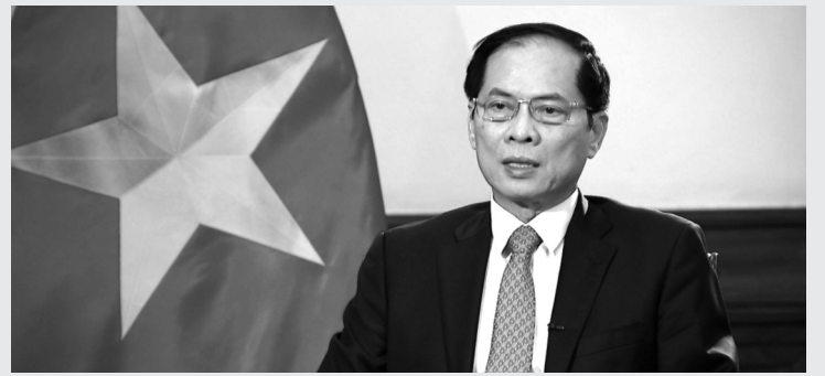
● Phó Thủ tướng, Bộ trưởng Bùi Thanh Sơn nêu rõ, để đưa đất nước bước vào kỷ nguyên mới đòi hỏi cần xây dựng nền đối ngoại, ngoại giao ngày càng toàn diện, hiện đại, chuyên nghiệp đáp ứng yêu cầu.

Đánh giá tổng quan về bức tranh ngoại giao Việt Nam năm 2024 cũng như các thành tựu nổi bật mà ngành đối ngoại - ngoại giao đạt được, Phó Thủ tướng, Bộ trưởng Bùi Thanh Sơn cho biết, năm 2024 tình hình thế giới tiếp tục biến động phức tạp với nhiều bất ổn, xung đột. Tuy nhiên, chúng ta có thể tự hào rằng trong bối cảnh thế giới như vậy, Việt Nam vẫn giữ vững cục diện đất nước hòa bình, ổn định, phát triển và được dư luận quốc tế coi là một trong những “điểm sáng” ở khu vực. Các hoạt động đối ngoại được triển khai một cách chủ động, tích cực, đạt nhiều kết quả thực chất, tạo nên tâm vóc đối ngoại mới, tạo đà thuận lợi cho đất nước bước vào kỷ nguyên vươn mình của dân tộc.