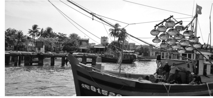
● Tại Quảng Ngãi, thời gian qua công tác chống khai thác IUU và việc tuyên truyền Luật Thủy sản được thực hiện thường xuyên, giúp ngư dân nâng cao ý thức chấp hành pháp luật.

Báo cáo của Sở Nông nghiệp và Phát triển nông thôn (NN&PTNT) tỉnh Quảng Ngãi cho biết, tính đến tháng 12/2024, tổng số tàu cá của tỉnh đã đăng ký là 4.928 chiếc (tăng 207 chiếc so với tháng 11); tổng số tàu cá đã đăng kiểm là 3.010 chiếc (tăng 355 chiếc so với tháng 11); tỉ lệ tàu cá đánh dấu cơ bản đạt 100% tàu cá đã đăng ký.