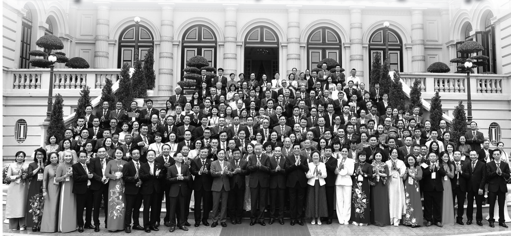
● Tổng Bí thư Tô Lâm (khi đó là Tổng Bí thư, Chủ tịch nước) gặp mặt Đoàn đại biểu doanh nhân tiêu biểu của Liên đoàn Thương mại và Công nghiệp Việt Nam (VCCI) và Hội Doanh nghiệp Tư nhân Việt Nam Nhân Ngày Doanh nhân Việt Nam (13/10), vào chiều 11/10/2024, tại Phủ Chủ tịch.