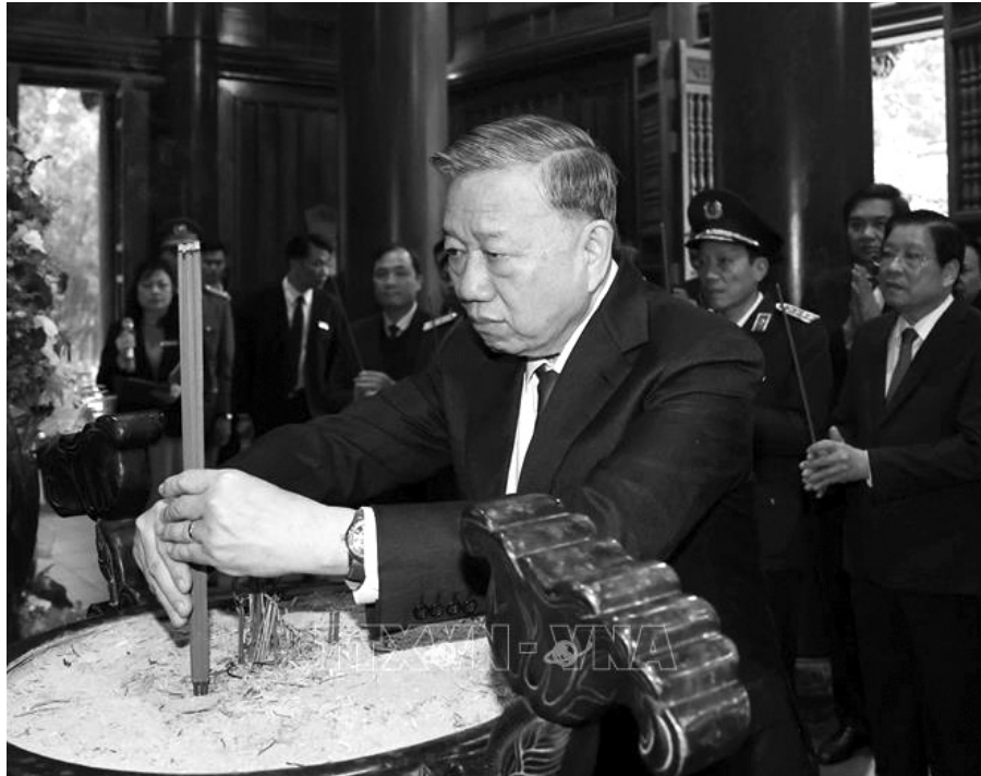
● Tổng Bí thư Tô Lâm dâng hương tưởng niệm Chủ tịch Hồ Chí Minh tại Khu di tích Quốc gia đặc biệt Kim Liên.

Thực hiện di huấn thiêng liêng của Người, Tổng Bí thư Tô Lâm và Đoàn công tác nguyện hứa tiếp tục đoàn kết thống nhất, chung sức đồng lòng, tranh thủ tối đa thời cơ, thuận lợi, phát huy cao nhất mọi nguồn lực để cùng nỗ lực thực hiện mục tiêu phát triển toàn diện, mạnh mẽ, bứt phá, đưa đất nước ta bước vào kỷ nguyên phát