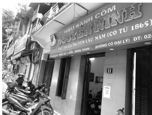
● Cơ sở bánh cốm gia truyền Nguyễn Ninh đã bị tạm dừng hoạt động vì chưa bảo đảm điều kiện an toàn thực phẩm, không chứng minh được nguồn gốc nguyên liệu.

người nhập viện và đã có trường hợp tử vong như: ngày 19/12, trên địa bàn quận Long Biên (Hà Nội) xảy ra vụ ngộ độc thực phẩm làm tử vong 2 người, nhiều người phải cấp cứu tại bệnh viện; đầu tháng 12, hơn 40 công nhân Công ty Premium Fashion (công ty may), đóng trong Khu công nghiệp WHA, thuộc xã Nghi Thuận, huyện Nghi Lộc phải nhập viện trong tình trạng chóng mặt, đau đầu, buồn nôn, cảm giác nóng bừng mặt, một số có cảm giác tức ngực, mất ngủ... với chẩn đoán ban đầu là ngộ độc thực phẩm, phân vệ độ 1.