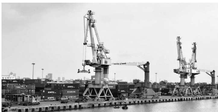
● Tổng kim ngạch xuất khẩu hàng hóa của doanh nghiệp TP đạt 36,3 tỷ USD, tăng 19,5% so với cùng kỳ.