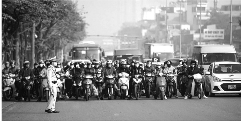
● Ý thức chấp hành Luật Giao thông đường bộ của người dân có sự chuyển biến rõ rệt sau khi Nghị định 168 có hiệu lực.

Những ngày qua, việc tăng nặng mức xử phạt và áp dụng cơ chế trừ điểm giấy phép lái xe bước đầu tạo hiệu quả tích cực, nâng cao ý thức chấp hành của người dân. Tuy nhiên, để thực sự xây dựng văn hóa giao thông cần nhiều hơn thế.