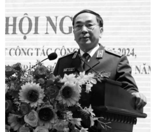
● Thứ trưởng Trần Quốc Tô biểu dương, ghi nhận và đánh giá cao những kết quả mà Công an tỉnh Nam Định đã đạt được trong năm 2024.

Sáng 03/1, Công an tỉnh Nam Định đã tổ chức Hội nghị tổng kết công tác năm 2024 và phát động Phong trào thi đua “Vì an ninh Tổ quốc” năm 2025. Tham dự Hội nghị có Thượng tướng Trần Quốc Tô, Ủy viên Trung ương Đảng, Phó Bí thư Đảng ủy Công an Trung ương, Thứ trưởng Bộ Công an.