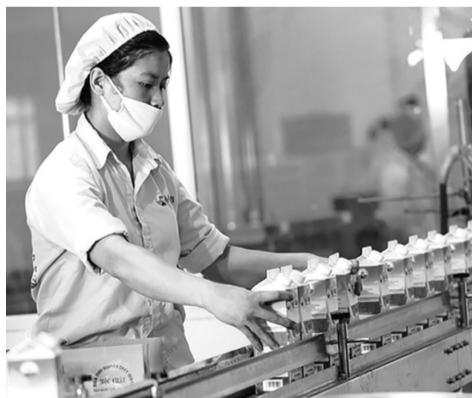
● Chính phủ cần xây dựng một khung pháp lý ổn định, trong đó có các chính sách hỗ trợ, khuyến khích đội ngũ doanh nhân, cộng đồng DN Việt phát triển.

“Hiện tại, Viện Nghiên cứu chiến lược, chính sách Công Thương, Bộ Công Thương đã hoàn thành dự thảo đối với 3 chiến lược phát triển ngành thép, sữa và ô tô, đã trình Chính phủ chờ phê duyệt. Khi những chiến lược này được thực thi, đối với thị trường các ngành thép, sữa và ô tô sẽ phát triển lành mạnh nhờ các chính sách và công cụ quản lý nhà nước cụ thể. Các DN có thể hưởng lợi từ các biện pháp hỗ trợ cụ thể được đề xuất trong các chiến lược.