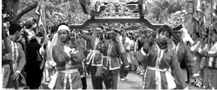
●Rước kiệu tại Lễ hội Gióng Đền Sóc.

Công tác quản lý và tổ chức lễ hội này cần tiếp tục được nghiên cứu, điều chỉnh, tuân thủ đúng các quy định pháp luật, loại bỏ các yếu tố, hành vi không đúng với giá trị truyền thống. Trong đó, chú trọng các nội dung như chuyển đổi hình thức tranh phết sang hướng thực hành nghi lễ đánh phết; hạn chế số lượng người tham gia đánh phết; quy định rõ trách nhiệm của BTC, người tham gia thực hành nghi lễ đánh phết, người tham gia hội để tránh hiện tượng tranh cướp, giẫm đạp lên nhau dẫn tới ẩu đã mất kiểm soát.