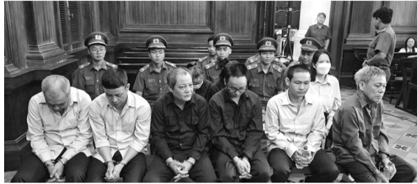
● Các bị cáo trong vụ án.