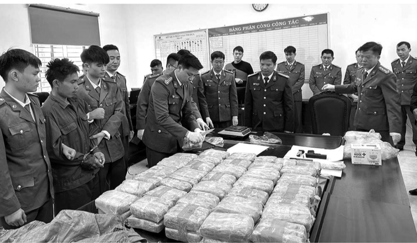
● Tang vật trong vụ án ma túy tại Sơn La ngày 17/12/2024.

lượng. Thời gian gần đây, phát hiện lượng lớn (hàng tấn) ma túy tổng hợp được một số đối tượng người nước ngoài mở xưởng điều chế, sản xuất ngay sát biên giới Việt Nam, sau đó vận chuyển vào Việt Nam rồi vận chuyển đi nước thứ ba tiêu thụ.