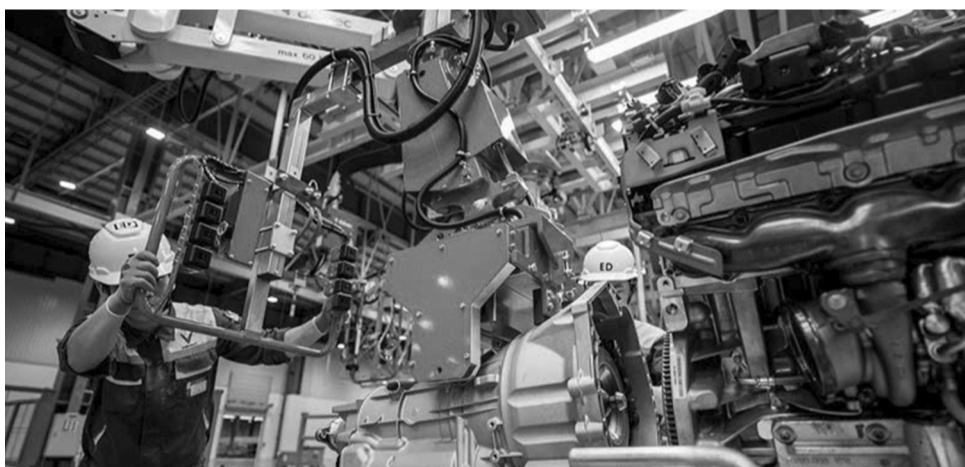
● Tổng sản phẩm trên địa bàn (GRDP) ước tăng 11,01% so cùng kỳ, đứng thứ 3 cả nước.

Hoạt động xuất khẩu ghi nhận thành công nổi bật với tổng kim ngạch ước đạt 36,3 tỷ USD, tăng 19,5% so với năm trước. Ngành công nghiệp chế biến chế tạo chiếm gần 80% tổng kim ngạch xuất khẩu. Hoạt động nhập khẩu cũng diễn ra sôi động với tổng kim ngạch nhập khẩu ước đạt 28,1 tỷ USD, đáp ứng đầy đủ nguyên liệu cho sản xuất.