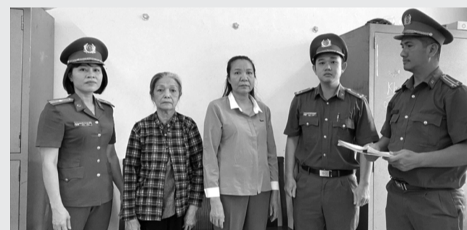
● Tổng đạt các quyết định tố tụng với hai bị can.