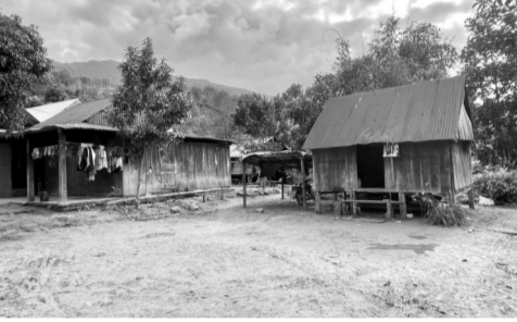
● Toàn tỉnh Quảng Bình còn 2.154 hộ nghèo, cận nghèo cần được hỗ trợ để cải thiện nhà ở.

Hôm qua (3/1), các huyện Quảng Trạch, Minh Hóa, Lệ Thủy, Tuyên Hóa, Quảng Ninh, Lệ Thủy, Bố Trạch và thị xã Ba Đồn (tỉnh Quảng Bình) đã đồng loạt tổ chức khởi công xóa nhà tạm, nhà dột nát (NT,NDN) cho hộ nghèo, hộ cận nghèo trên địa bàn.