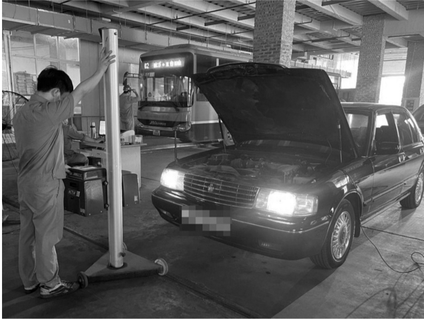
● Từ 1/1/2025, chưa nộp phạt vi phạm có thể bị từ chối đăng kiểm.

Chính phủ vừa ban hành Nghị định 166/2024/NĐ-CP quy định về điều kiện kinh doanh dịch vụ kiểm định xe cơ giới; tổ chức, hoạt động của cơ sở đăng kiểm; niên hạn sử dụng của xe cơ giới.