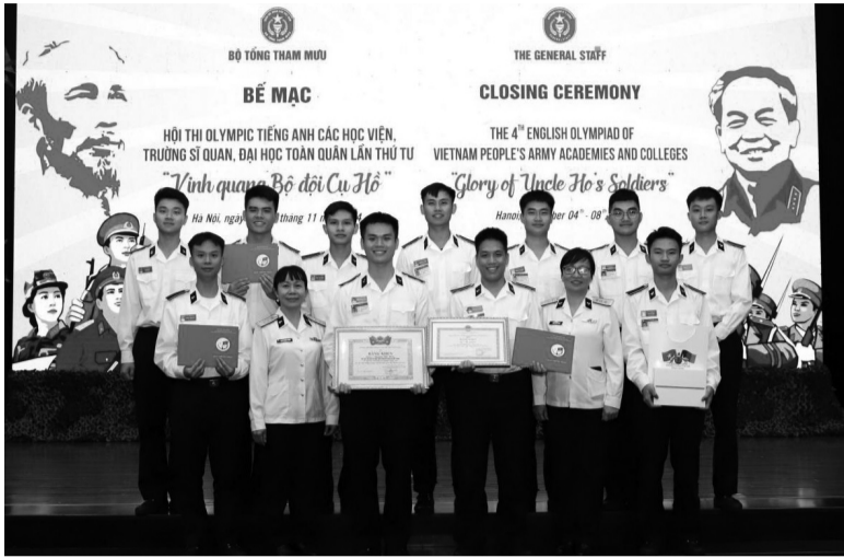
● Đội tuyển Học viện Hải quân tham gia Hội thi olympic tiếng Anh toàn quân lần thứ 4.

thông tin, kỹ thuật mô phỏng vào dạy học.