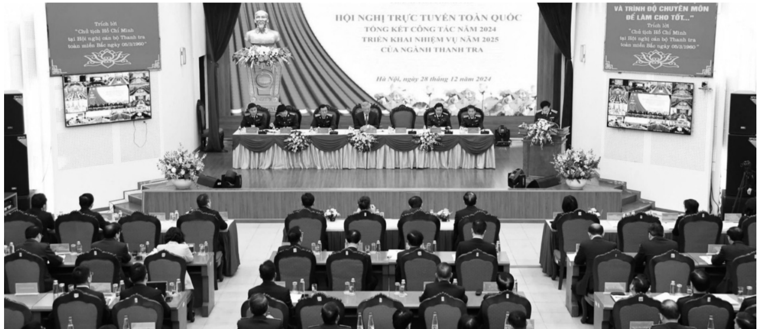
● Thanh tra Chính phủ tổ chức Hội nghị trực tuyến toàn quốc tổng kết công tác năm 2024, triển khai nhiệm vụ năm 2025 (ngày 28/12/2024).

cục, Thanh tra sở; cơ quan được giao thực hiện chức năng thanh tra chuyên ngành. Đội ngũ cán bộ, công chức, viên chức của cơ quan thanh tra không ngừng được củng cố, kiện toàn được đào tạo chuyên môn, bồi dưỡng nghiệp vụ thanh tra, lý luận chính trị và quản lý nhà nước, cơ bản đáp ứng được yêu cầu nhiệm vụ.