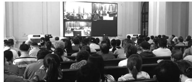
●Cáo trạng xác định vụ án có 592 nạn nhân.