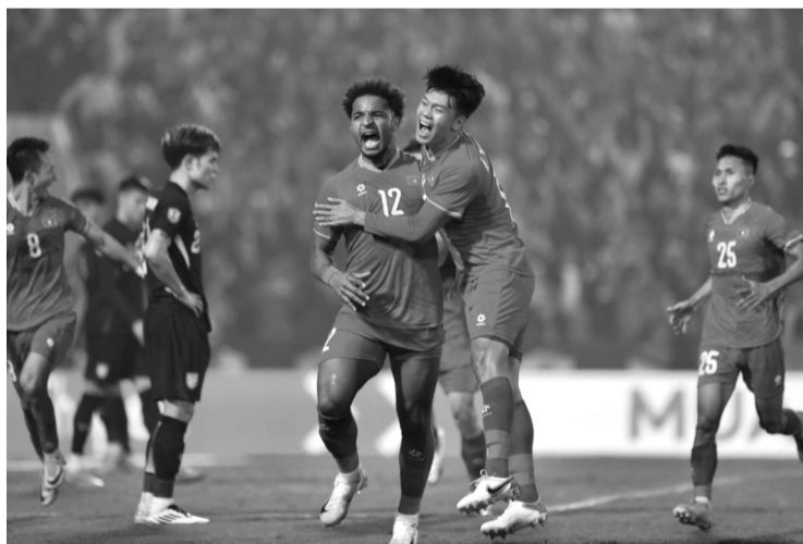
● Hy vọng tinh thần nhiệt huyết sẽ tiếp tục được nóng lên tại sân Thái Lan ngày 5/1 tới đây.

Trận chung kết lượt đi trên sân Việt Trì, đội tuyển Việt Nam có 15 phút đầu tiên chơi ấn tượng,