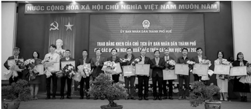
● Trao Bằng khen của Chủ tịch UBND thành phố Huế cho những doanh nghiệp xuất sắc trên các lĩnh vực năm 2024.