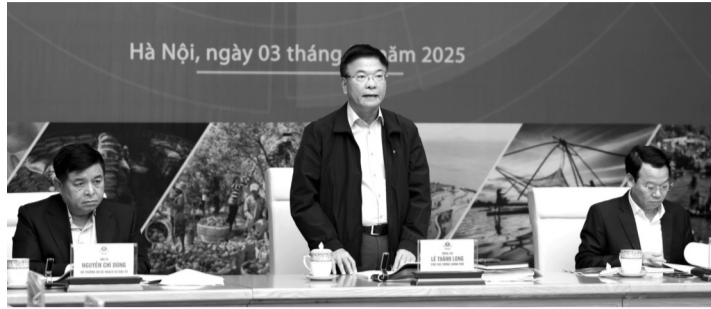
● Phó Thủ tướng Lê Thành Long phát biểu tại Hội nghị.

Nhìn nhận về tình hình hoạt động của Hội đồng điều phối vùng ĐBSCL, Phó Thủ tướng cho rằng, từ khi thành lập (năm 2020) đến nay, Hội đồng đã đi đúng hướng trong việc khắc phục những ách tắc, khó khăn và đạt nhiều kết quả quan trọng. Có 13/13 địa phương trong vùng đã được Thủ tướng Chính phủ phê duyệt quy hoạch tỉnh. Các địa phương trong vùng đã chủ động thực hiện liên kết, kết nối giữa các tỉnh, thành phố trong vùng, như ký Thỏa thuận hợp tác phát triển kinh tế - xã hội giữa TP HCM và các tỉnh vùng ĐBSCL đến năm 2025 trong nhiều lĩnh vực. Nhiều dự án trọng điểm trong vùng đang được tích