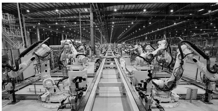
● Chỉ số sản xuất công nghiệp (IIP) tăng 15,43%.