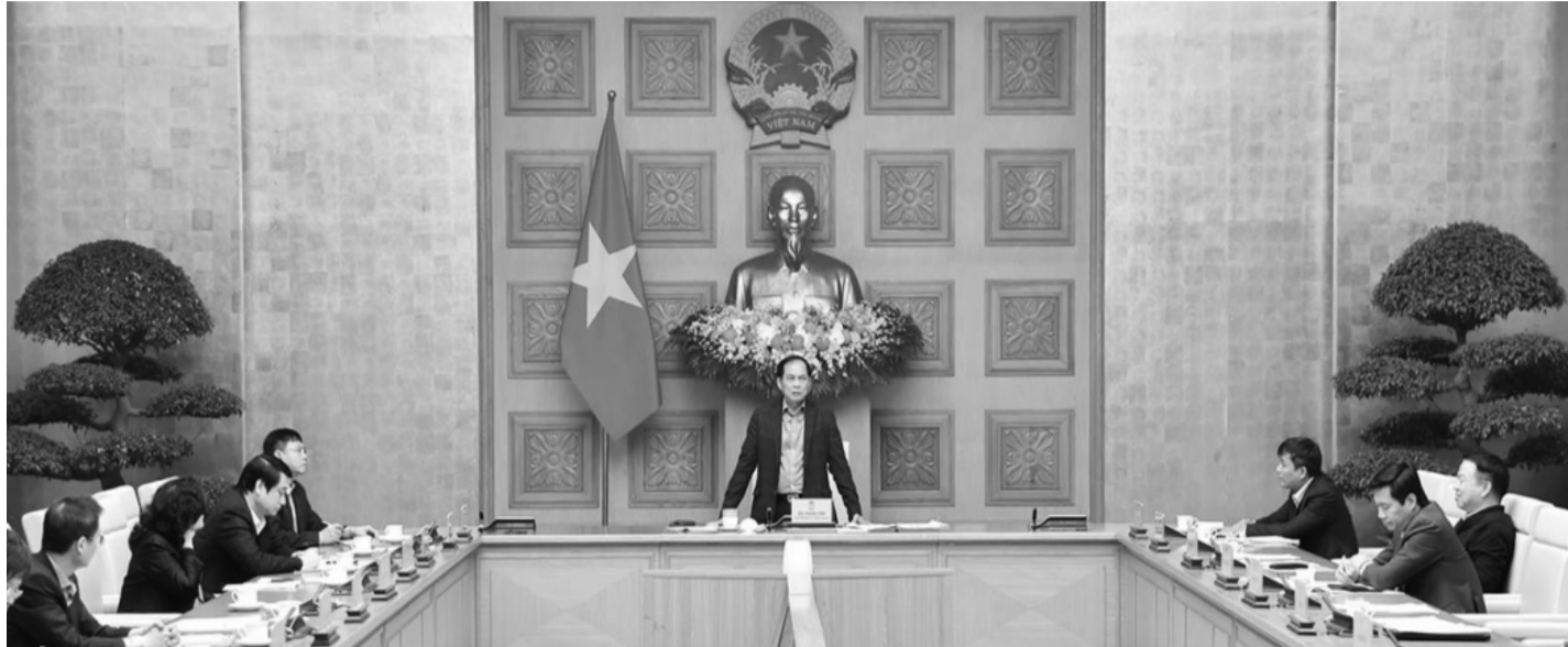
● Phó Thủ tướng Bùi Thanh Sơn ghi nhận văn hóa thực thi các cam kết bước đầu được lan tỏa.

Ngày 3/1, Phó Thủ tướng Chính phủ Bùi Thanh Sơn đã chủ trì cuộc họp tổng kết năm 2024 của cơ chế rà soát, đôn đốc việc thực hiện các cam kết, thỏa thuận hợp tác đã được ký kết, đề cập trong các hoạt động đối ngoại cấp cao từ đầu nhiệm kỳ Đại hội Đảng lần thứ XIII đến nay.