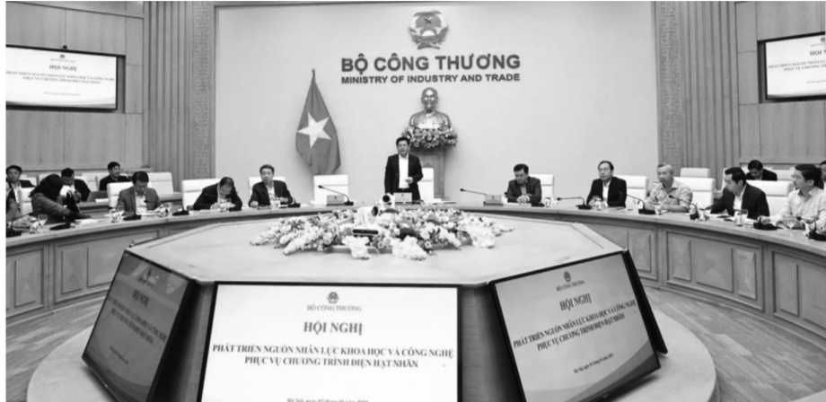
● Bộ trưởng Nguyễn Hồng Diên chủ trì Hội nghị phát triển nguồn nhân lực khoa học và công nghệ phục vụ chương trình điện hạt nhân.

Báo cáo của Tập đoàn Điện lực Việt Nam (EVN) cho thấy, giai đoạn đến 2017 (trước khi dừng thực hiện chủ trương đầu tư Dự án điện hạt nhân Ninh Thuận theo Nghị quyết số 31/2016/NQ-QH của Quốc hội), Bộ Giáo dục và Đào tạo đã cử tổng cộng 429 sinh viên đi học các chuyên ngành liên quan đến điện hạt nhân tại các trường đại học của Liên bang Nga, trong đó có 80 sinh viên là người Ninh Thuận; EVN đã cử tổng cộng 31 sinh viên đi học các chuyên