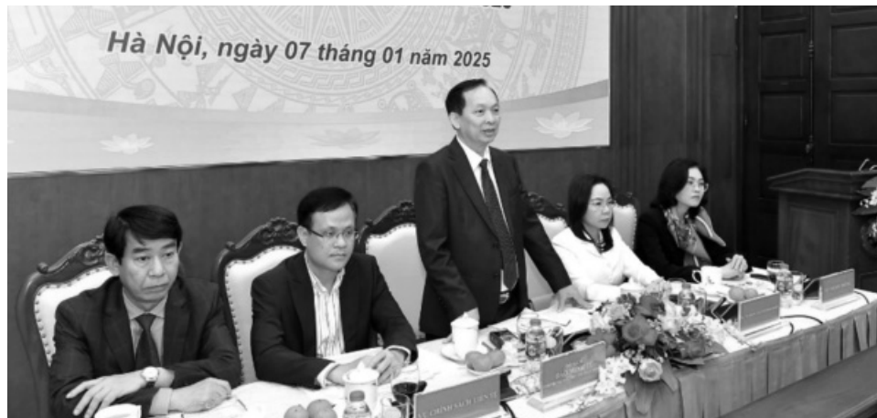
● Phó Thống đốc thường trực NHNN Đào Minh Tú thông tin tại họp báo.

Về điều hành lãi suất, NHNN tiếp tục giữ nguyên các mức lãi suất điều hành trong bối cảnh lãi suất thế giới vẫn neo ở