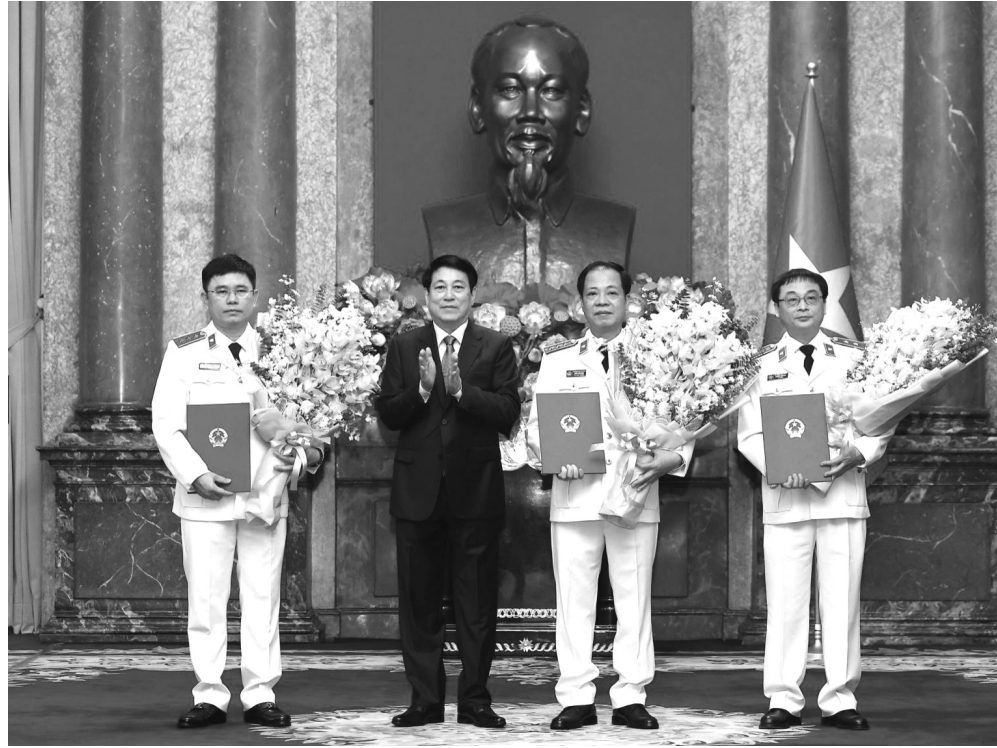
● Chủ tịch nước Lương Cường trao Quyết định bổ nhiệm Phó Viện trưởng và Kiểm sát viên Viện kiểm sát nhân dân tối cao cho các cá nhân.

Chủ tịch nước yêu cầu các cá nhân chủ động cùng tập thể lãnh đạo VKSNDTC phối hợp chặt chẽ với các cơ quan, đơn vị liên quan triển khai kịp thời, hiệu quả chủ trương của Đảng về sắp xếp, kiện toàn tổ chức bộ máy của hệ thống chính trị nói chung và tổ chức, bộ máy ngành KSND nói riêng, bảo đảm tinh gọn, hoạt động hiệu lực, hiệu quả, gắn với việc bố trí, sắp xếp, giải quyết chế độ, chính sách đối với đội ngũ cán bộ, công chức, viên chức và người lao động ngành KSND.