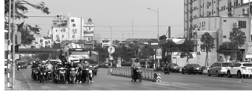
● Tại một ngã tư, từ khi hệ thống camera giám sát hoạt động, vi phạm đã giảm rõ rệt, tình hình giao thông thông thoáng hơn.

Đến nay, 5 nút giao thông gồm Lạch Tray - Nguyễn Bình, Hai Bà Trưng - Mê Linh, Trường Chinh - Nguyễn Trường Tộ, Lê Thánh Tông - Đà Nẵng, và Tôn Đức Thắng - Hùng Vương (ngã ba Sở Dầu) đã hoàn thành lắp đặt thiết bị. Các nhà thầu