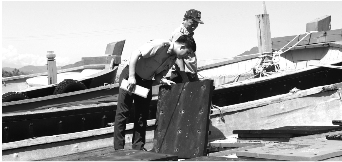
● Chấp hành viên xác minh tài sản là tàu cá.

Kết quả năm 2024 đã thi hành xong 6.252 việc, tương ứng hơn 30.544 tỷ đồng. So với năm 2023,