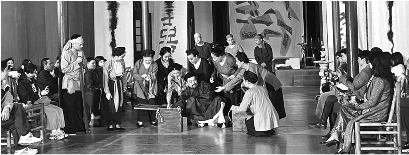
● Vở cải lương “Cảnh khế ngọt” được kỳ vọng sẽ trở thành sản phẩm du lịch hút khách.

Tuồng, chèo, múa rối... là những di sản văn hóa phi vật thể được Hà Nội “biến” thành sản phẩm du lịch độc đáo thu hút nhiều du khách trong và ngoài nước. Các nhà hát ở Thủ đô đang nâng cao kỹ năng biểu diễn của các nghệ nhân cũng như ý thức trách nhiệm trong bảo tồn, phát huy giá trị của di sản phi vật thể.