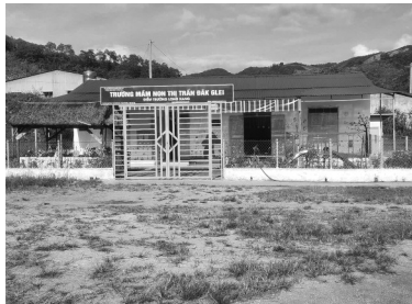
● Các công trình công cộng tại một khu TĐC.