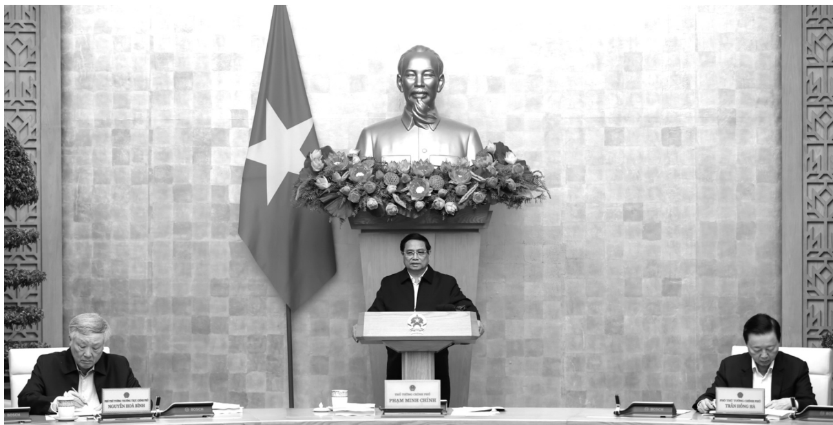
● Thủ tướng Phạm Minh Chính yêu cầu diễn đạt các nội dung của các dự án luật, nghị quyết phải ngắn gọn, súc tích, dễ hiểu, rõ ý, rõ nghĩa, rõ quyền hạn, rõ trách nhiệm, dễ hiểu, dễ kiểm tra, dễ giám sát.