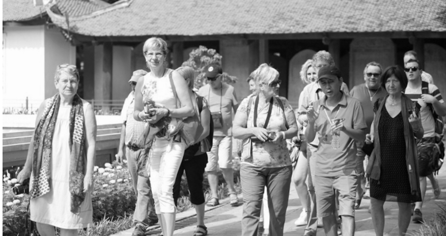
● Khách quốc tế đến Việt Nam có xu hướng tăng mạnh vào dịp đầu năm mới.

Thu hút khách quốc tế đến Việt Nam du lịch Tết Nguyên đán cũng là một hướng đi của nhiều tỉnh, địa phương và công ty du lịch - lữ hành. Theo thống kê của các công ty du lịch,