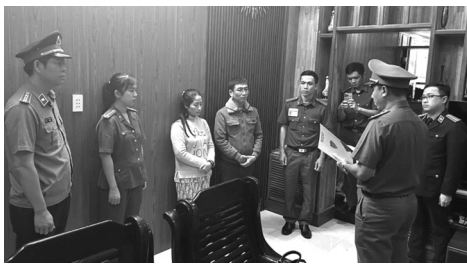
● Đọc lệnh khởi tố với chủ cơ sở sản xuất giò, chả sử dụng chất cấm tại Đà Nẵng.

Bổ trí nguồn lực để các cơ quan chuyên môn tổ chức các đợt lấy mẫu giám sát tăng cường với sản phẩm nông sản có nguy cơ cao mất ATTP tại cơ sở sản xuất, thu mua, sơ chế, chế biến, chợ đầu mối, cơ sở chuyên doanh nông sản. VĂN SON