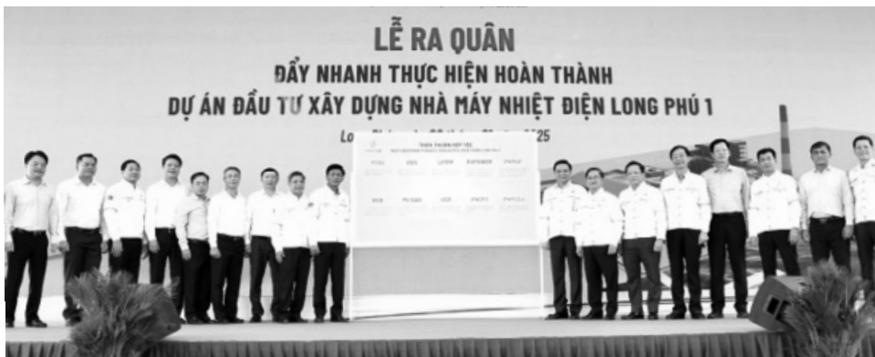
● Ban QLDA Long Phú 1 quyết tâm thi công hoàn thành Dự án trước năm 2027.