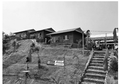
● Một góc khu du lịch TĐC thôn Tu Thố.