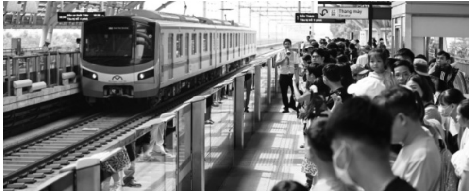
● Metro Bến Thành - Suối Tiên.

Những ngày gần đây, người đứng đầu Đảng ta - Tổng Bí thư Tô Lâm và người đứng đầu Chính phủ - Thủ tướng Phạm Minh Chính liên tục có buổi làm việc với chính quyền các địa phương, trong đó đã