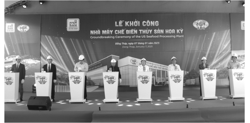
● Lãnh đạo và đại biểu thực hiện nghi thức khởi công.

Công trình được xây dựng trên diện tích gần 24.000m 2 trong Khu công nghiệp Sao Mai - Vàm Cống. Nhà máy có công suất 120 tấn nguyên liệu/ngày, sản lượng cá Fillet đông lạnh dự kiến khoảng 20.000 tấn/năm. Nhà máy được lắp đặt dây chuyền thiết bị sản xuất hoàn toàn nhập khẩu từ châu Âu, có qui trình nạp liệu tự động, hệ thống cấp đông hiện đại. Dự kiến thời gian xây dựng từ 12 - 14 tháng. Sau khi hoàn thành, Nhà máy chế biến thủy sản Hoa Kỳ sẽ góp phần nâng tổng công suất chế biến của IDI hơn 500 tấn nguyên liệu/ngày.