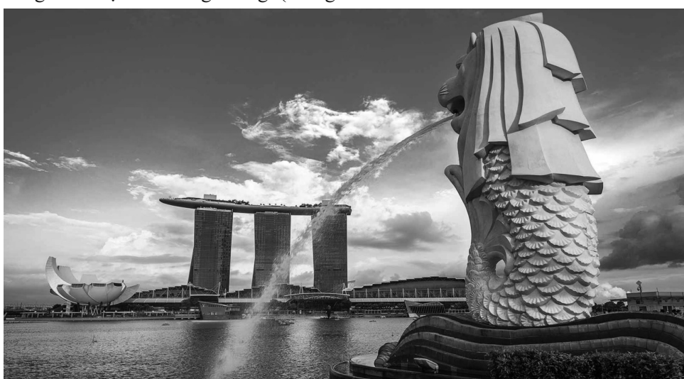
● Đảo quốc sư tử Singapore là một điển hình về phát triển thần kỳ.

Bằng cách mở rộng hỗ trợ cho những người áp dụng giải pháp xanh, Chương trình EFS-Green cũng nhằm mục đích giúp các doanh nghiệp bắt tay vào hành trình bền vững và giảm lượng khí thải carbon, góp phần vào các mục tiêu trong Kế hoạch Xanh Singapore 2030. GIA LÂM