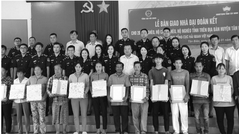
● 20 căn nhà trị giá 1,8 tỷ đồng đã được trao cho các hộ nghèo, cận nghèo huyện Tân Biên.

Vừa qua, Tổng cục Hải quan phối hợp với Ủy ban Mặt trận Tổ quốc Việt Nam tỉnh Tây Ninh tổ chức Lễ bàn giao nhà đại đoàn kết cho 20 hộ nghèo, hộ cận nghèo theo chuẩn Trung ương và hộ nghèo theo chuẩn nghèo tỉnh trên địa bàn huyện Tân Biên năm 2024, góp phần cùng địa phương xóa nhà tạm, nhà đột nát.