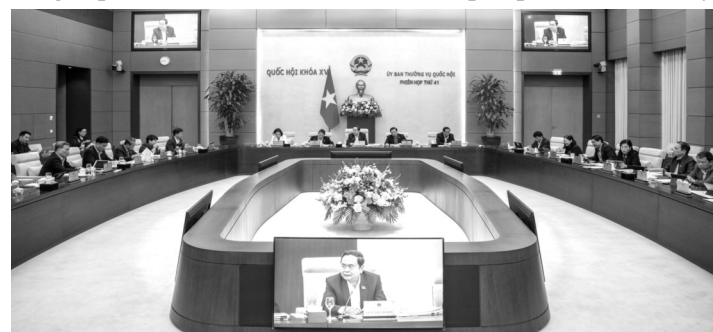
● Quang cảnh Phiên họp thứ 41 ngày 7/1.

Theo đó, QH sẽ tập trung xem xét, thông qua đối với 7 nội dung cấp thiết để triển khai, thực hiện sắp xếp tổ chức bộ máy.