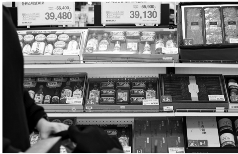
● Các công ty thực phẩm ở Hàn Quốc cho ra các bộ quà Tết sử dụng bao bì thân thiện với môi trường để gây ấn tượng với khách hàng.

Tết Nguyên đán không chỉ là thời điểm để gia đình sum họp mà còn là dịp để thể hiện văn hóa, truyền thống và phong tục đặc trưng của từng quốc gia. Tuy nhiên, với thách thức từ biến đổi khí hậu và các vấn đề môi trường, nhiều nước trên thế giới đang chuyển hướng tổ chức Tết một cách bền vững hơn. Tại Nhật Bản và Hàn Quốc, phong trào Tết xanh - kết hợp giữa tiết kiệm và bảo vệ môi trường - đã thu hút sự chú ý của nhiều người dân, tạo nên những thay đổi đáng kể trong cách đón Tết.