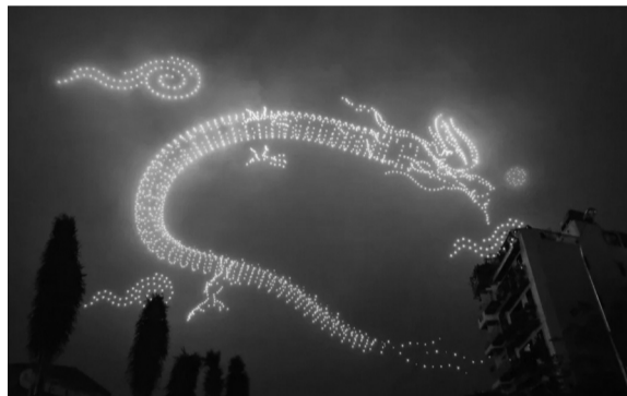
● Lễ hội Ánh sáng Quốc tế Hà Nội 2025 đón chào năm mới sẽ có màn trình diễn ánh sáng từ 2025 drone.