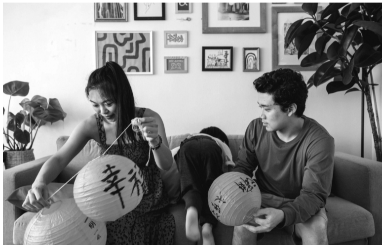
● Tái chế, tái sử dụng đồ trang trí ngày Tết đang trở thành xu hướng để tránh lãng phí.

● Trao lưu Tết Nguyên đán thân thiện môi trường, từ trang trí, ẩm thực đến lối sống, đang được đón nhận ở nhiều quốc gia.