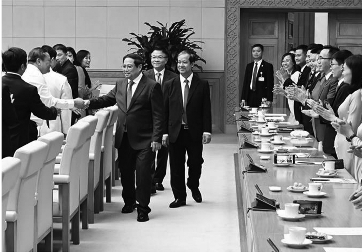
● Thủ tướng Phạm Minh Chính vui mừng chào đón các nhà giáo tiêu biểu năm 2024 tại trụ sở Chính phủ.