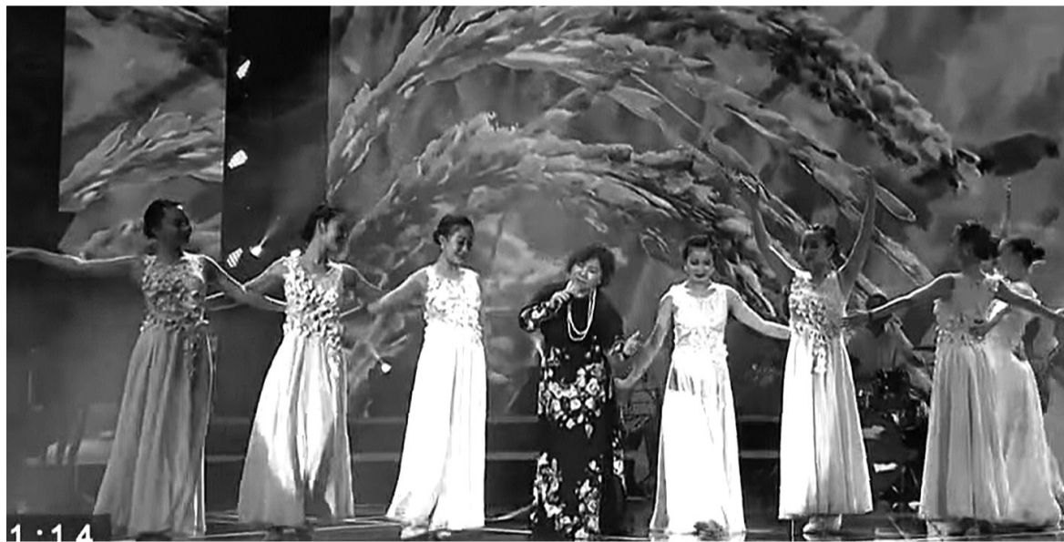
● NSND Thanh Hoa biểu diễn ca khúc “Mùa xuân làng lúa làng hoa” của nhạc sĩ Ngọc Khuê.

Dường như, những điều gì đẹp đẽ, thiêng liêng nhất, lại chính là những điều bình dị nhất. Xuất hiện trong những khúc ca mùa xuân bất hủ thường không phải những điều gì lớn lao, phi thường, chỉ là những cánh én nhỏ, làn khói lung trời, là công trường sôi nổi, hay vẻ đẹp giản dị những vật lúa, đồng hoa như trong ca khúc “Mùa xuân làng lúa làng hoa” của nhạc sĩ Ngọc Khuê viết vào cuối năm 1980. Nhạc sĩ đã chia sẻ về bối cảnh ông sáng tác bài hát như sau: “Tôi vốn là người Hà Tây nhưng sống tại Hà Nội. Từ rất lâu tôi muốn viết một ca khúc về mùa xuân Hà Nội, nhưng chưa tìm được tứ. Rồi một chiều đông năm 1981, khi đạp xe đi thăm người bạn ở gần hồ Tây, tôi mới phát hiện ra rằng hồ Tây không chỉ có làng hoa, mà còn có cánh đồng lúa xanh mướt, tôi muốn ví đó là những làng lúa. Phát hiện đó đã khiến tôi bật ra câu hát: “Bên lúa, anh bên lúa, cánh đồng làng ven đê. Hồ Tây xanh mênh mông trong tươi thắm nắng chiều. Làng em làng hoa, hoa thơm ngát bốn mùa...”. Từ câu hát đầu tiên ấy, về nhà tôi đã viết xong bài hát mà hầu như không phải chỉnh sửa nhiều”. Bài hát đã giúp nhạc sĩ Ngọc Khuê được nhận Giải thưởng Nhà nước về Văn học Nghệ thuật năm 2017.