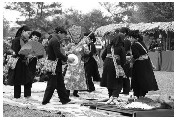
● Pú mo chủ trì lễ cúng tại Lễ hội Lồng Tồng.

Những ngày giáp Tết, tại các tỉnh, thành, không khí đón Tết cổ truyền tràn ngập trên khắp mọi nẻo đường, thu hút du khách. Các chương trình, lễ hội mang đậm bản sắc văn hóa Tết truyền thống được “trình làng” tươi vui, rộn rã đong đầy niềm hy vọng vào một năm mới Ất Tỵ hưng khởi, sung túc. Các lễ hội năm nay đa dạng hoạt động tái hiện mỹ tục cổ truyền ngày Tết, khơi dậy tình yêu đất nước và tôn vinh giá trị văn hóa, ẩm thực đặc trưng của mảnh đất hình chữ S.