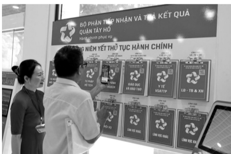
● Công chức bộ phận một cửa của quận Tây Hồ hướng dẫn người dân đến tra cứu thủ tục CCHC.

Tại quận Tây Hồ, công tác cải cách hành chính đang từng bước nâng cao chất lượng để đáp ứng việc xây dựng chính quyền số của TP Hà Nội.