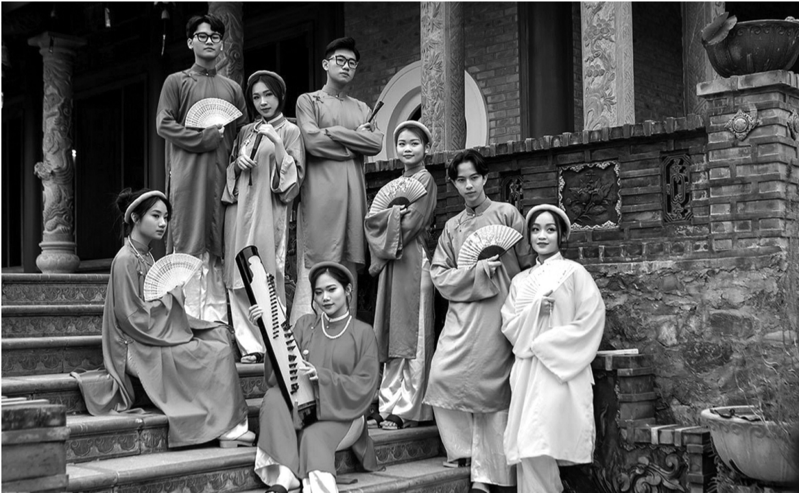
● Ngoài áo dài, những bộ Việt phục đang được nhiều người trẻ lựa chọn để chụp ảnh du xuân, đón Tết.