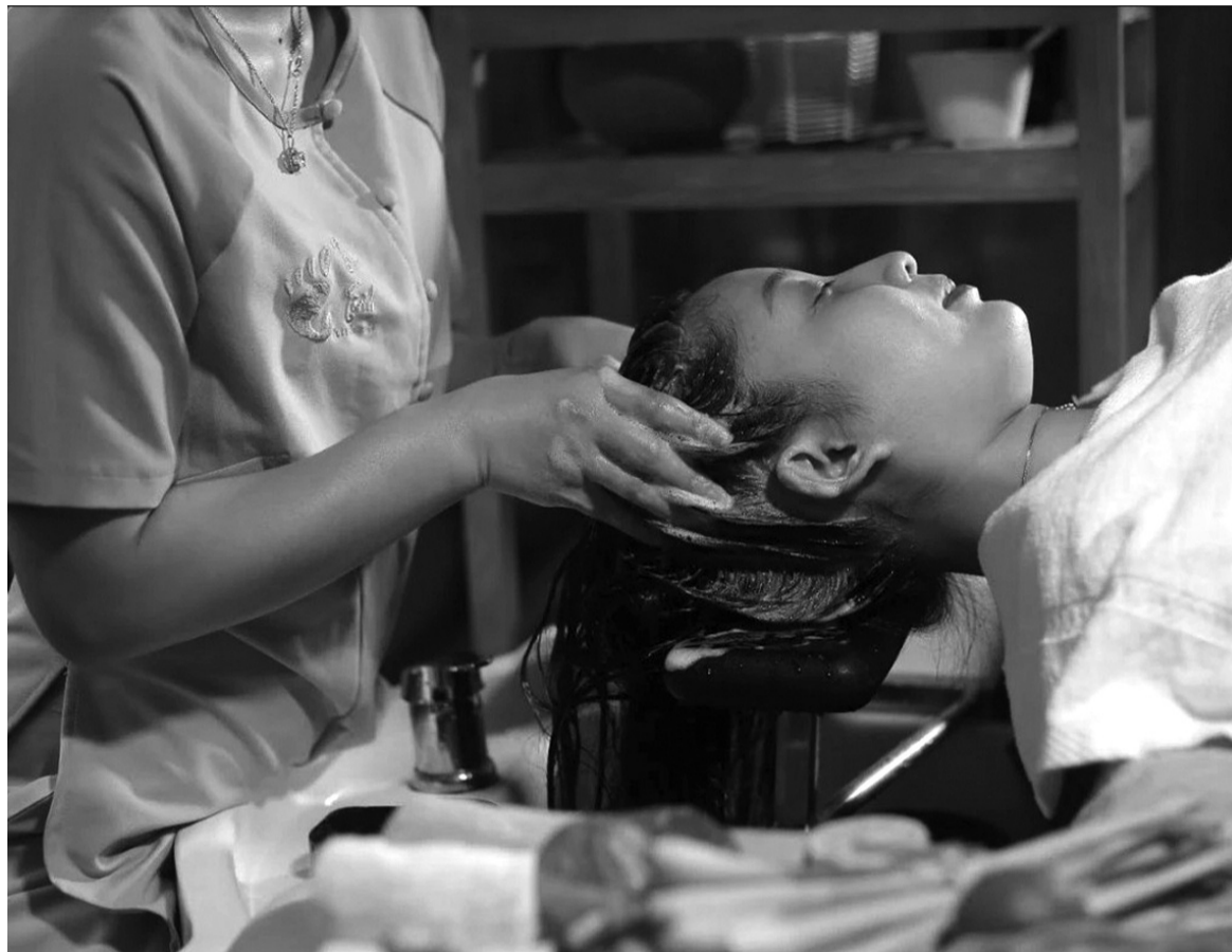
● Gội đầu dưỡng sinh - xu hướng thịnh hành của dân công sở.

Được biến đến là liệu pháp thư giãn hiệu quả, gội đầu dưỡng sinh đang ngày càng được ưa chuộng tại Việt Nam. Sự kết hợp hài hòa giữa liệu pháp gội đầu và dưỡng sinh không chỉ mang đến cảm giác thư giãn mà còn đem lại nhiều lợi ích cho sức khỏe thể chất và tinh thần.