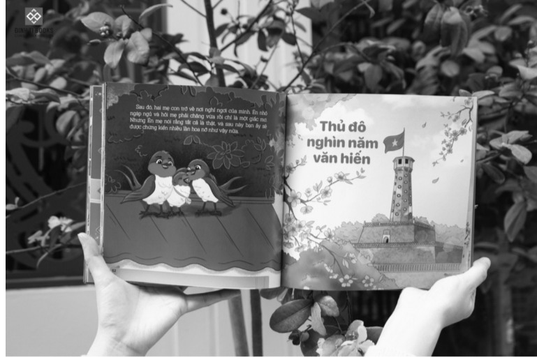
● Dù là đọc để thưởng thức hay làm quà tặng, sách Tết mang giá trị của sự sẻ chia và kết nối.

Khi nhắc đến Tết, ta thường nghĩ đến mâm cơm đoàn viên, sắc mai đào khoe sắc hay những phong tục cổ truyền. Nhưng trong nhịp sống hiện đại, có một món quà tinh thần đang dần trở thành biểu tượng của mùa xuân: sách Tết. Đó không chỉ là những trang viết đơn thuần mà còn là hơi thở của Tết xưa hòa quyện với Tết nay, là những lát cắt tinh tế từ cuộc sống, văn hóa, nghệ thuật được gói ghém trong từng dòng chữ, trang giấy.