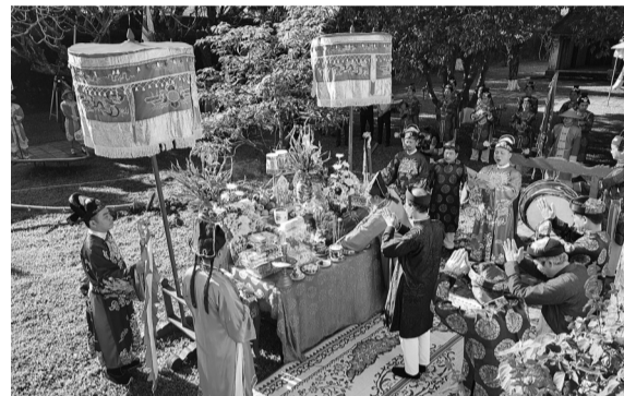
● Dịp Tết nguyên đán 2025, Trung tâm Bảo tồn di tích Cố đô Huế sẽ tái hiện các nghi thức dựng nêu đúng theo nghi lễ truyền thống của triều Nguyễn.