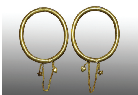
● Vòng vàng.