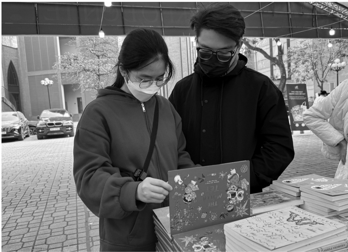
● Các bạn trẻ quan tâm nhiều hơn đến các ấn phẩm sách Tết được thiết kế tinh xảo, nội dung hấp dẫn.

Khi nhắc đến Tết, ta thường nghĩ đến mâm cơm đoàn viên, sắc mai đào khoe sắc hay những phong tục cổ truyền. Nhưng trong nhịp sống hiện đại, có một món quà tinh thần đang dần trở thành biểu tượng của mùa xuân: sách Tết. Đó không chỉ là những trang viết đơn thuần mà còn là hơi thở của Tết xưa hòa quyện với Tết nay, là những lát cắt tinh tế từ cuộc sống, văn hóa, nghệ thuật được gói ghém trong từng dòng chữ, trang giấy.