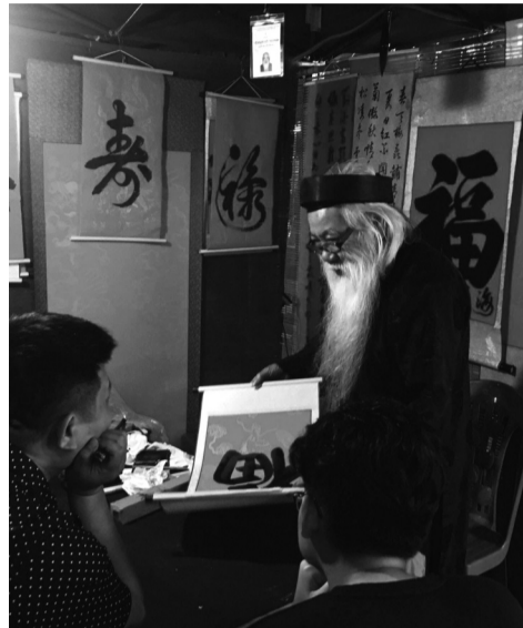
● Tết Nguyên đán ở thành thị hay thôn quê cũng đã và đang gìn giữ những nét đẹp văn hóa.

Khi những tia nắng ấm áp của mùa xuân bắt đầu chiếu rọi qua những đám mây màu xám bạc còn sót lại của đông chí, khắp phố phường ở mọi tỉnh, thành tại Việt Nam lại bùng lên sức sống của một năm mới. Dù có những khác biệt về không khí đón Tết Nguyên đán ở làng quê và thành phố. Nhưng tựu trung lại, Tết cổ truyền vẫn là thời gian sum họp gia đình, tưởng nhớ ông bà, tổ tiên.