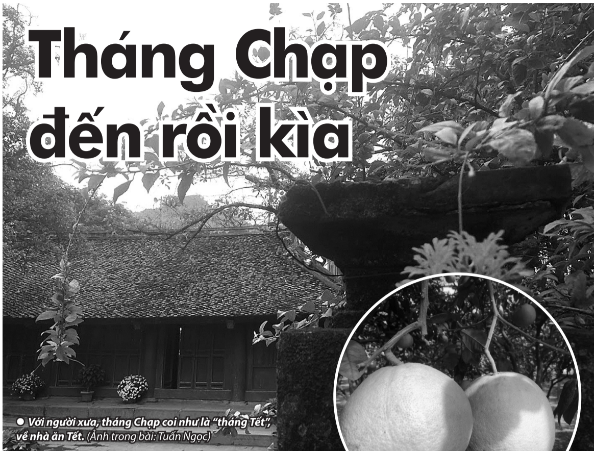
● Với người xưa, tháng Chạp coi như là “tháng Tết”, về nhà ăn Tết.

Mai Thảo - một người gốc Bắc (sinh ở Hải Hậu, Nam Định, quê gốc ở Gia Lâm, theo học ở Hà Nội) nên giọng văn trau chuốt, sâu sắc lắm. Cách ông tiếc nuối tháng Chạp như tiếc nuối phận người, thời gian trôi làm nhớ thương yêu mình, thương khung cảnh cũ, người xưa. Ngày tháng Chạp trôi qua tích tắc, nghe như sự tiễn biệt từ từ mà không ai bắt nó dừng lại được. Tất cả xuôi theo dòng, Mai Thảo nhìn chuyển động đó, thao thức, day dứt với