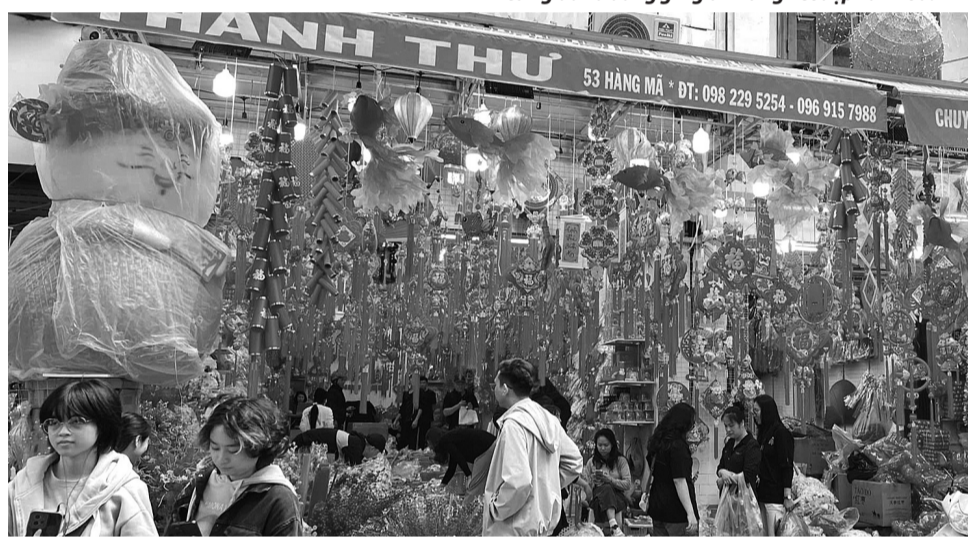
● Gắn Tết Nguyên đán, phố phường Hà Nội tràn ngập sắc đỏ rực rỡ.

Khi những tia nắng ấm áp của mùa xuân bắt đầu chiếu rọi qua những đám mây màu xám bạc còn sót lại của đông chí, khắp phố phường ở mọi tỉnh, thành tại Việt Nam lại bùng lên sức sống của một năm mới. Dù có những khác biệt về không khí đón Tết Nguyên đán ở làng quê và thành phố. Nhưng tựu trung lại, Tết cổ truyền vẫn là thời gian sum họp gia đình, tưởng nhớ ông bà, tổ tiên.