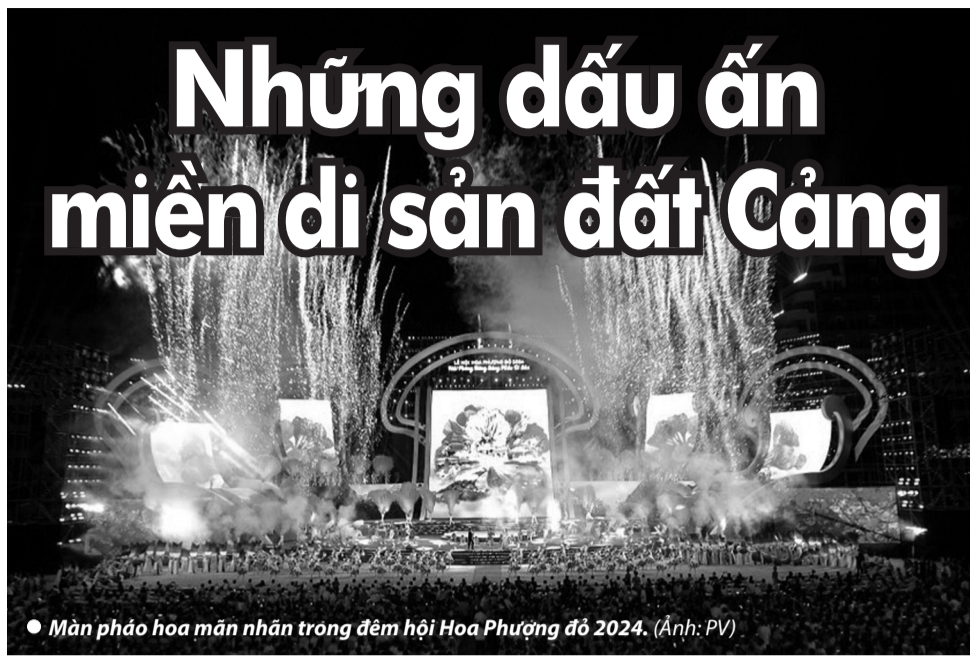
● Màn pháo hoa mãn nhãn trong đêm hội Hoa Phượng đỏ 2024.

Song song đó, công tác bảo tồn và phát huy giá trị di sản văn hoá tiếp tục có những điểm nổi bật: Phối hợp với các địa phương xây dựng 02 hồ sơ khoa học Di tích lịch sử khu vực Từ Lương Xâm - căn cứ bán doanh của Ngô Quyền năm 938 và Cùm di tích liên quan đến nhà Mạc trình Bộ Văn hoá, Thể thao và Du lịch, đề nghị Thủ tướng Chính phủ xếp hạng di tích cấp quốc gia đặc biệt. Xây dựng và trình các cấp Hồ sơ đề nghị xét công nhận Bảo vật quốc gia đối với bộ kim phẩm đền Nghè. Di sản văn hóa phi vật thể Lễ hội kỳ phúc xã Tân Viên, huyện An Lão được Bộ Văn hoá, Thể thao và Du lịch đưa vào Danh mục Di sản văn hóa phi vật thể quốc gia. 02 di tích là đền thờ Lê Khắc Cẩn, xã An Thọ, huyện An Lão và Nhà lưu niệm Chủ tịch Tôn Đức Thắng, xã Tiên Cường, huyện Tiên Lãng, thành phố Hải Phòng được Bộ Văn hóa, Thể thao và Du lịch quyết định xếp hạng là Di tích cấp quốc gia. Tham mưu xếp