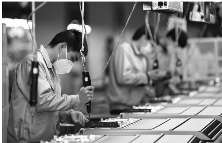
● Việt Nam sở hữu lực lượng lao động trẻ, có trình độ học vấn ngày càng cao, sẵn sàng đáp ứng các yêu cầu của nền kinh tế số.

Ngân hàng Thế giới (WB) và Ngân hàng Phát triển châu Á (ADB) đều dự báo triển vọng