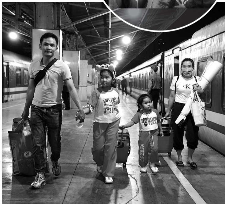
● Những chuyến tàu chở mùa xuân yêu thương tới mọi nhà: (Ảnh: Nguyễn Anh)