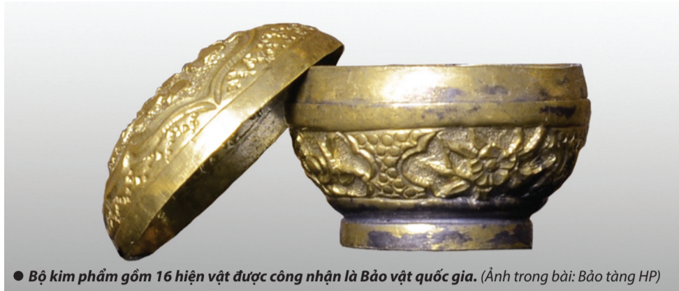
● Bộ kim phẩm gồm 16 hiện vật được công nhận là Bảo vật quốc gia.

Theo đánh giá của các chuyên gia, bộ kim phẩm đền Nghè là hiện vật gốc, độc bản, chưa thấy xuất hiện trong các di tích và bảo tàng ở Việt Nam. Bộ kim phẩm đền Nghè lần đầu tiên được giới thiệu đến công chúng trong trưng bày chuyên đề: “Bảo vật quốc gia - Suu tập An Biên” tại Bảo tàng Hải Phòng vào tháng 5/2024 trong chuỗi các sự kiện của Lễ hội Hoa Phượng Đỏ 2024 Hải Phòng - Bùng sáng miền di sản, thu hút sự quan tâm, thưởng ngoạn của đông đảo công chúng và du khách thập phương.