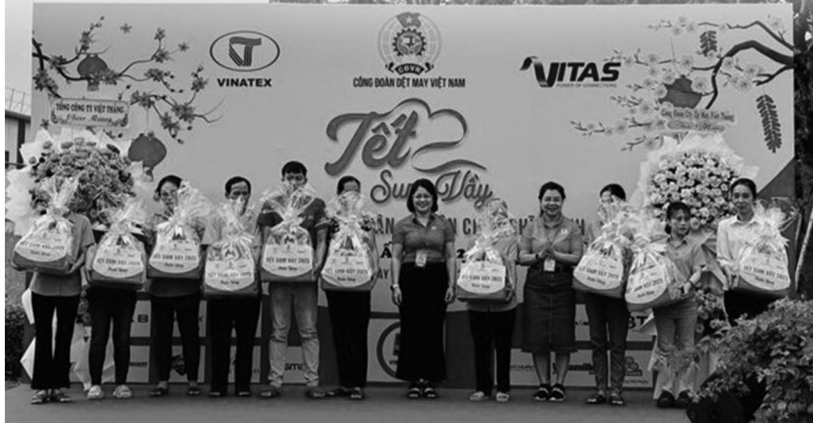
● Trao tặng quà Tết Ất Tỵ năm 2025 cho đoàn viên, NLĐ có hoàn cảnh khó khăn tại Tết Sum vầy ở Tổng Công ty Việt Thắng - CTCP.