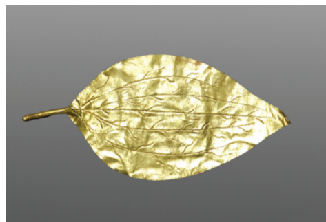
● Lá trầu vàng.

Trải qua thăng trầm của lịch sử, các hiện vật bằng vàng tại đền Nghè được chế tác vào giai đoạn này được bảo quản, gìn giữ khá nguyên vẹn, phản ánh tài nghệ khéo léo, tinh tế của các bậc thầy nghệ nhân kim hoàn từ xa xưa. Minh văn trên các hiện vật thể bài là mỹ tự về Thánh mẫu Lê Chân do các vua triều Nguyễn gia phong “Trang Huy Thượng Đẳng Thần”, “Dực Bảo Trung Hưng”... các mỹ tự trên vừa góp phần xác định niên đại cho bộ kim phẩm, đồng thời thể hiện được tính thiêng, ngưỡng vọng của Nhân dân đối với một nữ tướng gắn liền với lịch sử, truyền thống yêu nước, dựng nước và giữ nước của người Hải Phòng xưa. Những tấm thẻ bài được tạo tác cẩn trọng với những cụm đề tài mang ý nghĩa mật thiết với chức sắc trong cung đình, qua đó thể hiện được tư duy về sự tiếp nối giữa truyền thống với đương thời, giữa quá khứ và thực tại của triều đình nhà Nguyễn với những vị anh hùng đã để lại chiến công oanh liệt cũng là sự khẳng định về chủ quyền đất nước từ những thế kỷ đầu Công nguyên đến thế kỷ XX và kế thừa đến ngày nay.