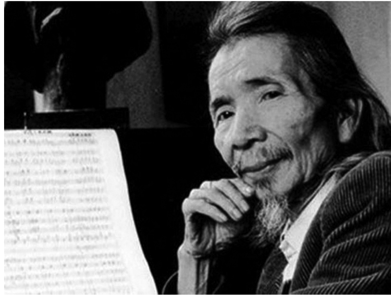
● Nhạc sĩ Văn Cao - tác giả ca khúc “Mùa xuân đầu tiên”.

Những ngày giáp Tết thật rộn ràng bởi những khúc ca xuân. Trong đó, không thể nào thiếu những ca khúc bất hủ đã đi cùng âm nhạc Việt nhiều thập kỉ. Đó không chỉ là bản hòa ca của niềm vui, tình yêu mà còn là giai điệu của những kí ức hào hùng đẹp đẽ, của niềm tin và hy vọng vào tương lai tươi sáng.