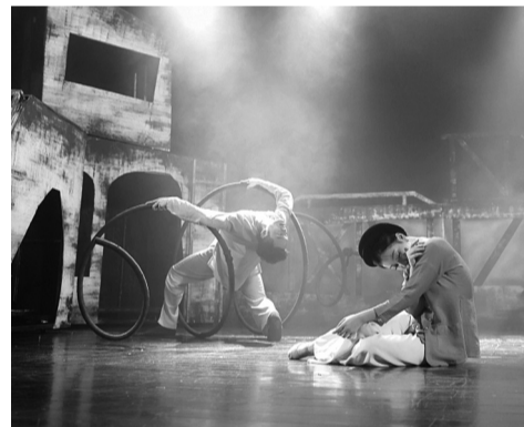
● Cảnh trong vở nhạc kịch Bi vô.

Với quan điểm, văn hóa là một dạng tài nguyên, công nghiệp văn hóa là việc ứng dụng công nghệ, tổ chức khai thác tài nguyên đó phục vụ cho phát triển thành phố, Hải Phòng đã và đang tập trung khai thác bề dày truyền thống văn hóa của mảnh đất cửa biển - nơi đang sở hữu nguồn tài nguyên di sản văn hóa dồi dào