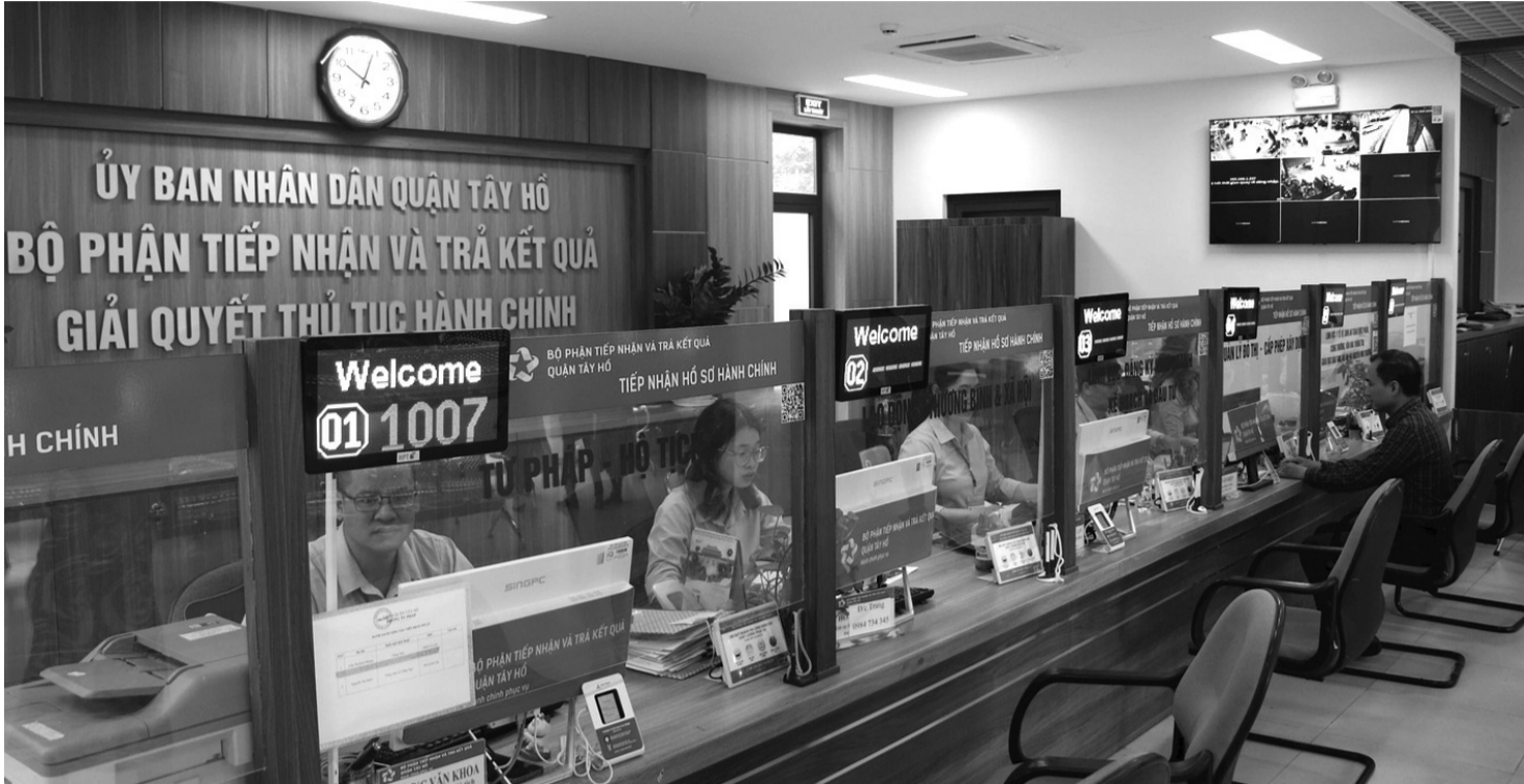
● Bộ phận một cửa của UBND quận Tây Hồ.