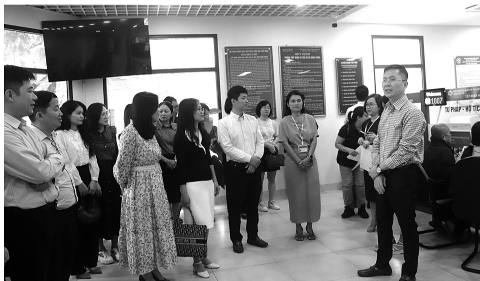
● Các đại biểu Lớp bồi dưỡng công tác CCHC thành phố Hà Nội năm 2024 tham quan bộ phận một cửa UBND Quận Tây Hồ.

Giải pháp song ngữ hóa tài liệu đã giúp số lượt công dân nước ngoài được bộ phận một cửa tiếp tăng lên gấp đôi, thậm chí là gấp 3 so với trước đây. Hiện quận