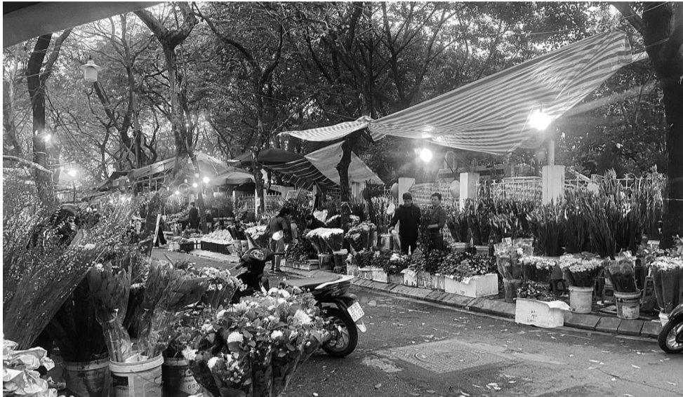
● Chợ Tết lúc nào cũng đông vui, nhộn nhịp.