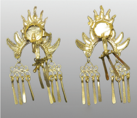
● Bông tai vàng.

Bộ kim phẩm gồm 16 hiện vật bằng vàng được chế tác từ thời Nguyễn đầu thế kỷ 20 được cung tiến Thánh mẫu Lê Chân tại đền Nghè, thành phố Hải Phòng vừa được Thủ tướng Chính phủ công nhận là Bảo vật quốc gia.