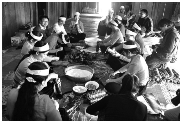
● Không gian gói bánh chưng tại nhà dân tộc Mường.