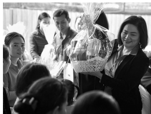
● Quà Tết sớm cho công nhân Huế.

Thưởng Tết là mong muốn chung của rất nhiều người lao động (NLĐ) hiện nay, bởi ngoài có thêm một khoản tiền, đây còn là niềm động viên tinh thần rất lớn, thể hiện sự quan tâm của doanh nghiệp đối với NLĐ. Đặc biệt, trong giai đoạn sản xuất - kinh doanh gặp nhiều khó khăn như những năm qua, điều này càng trở nên trân quý hơn.