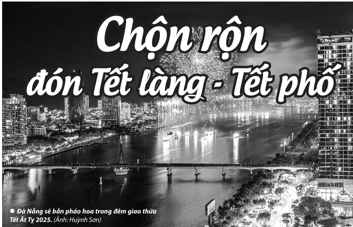
● Đà Nẵng sẽ bắn pháo hoa trong đêm giao thừa Tết Ất Tỵ 2025. (Ảnh: Huỳnh Sơn)

Tại huyện Lâm Bình (Tuyên Quang), lễ hội Lồng Tồng và Ngày hội Văn hóa các dân tộc sẽ diễn vào ngày 8/2/2025. Đây là một trong những lễ hội đặc sắc nhất của đồng bào dân tộc Tày, Mông và Dao... thể hiện