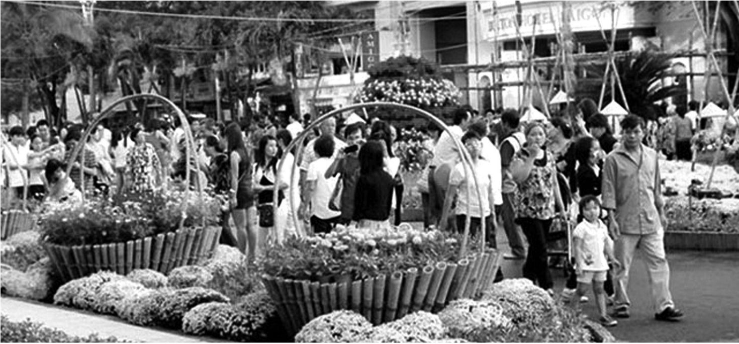
● Chuẩn bị tốt các điều kiện phục vụ Nhân dân đón Tết Nguyên đán Ất Tỵ vui tươi, lành mạnh, an toàn, tiết kiệm.

Đất nước ta đón Tết Nguyên đán Ất Tỵ năm 2025 cùng dịp kỷ niệm 95 năm Ngày thành lập Đảng, cả nước đang tập trung tăng tốc, bứt phá thực hiện thắng lợi Nghị quyết Đại hội Đảng toàn quốc lần thứ XIII và nghị quyết Đại hội Đảng bộ các cấp, đồng thời chuẩn bị tổ chức đại hội đảng bộ các cấp nhiệm kỳ 2025 - 2030 tiến tới Đại hội XIV của Đảng, đưa đất nước bước vào kỷ nguyên mới.