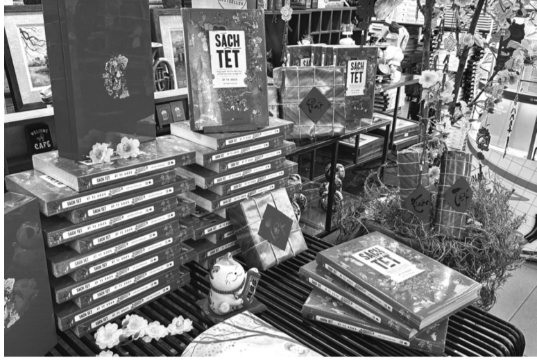
● Sách Tết là món quà ý nghĩa mang hương sắc mùa xuân.