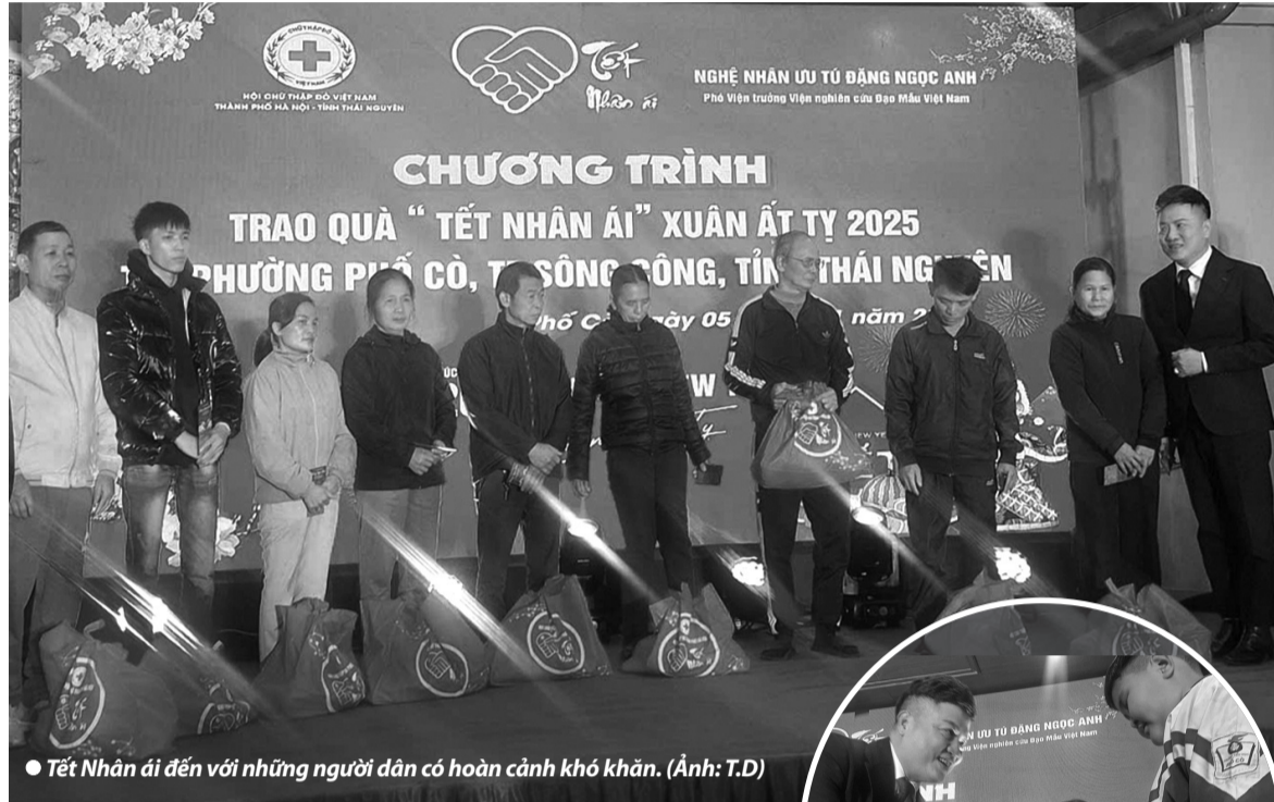
● Tết Nhân ái đến với những người dân có hoàn cảnh khó khăn.