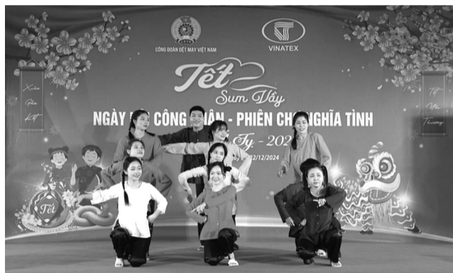
● Các nữ công nhân tham gia một tiết mục văn nghệ tại chương trình.