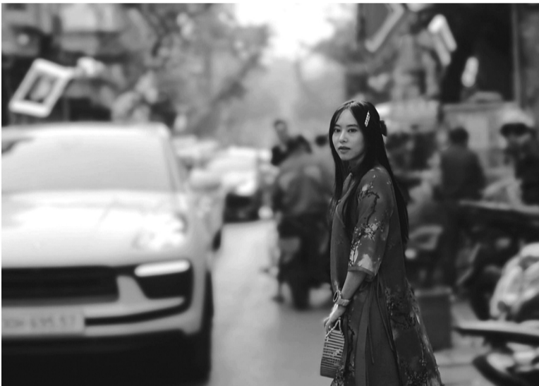
● Áo dài truyền thống là sự lựa chọn của Bạch Dương vào dịp Tết đến, Xuân về.