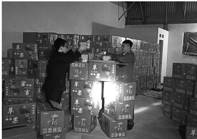
● Hàng loạt vụ tàng trữ, vận chuyển trái phép pháo quy mô lớn đã bị lực lượng công an các đơn vị, địa phương triệt phá.

Với mong muốn kết thúc năm cũ, đón chào năm mới thật tốt đẹp, thời gian qua, Chính phủ đã chỉ đạo các cấp, các ngành, địa phương, đơn vị, doanh nghiệp... tăng cường biện pháp bảo đảm đón Tết Nguyên đán Ất Tỵ năm 2025 vui tươi, lành mạnh, an toàn, tiết kiệm. Trong đó, yếu tố an toàn được quan tâm đặc biệt trong bối cảnh hiểm họa từ các hoạt động đón Tết vẫn luôn hiện hữu.