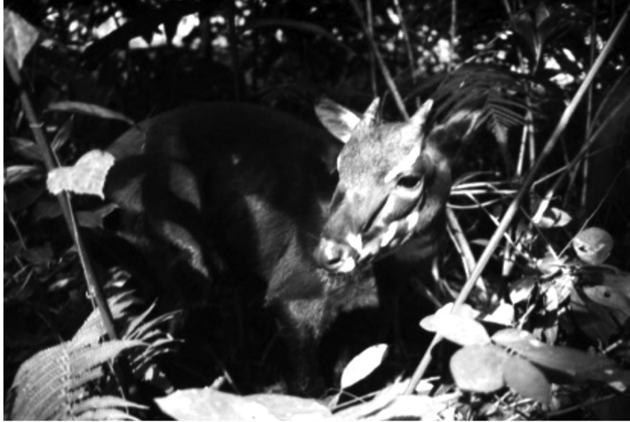
● Hành trình truy tìm dấu vết tự nhiên và bảo tồn sao la là minh chứng về nỗ lực bảo tồn dài hơi, bền bỉ với sự chung tay của cả hệ thống chính trị, toàn xã hội. (Ảnh sao la trong tự nhiên: WWF Việt Nam)

Từ các chương trình bẫy ảnh tại rừng Trung Trường Sơn đến các chiến dịch nâng cao nhận thức cộng đồng, mỗi bước đi đều hướng đến việc tìm kiếm dấu vết và bảo vệ môi trường sống tự nhiên của loài thú quý hiếm này. Năm 1996 và 1998, các cá thể sao la từng được đưa vào nuôi nhốt nghiên cứu nhưng chưa thành công. Tuy vậy, các khu rừng nguyên sinh như Khu dự trữ thiên nhiên Động Châu - Khe Nước Trong vẫn được xem là "mái nhà hy vọng" của loài này - nơi các biện pháp bảo tồn sinh cảnh và mô hình bảo vệ rừng bền vững đang được triển khai để bảo vệ sự sống còn của sao la và hệ sinh