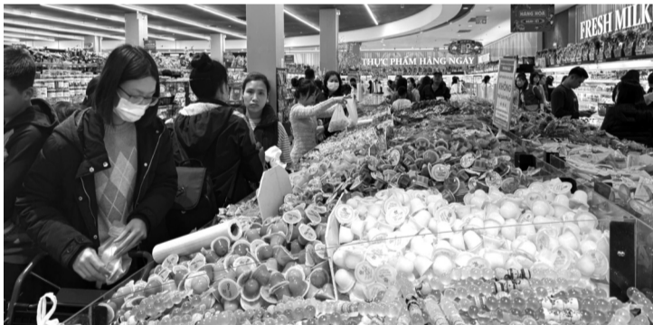
● Bảo đảm nguồn cung và đa dạng hàng hóa phục vụ Tết Nguyên đán 2025.