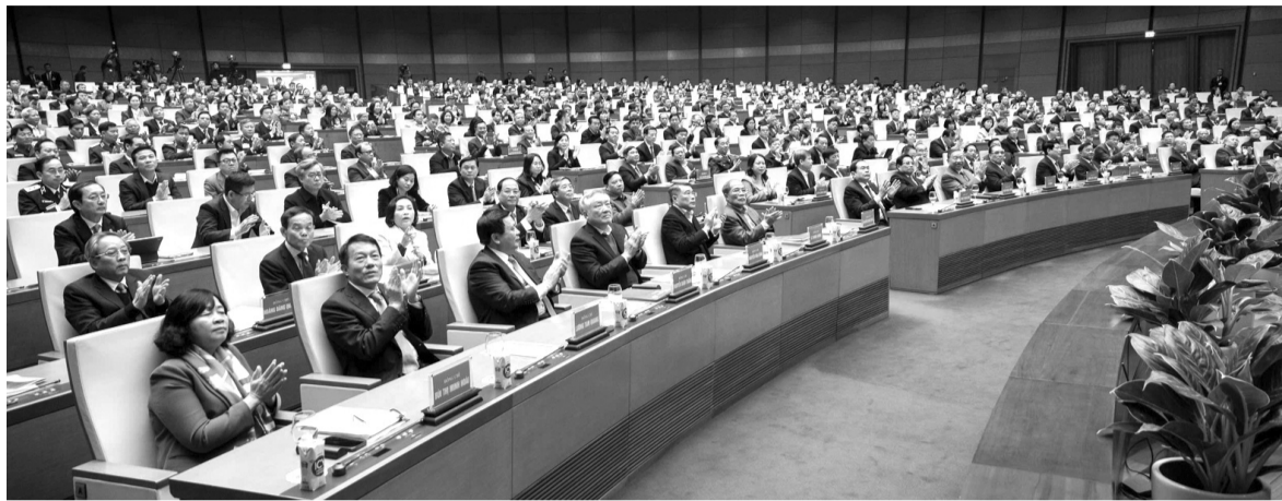
● Tổng Bí thư Tô Lâm và các đồng chí lãnh đạo, nguyên lãnh đạo Đảng, Nhà nước dự Hội nghị tại điểm cầu Trung ương.

Sáng 13/1, tại Hội trường Diên Hồng - Nhà Quốc hội, Ban Bí thư Trung ương Đảng tổ chức Hội nghị toàn quốc về đột phá phát triển khoa học, công nghệ, đổi mới sáng tạo và chuyển đổi số quốc gia. Tổng Bí thư Tô Lâm dự và phát biểu chỉ đạo Hội nghị.