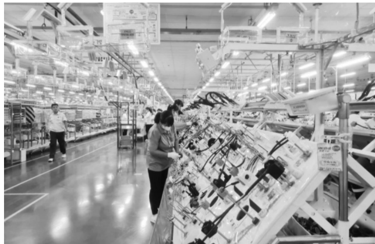
● Năm 2024, các chính sách hỗ trợ doanh nghiệp đã có những tác động tích cực, được phản ánh qua số doanh nghiệp gia nhập và tái gia nhập thị trường trong năm đạt mức cao.

quay trở lại hoạt động trong năm 2024 đạt mức cao nhất từ trước đến nay, vượt mức 70 nghìn doanh nghiệp tái gia nhập thị trường trong một năm; đồng thời, các doanh nghiệp đang hoạt động trong nền kinh tế đẩy mạnh việc mở rộng hoạt động sản xuất kinh doanh hơn so với năm trước: số vốn đăng ký bổ sung của doanh nghiệp đang hoạt động vào nền kinh tế trong năm 2024 đạt trên 2 triệu tỷ đồng, tăng 3,6% so với năm 2023.