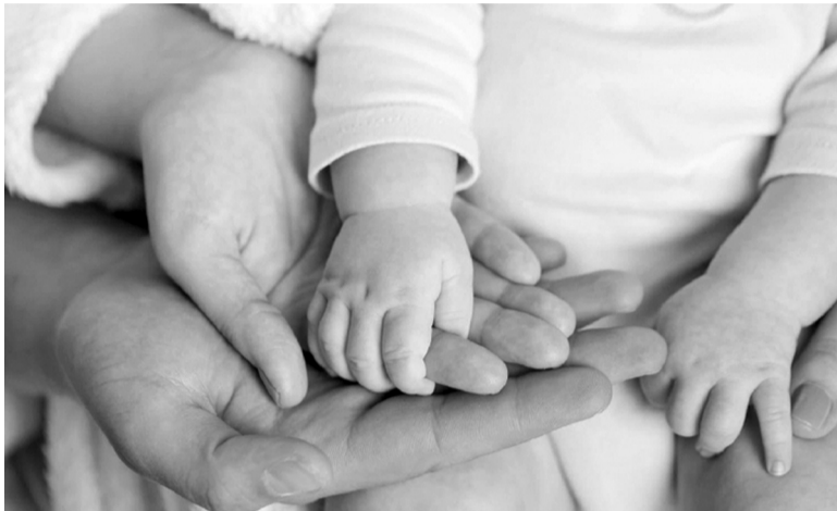
● Hồ sơ của người nhận con nuôi bị tẩy xóa thì không có giá trị sử dụng.

Chính phủ vừa ban hành Nghị định 06/2025/NĐ-CP sửa đổi, bổ sung một số điều của các Nghị định về nuôi con nuôi; trong đó có nội dung quy định về hồ sơ của người nhận con nuôi trong nước. Nghị định này có hiệu lực từ ngày 8/1/2025.