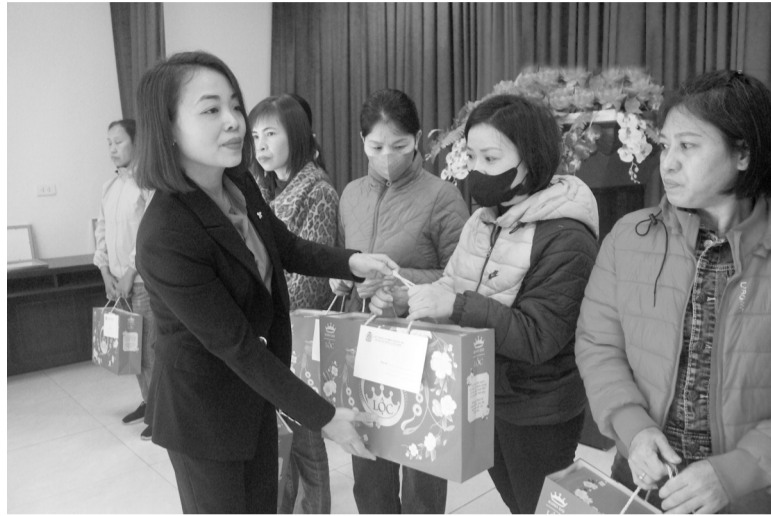
● Trong dịp Tết Nguyên đán Ất Tỵ 2025 sắp tới, Liên đoàn Lao động tỉnh Phú Thọ đã quyết định hỗ trợ gần 4.000 suất quà Tết cho đoàn viên và người lao động có hoàn cảnh khó khăn, đặc biệt khó khăn trên địa bàn.