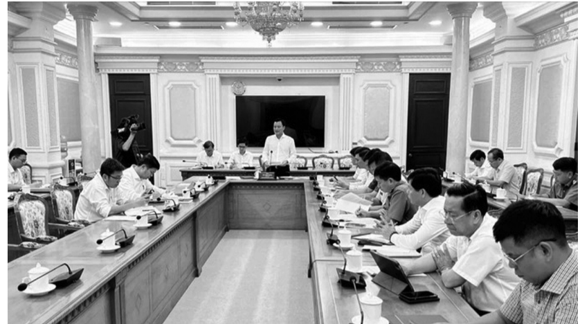
● Phó Chủ tịch UBND TP HCM Bùi Xuân Cường chủ trì cuộc họp.

Hôm qua (13/1), UBND TP HCM tổ chức cuộc họp về tình hình giao thông trên địa bàn TP, tập trung giải quyết vấn đề ùn tắc giao thông cuối năm, đặc biệt tại một số khu vực trọng điểm như sân bay Tân Sơn Nhất; cảng Cát Lái - Phú Hữu, bến xe, nhà ga... Cuộc họp do Phó Chủ tịch UBND TP HCM Bùi Xuân Cường chủ trì.