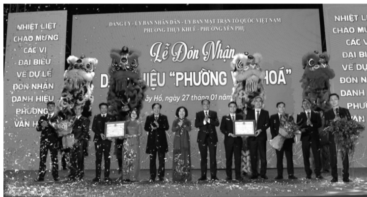
● Lãnh đạo quận Tây Hồ, Hà Nội trao Quyết định công nhận danh hiệu “Phường văn hóa” đối với phường Thụy Khuê.