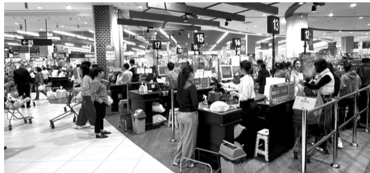
● Triển khai chính sách bình ổn giá, nhằm cung ứng các mặt hàng thiết yếu với mức giá hợp lý.

Dịp Tết Nguyên đán 2025 đang đến gần, nhu cầu tiêu dùng của người dân TP Hải Phòng đang sôi động hơn bao giờ hết. Các cửa hàng, siêu thị, trung tâm thương mại và các chợ truyền thống trên địa bàn TP đã chủ động triển khai các kế hoạch cung ứng hàng hóa thiết yếu, nhằm bảo đảm một mùa Tết trọn vẹn cho người dân.