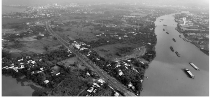
● Một góc cù lao Phố nhìn từ trên cao.

Đồng Nai vừa chính thức khởi động dự án Aeon Mall Biên Hòa có tổng mức đầu tư 6.000 tỷ đồng, quy mô rộng gần 12ha. Đây là công trình mở đầu năm trong “siêu dự án” Khu đô thị (KĐT) Hiệp Hòa với mục tiêu phát triển kinh tế và hạ tầng để “đánh thức” khu vực cù lao Phố, phường Hiệp Hòa, TP Biên Hòa.