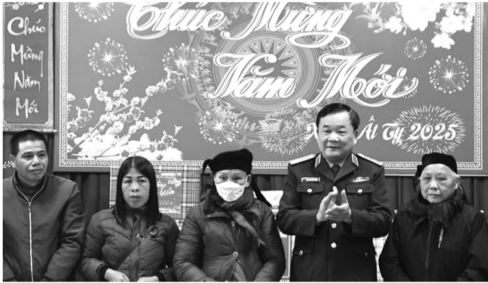
● Thượng tướng Hoàng Xuân Chiến tặng quà người dân ở Lạng Sơn.