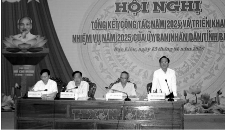
● Chủ tịch UBND tỉnh Bạc Liêu Phạm Văn Thiều phát biểu tại Hội nghị.

Tại buổi tọa đàm, các nhà khoa học đã giới thiệu đến đại biểu các nghiên cứu về giảm thiểu phát thải khí mê-tan từ những cánh đồng lúa, công cụ giám sát lúa gạo, thiết kế bản đồ phát thải khí mê-tan, cách đo mực nước và khí mê-tan phát thải... Theo các nhà khoa học, với phương pháp canh tác truyền thống, cây lúa được tưới ngập nước liên tục trong suốt chu kỳ sinh trưởng. Điều này tạo môi trường yếm khí tăng cường quá trình phân hủy chất hữu cơ, làm hình thành và giải phóng khí mê-tan. Tuy nhiên, phương pháp canh tác ngập nước không liên tục được chứng minh có thể làm giảm 40 - 50% lượng khí mê-tan phát thải và ít