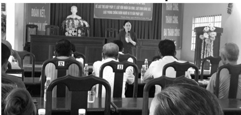
● Các buổi nói chuyện chuyên đề giúp đưa pháp luật đến với người dân.

Nhiều năm qua, công tác tuyên truyền, phổ biến, giáo dục pháp luật (PBGDPL) luôn được tỉnh Hậu Giang triển khai hiệu quả với nội dung đa dạng, phong phú, hình thức mới mẻ, hấp dẫn. Sở Tư pháp Hậu Giang thường xuyên tham mưu UBND tỉnh tạo điều kiện và tăng cường nhiều giải pháp hỗ trợ người dân tiếp cận pháp luật.