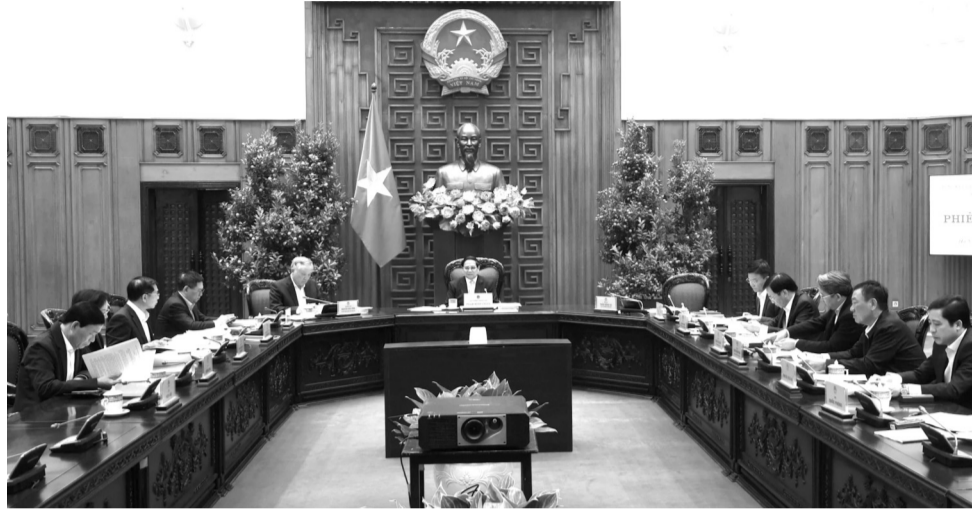
● Quang cảnh Phiên họp lần thứ 10 Ban Chỉ đạo tinh gọn bộ máy của Chính phủ.

Theo Ban Chỉ đạo, thực hiện ý kiến chỉ đạo của Bộ Chính trị, Ban Chỉ đạo Trung ương về sắp xếp tổ chức bộ máy của Chính phủ, các Bộ, ngành và Ban Chỉ đạo của Chính phủ đã hoàn thiện thêm một bước