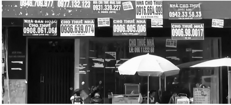
● Một mặt bằng treo biển cho thuê đã lâu ở khu vực trung tâm TP Hồ Chí Minh.

con đường vốn được coi là “đất vàng” nay cũng vắng bóng người thuê. Các biển hiệu “cho thuê mặt bằng” mọc lên ngày càng nhiều và ngay cả những vị trí đắc địa cũng không thu hút được khách hàng.