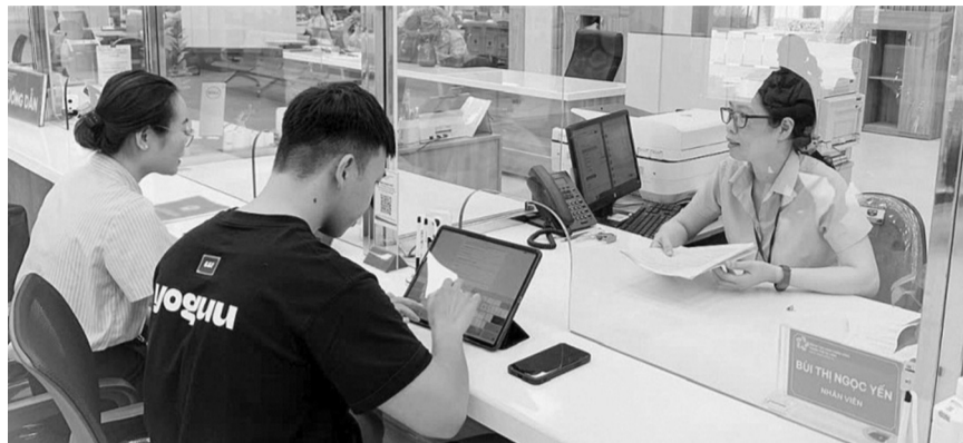
● Cán bộ Trung tâm hành chính công hướng dẫn người dân thực hiện dịch vụ công trực tuyến.

Về kinh tế số, tỉnh đã hoàn thành các nhiệm vụ trọng tâm, gồm triển khai thanh toán không dùng tiền mặt trong khu vực công và trong Nhân dân; 100% các dịch vụ thiết yếu của xã hội như y tế, giáo dục, điện, nước, viễn