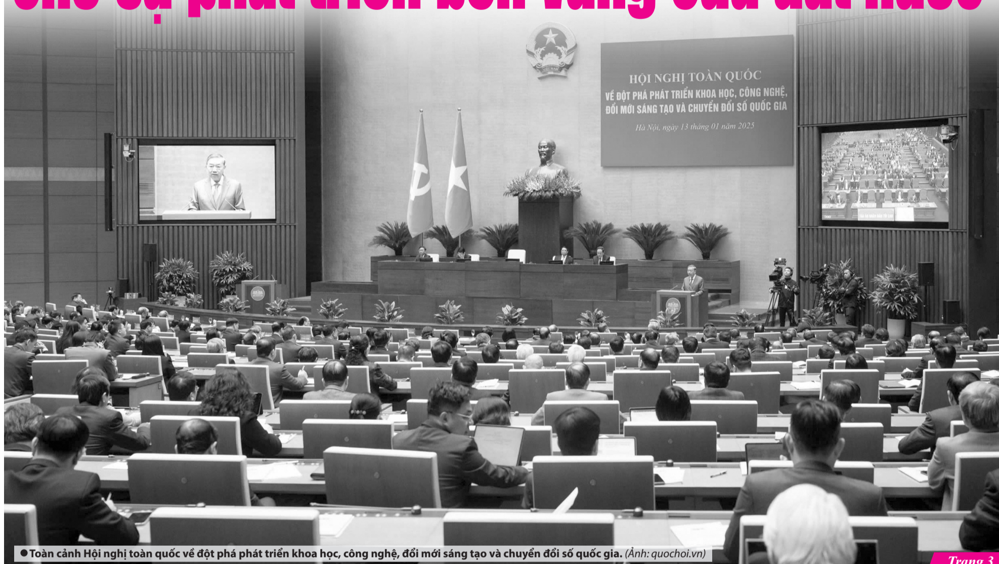
● Toàn cảnh Hội nghị toàn quốc về đột phá phát triển khoa học, công nghệ, đổi mới sáng tạo và chuyển đổi số quốc gia.