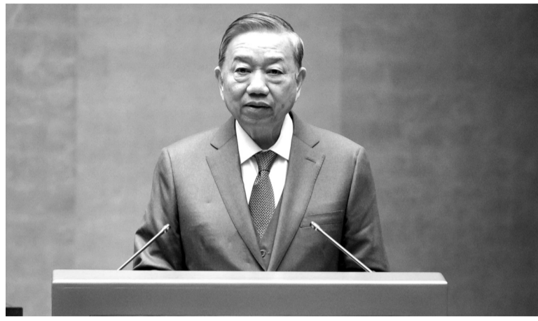
● Tổng Bí thư Tô Lâm phát biểu chỉ đạo tại Hội nghị.

2025 là năm đầu thực hiện Nghị quyết 57, do đó, Tổng Bí thư yêu cầu Chính phủ cần đổi mới kế hoạch bố trí ngân sách cho phát triển KHCCN, ĐMST&CĐS quốc gia. Tiến hành rà soát, điều chỉnh các đề án, dự án để đảm bảo phù hợp với Nghị quyết 57, tránh lãng phí, tập trung đầu tư hiệu quả, có trọng tâm. Đồng thời, cải cách triệt để quy trình phân bổ, quản lý và thanh quyết toán kinh phí, loại bỏ cơ chế “xin - cho” và các thủ tục rườm rà để tối ưu hóa nguồn lực và khuyến khích sáng tạo.