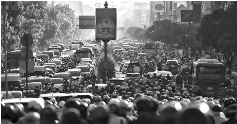
● Một cảnh ùn tắc giao thông tại TP HCM sáng 13/1/2025.

Với trường hợp "phạt nguội", lực lượng chức năng sẽ cho người vi phạm xem lại clip diễn biến của vi phạm vượt đèn đỏ trước khi lập biên bản.