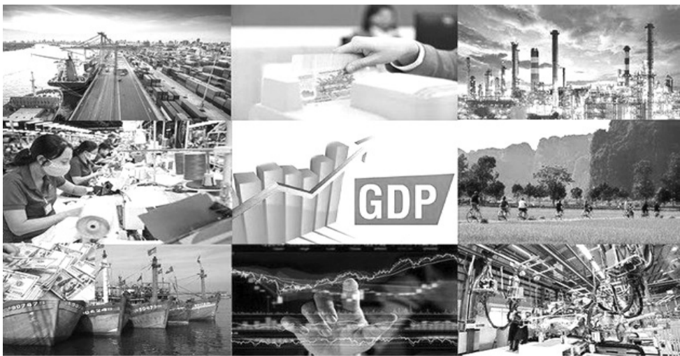
● Chính phủ yêu cầu năm 2025 phấn đấu tăng trưởng GDP hai con số trong điều kiện thuận lợi hơn. (Ảnh minh họa: VGP)

Chính phủ vừa ban hành Nghị quyết 01/NQ-CP về nhiệm vụ, giải pháp chủ yếu thực hiện Kế hoạch phát triển kinh tế - xã hội và dự toán ngân sách nhà nước năm 2025.