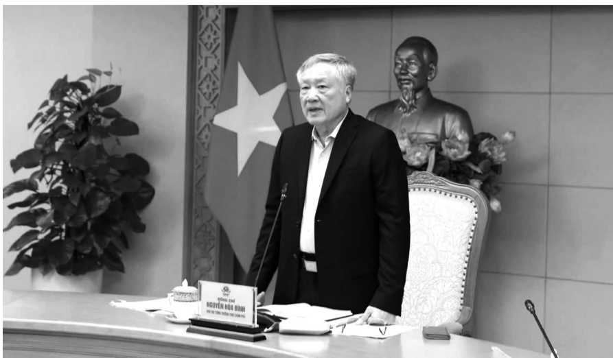
● Phó Thủ tướng Thường trực Chính phủ Nguyễn Hòa Bình.

Phó Thủ tướng Thường trực Chính phủ Nguyễn Hòa Bình, Phó Trưởng Ban Chỉ đạo của Chính phủ về tổng kết việc thực hiện Nghị quyết số 18-NQ/TW vừa đề nghị các Bộ trưởng, Thủ trưởng cơ quan ngang Bộ, cơ quan thuộc Chính phủ hoàn thiện phương án sắp xếp, tinh gọn tổ chức bộ máy của Bộ, ngành.