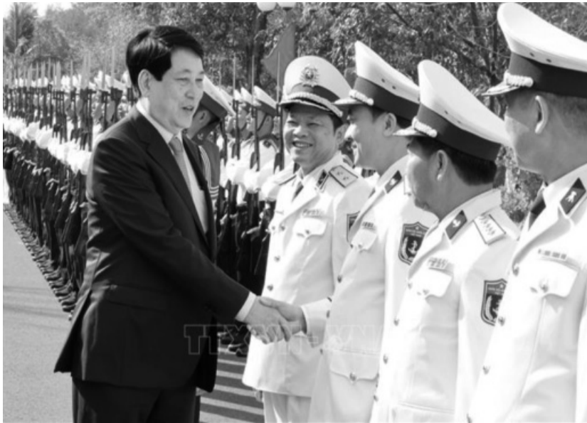
● Chủ tịch nước Lương Cường với cán bộ chỉ huy Bộ Tư lệnh Vùng 5 Hải quân.

Đồng thời, chủ động nắm bắt tình hình, sớm phát hiện và giải quyết kịp thời những vấn đề mới nảy sinh, không để bị động, bất ngờ trong mọi tình huống. Kiên quyết, kiên trì trong thực hiện nhiệm vụ bảo vệ chủ quyền biển, đảo; tinh táo, xử lý chuẩn xác những tình huống phức tạp trên biển theo đúng phương châm, đối sách. Kịp thời tham mưu với Đảng, Nhà nước, những giải pháp “đúng”, “trúng” bảo vệ vững chắc chủ quyền, lãnh thổ, giữ vững môi trường hòa bình, ổn định để phát triển.