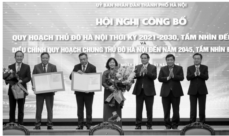
Thủ tướng Phạm Minh Chính trao quyết định công bố 2 quy hoạch cho lãnh đạo TP Hà Nội.

Phát biểu kết luận, Thủ tướng Phạm Minh Chính ghi nhận, đánh giá cao và biểu dương sự nỗ lực và những kết quả quan trọng của các địa phương trong vùng ĐBSH thời gian qua, đóng góp quan trọng cho thành tựu chung của đất nước. Bên cạnh những kết quả rất cơ bản đã đạt được, Thủ tướng Phạm Minh Chính nêu rõ,