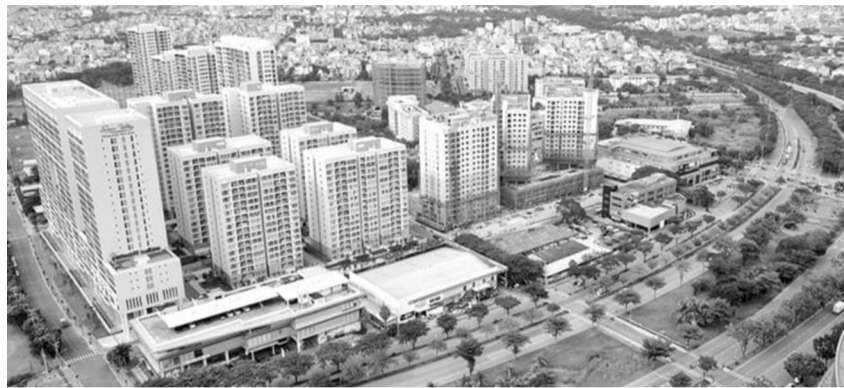
● Thị trường bất động sản đang có sự chuyển biến khi các "điểm nghẽn" pháp lý đang được tháo gỡ.

Năm 2024, nền kinh tế Việt Nam đạt mức tăng trưởng 7,09%, vượt mục tiêu 6 - 6,5% đề ra. Đây là mức tăng trưởng rất tích cực trong bối cảnh thế giới biến động khó lường. Vậy đâu là động lực dẫn đến mức tăng trưởng này?