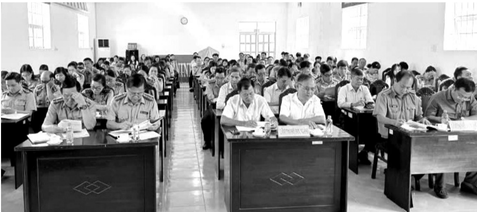
● Cục Thi hành án dân sự tỉnh Tây Ninh triển khai công tác thi hành án dân sự, theo dõi thi hành án hành chính năm 2025.

Cục Thi hành án dân sự (THADS) Tây Ninh cho biết sẽ tiếp tục nâng cao hiệu quả công tác quản lý, chỉ đạo điều hành sâu sát, quyết liệt hơn; tăng cường công tác đi cơ sở để nắm chắc tình hình từng địa bàn để có giải pháp tháo gỡ kịp thời những khó khăn, vướng mắc của chấp hành viên.