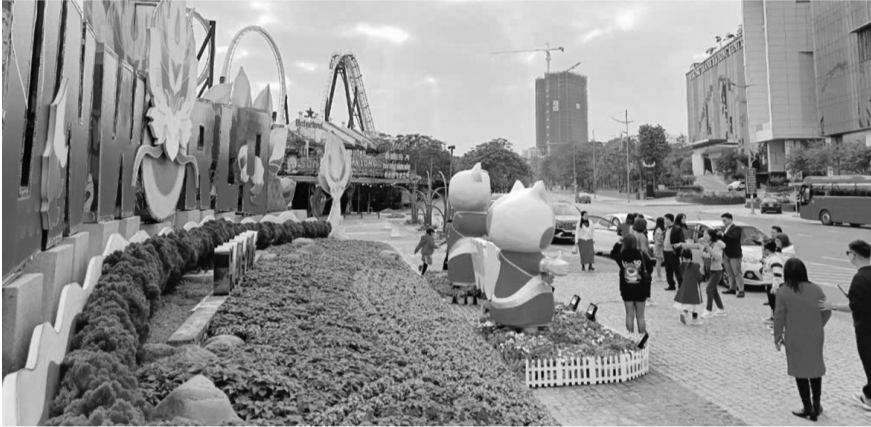
● Du lịch Tết có nhiều chương trình hấp dẫn nhưng du khách cần đảm bảo an toàn cho bản thân. (Ảnh minh họa: Hà Phong)

Tết Nguyên đán năm 2025, người dân được nghỉ liên tục 9 ngày, đây là thời gian nhiều hoạt động du lịch hấp dẫn diễn ra. Bên cạnh việc vui chơi, trải nghiệm, tham quan các điểm đến hấp dẫn, du khách cần lưu ý đảm bảo an toàn để có một kỳ nghỉ trọn vẹn niềm vui.