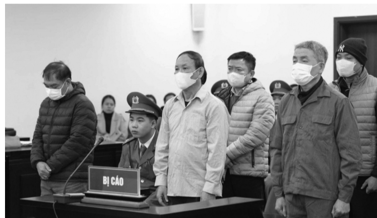
● Các bị cáo tại phiên tòa.

Tuy nhiên, Cơ quan điều tra xác định các cá nhân này là cán bộ cấp dưới, thực hiện hành vi sai phạm theo chỉ đạo của cấp trên; không thông đồng, không làm việc trực tiếp với nhà thầu; không biết mục đích của Thái khi chỉ đạo thực hiện để Thái được nhận tiền hối lộ; không được bàn bạc, trao đổi, không bị tác động hoặc chỉ đạo để làm sai lệch hồ sơ đấu thầu; không được hưởng lợi. Vì vậy, Cơ quan công an kết luận không đủ căn cứ xem xét trách nhiệm hình sự đối với hành vi của các cá nhân nêu trên, đồng thời có văn bản kiến nghị xem xét xử lý về Đảng và hành chính đối với những người này.