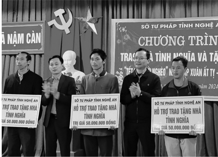
● Sở Tư pháp Nghệ An trao quà nhân dịp Tết Nguyên đán và hỗ trợ xây dựng nhà cho các hộ dân có hoàn cảnh khó khăn về nhà ở.