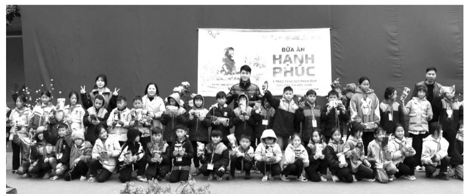
● Sự kiện đã mang đến nhiều hoạt động ý nghĩa nhằm phần nào giúp đỡ và lan tỏa yêu thương tới các em.

Sự kiện “Bữa ăn hạnh phúc” nhằm mang lại niềm vui, sự ấm áp và những hỗ trợ thiết thực cho 622 em học sinh tại ngôi trường dân tộc miền núi thuộc huyện Mù Cang Chải, tỉnh Yên Bái. Đây là một địa bàn đặc biệt khó khăn, nơi hơn 96% là các em học sinh dân tộc có hoàn cảnh thiệt thòi, cần sự quan tâm và sẻ chia từ cộng đồng. Trước sự kiện này, VIGEF, MSD United Way Vietnam và các đối tác đã gây quỹ 100.025.652 đồng từ hơn 3.000 nhà hảo tâm trên nền tảng Viet-tel Money và Givenow để trao tặng 30 bộ bàn ghế ăn mới, cải tạo phòng