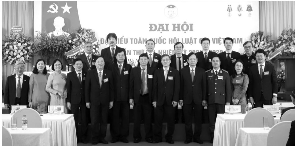
● Ra mắt Ban Thường vụ Hội Luật gia Việt Nam khóa XIV, nhiệm kỳ 2024 - 2029.

Các cấp Hội của Hội viên Hội Luật gia Việt Nam cần bám sát và nắm vững quan điểm chỉ đạo của Đảng, Nhà nước, tôn chỉ mục đích hoạt động của Hội, triển khai thực hiện có hiệu quả nhiệm vụ của Hội được quy định trong Điều lệ "đoàn kết, quyết tâm, phấn đấu thực hiện thắng lợi Nghị quyết Đại hội Đại biểu toàn quốc lần