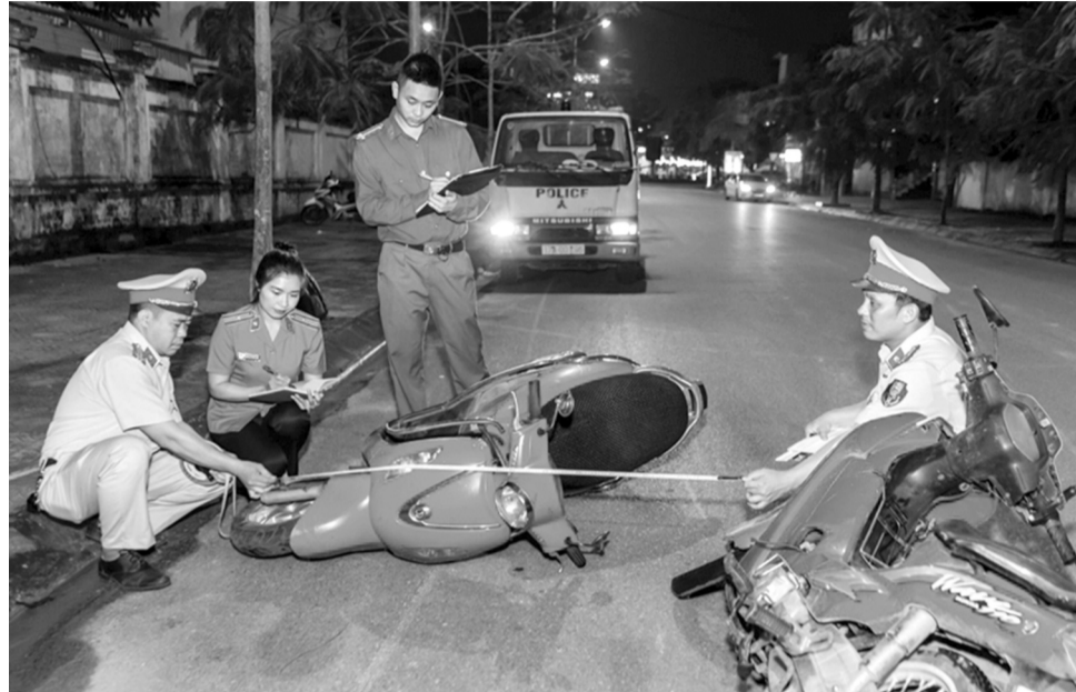
● Kiểm sát khám nghiệm hiện trường, thu thập dấu vết.

Khi kết thúc khám nghiệm hiện trường, tiến hành đánh giá dấu vết, vật chứng, tài liệu, đồ vật, dữ liệu điện tử, tử thi (nếu có) đã phát hiện, thu thập được để khai thác các thông tin phục vụ công