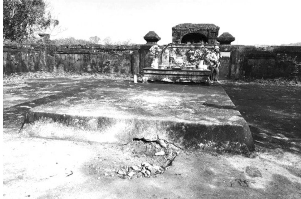
● Lăng mộ Chúa Nguyễn Phúc Khoát bị đào trộm.

Không chỉ lăng mộ Chúa Nguyễn Phúc Khoát mà nhiều lăng mộ của các chúa Nguyễn, hoàng thân, thậm chí là mộ vua nhà Nguyễn cũng từng bị nạn trộm mộ xâm hại để tìm kiếm kho báu, vàng bạc, ngọc ngà... Tiêu biểu như vụ việc lăng Hoàng Thái hậu Từ Dũ bị đào trộm vào những năm 1980, lăng Vĩnh Mậu (mẹ Chúa Nguyễn Phúc Chu) bị đào trộm năm 1990... Cũng năm 1990, lăng Vĩnh Thái (vợ Chúa Nguyễn Phúc Khoát, bà nội Vua Gia Long) cũng bị đào