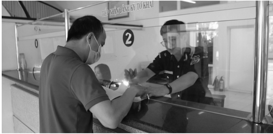
● Công chức Hải quan hướng dẫn thủ tục cho doanh nghiệp. (Ảnh minh họa: NH)

Tổng cục Hải quan vừa có quyết định ban hành kế hoạch hành động để triển khai thực hiện Đề án cải cách công tác quản lý trị giá hải quan đến năm 2030 (gọi tắt là Đề án) đã được phê duyệt tại Quyết định số 167/QĐ-TCHQ ngày 10/2/2023 của Tổng cục trưởng Tổng cục Hải quan.