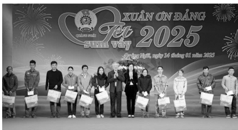
Phó Thủ tướng Thường trực Nguyễn Hòa Bình trao quà Tết cho các gia đình chính sách, hộ nghèo, công nhân viên chức, người lao động tỉnh Quảng Ngãi.

Đánh giá cao những nỗ lực của Đảng bộ, chính quyền và Nhân dân tỉnh Quảng Ngãi trong thời gian qua, Phó Thủ tướng Thường trực tin tưởng tỉnh Quảng Ngãi sẽ tiếp