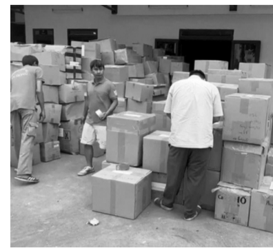
● Một phần tang vật vụ án.

Trước đó, trình sát phát hiện đường dây có biểu hiện sản xuất, buôn bán hàng giả là thuốc đông y kết hợp tân dược điều trị các bệnh đau xương khớp, viêm mũi, trĩ, phong ngứa, dạ dày, tim mạch, thần kinh... Vào cuộc điều tra, cảnh sát xác định, vợ chồng ông Diệu có vai trò cầm đầu. Họ đứng tên 2 Cty tại quận Bình Tân và quận 8 để làm bình phong kinh doanh dược phẩm, nhưng thực tế là âm thầm lập kho,