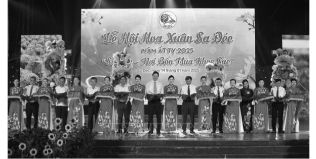
● Đại biểu thực hiện nghi thức khai mạc Lễ hội hoa xuân thành phố Sa Đéc.

Tối 14/1, tại Quảng trường thành phố Sa Đéc (tỉnh Đồng Tháp), UBND thành phố Sa Đéc tổ chức khai mạc Lễ hội hoa xuân năm 2025 với chủ đề: Sa Đéc - Nơi bốn mùa khoe sắc.