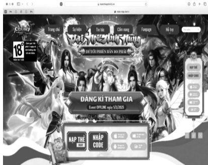
● Ảnh chụp màn hình tại website: kiemhieptinh2.vn ngày 19/12/2024 (Ảnh trong bài: Gia Hải)

Cũng theo đơn, khi có nhu cầu nạp thẻ, nạp tiền vào trò chơi “Kiếm Hiệp Tinh 2 Mobile” hay “Kiếm Thiên mobile”, người chơi được hướng dẫn chuyển tiền qua ngân hàng, Momo, Zalopay, Paypal. Tuy