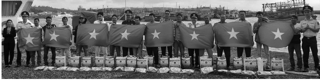
● Đoàn công tác tặng cờ và tuyên truyền pháp luật cho ngư dân huyện đảo Phú Quý.