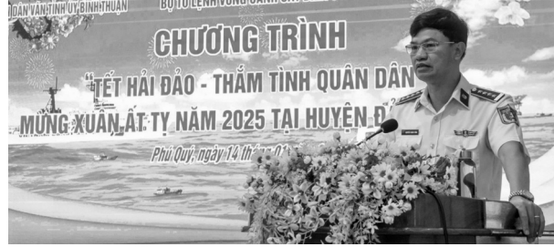
● Đại tá Cao Xuân Quận, Phó Chính ủy Vùng CSB 3 phát biểu tại chương trình “Tết hải đảo - Thăm tình quân dân, đón Xuân Ất Ty năm 2025”.

Trong không khí rộn ràng của những ngày cận Tết Nguyên đán Ất Ty, trong hai ngày 14 - 15/1, Đoàn công tác của Bộ Tư lệnh Vùng Cảnh sát biển (CSB) 3 đã tổ chức chương trình “Tết hải đảo - Thăm tình quân dân, đón Xuân Ất Ty năm 2025” tại huyện đảo Phú Quý, tỉnh Bình Thuận.