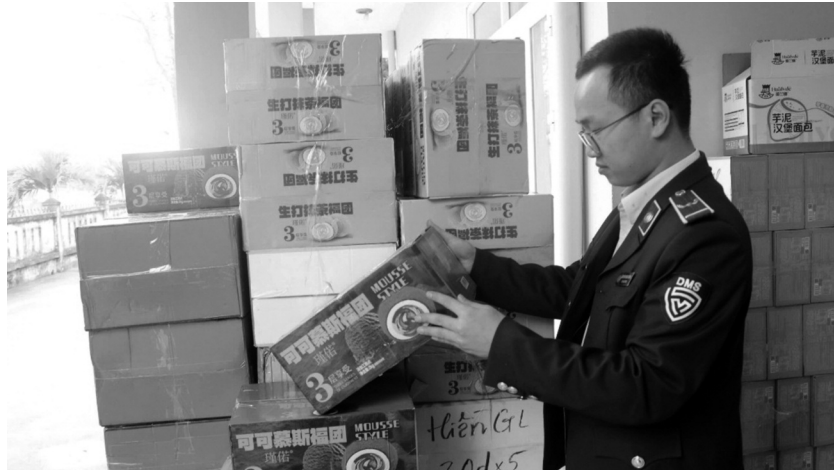
● Các loại bánh kẹo không rõ nguồn gốc vừa được lực lượng QLTT Quảng Bình thu giữ.

Đây là 2 trong số nhiều vụ việc điển hình mà lực lượng QLTT đã thực hiện trong giai đoạn cao điểm phòng, chống hàng giả, hàng nhái cũng như an toàn thực phẩm (ATTP) trong dịp Tết Nguyên đán Ất Tỵ. Đại diện Tổng cục QLTT cho biết, thời gian tới, lực lượng QLTT sẽ tiếp tục phối hợp với các đơn vị chức năng triển khai có hiệu quả Kế hoạch cao điểm kiểm tra, kiểm soát thị trường