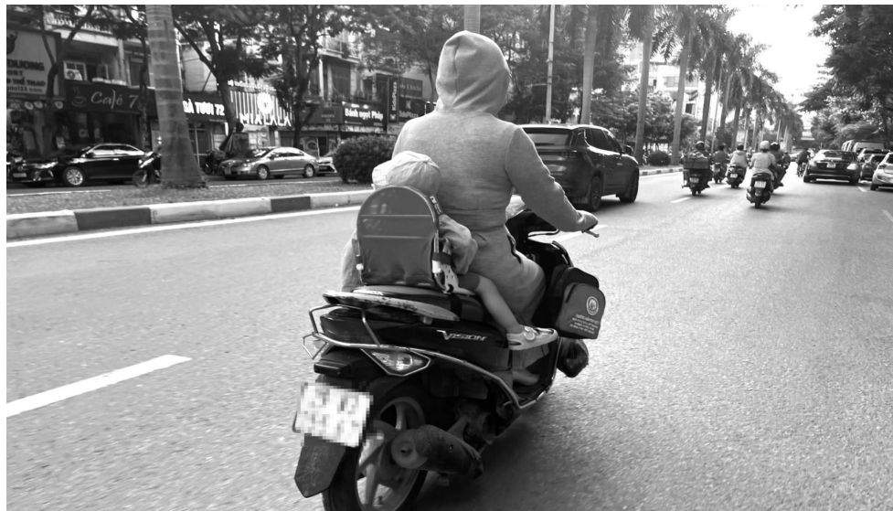
● Phụ huynh chở con trẻ trên xe máy cần bảo đảm sự an toàn.

Điểm đáng chú ý là quy định này vẫn cho phép trường hợp trẻ em dưới 6 tuổi ngồi phía trước người lái, bởi đây là nhu cầu thực tế khi cha mẹ chở con nhỏ và cần đảm bảo sự an toàn cho trẻ. Trẻ dưới 6 tuổi còn nhỏ, khó tự giữ thăng bằng khi ngồi phía sau, nên việc ngồi phía trước giúp cha mẹ dễ dàng quan sát và bảo vệ trẻ hơn. Tuy nhiên, từ 6 tuổi trở lên, trẻ đã có khả năng ngồi độc lập phía sau, đồng thời việc ngồi