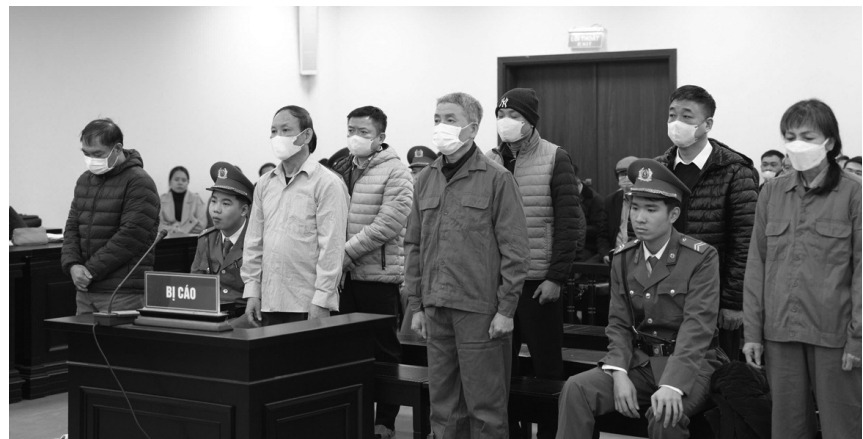
● Các bị cáo tại tòa.

Phát biểu quan điểm luận tội với các bị cáo, đại diện VKS cho rằng hành vi của các bị cáo là nguy hiểm cho xã hội,