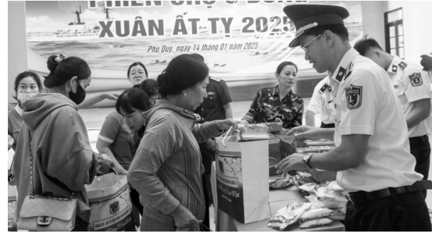
● Bộ Tư lệnh Vùng CSB 3 tặng quà cho người dân.