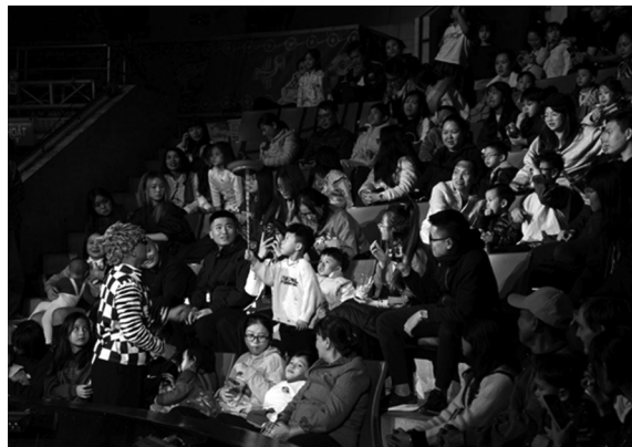
● Rạp xiếc Trung ương đón nhận lượng khán giả trẻ đông đảo.

trụ với nghề gần như là không thể nếu họ không nhận thêm show bên ngoài hoặc làm thêm công việc khác. Các nghệ sĩ xiếc cũng phải chật vật để đảm bảo cuộc sống sau khi giải nghệ. Bên cạnh đó, các chính sách bảo hiểm và hỗ trợ y tế dành cho nghệ sĩ xiếc cũng chưa thực sự toàn diện, đặc biệt là đối với những trường hợp chấn thương nghề nghiệp.