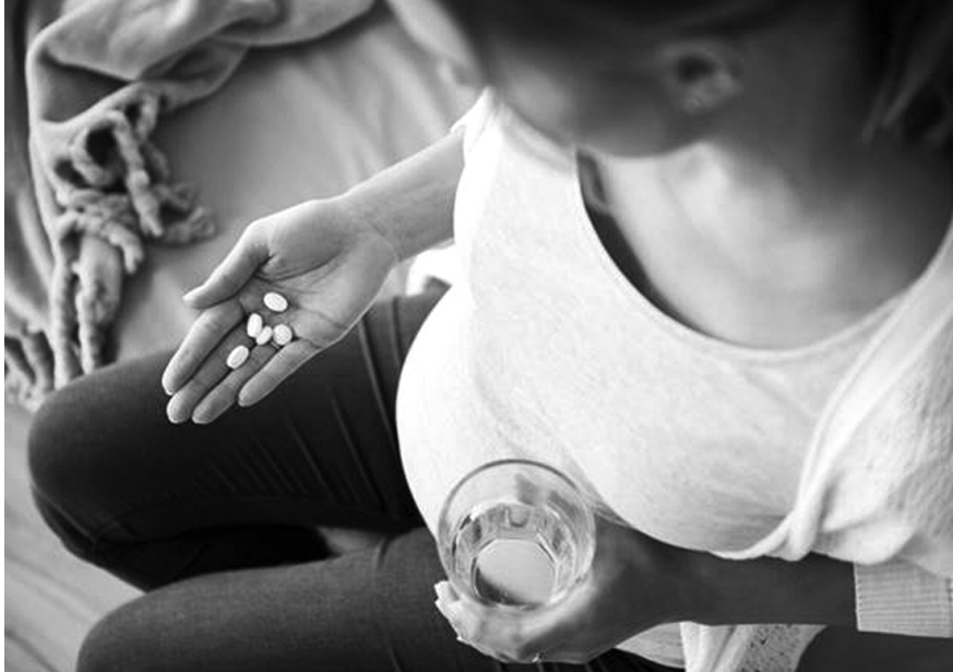
●Trào lưu “giảm cân thần tốc” đón Tết khiến nhiều người phải đối diện với vấn đề sức khỏe.

Ngoài ra, càng gần Tết, việc giảm cân trở thành nỗi “ám ảnh” của nhiều người. Mong muốn giảm cân nhanh trong vài tuần, thậm chí vài ngày. Nhiều loại trà, thuốc, cà phê... giảm cân không rõ nguồn gốc, xuất xứ được bày bán. Các nhóm kín trên mạng xã hội có hàng loạt những bài đăng về các loại trà thảo mộc dạng viên, chiết xuất