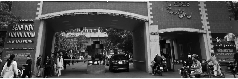
● Bệnh viện Thanh Nhân có địa chỉ tại số 42 Thanh Nhân, quận Hai Bà Trưng, TP Hà Nội.

Mới đây, Báo PLVN nhận được đơn phản ánh của một số bác sĩ đang công tác tại Bệnh viện (BV) Thanh Nhân (quận Hai Bà Trưng, Hà Nội), cho rằng tiền giảng dạy tại một số trường đại học, chủ yếu là Trường ĐH Kinh doanh và Công nghệ Hà Nội (KD&CN HN) sau nhiều năm vẫn chưa được nhận.