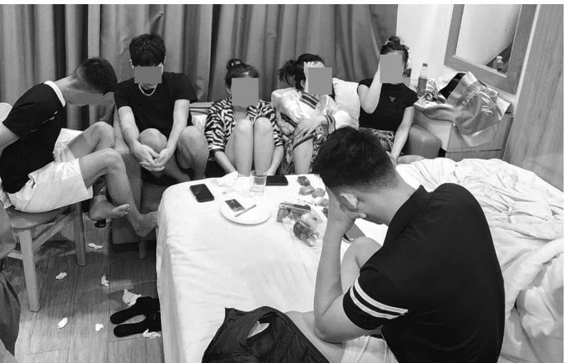
● Một nhóm đối tượng bị bắt quả tang sử dụng trái phép chất ma túy tại Đà Nẵng.

Đáng chú ý, xuất hiện một số vụ cán bộ, công chức, văn nghệ sĩ, cầu thủ tham gia tổ chức sử dụng trái phép chất ma túy. Tình trạng sử dụng "bóng cười", ma túy "núp bóng", tẩm ướp, pha trộn vào thực phẩm, đồ uống, thảo mộc, thuốc lá điếu, thuốc lá điện tử... gia tăng phức tạp, nhất là trong thanh, thiếu niên, tại các cơ sở kinh doanh có điều kiện và dịch vụ nhay cảm về an ninh trật tự.