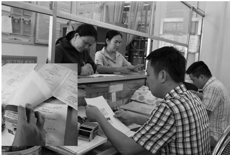
● Từ 9/1/2025, UBND cấp xã được chứng thực các văn bản do nước ngoài cấp. (Ảnh: moj.gov.vn)

Theo quy định trước đây thì Phòng Tư pháp huyện, quận, thị xã, thành phố mới có thẩm quyền chứng thực bản sao từ bản