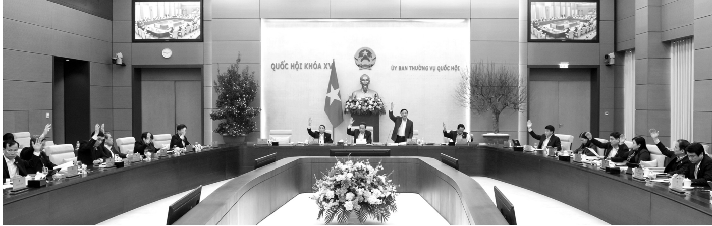
● Ủy ban Thường vụ Quốc hội nhất trí bổ sung 6 dự án luật vào Chương trình năm 2025.