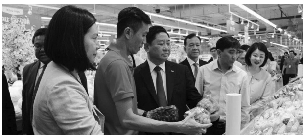
● Lãnh đạo tỉnh Ninh Thuận nghe đại diện Tập đoàn Central Retail Việt Nam giới thiệu sản phẩm đặc thù nhỏ, táo của địa phương đưa vào bán tại Trung tâm thương mại GO!

Sáng 15/1, Trung tâm thương mại GO! Ninh Thuận đã chính thức được Tập đoàn Central Retail Việt Nam khai trương tại thành phố Phan Rang - Tháp Chàm, tỉnh Ninh Thuận.