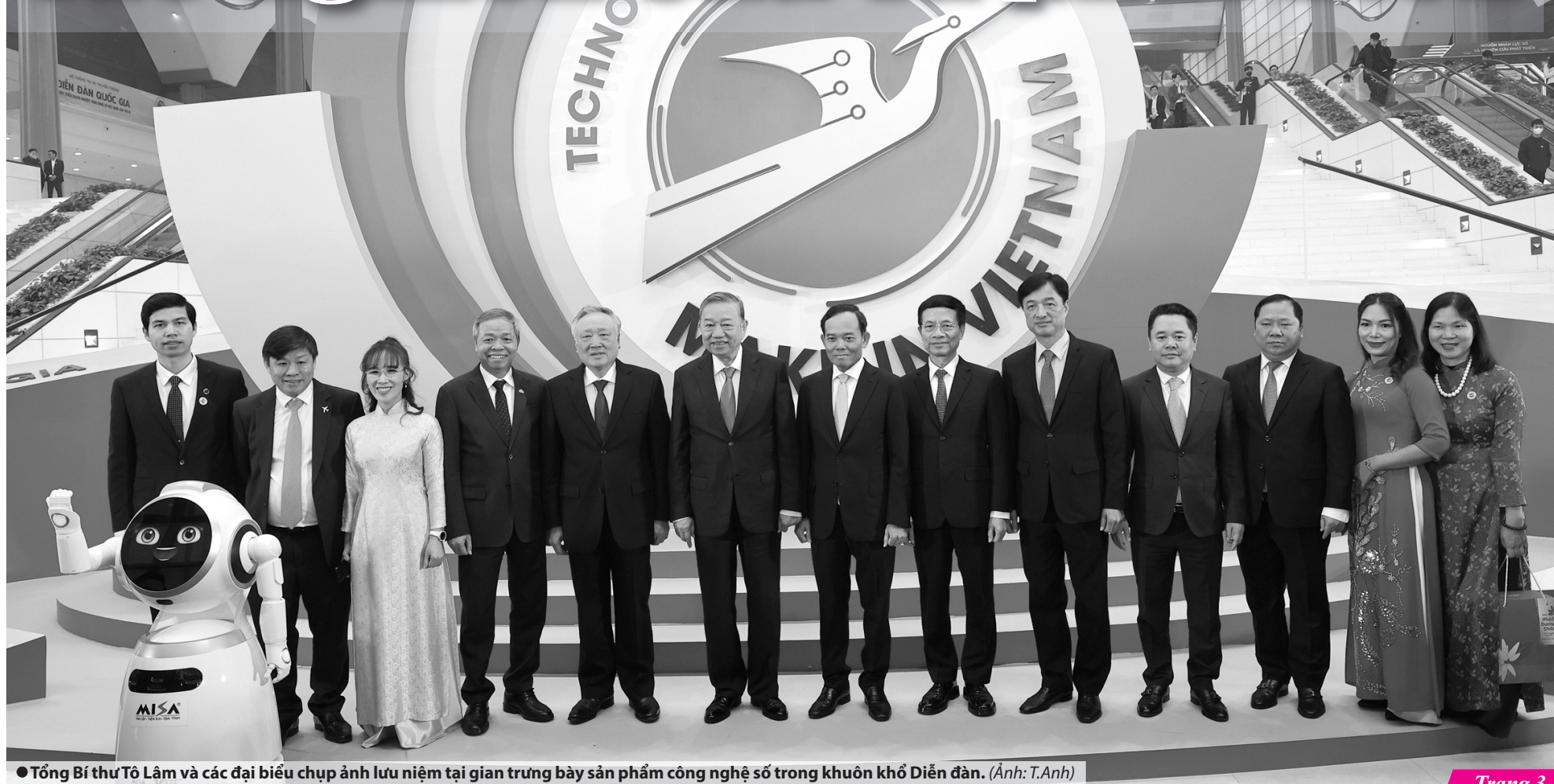
● Tổng Bí thư Tô Lâm và các đại biểu chụp ảnh lưu niệm tại gian trưng bày sản phẩm công nghệ số trong khuôn khổ Diễn đàn.