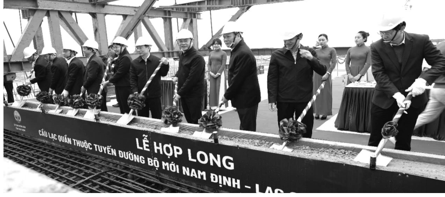
● Các đại biểu thực hiện nghi thức hợp long cầu Lạc Quần.

508,8m gồm 13 nhịp, 3 nhịp liên tục 55+90+55(m), tính không 85x11m.