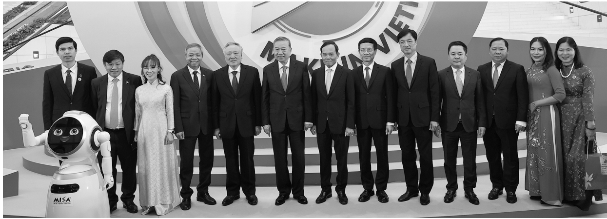
● Tổng Bí thư Tô Lâm và các đại biểu chụp ảnh lưu niệm tại gian trưng bày sản phẩm công nghệ số trong khuôn khổ Diễn đàn.