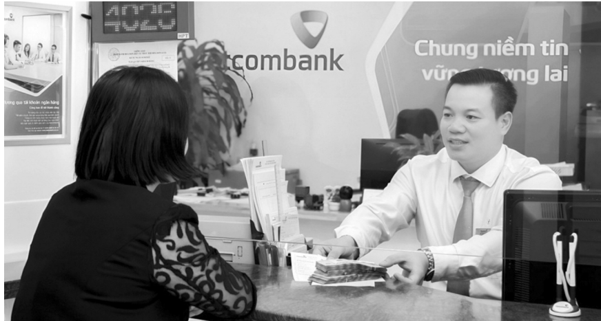
● Năm 2024, Vietcombank đã thực hiện 26 chương trình ưu đãi lãi suất.

Công tác phát triển khách hàng mới đạt kết quả đáng ghi nhận, số lượng khách hàng mới tăng trưởng 2 con số so