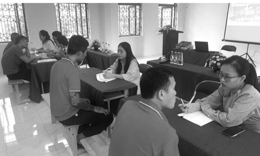
● Cơ sở cai nghiện ma túy số 5 phối hợp Trung tâm Dịch vụ việc làm Hà Nội tư vấn, hướng nghiệp học nghề, giới thiệu việc làm cho học viên cai nghiện.

Trước khi kết thúc phần tự bào chữa, ông Hiệp nói: "Cuối cùng đây là lời nói thật từ tấm lòng chứ không phải để bôi, là nếu trong quá trình thụ án, bị cáo có mệnh hệ gì thì bị cáo xin hiến xác cho y học, khoa học". HỒNG MÂY