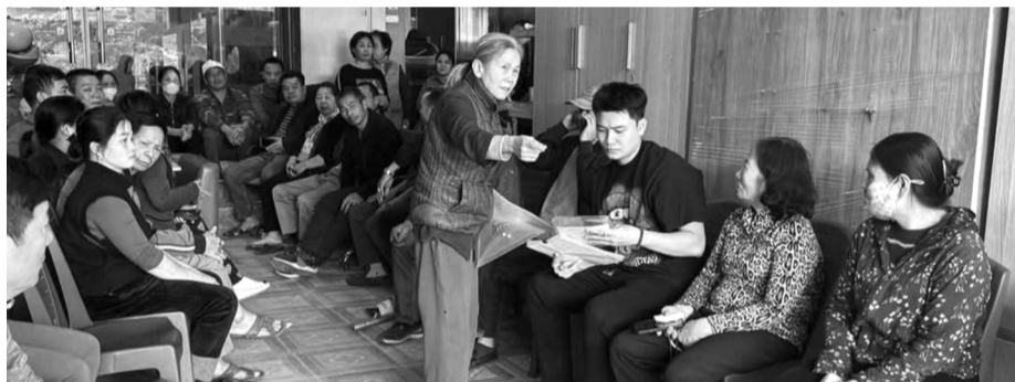
● Người dân cho rằng cần xem xét lại việc thu hồi, GPMB với nhà đất họ đang sử dụng từ nhiều năm qua. (Ảnh: Thiên Đức)

Mới đây, Báo PLVN nhận được đơn thư phản ánh của 63 hộ dân tại khu phố 5, đường Đá Bạc, phường Xuân Khanh (TX Sơn Tây, Hà Nội) cho rằng cần xem xét lại việc thu hồi, giải phóng mặt bằng (GPMB) với nhà đất họ đang sử dụng từ nhiều năm qua.