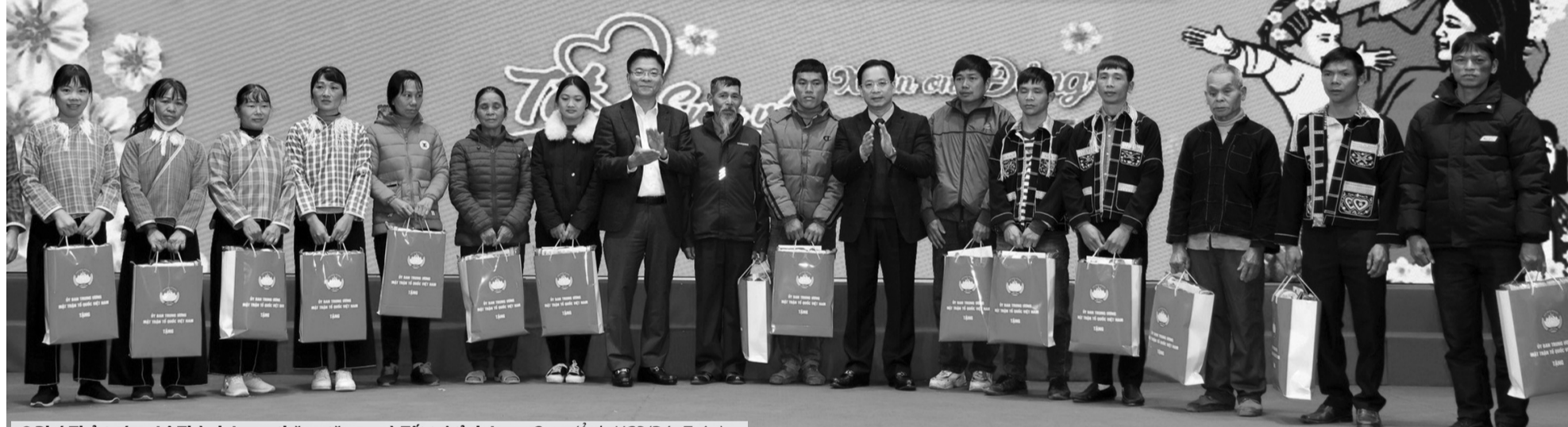
● Phó Thủ tướng Lê Thành Long thăm, tặng quà Tết tại tỉnh Lạng Sơn. (Ảnh: VGP/Đức Tuấn)