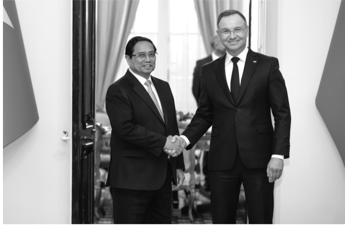
● Thủ tướng Chính phủ Phạm Minh Chính và Tổng thống Ba Lan Andrzej Duda.

Trong khuôn khổ chuyến thăm chính thức Ba Lan, tại hội kiến với Tổng thống Ba Lan Andrzej Duda, Thủ tướng Chính phủ Phạm Minh Chính khẳng định dù thời gian có thay đổi nhưng tình hữu nghị giữa hai dân tộc không bao giờ đổi thay.