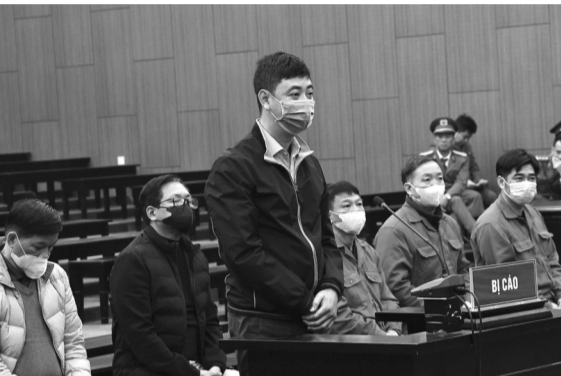
● Các bị cáo tại phiên xử.

Giải trình với HĐXX lý do ký hợp đồng "bảo mật thông tin", bị cáo Trí cho rằng "muốn tìm đối tác thật sự mong muốn phát triển một TP ở phía Nam Đà Lạt, chia sẻ áp lực cho TP Đà Lạt đã quá tải. Vì thế, bị cáo đưa ra điều kiện ký hợp đồng bảo mật với giá trị hơn 300 tỷ đồng thì mới chuyển giao toàn bộ hồ sơ của dự án để nghiên cứu".