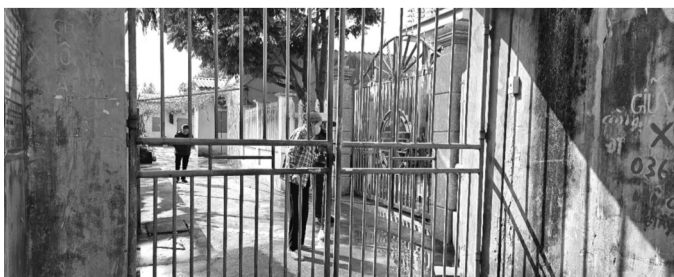
● Khu trọ - nơi xảy vụ việc.