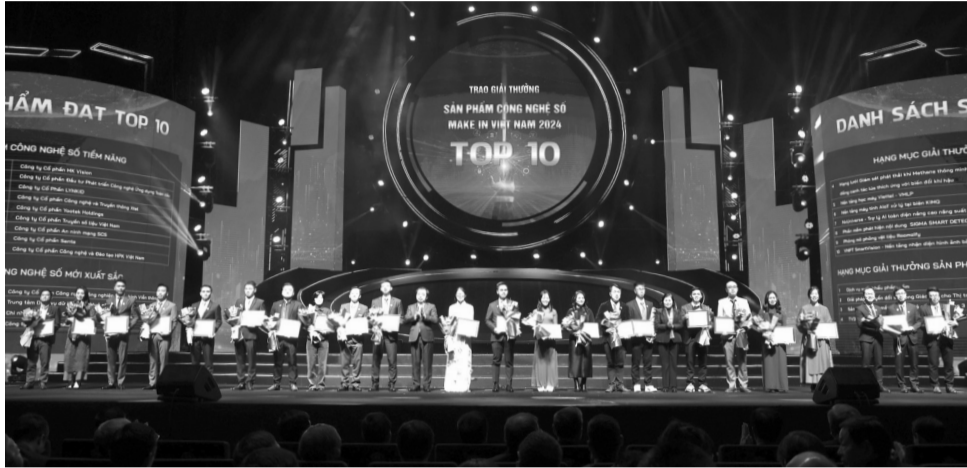
● Bộ TT&TT vừa công bố và trao Giải thưởng sản phẩm công nghệ số Make in Viet Nam năm 2024 cho 71 giải pháp công nghệ số xuất sắc, mang tự hào trí tuệ Việt Nam.