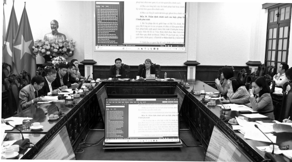
● Bộ trưởng Bộ Tư pháp Nguyễn Hải Ninh và Phó Chủ nhiệm Ủy ban Pháp luật của Quốc hội Ngô Trung Thành chủ trì buổi làm việc.

Ngày 17/1, Bộ trưởng Bộ Tư pháp Nguyễn Hải Ninh đã chủ trì buổi làm việc với đại diện pháp chế các Bộ, ngành về dự thảo Luật Ban hành văn bản quy phạm pháp luật (VBQPPL) sửa đổi. Ông Ngô Trung Thành, Phó Chủ nhiệm Ủy ban Pháp luật của Quốc hội đồng chủ trì buổi làm việc.