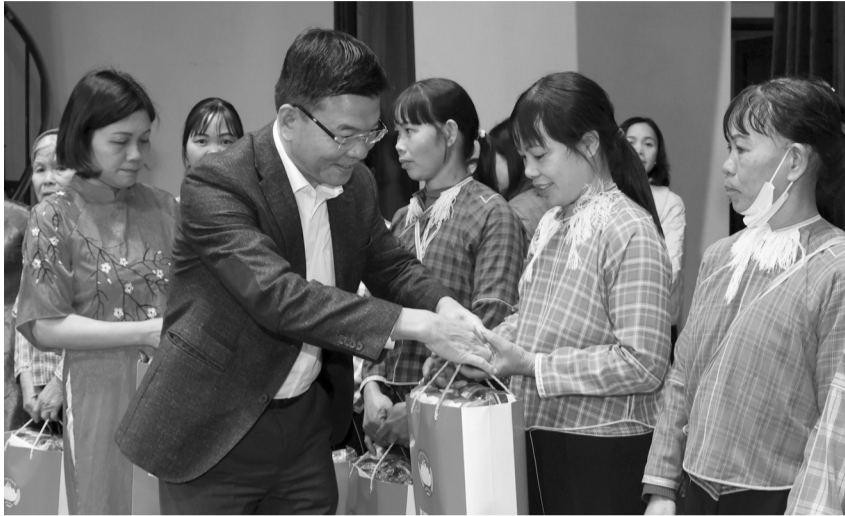
● Phó Thủ tướng Lê Thành Long tặng quà Tết cho người dân Lạng Sơn.

Đất nước càng phát triển thì càng phải chăm lo đến đời sống Nhân dân, giải quyết chế độ chính sách, hỗ trợ người có hoàn cảnh khó khăn vươn lên. Đó là đạo lý “uống nước nhớ nguồn”, là tinh thần đoàn kết, “tương thân, tương ái”, “lá lành đùm lá rách” mà các lãnh đạo Đảng, Nhà nước luôn khẳng định trong các chuyến thăm, tặng quà Tết ngày 17/1, nhân dịp Tết Nguyên đán Ất Tỵ năm 2025.