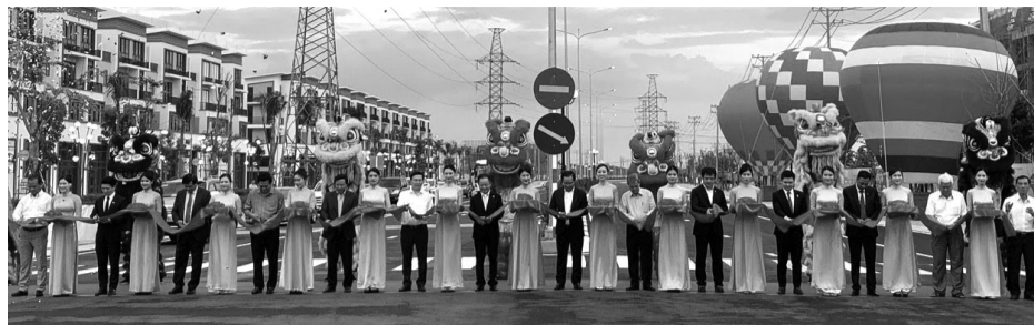
● Lãnh đạo tỉnh Long An thực hiện nghi thức Lễ khánh thành đường tỉnh 826E.

có ý nghĩa quan trọng trong việc huy động các DN phối hợp với Nhà nước xây dựng kết cấu hạ tầng giao thông phục vụ phát triển kinh tế - xã hội TP HCM và Long An.