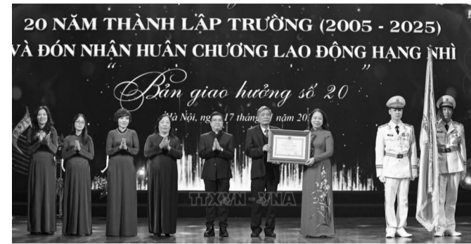
● Phó Chủ tịch nước Võ Thị Ánh Xuân trao Huân chương Lao động hạng Nhì của Chủ tịch nước tặng Trường THCS Đoàn Thị Điểm (quận Nam Từ Liêm, Hà Nội).

Sáng 17/1, Trường Trung học Cơ sở Đoàn Thị Điểm (Hà Nội) tổ chức Lễ kỷ niệm 20 năm thành lập Trường và đón nhận Huân chương Lao động hạng Nhì.