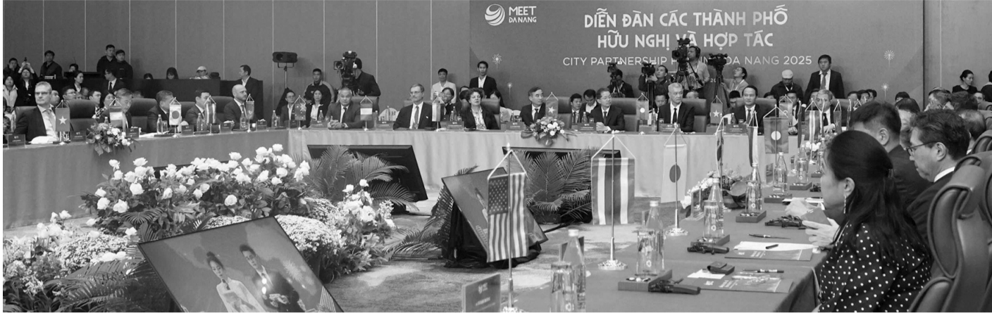
● Quang cảnh Diễn đàn.