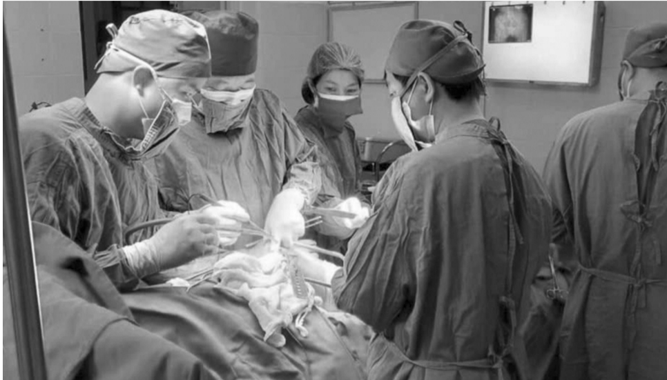
● Bộ Y tế ban hành quy định về đăng ký ghép mô, bộ phận cơ thể người.

Người bệnh được chỉ định và có nguyện vọng ghép mô, bộ phận cơ thể