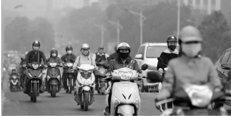
● Người tham gia giao thông bảo vệ sức khỏe bản thân bằng cách đeo khẩu trang.

Theo ghi nhận của phóng viên, vào những ngày cuối tuần khi lưu lượng giao thông tăng cao, ngay tại đường