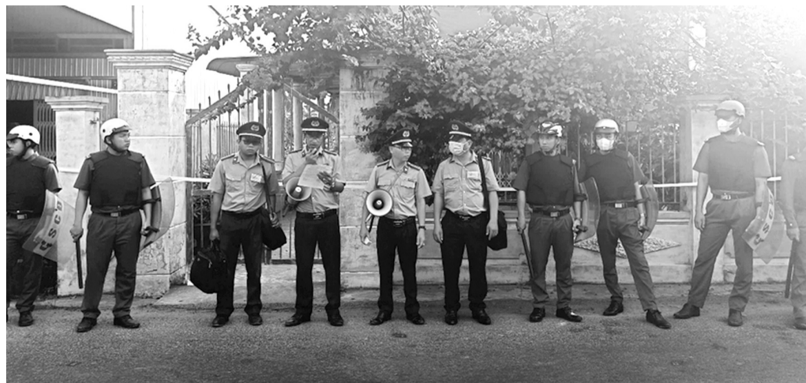
● Chấp hành viên Chi cục THADS huyện Phước Long, tỉnh Bạc Liêu thông qua Quyết định cưỡng chế thi hành án.

(* Bài dự thi Chuyên ngành Thi hành án dân sự.