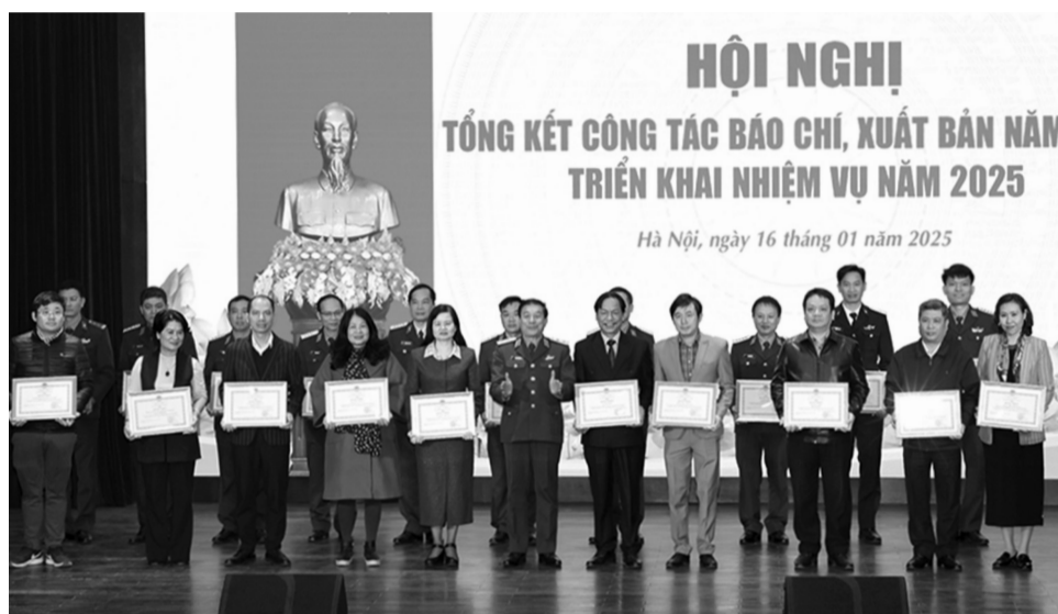
Đại diện Bộ Quốc phòng trao Bằng khen cho các cơ quan báo chí có thành tích xuất sắc.

Các cơ quan, đơn vị trong toàn quân tích cực phối hợp, tạo điều kiện cho cán bộ, phóng viên các cơ quan báo chí Trung ương và địa phương đến các đơn vị Quân đội, nhất là ở vùng sâu, vùng xa, biên giới, biên đảo để tuyên truyền, phản ánh kịp thời hoạt động của bộ đội trong thực hiện nhiệm vụ huấn luyện, sẵn sàng chiến đấu (SSCĐ), bảo vệ chủ quyền Tô quốc, góp phần lan tỏa hình ảnh, truyền thống, bản chất tốt đẹp của Quân đội. Hoạt động xuất bản, in và phát hành trong toàn quân tiếp