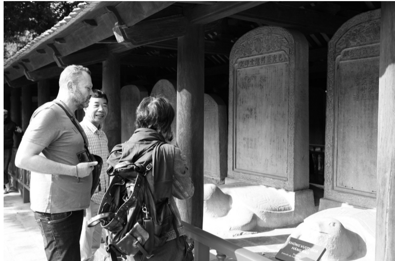
● Việc tiếp cận gần gũi các tấm bia tiến sĩ sẽ giúp du khách cảm nhận sâu hơn về những nội dung tư liệu hiện hữu cũng như khám phá điều ẩn chứa trong những tấm bia đá.

nhất của khu di tích Văn Miếu - Quốc Tử Giám. Đây là những pho sử đá khẳng định niềm tự hào của truyền thống hiếu học của Việt Nam.