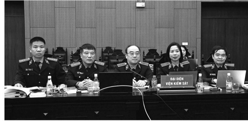
● Đại diện VKS tại tòa.