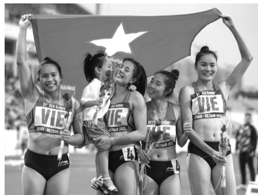
● Điền kinh tiếp tục là môn thể thao được kỳ vọng đem về nhiều HCV cho TTVN.