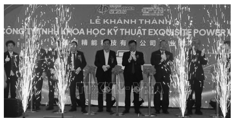
● Các đại biểu cắt băng khánh thành dự án.