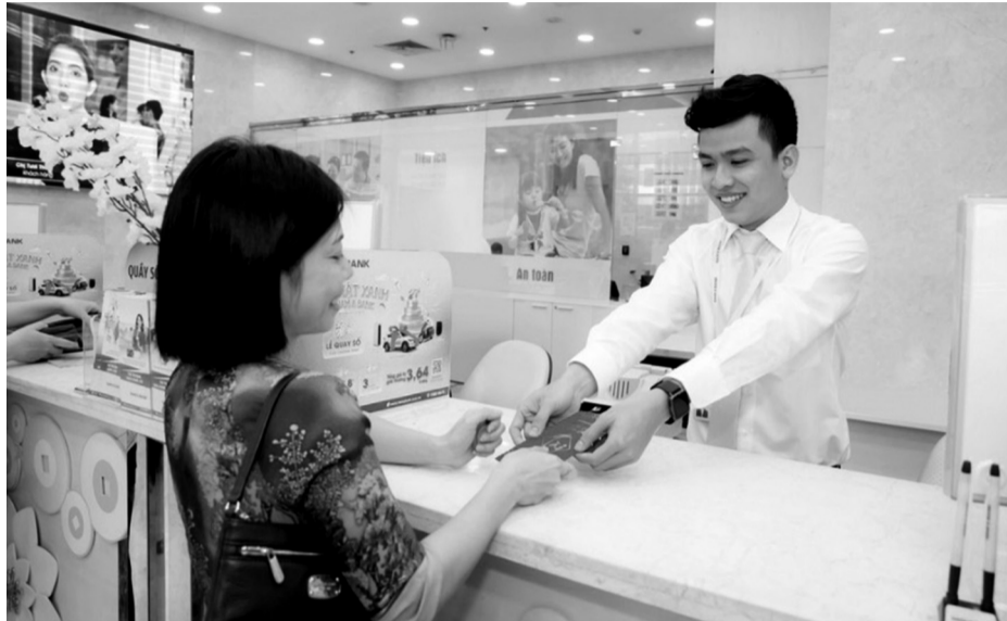
● Các ngân hàng dành nhiều chương trình tri ân khách hàng dịp Tết.

Ngân hàng TMCP Phương Đông (OCB) cũng triển khai 2 chương trình khuyến mãi vào dịp Tết cho cả 2 hình thức gửi tiết kiệm tại quầy và gửi tiết kiệm online. Theo đó, ngân hàng này dành ngân sách 3 tỷ đồng để tặng voucher Got It, với các mệnh giá tùy vào từng khoản tiền gửi và thời hạn gửi. Voucher có giá trị từ 200 - 800 ngàn đồng, dành cho tất cả khách hàng gửi