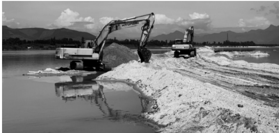
● Từ 1/3, khung thời gian khai thác cát, sỏi lòng sông từ 5h - 19h.

Nghị định 10/2025/NĐ-CP nêu rõ, cơ quan quản lý nhà nước có thẩm quyền cấp Giấy phép khai thác khoáng sản nào thì có thẩm quyền ra quyết định điều chỉnh Giấy phép khai thác khoáng sản đó. Quyết định điều chỉnh nội dung Giấy phép khai thác khoáng sản là văn bản pháp lý không tách rời của Giấy phép khai thác khoáng sản đã cấp trước đó.