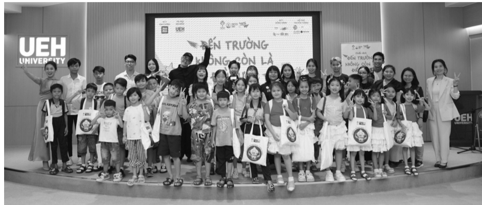
● Trải qua 10 năm dự án “Trang mới cuộc đời” hoạt động, hơn 320 tấm giấy khai sinh đã được trao cho các trẻ em có hoàn cảnh khó khăn. (Ảnh minh họa. Nguồn: MSD)

Cuối năm 2020, khi HN được đi học tiểu học tại một trường tình thương gần