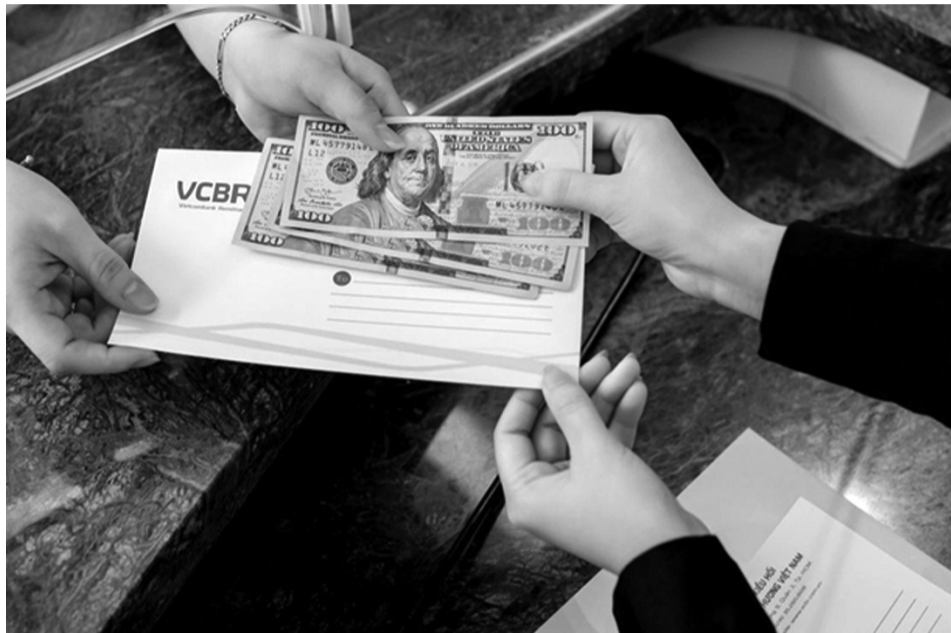
● Lượng kiều hối về Việt Nam duy trì ở mức ổn định trên nền tăng cao kỷ lục của năm 2023.

Năm 2024, mặc dù kinh tế và chính trị thế giới có những diễn biến không thuận lợi nhưng lượng kiều hối về Việt Nam vẫn đạt 16 tỷ USD, được đánh giá là ổn định, tương đương với năm 2023 - năm tăng trưởng kỷ lục của lượng kiều hối.