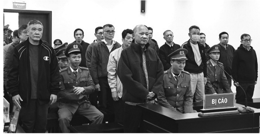
● Các bị cáo tại phiên sơ thẩm

Tuy nhiên ông Phương vẫn thống nhất với kết quả tư vấn xác định giá đất và phương án giá đất do Sở TN&MT xây dựng. Trong đó sử dụng tài sản so sánh không đủ điều kiện, không căn cứ quy hoạch chi tiết được phê duyệt; làm cơ sở tính toán, tính giá đất nhà cao tầng bằng cách thức, phương pháp xác định