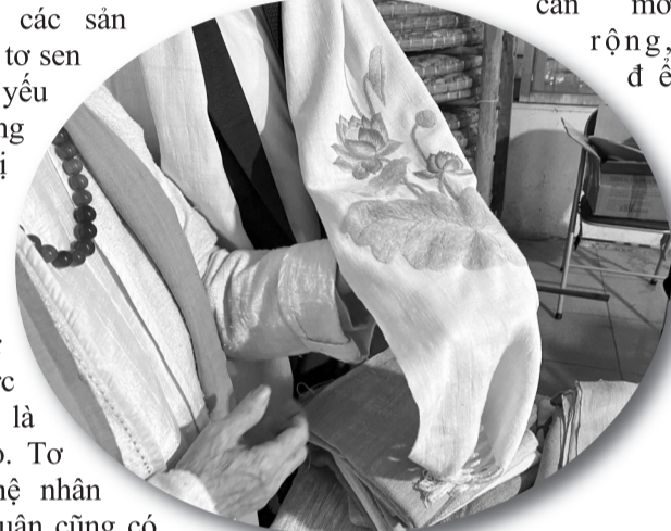
● Những chiếc khăn được làm từ tơ sen mang vẻ đẹp nhẹ nhàng, tinh tế.

Tuy nhiên, để các sản phẩm tơ sen, tơ lụa vươn mình ra "biển lớn" quốc tế, thứ nhất việc sản xuất tơ cần phải nâng tầm công nghệ, bắt kịp thời đại. Thứ hai, thị trường nguyên liệu