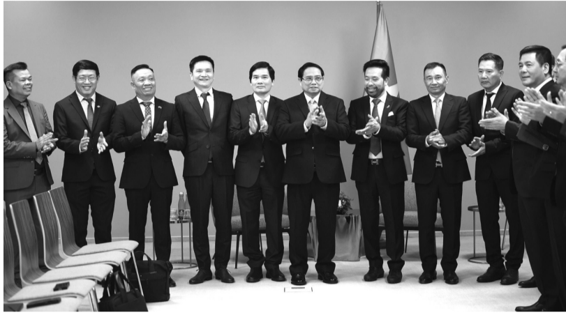
● Thủ tướng Phạm Minh Chính tiếp đại diện một số doanh nghiệp tiêu biểu Việt Nam tại Cộng hòa Séc và châu Âu.

Lãnh đạo các doanh nghiệp mong muốn Việt Nam tập trung đầu tư nhiều hơn nữa để hàng hoá, dịch vụ của Việt Nam có hàm lượng giá trị gia tăng cao hơn, có các thương hiệu mạnh, đáp ứng các thị trường khó tính; đầu tư nhiều hơn nữa quảng bá hình ảnh đất nước, con