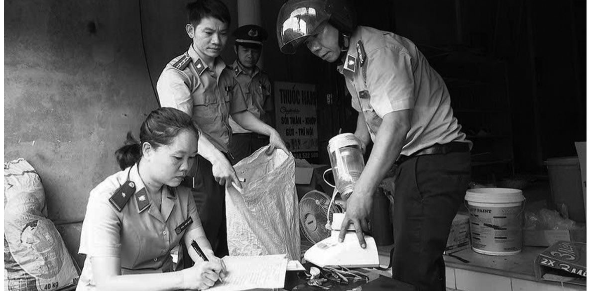
● Cán bộ Thi hành án dân sự thị xã Ba Đồn, tỉnh Quảng Bình luôn xác định phải làm việc tỉ mỉ, cẩn thận để đảm bảo quyền lợi của đương sự theo quy định của pháp luật.