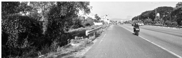
● Khu đất nhiều năm nay vướng khiếu nại.