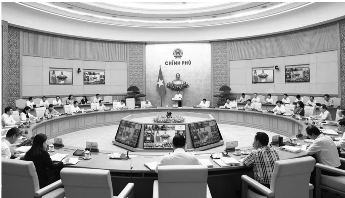
● Phiên họp Chính phủ thường kỳ tháng 9 năm 2024 và Hội nghị trực tuyến Chính phủ với địa phương.

Khoản 2 Điều 112 Hiến pháp năm 2013 quy định rõ: “Nhiệm vụ, quyền hạn của chính quyền