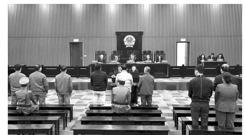
● Các bị cáo trong phiên tòa xét xử vụ án sai phạm tại dự án Sài Gòn - Đại Ninh.