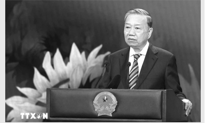
● Tổng Bí thư Tô Lâm phát biểu tại Chương trình.

Đây là chương trình do Cục Công tác Đảng và công tác chính trị, Bộ Công an tổ chức nhằm gặp mặt, biểu dương,