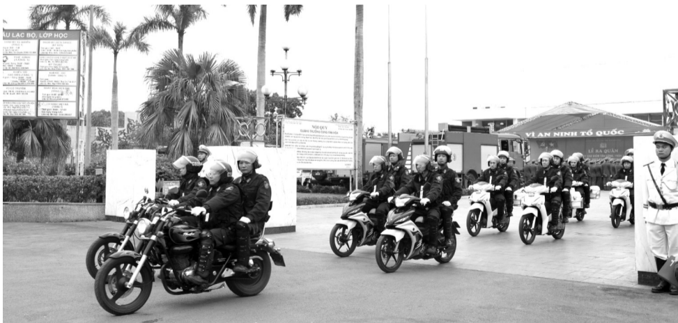
● Hải Phòng quyết tâm trở thành thành phố không ma túy.

TP Hải Phòng tập trung xây dựng địa bàn xã, phường, thị trấn thực sự là “pháo đài” trong công tác phòng, chống ma túy; kiên quyết không để hình thành các điểm, tụ điểm về tội phạm, tệ nạn ma túy tại địa bàn cấp xã.