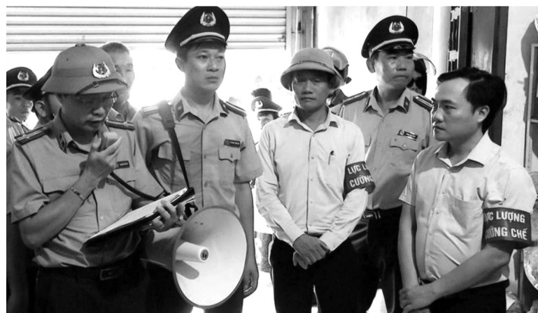
● Để tiến hành cưỡng chế thi hành đối với một bản án, các lực lượng, đặc biệt là lực lượng Thi hành án dân sự mất rất nhiều thời gian, công sức.

(*) Bài dự thi Chuyên ngành Thi hành án dân sự.