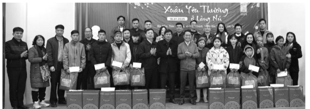
● Báo Pháp luật Việt Nam mang "Xuân yêu thương" đến với người dân Làng Nữ.