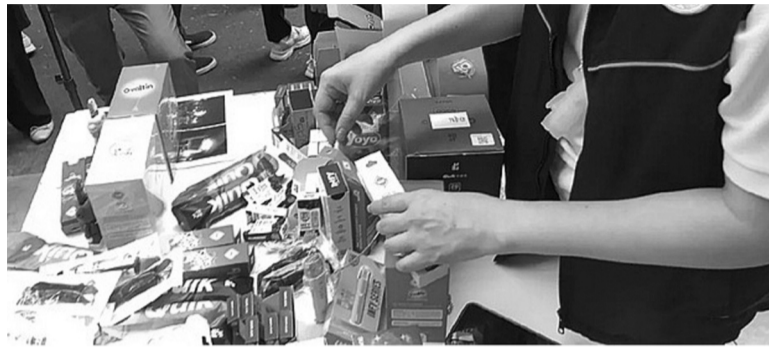
● Các sản phẩm thuốc lá điện tử lưu tại Thái Lan.

Trừ TLĐT dùng một lần, Bỉ hiện vẫn là quốc gia cung cấp hợp