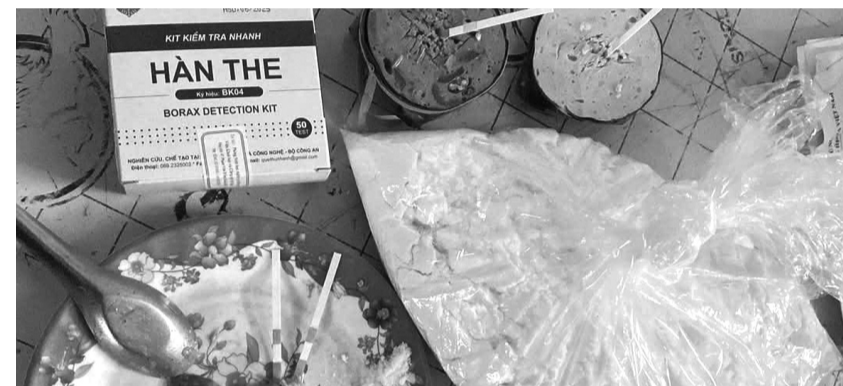
● Một phần tang vật vụ án.