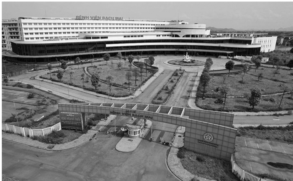
● Bệnh viện Bạch Mai ở Hà Nam xây xong bỏ hoang phế.

III của Đảng (tháng 9/1960) đã quyết nghị lấy ngày 3 tháng 2 dương lịch mỗi năm làm Ngày kỷ niệm thành lập Đảng Cộng sản Việt Nam. Đến nay, dưới sự lãnh đạo, chỉ đạo của Đảng qua 95 mùa Xuân, đất nước ta đã giành được nhiều thành tựu vẻ vang, đi từ thắng lợi này đến thắng lợi khác. Đặc biệt, những thành tựu của 40 năm đổi mới là rất to lớn và có ý nghĩa lịch sử, giúp Việt Nam tích lũy thế và lực cho sự phát triển bứt phá trong giai đoạn tiếp theo.