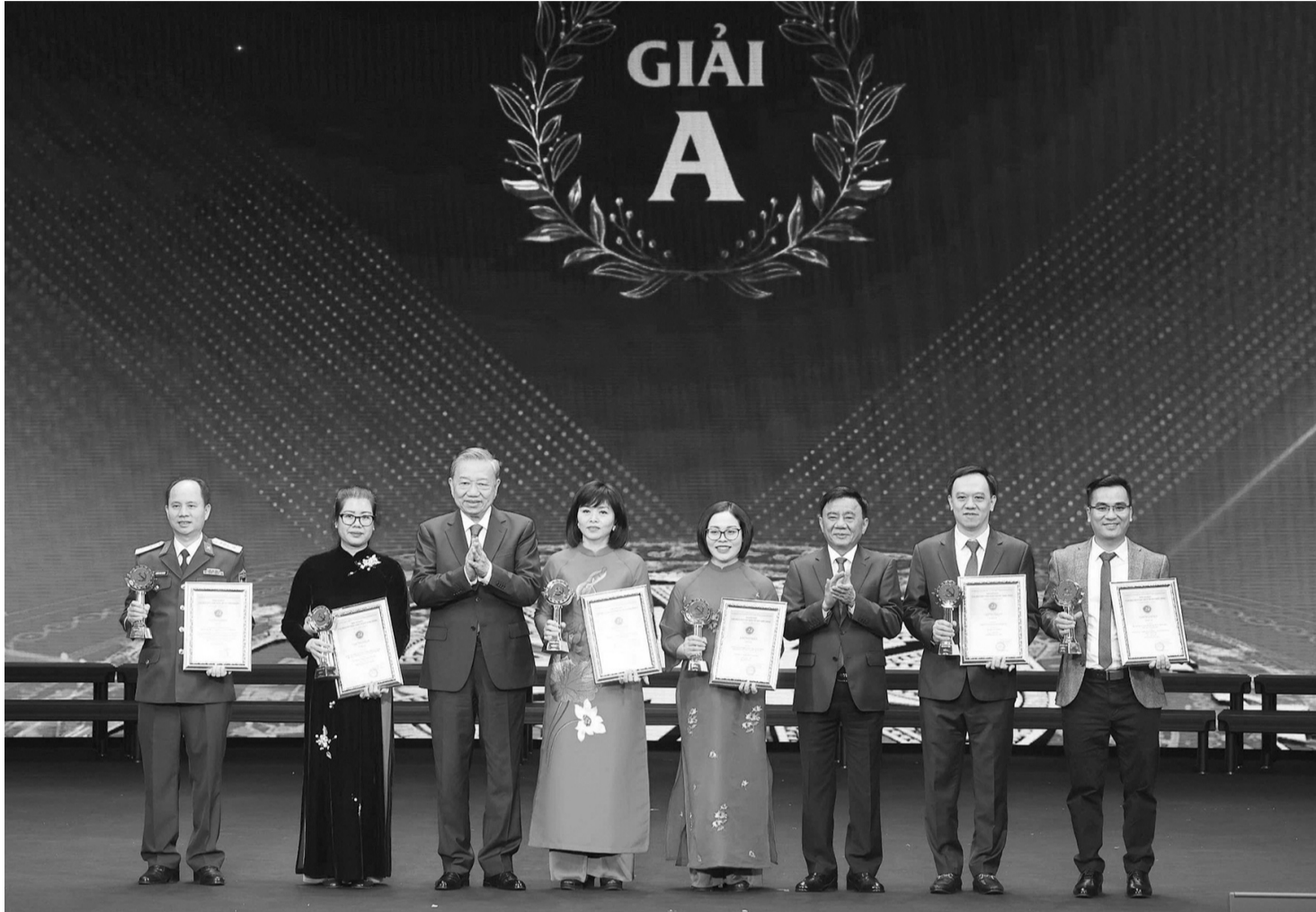
● Tổng Bí thư Tô Lâm và đồng chí Trần Cẩm Tú, Ủy viên Bộ Chính trị, Thường trực Ban Bí thư, Chủ nhiệm Ủy ban Kiểm tra Trung ương trao giải A cho các tác giả, nhóm tác giả.

Ngày 20/1, tại Nhà hát Hồ Gươm (Hà Nội), Tổng Bí thư Tô Lâm dự và phát biểu chỉ đạo tại Lễ trao Giải Báo chí toàn quốc về xây dựng Đảng (Giải Búa liềm vàng) lần thứ IX năm 2024. Báo Pháp luật Việt Nam vinh dự đạt giải A với loạt bài 5 kỳ “Chống hiểm họa từ doanh nghiệp sên sau”.