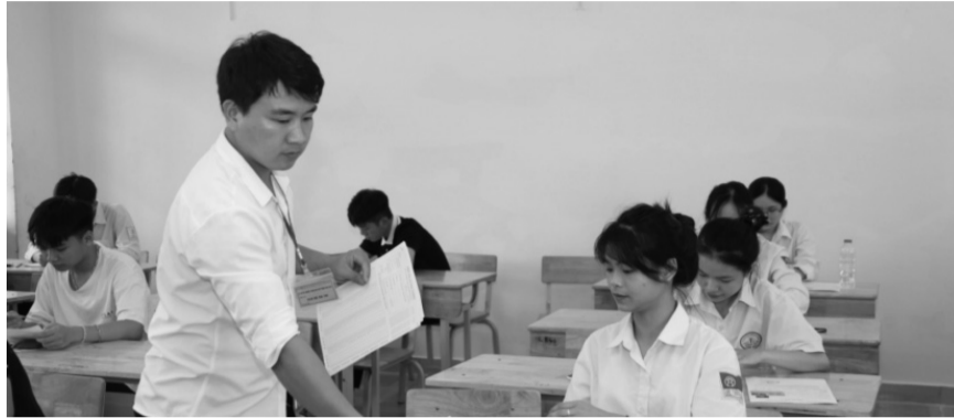
• Bộ Giáo dục và Đào tạo tăng cường thanh tra chuyên ngành trong lĩnh vực giáo dục.

Thực hiện quy chế chuyên môn, thực hiện nội dung, phương pháp giáo dục; việc quản lý, lựa chọn, sử dụng sách giáo khoa, tài liệu giáo dục, thiết bị dạy học và đồ chơi trẻ em. Thực hiện quy chế tuyển sinh, quản lý, giáo dục người học và các chế độ, chính sách đối với người học,