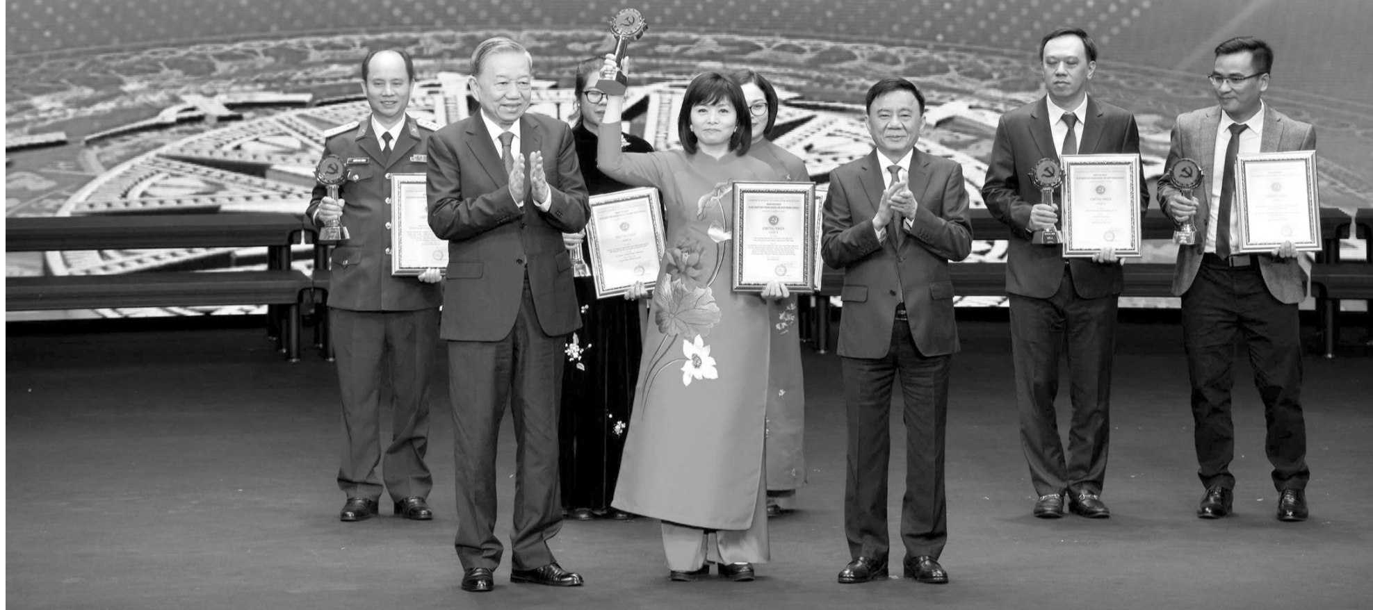
● Tổng Bí thư Tô Lâm trao Giải A cho Báo Pháp luật Việt Nam với loạt bài 5 kỳ "Chống hiểm họa từ doanh nghiệp sên sấu".

● Báo Pháp luật Việt Nam đạt Giải A, Giải Búa liềm vàng lần thứ IX - năm 2024