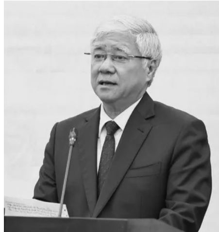
● Chủ tịch Ủy ban Trung ương Mặt trận Tổ quốc Việt Nam Đỗ Văn Chiến phát biểu tại Hội nghị.

Bộ Chính trị sẽ trình Ban Chấp hành Trung ương về phương án đối với các ban Đảng. Trong đó, sẽ kết thúc hoạt động của Ban Đối ngoại Trung ương, chuyển giao một phần về Bộ Ngoại giao, một phần về Văn