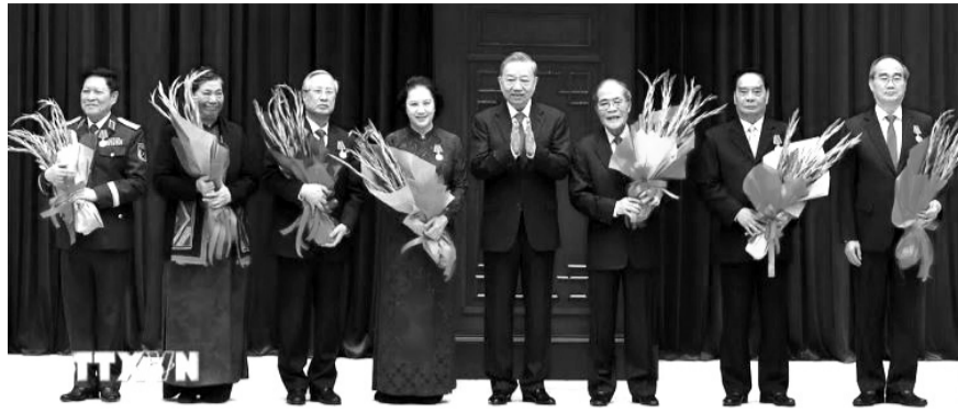
● Tổng Bí thư Tô Lâm trao tặng Huân chương Hồ Chí Minh và tặng hoa chúc mừng cho các nguyên lãnh đạo Đảng, Nhà nước.

Tổng Bí thư nhận định, từ nay đến năm 2030 là giai đoạn quan trọng nhất để xác lập trật tự thế giới mới, đây cũng là thời kỳ, cơ hội chiến lược, giai đoạn nước rút của cách mạng Việt Nam để đạt mục tiêu chiến lược 100 năm dưới sự lãnh đạo của Đảng, tạo tiền đề vững chắc đạt mục tiêu 100 năm thành lập nước. Nếu để lỡ thời cơ là có lỗi với đất nước và Nhân dân. Đó là mệnh lệnh của thời đại.