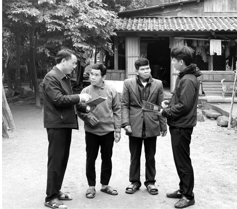
● Cán bộ Ngân hàng Chính sách huyện Minh Hóa về tận cơ sở để hướng dẫn việc sử dụng vốn vay cho bà con.

Độ-Tà Vòng là bản vùng rẻo cao, đặc biệt khó khăn của xã Trọng Hóa, huyện Minh Hóa, tỉnh Quảng Bình. Toàn bản có 86 hộ dân thì đã có đến 97% hộ thuộc hộ đồng bào dân tộc thiểu số. Trong những năm qua, nguồn vốn tín dụng chính sách đã được triển khai thực hiện cho vay đến bà con nơi đây, bà con người dân tộc đã mạnh dạn vay vốn lãi suất ưu đãi để chăn nuôi, trồng rừng và phát triển kinh tế.