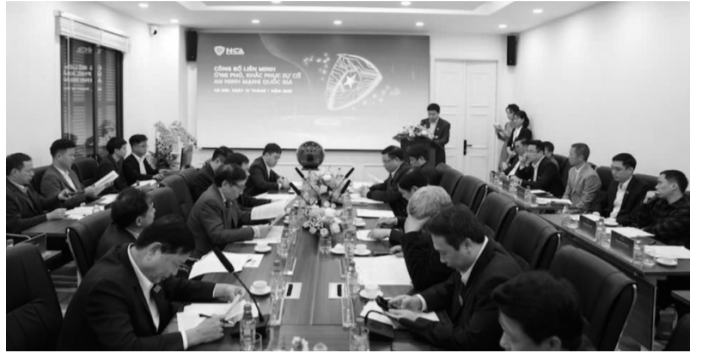
● Công bố quyết định thành lập Liên minh ứng phó, khắc phục sự cố an ninh mạng quốc gia.

Ngày 20/1, tại Hội nghị tổng kết năm 2024 và triển khai nhiệm vụ 2025 của Hiệp hội An ninh mạng quốc gia, dưới sự chứng kiến của Đại tướng Lương Tam Quang, Ủy viên Bộ Chính trị, Bộ trưởng Bộ Công an, Chủ tịch Hiệp hội, Trung tướng Nguyễn Minh Chính - Cục trưởng Cục An ninh mạng và Phòng, chống tội phạm sử dụng công nghệ cao - Bộ Công an, Phó Chủ tịch Thường trực Hiệp hội đã công bố quyết định thành lập Liên minh ứng phó, khắc phục sự cố an ninh mạng quốc gia.