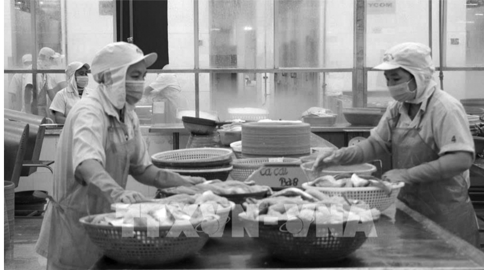
● Việc Việt Nam và Hoa Kỳ đạt được giải pháp song phương để giải quyết vụ kiện cá tra, basa là kết quả của thiện chí và nỗ lực đàm phán từ cả 2 phía.

Việt Nam và Hoa Kỳ đạt được giải pháp song phương để giải quyết vụ kiện cá tra, basa là kết quả của thiện chí và nỗ lực đàm phán từ cả 2 phía. Việt Nam hoan nghênh tinh thần xây dựng, thái độ thiện chí và nỗ lực tìm kiếm giải pháp song phương của phía Hoa Kỳ, đặc biệt là Bộ Thương mại Hoa Kỳ (DOC) và Cơ quan Đại diện Thương mại Hoa Kỳ (USTR). Đồng thời, việc Hoa Kỳ thực thi phán quyết của WTO cũng góp phần quan trọng trong việc thể hiện thiện chí tăng cường mối quan hệ nhiều mặt giữa Việt Nam và Hoa Kỳ, nhất là trong bối cảnh 2 nước đã nâng cấp quan hệ Đối tác chiến lược toàn diện.