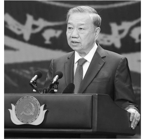
● Tổng Bí thư Tô Lâm phát biểu tại Lễ trao giải

báo chí tham dự Giải Búa liềm vàng năm 2024 là đã phản ánh sinh động, kịp thời những sự kiện, sinh hoạt chính trị của Đảng như Hội nghị Trung ương lần thứ 9, 10 và các nghị quyết của Ban Chấp hành Trung ương (khóa XIII), tạo diễn đàn sôi nổi về các vấn đề như tổng kết công tác xây dựng Đảng cả nhiệm kỳ và việc thi