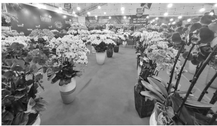
● Nhiều chợ hoa khai trương sớm nhưng cũng chưa thu hút được đông người mua sắm.