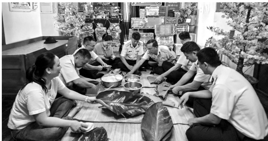
● Cán bộ, chiến sĩ trên Nhà giàn gói bánh chưng đón Tết.