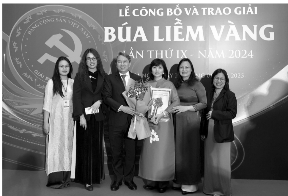
● Bộ trưởng Bộ Tư pháp Nguyễn Hải Ninh chúc mừng Báo Pháp luật Việt Nam đạt Giải A, Giải Búa liềm vàng lần thứ IX - năm 2024.

quốc về xây dựng Đảng - “Búa liềm vàng” tiếp tục nghiên cứu, đổi mới, cải tiến công tác tổ chức, chỉ đạo hiệu quả, phát huy tinh thần tích cực, chủ động, năng động, sáng tạo của các cơ quan báo chí và đội ngũ báo chí nước nhà; nâng cao hơn nữa chất lượng Giải để ngày càng có nhiều tác phẩm xứng tầm với thành tựu vĩ đại của công cuộc đổi