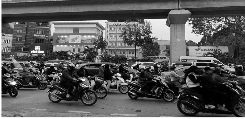
● Một số tuyến đường ken đặc xe vào những ngày cuối năm.

Theo ghi nhận của phóng viên, một số nút giao thông là "điểm nóng" ùn tắc như Ngã Tư Sở, Nguyễn Trãi, Khuất Duy Tiến, Lê Văn Lương, Giảng Võ, Mai Dịch... luôn trong tình trạng ken đặc người và xe. Không chỉ các tuyến đường lớn, mà ngay cả những con ngõ nhỏ hay đường nhánh, vốn được nhiều người sử dụng để "né tắc", cũng không thoát khỏi cảnh chen chúc. Nếu trước đây, tình trạng ùn tắc giao thông chủ yếu xảy ra trong khung giờ cao điểm từ 7 - 9h sáng và 17 - 20h tối, nhưng hiện tại