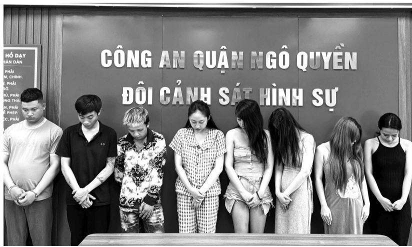
● Nhóm đối tượng trong đường dây môi giới mại dâm, mua bán và tổ chức sử dụng ma túy bị Công an Hải Phòng bắt hồi cuối năm 2024.