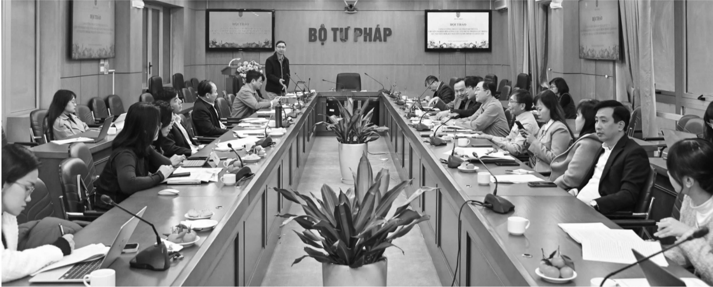
● Bộ Tư pháp tổ chức Hội thảo “Tăng cường phân cấp, phân quyền trong xây dựng pháp luật” vào ngày 26/12/2024.

Bên cạnh những kết quả đạt được, thực tế cho thấy vấn đề phân cấp, phân quyền trong xây dựng pháp luật vẫn còn hạn chế và chồng chéo. Trong đó, nguyên nhân chủ yếu xuất phát từ cách hiểu chưa thống nhất của các quy định pháp luật.