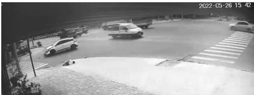
● Vụ TNGT xảy ra vào ngày 26/5/2022.

Tuy nhiên, ngày 26/5/2022, khi đang bị khởi tố, bị cấm đi khỏi nơi cư trú và đang bị tạm giữ GPLX để hành vi gây ra TNGT chết người, ông Danh bị cho là tiếp tục lái xe ô tô khác và tiếp tục xảy ra va chạm với xe máy khiến người chạy xe máy tử vong.