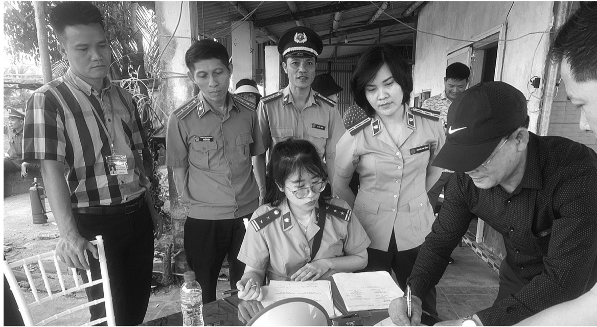
● Cưỡng chế THADS ở Đò Sơn, Hải Phòng.

Bên cạnh đó, trình tự, thủ tục xử lý tài sản (nhất là thủ tục xử lý bất động sản) còn khá phức tạp, mất nhiều thời gian, ảnh hưởng lớn đến hiệu quả giải quyết thi hành án cho các tổ chức tín dụng, ngân hàng.