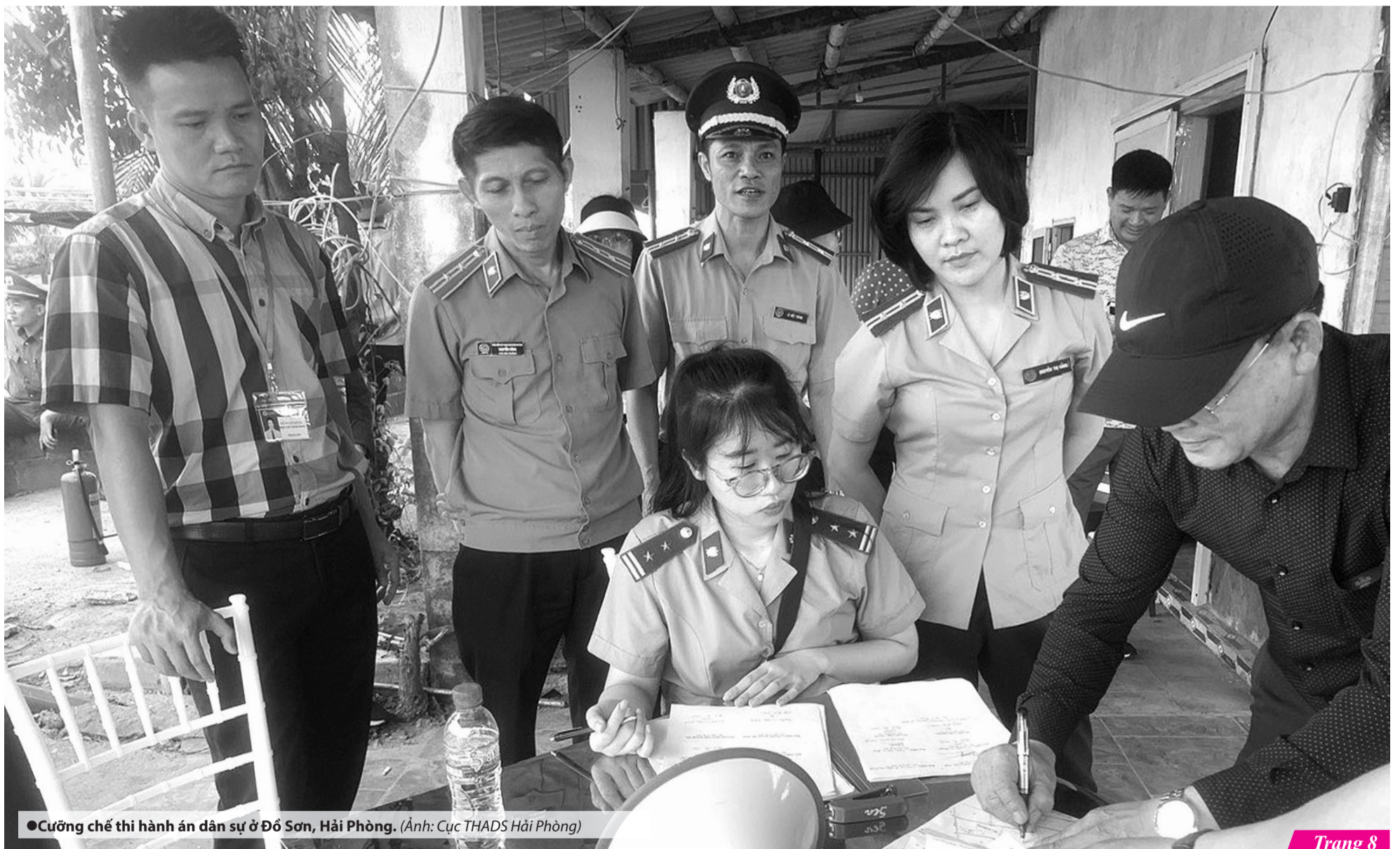
●Cường chế thi hành án dân sự ở Đồ Sơn, Hải Phòng.