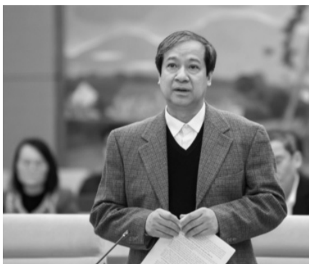
● Bộ trưởng Bộ Giáo dục và Đào tạo Nguyễn Kim Sơn phát biểu.

Dự thảo Luật Nhà giáo - một dự luật được dư luận xã hội rất quan tâm đã được trình Quốc hội cho ý kiến tại Kỳ họp thứ 8. Sau tiếp thu, chỉnh lý, dự thảo Luật gồm 9 chương, 46 điều với nhiều chính sách ưu đãi dành cho các nhà giáo.