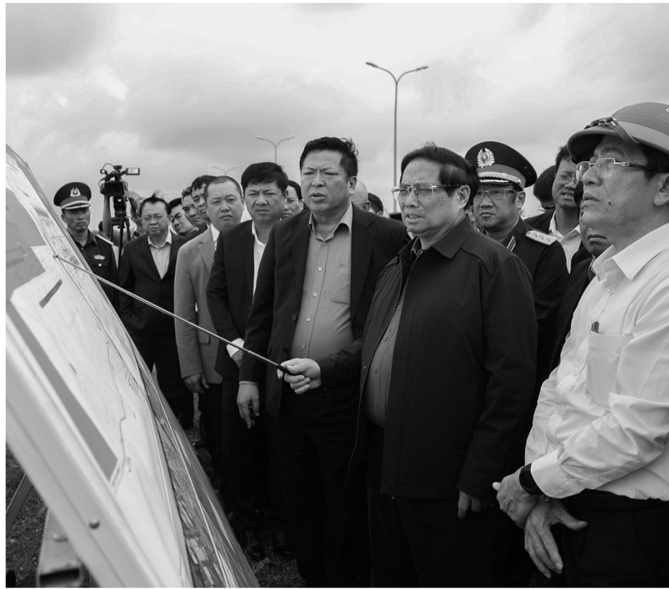
● Thủ tướng Chính phủ Phạm Minh Chính giao các Bộ, ngành phối hợp với tỉnh Quảng Nam hoàn thiện trình hồ sơ Quy hoạch Cảng hàng không quốc tế Chu Lai giai đoạn 2021 - 2030, tầm nhìn đến 2050 để trình Thủ tướng Chính phủ phê duyệt.

Tại dự án đường ven biển Dung Quất - Sa Huỳnh (đoạn qua thôn Minh Tân Nam, xã Đức Minh, huyện Mộ Đức), Thủ tướng cho biết, đây là tuyến đường chạy song song bờ biển và quỹ đất hai bên rộng lớn, thông thoáng là lợi thế rất lớn để Quảng Ngãi khai thác triệt để tiềm năng, lợi thế khi hoàn thành, đưa công trình vào khai thác. Thủ tướng đề nghị Quảng Ngãi xây dựng một số cầu trên tuyến, tính toán tính kết nối sao thuận lợi nhất. "Tinh thần là qua sông bắc cầu, qua ruộng đắp đất, qua núi khoét núi. Làm tuyến đường cho thẳng, đẹp, chất lượng để tạo động lực phát triển trong tương lai", Thủ tướng nhấn mạnh.