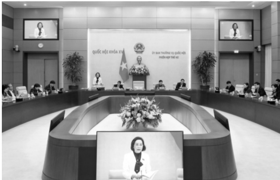
● Ủy ban Thường vụ Quốc hội cho ý kiến về việc giải trình, tiếp thu, chỉnh lý dự thảo Luật Nhà giáo.

Bên cạnh đó, dự thảo Luật cũng đã bổ sung quy định về trình độ chuẩn được đào tạo đối với nhà giáo dạy môn học đặc thù, nhà giáo làm nhiệm vụ đào tạo,