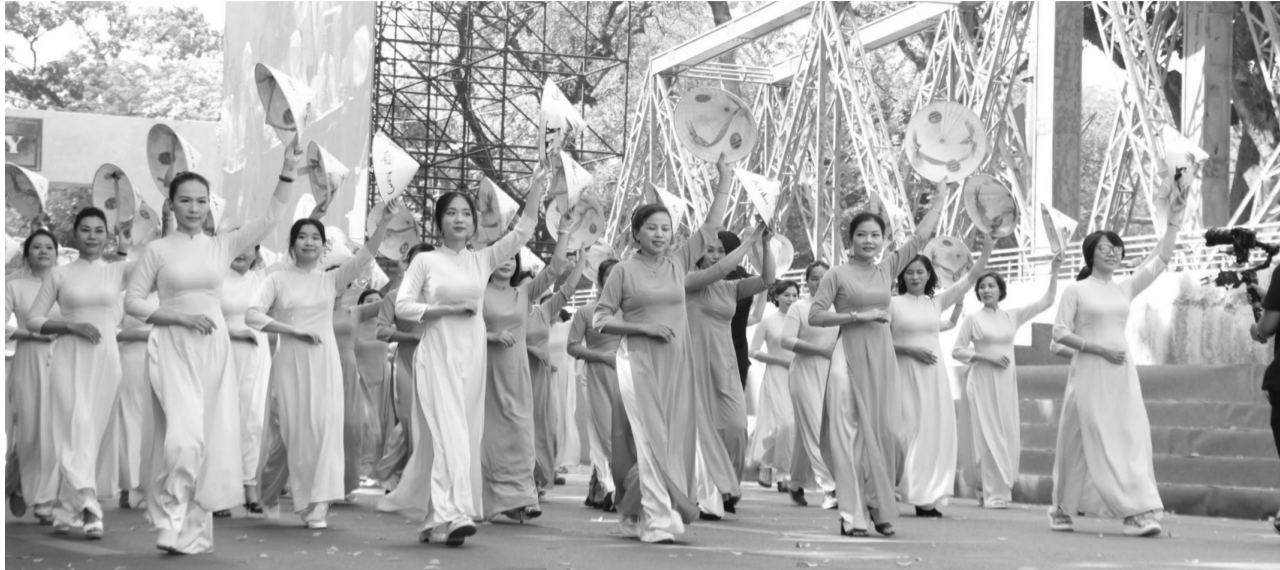
● Đoàn đại biểu Hội LHPN Hà Nội tại Lễ kỷ niệm 70 năm Giải phóng Thủ đô tháng 10/2024.

Những bước tiến trong bình đẳng giới đã khẳng định vị thế của phụ nữ Việt Nam trên hành trình xây dựng đất nước. Trong kỷ nguyên mới - kỷ nguyên vươn mình của dân tộc Việt Nam, công tác phụ nữ hứa hẹn những bước tiến vượt bậc nhờ vào những chủ trương, chính sách của Đảng, Nhà nước và nỗ lực của cả hệ thống chính trị.