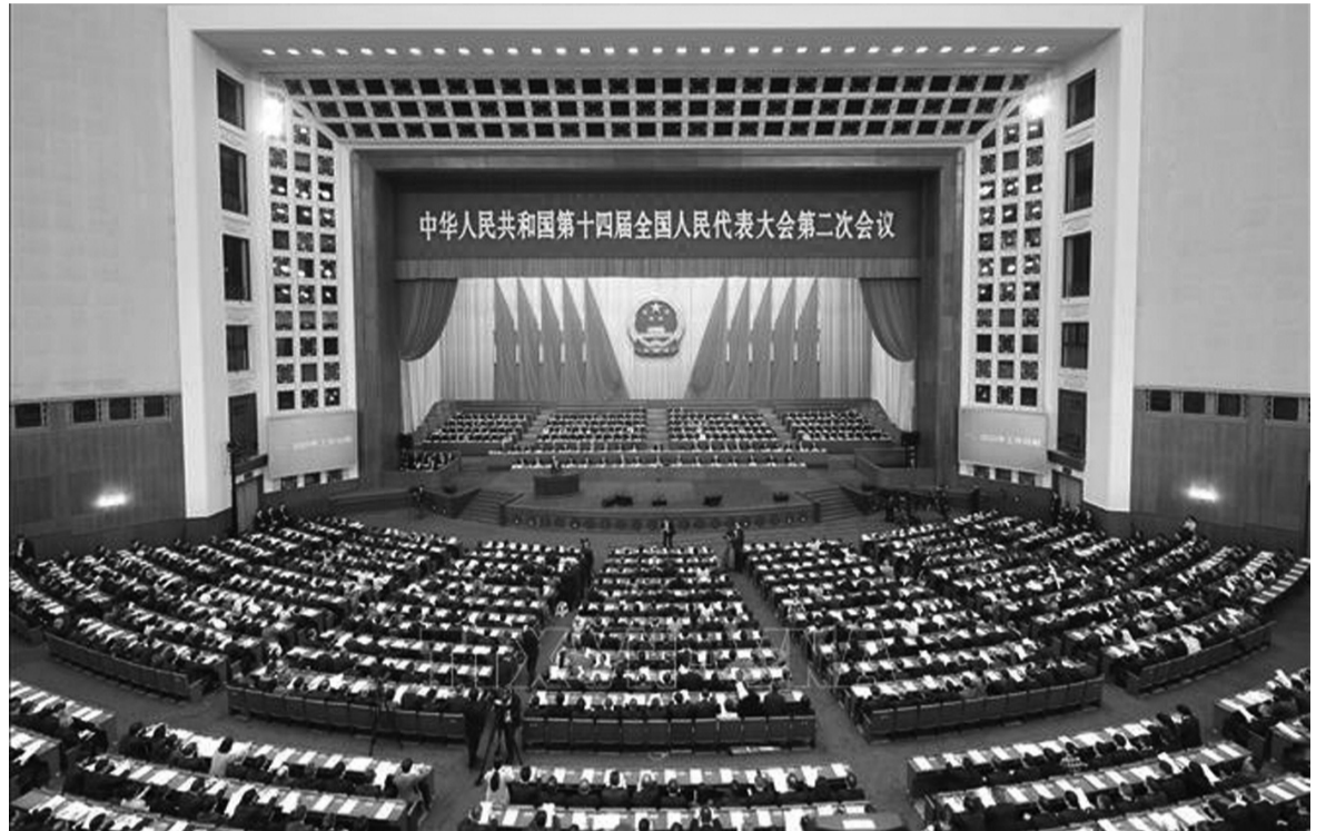
● Quang cảnh một kỳ họp của Đại biểu Nhân dân Toàn quốc (Nhân Đại - tức Quốc hội) Trung Quốc khóa XIV.

Ở Canada, sau khi được Bộ Tư pháp soạn thảo và được lãnh đạo của Bộ đặt hàng dự luật nhất trí và được Hội đồng Cơ mật chấp thuận thì dự án luật sẽ được trình QH xem xét. Quy trình xem xét và thông qua luật rất phức tạp vì phải qua 3 lần xem xét của Hạ viện và 3 lần xem xét của Thượng viện. Sau khi dự luật được soạn thảo thì phải thông báo cho Hạ viện thông qua chỉ gồm tên và tiêu đề của dự luật (mục đích của dự luật; cơ quan trình; tài liệu gửi kèm). Nếu