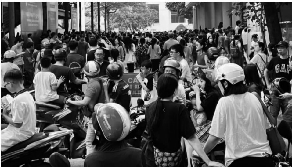
● Dạy thêm, học thêm luôn là vấn đề "nóng" nhiều năm qua, khiến phụ huynh lo lắng.

Tổ chức dạy thêm ngoài nhà trường có thu tiền của học sinh phải đăng ký kinh doanh... Công khai trên cổng thông tin điện tử hoặc niêm yết tại nơi cơ sở dạy thêm đặt trụ sở về các môn học được tổ chức dạy thêm; thời lượng dạy thêm đối với từng môn học theo từng khối lớp; địa điểm, hình thức, thời gian tổ chức dạy thêm, học thêm; danh sách người dạy thêm và mức thu tiền học thêm trước khi tuyển sinh các lớp dạy thêm, học thêm. Giáo viên đang dạy học tại các nhà trường tham gia dạy thêm ngoài nhà trường phải báo cáo với Hiệu trưởng