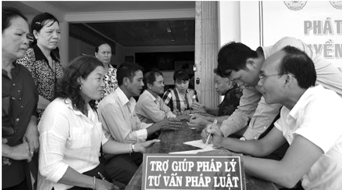
● Trợ giúp viên pháp lý tư vấn cho người dân. (Ảnh minh họa)

Trong năm 2024, số vụ việc trợ giúp pháp lý (TGPL) tham gia tố tụng hoàn thành là 30.538 vụ việc (tăng 19% so với cùng kỳ năm 2023) và là con số cao nhất từ trước đến nay. Đây là kết quả nỗ lực của cả hệ thống TGPL ở Trung ương và địa phương, góp phần bảo vệ quyền con người, quyền công dân, quyền công bằng trong tiếp cận công lý và công bằng trong xét xử.