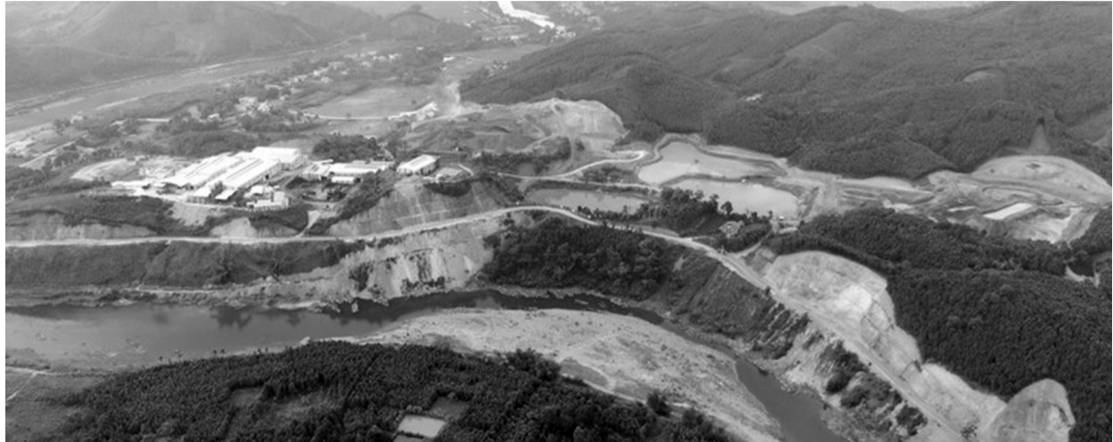
● Mỏ đất hiếm tại Yên Bái của Cty Thái Dương.

Như PLVN phản ánh, Cơ quan Cảnh sát điều tra, Bộ Công an vừa ban hành Kết luận điều tra (KLĐT) đề nghị truy tố 27 bị can trong vụ án Cty CP Tập đoàn Thái Dương và các đơn vị liên quan. Trong đó, Bộ Công an kiến nghị cơ quan có thẩm quyền cần tăng cường công tác quản lý, giám sát, thanh tra, kiểm tra đối với lĩnh vực cấp phép thăm dò, khai thác và chế biến tài nguyên.