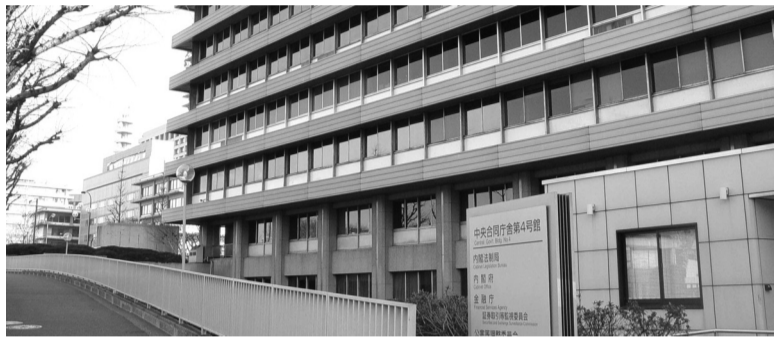
● Tòa nhà Chính phủ Trung ương số 4, nơi đặt Cục Pháp chế Nội các Nhật Bản.

Xuất phát từ cơ sở chính trị, cơ sở pháp lý và cơ sở thực tiễn hiện nay, việc sửa đổi Luật Ban hành văn bản quy phạm pháp luật (VBQPPL) là rất cần thiết. Việc nghiên cứu, tham khảo kinh nghiệm của các nước trên thế giới sẽ góp phần giúp dự thảo Luật Ban hành VBQPPL (sửa đổi) ngày càng hoàn thiện, tạo khuôn khổ pháp lý cho việc xây dựng và vận hành hệ thống VBQPPL thống nhất, đồng bộ, minh bạch, khả thi, dễ tiếp cận, hiệu lực và hiệu quả, dễ áp dụng.