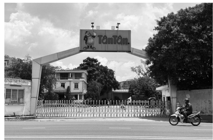
● Công ty Cổ phần Tân Tân.