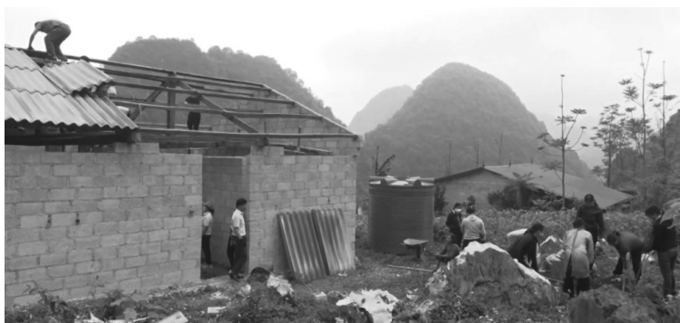
● Chương trình hỗ trợ xóa nhà tạm, nhà dột nát trên phạm vi cả nước đã huy động được sự vào cuộc của cả hệ thống chính trị - xã hội, đã huy động được trên 5.000 tỷ đồng. (Ảnh minh họa: INT)