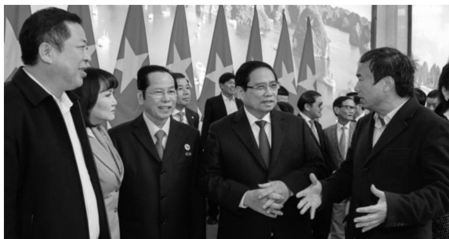
● Thủ tướng Phạm Minh Chính trao đổi với các doanh nghiệp.

năm 2021 - 2025, là năm tăng tốc, bứt phá, về đích. Với quan điểm phát triển đột phá, chủ động quyết định tương lai, lấy phát triển để duy trì ổn định, ổn định để thúc đẩy phát triển, Chính phủ đã xác định đặt mục tiêu tăng trưởng năm 2025 phải đạt 8% trở lên, tạo nền tảng vững chắc để tăng trưởng hai con số từ năm 2026 nhằm hiện thực hóa khát vọng, tầm nhìn về kỷ nguyên phát triển mới và mục tiêu chiến lược đến năm 2030, nước ta trở thành nước đang phát triển có công nghiệp hiện đại, thu nhập trung bình cao và năm 2045, phải trở thành nước phát triển, thu nhập cao.