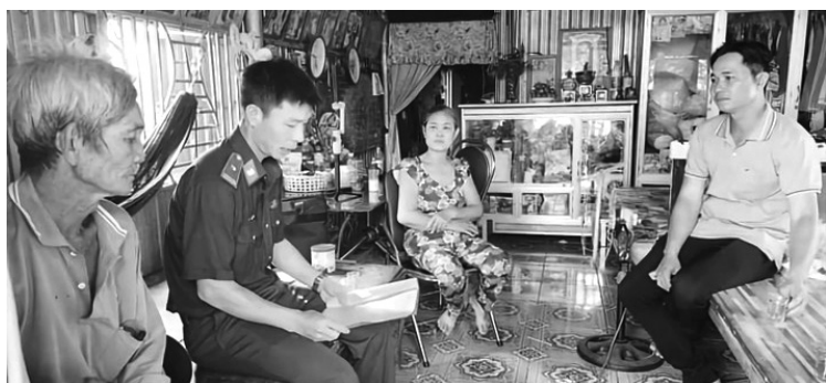
● Cán bộ Đồn Biên phòng Sông Trăng tuyên truyền, phổ biến, giáo dục pháp luật tới người dân.

Ba năm triển khai Đề án “Phát huy vai trò của lực lượng QĐND tham gia công tác phổ biến, giáo dục pháp luật (PBGDPL), vận động Nhân dân chấp hành pháp luật tại cơ sở giai đoạn 2021 - 2027” (Đề án 1371), các đơn vị Bộ đội Biên phòng (BĐBP) đã giúp người dân trên địa bàn hiểu và nắm rõ chủ trương, đường lối của Đảng, chính sách, pháp luật của Nhà nước, quy định của địa phương để từ đó tạo sự chuyển biến về nhận thức, ý thức chấp hành pháp luật của cán bộ và Nhân dân