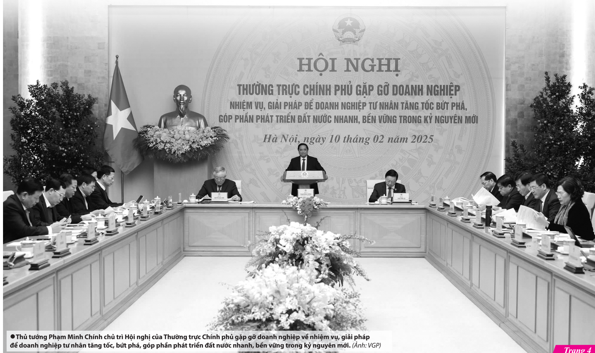
● Thủ tướng Phạm Minh Chính chủ trì Hội nghị của Thường trực Chính phủ gặp gỡ doanh nghiệp về nhiệm vụ, giải pháp để doanh nghiệp tư nhân tăng tốc, bứt phá, góp phần phát triển đất nước nhanh, bền vững trong kỷ nguyên mới.