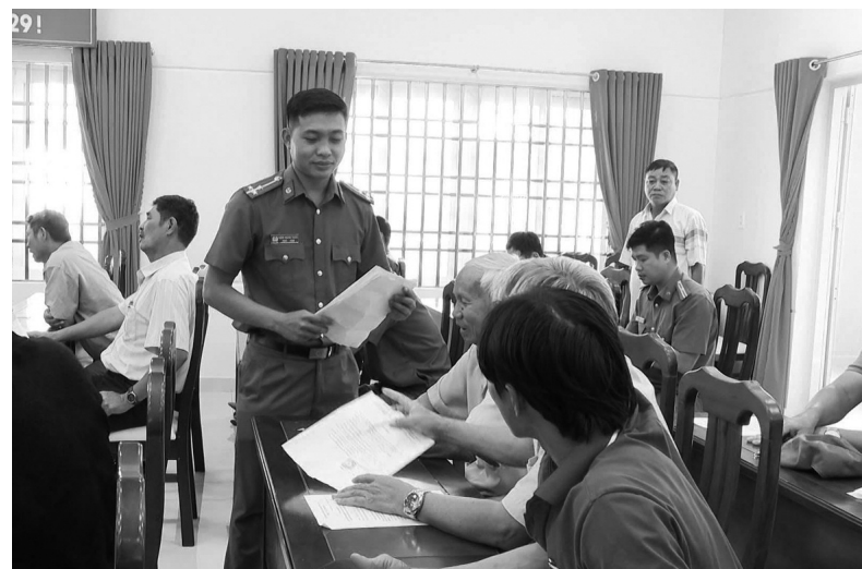
● Một hội nghị tuyên truyền, ký cam kết phòng, chống tội phạm ma túy với các chủ ghe, tàu.

Theo thống kê, hiện toàn tỉnh BR-VT có khoảng 4.481 tàu cá, trong đó, tàu hoạt động vùng khơi 2.534, vùng lộng 599, vùng ven bờ 1.348. Thời gian gần đây, do nguồn lao động đi biển thiếu hụt, nhiều chủ tàu buộc phải thuê lao động từ nhiều địa phương khác, dù chưa nắm rõ lai lịch. Điều này dẫn