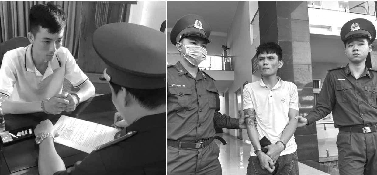
● Một số đối tượng vi phạm về ma túy bị ĐBQP BR-VT bắt giữ.

Tại Hội nghị, Công an xã Phước Tỉnh cho biết, tình hình tội phạm và tệ nạn xã hội, đặc biệt là vi phạm liên quan ma túy, đang diễn biến phức tạp. Các đối tượng tội phạm thường trà trộn vào các ghe, tàu, lợi dụng sự thiếu kiểm soát của chủ tàu và lực lượng chức năng để thực hiện các hành vi mua bán, sử dụng trái phép chất ma túy ngay trên biển.