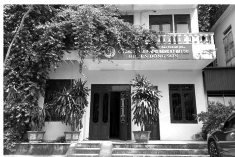
● Chi nhánh Văn phòng ĐKĐĐ huyện Đông Sơn (cũ) bị đề nghị rút kinh nghiệm.

Sau khi xác định mốc giới, ranh giới và tiến hành đo đạc xong, ông Hưng ký và chuyển bản đo đạc kèm bản mô tả chi tiết mốc giới, ranh giới cho UBND xã (chuyên