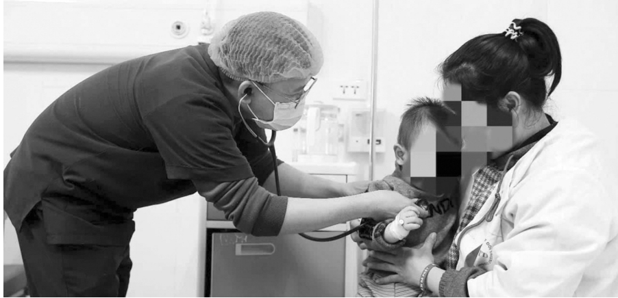
● Số ca nhập viện do cúm A có xu hướng gia tăng ở mọi lứa tuổi.

Bên cạnh người cao tuổi và người có bệnh nền, trẻ nhỏ mắc cúm cũng có nguy cơ gặp nhiều biến chứng nghiêm trọng. Thời gian qua, Bệnh viện Nhi Hà Nội đã tiếp nhận và điều trị cho hơn 1.000 ca mắc cúm, trong đó nhiều trường hợp có biến chứng phải nhập viện điều trị nội trú. Đáng chú ý, Bệnh viện đã tiếp nhận một số trẻ bị biến chứng viêm não do cúm, như hiện tại là một bệnh nhi 12 tuổi, tiền sử khỏe mạnh nhưng mắc cúm và biến chứng thành