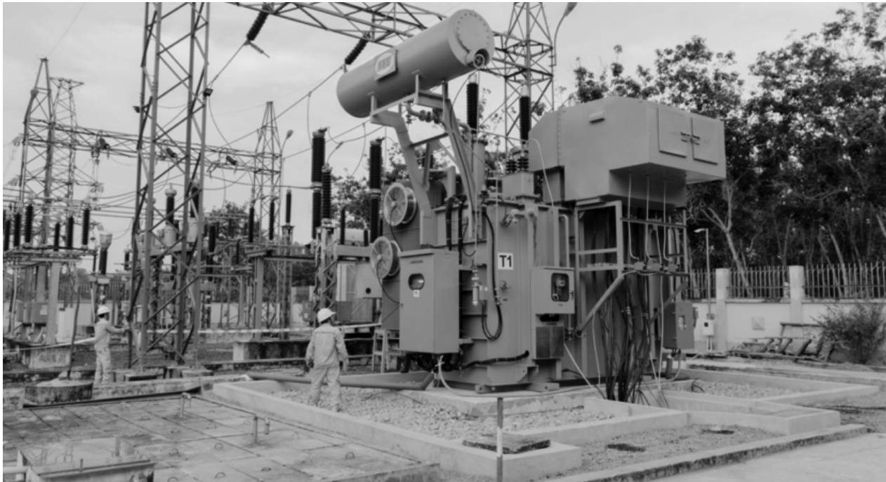
• Kiểm tra các thiết bị trước khi đóng điện máy biến áp T1, Trạm biến áp 110kV Thạch Đức, Gò Dầu, Tây Ninh.