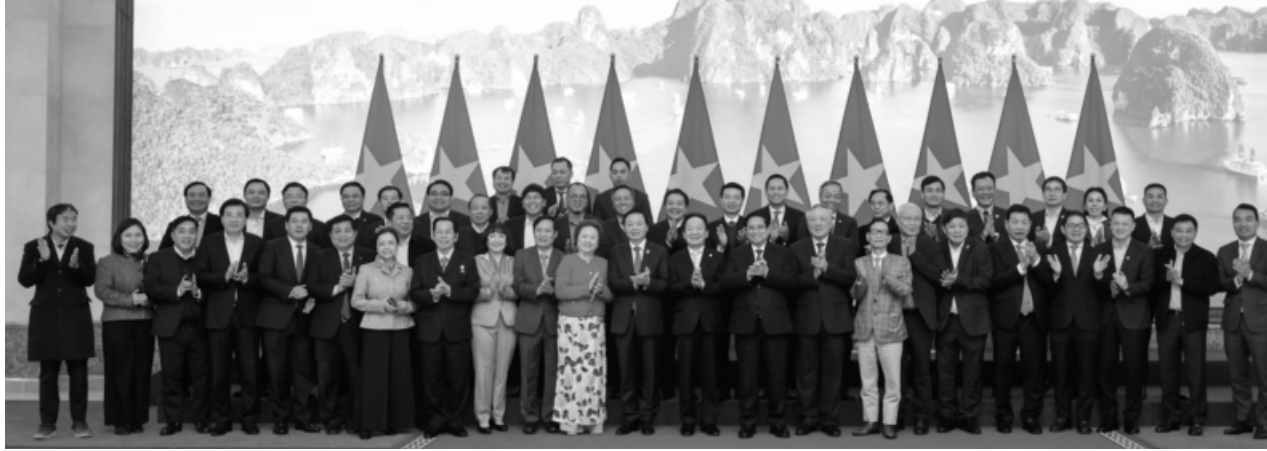
● Thủ tướng Phạm Minh Chính và các đại biểu, doanh nghiệp dự hội nghị.

Cùng với sự quyết tâm của Chính phủ, tại buổi gặp gỡ ngày 10/2, nhiều doanh nghiệp đã đưa ra những cam kết, kiến nghị với Thường trực Chính phủ về nhiệm vụ, giải pháp để doanh nghiệp tư nhân tăng tốc, góp phần phát triển đất nước trong kỷ nguyên mới.