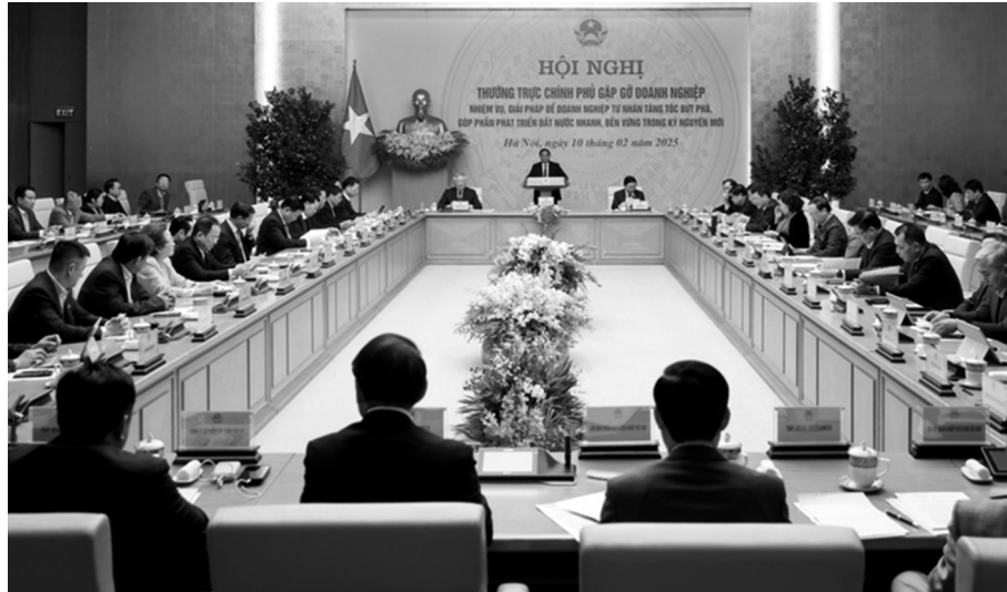
● Thủ tướng Phạm Minh Chính đề nghị các doanh nghiệp phấn đấu tăng trưởng ít nhất 2 con số, đóng góp triển khai các nhiệm vụ lớn của đất nước.

Năm 2025 có ý nghĩa đặc biệt quan trọng đối với đất nước. Đây là năm cuối thực hiện Kế hoạch phát triển KT-XH 5