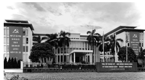
● UBND quận Long Biên.

Thực hiện Luật Đất đai, Nghị định 47/2014/NĐ-CP; Quyết định 10/2017/QĐ-