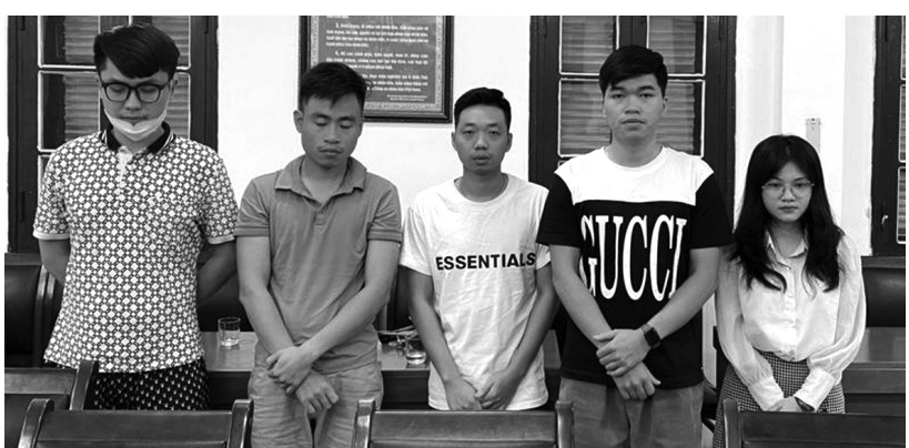
● Một số bị can trong vụ án.

Theo cáo trạng, nhóm này thường gọi điện, giới thiệu bán thuốc về mắt. Nếu khách hàng đồng ý mua, nhóm này thuê đơn vị vận chuyển là Cty CP