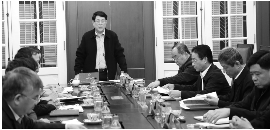
● Chủ tịch nước Lương Cường chủ trì cuộc họp với Văn phòng Chủ tịch nước về triển khai công tác tư pháp năm 2025.

Đồng thời, phải đánh giá toàn diện, đầy đủ để Ban Chỉ đạo tiếp tục triển khai các hoạt động một cách hiệu quả,