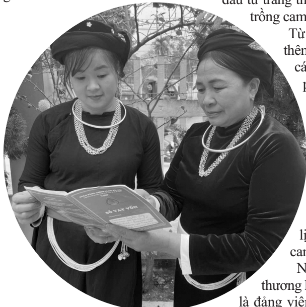
● Các nữ đảng viên trao đổi kinh nghiệm khi vay vốn chính sách phát triển kinh tế.

Những ngày đầu Xuân năm mới, về vùng cam Cao Phong (tỉnh Hòa Bình) có lẽ là thời điểm hấp dẫn nhất, khi những vườn cam, bưởi sai trĩu quả, chín mọng trên cành đang gấp rút thu hoạch để đưa đi khắp mọi miền. Một vụ cam bội thu nữa lại về với bà con nông dân nơi đây. Với hiệu quả kinh tế cao mà cây cam mang lại, tỉnh Hòa Bình xác định cây cam nói riêng và cây có múi nói chung là cây trồng chủ lực của địa phương.