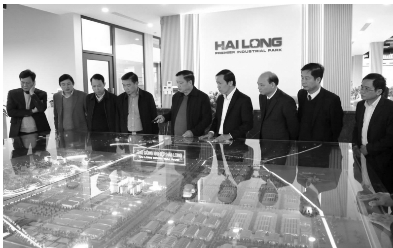
● Lãnh đạo tỉnh và các đại biểu tham quan mô hình quy hoạch tổng quan KCN Hải Long.