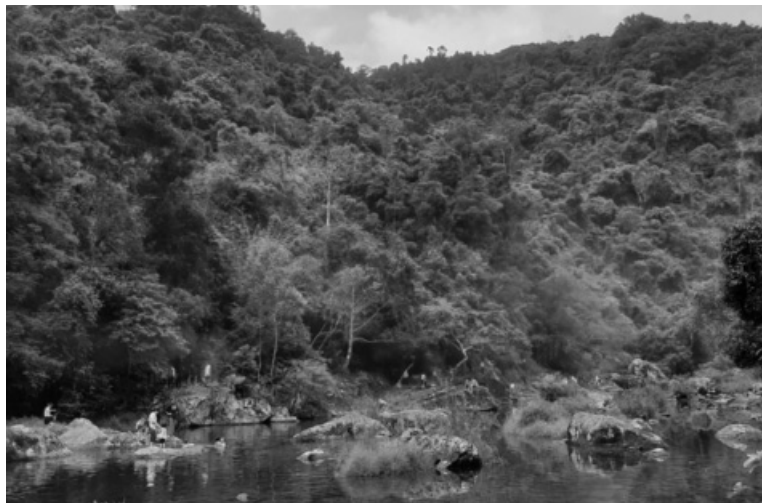
● Công tác phòng, chống cháy rừng trong mùa lễ hội đòi hỏi sự chủ động từ cả chính quyền và cộng đồng.

Trong cuộc chiến phòng ngừa nguy cơ cháy rừng, lực lượng chức năng đóng vai trò nòng cốt, nhưng sự tham gia của