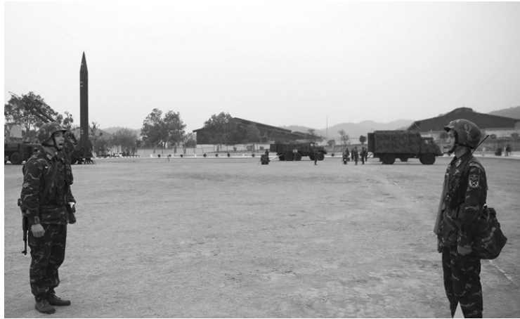
● Tổng Bí thư Tô Lâm và các đại biểu kiểm tra thực tế mô phỏng 1 nhiệm vụ phóng tên lửa tại Lữ đoàn Tên lửa 490.

Qua kiểm tra công tác, thấy tinh thần sẵn sàng chiến đấu, quyết tâm chiến thắng,