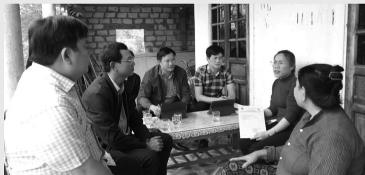
● Lãnh đạo huyện Phú Lộc gặp gỡ, lắng nghe tâm tư, nguyện vọng các hộ gia đình thuộc diện giải tỏa thực hiện dự án Kim Long Motors Huế.

Theo Ban quản lý KKT, công nghiệp TP Huế (BQL), trên địa bàn KKT Chân Mây - Lăng Cô có 54 dự án đầu tư còn hiệu lực với tổng vốn đầu tư đăng ký khoảng 83.690 tỷ đồng. Đến nay 28 dự án đã hoàn thành đưa vào hoạt động, 22 dự án đang triển khai thực hiện các thủ tục đầu tư xây dựng; 4 dự án chậm thực hiện, ngừng hoạt động.