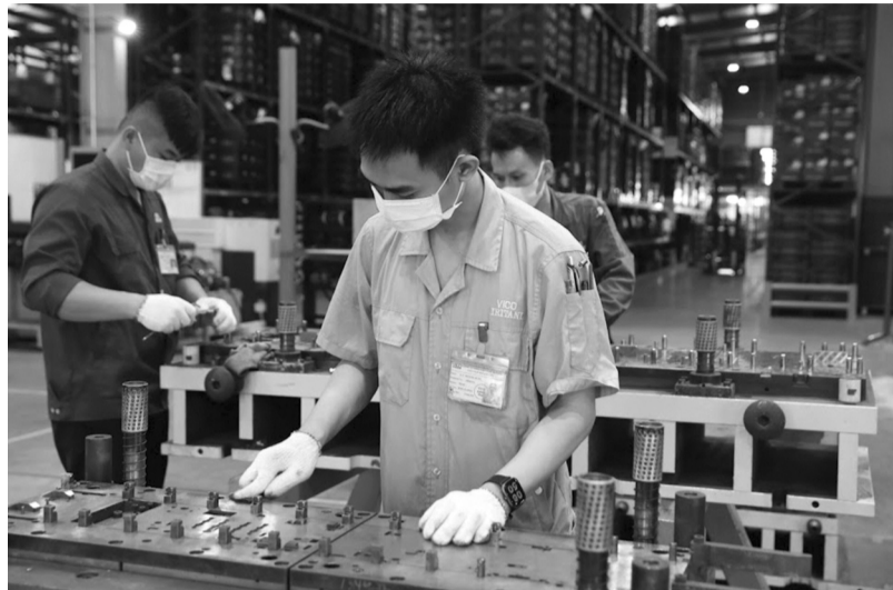
● Dự án đầu tư tại khu công nghệ cao phải đáp ứng các nguyên tắc, tiêu chí đối với dự án thực hiện hoạt động công nghệ cao. (Ảnh minh họa: HT)

Cam kết về việc đáp ứng các điều kiện, tiêu chuẩn, quy chuẩn kỹ thuật có liên quan theo quy định của pháp luật về xây dựng, bảo vệ môi trường, PCCC; không thực hiện các hành vi bị cấm theo quy định của pháp luật về xây dựng, bảo vệ môi trường, PCCC và chịu hoàn toàn trách nhiệm trong trường hợp không thực hiện đúng nội dung cam kết.