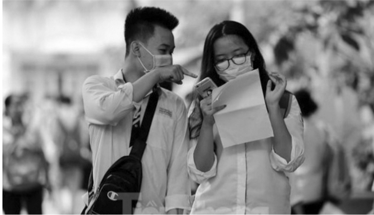
● Sẽ thay đổi thi cử, đánh giá để hạn chế dạy thêm, học thêm.