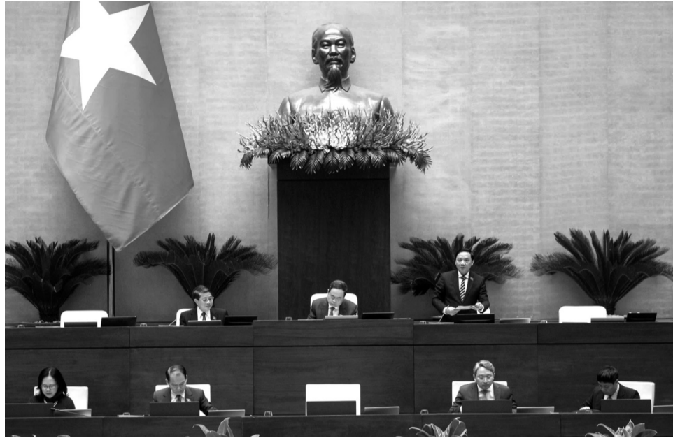
● Phó Chủ tịch Quốc hội Nguyễn Khắc Định điều hành nội dung phiên họp chiều 13/2.

Để tiếp tục hoàn thiện dự thảo Luật, các đại biểu đã tập trung thảo luận về các nội dung: tính hợp hiến, hợp pháp, tính thống nhất của dự thảo Luật với hệ thống pháp luật; các điều cấm; tính cụ thể; phản biện xã hội, tham vấn, góp ý đối với chính sách, dự thảo văn bản quy phạm pháp luật; sửa đổi, bổ sung, thay thế, bãi bỏ hoặc đình chỉ việc thi hành văn bản quy phạm pháp luật; việc xin ý kiến đối với các vấn đề lớn của hồ sơ chính sách và dự thảo văn bản quy phạm pháp luật; việc đăng tải văn bản quy phạm pháp luật trên cơ sở dữ liệu luật quốc gia; điều chỉnh chương trình lập pháp hằng năm; những trường hợp Quốc hội ban hành nghị quyết; trình tự xem xét, thông qua dự thảo luật, nghị quyết của Quốc hội, nghị quyết, pháp lệnh của Ủy ban Thường vụ Quốc hội; trình tự xem xét, thông qua dự thảo luật, nghị quyết tại kỳ họp tiếp theo; nghị định, nghị quyết của Chính phủ; đánh giá tác động khi ban hành nghị định;