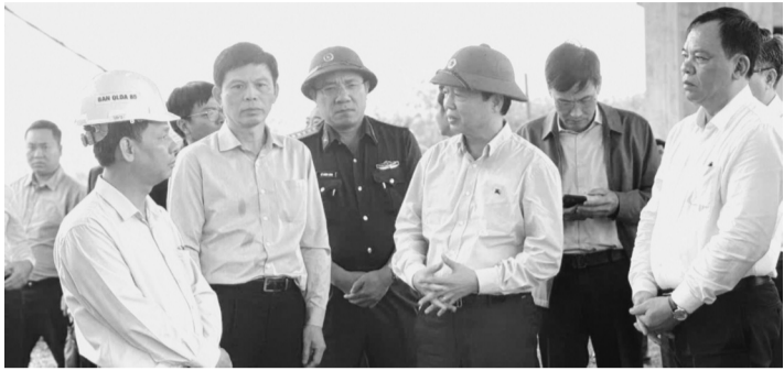
● Phó Thủ tướng Trần Hồng Hà kiểm tra dự án cao tốc Biên Hòa - Vũng Tàu.