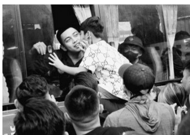
● Tân binh tạm biệt người thân.

Để làm tốt công tác tuyển quân, các địa phương đã thực hiện tốt công tác chính sách hậu phương quân đội với nhiều mô hình tiêu biểu, như: Xây tặng nhà hậu phương, trao sổ tiết kiệm tặng TNNN có hoàn cảnh khó khăn; gặp mặt tặng quà TNNN. TP Hà Nội tổ chức gặp mặt, tặng sổ tiết kiệm, tiền mặt và quà cho công dân nhập ngũ với tổng số tiền gần 20 tỷ đồng. Tại Đồng Nai, binh quân mỗi thanh niên trúng tuyển nghĩa vụ quân sự (NVQS) được tặng quà từ 2,5 - 5 triệu đồng.