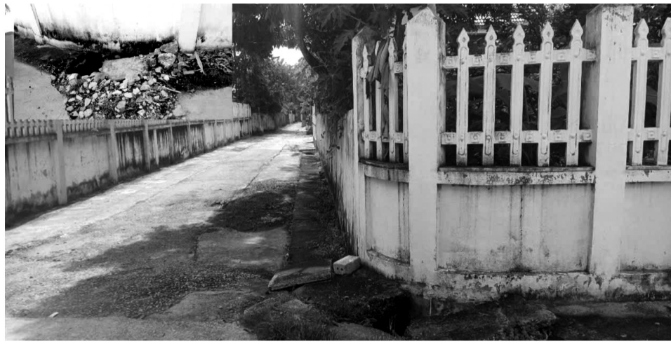
● Hạng mục công trình rãnh thoát nước đã được thanh tra, xác minh.

Liên quan sự việc có dấu hiệu vi phạm pháp luật trong xây dựng nông thôn mới (NTM) tại thôn Kim Bôi, xã Đông Thanh, huyện Đông Sơn, tỉnh Thanh Hóa; UBND huyện Đông Sơn (nay là TP Thanh Hóa) đã ban hành kết luận nội dung tố cáo; theo đó, nội dung công dân tố cáo sai phạm trong xây dựng các hạng mục công trình xây dựng NTM kiểu mẫu tại thôn Kim Bôi, là tố cáo đúng.