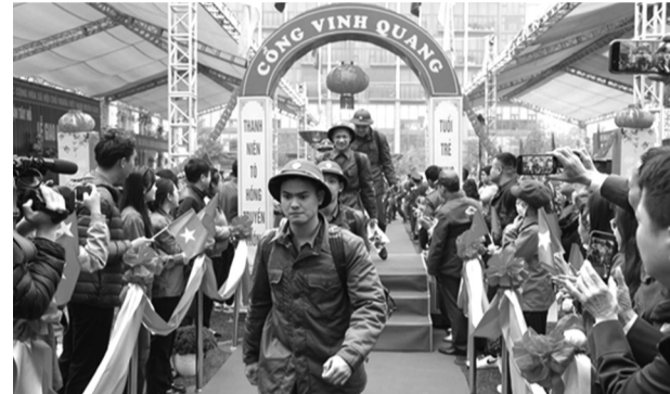
● Tân binh hăng hái lên đường nhập ngũ.