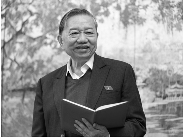
● Tổng Bí thư Tô Lâm phát biểu tại thảo luận Tổ.