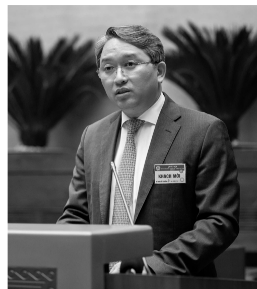
● Bộ trưởng Bộ Tư pháp Nguyễn Hải Ninh phát biểu, giải trình, làm rõ một số vấn đề đại biểu Quốc hội nêu.

Liên quan đến hướng dẫn văn bản áp dụng pháp luật, Bộ trưởng khẳng định, đây là vấn đề mới nhằm thể chế hóa ý kiến chỉ đạo của Bộ Chính trị tại Kết luận số 119-KL/TW ngày 20/01/2025 của Bộ Chính trị về định hướng đổi mới, hoàn thiện quy trình xây dựng pháp luật và ý kiến chỉ đạo của Tổng Bí thư tại Thông báo số 108-TB/VPTW về Kết luận của Tổng Bí thư Tô Lâm tại buổi làm việc với Ban Cán sự đảng Bộ Tư pháp ngày 7/11/2024. Theo Bộ trưởng, hiện nay Hiến pháp quy định là