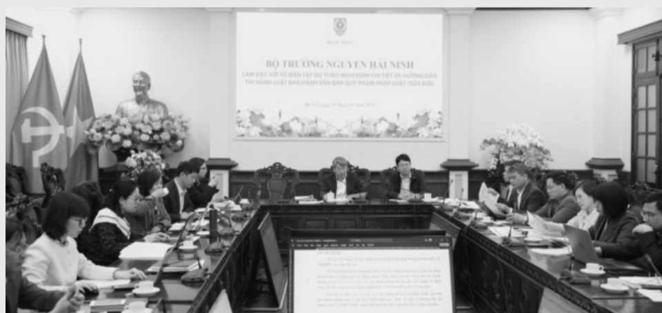
● Toàn cảnh buổi làm việc về Dự thảo Nghị định chi tiết và hướng dẫn thi hành Luật Ban hành văn bản quy phạm pháp luật (sửa đổi), ngày 13/2.

Trường hợp có hình thức bằng văn bản hành chính trái pháp luật, Bộ trưởng cho hay, nếu cơ quan có thẩm quyền phát hiện hoặc tự phát hiện văn bản của mình trái thì có quyền sửa đổi, bổ sung hoặc bãi bỏ văn bản đó hoặc khi xâm phạm đến quyền, lợi ích hợp pháp của cá nhân, tổ chức doanh nghiệp, các đối tượng có quyền khởi kiện hành chính theo quy định của Luật Tố tụng hành chính. DOÃN SON