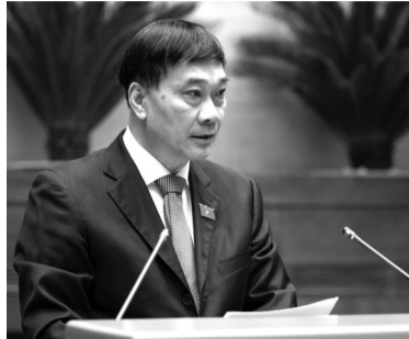
● Chủ nhiệm Ủy ban Kinh tế của Quốc hội Vũ Hồng Thanh trình bày báo cáo thẩm tra.

hàng khách và hàng hóa; tuyến chính đoạn từ ga Lào Cai Mới đến ga Nam Hải Phòng tốc độ thiết kế 160km/h, đoạn qua khu vực đầu mối Hà Nội tốc độ thiết kế 120km/h, các đoạn nối, tuyến nhánh tốc độ thiết kế 80km/h.