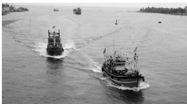
● Số lượng tàu cá tại Quảng Trị đã lắp đặt thiết bị giám sát hành trình (VMS) đạt 98,94%.

khai thác thủy sản đối với nhóm tàu cá có chiều dài từ 6m đến dưới 12m chưa được thực hiện đầy đủ... Để khắc phục hạn chế và triển khai thực hiện tốt các nhiệm vụ chống khai thác IUU trong thời gian tới, UBND tỉnh yêu cầu các sở, ban, ngành và UBND các huyện ven biển, huyện đảo Côn Cỏ tiếp tục tập trung cao điểm, huy động các nguồn lực triển khai đồng bộ các nhiệm vụ, giải pháp chống khai thác IUU theo đúng chỉ đạo của Ban Bí thư, Chính phủ, Thủ tướng Chính phủ.