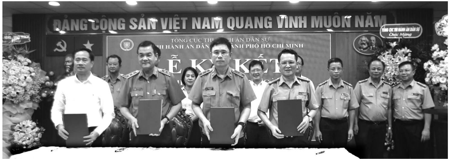
● Lãnh đạo các cơ quan nội chính TP Hồ Chí Minh ký kết phối hợp công tác THADS ngày 12/12/2024.

Cũng theo Cục THADS TP Hồ Chí Minh, cần tăng cường tổ chức thực hiện chủ trương, đường lối của Đảng và pháp luật về thu hồi tài sản trong các vụ án kinh tế tham nhũng, trên địa bàn Thành phố như: tăng cường trách nhiệm của Thủ trưởng các cơ quan tố tụng, THADS, cơ quan chức năng khác trên địa bàn Thành phố trong công tác quản lý, chỉ đạo điều hành đối với công tác