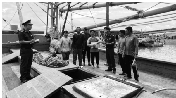
● Bộ đội Biên phòng Quảng Trị tuyên truyền cho ngư dân về chống khai thác IUU.

Điều 6 Luật NVQS 2015 quy định, công dân nữ trong độ tuổi thực hiện NVQS trong thời bình nếu tự nguyện và quân đội có nhu cầu thì được phục vụ tại ngũ. Thực tế cho thấy, ngày càng có nhiều những nữ tân binh tự tin, tình nguyện thực hiện NVQS cùng khát khao cháy bỏng được cống hiến cho Tổ quốc, phục vụ lâu dài trong quân đội; truyền cảm hứng cho đồng bào thanh niên.