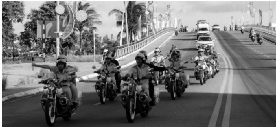
● Thời gian qua, tỉnh Kiên Giang đã thực hiện tốt công tác tuyên truyền pháp luật về trật tự ATGT.