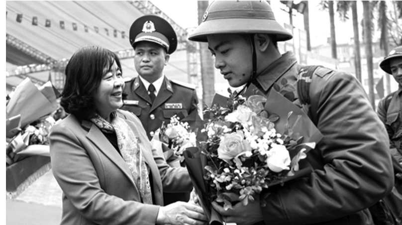
● Bí thư Thành ủy Hà Nội Bùi Thị Minh Hoài động viên tân binh quận Ba Đình lên đường nhập ngũ.

9h sáng hôm qua (13/2), 52 tỉnh, thành trong cả nước đã hoàn thành công tác giao nhận quân năm 2025. Các lễ giao nhận quân được tổ chức trang trọng, chu đáo, an toàn, đúng quy định. Trong không khí tươi vui, náo nức, các tân binh hăng hái lên đường thực hiện nghĩa vụ thiêng liêng bảo vệ Tổ quốc.