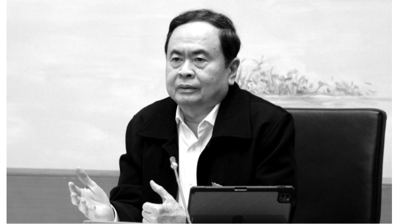
● Chủ tịch Quốc hội Trần Thanh Mẫn phát biểu tại thảo luận Tổ.

Những vấn đề đã chín muồi, đã rõ, được thực tế kiểm nghiệm chứng minh thì giải quyết ngay. Đặc biệt, không vì những quy trình, thủ tục cứng nhắc mà làm chậm sự phát triển của đất nước.