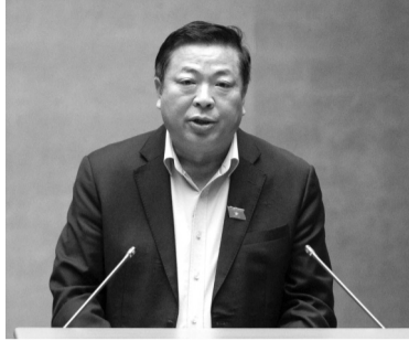
● Bộ trưởng Bộ Giao thông vận tải Trần Hồng Minh trình bày Tờ trình.

Dự án đường sắt Lào Cai - Hà Nội - Hải Phòng có vai trò quan trọng, chiến lược, có quy mô lớn, phức tạp. Do đó, Chính phủ đề xuất Quốc hội cho phép áp dụng 19 cơ chế, chính sách đặc thù, đặc biệt, trong đó có 15/19 cơ chế, chính sách đã được Quốc hội cho phép áp dụng