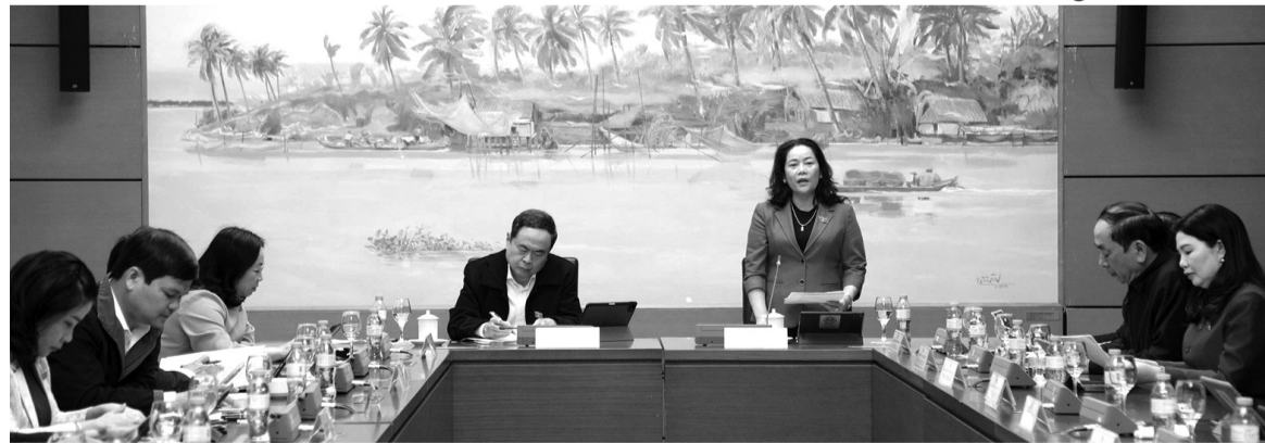
● Đại biểu Quốc hội thảo luận tại Tổ sáng 13/2.