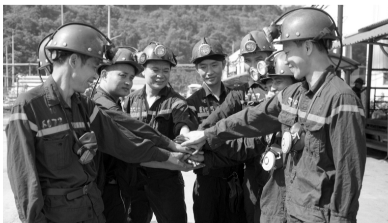
● Công nhân Công ty Than Hạ Long quyết tâm đảm bảo an toàn trong ca sản xuất.

Tuy nhiên, bên cạnh yếu tố văn hóa và tâm linh, quan niệm “Tháng Giêng là tháng ăn chơi” cũng có những tác động nhất định đến đời sống kinh tế - xã hội. Đối với một số ngành nghề như du lịch, dịch vụ ăn uống, vận tải... đây là thời điểm cao điểm của hoạt động kinh doanh, góp phần thúc đẩy nền kinh tế. Nhưng ngược lại, tư tưởng “ăn chơi” kéo dài có thể khiến một số người chểnh mảng công việc, ảnh hưởng đến năng suất lao động. Điều này đặc biệt dễ thấy ở những DN, tổ chức còn duy trì tư tưởng “làm cả năm, nghỉ cả tháng Giêng”.