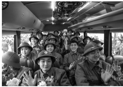
● Ngày đầu làm chiến sĩ.

“Khi trở thành người quân nhân, các em phải nỗ lực phấn đấu vượt qua mọi khó khăn, quyết tâm hoàn thành xuất sắc nhiệm vụ được giao, xứng danh Bộ đội Cụ Hồ, bộ đội của Nhân dân”, ông Hiếu gửi lời nhắn nhủ. LONG VINH