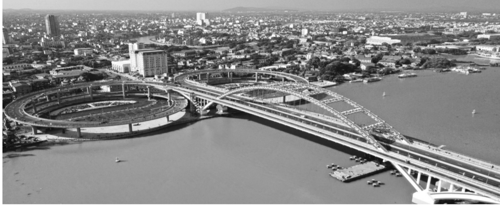
● TP Hải Phòng sẽ tập trung chi đạo để tiếp tục nghiên cứu, thành lập các khu công nghiệp, cụm công nghiệp mới theo quy hoạch đã được phê duyệt.

Năm 2025 là thời điểm đặc biệt quan trọng khi Hải Phòng bước vào năm cuối của Kế hoạch phát triển kinh tế - xã hội (KT-XH), Kế hoạch đầu tư công trung hạn 5 năm 2021 - 2025... TP đang tập trung nỗ lực nâng cao chất lượng tăng trưởng, thúc đẩy đổi mới sáng tạo và phát triển bền vững để giữ vững tốc độ tăng trưởng.