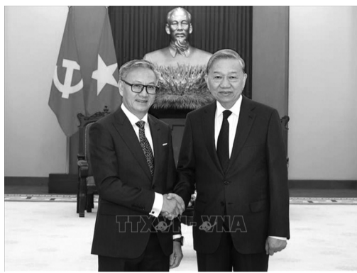
● Tổng Bí thư Tô Lâm tiếp Bộ trưởng Ngoại giao Lào Thongsavanh Phomvihane.

Tại cuộc tiếp, Tổng Bí thư Tô Lâm bày tỏ vui mừng quan hệ Việt Nam - Lào ngày càng phát triển mạnh mẽ trên tất cả các lĩnh vực, mang lại lợi ích thiết thực cho Nhân dân mỗi nước; khẳng định Việt Nam sẽ cùng Lào mãi mãi giữ gìn và vun đắp cho mối quan hệ vĩ đại, đoàn kết đặc biệt và hợp tác toàn diện ngày càng đi vào chiều sâu, thiết thực và hiệu quả trên tất cả các lĩnh vực; đánh giá cao phối hợp chỉ đạo quyết liệt của hai Bộ Chính trị, sự điều hành của hai Chính phủ, cũng như sự nỗ lực của các Bộ, ngành, địa phương hai nước, trong đó có hai