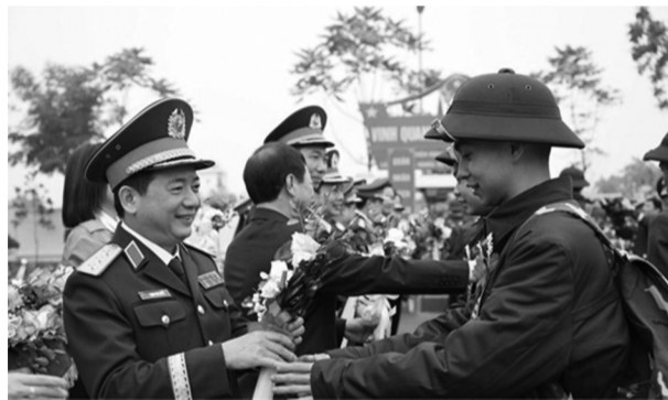
● Thượng tướng Trịnh Văn Quyết, Chủ nhiệm Tổng cục Chính trị động viên thanh niên lên đường nhập ngũ