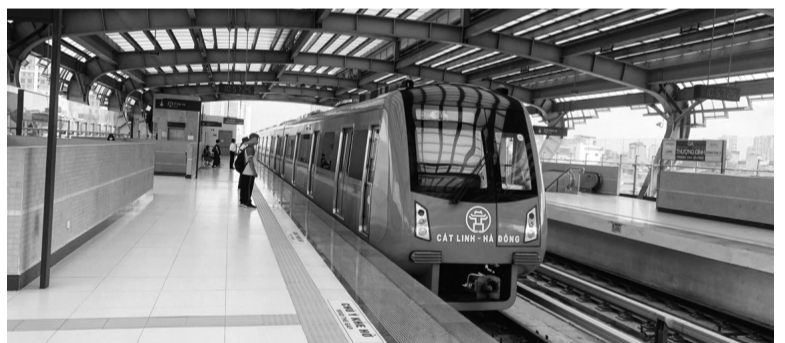
● Đường sắt Cát Linh - Hà Đông.

Với trình tự, thủ tục thực hiện đầu tư, cần thuyết minh làm rõ