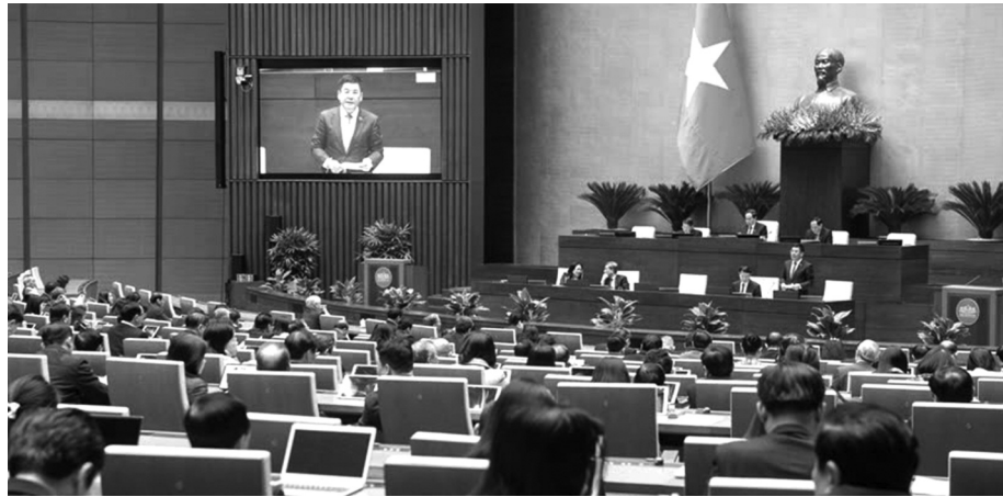
● Các đại biểu Quốc hội cơ bản tán thành với sự cần thiết ban hành các cơ chế, chính sách đặc thù đầu tư xây dựng dự án điện hạt nhân Ninh Thuận. (Ảnh trong bài: quochoi.vn)

Ngày 17/2, thảo luận tại hội trường về dự thảo Nghị quyết các cơ chế, chính sách đặc thù đầu tư xây dựng dự án điện hạt nhân Ninh Thuận, các đại biểu Quốc hội cơ bản tán thành với sự cần thiết ban hành các cơ chế, chính sách đặc thù và kiến nghị nhiều giải pháp để bảo đảm thực hiện thành công dự án.