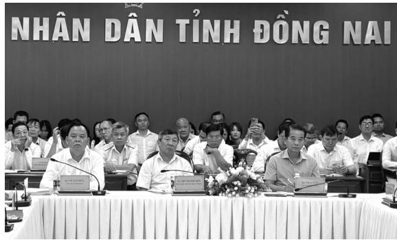
● Hội thảo đưa ra 9 giải pháp ưu tiên nhằm giúp Đồng Nai tháo gỡ những "điểm nghẽn", tăng trưởng kinh tế.

Nai và quy hoạch vùng. Đồng Nai cần đề xuất, thực hiện tuyến đường sắt đô thị Trảng Bom - Suối Tiên (kết nối Suối Tiên - Bến Thành). Việc xây dựng cầu Cát Lái là cấp thiết, Đồng Nai phải quyết liệt để phát triển đô thị Nhơn Trạch.