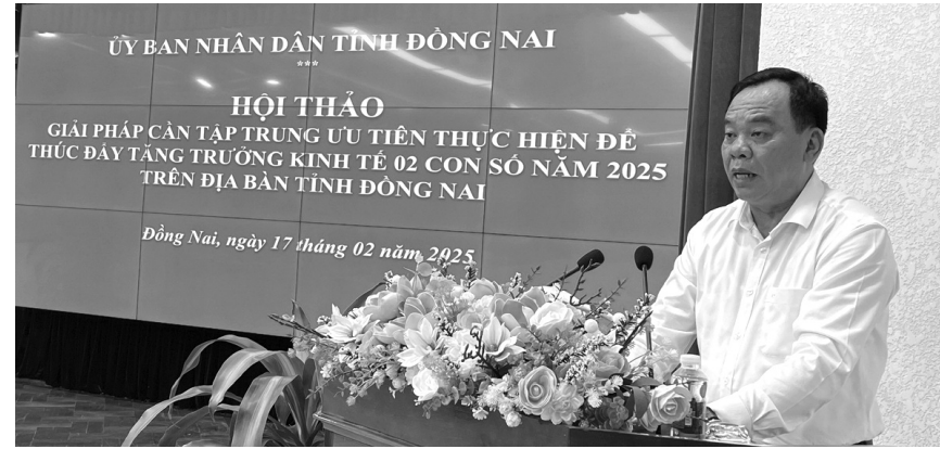
● Ông Võ Tấn Đức, Chủ tịch UBND tỉnh Đồng Nai phát biểu tại Hội thảo.

Hội thảo đưa ra 9 giải pháp ưu tiên nhằm giúp Đồng Nai tháo gỡ những