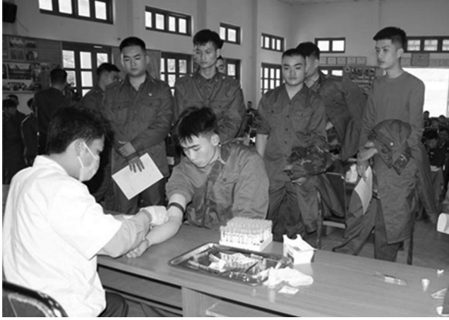
● Ngay khi về đơn vị, CSM được khám phúc tra sức khỏe. (Ảnh trong bài: Thanh Đông)