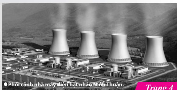
● Phối cảnh nhà máy điện hạt nhân Ninh Thuận.