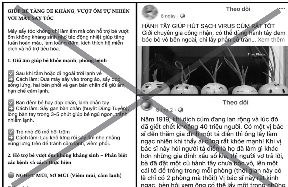
● Trần lan thông tin sức khỏe sai lệch trên mạng xã hội. (Ảnh chụp màn hình)

Cũng rộ lên trên mạng xã hội là phương pháp trồng hành tây để “hút” virus cúm và diệt khuẩn, làm sạch không khí. Bài viết cho biết có thể đuổi virus cúm bằng việc trồng củ hành tây trong nước, đặt rải rác khắp nhà. Để tăng độ tin cậy, bài viết còn trích dẫn một câu chuyện liên quan đến đại dịch cúm năm 1919, theo đó, một bác sĩ được người nông dân chia sẻ bí quyết phòng bệnh bằng cách đặt một củ hành tây trên bàn. Khi mang củ hành tây này về soi dưới kính hiển vi, ông phát hiện bên trong bám đầy siêu vi trùng.