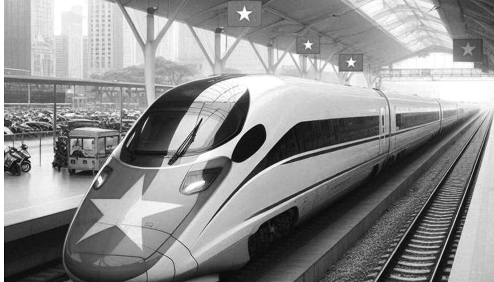
● Dự án đường sắt tốc độ cao Bắc - Nam là đường đôi, khổ 1.435mm, tốc độ thiết kế 350km/h, dự kiến tổng vốn đầu tư hơn 67 tỉ USD.

Theo quan sát của PLVN, tuy không phổ biến nhưng chuyện “lính thủy đánh bộ” ở ngành Giao thông đã từng diễn ra, khi nhiều năm trước PMU Đường thủy từng được Bộ giao nhiệm vụ chuẩn bị đầu tư Dự án cải tạo, mở rộng QL2. Trước nữa, PMU Thăng