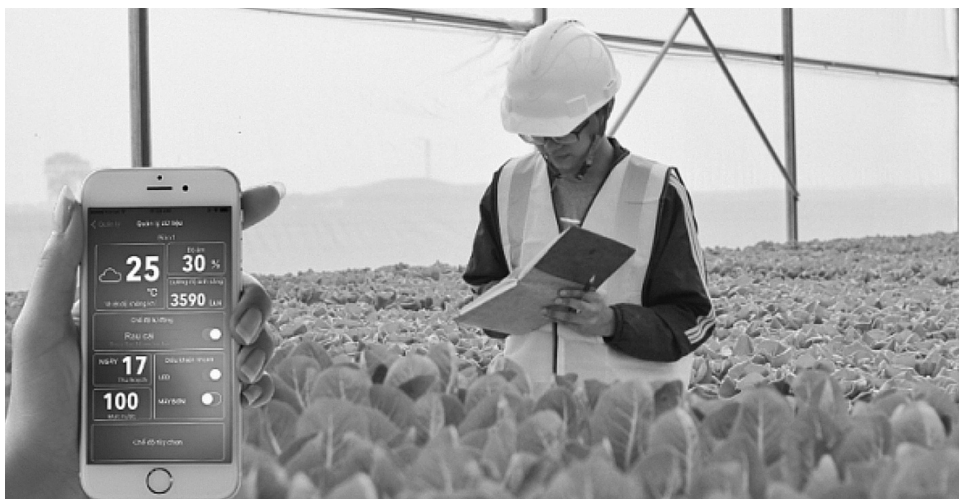
● Nông nghiệp công nghệ cao là xu thế tất yếu.

Sự phát triển mạnh mẽ của khoa học công nghệ đang mở ra nhiều cơ hội nhưng cũng đặt ra không ít thách thức cho các