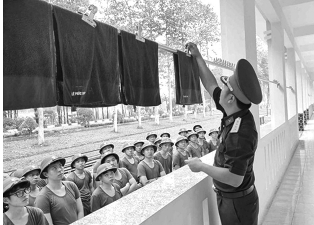
● CSM được hướng dẫn từ việc gấp, phơi khăn mặt.

Những ngày đầu trong quân ngũ còn nhiều bỡ ngỡ, lo lắng, nhưng được sự quan tâm, hướng dẫn của cán bộ, các chiến sĩ mới (CSM) tự tin, nhanh chóng hòa nhập môi trường Quân đội, chuẩn bị bước vào mùa huấn luyện mới.