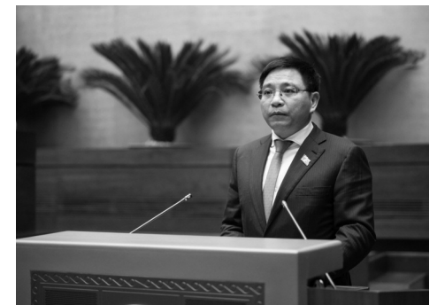
● Bộ trưởng Bộ Tài chính Nguyễn Văn Thắng.

Trong đó, khoảng 1.562 tỷ đồng từ Quỹ Đầu tư phát triển tại doanh nghiệp (DN) được ghi trong dự án đầu tư hình thành tài sản phục vụ sản xuất kinh doanh và 36.689 tỷ đồng từ nguồn ngân sách nhà nước đã giải ngân đầu tư 5 dự án đường bộ cao tốc do VEC làm chủ đầu tư (gồm 10.062 tỷ đồng vốn đối ứng từ ngân sách; 24.127 tỷ vốn ODA tại các dự án thực hiện theo hình thức chuyển vốn vay về cho vay lại thành cấp phát ngân sách và 2.500 tỷ cấp phát ngân sách cho dự án Nội Bài - Lào Cai và Cầu Giẽ - Ninh Bình).