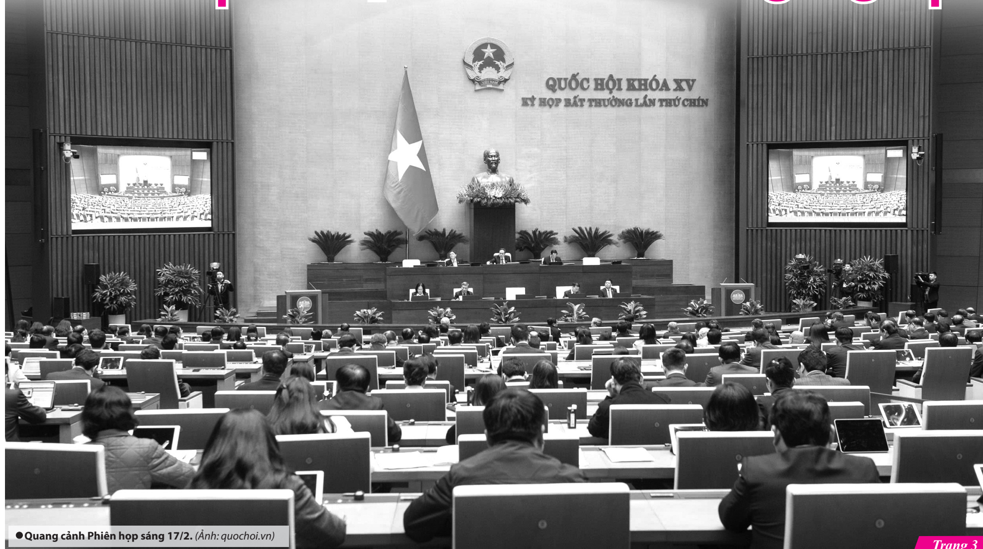
● Quang cảnh Phiên họp sáng 17/2.