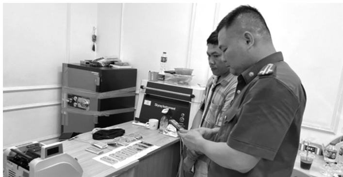
● CQĐT khám xét một tiệm vàng liên quan vụ án.

vàng trang sức; giám sát thị trường vàng, các cơ sở kinh doanh mua bán vàng; quản lý nguồn gốc vàng bày bán tại các tiệm vàng; đồng thời xử lý các cơ sở kinh doanh mua bán vàng không hợp pháp, không có nguồn rõ ràng.