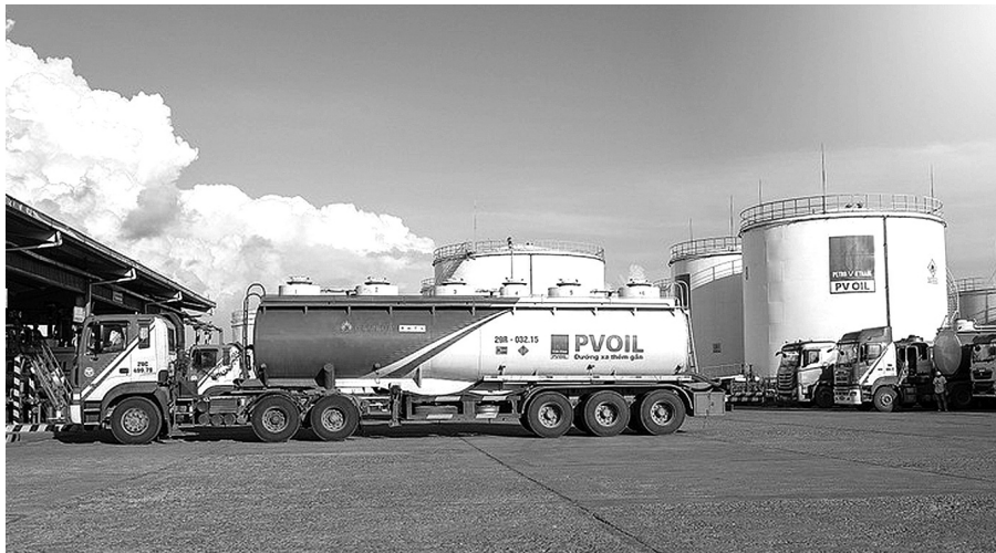
● Sản xuất xăng dầu của Tập đoàn Petrovietnam duy trì liên tục, bảo đảm cung ứng trong dịp Tết Nguyên đán.

Giá trị thực hiện đầu tư toàn Tập đoàn trong tháng ước đạt 2,3 nghìn tỷ đồng, tăng 35% so với cùng kỳ năm 2024. Tập đoàn kiểm soát chặt chẽ về tiến độ đầu tư các dự án, đặc biệt là những công trình trọng điểm và vẫn duy