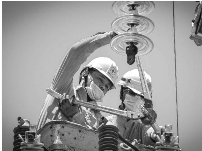
● Thông tư 04 quy định cụ thể về trình tự ngừng, giảm cung cấp điện.

Về thông báo ngừng, giảm mức cung cấp điện, Thông tư 04 quy định phải bao gồm các nội dung sau: Địa điểm ngừng, giảm mức cung cấp điện; mức công suất giảm hoặc khả năng cung cấp tối đa trong trường hợp giảm