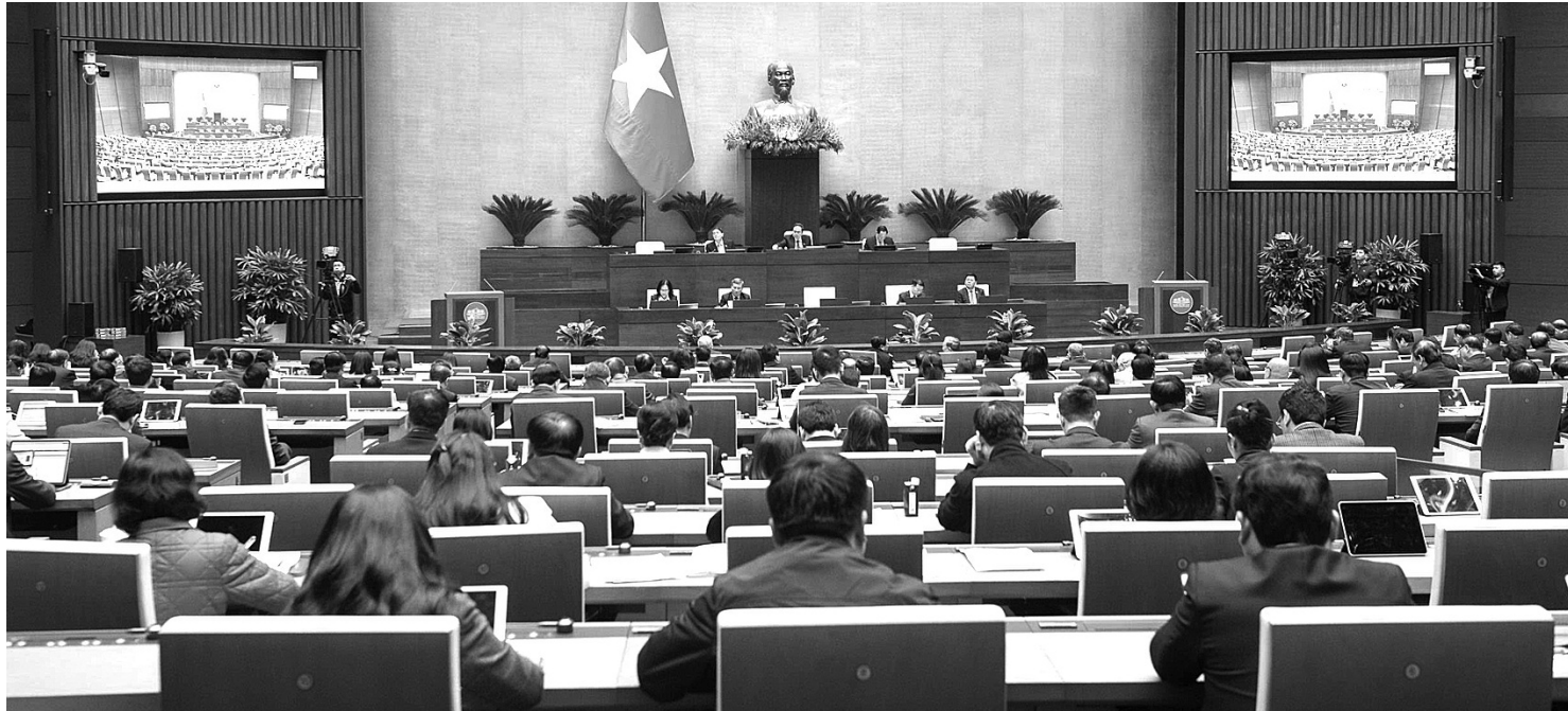
● Toàn cảnh phiên họp sáng 17/2.

Sáng 17/2, tiếp tục chương trình Kỳ họp bất thường lần thứ 9, Quốc hội (QH) thảo luận tại hội trường về dự thảo Nghị quyết của QH về thí điểm một số cơ chế, chính sách để tháo gỡ vướng mắc trong hoạt động khoa học, công nghệ (KH-CN), đổi mới sáng tạo và chuyển đổi số quốc gia.