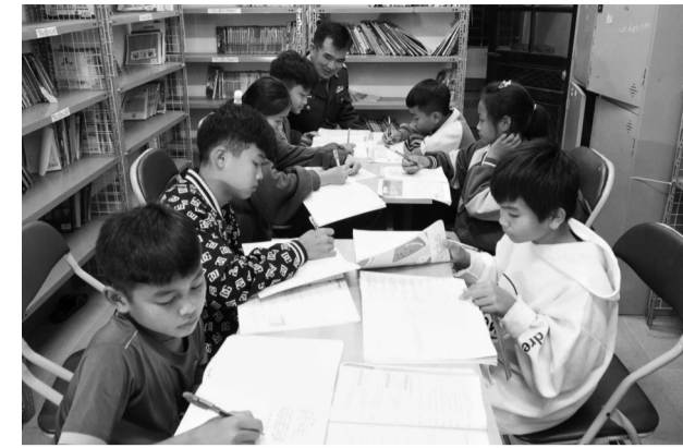
● HS ôn luyện bài cũ trong KTX.