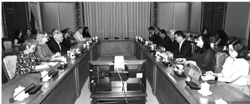
● Một cuộc gặp trao đổi tìm kiếm cơ hội hợp tác đầu tư tại TP HCM.

Trong vụ án này, về trách nhiệm dân sự, tòa cũng buộc người được bà Vy lấy tiền của khách để trả nợ, chuyển 3,5 tỷ đồng cho cơ quan thi hành án để bảo đảm nghĩa vụ thi hành án. Chủ nợ của bà Vy có quyền khởi kiện bị cáo Vy trong vụ án dân sự khác. BÙI YÊN