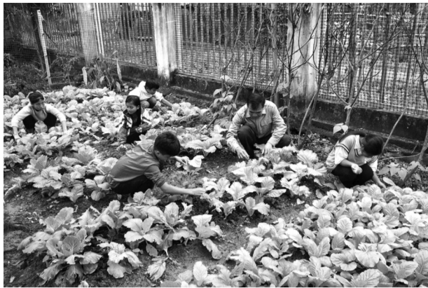
● Không chỉ được tập sống nề nếp, các HS còn được dạy cách chăm sóc rau màu.

là địa điểm thứ hai mà BDBP Nghệ An thực hiện mô hình “KTX vùng biên”. Mô hình đi vào hoạt động đúng dịp khai giảng năm học 2024 - 2025, giúp 46 HS đồng bào Thái, Khơ Mú, Tày Pọng có điểm tựa để chuyên tâm vào học tập.