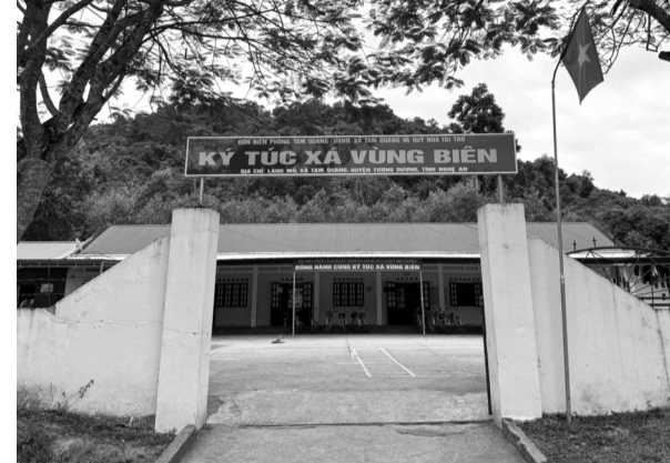
● KTX xã Tam Quang hoạt động từ dịp khai giảng năm học 2024 - 2025.

Mô hình “Ký túc xá (KTX) vùng biên” góp phần tạo điều kiện cho học sinh (HS) nghèo vùng biên giới được đến trường, nâng cao chất lượng học tập, tạo môi trường rèn luyện kỹ năng sống và phát triển toàn diện.