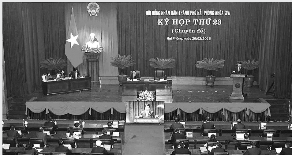
● Kỳ họp thứ 23 (Kỳ họp chuyên đề) của HĐND TP Hải Phòng khóa XVI, nhiệm kỳ 2021 - 2026.

● Tại Hải Phòng: Chiều 20/2, HĐND TP Hải Phòng khóa XVI, nhiệm kỳ 2021 - 2026 tổ chức Kỳ họp thứ 23 (Kỳ họp chuyên đề). Tại Kỳ họp này, HĐND TP sẽ xem xét, cho ý kiến và quyết nghị 11 dự thảo Nghị quyết, bao gồm: xem xét, quyết định hợp nhất, sáp nhập một số cơ quan chuyên môn thuộc UBND TP theo chỉ đạo của Trung ương và Thành ủy, bảo đảm các cơ quan hoạt động theo mô hình tổ chức bộ máy mới ngay từ ngày 01/3/2025; xem xét, ban hành chính sách hỗ trợ thêm đối với cán bộ, công chức, viên chức, người lao động trong thực hiện sắp xếp tổ chức bộ máy của hệ thống chính trị tại TP Hải Phòng...