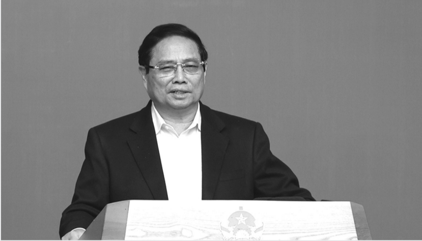
● Thủ tướng Phạm Minh Chính phát biểu tại Hội nghị.

Ngày 20/2, tại Hà Nội, Đoàn kiểm tra của Bộ Chính trị, Ban Bí thư đã tổ chức Hội nghị công bố các quyết định thành lập các đoàn kiểm tra năm 2025 đối với Đảng ủy Chính phủ, Đảng ủy Quốc hội.