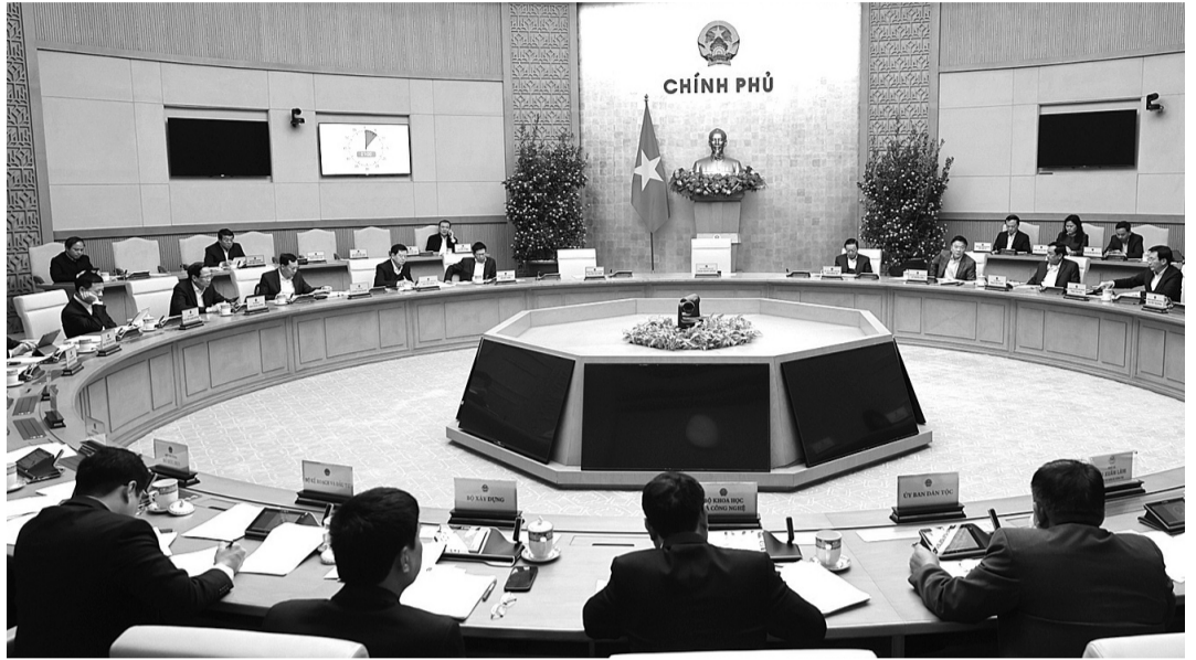
● Phiên họp đã cho ý kiến vào 7 dự án luật quan trọng.

Ngày 20/2, Chính phủ tổ chức phiên họp chuyên đề về xây dựng pháp luật tháng 2/2025. Đây là phiên họp thứ 2 của năm 2025 về chuyên đề xây dựng pháp luật, được tổ chức ngay sau ngày Kỳ họp bất thường lần thứ 9, Quốc hội khóa XV bế mạc. Phó Thủ tướng Lê Thành Long thay mặt Thủ tướng Chính phủ điều hành phiên họp.