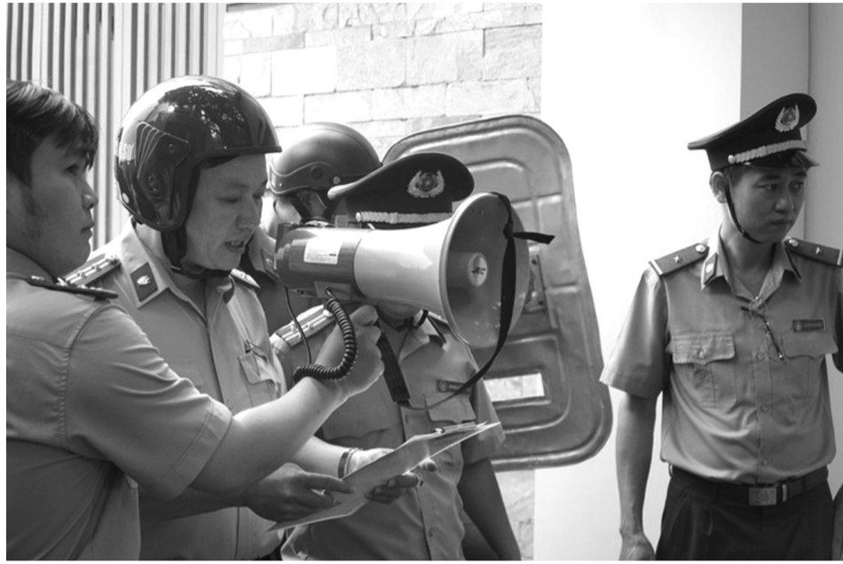
● Cục THADS và lực lượng chức năng TP Hồ Chí Minh tổ chức cưỡng chế THADS.

Tương tự trên địa bàn cũng còn một số việc đấu giá chưa thành mà nguyên nhân