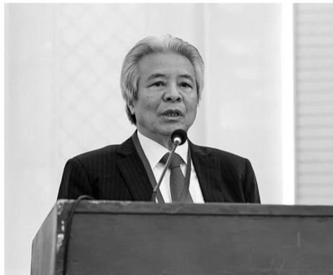
● GS.TS Võ Khánh Vinh, nguyên Phó Chủ tịch Viện Hàn lâm Khoa học xã hội Việt Nam

Kỷ nguyên phát triển mới của đất nước đòi hỏi phải đổi mới căn bản, mạnh mẽ, mang tính đột phá cách mạng công tác xây dựng pháp luật và thi hành pháp luật theo hướng phát huy dân chủ và bảo vệ quyền con người, đáp ứng yêu cầu phát triển nhanh và bền vững đất nước. Đây là nội dung trao đổi của GS.TS Võ Khánh Vinh, nguyên Phó Chủ tịch Viện Hàn lâm Khoa học xã hội Việt Nam với Báo Pháp luật Việt Nam.