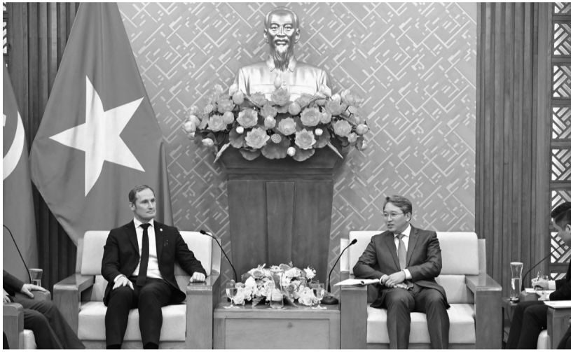
● Bộ trưởng Bộ Tư pháp Nguyễn Hải Ninh và Chủ tịch Liên minh Công chứng Quốc tế.

Bộ trưởng Nguyễn Hải Ninh cảm ơn sự quan tâm đặc biệt và sự đồng hành của Liên minh Công chứng Quốc tế đã dành cho Bộ, ngành Tư pháp Việt Nam và nghề công chứng ở Việt Nam trong suốt thời gian qua. Đồng thời đánh giá cao việc Hội đồng Công chứng tối cao Pháp và Hiệp hội Công chứng viên Việt Nam phối hợp để tổ chức Hội thảo “Chia sẻ kinh nghiệm quốc tế về công chứng của Việt Nam và Cộng hòa Pháp”. Đây là hoạt động có ý nghĩa nhằm triển khai Chương trình hợp tác giai đoạn 2023 - 2025 mà hai bên đã ký kết.