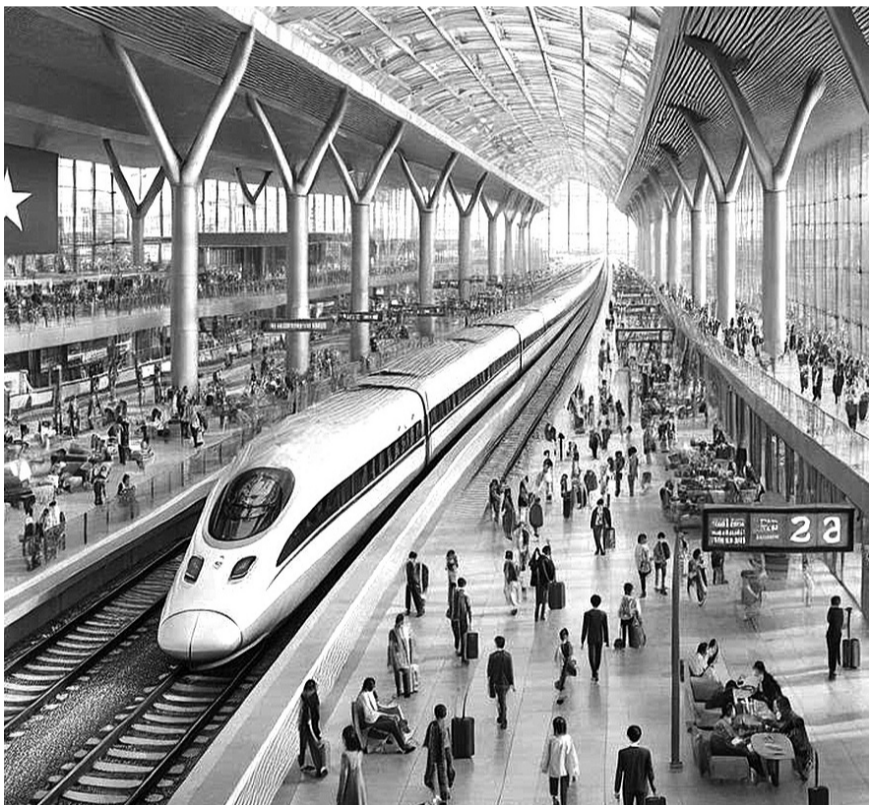
● Nhiều chính sách đặc thù sẽ được áp dụng cho việc triển khai Dự án đường sắt tốc độ cao Bắc - Nam. (Ảnh minh họa: Đường sắt tốc độ cao Bắc - Nam do AI thực hiện)

Ở Việt Nam hiện nay, hệ thống chính trị được thiết lập và vận hành theo cơ chế Đảng lãnh đạo, Nhà nước quản lý, Nhân dân làm chủ. Đảng Cộng sản Việt Nam với tư cách là “lực lượng lãnh đạo Nhà nước và xã hội” có trách nhiệm lãnh đạo, chỉ đạo việc xây dựng thể chế và cơ chế vận hành cụ thể để bảo đảm thực hiện nguyên tắc tất cả quyền lực nhà nước thuộc về Nhân dân.