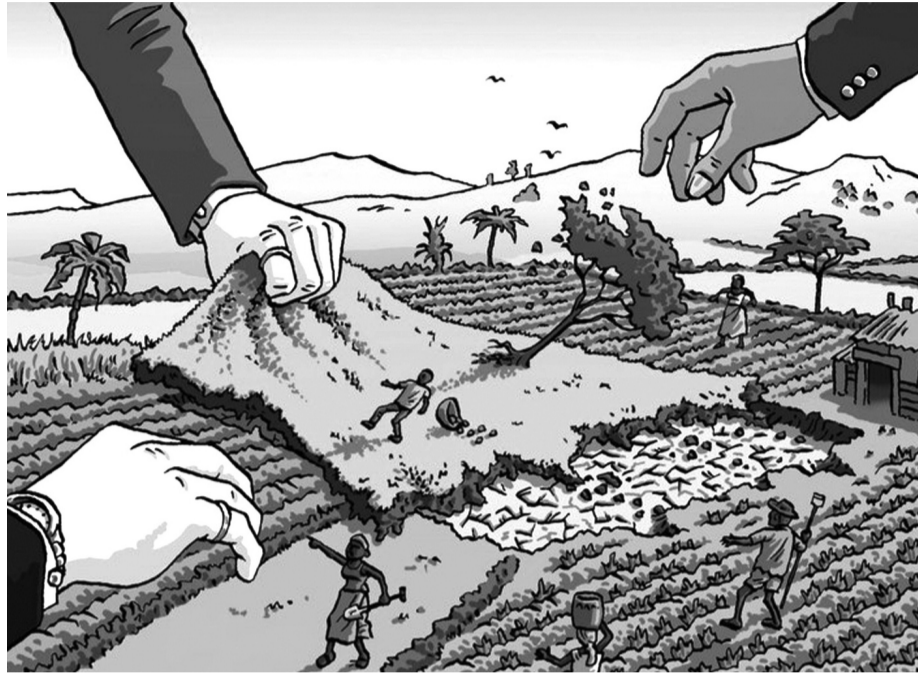
● Luật Đất đai 2024 đã bổ sung thẩm quyền giải quyết tranh chấp đất đai cho Trọng tài thương mại. (Ảnh minh họa: ITN)

Tại Điều 137 cũng quy định: "Hộ gia đình, cá nhân, cộng đồng dân cư được sử dụng đất theo bản án hoặc quyết định của tòa án, quyết định của Trọng tài thương mại Việt Nam...".