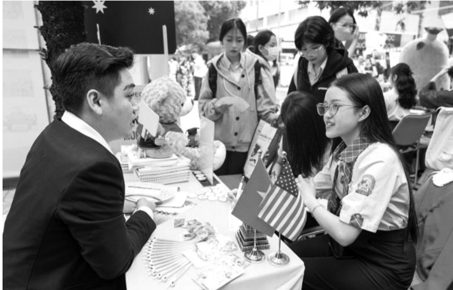
● Thí sinh tại Ngày hội tư vấn tuyển sinh 2025.

Về phía địa phương, đến nay, hầu hết các địa phương đã ban hành Chỉ thị hoặc văn bản chỉ đạo đối với ngành Giáo dục triển khai thực hiện các nhiệm vụ của kỳ thi tốt nghiệp THPT năm 2025 sau khi có Chỉ thị của Thủ tướng Chính phủ và Quy chế thi tốt nghiệp THPT của Bộ GD&ĐT.