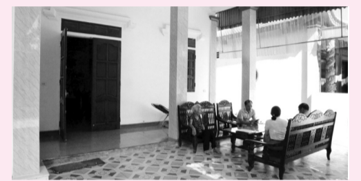
● Một căn nhà tại huyện Nghi Lộc (Nghệ An) được xây dựng khang trang từ nguồn hỗ trợ gia đình thân nhân liệt sỹ.

Theo đó, những hộ gia đình người có công mà nhà ở có nguy cơ sập đổ, không an toàn khi sử dụng; người có công cao tuổi; là dân tộc thiểu số; có hoàn cảnh khó khăn; thuộc vùng thường xuyên xảy ra thiên tai sẽ được hỗ trợ xây mới hoặc sửa chữa. Mức hỗ trợ sẽ là 60 triệu đồng với nhà xây mới; 30 triệu đồng với sửa chữa, cải tạo.