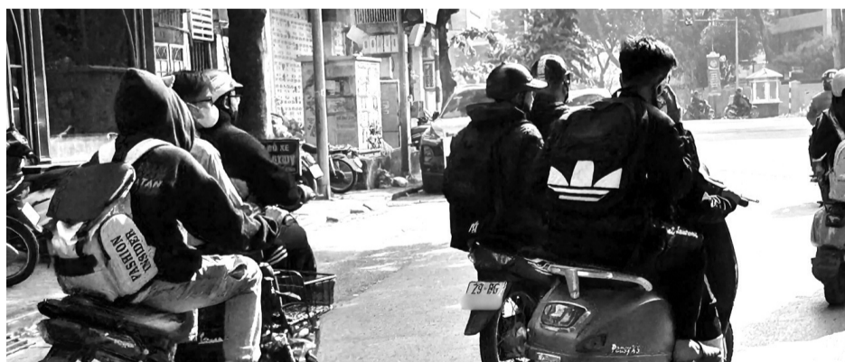
● Rất nhiều học sinh không đội mũ bảo hiểm khi tham gia giao thông trên đường phố.

bắt gặp hình ảnh học sinh điều khiển xe điện, xe gắn máy, xe máy nhưng không đội mũ bảo hiểm, chờ hai, chờ ba, thậm chí phóng nhanh, vượt ẩu, vượt đèn đỏ, đi ngược chiều,