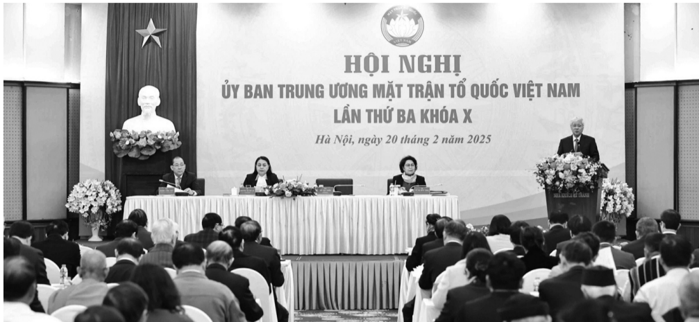
● Chủ tịch UBUT MTTQ Việt Nam Đỗ Văn Chiến phát biểu tại Hội nghị.

Ngày 20/2, tại Hà Nội, Ủy ban Trung ương Mặt trận Tổ quốc (UBTU MTTQ) Việt Nam tổ chức Hội nghị lần thứ ba khóa X dưới sự chủ trì của Ủy viên Bộ Chính trị, Bí thư Trung ương Đảng, Bí thư Đảng ủy MTTQ, các đoàn thể Trung ương, Chủ tịch UBUT MTTQ Việt Nam Đỗ Văn Chiến.