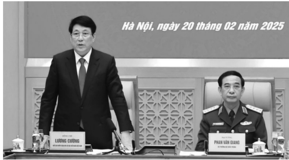
● Chủ tịch nước Lương Cường phát biểu chỉ đạo tại buổi làm việc.

Chủ tịch nước đề nghị trong thời gian tới, Quân ủy Trung ương, Bộ Quốc phòng cần nghiên cứu, rà soát lại tình hình đất