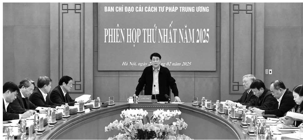
● Chủ tịch nước Lương Cường yêu cầu cần có nhiều hoạt động tư pháp về thực hiện chính sách nhân đạo.

Cụ thể, BCĐ đã cho ý kiến trước khi Quốc hội xem xét, thông qua 3 luật, 11 nghị quyết liên quan đến tổ chức, hoạt động tư pháp; quan tâm chỉ đạo hoàn thiện tổ chức bộ máy, đầu tư cơ sở vật chất, xây dựng đội ngũ cán bộ, nhất là cán bộ có chức danh tư pháp trong sạch, vững mạnh, đủ về số lượng, có chất lượng, đáp ứng yêu cầu, nhiệm vụ. Các cơ quan tư pháp Trung ương thực hiện tốt các giải pháp đột phá nhằm nâng cao chất lượng hoạt động điều tra, truy tố, xét xử, thi hành án; thực hiện nghiêm túc chủ trương tiết kiệm, chống lãng phí trong đầu tư, xây dựng trụ sở, kho vật chứng,