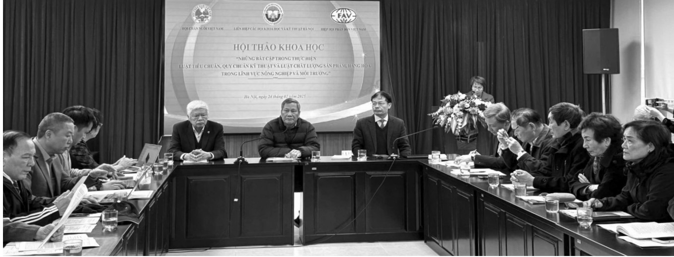
● Toàn cảnh Hội thảo khoa học những bất cập trong thực hiện Luật Tiêu chuẩn, quy chuẩn và Luật Chất lượng sản phẩm.

Ngày 24/2, Liên hiệp các Hội Khoa học và Kỹ thuật (LHH) Hà Nội phối hợp với Hội Chăn nuôi Việt Nam, Hiệp hội Phân bón Việt Nam tổ chức Hội thảo về những bất cập trong thực hiện Luật Tiêu chuẩn, Quy chuẩn kỹ thuật và Luật Chất lượng sản phẩm, hàng hóa trong lĩnh vực nông nghiệp và môi trường.