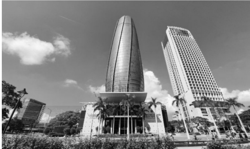
● Đà Nẵng sẽ trở thành 1 trong 2 Trung tâm tài chính của Việt Nam.

Trong bối cảnh hội nhập kinh tế quốc tế ngày càng sâu rộng, việc xây dựng và phát triển các Trung tâm tài chính (TTTC) tại Việt Nam đang trở thành mục tiêu chiến lược nhằm nâng cao vị thế quốc gia, thu hút dòng vốn đầu tư và thúc đẩy tăng trưởng kinh tế bền vững. Để đạt được mục tiêu này, việc xây dựng các cơ chế, chính sách đặc thù, vượt trội là một trong những yêu cầu quan trọng cho hoạt động của TTTC.