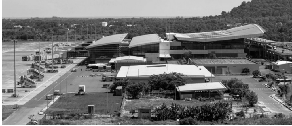
● Một góc Cảng hàng không quốc tế Phú Quốc.

Tầm nhìn đến năm 2050, Cảng hàng không quốc tế Phú Quốc tiếp tục giữ nguyên