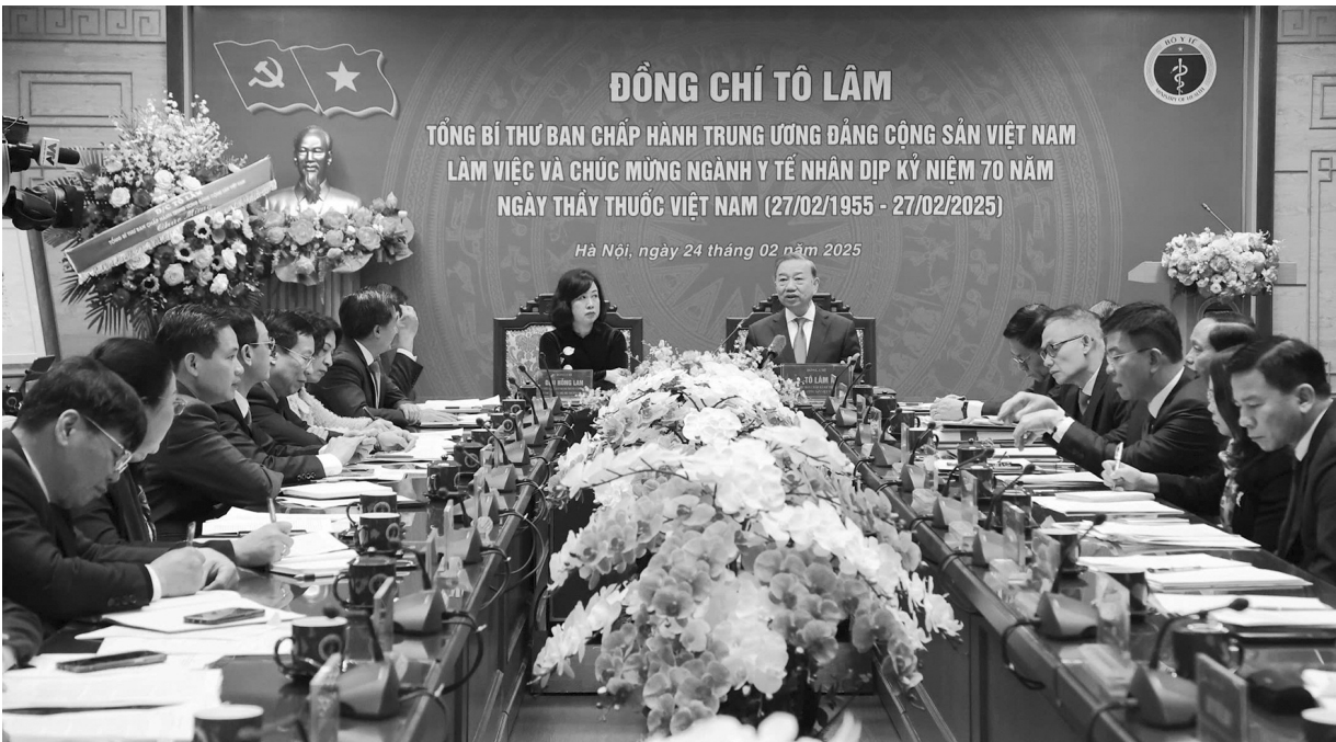
● Tổng Bí thư Tô Lâm thăm và làm việc với Bộ Y tế, sáng 24/2.

Hôm qua (24/2), nhân kỷ niệm 70 năm Ngày Thầy thuốc Việt Nam (27/2/1955 - 27/2/2025), Tổng Bí thư Tô Lâm đã đến thăm, làm việc với Bộ Y tế. Phát biểu tại đây, Tổng Bí thư yêu cầu phải tập trung tháo gỡ khó khăn, rào cản, “nút thắt” để ngành Y tế vươn dậy, để chúng ta có được “một nền y tế thích hợp với nhu cầu của Nhân dân ta” như mong muốn của Bác Hồ.