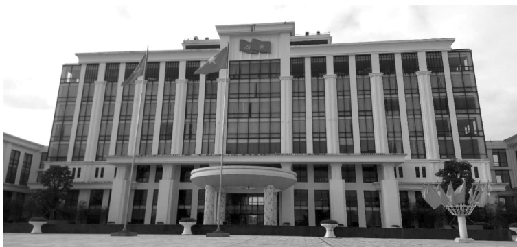
● Trụ sở UBND TP Thanh Hóa.

Liên quan đơn của công dân xã Đông Tiến, huyện Đông Sơn phản ánh Chủ tịch UBND huyện Đông Sơn (nay là TP Thanh Hóa, tỉnh Thanh Hóa) ban hành Thông báo số 268/TB-UBND về việc không thụ lý giải quyết tố cáo là không phù hợp quy định pháp luật; mới đây, Chủ tịch UBND TP Thanh Hóa (là người bị phản ánh) đã có văn bản gửi Báo PLVN thông tin kết quả xử lý, giải quyết vụ việc.