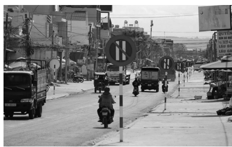
● Hình ảnh biển báo dày đặc.

Theo đó, để tránh việc lắp biển báo quá dày, song vẫn đảm bảo tính hiệu lực biển