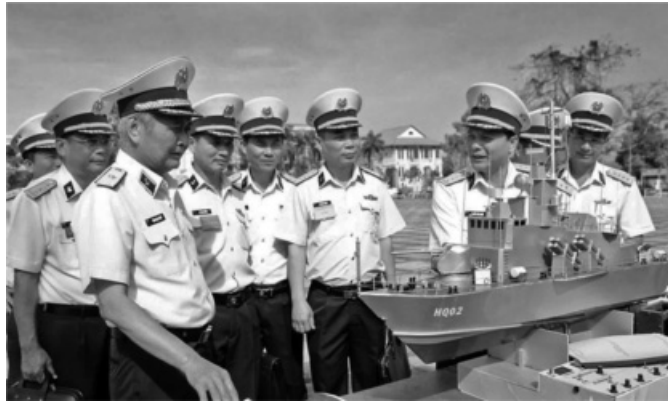
● Kiểm tra mô hình học cụ chuẩn bị huấn luyện tại Trung tâm Huấn luyện Vùng 2 Hải quân.

Năm 2025, BTL TP HCM vinh dự được Bộ Quốc phòng chọn là đơn vị tổ chức lễ ra quân huấn luyện và phát động đợt thi đua cao điểm chủ đề “Thần tốc - Quyết thắng” làm trước, rút kinh nghiệm cho toàn quân.