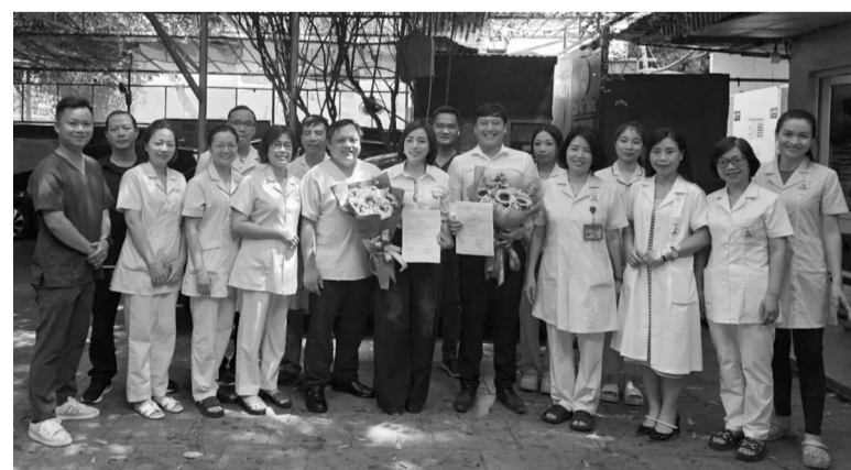
● Các bác sĩ, giám định viên của Trung tâm Pháp y Hà Nội đều mong muốn sẽ được tạo điều kiện tốt nhất để hoạt động nghề nghiệp, phụng sự công lý.

của các bác sĩ pháp y nhiều thế hệ như vậy để thấy nhân lực luôn là vấn đề nổi cộm của ngành pháp y. Tại Hội nghị tổng kết công tác giám định pháp y năm 2024 và triển khai kế hoạch hoạt động năm 2025 diễn ra ngày 16/1/2025, báo cáo của 3 đơn vị pháp y bao gồm Viện Pháp y quốc gia, Viện Pháp y quân đội, Trung tâm 1 Viện Khoa học hình sự, Bộ Công an cho thấy rất nhiều băn khoăn về nguồn nhân lực.