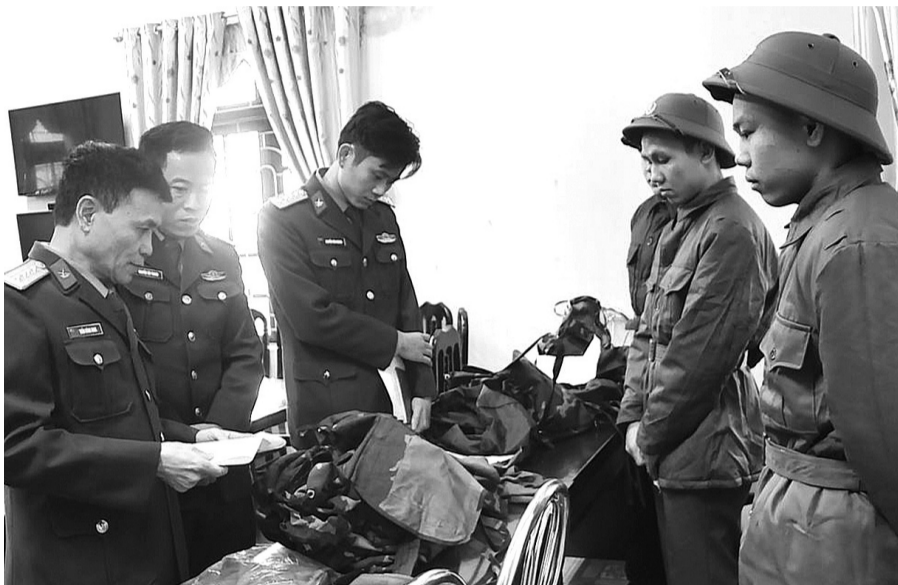
● Đoàn công tác Cục Quân nhu kiểm tra thực tế bảo đảm quân trang cho tân binh nhập ngũ năm 2025.

Tổng cục Hậu cần - Kỹ thuật (HC-KT) sau khi sáp nhập có 32 đầu mối trực thuộc. Khắc phục khó khăn, nhanh chóng kiện toàn tổ chức, toàn Tổng cục bảo đảm sau sáp nhập, chất lượng công việc sẽ tốt hơn, hiệu quả hơn.