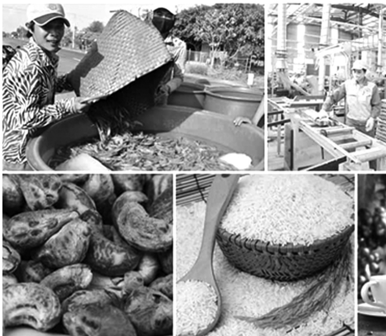
● Nông sản xuất khẩu phải đáp ứng nhiều tiêu chuẩn mới.

Cơ quan Thương vụ Việt Nam tại Thụy Điển cũng cho biết, Quỹ H&M của Thụy Điển vừa công bố hợp tác với Quỹ Ellen MacArthur trong dự án The Fashion ReModel, nhằm thúc đẩy các mô hình kinh doanh tuần hoàn trong ngành thời trang, bao gồm cho thuê, sửa chữa, tái bán và tái chế thúc đẩy các mô hình kinh doanh tuần hoàn trong ngành thời trang. Sự chuyển đổi mạnh mẽ sang thời trang tuần hoàn không chỉ diễn ra ở các thương hiệu lớn mà còn thu hút sự quan tâm của nhiều doanh nghiệp tái chế dệt may trên thế giới.