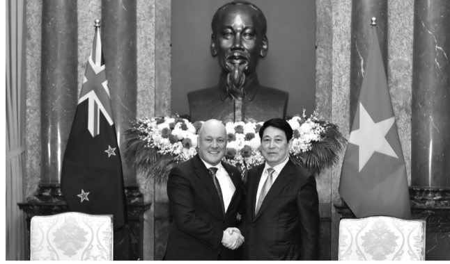
● Chủ tịch nước Lương Cường và Thủ tướng New Zealand Christopher Luxon tại buổi tiếp.

Chiều 26/2, tại Hà Nội, Thủ tướng Chính phủ Phạm Minh Chính đã chủ trì lễ đón Thủ tướng New Zealand Christopher Luxon thăm chính thức Việt Nam. Ngay sau lễ đón chính thức, hai Thủ tướng đã tiến hành hội đàm. Hai nhà lãnh đạo nhất trí nâng cấp quan hệ Việt Nam - New Zealand lên Đối tác Chiến lược Toàn diện, đáp ứng nguyện vọng của Nhân dân hai nước và đóng góp vào hòa bình, ổn định, hợp tác và phát triển ở khu vực và trên thế giới.