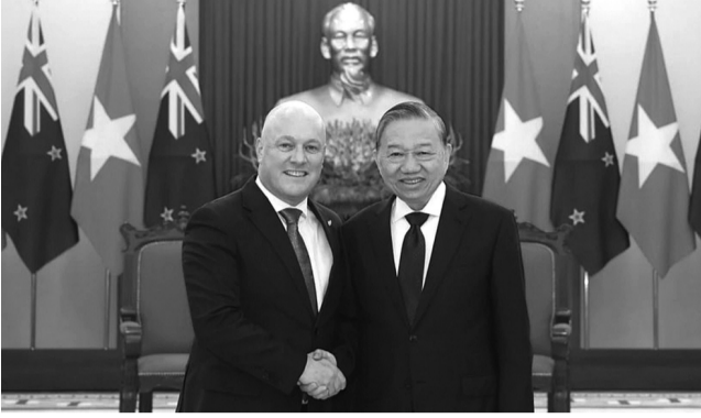
● Tổng Bí thư Tô Lâm tiếp Thủ tướng New Zealand Christopher Luxon.