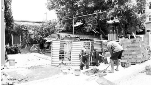
● Một trong số các hộ nghèo, cận nghèo thuộc diện được hỗ trợ xây sửa nhà tại Thái Bình.

UBND tỉnh Thái Bình vừa có văn bản chỉ đạo các sở, ngành và địa phương tập trung đẩy nhanh tiến độ đề án hỗ trợ hộ nghèo, hộ cận nghèo xóa nhà tạm, nhà dột nát (NT,NDN) giai đoạn 2024 - 2025. UBND cấp huyện rà soát lại, thành lập tổ kiểm tra đối tượng trong đề án, khởi công toàn bộ trước ngày 30/4/2025; khẩn trương báo cáo tiến độ thực hiện đề án đến ngày 28/2 và xác định lộ trình tiến độ đến tháng 9/2025.