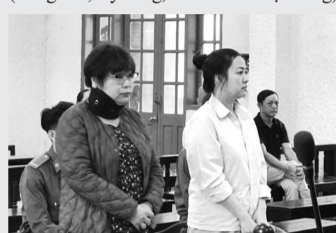
● Hai bị cáo tại phiên tòa.

Ngày 6/9/2022, người đàn ông SN 1962 ký Hợp đồng thế chấp tài sản trên với Ngân hàng Thương mại cổ phần Đầu tư & Phát triển Việt Nam - Chi nhánh Gia Lai để vay 2,5 tỷ đồng. Đến nay, do không trả gốc, lãi đúng hạn, nên Ngân hàng đã kiện khách hàng ra TAND TP Pleiku và đã được giải quyết bằng Quyết định công nhận sự thỏa thuận của các đương sự số 11/2024/QĐST-KDTM ngày 23/5/2024. Theo đó, bên vay có nghĩa vụ trả cho ngân hàng tính đến ngày 15/5/2024 là gần 2,7 tỷ đồng (tiền gốc 2,5 tỷ đồng, tiền lãi 200 triệu đồng).