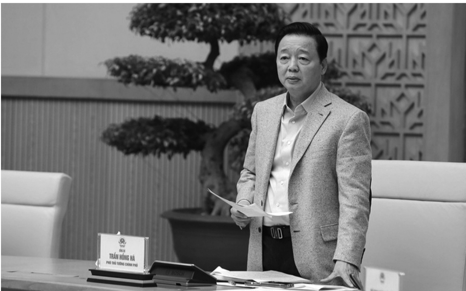
● Phó Thủ tướng Chính phủ Trần Hồng Hà phát biểu tại cuộc họp.