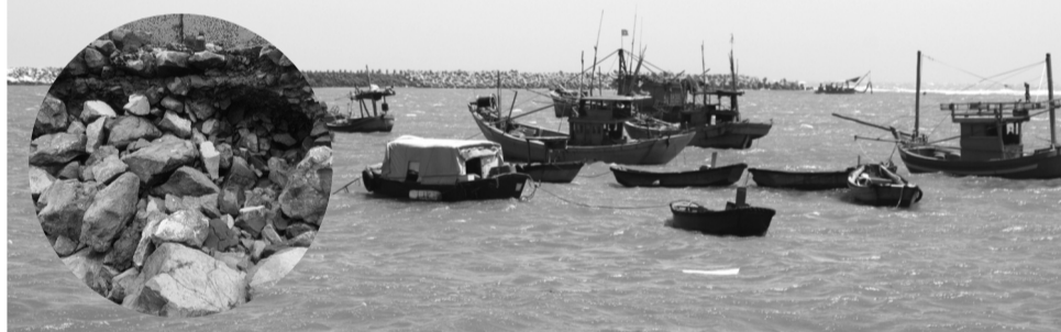
● Khu vực bờ đê hữu tại Khu neo đậu tránh trú bão Bến Lội - Bình Châu sạt lở nghiêm trọng.

Khu neo đậu tránh trú bão Bến Lội - Bình Châu nằm tại xã Bình Châu, huyện Xuyên Mộc, tỉnh Bà Rịa - Vũng Tàu, là nơi trú ẩn quan trọng với ngư dân và tàu thuyền khi mùa bão đến. Tuy nhiên, những năm gần đây, tình trạng sạt lở bờ đê hữu tại khu vực này không chỉ đe dọa sự an toàn của tàu thuyền, còn ảnh hưởng nghiêm trọng sinh kế người dân.