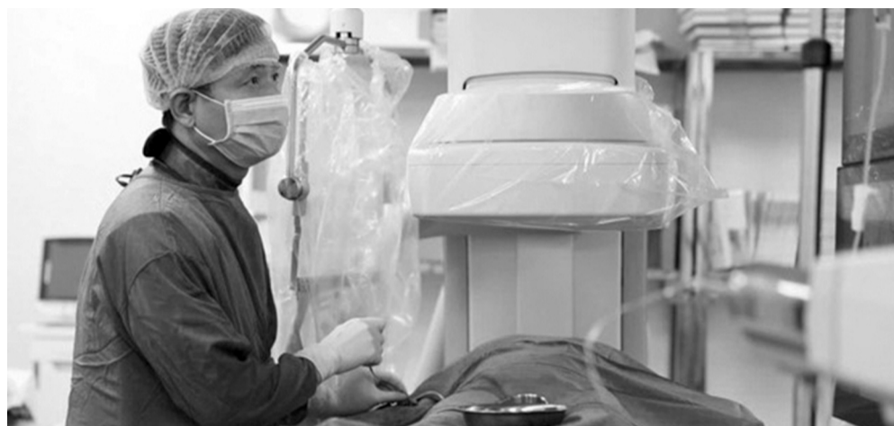
● Việc ứng dụng công nghệ thông tin giúp các bác sĩ Bệnh viện Đa khoa tỉnh Vinh Phúc nâng cao độ chính xác trong quá trình phẫu thuật.

Không ngừng nỗ lực, triển khai các giải pháp đồng bộ đưa chuyển đổi số vào thực tiễn đã giúp ngành Y tế tỉnh đạt được nhiều