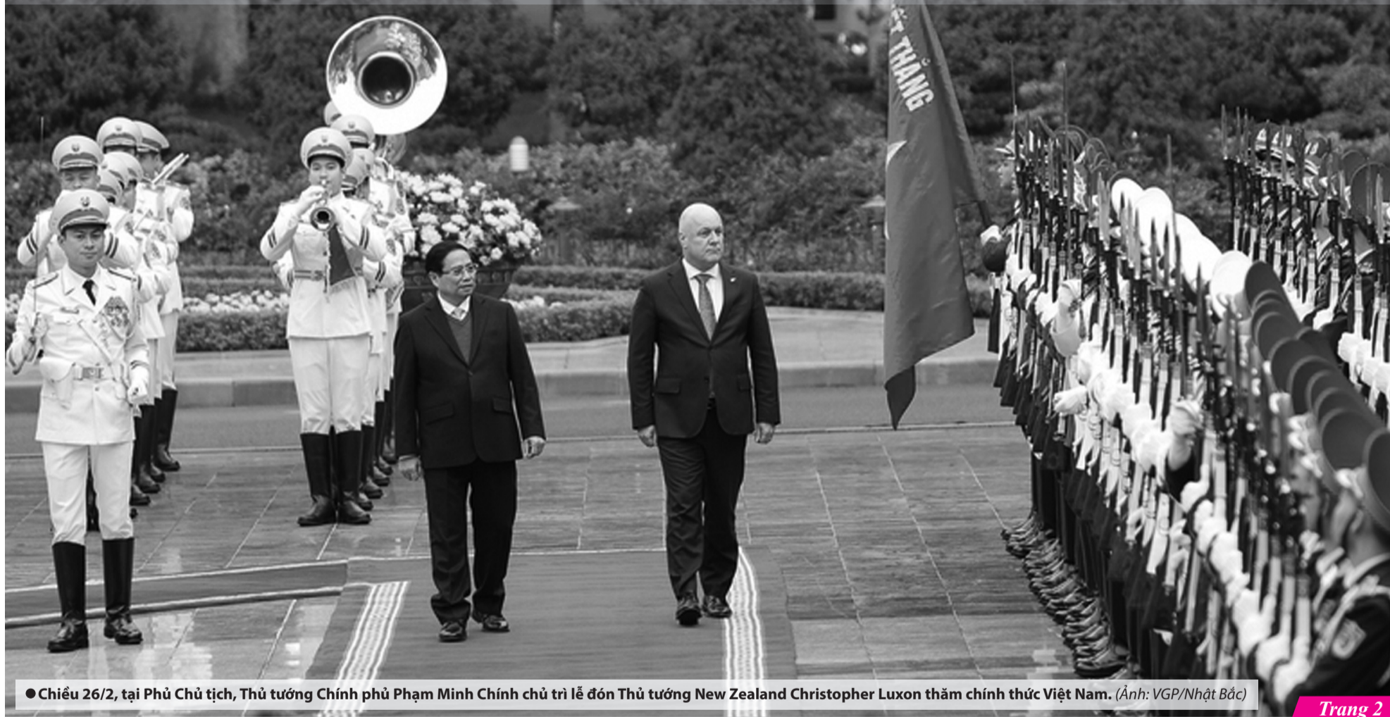
● Chiều 26/2, tại Phủ Chủ tịch, Thủ tướng Chính phủ Phạm Minh Chính chủ trì lễ đón Thủ tướng New Zealand Christopher Luxon thăm chính thức Việt Nam.