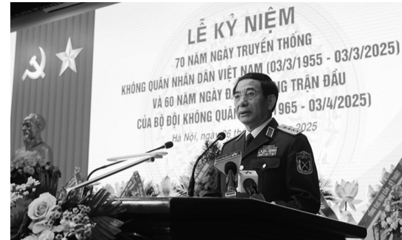
● Đại tướng Phan Văn Giang phát biểu tại Lễ kỷ niệm.

Sáng qua (26/2), Đại tướng Phan Văn Giang, Bộ trưởng BQP đã dự Lễ kỷ niệm 70 năm Ngày truyền thống Không quân nhân dân Việt Nam (3/3/1955 - 3/3/2025); 60 năm Ngày đánh thắng trận đầu của Bộ đội Không quân (3/4/1965 - 3/4/2025).