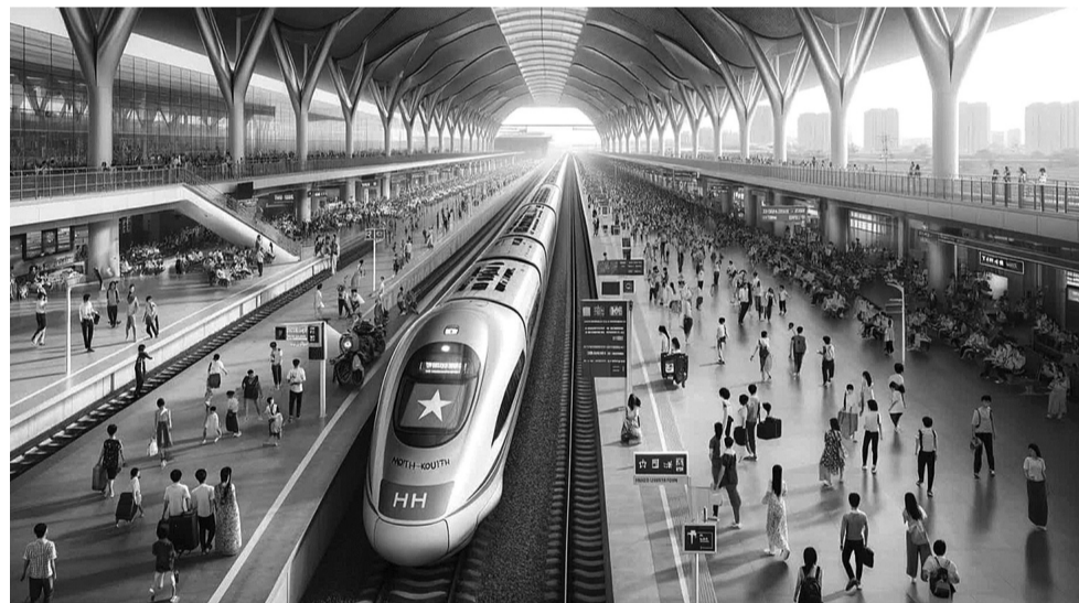
● Mô phỏng Đường sắt tốc độ cao. (Ảnh: AI thực hiện)