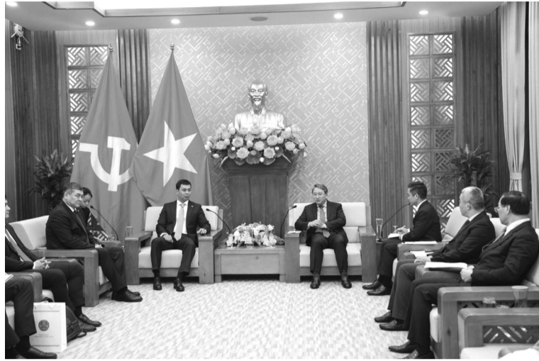
● Bộ trưởng Bộ Tư pháp Nguyễn Hải Ninh tiếp Chủ tịch Cơ quan phòng, chống tham nhũng Kazakhstan cùng đoàn công tác.

Thông tin với Chủ tịch Cơ quan phòng, chống tham nhũng Kazakhstan, Bộ trưởng Nguyễn Hải Ninh cho biết, Bộ Tư pháp là