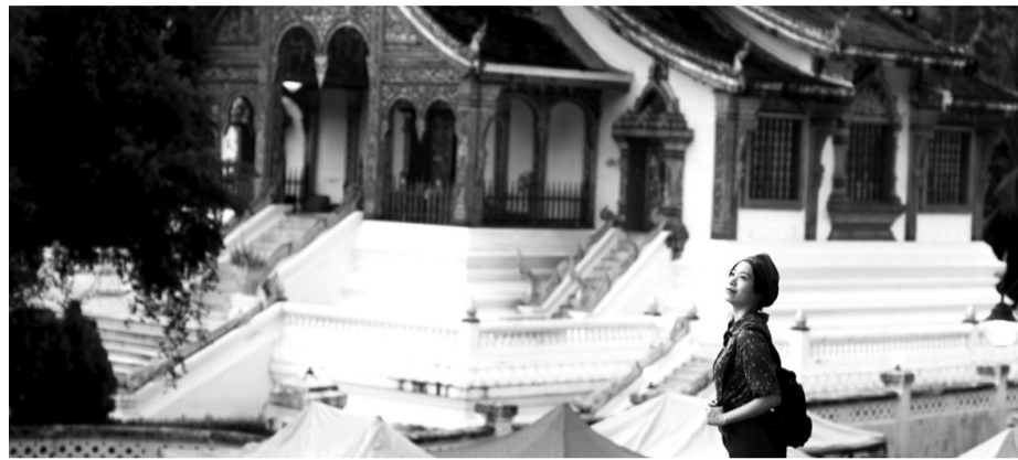
● Liên kết du lịch giữa các nước trong khu vực châu Á đang là một động lực ngành Du lịch Việt Nam tăng trưởng trong năm 2025. (Ảnh minh họa)

Lý do người Việt Nam đang có xu hướng du lịch nước ngoài do trần giá vé máy bay các điểm đến trong nước tăng cao, khiến những tour du lịch nội địa có