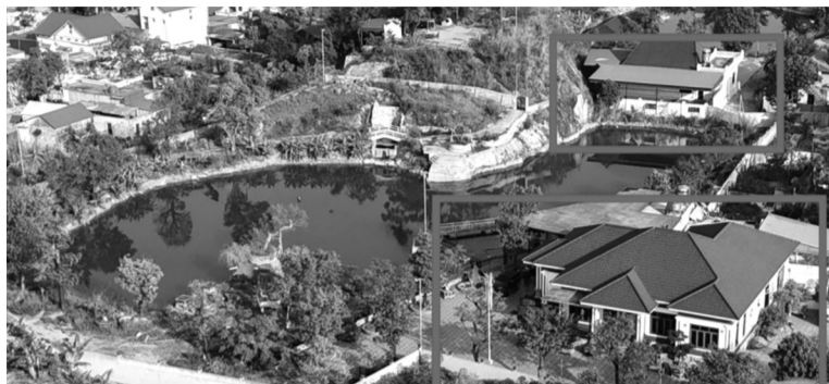
● Một số công trình vi phạm (nằm trong khu vực khoanh đánh dấu) của 3 hộ dân tại khu vực mỏ núi Lim.

Theo thông tin từ UBND thị xã Kinh Môn (tỉnh Hải Dương), hiện 3 hộ lấn chiếm đất ở khu vực mỏ núi Lim (phường Phú Thứ) đã đồng loạt xin tự tháo dỡ, di dời công trình vi phạm.