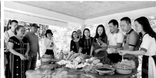
● Du khách trải nghiệm sản phẩm nông sản sạch tại một điểm du lịch cộng đồng. (Ảnh trong bài: Thùy Nhung)