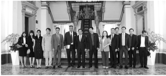
● Lãnh đạo TP HCM làm việc với một tập đoàn nước ngoài về việc đầu tư TTTCQT Việt Nam tại TP HCM.