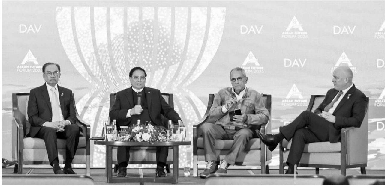
● Thủ tướng Phạm Minh Chính, Thủ tướng Malaysia, Thủ tướng New Zealand và Tổng thống Timor Leste trao đổi hỏi đáp cấp cao.

Sáng 26/2, tại Hà Nội, dự Phiên Toàn thể cấp cao Diễn đàn Tương lai ASEAN năm 2025, Thủ tướng Phạm Minh Chính đã chia sẻ về nhiều vấn đề mang tính chiến lược với ASEAN và thế giới, trong đó, nhấn mạnh ASEAN cần “tự chủ chiến lược” trong bối cảnh thế giới đang có nhiều thay đổi và phức tạp như hiện nay.