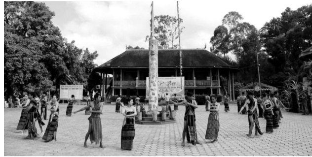
● Truyền thống văn hóa đặc trưng của người dân A Lưới cũng là tiềm năng, lợi thế phát triển du lịch.

Xác định phát triển du lịch trở thành ngành kinh tế quan trọng, gắn với giải quyết việc làm, tạo kinh tế và giảm nghèo bền vững cho người dân; nên trong những năm qua, UBND huyện A Lưới (TP Huế) đã có nhiều chủ trương, chính sách đẩy mạnh phát triển du lịch dựa trên những tiềm năng địa phương.