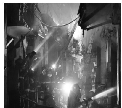
● Hiện trường vụ cháy.

Hà Nội đã điều động các lực lượng chữa cháy đến dập lửa, cứu nạn, cứu hộ. Đến khoảng 0h15 phút ngày 13/9/2023, đám cháy đã cơ bản được dập tắt.