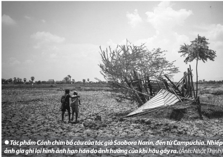
● Tác phẩm Cánh chim bồ câu của tác giả Saobora Narin, đến từ Campuchia. Nhiếp ảnh gia ghi lại hình ảnh hạn hán do ảnh hưởng của khí hậu gây ra.

Triển lãm kéo dài đến hết ngày 12/3/2025, khách tham quan được chứng kiến 12 câu chuyện từ 12 tác giả từ Việt Nam, Campuchia, Lào và Thái Lan với nội dung từ tác động của quá trình axit hóa đại dương cho đến sự sống đột ngột biến mất, nạn phá rừng và cháy rừng vẫn tiếp diễn, thiên nhiên bị tàn phá