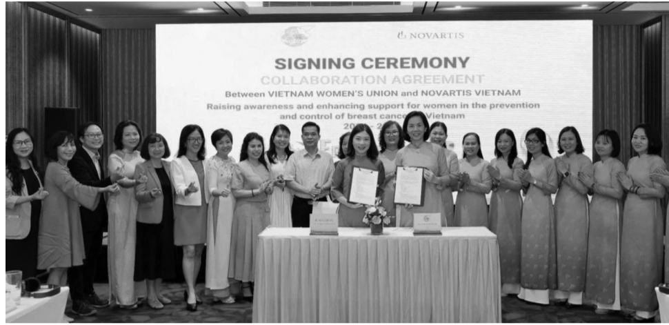
● Lễ ký kết hợp tác chương trình “Nâng cao nhận thức và tăng cường hỗ trợ phụ nữ trong công tác phòng, chống mắc ung thư vú tại Việt Nam” của Hội LHPN Việt Nam và Novartis Việt Nam.

Đối với phụ nữ, ung thư vú là một trong các loại ung thư phổ biến và có ảnh hưởng lớn đến sức khỏe sinh sản và tinh thần. Chính vì vậy, sự đồng cảm, động viên, truyền cảm hứng cho những phụ nữ không may mắc ung thư vú giúp họ vượt qua mặc cảm, thiếu tự tin để chiến thắng bệnh tật và hòa nhập trở lại với cuộc sống có ý nghĩa hết sức quan trọng.