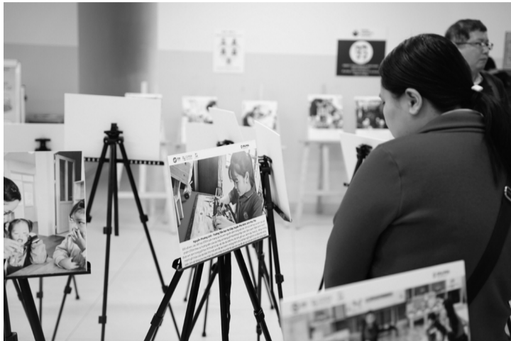
● Buổi lễ trao giải Cuộc thi ảnh "Câu chuyện về phụ nữ và trẻ em gái trong giáo dục STEM và chuyển đổi số".

Họ là những nhà giáo, nhà khoa học, chuyên gia công nghệ không ngừng nỗ lực đưa STEM (Khoa học, Công nghệ, Kỹ thuật, Toán học) đến gần hơn với trẻ em Việt Nam. Từ ngôi nhà, giảng đường đến các lớp học vùng cao, họ không chỉ truyền đạt kiến thức mà còn thắp lên đam mê khám phá, giúp thế hệ trẻ tiếp cận, làm chủ tri thức về khoa học, công nghệ và đưa ra quyết định cho tương lai.