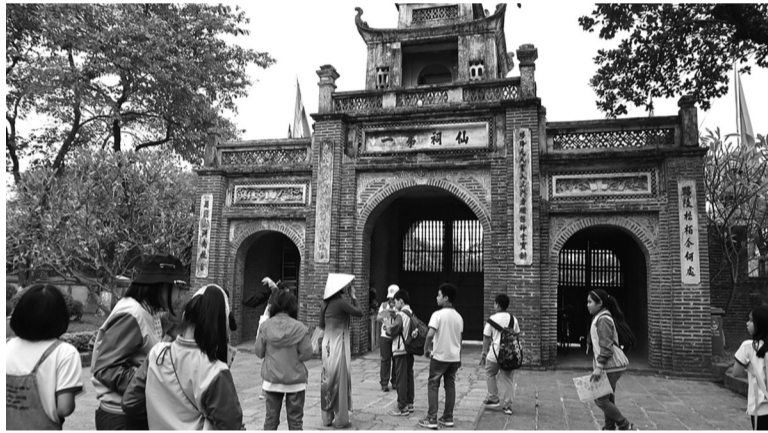
● Học sinh tham quan, trải nghiệm tại Khu Di tích Thành Cổ Loa.

Nhắc đến môn Lịch sử, nhiều người thường hình dung đến những trang sách dày đặc chữ và những con số khô khan nhưng thực tế lịch sử còn là những câu chuyện sống động, chứa đựng nhiều bài học ý nghĩa về quá khứ. Để thay đổi suy nghĩ và khơi dậy niềm yêu thích môn học này, những tiết học thực tế đã ra đời, giúp học sinh không chỉ hiểu rõ hơn về lịch sử mà còn nuôi dưỡng tình yêu quê hương, đất nước, niềm tự hào dân tộc.