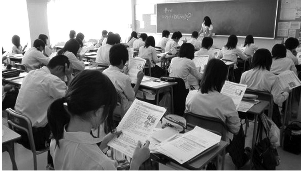
● Các trung tâm dạy thêm tại Nhật Bản rất phổ biến.

Dạy và học thêm đã trở thành một hiện tượng phổ biến ở nhiều quốc gia, đặc biệt tại những nền giáo dục cạnh tranh cao và áp lực thi cử lớn. Quản lý hoạt động dạy và học thêm là một thách thức với các nhà quản lý, đòi hỏi sự cân bằng giữa nhu cầu nâng cao, hỗ trợ kiến thức ngoài giờ học chính quy và việc bảo vệ quyền lợi, giảm thiểu áp lực không đáng có cho học sinh.