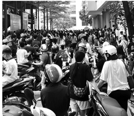
● Ai cũng muốn con em mình vui vẻ khi đến trường.