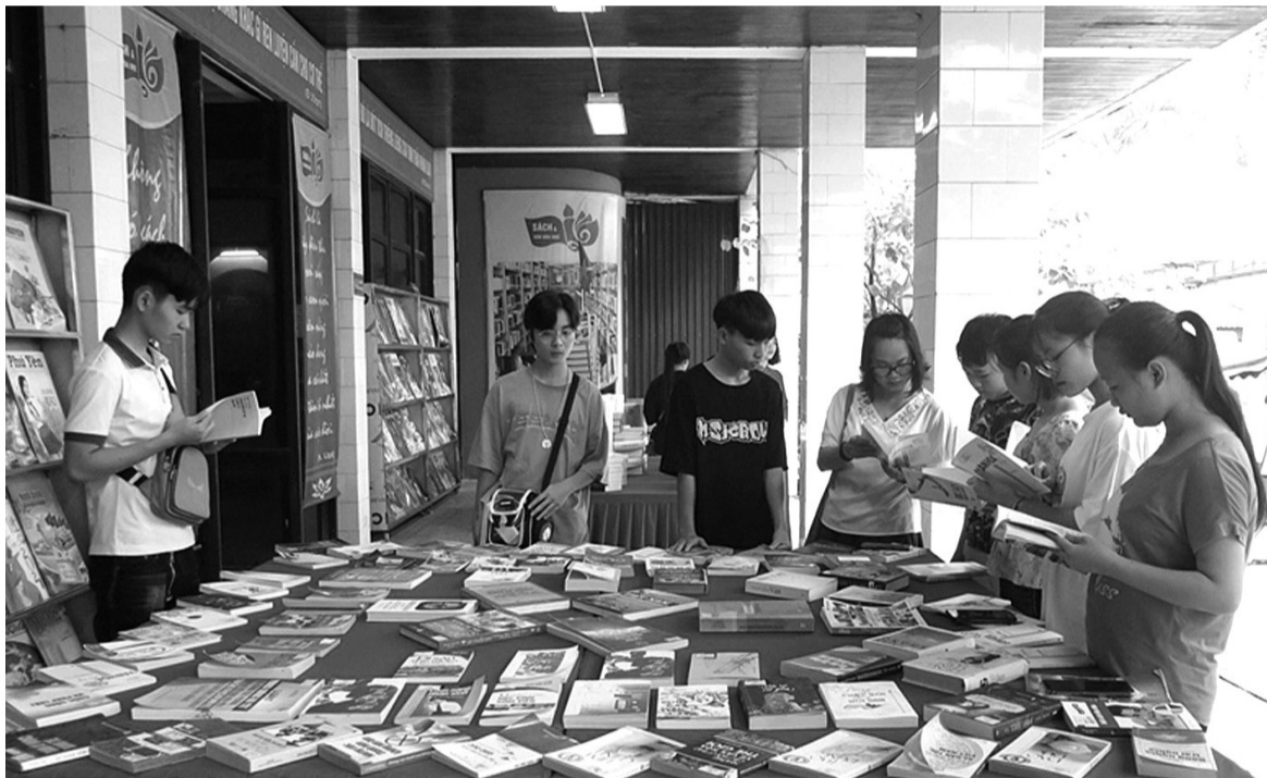
● Sách thúc đẩy trào lưu tự học ở người trẻ.

Một trong những lý do chính khiến sách học tập trở nên phổ biến hơn là nhu cầu tự học đang ngày càng mạnh mẽ, đặc biệt trong giới trẻ. Trong bối cảnh công nghệ phát triển nhanh chóng, những kỹ năng mà một người học được chỉ từ nhà trường có thể trở nên lỗi thời chỉ sau vài năm. Để tồn tại và phát triển, việc liên tục cập nhật kiến thức là điều bắt buộc.