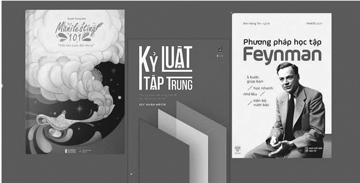
● Sách là những “người thầy vô hình”. (Ảnh B.C)