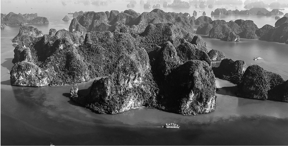
● Chương trình Nghệ thuật vì khí hậu - Hạ Long 2025 diễn ra tại Quảng Ninh có tầm ảnh hưởng toàn cầu.