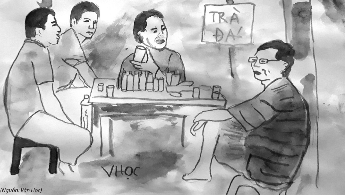
● Tranh minh họa.

chẳng hết, không có thời gian mà tiếp người đến nhận lại đồ. Mỗi người một khuôn mặt, dáng vẻ, nhưng đều giãn nở hơn hờ khi được nhận lại. Có người ào đến rồi ào đi, lời cảm ơn cục cằn như ngói vỡ. Một người nhận lại cái ví có rất nhiều giấy tờ quan trọng, nói lời cảm ơn kỹ quá đến phiên hả, rồi buộc ông nhận một chục trứng vịt lộn. Lại có những kẻ tham lam, cố tình nhận nhầm đồ giá trị hơn, có kẻ không mất thứ gì cũng đến hỏi, rồi tỏ ra tức tối, rớt muện phiền cho ông. Như thằng Tô chẳng hạn. Nếu không vì lão Rõ, bỏ thằng Tô với ông từng là đồng đội thì ông đã cho nó nắm đấm rồi.