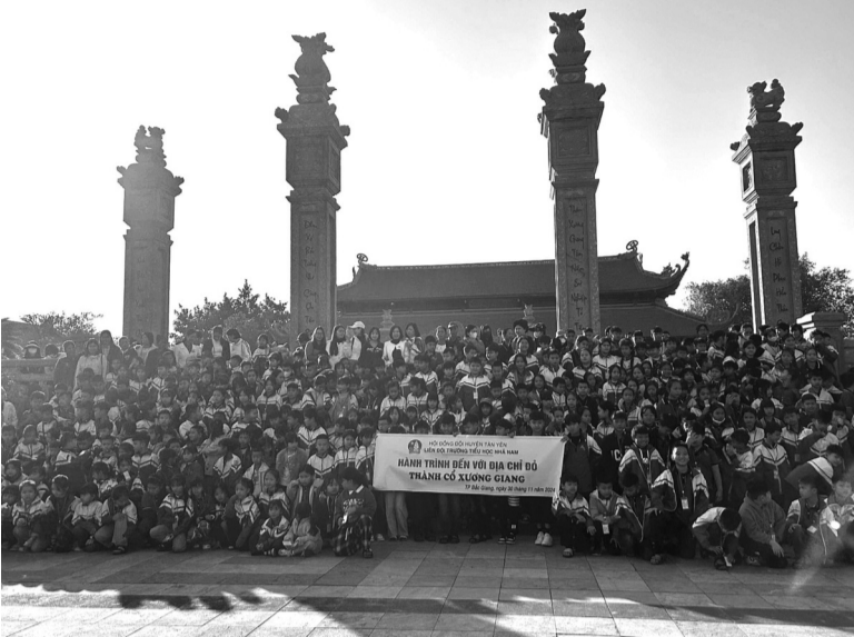
● Học sinh tham gia chương trình giáo dục lịch sử địa phương tại Thành cổ Xương Giang.