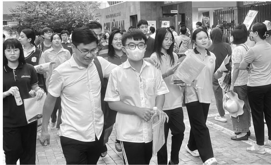
● Các tỉnh, địa phương đang siết chặt quy định về học thêm, dạy thêm.