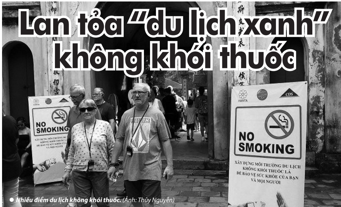
● Nhiều điểm du lịch không khói thuốc.

Nhận thức rõ tác hại của thuốc lá, tỉnh Quảng Ninh đã sớm triển khai quyết liệt các hoạt động giảm thiểu, tiến tới cấm hút thuốc lá. Một trong những địa phương của Quảng Ninh thực hiện tích cực việc giảm thiểu ảnh hưởng từ thuốc lá TP Hạ Long với Đề án "Xây dựng Hạ Long - Thành phố du lịch không khói thuốc". Quảng Ninh yêu cầu các khách sạn, nhà hàng, các điểm du lịch trên