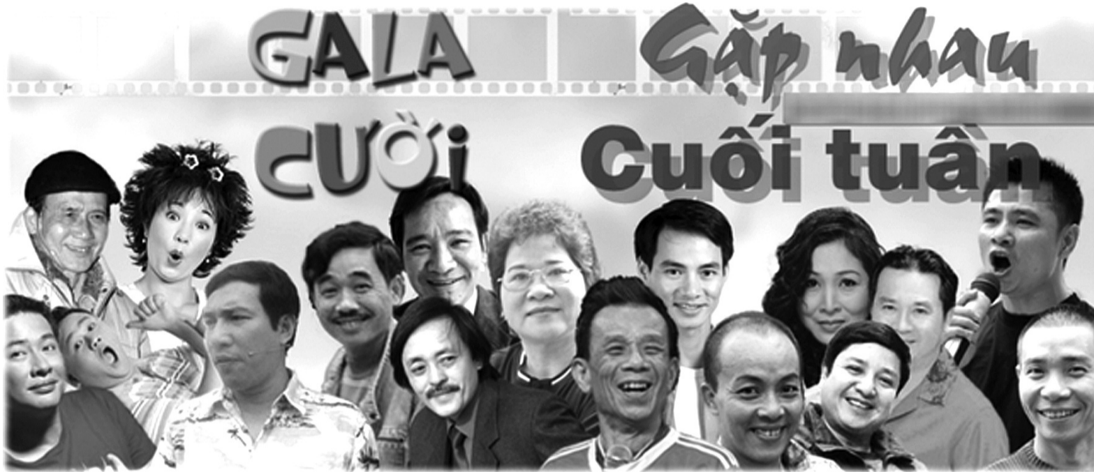
● Gặp nhau cuối tuần là bộ phóng cho nhiều nghệ sĩ nổi tiếng.

Những ai thuộc thế hệ 9X trở về trước chắc hẳn vẫn còn nhớ khoảng thời gian cả gia đình quây quần bên chiếc tivi, cùng nhau đón xem chương trình Gặp nhau cuối tuần , cùng nhau cười đùa và bàn luận rôm rả. Đến nay, dù thời gian trôi qua và thói quen giải trí đã đổi thay nhưng mỗi khi nhắc lại, nhiều người vẫn không khỏi tương tư về một trong những chương trình hài kịch gắn liền với ký ức của biết bao thế hệ.