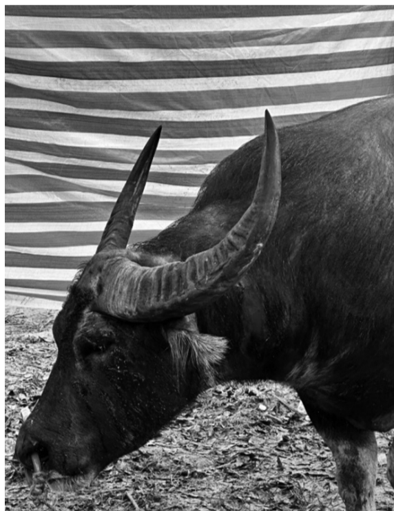
● Ảnh trong bài: Đỗ Lê Thủy Dương. (Tổ chức Động vật Châu Á)