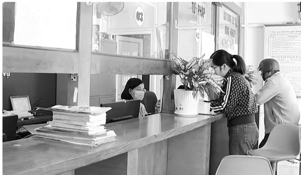
● Người dân thực hiện thủ tục về hộ tịch tại Bộ phận một cửa.

Thực hiện chức năng, nhiệm vụ được giao trong quản lý nhà nước về công tác đăng ký và quản lý hộ tịch, Bộ, ngành Tư pháp luôn chú trọng đổi mới, cải cách thủ tục hành chính đối với công tác này. Đặc biệt, Bộ đã kịp thời quán triệt, hướng dẫn triển khai quy định về việc bỏ Giấy xác nhận tình trạng hôn nhân (của công dân Việt Nam trong hồ sơ ĐKKH tại UBND cấp xã, UBND cấp huyện); khi đăng ký khai sinh không cần xuất trình Giấy chứng nhận kết hôn... tại Nghị định số 07/2025/NĐ-CP, bảo đảm khai thác dữ liệu hộ tịch đạt hiệu quả như mong muốn, đem lại sự thuận tiện tối đa cho người dân.