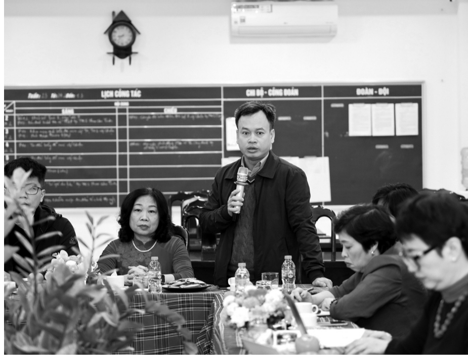
● Các thầy cô Hà Nội tại buổi làm việc về thực hiện Thông tư 29. (Ảnh: minh họa MOET)