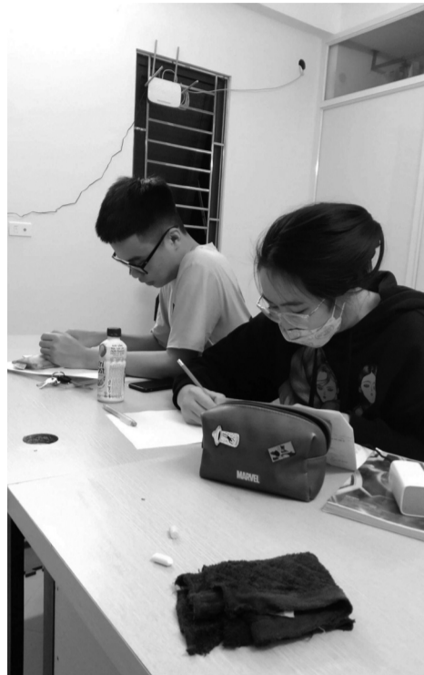
● Không ít các trung tâm, giáo viên đang tìm cách "lách luật" tiếp tục công việc dạy thêm sai quy định. (Ảnh minh họa trong bài - Nguồn: PV)

Sau khi Thông tư 29/2024/TT-BGDĐT (Thông tư 29) của Bộ GD&ĐT có hiệu lực từ ngày 14/2/2025, việc học thêm, dạy thêm ở Việt Nam hiện đang được siết chặt. Rất nhiều lớp học thêm đã tạm ngừng dạy, tuy nhiên, vẫn còn những giáo viên đang cố gắng "lách luật" để tiếp tục dạy thêm.