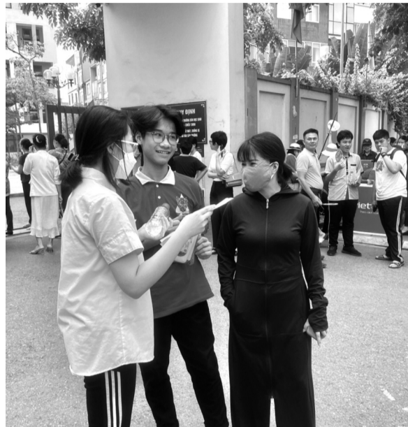
● Nhiều tỉnh, địa phương đã lập tức triển khai kế hoạch ngay sau khi Thông tư 29 có hiệu lực. (Ảnh minh họa trong bài - Nguồn: PV).