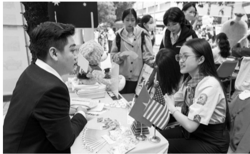
● Thí sinh tại Ngày hội tư vấn tuyển sinh 2025. (Ảnh minh họa: HUTECH)