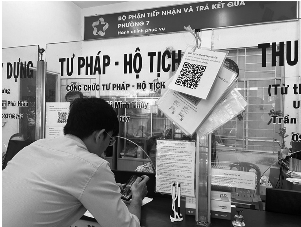
● Ngày càng đơn giản việc giải quyết các yêu cầu về hộ tịch của người dân.

Chỉ khi người đó không chứng minh được thì công chức tư pháp - hộ tịch báo cáo Chủ tịch UBND cấp xã có văn bản đề nghị UBND cấp xã nơi người đó đã từng đăng ký thường trú tiến hành kiểm tra, xác minh về tình trạng hôn nhân của người đó. Trong thời hạn 3 ngày làm việc, kể từ ngày nhận được văn bản đề nghị, UBND cấp xã được yêu cầu tiến hành kiểm tra, xác minh và trả lời bằng văn bản cho UBND cấp xã yêu cầu về tình trạng hôn nhân của người đó trong thời gian thường trú tại địa phương.