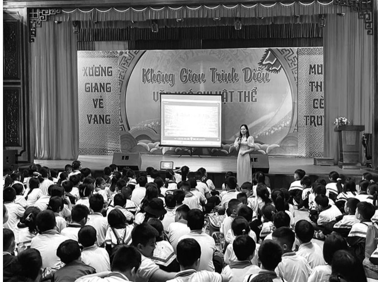
● Tiết học lịch sử ngay tại những "địa chỉ đỏ".