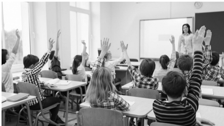
● Nền giáo dục các nước Bắc Âu chú trọng đến hạnh phúc của học sinh.