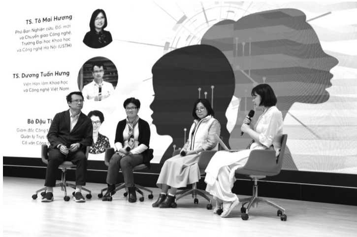
● Chuyên gia chia sẻ về bình đẳng giới trong giáo dục STEM.