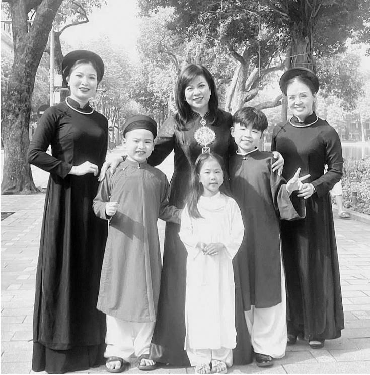
● Cô trò trường Tiểu học Ngô Tất Tố Hải Phòng cân bằng giữa học và các hoạt động ngoại khóa. (Ảnh minh họa: M.M)