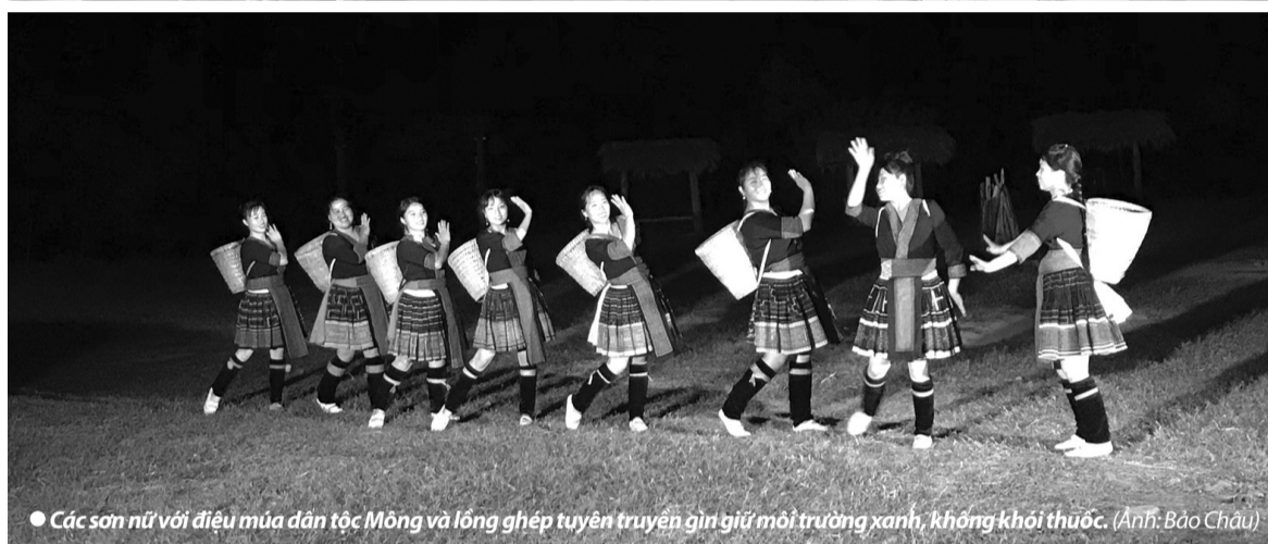
● Các sơn nữ với điệu múa dân tộc Mông và lồng ghép tuyên truyền gìn giữ môi trường xanh, không khói thuốc.