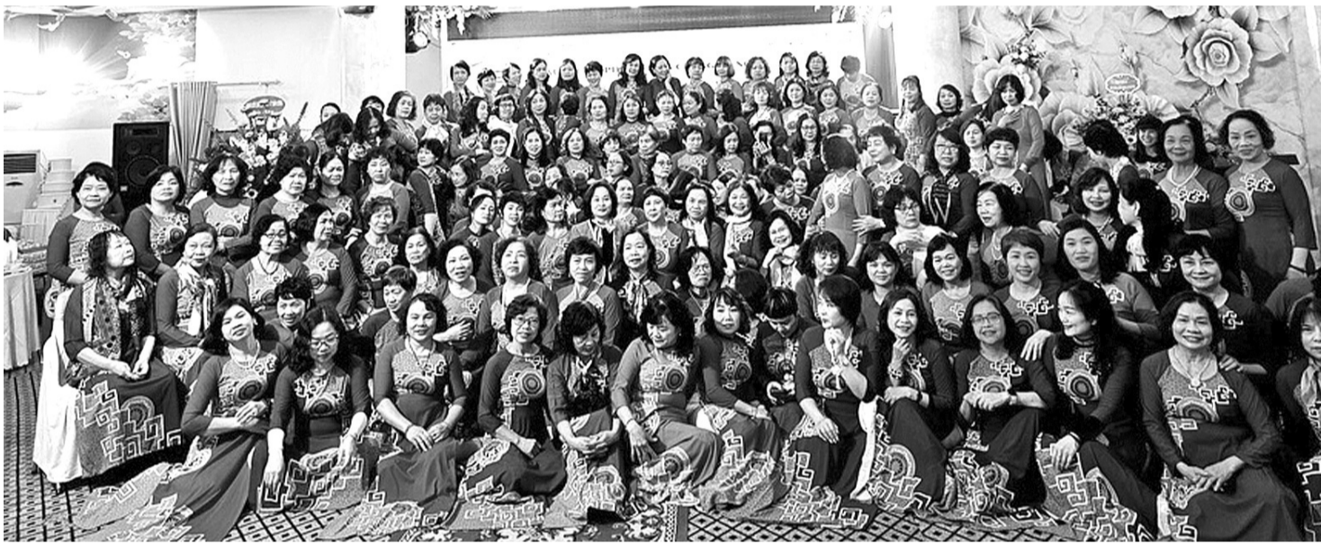
● Các thành viên CLB PNKC Hà Nội.

Theo thống kê của Tổ chức ung thư toàn cầu Globocan 2022, ung thư vú là loại ung thư phổ biến nhất ở Việt Nam, với 24.563 ca mắc mới, chiếm 28,9% các ca ung thư ở nữ giới. Nghĩa là cứ trong 100.000 phụ nữ sẽ có 24,5 người được chẩn đoán mắc ung thư vú. Mỗi năm, căn bệnh này gây ra hơn 10.000 ca tử vong, chiếm 8,3% tổng số ca tử vong do ung thư tại Việt Nam. Mặc dù vậy, nhận thức về bệnh trong cộng đồng vẫn còn hạn chế.