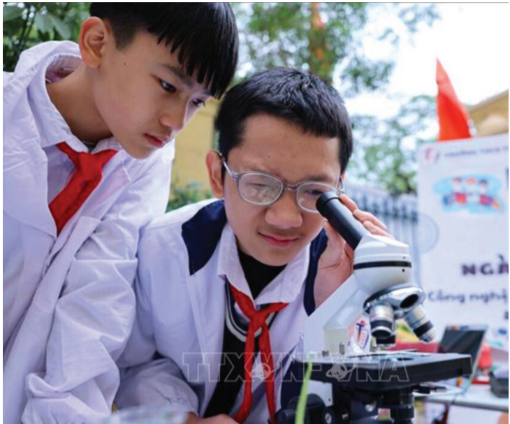
● Một nhóm học sinh Hà Nội tham gia Ngày hội Công nghệ thông tin.