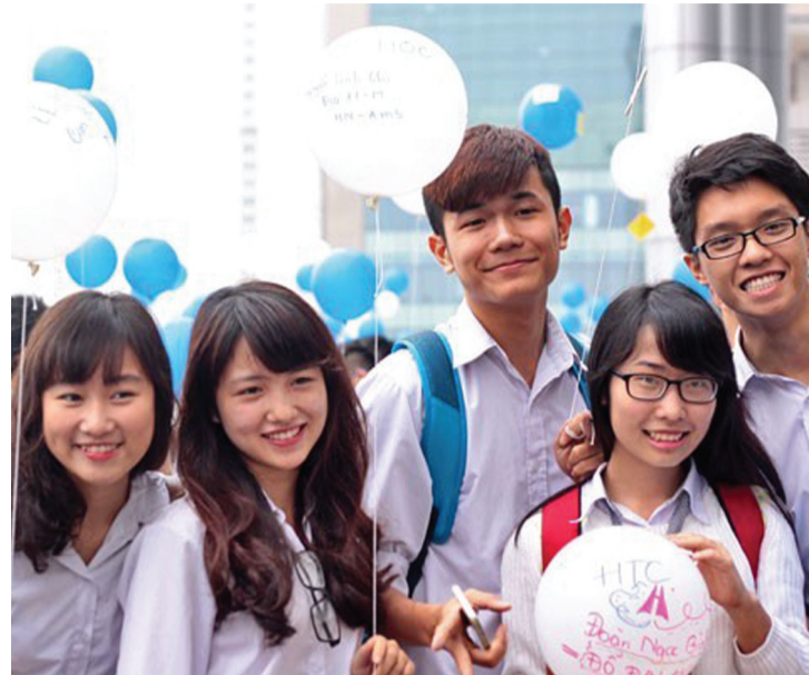
● Học sinh trung học phổ thông của Việt Nam. (Ảnh minh họa)

Kết quả nghiên cứu của Saville Việt Nam tại Thành phố Hồ Chí Minh, Hà Nội và Bình Dương được công bố năm 2023 cho thấy một bức tranh về sự phát triển của các trường tư thục và những thách thức của hệ thống giáo dục hiện tại trong bối cảnh nhu cầu về giáo dục chất lượng ngày càng tăng.