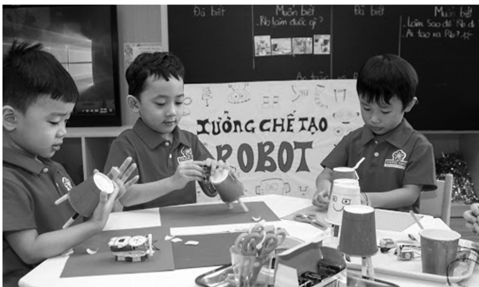
● Trẻ em được tiếp cận STEM từ cấp mầm non tại một số trường.

Họ là những nhà giáo, nhà khoa học, chuyên gia công nghệ không ngừng nỗ lực đưa STEM (Khoa học, Công nghệ, Kỹ thuật, Toán học) đến gần hơn với trẻ em Việt Nam. Từ ngôi nhà, giảng đường đến các lớp học vùng cao, họ không chỉ truyền đạt kiến thức mà còn thắp lên đam mê khám phá, giúp thế hệ trẻ tiếp cận, làm chủ tri thức về khoa học, công nghệ và đưa ra quyết định cho tương lai.