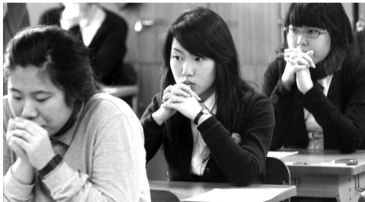
● Hàn Quốc nổi tiếng với nền giáo dục cạnh tranh khốc liệt, nơi dạy và học thêm trở thành một phần không thể thiếu.