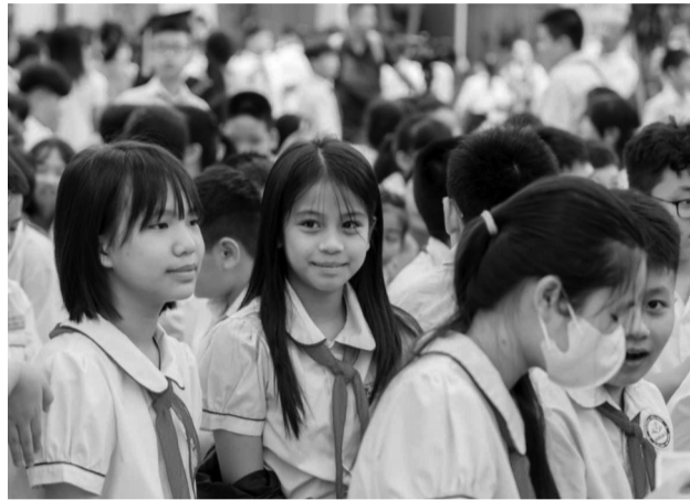
● Việc dạy thêm, học thêm đang được "siết chặt" theo Thông tư 29.