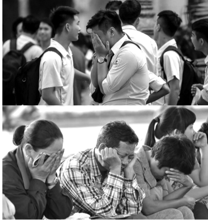
● Học thêm nên là nhu cầu tự thân của mỗi học trò thay vì thực hiện ước mơ của người lớn. (Ảnh minh họa: FB)