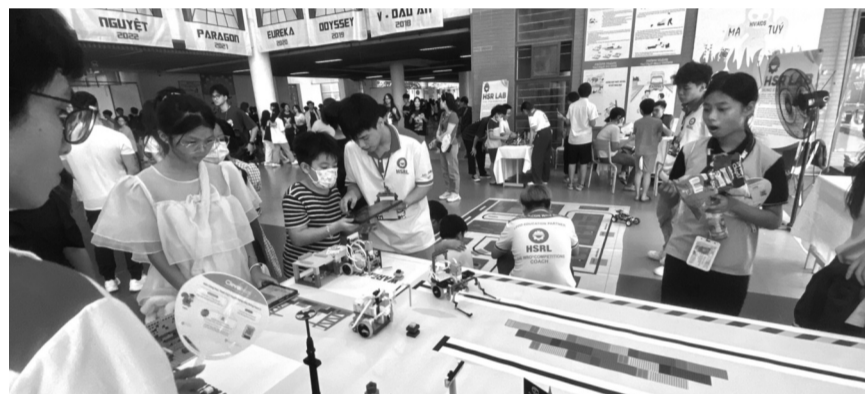
● Một số trường đã tổ chức cho các em học sinh học 2 buổi/ngày.

Thông tư 29/2024/TT-BGDĐT (Thông tư 29) có hiệu lực từ ngày 14/2/2025, trước những đổi mới trong việc dạy thêm, học thêm, các tỉnh, thành phố có những thay đổi để đảm bảo vấn đề học tập cho học sinh.