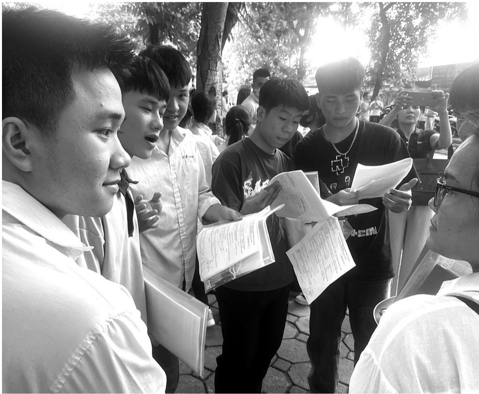
● Việc kiểm soát, siết chặt học thêm, dạy thêm đem lại nhiều lợi ích cho các em học sinh.