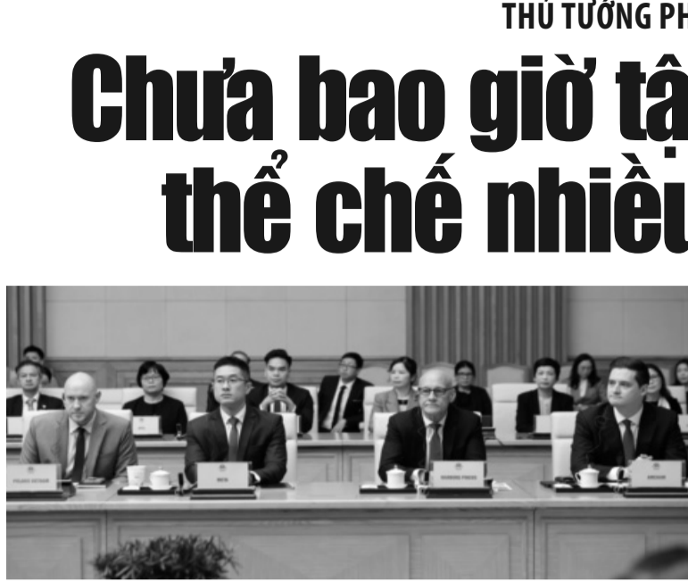
● Các doanh nghiệp Hoa Kỳ tham gia Tọa đàm.

Theo Thủ tướng, việc thực hiện cuộc cách mạng tinh gọn bộ máy và quá trình vận hành bộ máy mới cũng có thể phát sinh những vướng mắc, nhưng phía Việt Nam cam kết các cơ quan sẽ giải quyết nhanh chóng, không để ảnh hưởng tới người dân và DN. “Tóm lại, Việt Nam đang đổi mới toàn diện và bao trùm, phù hợp tình hình hiện nay. Có thể nói, chưa bao giờ Việt Nam tập trung