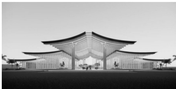
● Phối cảnh nhà ga hành khách sân bay Gia Bình.