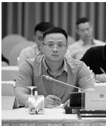
• Ông Uông Việt Dũng - Cục trưởng Cục Hàng không Việt Nam.

- Ngành Hàng không là ngành kinh tế kỹ thuật đặc biệt, là bộ phận của nền kinh tế. Sự phát triển của hoạt