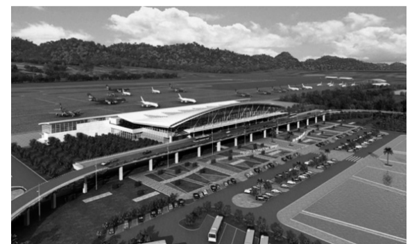
● Sân bay Phú Quốc.