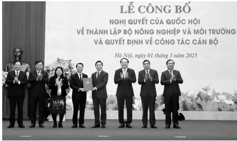
● Phó Thủ tướng Trần Hồng Hà trao các Quyết định bổ nhiệm Bộ trưởng Bộ Nông nghiệp và Môi trường Đỗ Đức Duy và các Thứ trưởng.

"Hai Bộ đã hoàn thành xuất sắc sứ mệnh giai đoạn vừa qua và bước sang bước ngoặt mới có ý nghĩa to lớn để đất nước ta bước vào kỷ