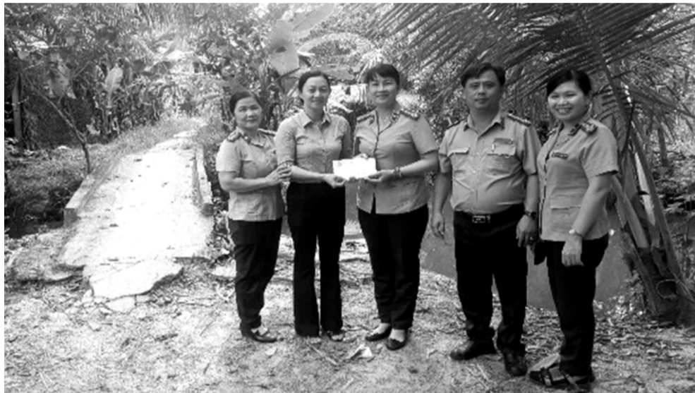
● Chi cục THADS TP Thuận An, Bình Dương trao kinh phí hỗ trợ xây cầu trên địa bàn xã Huyền Hội, huyện Cầu Kè, tỉnh Trà Vinh.

Ban Chỉ đạo THADS đã phát huy vai trò trong chỉ đạo hoạt động phối hợp trong công tác thi hành án, nhất là những vụ án lớn, án liên quan đến tín dụng ngân hàng, án kinh tế tham nhũng thuộc diện Ban Chỉ đạo theo dõi, án phức tạp, khó