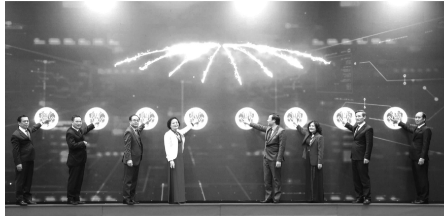
● Bộ trưởng Phạm Thị Thanh Trà và các Thứ trưởng thực hiện nghi thức ra mắt Bộ Nội vụ.

Theo Thủ tướng, trong tình hình mới, điểm tựa của đất nước ta vẫn là tinh thần đại đoàn kết toàn dân tộc, tình dân tộc, nghĩa đồng bào, cần tiếp tục phát huy cao độ nhất để thực hiện các nhiệm vụ chính trị cao cả và nặng nề mà Đảng, Nhà nước và Nhân dân giao phó. Trên