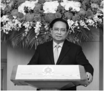
● Tại tọa đàm với các tập đoàn, DN Hoa Kỳ, Thủ tướng Phạm Minh Chính cho biết, chưa bao giờ Việt Nam tập trung vào xây dựng, hoàn thiện thể chế nhiều như hiện nay.