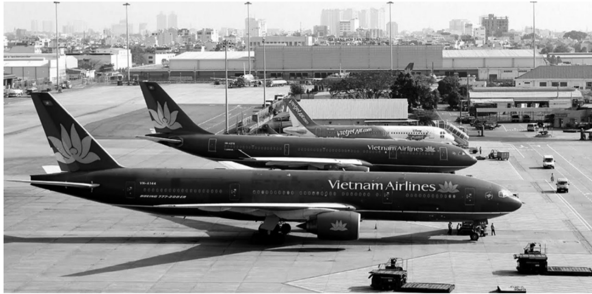
● Năm 2025 được dự báo sẽ tiếp tục là một năm tích cực đối với vận tải hàng không, đặc biệt là vận tải hàng không quốc tế.

Theo thống kê, tính đến thời điểm hiện tại, Việt Nam có 22 cảng hàng không, trong đó có 12 sân bay quốc tế và 10 sân bay nội địa. Các sân bay quốc tế lớn có thể kể đến như Tân Sơn Nhất (TP HCM), Nội Bài (Hà Nội), Đà Nẵng (Đà Nẵng)... đóng vai trò quan trọng trong việc xây cầu nối quốc gia với bạn bè năm châu, tạo điều kiện thuận lợi cho du lịch,