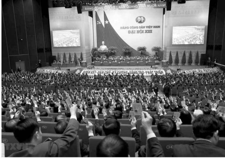
●Xây dựng đất nước giàu mạnh, hùng cường chính là thực hiện những mong muốn của Bác Hồ cũng như những mục tiêu tại Nghị quyết Đại hội lần thứ XIII của Đảng.

ương (BCH TƯ) Đảng vào trung tuần tháng 4/2025.