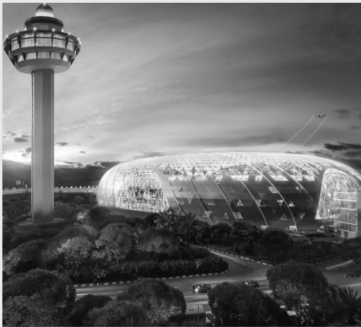
• Sân bay Changi (Singapore).

Bên kia bờ Đại Tây Dương, sân bay quốc tế Hartsfield-Jackson (Atlanta, Mỹ) là sân bay nhộn nhịp nhất thế giới xét về lượng hành khách. Là trung tâm hoạt động chính của Delta Airlines, sân bay này đóng vai trò quan trọng trong việc kết nối Bắc Mỹ với phần còn lại của thế