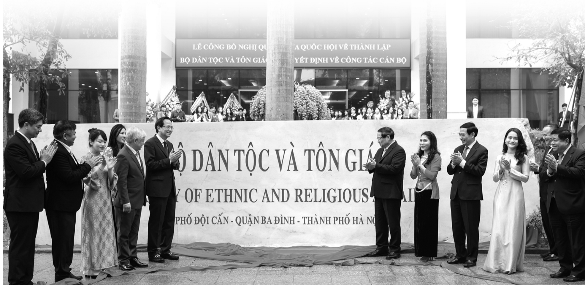
● Thủ tướng Phạm Minh Chính và các đại biểu thực hiện nghi thức ra mắt Bộ Dân tộc và Tôn giáo, ngày 1/3/2025.

● Sau 2 ngày tiếp nhận thêm nhiệm vụ mới: Công an các địa phương bắt nhịp nhanh, giải quyết công việc cho dân (Tr.10)