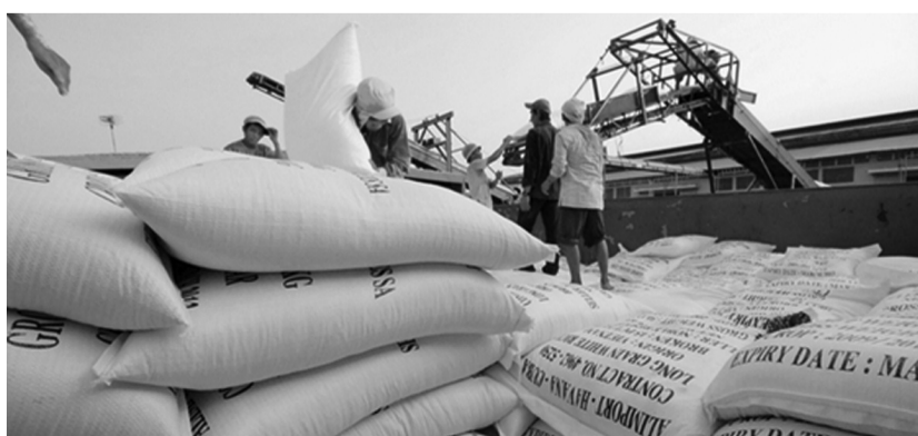
● Philippines là thị trường xuất khẩu gạo tiềm năng của Việt Nam.

Tuy nhiên, để có thể tận dụng đà tăng trưởng này, Cơ quan Thương vụ tại Philippines cho rằng, cần có những giải pháp và sự chung tay của các cơ quan, hiệp hội và doanh nghiệp. Mục tiêu trọng tâm đối với thị trường Philippines là giữ vững “vị trí số 1” và đã tăng trưởng XK gạo của Việt Nam vào thị trường Philippines vì đây là mặt hàng XK chủ lực của Việt Nam tại thị trường này. Ngoài ra, tiếp tục tìm kiếm cơ hội mở rộng ngành hàng, mặt hàng XK, gia tăng khối lượng và kim ngạch XK của từng mặt hàng vào thị trường Philippines cũng là mục tiêu quan trọng. Và cuối cùng là gia tăng XK các mặt hàng chế biến, sản phẩm công nghệ cao tiến tới hài hòa cơ cấu và tỉ trọng xuất khẩu giữa nhóm mặt hàng nông sản với nhóm mặt hàng máy móc, chế tạo, công nghệ cao. NHẬT THU