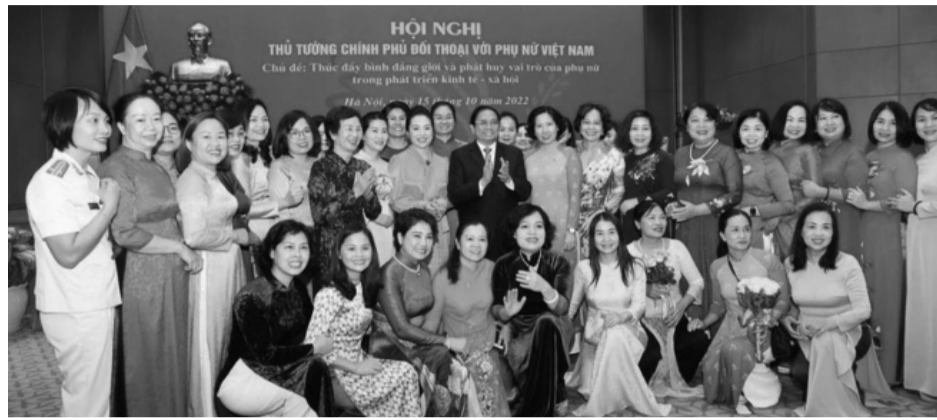
● Thủ tướng Chính phủ Phạm Minh Chính tại Hội nghị Đối thoại với phụ nữ Việt Nam tháng 10/2022.