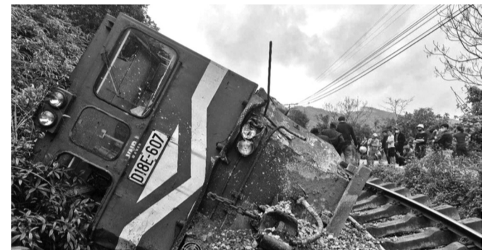
● Tàu hàng HH62 (đầu máy D18E-607) bị lật tại Km358+480 trên tuyến đường sắt Bắc - Nam.

Sau gần 1 ngày nỗ lực khắc phục sự cố lật toa tàu hàng, đến 8h Sớm qua -2/3, đường sắt Bắc - Nam qua địa bàn xã Đức Liên, huyện Vũ Quang (Hà Tĩnh) đã lưu thông trở lại. Thông tin từ lãnh đạo ga Hòa Duyệt, công tác cứu hộ, cứu nạn tàu hàng HH62 bị lật tại Km358+480 trên tuyến đường sắt Bắc - Nam đã hoàn thành. Việc sửa chữa hư hỏng, bong bật đường ray, công tác thử tải trọng được thực hiện đúng quy trình vận hành của ngành đường sắt.