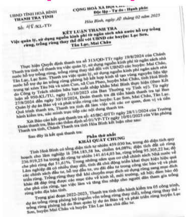
● KLTT của Thanh tra tỉnh Hòa Bình.

Theo KLTT, Ban Quản lý dự án Bảo vệ và phát triển rừng (BQLBV&PTR) các huyện Lạc Sơn, Mai Châu, Tân Lạc được Quỹ BV&PTR tỉnh cấp kinh phí thực hiện các dự án trồng rừng thay thế (trồng rừng phòng hộ) trên cơ sở hồ sơ thiết kế, dự toán