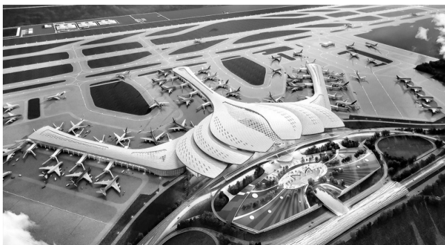
● Phối cảnh Dự án Sân bay Quốc tế Long Thành.

Khi hoàn thành, sân bay này sẽ phục vụ nhiệm vụ bay huấn luyện, sẵn sàng chiến đấu của Không quân Công an nhân dân, dự bị cho hoạt động bay của Quân chủng Phòng không - Không quân (Bộ Quốc phòng), dự bị cho các cảng hàng không, sân bay trong khu vực khi có