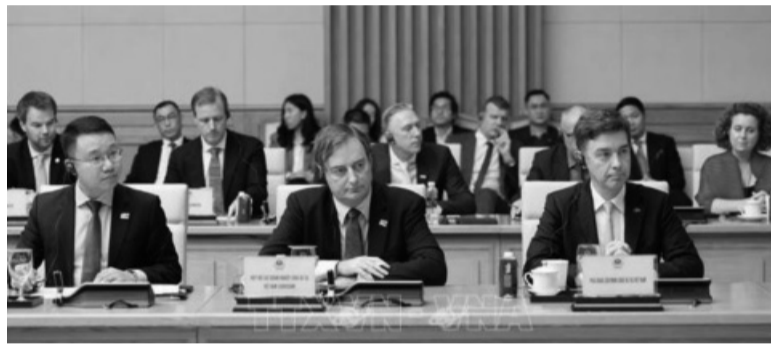
● Đại diện các tổ chức, hiệp hội doanh nghiệp châu Âu tham dự Tọa đàm.

vào cải cách thể chế nhiều như hiện nay để tạo thuận lợi nhất cho người dân và DN, thúc đẩy mạnh mẽ môi trường đầu tư kinh doanh thông thoáng, bình đẳng giữa các chủ thể, giúp các DN, nhà đầu tư hoạt động an toàn, bền vững và đạt hiệu quả ngày càng cao hơn, trên nguyên tắc lợi ích hài hòa, rui ro chia sẻ” - Thủ tướng nói.