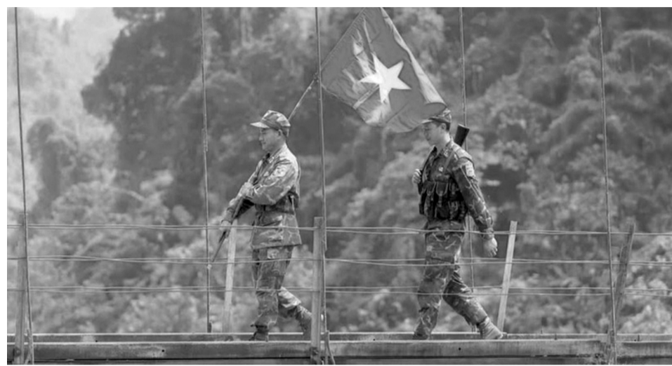
● Chiến sĩ Bộ đội Biên phòng tỉnh Cao Bằng tuần tra biên giới.

Nghĩa tình quân - dân bền chặt Hơn cả nhiệm vụ, tình cảm gắn bó giữa