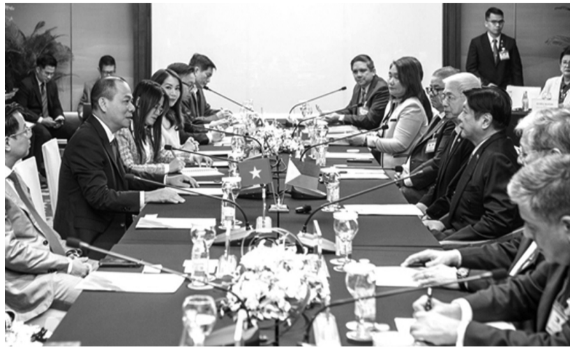
● Tháng 1/2024, trong khuôn khổ chuyến thăm cấp nhà nước tới Việt Nam, Tổng thống Philippines Ferdinand Marcos Jr đã gặp Chủ tịch Tập đoàn Vingroup Phạm Nhật Vượng.

Bên cạnh đó, hàng hóa XK của Việt Nam phải cạnh tranh khốc liệt