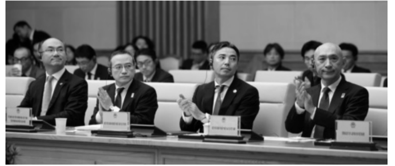
● Các doanh nghiệp Nhật Bản tham gia Tọa đàm.

Thủ tướng cho biết, Chính phủ Việt Nam cam kết “3 bảo đảm”, trong đó, bảo đảm khu vực kinh tế có vốn đầu tư nước ngoài là hợp phần quan trọng của kinh tế Việt Nam; bảo đảm các quyền lợi và lợi ích chính đáng, hợp pháp của các nhà đầu tư kinh doanh theo đúng pháp luật; bảo đảm ổn định về chính trị, trật tự, an toàn xã hội, thể chế, cơ chế, chính sách thu hút đầu tư. Ngoài ra, phía Việt Nam mong muốn thực hiện “3 cùng”: cùng lắng nghe và thấu hiểu giữa Nhà nước, DN và người dân; cùng chia sẻ tầm nhìn và hành động để mang lại hiệu quả cao nhất cho các bên, phát triển nhanh, bền vững; cùng làm, cùng hưởng, cùng thắng, cùng phát triển, cùng chung niềm vui, hạnh phúc, tự hào.