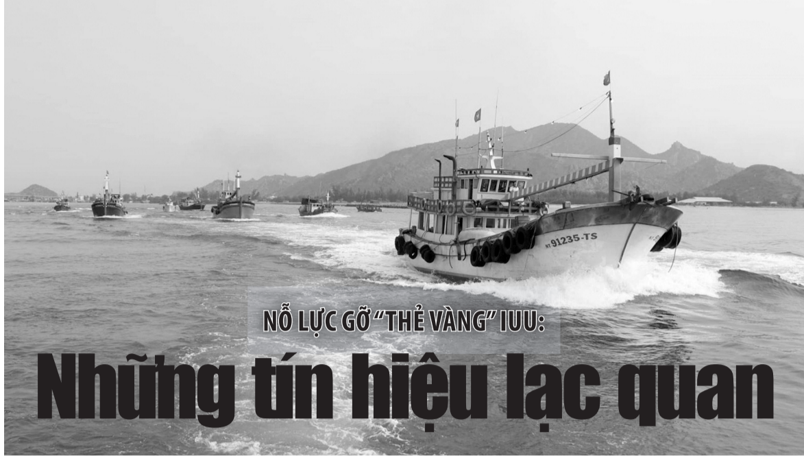
NỖ LỰC GỖ “THẺ VÀNG” IUU: