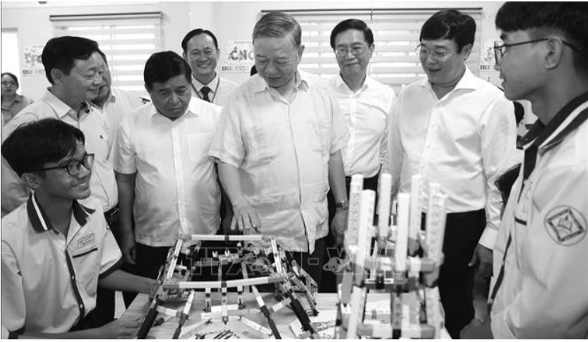
● Tổng Bí thư Tô Lâm thăm phòng thực hành giáo dục STEM tại Trường THPT Trâm Chim, huyện Tam Nông, tỉnh Đồng Tháp, ngày 11/12/2024.

Tổng Bí thư Tô Lâm vừa có bài viết nhan đề “Học tập suốt đời”: Học tập suốt đời để dám nghĩ, dám nói, dám làm, dám chịu trách nhiệm, dám hy sinh vì lợi ích chung, để trở thành người có ích cho xã hội.