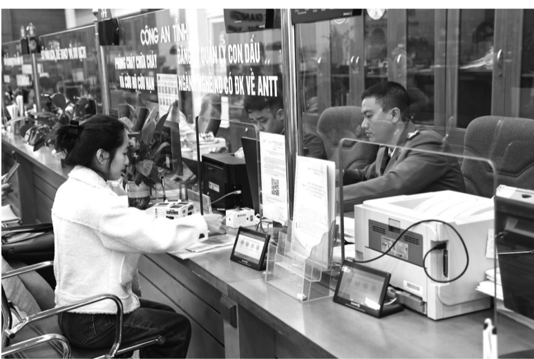
● Cán bộ Công an tỉnh Bắc Giang tiếp nhận thủ tục hành chính tại Trung tâm hành chính công tỉnh Bắc Giang.

thủ tục hành chính về cấp, quản lý Căn cước; định danh và xác thực điện tử cho công dân; trong đó, mỗi huyện, thị xã có 1 điểm; riêng ở TP Bắc Giang có 2 điểm tiếp nhận, giải quyết do Công an cấp xã thực hiện và cấp tỉnh có 1 điểm do Phòng Cảnh sát Quản lý hành chính về trật tự xã hội của Công an tỉnh Bắc Giang tiếp nhận, giải quyết.