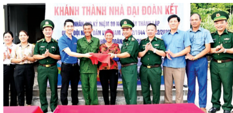
● BĐBP Hà Tĩnh là một trong những lá cờ đầu trong phong trào thi đua quyết thắng của toàn lực lượng BĐBP.