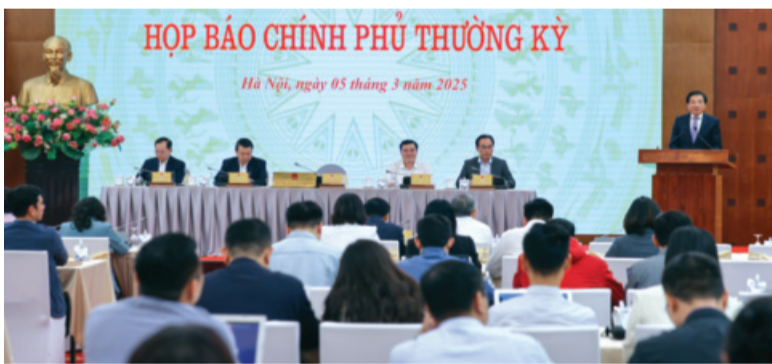
● Quang cảnh họp báo Chính phủ thường kỳ tháng 2/2025.

Chiều 5/3, tại họp báo Chính phủ thường kỳ tháng 2/2025, Phó Thống đốc Thường trực Ngân hàng Nhà nước (NHNN) Đào Minh Tú nhấn mạnh nhiệm vụ đạt được tăng trưởng GDP 8% là một trong những nhiệm vụ tất cả các cấp, các ngành, từ Trung ương đến địa phương vào cuộc rất tích cực.