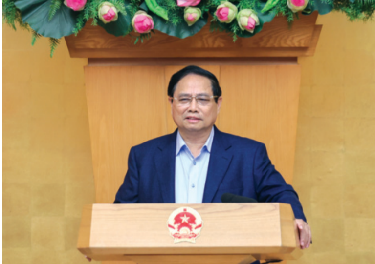
● Thủ tướng Phạm Minh Chính chỉ ra nhiều nhiệm vụ và giải pháp trọng tâm trong thời gian tới.

Các báo cáo, ý kiến tại phiên họp thống nhất đánh giá, trong tháng 2/2025, Chính phủ tiếp tục chỉ đạo triển khai quyết liệt các nghị quyết, kết luận của Trung ương, Bộ Chính trị, Ban Bí thư, lãnh đạo chủ chốt, Quốc hội, Chính phủ, chỉ đạo của Thủ tướng Chính phủ. Khẩn trương thực