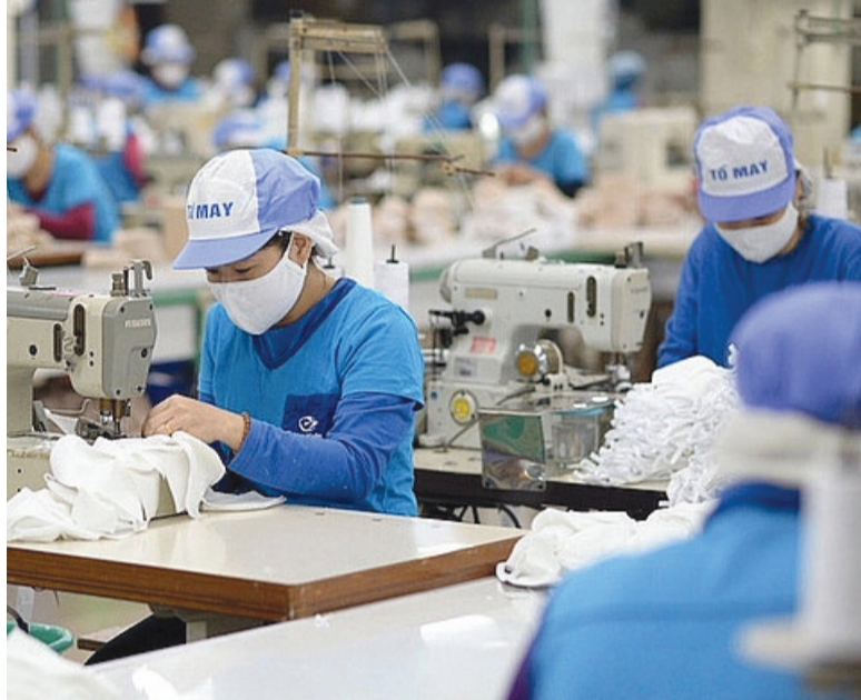
● Từng ngành, lĩnh vực đã có những bước chuẩn bị cụ thể để góp phần hoàn thành mục tiêu tăng trưởng GDP 8% của Chính phủ.

Mục tiêu tăng trưởng 8% được nhận định là thách thức nhưng vẫn có thể hoàn thành với quyết tâm cao. Hiện các ngành, lĩnh vực và doanh nghiệp cũng đã có những bước chuẩn bị cụ thể, để góp sức vào việc hoàn thành mục tiêu tăng trưởng.