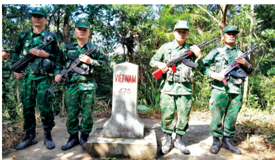
● Công tác tuần tra, kiểm soát chặt chẽ biên giới luôn được BĐBP Hà Tĩnh chú trọng.

Với vai trò chuyên trách bảo vệ biên giới, thời gian qua, Bộ đội Biên phòng (BĐBP) tỉnh Hà Tĩnh đã triển khai toàn diện, đồng bộ, hiệu quả các nhiệm vụ công tác biên phòng. Cùng với tăng cường tuần tra, kiểm soát chặt chẽ biên giới, cửa khẩu, cảng biển và tham gia phòng, chống thiên tai, cứu hộ, cứu nạn, phòng, chống cháy rừng, ngăn ngừa dịch bệnh hiệu quả để xây dựng “lũy thép” nơi biên cương; BĐBP Hà Tĩnh đã có những “cú đấm thép” giáng mạnh vào các loại tội phạm.