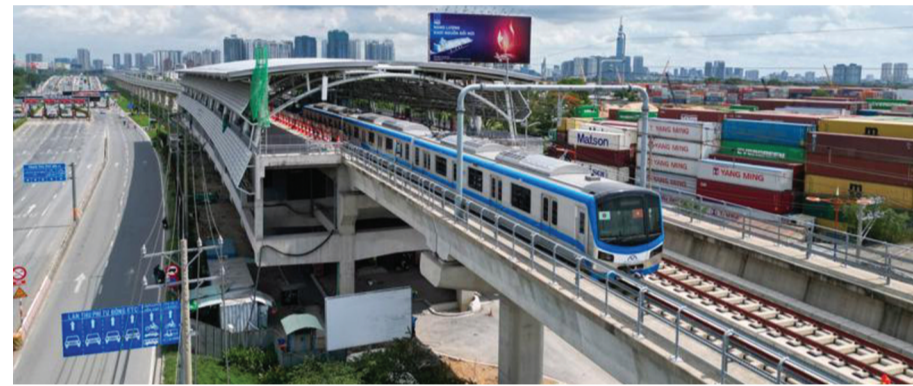
● Metro số 1 Bến Thành - Suối Tiên tại TP HCM.

TP HCM đặt mục tiêu xây dựng hệ thống giao thông thống nhất, kết nối liên vùng và đa phương thức. Mạng lưới này không chỉ đáp ứng nhu cầu đi lại của người dân mà còn phù hợp các quy hoạch kinh tế - xã hội, quy hoạch phát triển giao thông vận tải quốc gia. TP cũng đặc biệt quan tâm đến việc bảo trì, khai thác tối đa hệ thống hạ tầng hiện có và đầu tư có trọng điểm vào các công trình mang tính đột phá.