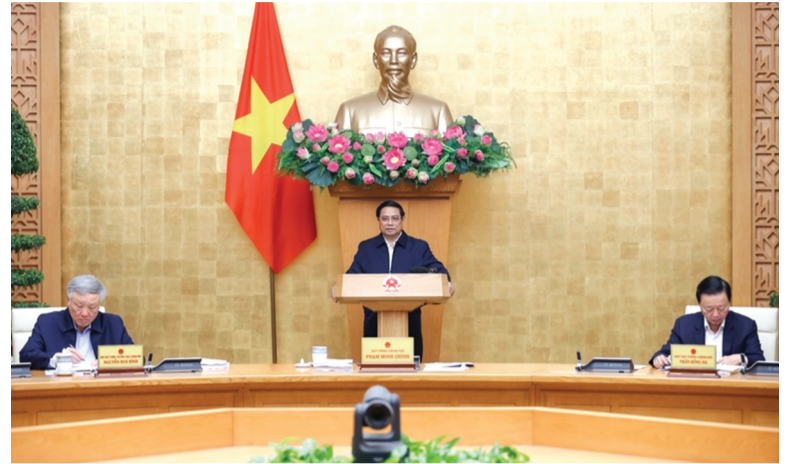
● Thủ tướng Phạm Minh Chính chủ trì Phiên họp Chính phủ chuyên đề về xây dựng pháp luật tháng 1/2025.

Về công tác THPL, Tổng Bí thư Tô Lâm, tại buổi làm việc với Ban Cán sự Đảng Bộ Tư pháp nêu trên, đã chỉ đạo 4 nhiệm vụ để nâng cao hiệu quả của công tác này. Đó là: Đổi mới công tác phổ biến, giáo dục pháp luật và tập trung xây dựng văn hóa tuân thủ pháp luật, trước hết là trong cán bộ, đảng viên và