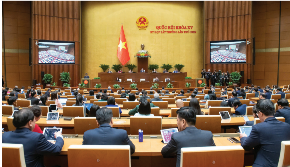
● Kỳ họp Quốc hội bất thường lần thứ 9 vừa qua đã thông qua nhiều quyết sách quan trọng cho giai đoạn phát triển mới.

Tiếp theo, chúng ta cần đổi mới việc ban hành nghị quyết của Đảng làm cơ sở, định hướng cho hoạt động xây dựng và tổ chức thi hành pháp luật. Bởi thực tế, nội dung và cách thức ra nghị quyết của Đảng trong những năm qua đã có sự đổi mới, nhưng chưa tương xứng với mong mỏi của các đại biểu QH. Về nội dung, có một số Nghị quyết quá cụ thể, quá chi tiết, rất khó thể chế hóa thành luật, nhiều trường hợp muốn tìm phương thức điều chỉnh mới phù hợp hơn nhưng lại “đụng trần” Nghị quyết. Do đó, cần bảo đảm các nghị quyết, kết luận, chỉ thị của Đảng phải xác định rõ mục tiêu tổng quát, rõ đường lối, định hướng chính trị trong một thời kỳ nhất định, bảo đảm tính đồng bộ, nhất quán, tính khoa học, tính phù hợp và khả thi của các nhiệm vụ mà nghị quyết, kết luận, chỉ thị nêu ra.