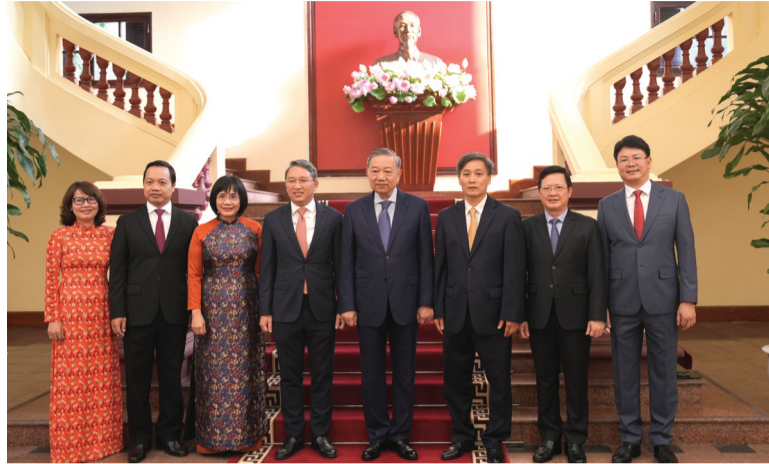
● Tổng Bí thư Tô Lâm và Ban Cán sự Đảng Bộ Tư pháp tại buổi làm việc ngày 7/11/2024.

Tổng Bí thư nhấn mạnh, đổi mới quy trình xây dựng tổ chức thực hiện pháp luật, bám sát thực tiễn, đứng trên mảnh đất thực tiễn Việt Nam để xây dựng các quy định pháp luật phù hợp, vừa làm, vừa rút kinh nghiệm, không nóng vội nhưng không cầu toàn để mất thời cơ; lấy người dân, doanh