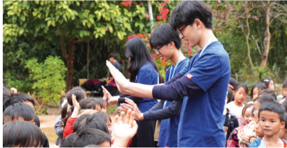
● Các em học sinh thuộc Dự án The Up Project mùa 7 có những hoạt động thiện nguyện ý nghĩa ở các bản làng vùng cao.

Hiện nay, bên cạnh việc dạy học các môn văn hóa, rất nhiều trường chú tâm rèn luyện đạo đức, “vun trồng” lòng nhân ái cho các em học sinh. Phù hợp với phương châm “tuổi nhỏ làm việc nhỏ”, học sinh được khuyến khích lan tỏa văn hóa sẻ chia. Sẻ chia ở đây là tình yêu thương, vốn kiến thức,... mà các em dành tặng cho những mảnh đời khó khăn hơn.