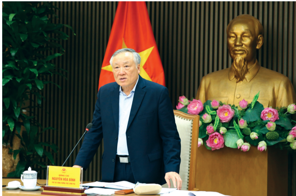
● Phó Thủ tướng Thường trực Nguyễn Hòa Bình phát biểu tại cuộc họp.

Đánh giá cao Thường trực Ban Chỉ đạo 1568 - Bộ Kế hoạch và Đầu tư trước đây và nay là Bộ Tài chính, đã phối hợp tốt với các Bộ, ngành, địa phương triển khai thực hiện các nhiệm vụ được giao, Phó Thủ tướng Thường trực cho rằng, từ khi thành lập đến nay, Ban Chỉ đạo đã tích cực triển khai, thực hiện các nhiệm vụ được giao, trong đó đã chỉ đạo các địa phương tổng hợp, báo cáo toàn diện về các dự án tồn đọng; thực hiện các yêu cầu trong nghị quyết của Quốc hội về tháo gỡ khó khăn, vướng mắc cho các địa phương và triển khai nhiều nhiệm vụ