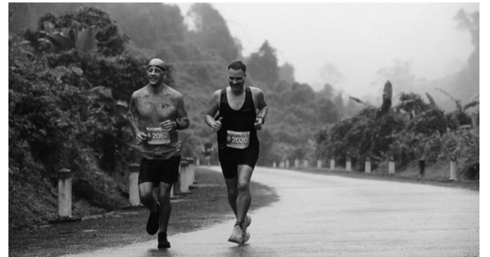
● Nhiều VĐV nước ngoài tham dự tại giải chạy khám phá Quảng Bình.

Trong 2 ngày 8 - 9/3, tại thị trấn Phong Nha (huyện Bố Trạch), Sở Văn hóa, Thể thao và Du lịch Quảng Bình tổ chức giải chạy khám phá Quảng Bình “Quang Binh Discovery Marathon - 2025”, thu hút hơn 1.200 người yêu thích thể thao nói chung và môn chạy bộ nói riêng về tham gia, khám phá những kỳ quan giữa lòng di sản.