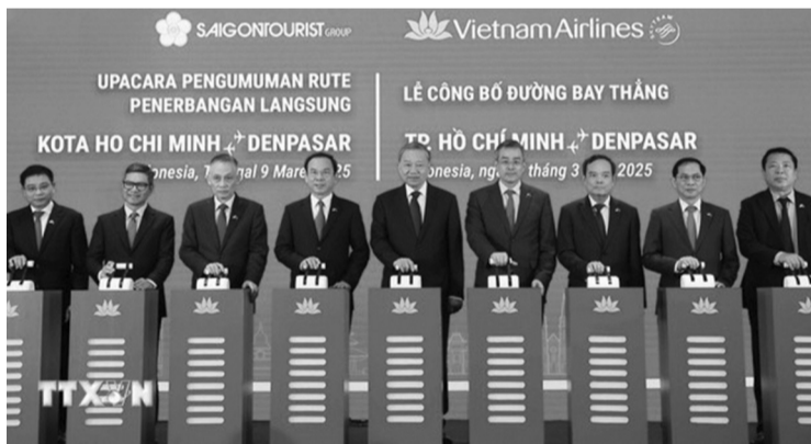
● Tổng Bí thư Tô Lâm và các đại biểu thực hiện nghi thức khai trương đường bay thẳng TP Hồ Chí Minh-Denpasar của Vietnam Airlines.