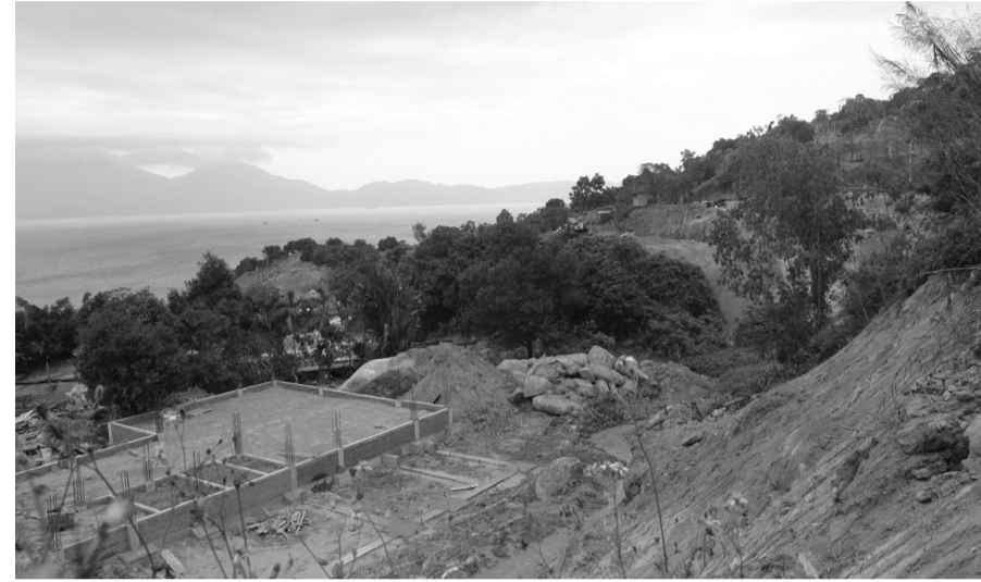
● Một dự án sai phạm về đất đai tại bán đảo Sơn Trà.

Tại buổi làm việc, sau khi thông tin về việc triển khai của TP với các chủ trương, văn bản trên, Đà Nẵng đề nghị các DN, NĐT rà soát, chuẩn bị hồ sơ