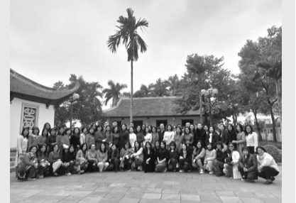
● Đoàn tham quan, dâng hương tại Nhà tưởng niệm Tổng Bí thư Nguyễn Văn Linh và Nhà tưởng niệm Trung tướng Nguyễn Bình (thôn Yên Phú, xã Giai Phạm, huyện Yên Mỹ, tỉnh Hưng Yên).

Ngày 8/3, Công đoàn Bộ Tư pháp chủ trì, phối hợp cùng Sở Tư pháp, Cục Thi hành án dân sự tỉnh Hưng Yên tổ chức chuyến sinh hoạt chuyên đề tại tỉnh Hưng Yên, nhân kỷ niệm 115 năm Ngày Quốc tế Phụ nữ (8/3/1910 - 8/3/2025) và khởi nghĩa Hai Bà Trưng.