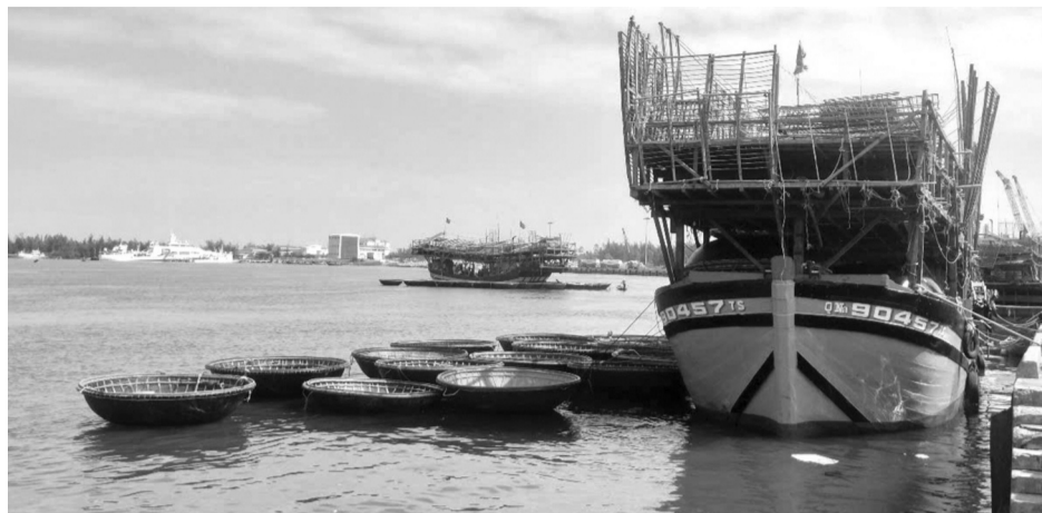
●Việc triển khai chống các hoạt động khai thác IUU tại Quảng Nam thời gian qua đạt nhiều kết quả tích cực.

Số tàu cá trên toàn tỉnh được cấp giấy phép khai thác thủy sản là 2.411 giấy phép/2.565 tàu cá (94%). Một số tàu chưa được cấp phép là do: Tàu đã thực hiện mua