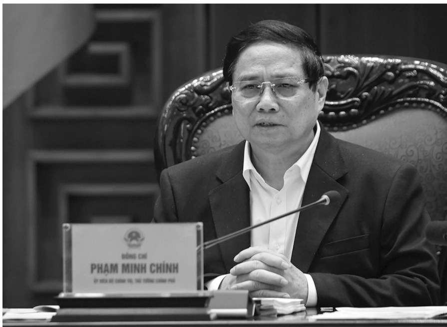
● Bí thư Đảng ủy Chính phủ, Thủ tướng Chính phủ Phạm Minh Chính chủ trì Hội nghị của Ban Thường vụ Đảng ủy Chính phủ.

trường; xây dựng văn kiện và chuẩn bị tổ chức đại hội đảng các cấp; kỷ niệm các ngày lễ lớn của đất nước... Do đó, các Ủy viên Ban Thường vụ, các cơ quan giúp việc Đảng ủy Chính