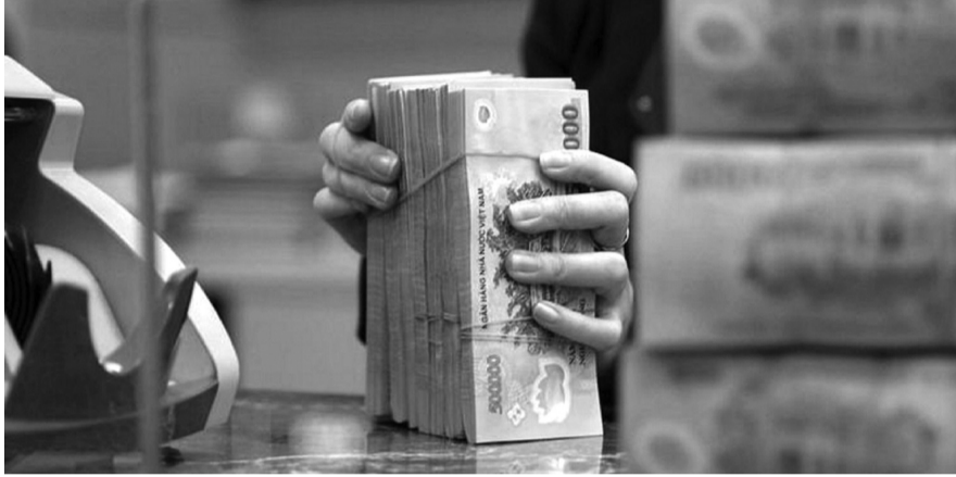
● Tiếp tục giảm lãi suất cho vay, tạo điều kiện cho doanh nghiệp mở rộng đầu tư. (Ảnh minh họa: VnEconomy)

Ngân hàng Nhà nước sẽ chủ động điều hành các công cụ để tạo điều kiện cho các ngân hàng thương mại có thanh khoản, có nguồn vốn mà không phải tăng vốn huy động, từ đó ổn định được lãi suất đầu vào và có nguồn vốn để cho vay.