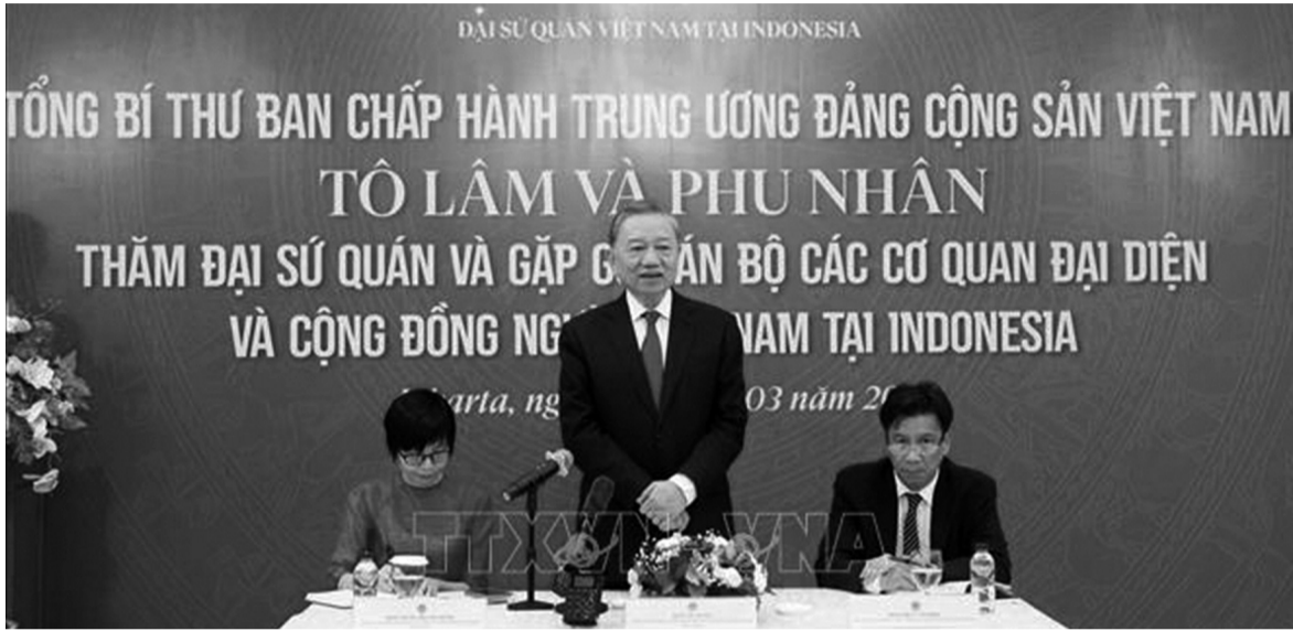
● Tổng Bí thư Tô Lâm nói chuyện với cán bộ, nhân viên Đại sứ quán, các cơ quan đại diện và cộng đồng người Việt Nam tại Indonesia.