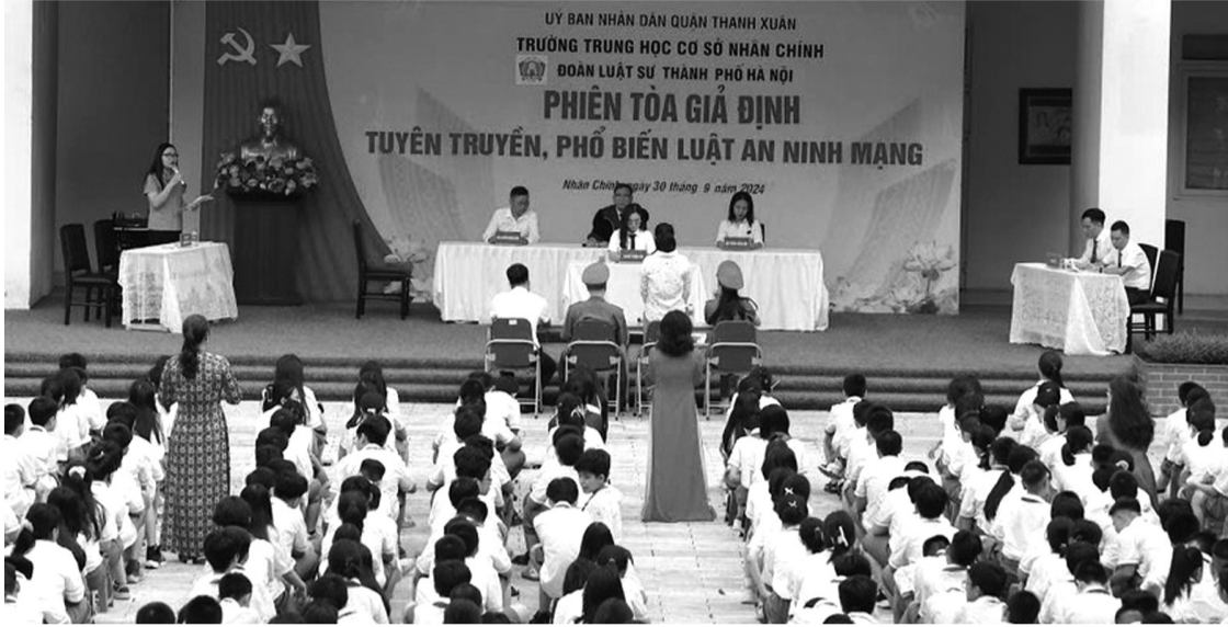
● Đoàn Luật sư TP Hà Nội phối hợp với Trường THCS Nhân Chính tuyên truyền pháp luật qua mô hình Phiên tòa giả định. (Ảnh minh họa: H.Mây)

Trên cả nước thời gian qua xuất hiện nhiều mô hình hay, cách làm mới, hiệu quả trong công tác phổ biến, giáo dục pháp luật (PBGDPL). Các mô hình này cần được đánh giá để triển khai nhân rộng.