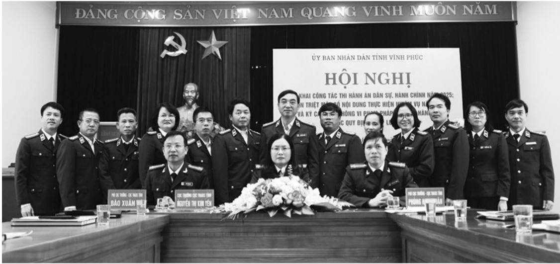
● Các cơ quan THADS Vinh Phúc ký cam kết không vi phạm pháp luật THADS.

Số thụ lý mới về việc và tiền năm sau cao hơn năm trước, tháng sau cao hơn tháng trước là những thách thức mà các cơ quan Thi hành án dân sự (THADS) trên địa bàn Vinh Phúc phải đối mặt trong bối cảnh toàn tỉnh đang gấp rút thực hiện công cuộc tinh gọn bộ máy.