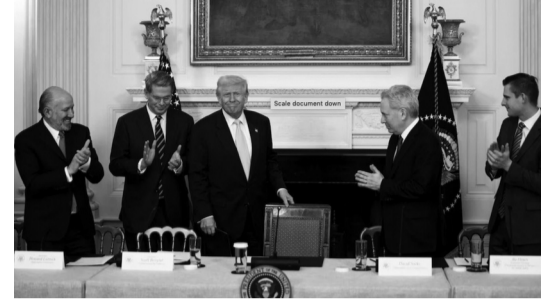
● Tổng thống Trump dự hội nghị thượng đỉnh về tiền điện tử tại Nhà Trắng ngày 7/3.

Với nước Mỹ, từ khi trở lại trong chiến dịch tranh cử Tổng thống lần thứ 2, ông Donald Trump đã thể hiện sự ủng hộ mạnh mẽ với tài sản kỹ thuật số, cam kết biến Mỹ thành “thủ đô tiền điện tử của thế giới” và thành lập kho dự trữ Bitcoin quốc gia. Ông cũng dự kiến bổ nhiệm Paul Atkins, một người có nhiều kinh nghiệm trong chính sách tiền điện tử, làm Chủ tịch Ủy ban Chứng khoán và Giao dịch Hoa Kỳ (SEC).