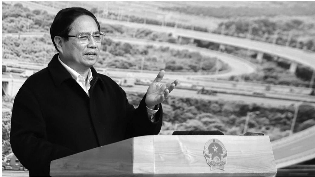
● Thủ tướng Phạm Minh Chính, Trưởng Ban Chỉ đạo Nhà nước các công trình, dự án quan trọng quốc gia, trọng điểm ngành Giao thông vận tải chủ trì họp Phiên thứ 16 của Ban Chỉ đạo.

Hiện nay, cả nước đang triển khai thi công 28 dự án/dự án thành phần đường bộ cao tốc, với tổng chiều dài khoảng 1.188km, dự kiến hoàn thành vào năm 2025 để đạt mục tiêu cả nước có 3.000km đường bộ cao tốc. Ngoài ra, nhiều dự án đường bộ khác đang tiến hành lập, phê duyệt báo cáo nghiên cứu tiền khả thi, lập thiết kế kỹ thuật, lựa chọn nhà thầu, tổ chức thi công như: Vành đai 4 Vùng Thủ đô Hà Nội, Vành đai 4 TP.HCM... Các dự án: Cảng hàng không Quốc tế Long Thành, Nhà ga hành khách T3 Cảng hàng không Quốc tế Tân Sơn Nhất, Đường sắt đô thị Nhôn - ga Hà Nội... đang triển khai bám sát kế hoạch đề ra.