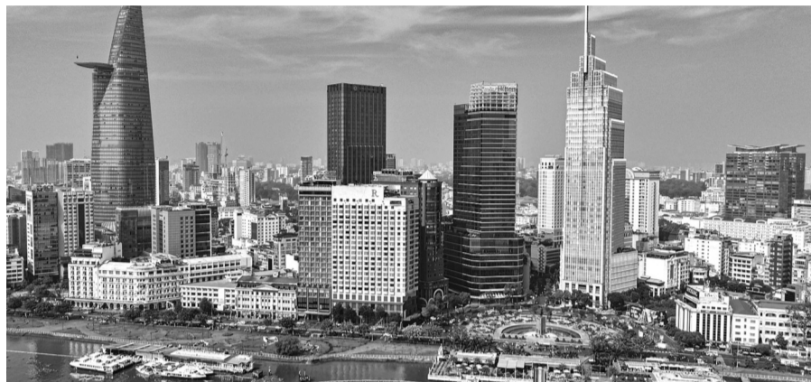
● Việc bỏ cấp huyện, sáp nhập một số đơn vị cấp tỉnh sẽ mở rộng không gian phát triển và phát huy tối đa những điều kiện, động lực thúc đẩy phát triển vùng, phát triển địa phương.

Hưởng lợi nhất là Nhân dân, bởi vì mọi hoạt động của chính quyền là phục vụ Nhân dân, do đó, khi bỏ cấp trung gian là cấp huyện, cấp cơ sở sẽ đảm trách các chức năng của cấp huyện, từ đó phát huy tính tinh gọn, cải cách hơn nữa thủ tục hành chính và kết quả đến với người dân