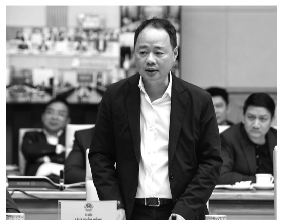
● Chủ tịch UBND tỉnh Lâm Đồng Trần Hồng Thái phát biểu tại phiên họp.