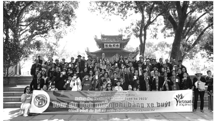
● Người dân và du khách chụp ảnh lưu niệm.

Với mục đích phục vụ Nhân dân, du khách có những trải nghiệm thực tế đến các điểm du lịch, làng nghề truyền thống, di tích lịch sử - văn hóa tiêu biểu của địa phương, Sở Văn hóa, Thể thao và Du lịch Bắc Ninh đã có kế hoạch tổ chức các tour du lịch miễn phí để qua đó quảng bá về các điểm đến du lịch, khơi dậy niềm tự hào dân tộc và truyền thống văn hiến đặc sắc của tỉnh Bắc Ninh.