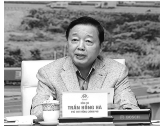
● Phó Thủ tướng Trần Hồng Hà phát biểu tại phiên họp.