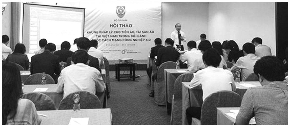
● Một hội thảo về tiền ảo do Bộ Tư pháp tổ chức năm 2018.

Một trong những nội dung của thời đại số được đặc biệt quan tâm trong vài năm gần đây chính là tiền điện tử, tiền kỹ thuật số, tiền ảo. Về việc quản lý đồng tiền này, quan điểm của Việt Nam ngày càng cởi mở, tiệm cận hơn với cách tiếp cận của các nước tiên tiến trên thế giới.