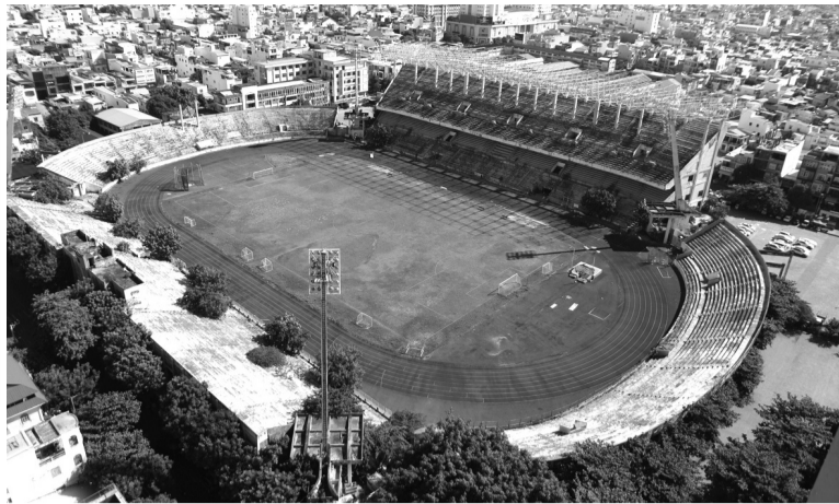
● Sân vận động Chi Lăng sẽ sớm hoàn thành giải phóng mặt bằng, điều chỉnh quy hoạch, bán đấu giá.

Tính tới hiện nay, Đà Nẵng đã có 554 trường hợp đã được giải quyết. Trong 759 trường hợp còn lại, có 709 trường hợp đã được báo cáo. Riêng với sân vận động Chi Lăng, TP đã chỉ đạo hoàn thành công tác giải phóng mặt bằng và điều chỉnh quy hoạch cục bộ trong tháng 4/2025 để tiến hành xây dựng các phương án đấu giá toàn bộ khu đất.