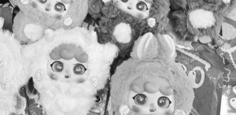
● Một dòng sản phẩm Baby Three.

DN này cho biết “gần đây đã quan sát các cuộc thảo luận trên các nền tảng trực tuyến liên quan đến thiết kế graffiti trên khuôn mặt của sản phẩm “Lily Rabbit Town thế hệ thứ 2” từ loạt Baby Three. DN khẳng định mẫu khuôn mặt của “Baby Three thỏ thị trấn ver 2” là một bức vẽ graffiti nghệ thuật gothic hoàn toàn ngẫu nhiên. Tất cả các đường nét, khối màu và biểu tượng đều dựa trên thiết kế theo phong cách nghệ thuật trừu tượng và giả tưởng, không phản ánh ảnh hưởng tới bất kỳ hình ảnh, biểu tượng hoặc đường nét địa lý cụ thể nào trong thực tế”, “không có hàm ý, ẩn dụ định ám chỉ bất kỳ vấn đề nào trong đời thực”.