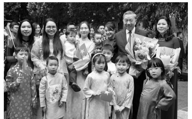
● Tổng Bí thư Tô Lâm và Phu nhân gặp gỡ cộng đồng người Việt Nam tại Indonesia.