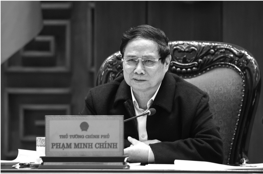
● Thủ tướng Phạm Minh Chính nhấn mạnh yêu cầu với việc sắp xếp, tổ chức lại đơn vị hành chính các cấp là tăng cường thẩm quyền, nêu cao hơn nữa tính tự lực, tự chủ, tự cường của cấp địa phương.

Chiều 11/3, Ủy viên Bộ Chính trị, Bí thư Đảng ủy Chính phủ, Thủ tướng Chính phủ Phạm Minh Chính đã chủ trì cuộc họp của Ban Thường vụ Đảng ủy Chính phủ, tiếp tục cho ý kiến về Đề án sắp xếp, tổ chức lại đơn vị hành chính các cấp và xây dựng chính quyền địa phương 2 cấp.