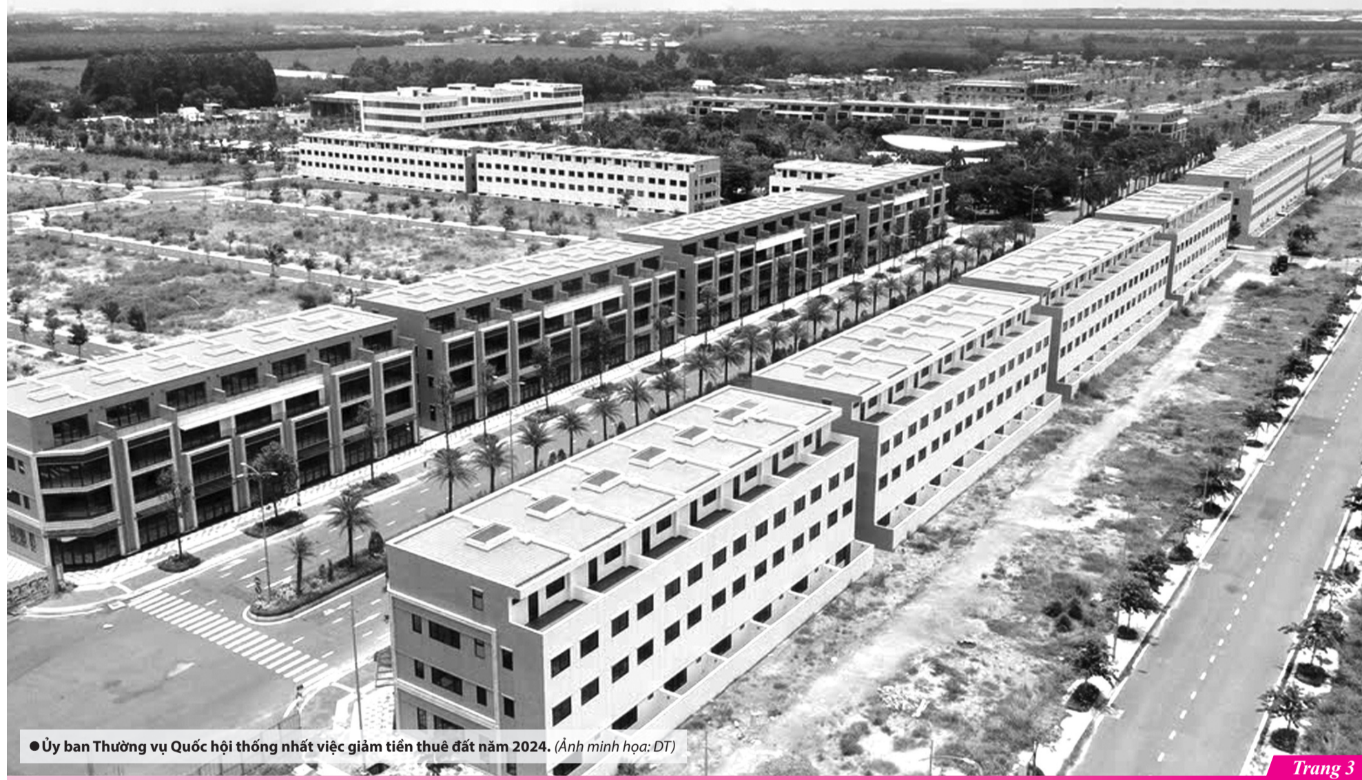
● Ủy ban Thường vụ Quốc hội thống nhất việc giảm tiền thuê đất năm 2024. (Ảnh minh họa: DT)