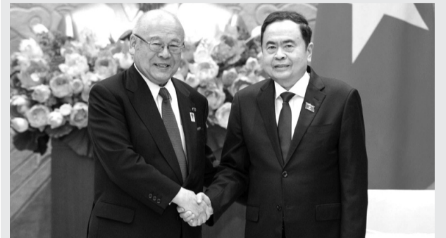
● Chủ tịch Quốc hội Trần Thanh Mẫn tiếp Cố vấn đặc biệt Liên minh Nghị sĩ hữu nghị Nhật - Việt Takebe Tsutomu.

Chiều 11/3 tại Nhà Quốc hội, Ủy viên Bộ Chính trị, Chủ tịch Quốc hội Trần Thanh Mẫn tiếp ông Tsutomu Takebe, Cố vấn đặc biệt Liên minh Nghị sĩ hữu nghị Nhật - Việt đang thăm và làm việc tại Việt Nam.