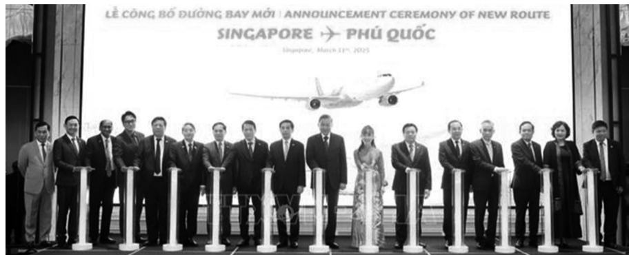
● Tổng Bí thư Tô Lâm và các đại biểu thực hiện nghi thức khai trương đường bay Phú Quốc - Singapore của Vietjet Air.

Đây là chuyến thăm đầu tiên của Tổng Bí thư Tô Lâm đến Singapore trên cương vị Tổng Bí thư, đánh dấu một bước tiến mới trong quan hệ song phương giữa Việt Nam và Singapore; thể hiện sự coi trọng thúc đẩy quan hệ với Singapore lên tầm cao mới, phù hợp với chủ trương, đường lối đối ngoại của Việt Nam. Chuyến thăm cũng góp phần làm sâu sắc hơn nữa quan hệ giữa hai Đảng, tạo cơ sở chính trị vững chắc cho quan hệ hai nước; phát huy tiềm năng