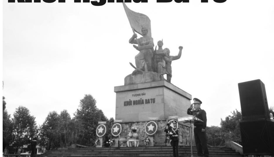
● Từ “thế trận lòng dân” trong Khởi nghĩa Ba Tơ, có thể rút ra nhiều bài học kinh nghiệm quý báu về xây dựng, phát huy sức mạnh đại đoàn kết toàn dân trong sự nghiệp xây dựng và bảo vệ Tổ quốc. (Ảnh: PV)

Thượng tướng Lê Chiêm, nguyên Thứ trưởng Bộ Quốc phòng phân tích, “thế trận lòng dân” trong hoạt động quân sự, quốc phòng là sự tổ chức và huy động sức mạnh chính trị tinh thần, niềm tin và sự đồng lòng của Nhân dân vào mục tiêu bảo vệ Tổ quốc, được tích hợp chặt chẽ với các yếu tố chính trị, kinh tế, văn hóa và đối ngoại. Trong cuộc Khởi nghĩa Ba Tơ, “thế trận lòng dân” được thể hiện rõ nét. Sự tham gia tích cực của Nhân dân là nhân tố quyết định tạo nên thành công của cuộc khởi nghĩa, là một trong những hình mẫu về khởi nghĩa vũ trang, dùng bạo lực cách mạng để đánh đổ bạo lực phản cách mạng ở Nam Trung Bộ, tạo tiền đề cho Tổng khởi nghĩa giành chính quyền tháng Tám 1945. Đội Du kích Ba Tơ dựa vào dân để hoạt động, chiến đấu và chiến thắng chứng minh cho đường lối chiến tranh nhân dân do Đảng Cộng sản Đông Dương lãnh đạo, là nét đặc sắc của nghệ