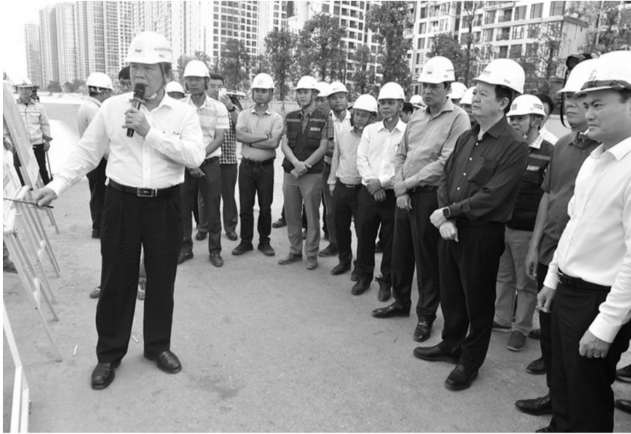
● Phó Thủ tướng Mai Văn Chính kiểm tra, nghe báo cáo tình hình thực hiện Dự án tại Km17 thuộc gói thầu XL3, dự án thành phần 1, TP HCM.

Chiều 11/3, Đoàn kiểm tra số 07 do Phó Thủ tướng Mai Văn Chính làm Trưởng đoàn đã có buổi làm việc với lãnh đạo các tỉnh, thành phố: TP HCM, Đồng Nai, Bình Dương, Long An, Vĩnh Long, Bến Tre, Tiền Giang về rà soát khó khăn, vướng mắc của dự án đầu tư xây dựng đường Vành đai 3 TP HCM.