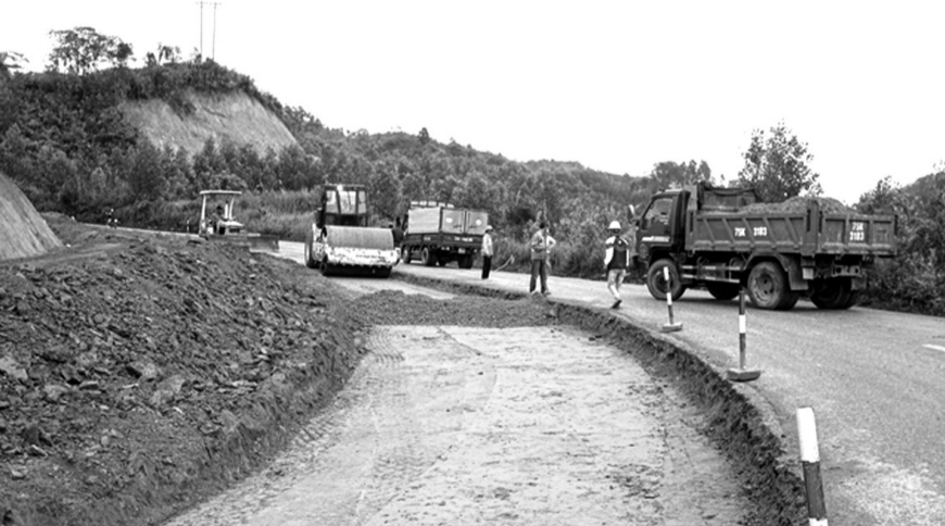
● Nhiều khúc cua tiềm ẩn TNGT trên QL49 đã được đào bạt, mở rộng tầm nhìn nhằm bảo đảm an toàn cho người đi đường.

Ngoài ra, VKS cũng đề nghị HĐXX kiến nghị các đơn vị tham mưu, phụ trách PCCC cần đưa ra các chế tài nghiêm khắc với cá nhân, tổ chức không chấp hành quy định lĩnh vực này; kiến nghị chấn chỉnh công tác thanh tra lĩnh vực xây dựng để bảo đảm tính nghiêm minh của pháp luật. HỒNG MÂY