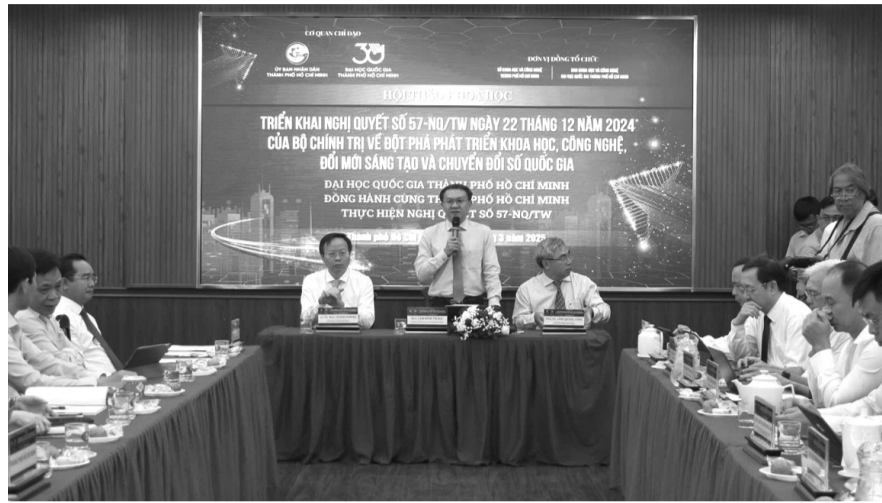
● Hội thảo do UBND TP HCM phối hợp ĐHQG TP HCM tổ chức.

Ngay sau hội nghị toàn quốc triển khai Nghị quyết 57, TP đã bắt tay ngay vào việc hoàn thành các văn bản khung và thành lập Ban Chỉ đạo, hội đồng tư