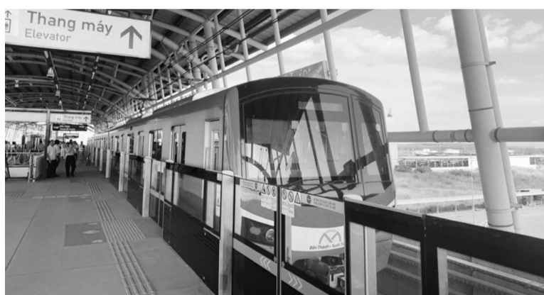
● TP HCM đã thống nhất chủ trương chuyển toàn bộ nguồn vốn thực hiện tuyến metro số 2 (Bến Thành - Tham Lương) từ vốn vay ODA sang vốn ngân sách nhà nước.

Theo chủ trương mới, TP HCM sẽ bổ sung quy mô dự án, bao gồm công trình kết nối đồng bộ tuyến metro số 1 và số 2 tại ga trung tâm Bến Thành, tạo nền tảng hạ tầng giao thông đô thị hiện đại và đồng bộ. Ban Thường vụ Thành ủy giao Đảng ủy UBND TP và lãnh đạo UBND TP chỉ đạo Ban Quản lý Đường