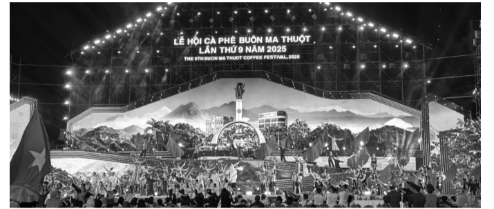
● Khai mạc Lễ hội Cà phê Buôn Ma Thuật lần thứ 9 năm 2025.

Lễ hội Cà phê Buôn Ma Thuật lần thứ 9 là hoạt động thiết thực chào mừng kỷ niệm 50 năm Ngày Chiến thắng Buôn Ma Thuật, giải phóng tỉnh Đắk Lắk (10/3/1975 - 10/3/2025). Đây cũng là sự kiện quan trọng, góp phần quảng bá thương hiệu cà phê Buôn Ma Thuật, xây dựng hình ảnh thành phố Buôn Ma Thuật là "Thành phố cà phê của thế giới".