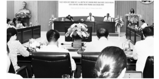
● Quang cảnh Hội thảo. (Ảnh: TG)

Ngày 11/3, Học viện Cán bộ TP HCM tổ chức Hội thảo khoa học với chủ đề "Thực hiện Quy định số 144-QĐ/TW về chuẩn mực đạo đức cách mạng của cán bộ, đảng viên trong giai đoạn mới".