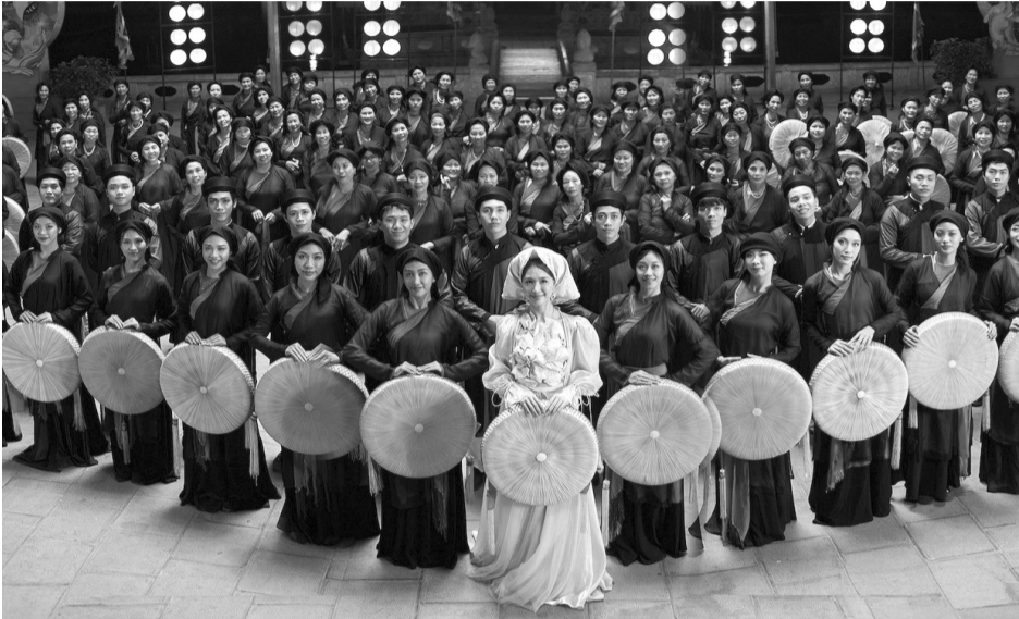
● MV "Bắc Blink" của Hòa Minzy đang quảng bá hình ảnh đẹp của tỉnh Bắc Ninh đến với du khách.

Hiện nay, nhiều MV âm nhạc đang trở thành cách quảng bá du lịch nhanh chóng, hiệu quả cho những điểm đến ở Việt Nam. Việc sử dụng âm nhạc để thu hút khách du lịch hứa hẹn sẽ trở thành mô hình độc đáo, hấp dẫn trong thời gian tới.