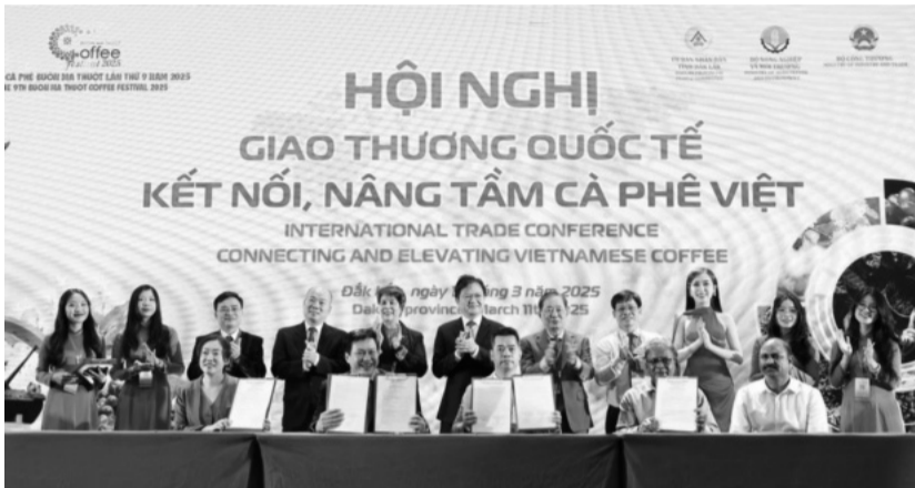
● Ký kết biên bản thỏa thuận hợp tác trong khuôn khổ Hội nghị.

Sáng 11/3, tại TP Buôn Ma Thuật, UBND tỉnh Đắk Lắk phối hợp cùng Bộ Công Thương, Bộ Nông nghiệp và Môi trường, Hiệp hội Cà phê - Ca cao Việt Nam (Vicofa) cùng tổ chức Hội nghị Giao thương Quốc tế - Kết nối, nâng tầm cà phê Việt. Đây là sự kiện nằm trong khuôn khổ Lễ hội Cà phê Buôn Ma Thuật lần thứ 9 năm 2025.