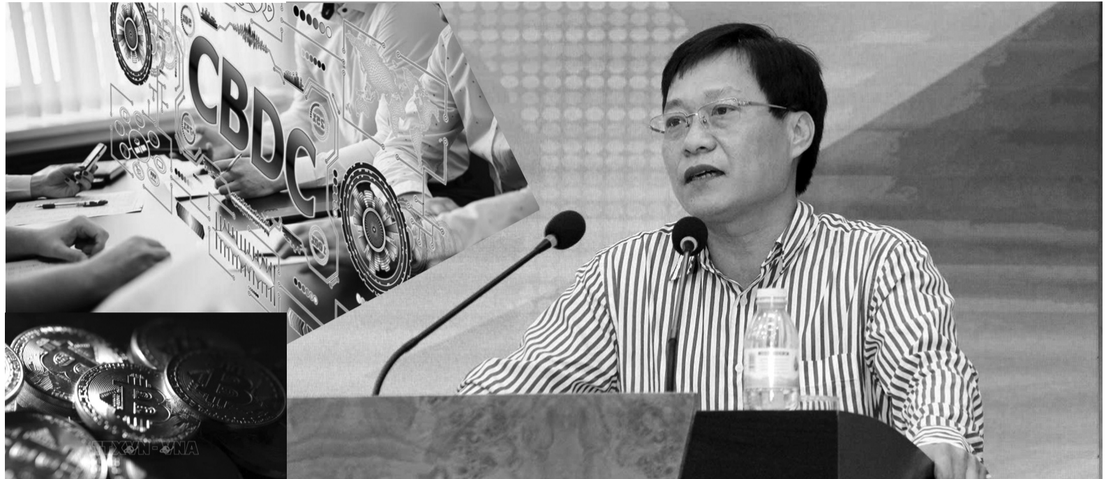
• Đồng tiền Bitcoin.

Trong thời gian tới, Việt Nam cần ban hành khung pháp lý cho