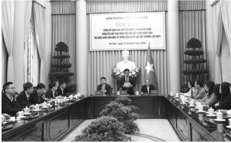
● Toàn cảnh buổi họp báo.

Luật được xây dựng trên quan điểm bảo đảm sự lãnh đạo toàn diện, trực tiếp của Đảng trong công tác xây dựng pháp luật mà cụ thể là thể chế kịp thời, đầy đủ các ý kiến chỉ đạo của Bộ Chính trị, của đồng chí Tổng Bí thư, Thủ tướng Chính phủ, Chủ tịch Quốc hội về đổi mới mạnh mẽ tư duy xây dựng pháp luật. Bảo đảm tính hợp hiến, hợp pháp, tính đồng bộ, thống nhất của hệ thống pháp luật và tính tương thích với