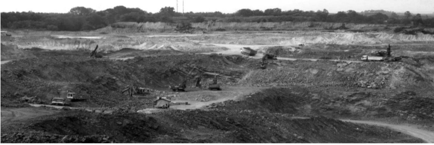
● Sở NN&MT đã lên kế hoạch phân bổ hơn 7,1 triệu m 3 đá xây dựng từ 12 mỏ trên địa bàn Đồng Nai.

Việc phân bổ nguồn đá này có vai trò quan trọng trong bảo đảm tiến độ thi công các công trình trọng điểm, nhất là trong giai đoạn cao điểm xây dựng. UBND tỉnh cam kết tiếp tục đồng hành cùng DN, kịp thời tháo gỡ khó khăn để đáp ứng nguồn cung vật liệu ổn định cho các dự án quan trọng của quốc gia. THIÊN PHÚC