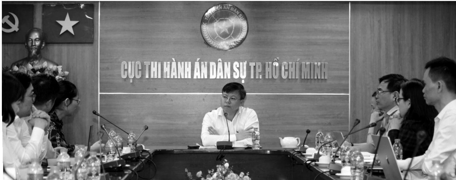
● Cục THADS TP. Hồ Chí Minh làm việc với các cơ quan liên quan về xây dựng phần mềm phục vụ quá trình tổ chức thi hành án vụ án Vạn Thịnh Phát.

Với các vụ việc có số lượng tài sản phải xử lý đặc biệt lớn, số người được thi hành án đặc biệt đông nếu thực hiện theo quy định hiện hành thì cơ quan Thi hành án dân sự (THADS) phải thực hiện thanh toán tiền thi hành án nhiều nghìn lần.