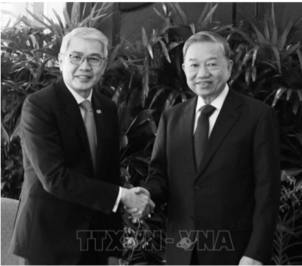
● Tổng Bí thư Tô Lâm tiếp ông Lim Ming Yan, Chủ tịch Liên đoàn Doanh nghiệp Singapore (SBF).

Sau khi kết thúc tốt đẹp chuyến thăm cấp nhà nước tới Cộng hòa Indonesia, thăm chính thức Ban Thư ký ASEAN, 14h17 ngày 11/3 (giờ địa phương), chuyên cơ chở Tổng Bí thư Tô Lâm và Phu nhân cùng Đoàn đại biểu cấp cao Việt Nam đã đến sân bay Changi, Singapore, bắt đầu chuyến thăm chính thức Cộng hòa Singapore từ ngày 11 - 13/3, theo lời mời của Thủ tướng Cộng hòa Singapore, Tổng Thư ký Đảng Hành động Nhân dân Singapore (PAP) Lawrence Wong.