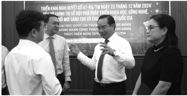
● Chủ tịch UBND TP Nguyễn Văn Đước trao đổi cùng các đại biểu.