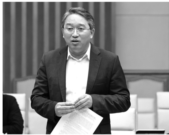
● Bộ trưởng Bộ Tư pháp Nguyễn Hải Ninh phát biểu tại phiên họp.