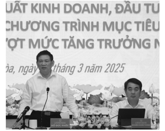
● Phó Thủ tướng Hồ Đức Phớc phát biểu tại buổi làm việc.

Ngày 13/3, Đoàn công tác do Phó Thủ tướng Chính phủ Hồ Đức Phớc dẫn đầu đã làm việc với các tỉnh Khánh Hòa, Phú Yên, Bình Định về việc thúc đẩy sản xuất, kinh doanh, đầu tư công, xuất nhập khẩu, các chương trình mục tiêu quốc gia, phấn đấu đạt và vượt mức tăng trưởng năm 2025.