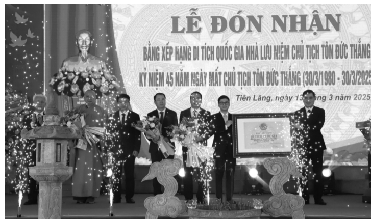
Đại diện Bộ VH,TT&DL trao Bằng xếp hạng di tích quốc gia Nhà lưu niệm Chủ tịch Tôn Đức Thắng.

Năm 1958, khi là Phó Chủ tịch nước, về thăm nông trang Nam Bộ, Phó Chủ tịch nước Tôn Đức Thắng rất xúc động trước mảnh đất và con người rất gần gũi với quê hương Nam Bộ. Trước nguyện vọng được xây cất một ngôi nhà trên mảnh đất này để tiện đi về thăm bà con quê hương, Trung ương Đảng chấp thuận để Phó Chủ tịch nước Tôn Đức Thắng