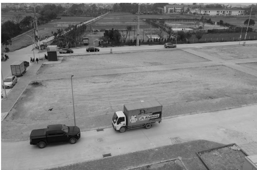
● Các thửa đất trong khu đấu giá đất tại thôn Đông Lai, xã Quang Tiến, Sóc Sơn - nơi các đối tượng “thổi giá” bỏ cọc 30 tỷ đồng/m 2 vào tháng 11/2024.