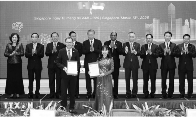
● Tổng Bí thư Tô Lâm chứng kiến trao văn kiện hợp tác giữa các doanh nghiệp hai nước.

Chiều 13/3, Tổng Bí thư Tô Lâm và Phu nhân cùng Đoàn đại biểu cấp cao Việt Nam đã về đến sân bay Nội Bài (Hà Nội), kết thúc tốt đẹp chuyến thăm chính thức Cộng hòa Singapore từ ngày 11 - 13/3, theo lời mời của Thủ tướng Cộng hòa Singapore, Tổng Thư ký đảng Hành động Nhân dân Singapore (PAP) Lawrence Wong.