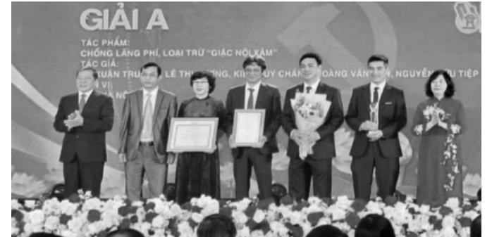
● Năm 2024 đánh dấu lần thứ 7 liên tiếp Giải báo chí về xây dựng Đảng và hệ thống chính trị TP Hà Nội được tổ chức.

Ngày 13/3/2025, Thành ủy Hà Nội tổ chức Lễ trao Giải báo chí về xây dựng Đảng và hệ thống chính trị TP Hà Nội lần thứ VII năm 2024. Đây là sự kiện quan trọng, thiết thực chào mừng kỷ niệm 95 năm Ngày thành lập Đảng bộ TP Hà Nội (17/3/1930 - 17/3/2025), tôn vinh những tác phẩm báo chí xuất sắc góp phần nâng cao chất lượng công tác xây dựng Đảng và hệ thống chính trị của Thủ đô.