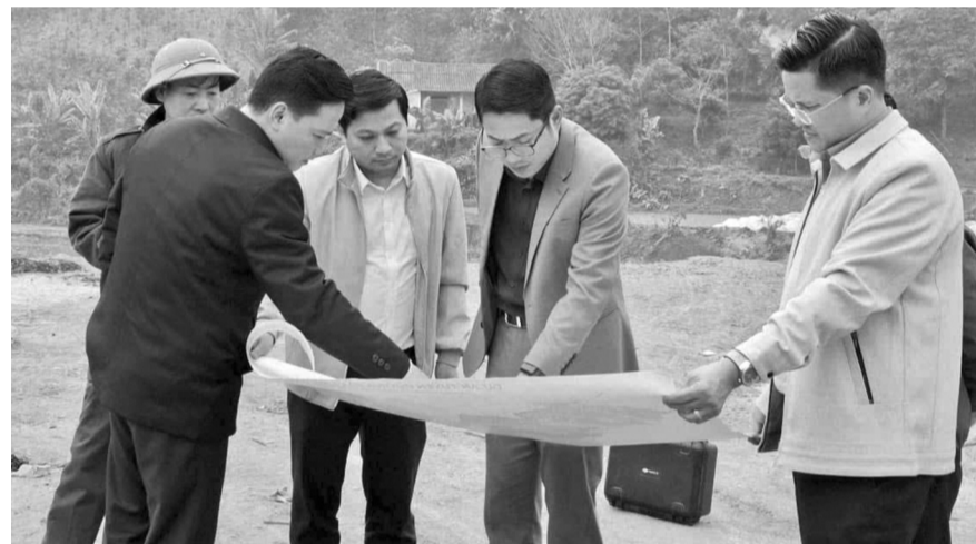
● Lãnh đạo huyện Văn Bàn thực hiện khảo sát, lựa chọn một số vị trí dự kiến xây dựng khu tái định cư phục vụ triển khai dự án đầu tư xây dựng tuyến đường sắt Lào Cai - Hà Nội - Hải Phòng.

Các địa phương tại tỉnh Lào Cai đã và đang thực hiện đo đạc bản đồ địa chính để phục vụ công tác bồi thường, giải phóng mặt bằng. Có thể nói, đến