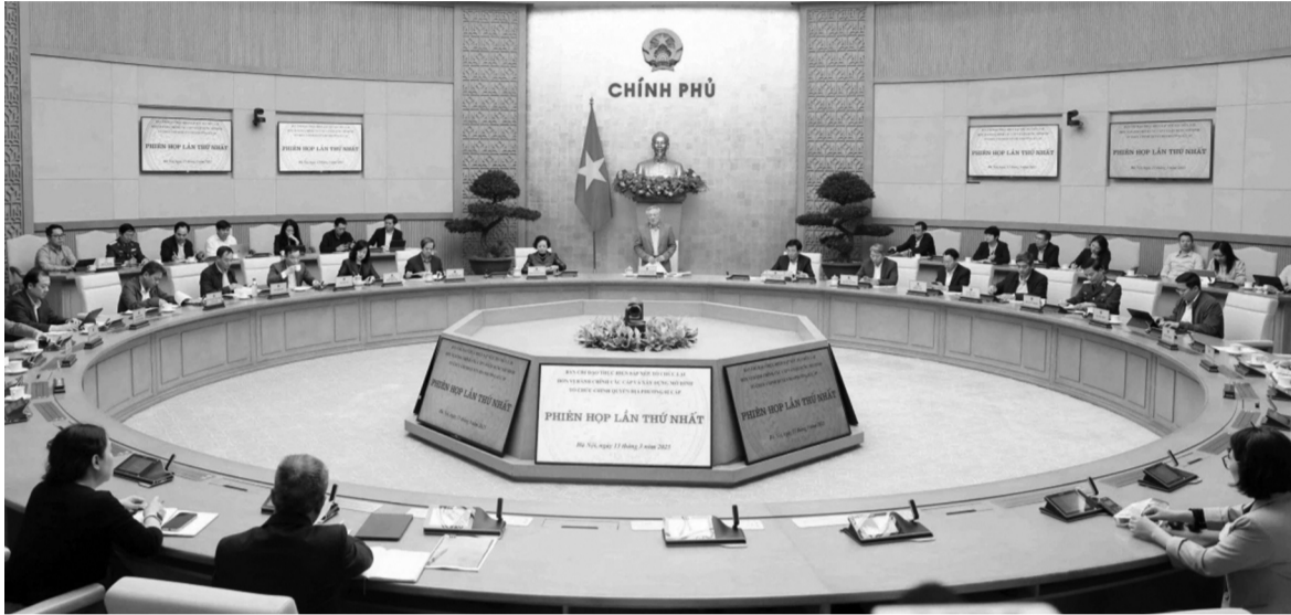
● Chiều 13/3, tại Trụ sở Chính phủ diễn ra Phiên họp lần thứ nhất Ban Chỉ đạo thực hiện sắp xếp tổ chức lại đơn vị hành chính các cấp và xây dựng mô hình tổ chức chính quyền địa phương 2 cấp. (Ảnh: VOV)

Kết luận số 126-KL/TW ngày 14/2/2025 và Kết luận số 127 KL/TW ngày 28/2/2025 của Bộ Chính trị, Ban Bí thư đã đưa ra định hướng sáp nhập một số đơn vị hành chính cấp tỉnh, không tổ chức cấp huyện, tiếp tục sáp nhập đơn vị hành chính cấp xã. Từ định hướng này, cả bộ máy tiếp tục chuyển động tích cực để sớm đưa chủ trương đúng đắn của Đảng trở thành hiện thực, đáp ứng nhu cầu phát triển đất nước và kỳ vọng của người dân.