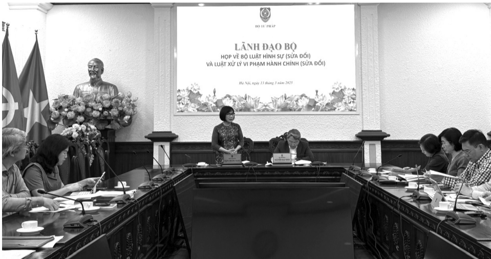
● Lãnh đạo Bộ Tư pháp nghe báo cáo về việc sửa đổi Bộ luật Hình sự.

Tuy nhiên, để tăng cường bảo vệ hơn nữa quyền con người, quyền công dân, đồng thời góp phần khơi thông nguồn lực, tạo môi trường an toàn để phát triển thì việc nghiên cứu sửa đổi, bổ sung quy định của BLHS năm 2015 cần đáp ứng các yêu cầu như chuyển đổi tư duy xây dựng pháp luật theo hướng vừa bảo đảm yêu cầu quản lý nhà nước, vừa khuyến khích sáng tạo, giải phóng toàn bộ sức sản xuất, khơi thông mọi nguồn lực để phát triển, dứt khoát từ bỏ tư duy “không