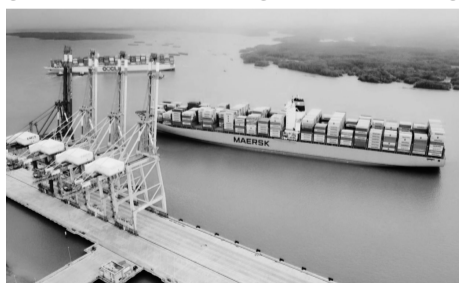
● Tỉnh Đồng Nai đặt mục tiêu thu hút 1,1 tỷ USD vốn FDI trong năm 2025.

Cùng với Đồng Nai, Bà Rịa - Vũng Tàu cũng ghi nhận sự tăng trưởng tích cực khi thu hút tổng vốn FDI mới và tăng thêm gần 200 triệu USD, tăng 48% so với cùng