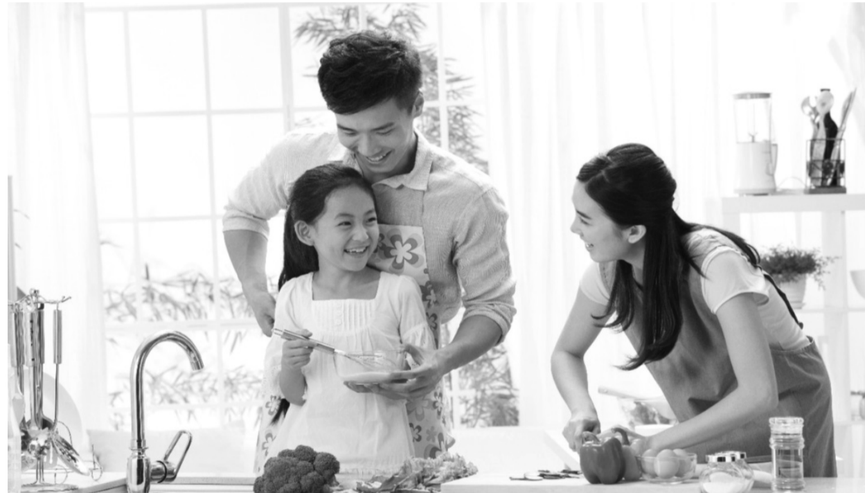
● Cần có những lớp học tiền hôn nhân để xây dựng “sức đề kháng” cho các gia đình trẻ ở Việt Nam.

Chính vì vậy, theo bà Tâm Anh, cần có những liệu “vắc-xin” xây dựng sức đề kháng cho người trẻ trước khi kết hôn. Đó là các lớp tiền hôn nhân, trong những lớp học này, người trẻ sẽ được bổ sung kiến thức về kỹ năng sống, kỹ năng giải quyết mâu thuẫn, những bài học về sự xung đột, xung