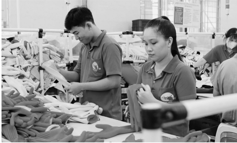
● Tỉnh Bình Dương thu hút gần 1 tỷ USD vốn FDI qua 7 dự án đầu tư bao gồm sản xuất linh kiện điện tử, logistics, bất động sản công nghiệp.

Vùng Đông Nam Bộ tiếp tục là điểm đến hấp dẫn của dòng vốn đầu tư trực tiếp nước ngoài (FDI). Các tỉnh, thành trong vùng không chỉ nỗ lực chuẩn bị những điều kiện tốt nhất cho các nhà đầu tư mà còn hướng tới chuyển đổi số, phát triển kinh tế xanh, bền vững.