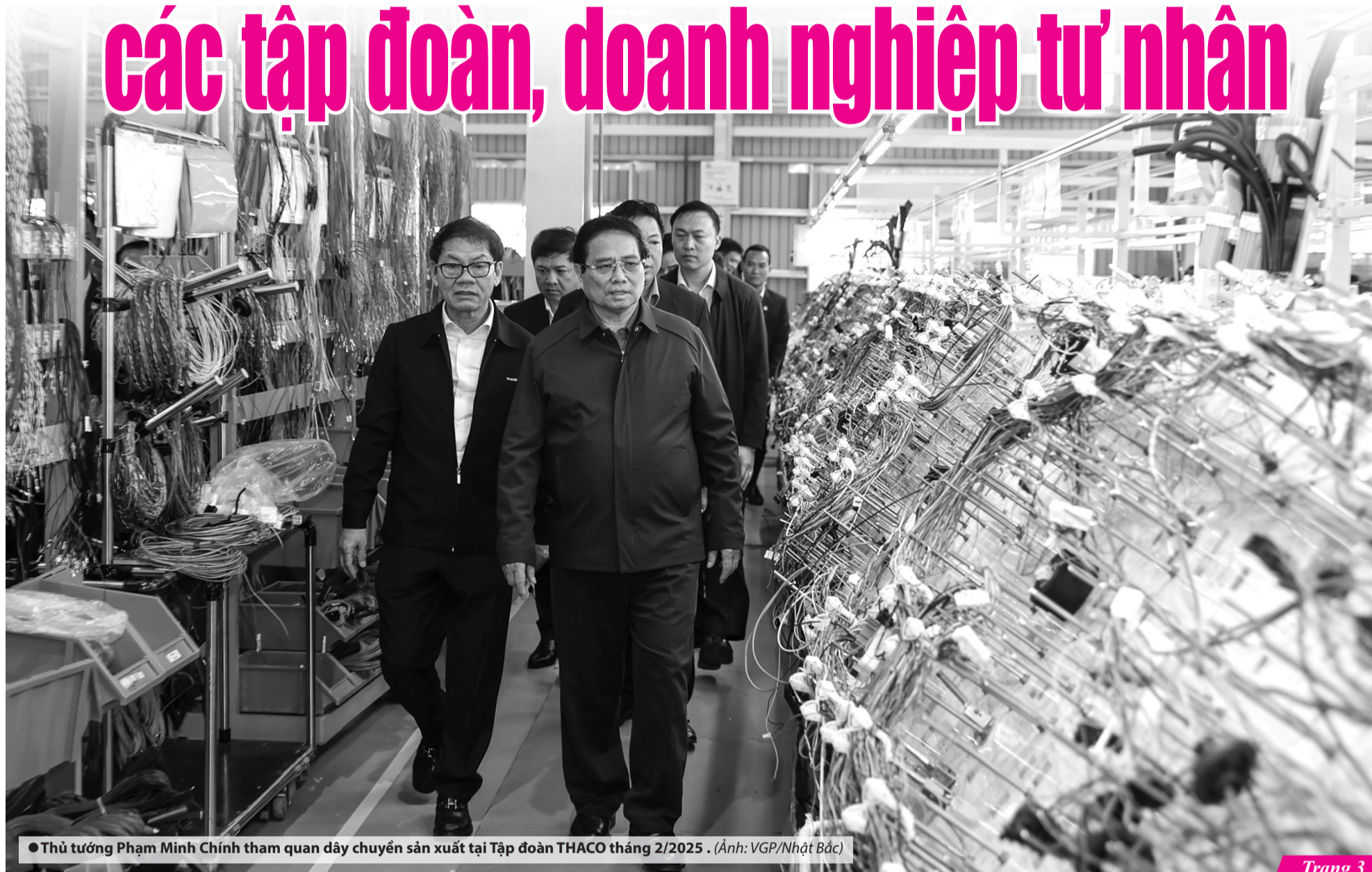
● Thủ tướng Phạm Minh Chính tham quan dây chuyền sản xuất tại Tập đoàn THACO tháng 2/2025.