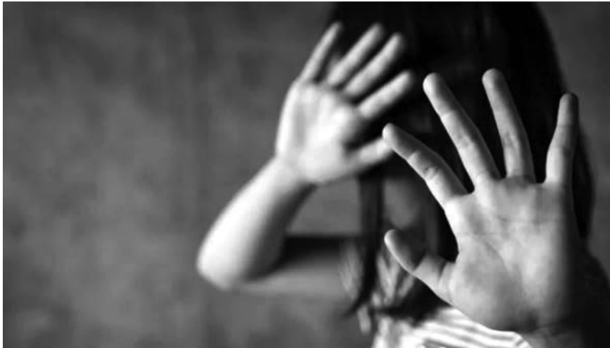
● Ảnh minh họa.

Đối tượng bắt đầu dùng vũ lực để ép buộc nạn nhân quan hệ tình dục nhưng bị chống cự. Bị cáo Hưng liền lấy chiếc đèn pin có chức năng chích điện được chuẩn bị sẵn trên xe rồi tấn công, chích điện nhiều lần vào cơ thể