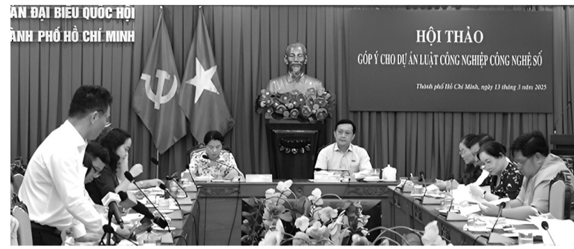
● Đoàn Đại biểu Quốc hội TP HCM tổ chức góp ý cho Dự án Luật CNCNS.