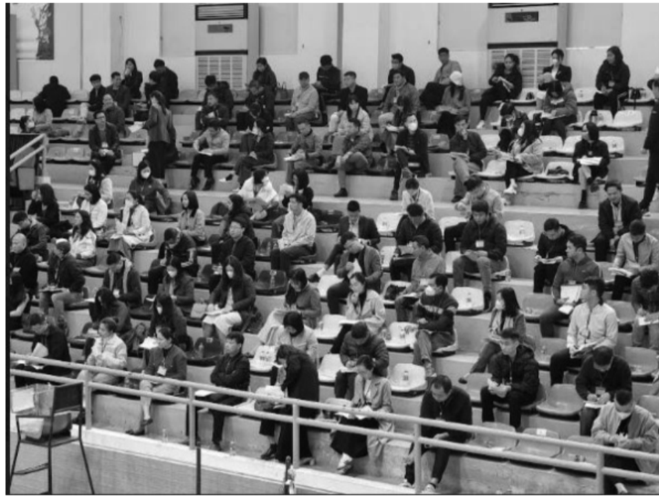
● Các khách hàng tham gia cuộc đấu giá lại 36 thửa đất ngày 8/3 tại huyện Sóc Sơn, Hà Nội.

Trước đó, tháng 10/2024, có đến 80% khách hàng trúng đấu giá đất ở khu đất có thửa cạnh nghĩa trang trên địa