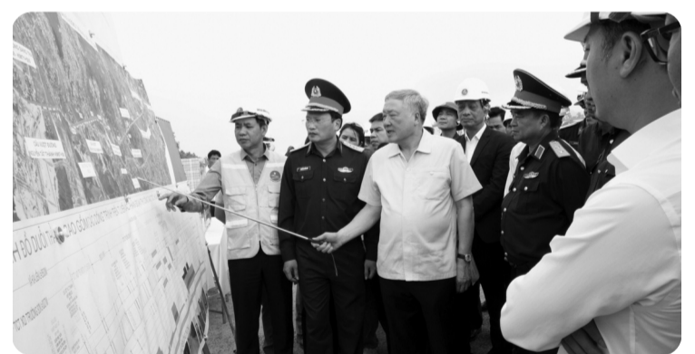
● Phó Thủ tướng Thường trực Chính phủ Nguyễn Hòa Bình kiểm tra tiến độ thi công dự án cao tốc Hòa Liên - Túy Loan.

Sáng 13/3, Phó Thủ tướng Thường trực Chính phủ Nguyễn Hòa Bình kiểm tra tiến độ thi công dự án cao tốc Hòa Liên - Túy Loan và chỉ đạo tháo gỡ khó khăn về vật liệu cho dự án. Sau khi nghe báo cáo về những khó khăn vướng mắc, Phó Thủ tướng Thường trực Chính phủ Nguyễn Hòa Bình yêu cầu các cơ quan, đơn vị hữu quan và TP Đà Nẵng tiếp tục quan tâm, tập trung tháo gỡ, xử lý dứt điểm một số vướng mắc còn tồn tại, trong đó có vấn đề vật liệu là đá lát đường, giải phóng mặt bằng; đẩy nhanh hơn nữa tiến độ triển khai thực hiện dự án, bảo đảm cho dự án “về đích” theo đúng yêu cầu đặt ra về tiến độ và chất lượng.