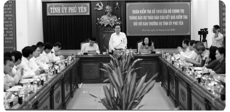
● Chủ tịch Quốc hội Trần Thanh Mẫn phát biểu tại buổi làm việc với Ban Thường vụ Tỉnh ủy Phú Yên.

Tiếp tục chuyến công tác của Đoàn kiểm tra số 1910 của Bộ Chính trị, Ban Bí thư, ngày 13/3, Ủy viên Bộ Chính trị, Chủ tịch Quốc hội Trần Thanh Mẫn - Trưởng Đoàn kiểm tra đã chủ trì cuộc làm việc với Ban Thường vụ Tỉnh ủy Bình Định, Ban Thường vụ Tỉnh ủy Phú Yên.