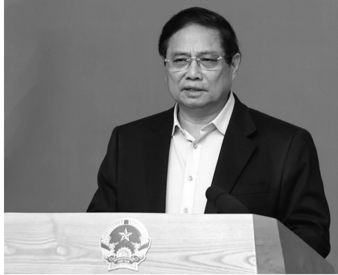
● Thủ tướng Phạm Minh Chính phát biểu kết luận Phiên họp thứ tư của Tiểu ban Kinh tế - Xã hội Đại hội toàn quốc lần thứ XIV của Đảng.

Ngày 13/3, kết luận Phiên họp thứ tư của Tiểu ban Kinh tế - Xã hội Đại hội XIV của Đảng, Ủy viên Bộ Chính trị, Thủ tướng Chính phủ Phạm Minh Chính, Trưởng Tiểu ban yêu cầu dự thảo Báo cáo kinh tế - xã hội phải có tầm nhìn xa, trông rộng, nghĩ sâu, làm lớn, vượt qua giới hạn của chính mình; liên thông với Báo cáo chính trị và các văn kiện khác; tiếp thu đầy đủ ý kiến chỉ đạo của Tổng Bí thư Tô Lâm trong các cuộc làm việc với các tiểu ban.