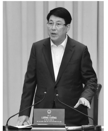
● Chủ tịch nước Lương Cường.

Tại buổi làm việc, Chủ tịch nước chỉ rõ, trong bối cảnh khối lượng công việc trong thời gian tới rất nhiều, đặc biệt là công tác chuẩn bị cho các sự kiện trọng đại của Đảng và đất nước, cũng như việc quán triệt và triển khai các nghị quyết, kết luận của Bộ Chính trị, Ban Chấp hành Trung ương về việc sắp xếp, tinh gọn bộ máy tổ chức, bảo đảm hoạt động hiệu lực, hiệu quả và chuẩn bị Đại hội Đảng bộ các cấp tiến tới Đại hội toàn quốc lần thứ XIV của Đảng. Do đó, các nhiệm vụ, công việc cần có sự phối hợp chặt chẽ, nhịp nhàng; khi đã có quyết định thì cần phải làm việc khẩn trương, chính xác, kịp thời, đúng quy định với yêu cầu chất lượng cao hơn.