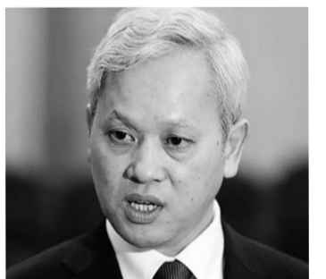
● Ông Nguyễn Bích Lâm.

Chỉ đạo của Tổng Bí thư Tô Lâm hoàn toàn đúng đắn. Bởi vì tình hình thực tiễn biến đổi rất nhanh chóng, đặc biệt trong bối cảnh kinh tế chính trị thế giới có nhiều biến động phức tạp, khó lường và biến đổi rất nhanh. Vì vậy, nếu thể chế không theo kịp với những biến đổi của thực tiễn, thì vô hình trung thể chế sẽ trở thành “trói buộc” động lực tăng trưởng, kìm hãm sự phát triển. Do đó, các nhà lập pháp, đặc biệt là các nhà hành pháp, cần phải theo dõi và dự báo tình hình thực tế để đưa ra kiến nghị sửa đổi, bổ sung môi trường pháp lý sao cho phù hợp. H.THU - H.TUỒI