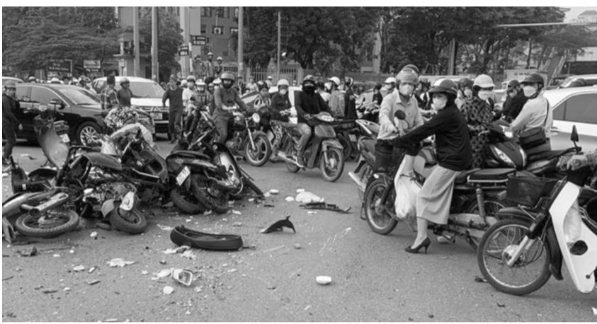
● Việc lập Quỹ giảm thiểu thiệt hại TNGT đường bộ sẽ huy động nguồn lực xã hội hóa trong và ngoài nước tập trung cho công tác hỗ trợ nạn nhân TNGT. (Ảnh minh họa)

nội dung chi của Quỹ giảm thiểu thiệt hại TNGT đường bộ gồm: Hỗ trợ nạn nhân, gia đình nạn nhân do TNGT đường bộ gây ra. Hỗ trợ tổ chức, cá nhân giúp đỡ, cứu chữa, đưa người bị TNGT đường bộ đi cấp cứu. Hỗ trợ cho tổ chức, cá nhân tham gia tuyên truyền, vận động quần chúng Nhân dân tham gia các hoạt động làm giảm thiểu thiệt hại TNGT đường bộ mà không được Nhà nước bảo đảm kinh phí.