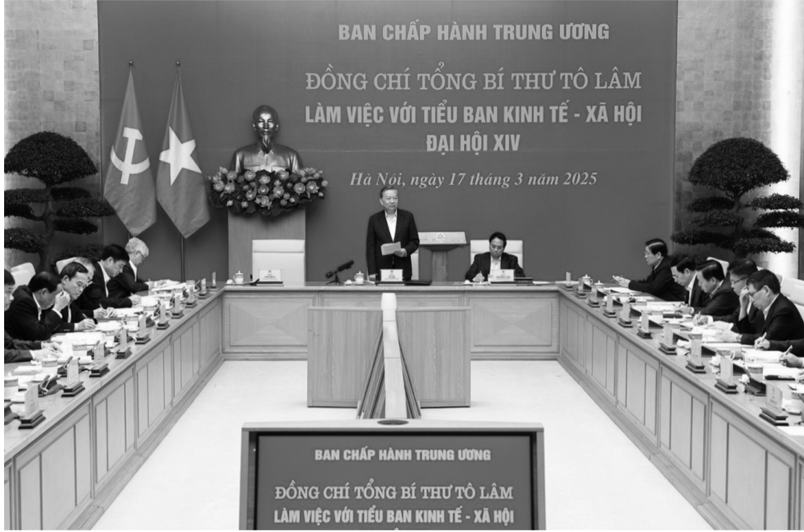
● Tổng Bí thư Tô Lâm phát biểu chỉ đạo.

Phát biểu chỉ đạo tại buổi làm việc với Tiểu ban Kinh tế - Xã hội Đại hội XIV của Đảng, diễn ra hôm qua (17/3), Tổng Bí thư Tô Lâm nhấn mạnh, việc xây dựng, ban hành pháp luật phải theo tình hình thực tiễn, không để tình trạng chờ luật, chờ cơ chế dẫn đến chậm trễ, mất cơ hội. Phải biến thể chế từ “điểm nghẽn” trở thành lợi thế cạnh tranh.