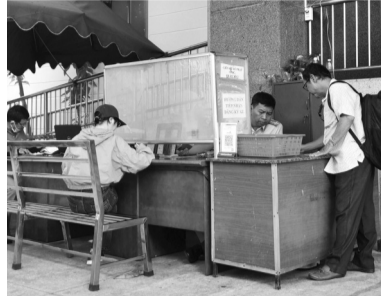
● Thủ tục được thực hiện rất nhanh.