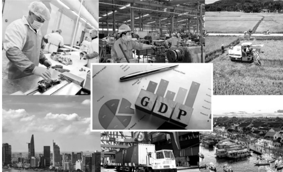
● Cập nhật kịp thời các kịch bản để đạt mục tiêu tăng trưởng. (Ảnh minh họa: VGP)

đạt mục tiêu tăng trưởng năm 2025 8% trở lên, kịch bản đưa ra là quý I tăng 7,7%; quý II tăng 8,1%; quý III tăng 8%; quý IV tăng 8,2%. Nhưng ngay từ quý I và số liệu 2 tháng đầu năm đã cho thấy có nhiều thách thức với mục tiêu của quý I.