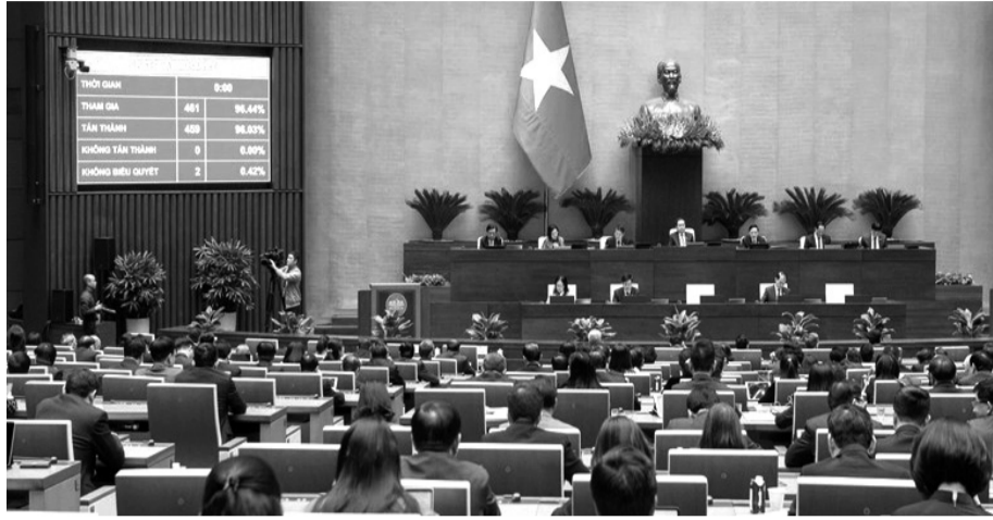
● Quốc hội biểu quyết thông qua Luật Ban hành văn bản quy phạm pháp luật (sửa đổi) tháng 2/2025.

Hiện nay, kinh phí dành cho công tác xây dựng pháp luật chủ yếu được phân bổ từ ngân sách nhà nước theo hai hình thức: chi thường xuyên và chi đầu tư phát triển. Tuy nhiên, trong nhiều trường hợp, nguồn kinh phí này chưa đáp ứng được nhu cầu thực tế. Định mức chi tiêu cho các hoạt động lập pháp chưa thực sự tương xứng với tầm quan trọng của công tác này. Nhiều cơ quan xây dựng luật vẫn gặp khó khăn trong việc huy động nguồn lực để nghiên cứu chuyên sâu, tổ chức hội thảo khoa học, lấy ý kiến chuyên gia hay tổ chức tham vấn rộng rãi từ xã hội. Thực tế cũng cho thấy, quá trình xây