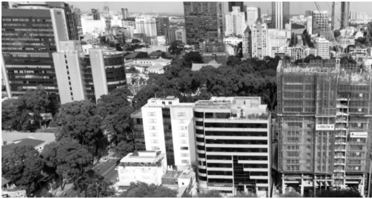
● TP HCM đang chỉ đạo khẩn trương hoàn thiện Kế hoạch thúc đẩy tăng trưởng hai con số trên địa bàn trong năm 2025.

thành các động lực tăng trưởng mới, thu hút các dự án đầu tư quy mô lớn, công nghệ cao, đầu tư các công trình kết cấu hạ tầng quan trọng; phát triển các vùng động lực, đô thị, hạt nhân tăng trưởng của địa phương.