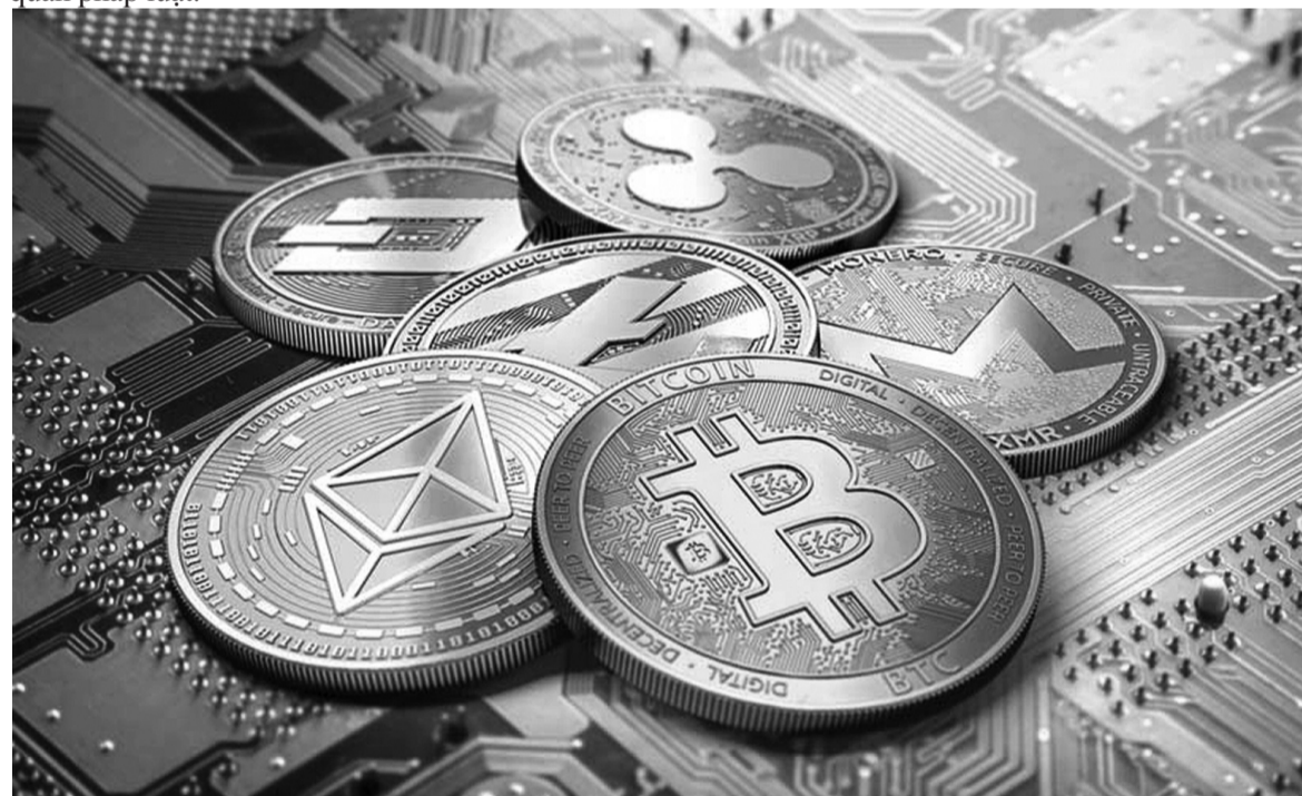
● Thiếu cơ chế pháp lý gây rủi ro khi đầu tư tiền ảo.

Thứ ba , do thị trường tiền ảo còn thiếu minh bạch và xuất hiện nhiều tình trạng lừa đảo nên việc thiếu cơ chế giám sát và kiểm tra sẽ khiến nhà đầu tư dễ dàng trở thành nạn nhân của các hành vi gian lận, làm cho việc đòi lại tài sản trở nên rất khó khăn, nếu không có sự bảo vệ từ các cơ quan pháp luật.