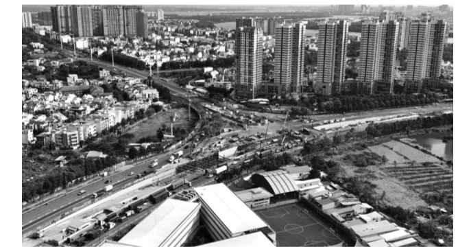
● Dự án nút giao An Phú là công trình trọng điểm ở cửa ngõ phía đông TP HCM.