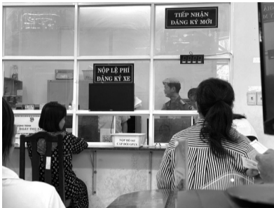
● Tại một điểm tiếp nhận hồ sơ cấp, đổi GPLX ở quận Bình Thạnh.

Với các trường hợp không thuộc thẩm quyền tiếp nhận của Công an cấp xã (cấp mới hạng bằng lái FC, liên quan đến bằng lái quốc tế), các cán bộ cũng trực tiếp hướng dẫn người dân liên hệ với 3 điểm tiếp nhận của Phòng Cảnh sát giao thông tại quận 3, quận Tân Phú và quận 12.