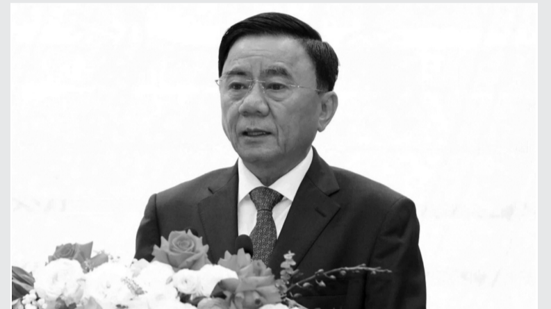
● Thường trực Ban Bí thư Trần Cẩm Tú phát biểu chỉ đạo Hội thảo.

Phát biểu chỉ đạo Hội thảo, Ủy viên Bộ Chính trị, Thường trực Ban Bí thư Trần Cẩm Tú nhấn mạnh yêu cầu cấp bách về đổi mới tư duy lý luận, phát triển các luận cứ khoa học, để Đảng đề ra các quyết sách chiến lược phù hợp thực tiễn. Công tác lý luận của Đảng phải hướng tới khơi dậy sức mạnh tinh thần, trí tuệ và ý chí Việt Nam, tạo nên