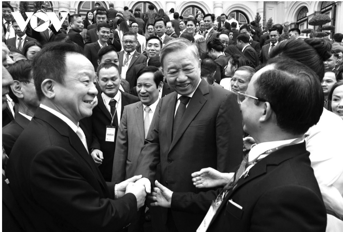
● Ngày 11/10/2024, Tổng Bí thư, Chủ tịch nước (nay là Tổng Bí thư) Tô Lâm gặp mặt Đoàn đại biểu doanh nhân tiêu biểu của Liên đoàn Thương mại và Công nghiệp Việt Nam và Hội Doanh nhân tư nhân Việt Nam nhân Ngày Doanh nhân Việt Nam (13/10).

Tuy nhiên, dù đóng góp ngày càng lớn, kinh tế tư nhân vẫn đối mặt với nhiều rào cản kìm hãm sự phát triển, không thể bứt phá về quy mô và năng lực cạnh tranh. Theo Tổng Bí thư, ngoài những hạn chế nội tại, các DN tư