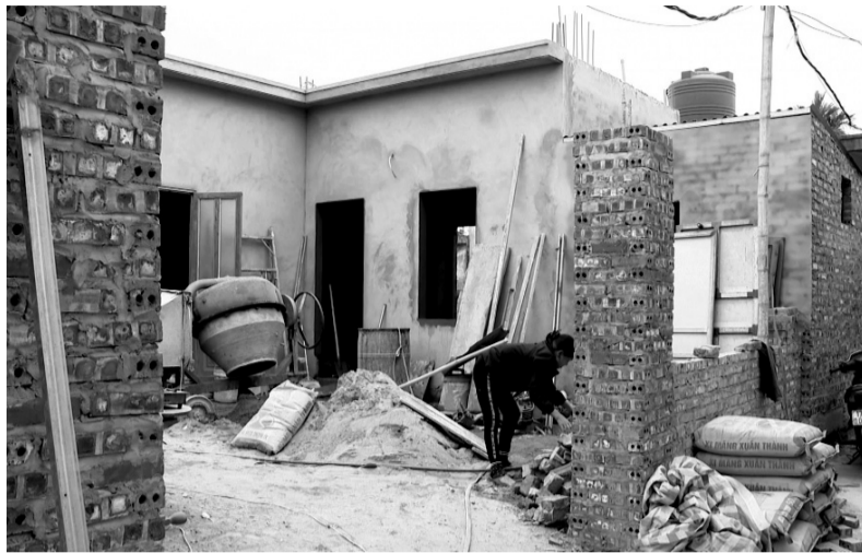
● Thái Bình phấn đấu hoàn thành xóa nhà tạm, nhà dột nát cho hộ nghèo, cận nghèo, người có công trước 30/6/2025.

Bên cạnh đó, tỉnh cũng ghi nhận có 866 hộ là người có công với cách mạng và thân nhân liệt sĩ có nhu cầu xây mới hoặc sửa chữa nhà ở, với tổng kinh phí hỗ trợ dự kiến trên 65 tỷ đồng từ ngân sách trung ương và địa phương. Đến nay, toàn tỉnh đã khởi công xây mới và sửa chữa 419 nhà, trong đó 92 nhà đã hoàn thành. Trong tháng 3/2025, sẽ khởi công xây mới và sửa chữa cho 311 hộ còn lại.