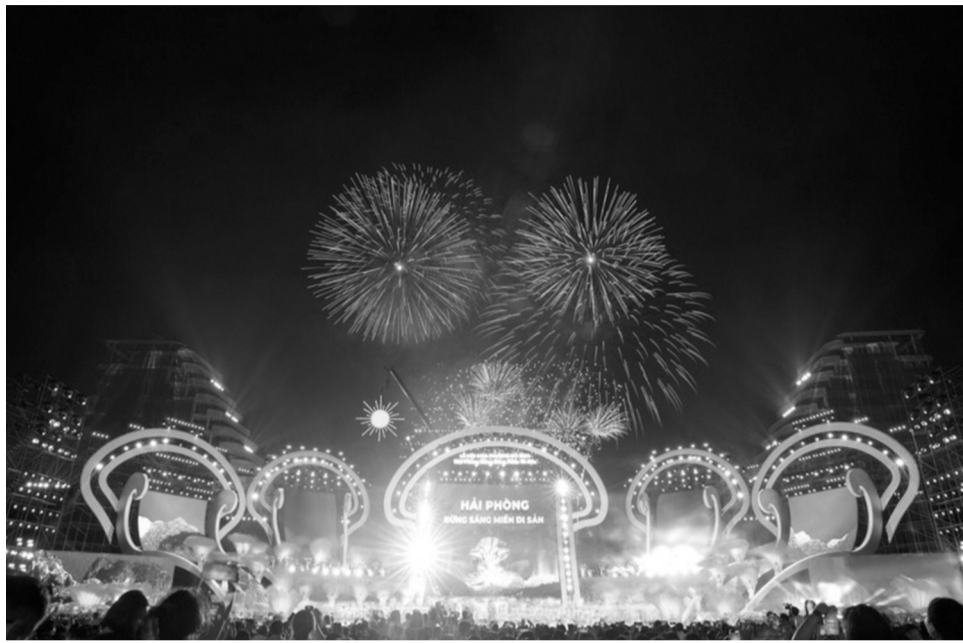
● Công tác tổ chức các hoạt động kỷ niệm Ngày giải phóng Hải Phòng phải bảo đảm thiết thực, hiệu quả. (Ảnh: PV)

Tuyên truyền sâu rộng về ý nghĩa lịch sử to lớn của Ngày giải phóng Hải