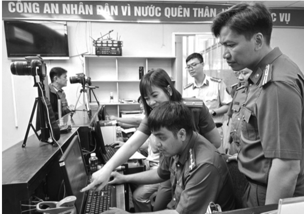
● Tập huấn cho lực lượng Công an cấp xã cấp, đổi GPLX.