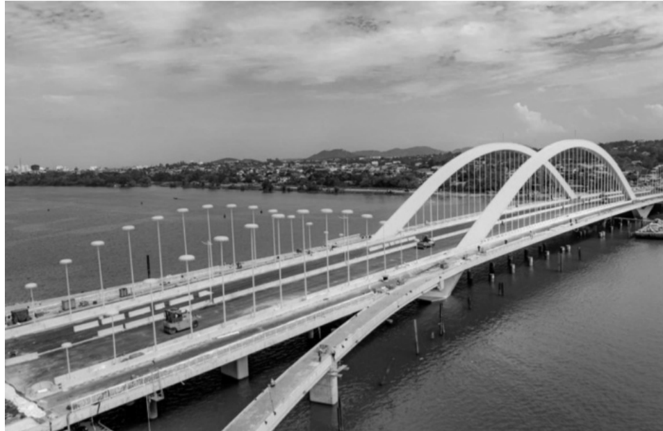
● Cầu Nguyễn Hoàng là công trình giao thông quan trọng nằm trong dự án cầu vượt bắc qua sông Hương và mở rộng tuyến đường Nguyễn Hoàng, kết nối hai quận Phú Xuân và Thuận Hóa của TP Huế.

Thứ ba là Dự án Nhà máy sản xuất kính hoa siêu trắng Đạt Phương do Công ty Cổ phần Kính Đạt Phương làm