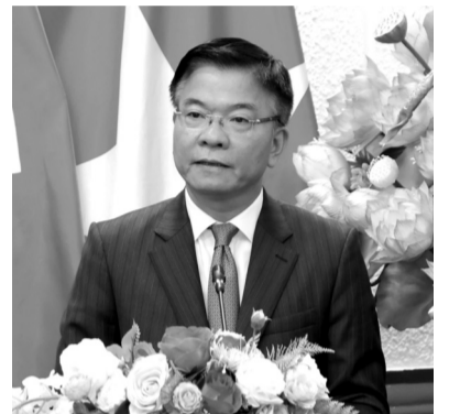
● Phó Thủ tướng Lê Thành Long.