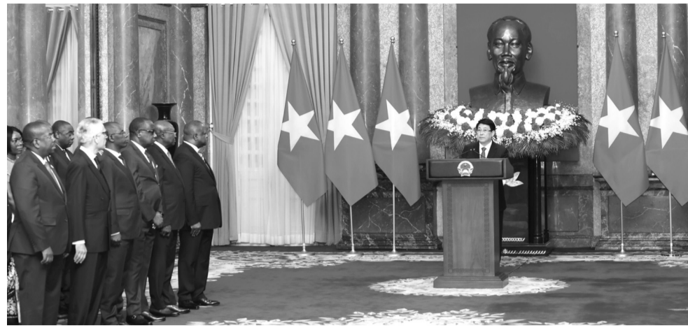
● Chủ tịch nước Lương Cường phát biểu chào mừng.

Chào mừng bà Nubiela Ayala Modes được cử làm Đại sứ Đặc mệnh Toàn quyền Cộng hòa Panama tại Việt Nam, Chủ tịch nước khẳng định Việt Nam coi trọng vai trò, vị thế của Panama tại khu vực Trung Mỹ và Mỹ La-tinh; mong muốn cùng cố quan hệ hữu nghị truyền thống tốt đẹp, tăng cường sự tin cậy về chính trị, nâng cao hiệu quả quan hệ hợp tác, đặc biệt về kinh tế - thương mại đầu tư, văn hóa, giao lưu Nhân dân, vì lợi ích của Nhân dân hai nước. Chủ