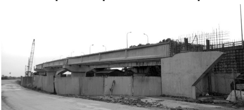
● Dự án cải tạo nâng cấp đường tỉnh 390 là một trong những dự án đang chậm tiến độ của tỉnh Hải Dương.

H hiện nay, trên địa bàn tỉnh Hải Dương còn nhiều dự án chưa hoàn thành giải phóng mặt bằng để bàn giao cho nhà đầu tư, đơn vị thi công, gây ảnh hưởng đến tiến độ giải ngân vốn đầu tư công chung của toàn tỉnh.