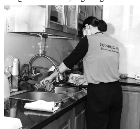
● Dịch vụ tạp vụ do HDC GROUP cung cấp.