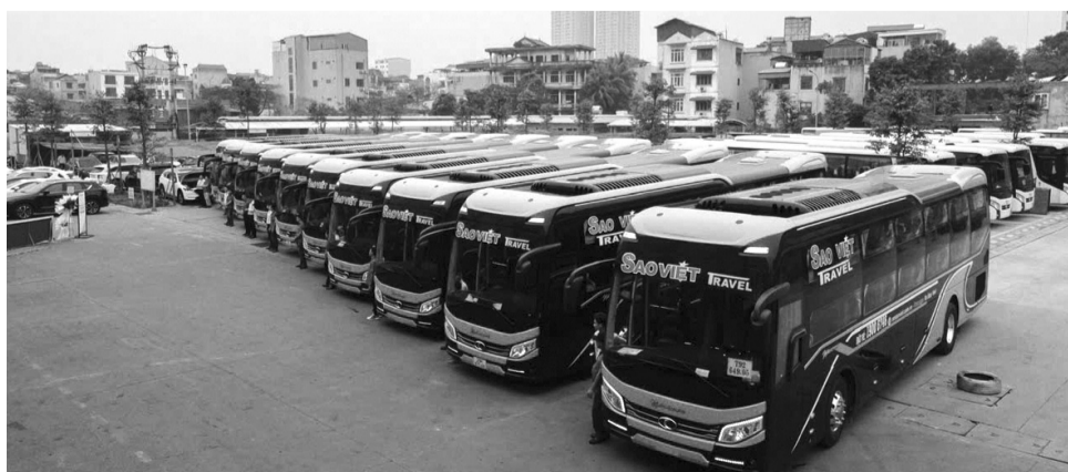
● Đoàn xe Sao Việt của Công ty Minh Thành Phát.

“Cùng với các chủ trương và giải pháp của Đảng và Nhà nước về tiếp tục đổi mới, sắp xếp tổ chức bộ máy của hệ thống chính trị, tôi mong rằng, sự quan tâm, tạo điều kiện cho KTTN phát triển cùng một bộ máy quản lý nhà nước được tinh gọn, hiệu lực, hiệu quả với nền hành chính “phục vụ DN - phục vụ đất nước” thì đây sẽ tạo điều kiện quan trọng giúp DN và nền KTTN được phát triển mạnh mẽ, để có những đóng góp tích cực cho sự giàu mạnh của các địa phương và thịnh vượng của đất nước”, người đứng đầu HDC GROUP VN bày tỏ. MỸ CHÂU - NGỌC AN