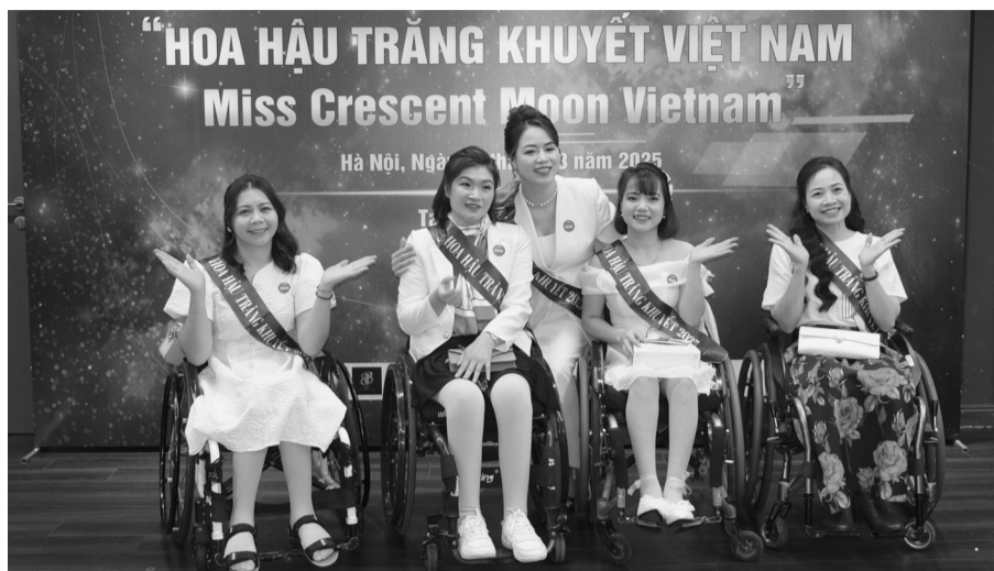
● Những bông hoa có cơ hội tỏa hương theo cách riêng của mình.