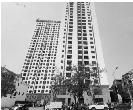
● Chung cư 26 tầng chưa được nghiệm thu đã cho dân vào ở.

Lãnh đạo Phòng KTHT&ĐT cho hay, Cty 389 đã có văn bản gửi UBND TP trình Sở Xây dựng và UBND tỉnh