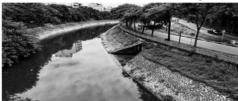
● Hà Nội nghiên cứu phương án bổ cập nước từ sông Hồng vào sông Tô Lịch theo trục đường Võ Chí Công.

Văn phòng UBND Thành phố vừa ban hành Thông báo số 140/TB-VP về kết luận, chỉ đạo của Chủ tịch UBND Thành phố Trần Sỹ Thanh tại buổi họp nghe báo cáo về việc cải tạo sông Tô Lịch và chỉnh trang khu vực hai bên sông Tô Lịch.