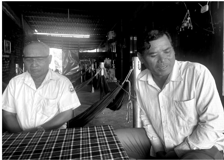
● Ông Điều Tá và ông Điều Bôn đang rất lo lắng khi sổ đỏ nhà mình bị sang tên người khác.

Một số hộ dân tại huyện Bù Gia Mập, tỉnh Bình Phước đang đối diện nguy cơ mất đất vì tin tưởng giao sổ đỏ cho một cán bộ xã nhờ vay tiền giúp. Bí thư kiêm Chủ tịch UBND xã Phú Nghĩa cho biết chính quyền xã nhận thấy có nhiều nội dung vượt quá thẩm quyền nên đã gửi công văn đề nghị công an hỗ trợ xác minh, làm rõ.