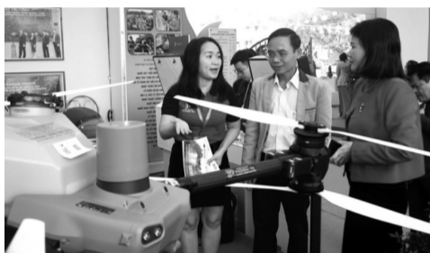
● Đa dạng các sản phẩm được trưng bày, giới thiệu tại triển lãm.

Quy mô tổ chức trưng bày, triển lãm có tổng số 72 gian, gồm 28 gian trưng bày,