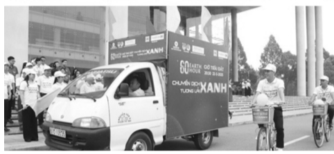
● Toàn quốc hưởng ứng Giờ Trái đất - Khởi đầu của cuộc hành trình sống xanh.