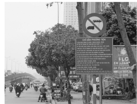
● Một biển chỉ dẫn được in quá nhiều chữ và cỡ chữ rất nhỏ.

Ngoài ra, đèn tín hiệu và đèn đếm ngược bị hư hỏng do khai thác, do tai nạn giao thông; bóng đèn bị cháy; nhiều cụm đèn chưa có đèn đếm ngược thời gian; thiếu đèn tín hiệu chỉ dẫn cho người đi bộ tại nút giao hoặc có nhưng đã hỏng không hoạt động; vị trí đặt cột đèn tín hiệu không hợp lý, bị che khuất; hư hỏng, bất cập khác chưa hoàn thành khắc phục.