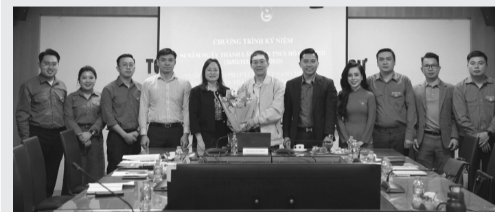
● Các đại biểu chụp ảnh lưu niệm với đoàn viên, thanh niên Báo PLVN.

Chiều ngày 21/3, Báo Pháp luật Việt Nam (PLVN) đã tổ chức thành công Tọa đàm với chủ đề “Tuổi trẻ Báo PLVN chủ động sáng tạo, dấn thân trong kỷ nguyên số”. Sự kiện hướng tới kỷ niệm 94 năm Ngày thành lập Đoàn TNCS Hồ Chí Minh, 100 năm Ngày Báo chí Cách mạng Việt Nam; 40 năm thành lập Báo PLVN.