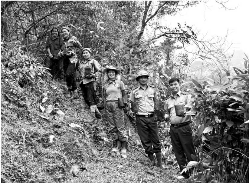
● Hưởng ứng Ngày Thế giới trồng cây (21/3), 41.175 cây thuộc 12 loài gỗ quý hiếm đã được trồng tại Vườn Quốc gia Xuân Liên.

Hiện trạng rừng Việt Nam cho thấy, tính đến ngày 31/12/2023, Việt Nam có tổng diện tích che phủ rừng là 42%, tương ứng với 16 triệu ha, trong đó, rừng tự nhiên chiếm khoảng 70,8%, còn lại là rừng trồng. Tại rất nhiều địa phương, diện tích rừng tự nhiên đang bị suy giảm mạnh. Nhiều khu rừng là rừng nghèo kiệt. Các khu rừng trồng phần lớn là rừng nghèo loài, không có tầng tán, không có giá trị sinh thái cao như rừng tự nhiên. Trong bối cảnh biến đổi khí hậu ngày càng nghiêm trọng, việc giảm phát thải khí nhà kính và hướng tới mục tiêu phát thải ròng bằng "0" (Net Zero) đã trở thành ưu tiên hàng đầu của nhiều quốc gia, trong đó có Việt Nam. Trong số các giải pháp được đề xuất, trồng rừng và phục hồi rừng được xem là chiến lược quan trọng nhờ khả năng hấp thụ carbon hiệu quả.