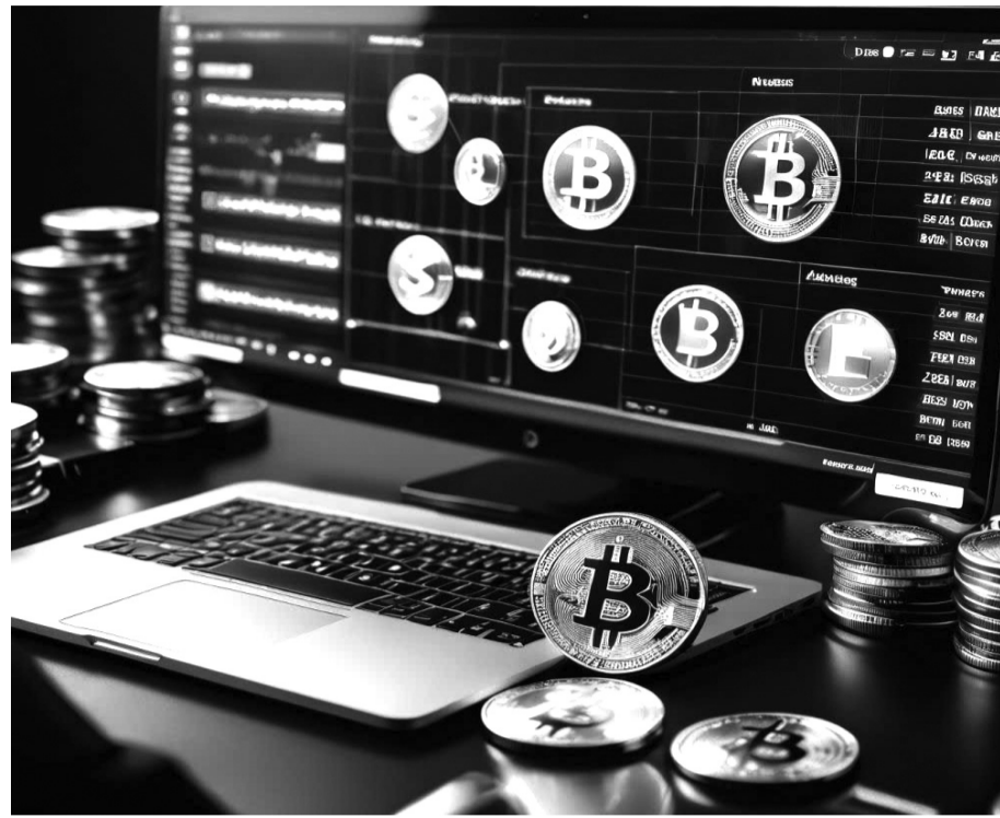
● Các giao dịch tiền số trong giai đoạn đầu dự kiến sẽ có ưu đãi về thuế. (Ảnh minh họa)

Đáng chú ý, trong dự thảo đề xuất về triển khai thí điểm phát hành và giao dịch tài sản mã hóa, Bộ Tài chính đề xuất cơ chế phối hợp giữa cơ quan quản lý như Bộ Tài chính, Bộ Công an, Ngân hàng Nhà nước (NHNN). Lý giải cho đề xuất này, Bộ Tài chính cho biết, một trong những vấn đề quan trọng nhất khi xây dựng khung pháp