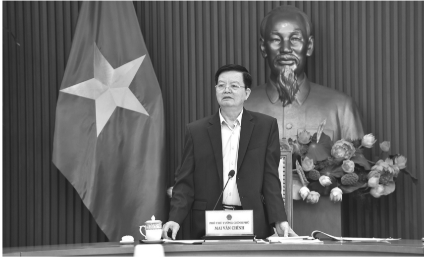
● Phó Thủ tướng Mai Văn Chính phát biểu chỉ đạo cuộc họp.

Phát biểu tại cuộc họp, đại diện các Bộ, cơ quan đã báo cáo về kế hoạch vốn, tiến độ phân bổ vốn, giải ngân vốn. Trong đó, Bộ Văn hóa, Thể thao và Du lịch, Bộ Dân tộc và