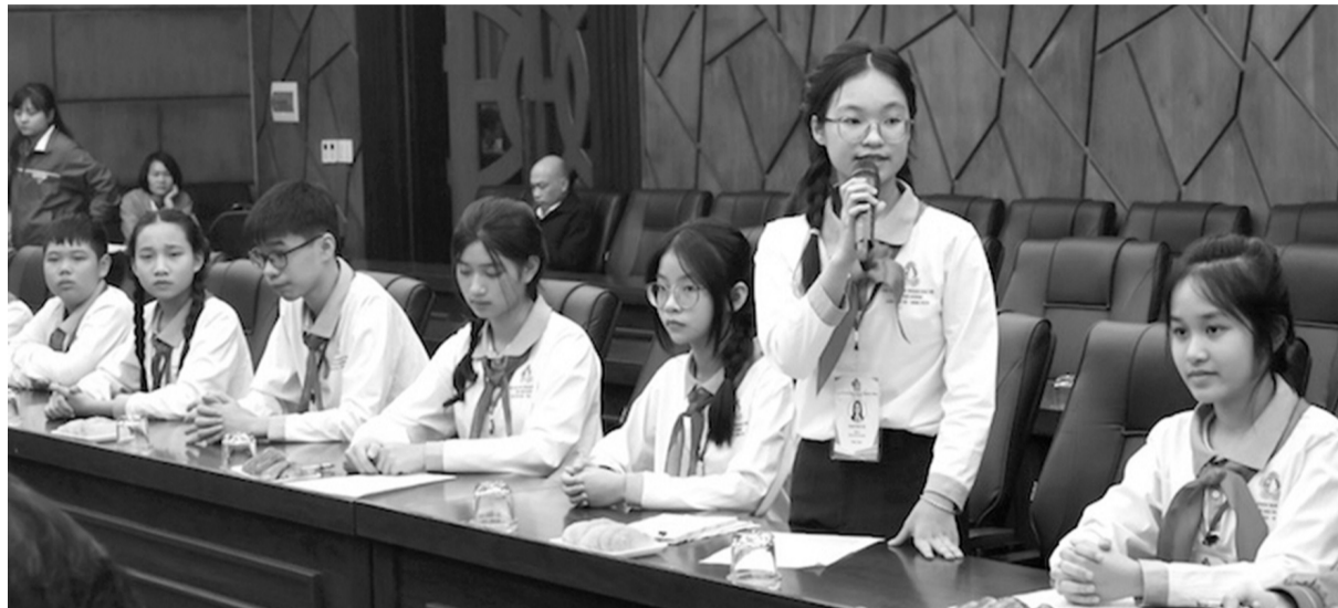
Đại diện đội viên tiêu biểu gửi ý kiến, nguyện vọng tới lãnh đạo tỉnh Hải Dương.

Ngày 21/3, tỉnh Hải Dương tổ chức chương trình gặp mặt, biểu dương đội viên tiêu biểu tỉnh Hải Dương giai đoạn 2020 - 2025. Buổi gặp mặt có sự tham dự của 30 đội viên tiêu biểu đến từ 12 huyện, thị, thành phố đại diện cho hơn 180.000 đội viên toàn tỉnh.