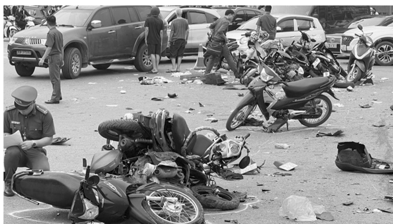
● Một vụ tai nạn giao thông. (Ảnh minh họa)

Tại phiên thảo luận, nhiều nhà báo, phóng viên trẻ của Báo PLVN đã tham gia đặt câu hỏi, đóng góp ý kiến từ thực tiễn hoạt động báo chí. ĐỨC ANH