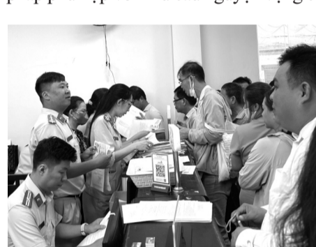
● Công an TP HCM tận tình hướng dẫn người dân làm thủ tục cấp đổi giấy phép lái xe.

"Trong thực tế, TP HCM là nơi khởi nguồn nhiều mô hình có tính chất đặc thù, với sự đồng tình, ủng hộ của Trung ương. TP đã mạnh dạn thí điểm để rồi từ đó chứng minh được tính hiệu quả, một số được nhân rộng ra cả nước. Để có được những cách làm hay, sáng tạo và phù hợp như vậy, một lý do là TP luôn có những cán bộ năng động, sáng tạo, với tinh thần dám nghĩ, dám làm, dám chịu trách nhiệm. Đồng thời, đó cũng là những cán bộ luôn biết trăn trở với thực tiễn, gắn bó với đời sống Nhân dân; đề từ đời hỏi của cuộc sống, của Nhân dân mà có những kiến nghị, đề xuất, giải pháp phù hợp với nhu cầu nguyện vọng chính đáng của Nhân dân", TS Hiếu nói.