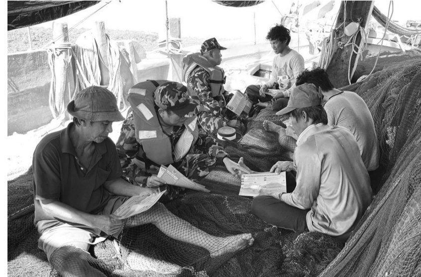
● Cảnh sát biển Vùng 3 tuyên truyền cho ngư dân trên biển.

Đơn vị cũng đẩy mạnh công tác tuyên truyền, phổ biến pháp luật cho ngư dân nhằm nâng cao nhận thức, giúp bà con chấp hành nghiêm quy định pháp luật khi khai thác hải sản trên biển. Trong năm 2024, đơn vị đã tổ chức 13 đợt tuyên truyền về