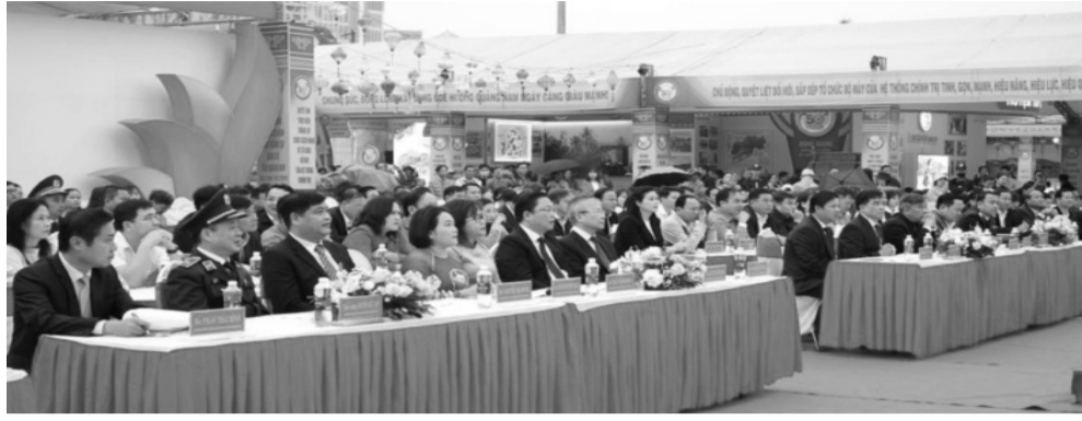
● Các đại biểu tham dự Lễ khai mạc triển lãm.

Trải qua 50 năm xây dựng và phát triển, Quảng Nam đã và đang vươn mình mạnh mẽ, khẳng định vị thế là một tỉnh công nghiệp, du lịch - dịch vụ. Những thành tựu trên chặng đường ấy sẽ được giới thiệu qua các tư liệu, sản phẩm đặc trưng tại triển lãm chào mừng kỷ niệm giải phóng tỉnh Quảng Nam.