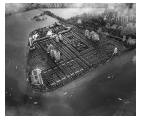
● Phối cảnh tổng thể Dự án Khu đô thị mới Thuận Phước - Đà Nẵng.

Dự án nằm trên phường Nại Hiên Đông và phường Thọ Quang (quận Sơn Trà), gần bờ biển, kết nối trực tiếp với các tuyến đường huyết mạch và các khu trung tâm của thành phố Đà Nẵng. Khi hoàn thiện, Khu đô thị mới Thuận Phước - Đà Nẵng sẽ có các phân khu chức năng nổi bật như: khu nhà ở thấp tầng và cao tầng (biệt thự, shophouse, căn hộ cao cấp, nhà phố thương mại); tổ hợp trung tâm thương mại, khách sạn 5 - 6 sao (gồm các khách sạn quốc tế, trung tâm hội nghị cao cấp, phục vụ lưu trú và các hoạt động giao thương quốc tế); các khu phố mua sắm, ẩm thực, giải trí (tuyên phố đi bộ, khu thương mại dịch vụ, hệ thống công viên và tiện ích công cộng)... P.V