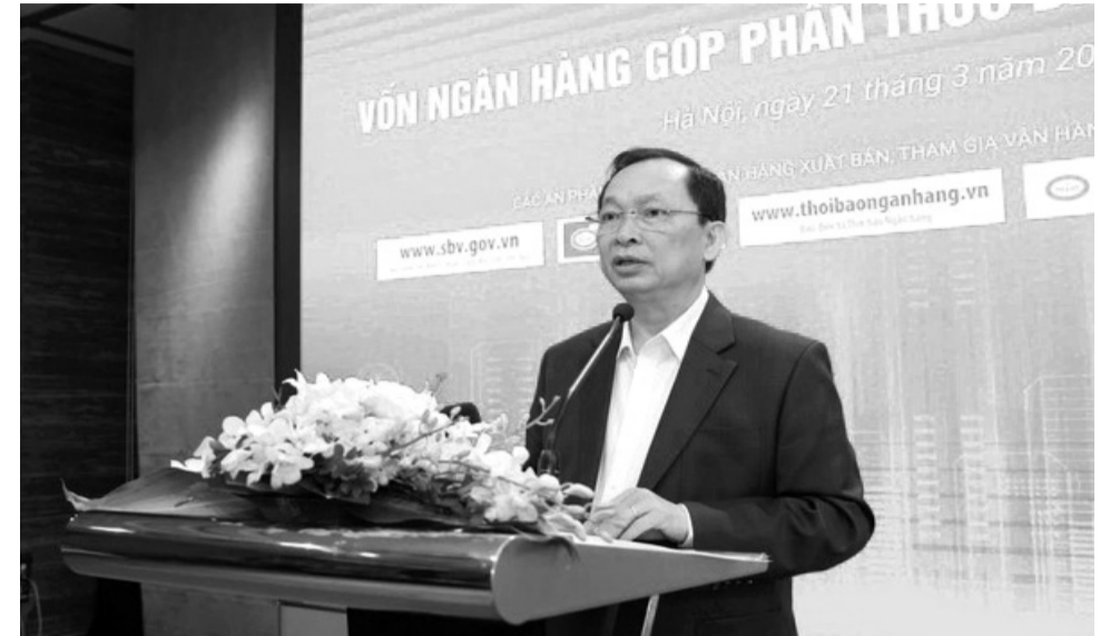
● Phó Thống đốc Thường trực NHNN Đào Minh Tú phát biểu tại Hội thảo.

quan đến hoạt động doanh nghiệp, hợp tác xã. Đồng thời đề nghị lãnh đạo các cấp, các sở, ban, ngành lắng nghe những tâm tư, nguyện vọng, khó khăn, vướng mắc cũng như đề xuất của các doanh nghiệp, hợp tác xã, để kịp thời xử lý, tháo gỡ khó khăn, vướng mắc, tạo thuận lợi cho doanh nghiệp, hợp tác xã hoạt động hiệu quả trên địa bàn tỉnh.