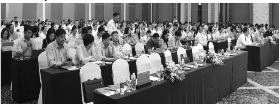
● Toàn cảnh Hội nghị.

quan đến hoạt động doanh nghiệp, hợp tác xã. Đồng thời đề nghị lãnh đạo các cấp, các sở, ban, ngành lắng nghe những tâm tư, nguyện vọng, khó khăn, vướng mắc cũng như đề xuất của các doanh nghiệp, hợp tác xã, để kịp thời xử lý, tháo gỡ khó khăn, vướng mắc, tạo thuận lợi cho doanh nghiệp, hợp tác xã hoạt động hiệu quả trên địa bàn tỉnh.