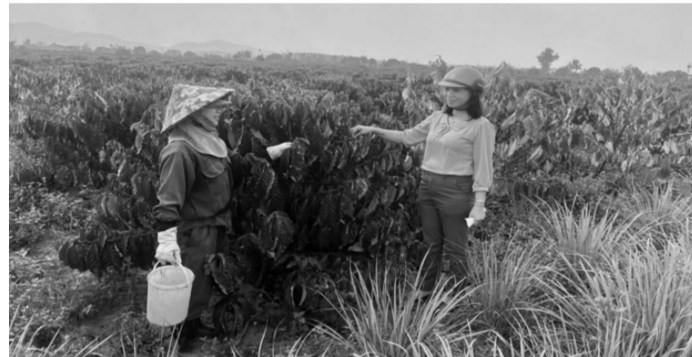
● Nữ Bí thư Đảng ủy xã mang nặng trách nhiệm của một đảng viên với đất và người trên vùng đất cao nguyên nắng gió.

Theo Phó Bí thư Đảng ủy, Chủ tịch UBND xã Y Sương, kinh tế của xã duy trì tốc độ tăng trưởng khá, nhất là xây dựng NTM được triển khai đồng bộ. Đến nay, Đăk Ngok đã đạt 19/19 tiêu chí xã