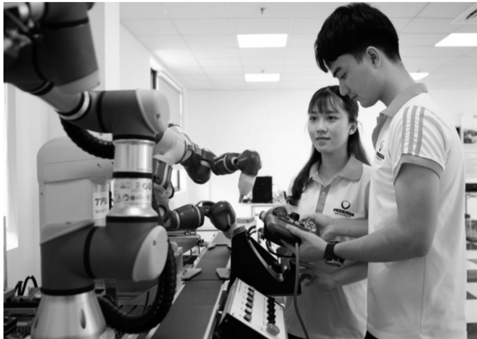
● Đào tạo nghề cho thanh niên khó khăn là “chìa khóa” để Việt Nam chuyển đổi số bền vững và thu hẹp khoảng cách giới trong lĩnh vực công nghệ. (Ảnh minh họa.)

Dù chỉ kéo dài trong một năm, nhưng dự án đã mang lại những kết quả ấn tượng: 207 thanh niên được tham gia các khóa học đào tạo nghề trong lĩnh vực kỹ thuật số, bao gồm thiết kế đồ họa 2D, thiết kế 3D và Digital Marketing; trong đó 42% là nữ – một con số rất đáng khích lệ trong bối cảnh định kiến giới vẫn còn tồn tại trong ngành công nghệ. 85% học viên có việc làm sau khi tốt nghiệp, cho thấy hiệu quả thực tiễn cao