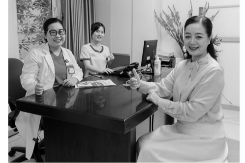
● Điều khiến nữ nghệ sĩ an tâm, tin tưởng hơn cả là được bác sĩ tư vấn nhiệt tình, giải thích cặn kẽ.

Sau trải nghiệm dịch vụ, nghệ sĩ đánh giá: “Tôi thật rất ấn tượng với sự chuyên nghiệp, tận tâm, tận tụy và chu đáo của đội ngũ y bác sĩ. Thêm nữa, các thiết bị nội soi hiện đại tối tân giúp tôi cảm thấy an tâm và hài lòng về kết quả chẩn đoán”.