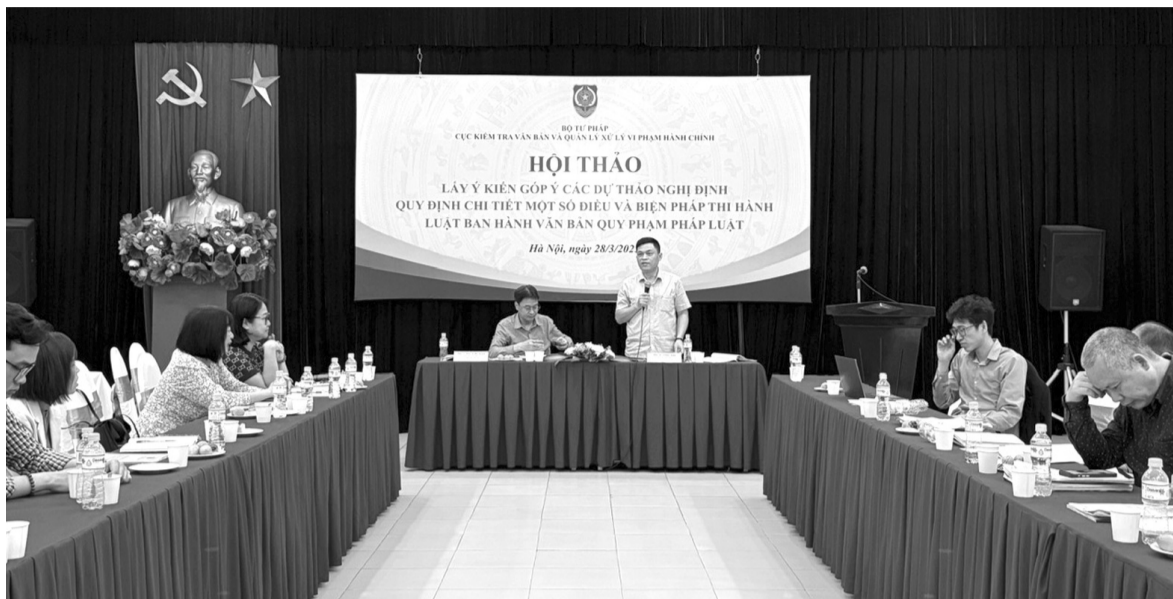
● Quang cảnh Hội thảo.