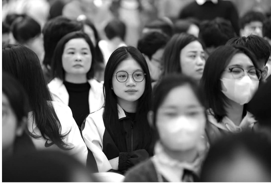
Thí sinh trong Ngày hội tư vấn TS 2025 tại Hà Nội.