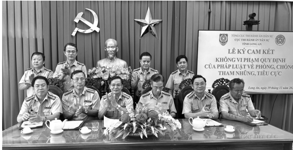
● Đại diện các Chi cục THADS trên địa bàn tỉnh Long An ký cam kết không vi phạm các quy định của pháp luật về phòng, chống tham nhũng, tiêu cực trong THADS.

Tại Long An, Cục THADS cho biết, Cục THADS tỉnh sẽ tổ chức tự kiểm tra tại Cục, Chi cục THADS từ ngày 01/4/2025