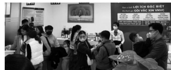
● Trong số ca mắc sởi ở Đà Nẵng có đến 54,03% chưa tiêm vaccine phòng bệnh.

Thứ trưởng Thuấn yêu cầu Sở Y tế Đà Nẵng chuẩn bị đầy đủ thuốc và thiết bị y tế để cung cấp cho các đơn vị. Các đơn vị cần tiếp tục thực hiện nghiêm túc chỉ đạo của Thủ tướng Chính phủ và Bộ Y tế, đồng thời tăng cường tập huấn, đào tạo chuyên môn cho tuyến dưới. Trung tâm Kiểm soát bệnh tật cần đẩy nhanh tiến độ tiêm vaccine sởi để phòng ngừa dịch bệnh. VŨ VĂN ANH