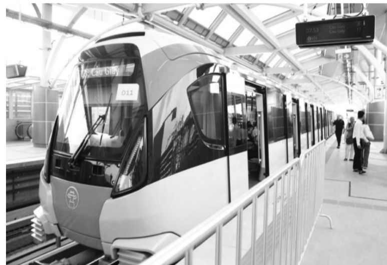
● Nhu cầu về toa xe đường sắt tốc độ cao và đường sắt đô thị là một thị trường lớn đối với các doanh nghiệp cơ khí Việt Nam.

● Trân trọng cảm ơn ông! VÕ TUẤN (Thực hiện)