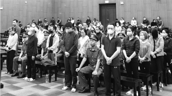
• Các bị cáo tại tòa.

Sau nhiều ngày xét xử và nghị án, vừa qua, HĐXX TAND TP Hà Nội đã ra phán quyết với 38 bị cáo trong vụ vi phạm quy định về kế toán, mua bán hóa đơn gây thất thoát hơn 743 tỷ đồng tiền thuế phải nộp cho Nhà nước.