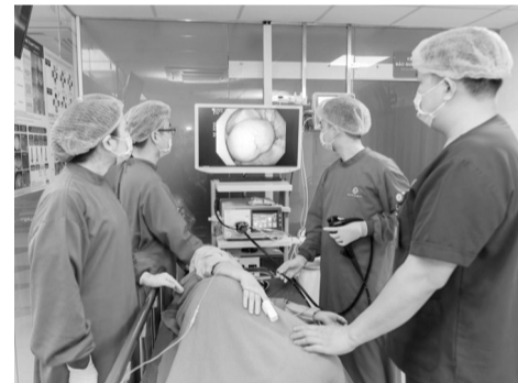
● Nội soi gây mê đem lại sự êm ái, nhẹ nhàng trong suốt quá trình thực hiện.

đầu tư đồng bộ hệ thống nội soi Olympus X1 và dịch vụ nội soi phóng đại hiện đại nhất thế giới. Hệ thống máy này có những ưu điểm nổi bật như: TXI (Texture and color enhancement Imaging): Ánh sáng trắng mới; RDI (Red Dichromatic Imaging): Phát hiện chính xác các điểm chảy máu; EDOF (Extended Depth of Field): Mở rộng độ sâu trường quan sát; M-NBI (Magnifying with Narrow-Band Imaging): Nội soi phóng đại hàng trăm lần tổn thương. Do đó, cho phép đánh giá chính xác những tổn thương có kích thước chỉ vài milimet, cũng như mang lại hiệu quả trong tầm soát ung thư đường tiêu hóa sớm.