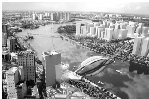
● Phối cảnh cầu đi bộ qua sông Sài Gòn.

Tại lễ khởi công, đại diện Sở Giao thông công chánh (GTCC) khẳng định, quy hoạch TP thời kỳ 2021 - 2030, tầm nhìn đến năm 2050 đã được Thủ tướng phê duyệt; cùng đồ án điều chỉnh quy hoạch chung TP đến 2040, tầm nhìn 2060; đều xác định sông Sài Gòn là trục phát triển bền vững, sinh thái gắn với du lịch, dịch vụ. Hành lang sông Sài Gòn là hành lang xanh, đa chức năng, được quy hoạch đồng bộ với hệ thống giao thông đường bộ, đường thủy, đường sắt, kết nối với các tỉnh Đông Nam Bộ.