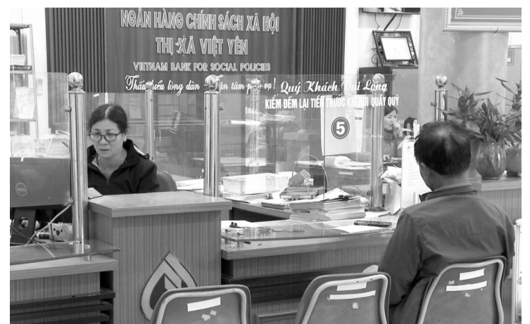
● Nguồn vốn chính sách sẽ góp phần tích cực để người dân và người lao động sớm có được chốn an cư.