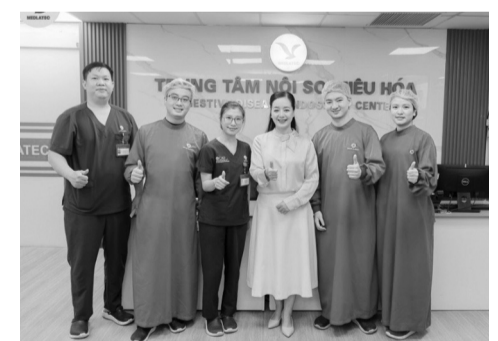
● Với sự trải nghiệm ấn tượng, nghệ sĩ an tâm gửi trọn niềm tin tại MEDLATEC.

Sau sự “kiểm chứng” chất lượng chuyên môn và dịch vụ của gia đình nghệ sĩ, tin rằng Bệnh viện Đa khoa MEDLATEC nói riêng, Hệ thống Y tế MEDLATEC nói chung xứng đáng là điểm đến tin cậy của người toàn quốc trong chăm sóc sức khỏe.