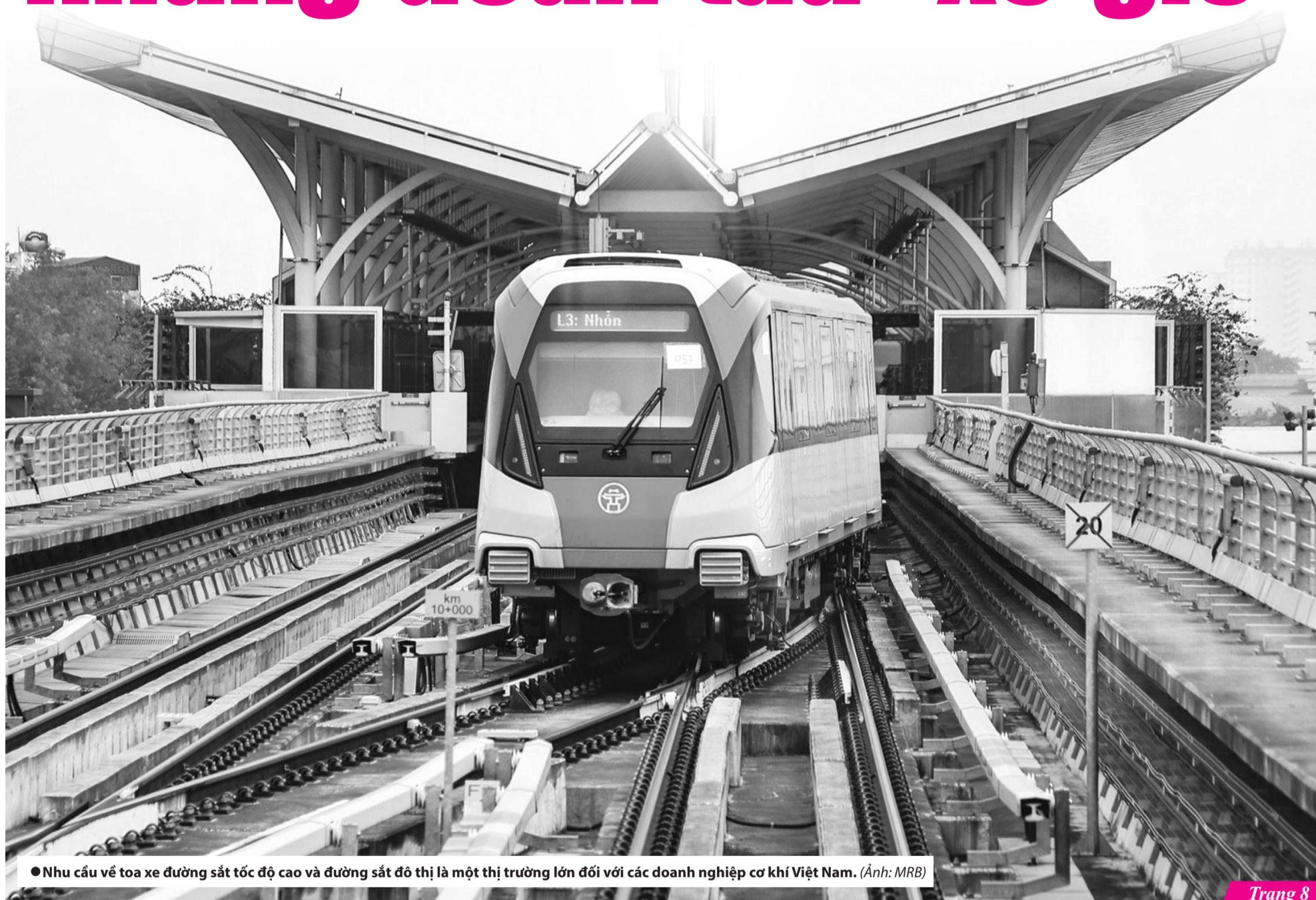
● Nhu cầu về toa xe đường sắt tốc độ cao và đường sắt đô thị là một thị trường lớn đối với các doanh nghiệp cơ khí Việt Nam.