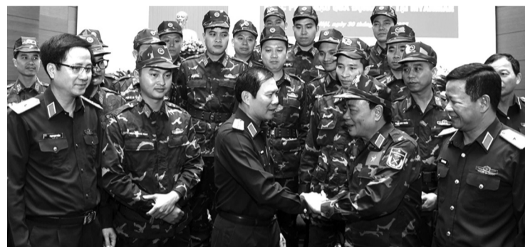
● Đại tướng Nguyễn Tân Cương động viên các lực lượng chuẩn bị lên đường tham gia khắc phục hậu quả động đất tại Myanmar.

Thực hiện phương châm đối ngoại của Đảng, Việt Nam luôn sẵn sàng là bạn, là đối tác tin cậy, là thành viên có trách nhiệm với cộng đồng quốc tế, thể hiện truyền thống, đạo lý “Thương người như thể thương thân” tốt đẹp của dân tộc Việt Nam; ngay sau khi nhận được tin xảy ra động đất tại Myanmar, ngay trong ngày 29/3, Bộ Quốc phòng đã chỉ đạo Cục Cứu hộ - Cứu nạn Bộ Tổng Tham mưu QĐND Việt Nam chủ trì, phối hợp với Cục Đối ngoại, Tổng cục Hậu cần - Kỹ thuật, Binh chủng Công binh, Bộ Tư lệnh Bộ đội Biên phòng và các đơn vị chức năng xây dựng kế hoạch, tổ chức thành lập lực lượng tham gia tham gia hỗ trợ nhân đạo, cứu trợ thảm họa của QĐND Việt Nam tại Myanmar gồm 80 quân nhân.