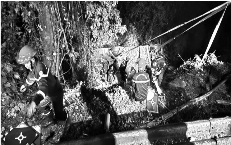
Lực lượng cứu hộ tiếp cận hiện trường vụ tai nạn.

Lực lượng CSGT Công an tỉnh Lâm Đồng và các lực lượng chức năng cùng nhiều