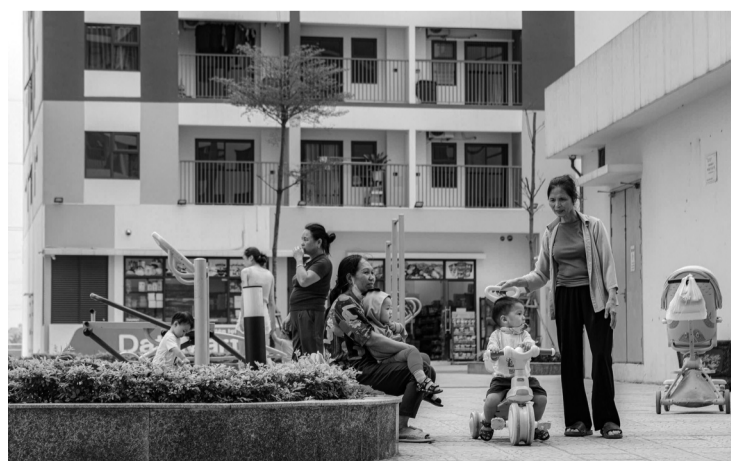
● Nhu cầu an cư, lạc nghiệp của người dân là rất lớn.

Theo kế hoạch đầu tư công năm 2025, trên cả nước sẽ có khoảng trên 6.200 tỷ đồng sẽ được giải ngân cho vay mua