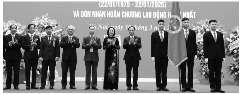
● Phó Thủ tướng Bùi Thanh Sơn trao tặng Huân chương Lao động hạng Nhất, phần thưởng cao quý của Đảng và Nhà nước Việt Nam cho Hội Hữu nghị Việt Nam - Campuchia.

Trong diễn văn tại buổi lễ, Phó Chủ tịch Quốc hội, Chủ tịch Hội Hữu nghị Việt Nam - Campuchia Nguyễn Thị Thanh ôn lại quá trình hình thành, phát triển cũng như những đóng góp nổi bật của Hội Hữu nghị Việt Nam - Campuchia trong suốt nửa thế kỷ qua, khẳng định: Sự ra đời của Hội là một chủ trương lớn, một sáng kiến thể hiện tầm nhìn chiến lược của Đảng và Nhà nước Việt Nam nhằm củng cố và phát huy mối quan hệ láng giềng truyền thống, góp phần xây dựng nền tảng hợp tác lâu dài, bền chặt giữa hai quốc gia và Nhân dân hai nước.