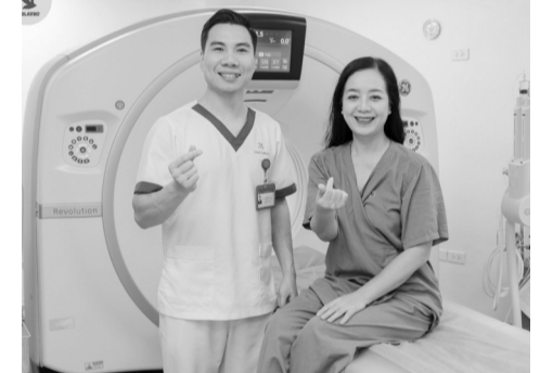
● Nghệ sĩ có ấn tượng đặc biệt về hệ thống máy móc hiện đại, cho kết quả chính xác và tin cậy.

Rất may mắn kết quả nội soi của nữ nghệ sĩ chỉ mới chớm viêm nhẹ dạ dày, nhưng bác sĩ cũng tư vấn kỹ càng cho chị về chế độ ăn uống, sinh hoạt để bảo vệ hệ tiêu hóa khỏe mạnh.