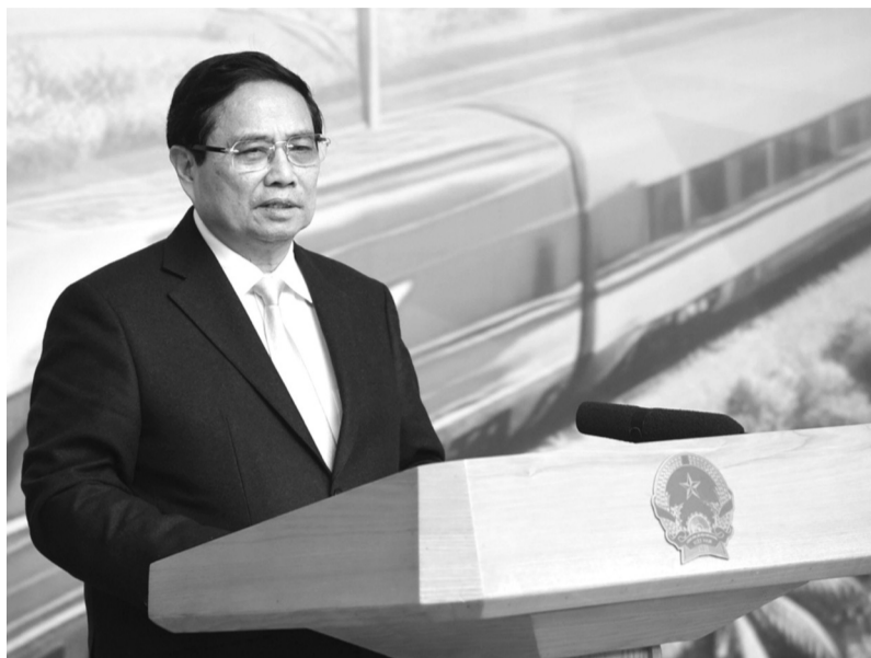
● Thủ tướng Phạm Minh Chính: Quyết tâm xây dựng bằng được ngành công nghiệp đường sắt.

Cuối tuần qua, phát biểu kết luận Phiên họp thứ nhất Ban Chỉ đạo các công trình trọng điểm, dự án quan trọng quốc gia lĩnh vực đường sắt, Thủ tướng Phạm Minh Chính, Trưởng Ban Chỉ đạo nêu rõ quyết tâm xây dựng bằng được ngành công nghiệp đường sắt, làm chủ công nghệ, sản xuất được toa xe, đầu máy, phát triển hệ sinh thái công nghiệp đường sắt.