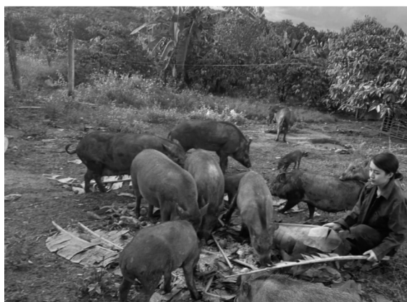
● Từ bỏ phố thị, chị Nhi trở về quê xây dựng trang trại cây ăn trái kết hợp chăn nuôi heo rừng theo hướng hữu cơ.