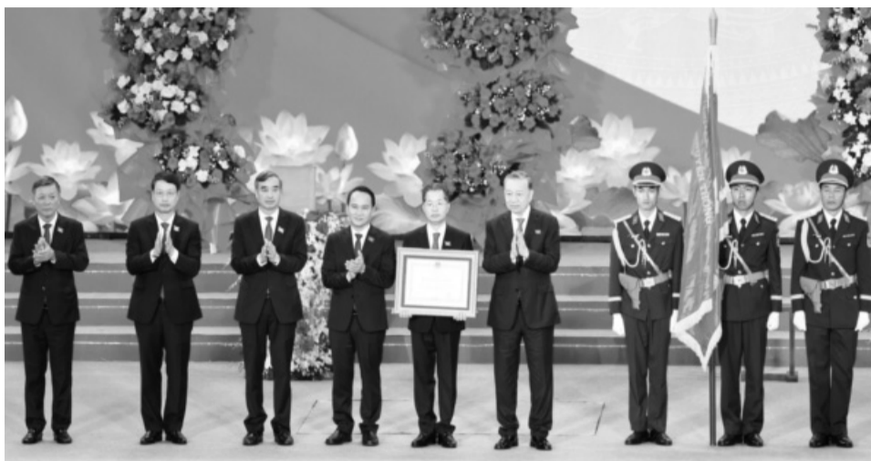
● Thay mặt lãnh đạo Đảng và Nhà nước, Tổng Bí thư Tô Lâm đã trao Huân chương Lao động hạng Nhất tặng Đảng bộ, chính quyền và Nhân dân TP Đà Nẵng.

"Có thể nói, cái được lớn nhất của Đảng bộ Đà Nẵng là được lòng dân và đó chính là niềm tự hào đáng trân trọng của Nhân dân Đà Nẵng anh hùng. Đây là tiền đề để tạo ra sức mạnh tổng hợp để Đà