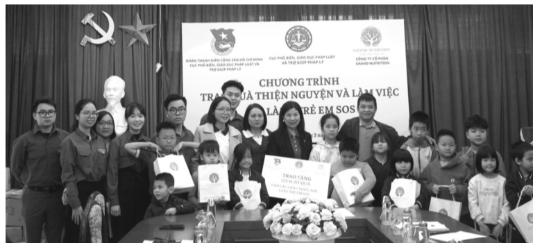
● Trao quà thiện nguyện tại Làng trẻ em SOS tại Hà Nội.

Ngày 29/3, Đoàn thanh niên Cục Phổ biến, giáo dục pháp luật và Trợ giúp pháp lý (Cục PBGDPL&TGPL) – Bộ Tư pháp phối hợp với Công ty Cổ phần Grand Nutrition tổ chức Chương trình thiện nguyện tại Làng trẻ em SOS tại Hà Nội.