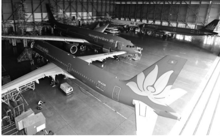
● Tàu bay bảo dưỡng tại 1 hangar của Vietnam Airlines.

Hiện tại, cả nước có 5 hãng bay, nhưng chỉ Hãng hàng không Quốc gia Việt Nam - Vietnam Airlines có hangar. Vietjet - hãng hàng không tư nhân, với số lượng tàu bay gần “đuôi kíp”