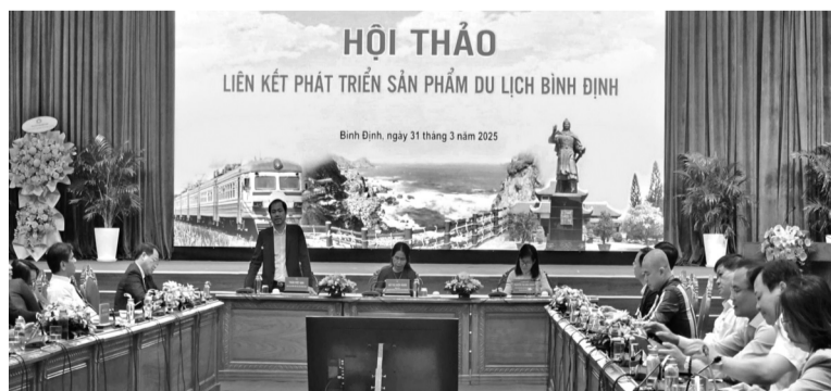
● Quang cảnh Hội thảo.