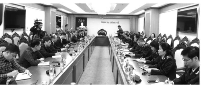
● Quang cảnh Hội nghị công bố KLTT.

Ông Cường đề nghị quá trình thực hiện KLTT, các đơn vị được thanh tra trực tiếp ngoài các nội dung công việc theo thẩm quyền, cần chủ động phối hợp với các cơ quan, đơn vị có liên quan để triển khai thực hiện đầy đủ các nội dung tại kết luận, báo cáo Thủ tướng Chính phủ kết quả thực hiện theo quy định. Đồng thời hy vọng rằng sau thanh tra, Bộ Y tế và các cơ quan, đơn vị có liên quan sẽ rút ra nhiều kinh nghiệm quý báu phục vụ công tác quản lý, điều hành, song song với quá trình tổ chức thực hiện KLTT; tiếp tục nâng cao tinh thần trách nhiệm, quyết liệt thực hiện các biện pháp sớm đưa 2 BV đi vào hoạt động, đáp ứng lòng mong đợi của lãnh đạo Đảng, Chính phủ và các tầng lớp Nhân dân. T.QUYÊN