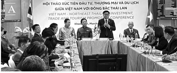
● Tại Hội thảo, Đoàn công tác tỉnh Quảng Bình đã giới thiệu các tiềm năng, lợi thế của tỉnh.

Tổng lãnh sự quán Việt Nam tại Khôn Kèn (Thái Lan) vừa chủ trì, phối hợp với các đơn vị tổ chức chương trình xúc tiến đầu tư, thương mại, du lịch giữa Việt Nam và các tỉnh Đông Bắc Thái Lan.