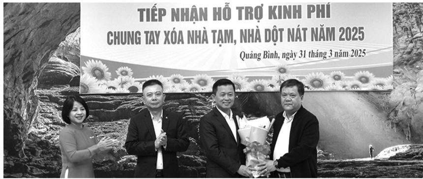
● Ông Trần Phong (ngoài cùng bên phải), Chủ tịch UBND tỉnh Quảng Bình tặng hoa, cảm ơn sự đồng hành, hỗ trợ của các nhà tài trợ.

Theo báo cáo từ Sở NN&MT tỉnh Quảng Bình, tính đến ngày 31/3/2025, toàn tỉnh đã khởi công, xây mới, xóa 1.273 NT,NDN, trong đó có 420 ngôi nhà đã hoàn thành và đưa vào sử dụng trên tổng số 1.553 NT,NDN có quyết định được hỗ trợ sửa chữa, xây mới (trong đó, 91 hộ có đơn đề nghị không thực hiện).