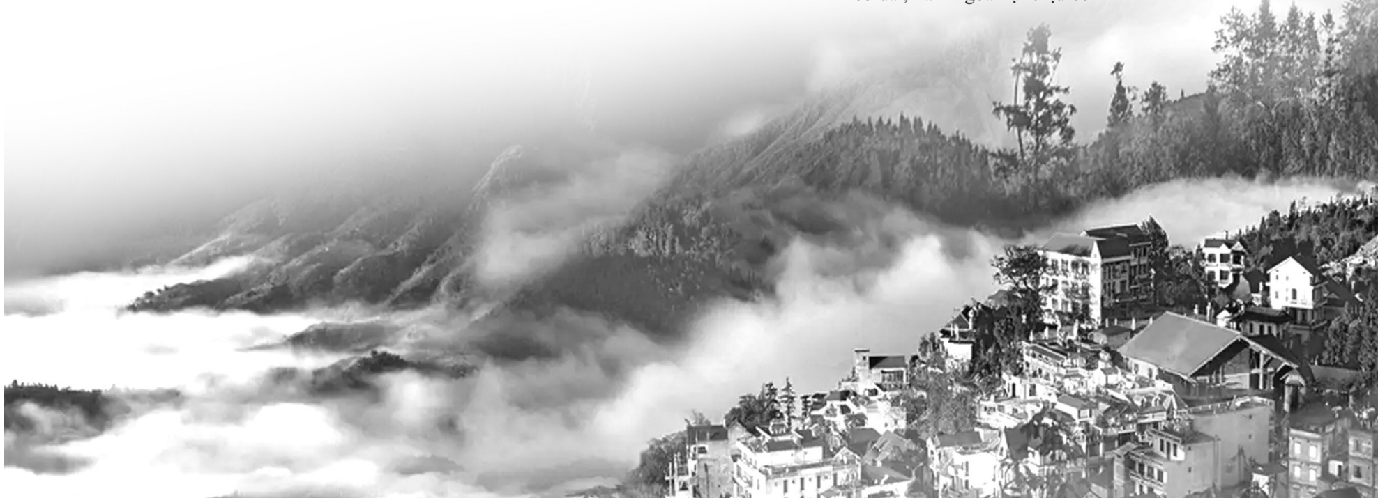
● Lào Cai là một trong 15 tỉnh vùng TD&MNPB có nhiều du địa cho doanh nghiệp tư nhân phát triển.

“Trong năm 2024, cơ quan nhà nước đã cấp giấy đăng ký kinh doanh cho 700 DN và 60 đơn vị trực thuộc với tổng vốn đăng ký đạt 6.700 tỷ đồng. Hiện Lào Cai có khoảng 4.300 DN đang hoạt động”, ông Long cho biết và nói thêm rằng, nhờ sự nỗ lực không ngừng nghỉ của cộng đồng DN đã góp phần quan trọng thúc đẩy kinh tế - xã hội tỉnh Lào Cai phát triển, góp phần quan trọng để năm vừa qua, tổng thu ngân sách trên địa bàn tỉnh đạt gần 13.000 tỷ đồng, mức kỷ lục cao nhất từ trước đến nay.