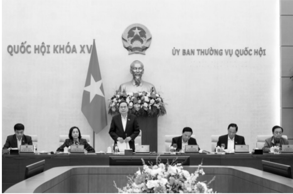
● Chủ tịch Quốc hội Trần Thanh Mẫn lưu ý ưu tiên trình các nội dung phục vụ sắp xếp bộ máy tại Kỳ họp thứ 9.

Cho ý kiến việc điều chỉnh thời gian xem xét thông qua đối với các dự án luật, Chủ tịch QH đề nghị, các cơ quan theo lĩnh vực phụ trách phối hợp chặt chẽ với Thường trực Ủy ban Pháp luật và Tư pháp và các cơ quan của QH báo cáo UBTVQH xem xét, quyết định việc điều chỉnh Chương trình xây dựng luật, pháp