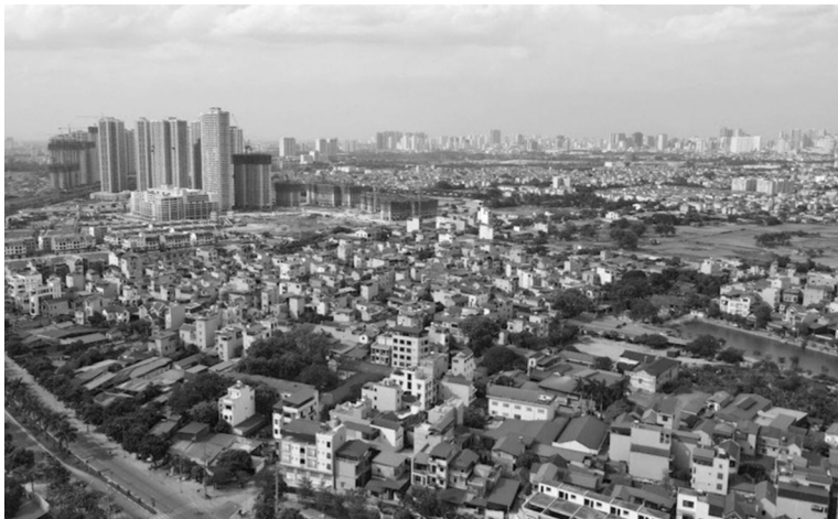
● Đất nông nghiệp được thí điểm chuyển nhượng làm dự án nhà ở thương mại.

Ngày 11/2/2025, Bộ Lao động - Thương binh và Xã hội (trước khi bị sáp nhập) đã ban hành Thông tư 03/2025/TT-BLĐTBXH quy định tiêu chuẩn phân loại lao động (LĐ) theo điều kiện LĐ. Theo quy định, có 6 loại điều kiện LĐ, từ loại I đến loại VI. Trong đó, nghề, công việc có điều kiện LĐ được xếp loại I, II, III là nghề, công việc không nặng nhọc, không độc hại, không nguy hiểm. Nghề, công việc có điều kiện LĐ được xếp loại IV là nghề, công việc nặng nhọc, độc hại, nguy hiểm. Nghề, công việc có điều kiện LĐ được xếp loại V, VI là nghề, công việc đặc biệt nặng nhọc, độc hại, nguy hiểm.