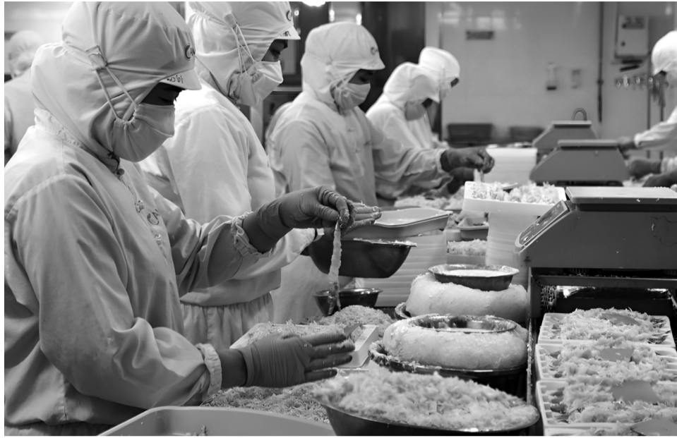
● Ngành tôm mang lại nguồn thu lớn cho tỉnh Cà Mau.

Tuy nhiên, ngành tôm tỉnh Cà Mau phát triển chưa tương xứng với tiềm năng, lợi thế và đối mặt với nhiều thách thức như: cơ sở hạ tầng chưa đáp ứng yêu cầu phát triển; tác động của biến đổi khí hậu, ô nhiễm môi trường, dịch bệnh; hiệu quả sản