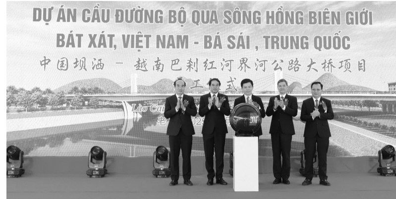
● Các đại biểu phát lệnh khởi công xây dựng cầu đường bộ qua sông Hồng biên giới Bát Xát (Việt Nam) - Bá Sái (Trung Quốc).

Mỗi bên sẽ đầu tư xây dựng 1/2 cầu chính, chiều dài 115m. Phần cầu và đường dẫn phía Việt Nam, chiều