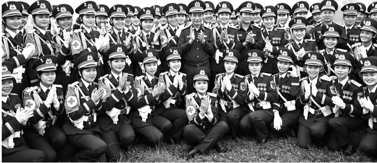
● Đại tướng Phan Văn Giang chụp ảnh chung với khối nữ sĩ quan quân y.

Trên thao trường TB4, những “bóng hồng” đang nỗ lực tập luyện điều binh, điều hành nhân dịp kỷ niệm 50 năm Ngày giải phóng miền Nam, thống nhất đất nước (30/4/1975 - 30/4/2025). Dù gặp không ít khó khăn, song các chị em luôn cố gắng, xác định rõ tư tưởng, ý chí quyết tâm cao, hoàn thành tốt nhiệm vụ được giao.