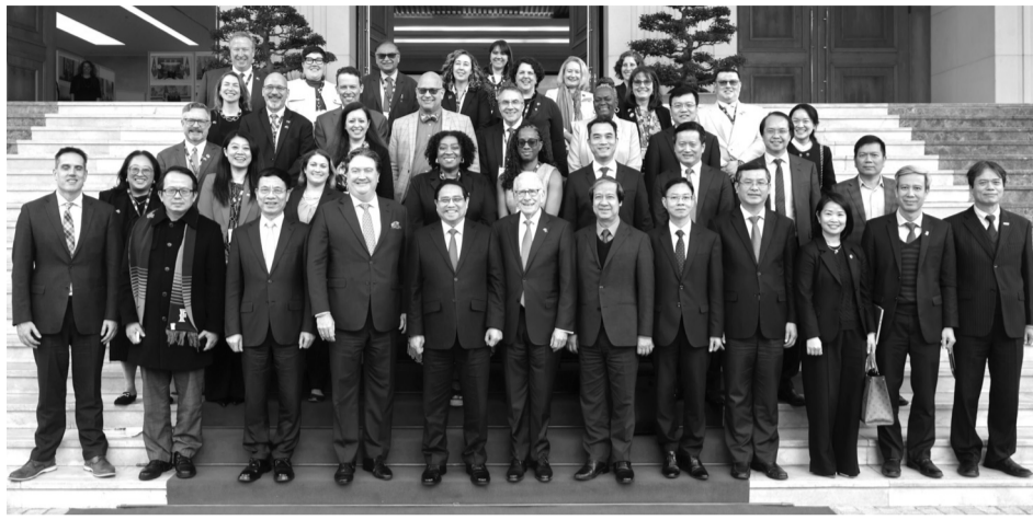
● Thủ tướng Phạm Minh Chính và Đoàn đại biểu 21 trường đại học danh tiếng hàng đầu của Hoa Kỳ.

Thủ tướng Chính phủ đề nghị các trường đại học của hai nước phối hợp chặt chẽ xây dựng những kế hoạch hợp tác mang tính dài hạn, bền vững, thiết thực và hiệu quả với các hình thức đa dạng, sáng tạo, linh hoạt như trao đổi sinh viên, giảng viên, liên kết đào tạo, các chương trình nghiên cứu chung, đi vào