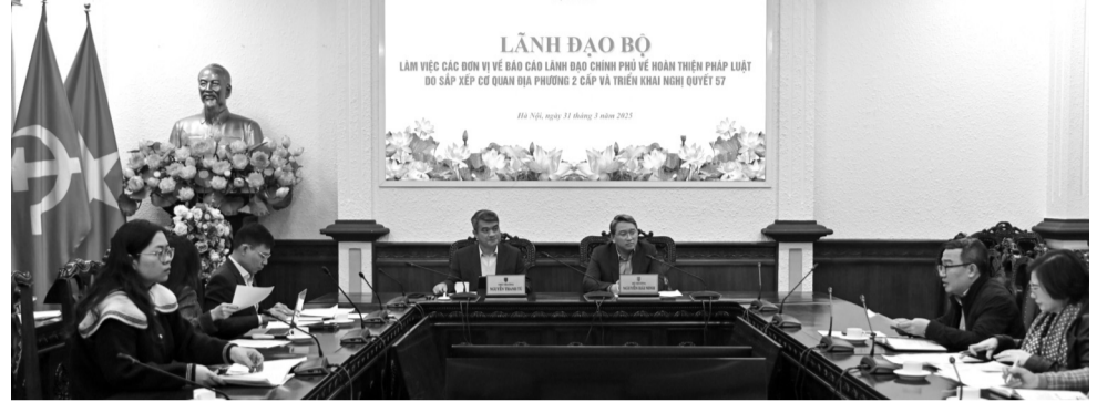
● Bộ trưởng Bộ Tư pháp Nguyễn Hải Ninh và Thứ trưởng Nguyễn Thanh Tú chủ trì buổi làm việc.

Đồng thời, Bộ trưởng đề nghị các đơn vị tiếp tục chủ động rà soát, tham mưu, xác