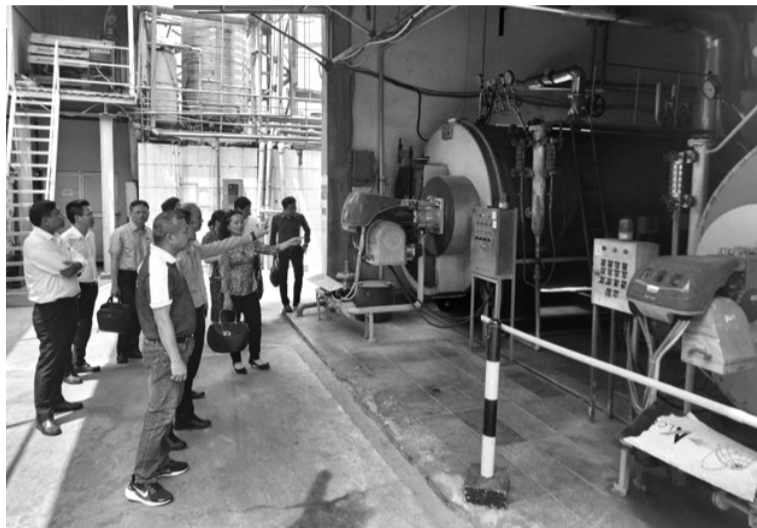
● Thúc đẩy được hộ kinh doanh cá thể thành DN sẽ phát huy được sức mạnh khu vực KTTN.

Bên cạnh đó, tính phi chính thức của khu vực KTTN còn rất cao. Bởi bên cạnh 940.000 DN