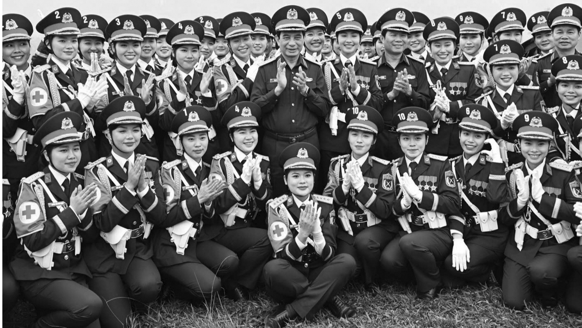
● Đại tướng Phan Văn Giang chụp ảnh chung với khối nữ sĩ quan quân y.