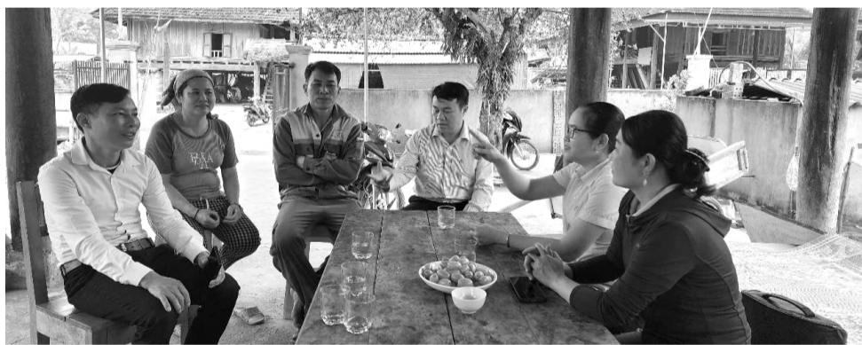
● Cán bộ NHCSXH huyện Con Cuông luôn sát cánh bên những hộ gia đình được vay vốn, bảo đảm đúng đối tượng và phát huy hiệu quả.