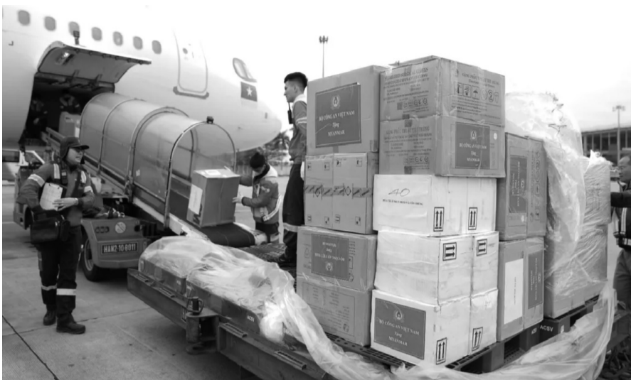
● Hàng hóa cứu trợ được vận chuyển lên máy bay chiều 30/3 đến Myanmar.

Nhiều nghiên cứu pháp lý khu vực ASEAN đã chỉ ra sự điều phối và đơn giản hóa thủ tục hiệu quả là nền tảng cho việc thực hiện thành công AADMER. AADMER đã tạo điều kiện cho việc cung cấp hỗ trợ trong nhiều thảm họa khác nhau trong khu vực, trước đó có thể kể tới bão Haiyan ở Philippines