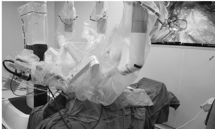
● Đã có hàng nghìn người bệnh được các bệnh viện trong nước thực hiện phẫu thuật bằng robot thành công.

Trước đó, nhiều hội nghị chuyên đề và thỏa thuận hợp tác về khoa học công nghệ trong y học đã được tổ chức, như Hội nghị "Đổi mới, sáng tạo, ứng dụng khoa học công nghệ, chuyển đổi số trong đào tạo nhân lực y tế" của Trường Đại học Y - Dược, Đại học Thái Nguyên; Hội nghị Khoa học thường niên lần thứ 3 của Bệnh viện Đại học Y Dược Buôn Ma Thuột; hay lễ ký