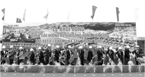
● Công trình là dự án quan trọng, có tổng mức đầu tư 1.500 tỷ đồng.

Trước đó, năm 2021, cầu Đình nối Kinh Môn (Hải Dương) với Thủy Nguyên (TP Hải Phòng) đã được đưa vào khai thác, góp phần kết nối các QL37, 10, đường tỉnh 389B, 352 và các tuyến đường trong khu vực. Công trình tạo sự liên kết vùng quan trọng, thuận lợi cho giao thương của người dân TX Kinh Môn, các huyện Kim Thành, Nam Sách (Hải Dương), TP Đông Triều (Quảng Ninh) và vùng phụ cận, đặc biệt là với Khu trung tâm Chính trị - Hành chính mới của TP Hải Phòng tại Khu đô thị mới Bắc Sông Cấm. HOÀNG GIANG