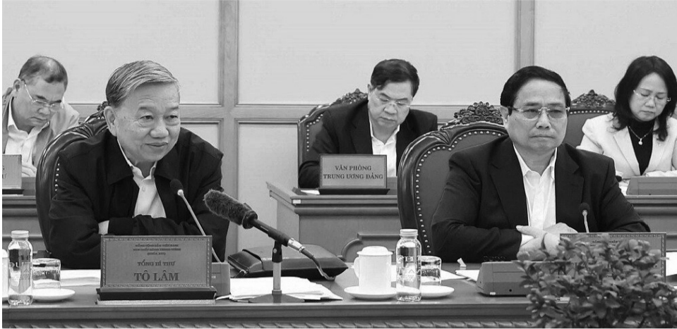
● Tổng Bí thư Tô Lâm và Thủ tướng Phạm Minh Chính tại cuộc họp.

Ngày 1/4, tại Trụ sở Trung ương Đảng, Bộ Chính trị, Ban Bí thư nghe báo cáo cập nhật kiến thức và cho ý kiến hoàn thiện Chuyên đề về đột phá phát triển khoa học, công nghệ, đổi mới sáng tạo, chuyển đổi số.