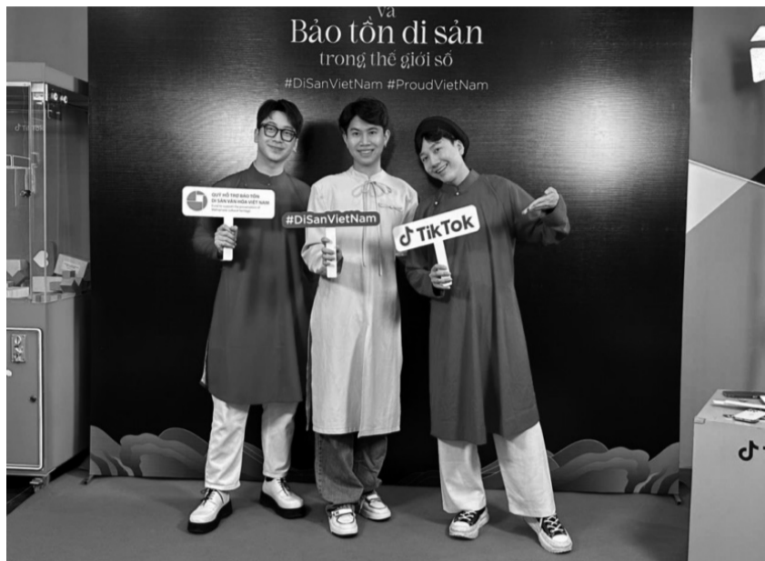
● Các bạn trẻ cùng nhau đồng lòng quảng bá di sản văn hóa Việt trên nền tảng số.

PGS.TS Đỗ Văn Trụ - Chủ tịch Hội Di sản Văn hóa Việt Nam đồng thời là Chủ tịch Hội đồng Quản lý Quỹ Hỗ trợ bảo tồn di sản văn hoá Việt Nam khẳng định: “Di sản văn hoá bao gồm di sản vật thể, di sản phi vật thể, di sản ký ức, là sản phẩm tinh thần, vật chất có giá trị lịch sử, văn hoá, khoa học, được hình thành, xây dựng và vun đắp từ thế hệ này qua thế hệ khác, là sự kết nối liên tục giữa quá khứ, hiện tại và tương lai. Không có đất nước nào xây dựng nền văn hoá mà lại không cần đến lịch sử. Giá trị của di sản văn hoá được tích tụ từ truyền thống mang đến sức mạnh về tinh thần, trở thành những tinh hoa để phát triển nền văn hoá mới, xã hội mới phù hợp với tình hình mới”.