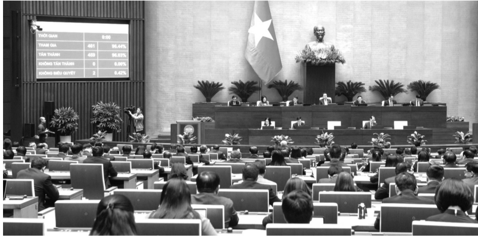
● Quang cảnh phiên họp Quốc hội thông qua Luật Ban hành văn bản quy phạm pháp luật.

Từ ngày 1/4/2025, Luật Ban hành văn bản quy phạm pháp luật (VBQPPL) năm 2025, được thông qua ngày 19/2/2025 tại Kỳ họp bất thường lần thứ 9, Quốc hội (QH) khóa XV, có hiệu lực thi hành. Luật có rất nhiều quy định nhằm đổi mới và hoàn thiện quy trình xây dựng, ban hành VBQPPL, đòi hỏi phải khẩn trương đưa vào cuộc sống, góp phần thực hiện bằng được đột phá chiến lược và hoàn thiện thể chế phát triển.