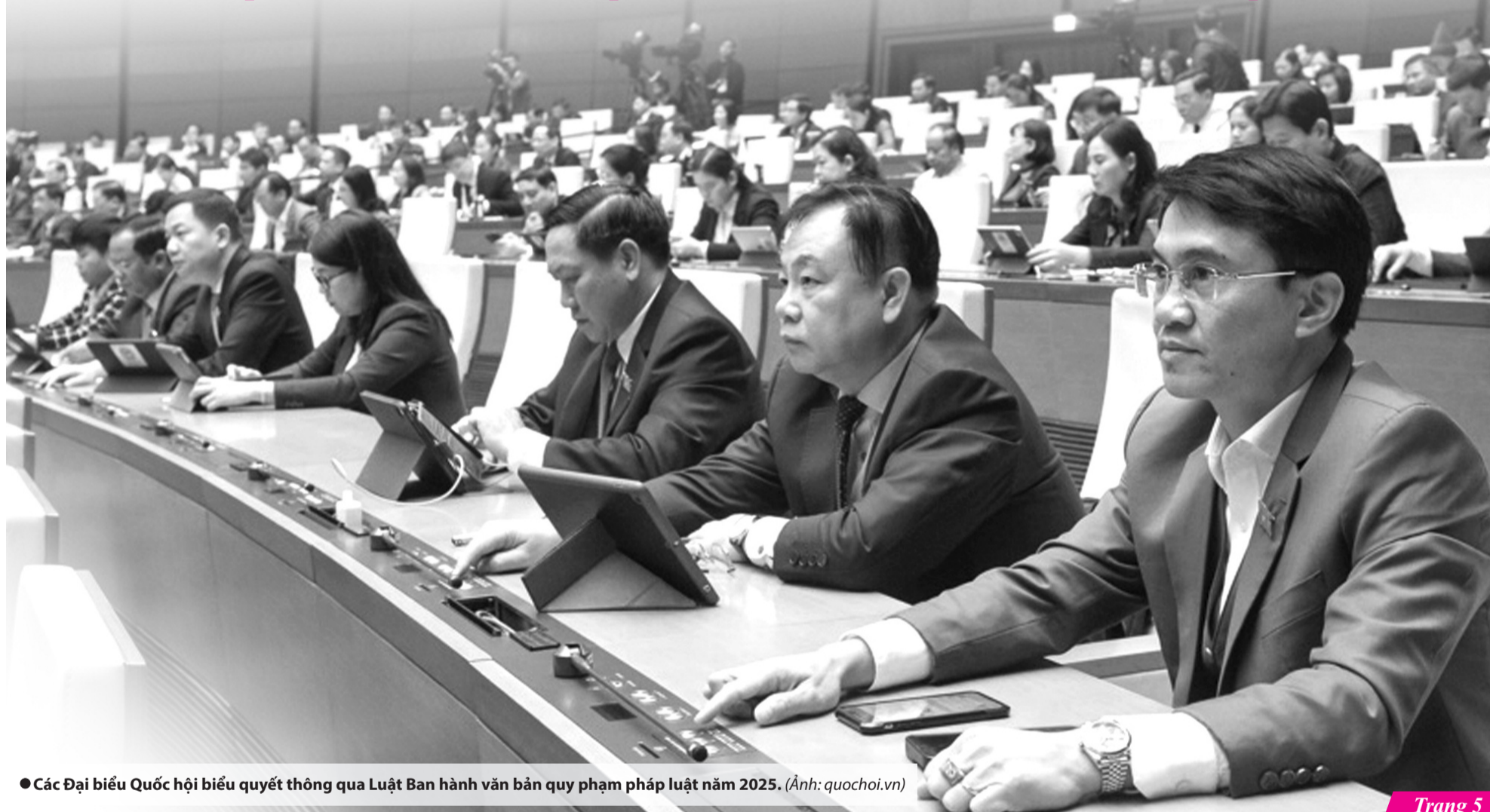
● Các Đại biểu Quốc hội biểu quyết thông qua Luật Ban hành văn bản quy phạm pháp luật năm 2025.