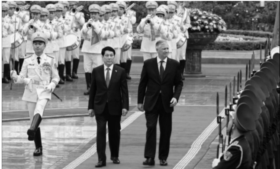
● Chủ tịch nước Lương Cường và Vua Philippe duyệt đội danh dự trong lễ đón tại Phủ Chủ tịch ngày 1/4.