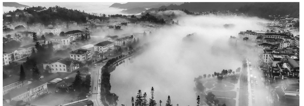
● Tiềm năng, cơ hội, lợi thế cạnh tranh của tỉnh Lào Cai còn nhiều (du lịch, cửa khẩu...), cần phát huy tối đa.