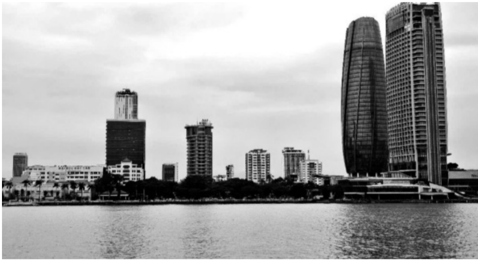
● Trung tâm tài chính phải có khung pháp lý rõ ràng cho các chủ thể tham gia. (Ảnh minh họa)

Giao dịch ngoại tệ tại Trung tâm tài chính sẽ được thực hiện như thế nào khi pháp luật hiện hành ở Việt Nam không cho phép thực hiện giao dịch ngoại tệ tự do. Đây là vấn đề đang được bàn đến trong quá trình xây dựng khung pháp lý cho Trung tâm tài chính tại Việt Nam.