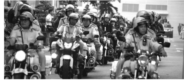
● Các lực lượng CA TP đồng loạt ra quân trấn áp tội phạm.