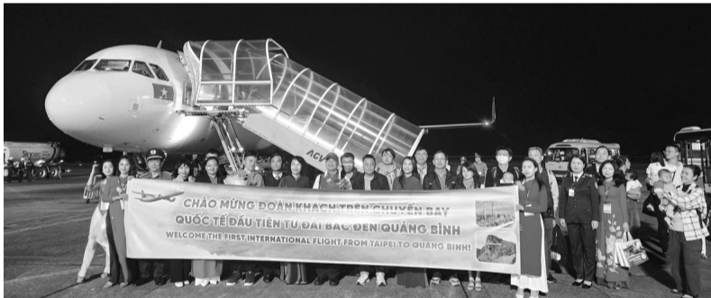
● Chuyến bay hạ cánh tại sân bay Đồng Hới lúc 19h40 tới 31/3.

Chuyến bay số hiệu VJ7173, TPE-VDH, do Hãng hàng không Vietjet Air khai thác vừa hạ cánh tại sân bay Đồng Hới lúc 19h40 tới 31/3, đưa 38 hành khách từ Đài Bắc (Đài Loan, Trung Quốc) đến tham quan, du lịch tại Quảng Bình.