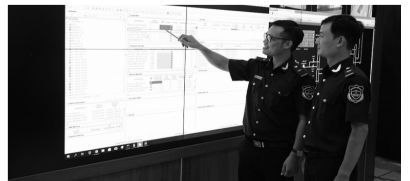
● Hệ thống vận hành tại Trung tâm quản lý vận hành Hệ thống công nghệ thông tin hải quan.