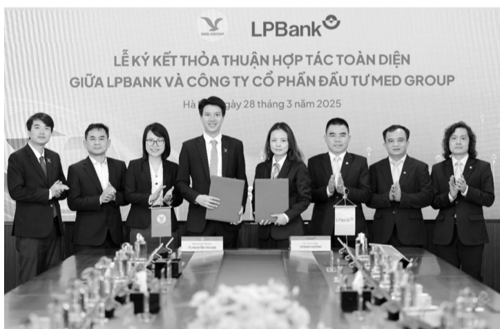
● Thỏa thuận mở ra cơ hội hợp tác phát triển bền vững, mang lại lợi ích thiết thực cho khách hàng và cán bộ, nhân viên hai bên.

Lễ ký kết hợp tác toàn diện giữa LPBank và MED GROUP không chỉ là sự khởi đầu cho mối quan hệ chiến lược mà còn mở ra triển vọng hợp tác sâu rộng trong tương lai. Hai bên cam kết sẽ tiếp tục đồng hành, phát huy thế mạnh để mang lại những giá trị thiết thực, góp phần vào sự phát triển kinh tế - xã hội của đất nước. Qua việc hợp tác toàn diện, LPBank và MED GROUP đã đặt nền móng vững chắc cho một hành trình hợp tác đầy tiềm năng, hứa hẹn mang đến những thay đổi tích cực cho cộng đồng Việt Nam trong thời gian tới. P.V