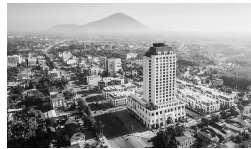
● Một góc Tây Ninh.

như can thiệp tim mạch, ghép tạo nhịp tim được thực hiện ngay tại tuyến tỉnh.