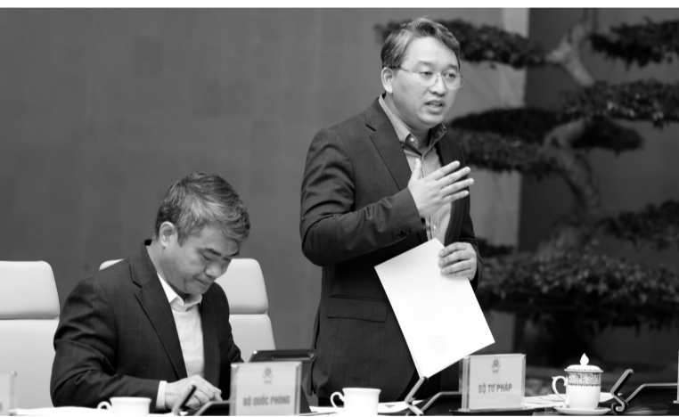
● Bộ trưởng Bộ Tư pháp Nguyễn Hải Ninh nhận định, đối với việc tổ chức chính quyền địa phương 2 cấp, quan trọng nhất là phải phân định được thẩm quyền giữa các cấp.

công tác về tiếp nhận, xử lý phản ánh, kiến nghị nhằm hoàn thiện pháp luật. Bộ đã xây dựng Hệ thống thông tin tiếp nhận, xử lý phản ánh, kiến nghị về VBQPPL để đưa vào vận hành thử nghiệm.