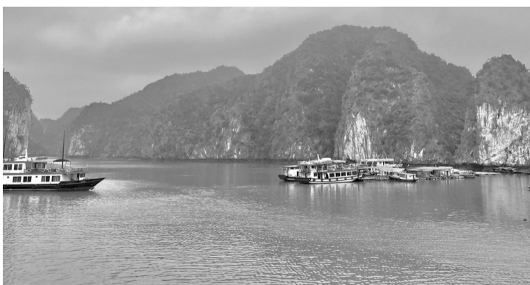
● Ngay từ đầu mùa du lịch hè, nhiều bãi biển đã nhận nhịp đón du thuyền đến tham quan.