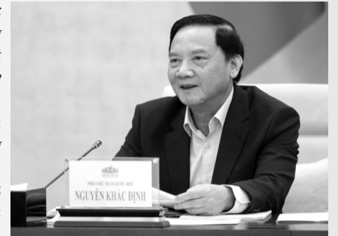
● Phó Chủ tịch Quốc hội Nguyễn Khắc Định.

Chỉ áp dụng quy định tại khoản 2 Điều 26 của Luật ban hành VBQPPL năm 2025 về việc "ban hành luật, nghị quyết ngay tại kỳ họp QH đang diễn ra hoặc kỳ họp gần nhất" để giải quyết vấn đề thực sự cấp bách, vướng mắc, bất cập phát sinh từ thực tiễn đối với trường hợp xây dựng luật, nghị quyết có hồ sơ được gửi đến UBTVQH sau thời hạn 45 ngày trước ngày khai mạc kỳ họp QH (thời điểm muộn nhất dự án luật, nghị quyết phải được gửi đến các cơ quan của QH để thẩm tra trước khi trình QH - khoản 1 Điều 37 của Luật năm 2025).