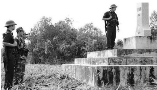
● Bộ đội Biên phòng Tây Ninh tuần tra, bảo vệ cột mốc chủ quyền quốc gia.