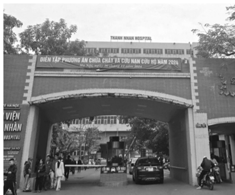
●BV Thanh Nhàn có địa chỉ tại số 42 Thanh Nhàn, quận Hai Bà Trưng.

Trong khi đó, các bác sĩ cho rằng không nhận được hoặc chỉ nhận được số tiền nhỏ từ Phòng Tài chính Kế toán của BV Thanh Nhàn được xác định là kinh phí giảng dạy của giảng viên, nhưng khác với khoản tiền đã được kê