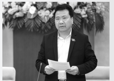
● Phó Chủ nhiệm Ủy ban Pháp luật và Tư pháp của Quốc hội Ngô Trung Thành.