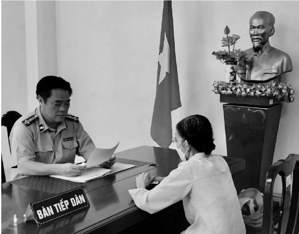
● Cán bộ THA tiếp dân.

Nhà nước cần tăng cường quan tâm hơn nữa về cơ sở vật chất, điều kiện làm việc, công tác đào tạo đội ngũ cán bộ tiếp công dân, giải quyết khiếu nại, tố cáo; kết hợp với cơ chế bảo vệ tương xứng; bảo đảm công tác ổn định, lâu dài chuyên sâu về nghiệp vụ, giỏi về thực tiễn và có kinh nghiệm; có bản lĩnh chính trị vững vàng, phẩm chất đạo đức tốt, có đủ sức mạnh đấu tranh với tiêu cực, vi phạm pháp luật.