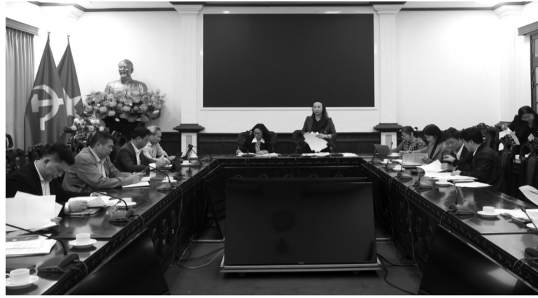
● Toàn cảnh Hội đồng thẩm định.