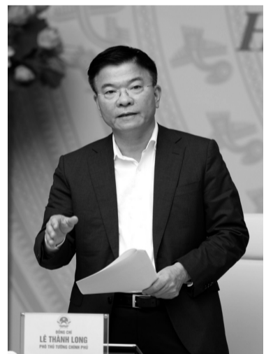
● Phó Thủ tướng Lê Thành Long chủ trì phiên họp thứ 5 của Ban Chỉ đạo.

Đối với những văn bản mới được trình sau ngày 1/4/2025 thì thực hiện theo Luật Ban hành VBQPPL năm 2025. Theo đó,