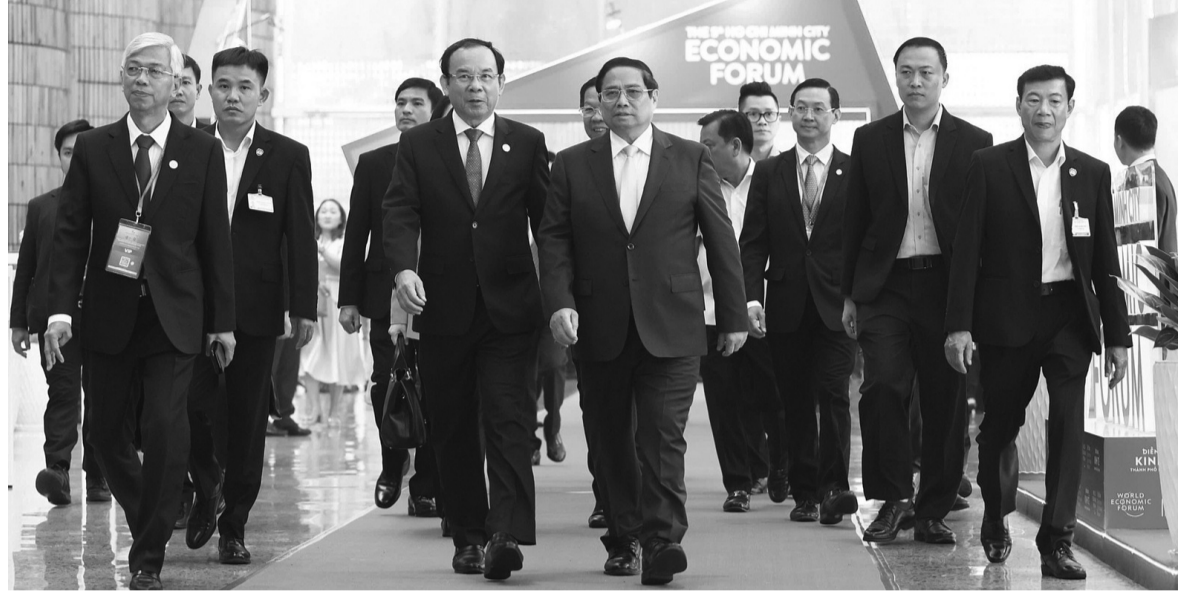
● Thủ tướng Phạm Minh Chính dự Diễn đàn Kinh tế TP HCM lần thứ 5 năm 2024.

Mặc dù vậy, theo khảo sát sơ bộ gần đây nhất của Viện Nghiên cứu quản lý kinh tế Trung ương (nay là Viện Nghiên cứu chính sách và chiến lược), cho thấy số lượng ngành nghề đầu tư kinh doanh có điều kiện tuy giảm về hình thức nhưng nội hàm của ngành nghề mở rộng hơn, bao trùm hơn. Ví dụ: Danh mục ngành nghề kinh doanh có điều kiện của Luật 2014 quy định “Nuôi sinh sản, nuôi sinh trưởng động vật hoang dã thông thường”; đến Luật 2020, ngành nghề này được rút ngắn với nội dung: “Nuôi động vật rừng thông thường”. Hay như nghề “Kinh doanh dịch vụ khảo nghiệm thức ăn thủy sản” là ngành nghề kinh doanh