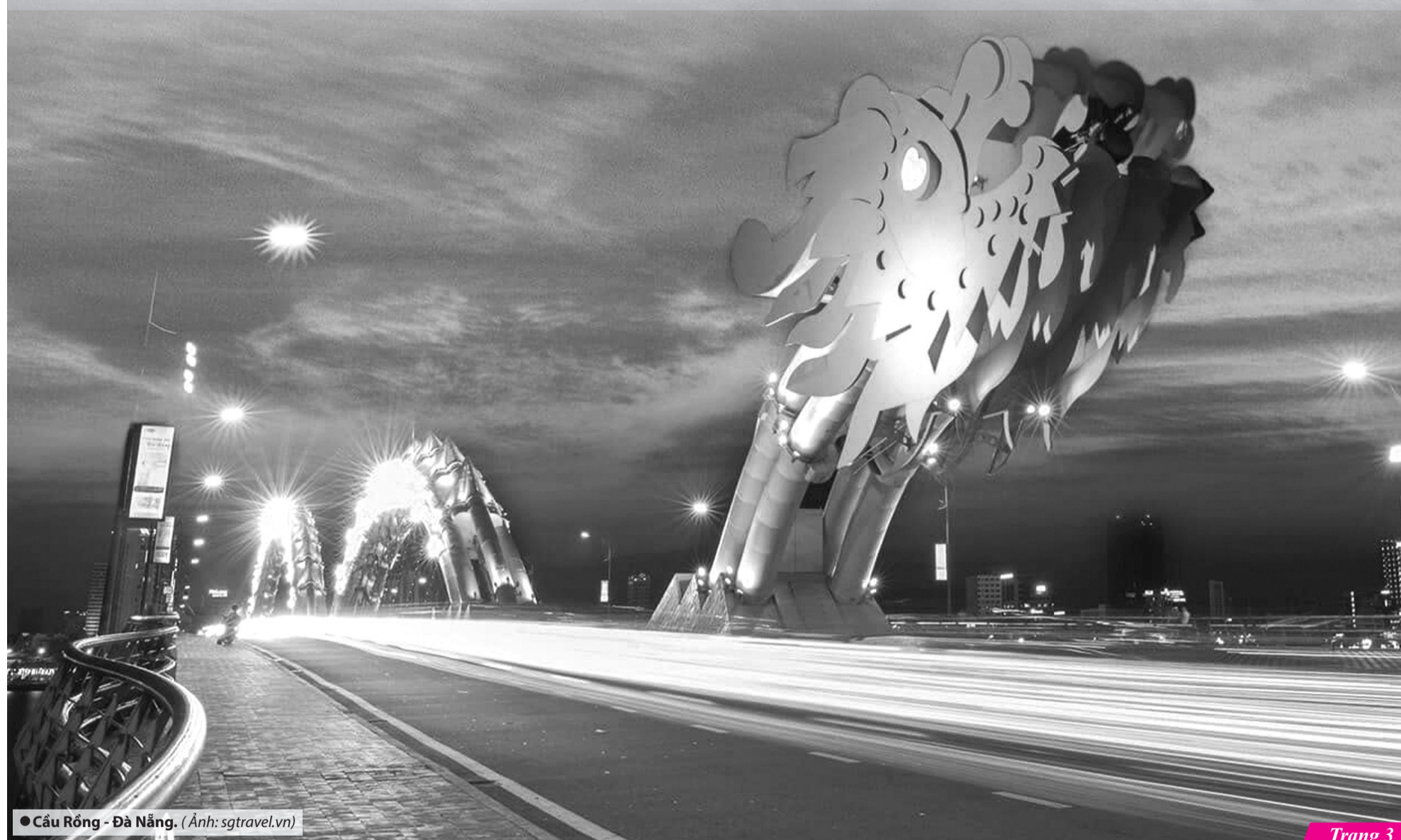
● Cầu Rồng - Đà Nẵng.