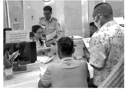
● Công an tỉnh Bình Dương tiếp nhận 7.664 hồ sơ đổi, cấp lại GPLX sau 1 tháng nhận nhiệm vụ mới.

Với sự nỗ lực không ngừng của lực lượng CSGT và sự ủng hộ từ người dân, công tác cấp, đổi GPLX được đánh giá ngày càng trở nên thuận tiện, hiệu quả, góp phần nâng cao chất lượng dịch vụ công. Hệ thống tiếp nhận hồ sơ trực tuyến tạo thuận lợi tối đa cho người dân trong việc đăng ký và theo dõi tiến độ xử lý hồ sơ.