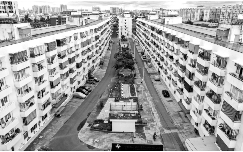
● Một dự án NOXH tại TP HCM.