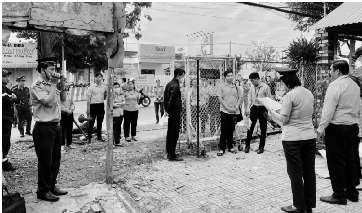
● Một vụ việc cưỡng chế THADS của Chi cục THADS TP Tây Ninh, tỉnh Tây Ninh (ngày 17/12/2024).

Tuy nhiên, toàn Hệ thống THADS đã khắc phục khó khăn, nỗ lực phấn đấu, đề ra nhiều giải pháp linh hoạt để duy trì tổ chức thi hành án; kết quả THADS vẫn giữ được ổn định, tương đương với cùng kỳ năm 2024, trong đó, kết quả thi hành xong về tiền tăng