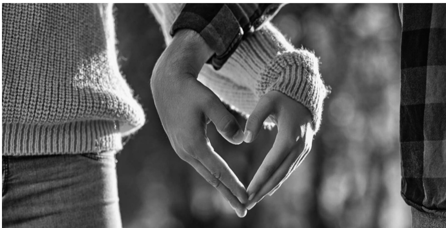
● Cần định hướng cảm xúc tình yêu trách nhiệm, an toàn, lành mạnh cho thế hệ trẻ Việt Nam từ sớm.

Mới gần đây, trong giới ca nhạc, việc cùng lúc có mối quan hệ tình cảm với nhiều người của một số nghệ sĩ trẻ đang khiến cộng đồng bức xúc. Điều này cho thấy cần phải có sự giáo dục, định hướng về cảm xúc tình yêu cho thế hệ trẻ từ khi còn ngồi trên ghế nhà trường.