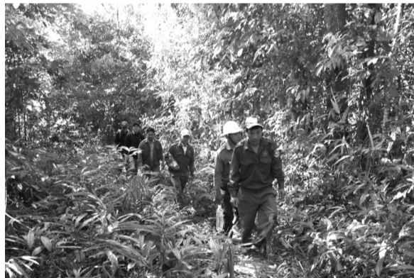
● Lực lượng bảo vệ rừng tuần tra, giám sát tại các khu vực có nguy cơ cháy rừng cao.

Chi cục đã thiết lập Trung tâm giám sát và điều