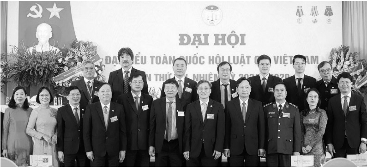
● Tập thể Ban Thường vụ Hội Luật gia khóa XIV nhiệm kỳ 2024 - 2029. (Ảnh chụp tại Đại hội Đại biểu Hội Luật gia Việt Nam khóa XIV ngày 14/1/2025)

Với hành trình 70 năm xây dựng và phát triển (4/4/1955 - 4/4/2025), Hội Luật gia Việt Nam (HLGVN) với vị thế là tổ chức chính trị - xã hội - nghề nghiệp hàng đầu trong lĩnh vực pháp luật; quy tụ hơn 102.000 hội viên trên cả nước, bao gồm các luật gia có chuyên môn sâu rộng, đã và đang công tác tại các cơ quan thuộc các ngành lập pháp, hành pháp, tư pháp, an ninh, quốc phòng, kinh tế - xã hội... Đây chính là nguồn lực quý giá, giúp Hội không ngừng phát triển, hoàn thành xuất sắc nhiệm vụ, góp phần quan trọng vào quá trình hoàn thiện thể chế pháp luật, xây dựng Nhà nước pháp quyền trong kỷ nguyên mới.