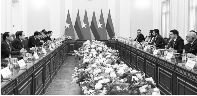
● Chủ tịch QH Trần Thanh Mẫn hội đàm với Chủ tịch QH Armenia Alen Simonyan.

Khẳng định hai nước còn nhiều tiềm năng và dư địa để thúc đẩy hợp tác trong các lĩnh vực văn hóa, du lịch, giáo dục - đào tạo, giao thông - vận tải, hợp tác địa phương và giao lưu nhân