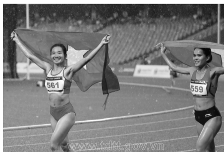
● Ảnh minh họa: (Cục TDTT)

Vậy nền tảng dữ liệu lớn (bigdata) và ứng dụng công nghệ đóng vai trò như thế nào trong chuyển đổi số của ngành TDTT,