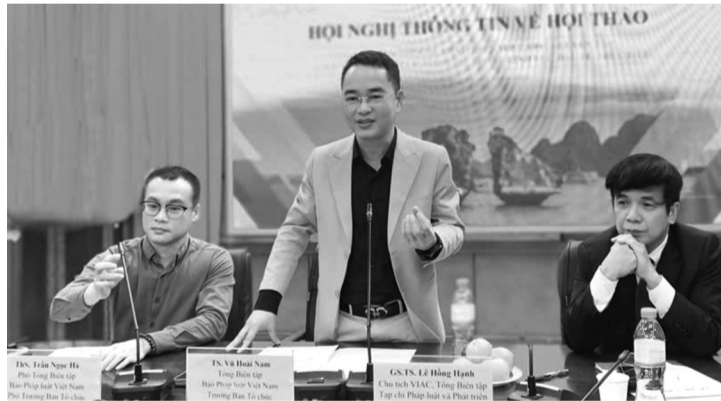
● Báo Pháp luật Việt Nam và Tạp chí Pháp luật và Phát triển đã cung cấp nhiều thông tin về Hội thảo đến các cơ quan báo chí.

Hội thảo đồng thời tìm cách xác định những yêu cầu phổ quát quốc tế và yêu cầu đặc thù do bối cảnh Việt Nam mà nguyên tắc “lợi ích hài hòa, rủi ro chia sẻ” đặt ra gắn với thể chế hiện hành và việc hoàn thiện trong tương lai, nhận diện các giải pháp có khả năng thúc đẩy nguyên tắc “lợi ích hài hòa, rủi ro chia sẻ” trở thành động lực thu hút đầu tư phát triển đất nước.