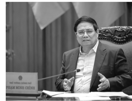
● Thủ tướng yêu cầu đề xuất xây dựng mô hình trung tâm tài chính quốc tế phù hợp với tình hình và điều kiện phát triển Việt Nam.