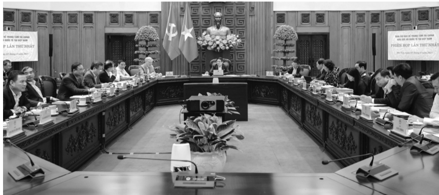
● Ban Chỉ đạo thảo luận, cho ý kiến về việc xây dựng Nghị quyết của Quốc hội về trung tâm tài chính khu vực và quốc tế tại Việt Nam.