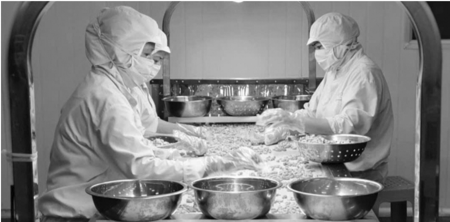
● Các doanh nghiệp điều lập tức điều chỉnh kế hoạch xuất khẩu, trong đó quan tâm thị trường Trung Đông. (Ảnh minh họa)

Rạng sáng 9/4 (khoảng 11h theo giờ Việt Nam), các khoản thuế đối ứng mà Tổng thống Mỹ Donald Trump áp đặt lên hàng nhiều quốc gia, trong đó có Việt Nam chính thức có hiệu lực. Nhiều doanh nghiệp (DN) Việt đang “loay hoay vật lộn” tìm hướng đi mới.