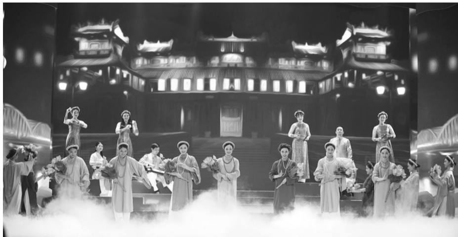
● Việt Nam cần có chiến lược rõ ràng, cơ chế, chính sách hỗ trợ, phát triển văn hóa.