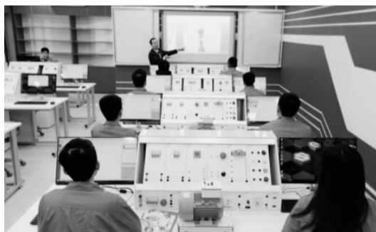
● Đến năm 2026, khoảng 40% lao động sẽ phải chuyển đổi kỹ năng để thích nghi với công nghệ mới. (Hình minh họa)

Nếu không hành động kịp thời, Đông Nam Bộ có thể bỏ lỡ cơ hội vươn lên trở thành trung tâm kinh tế, công nghệ, dịch vụ hiện đại hàng đầu cả nước. Ngược lại, nếu đi đúng hướng, vùng có thể là hình mẫu trong phát triển nguồn nhân lực chất lượng cao, góp phần quan trọng tạo ra những đột phá về tăng trưởng kinh tế, nâng cao năng lực cạnh tranh quốc gia. DUY KHƯƠNG