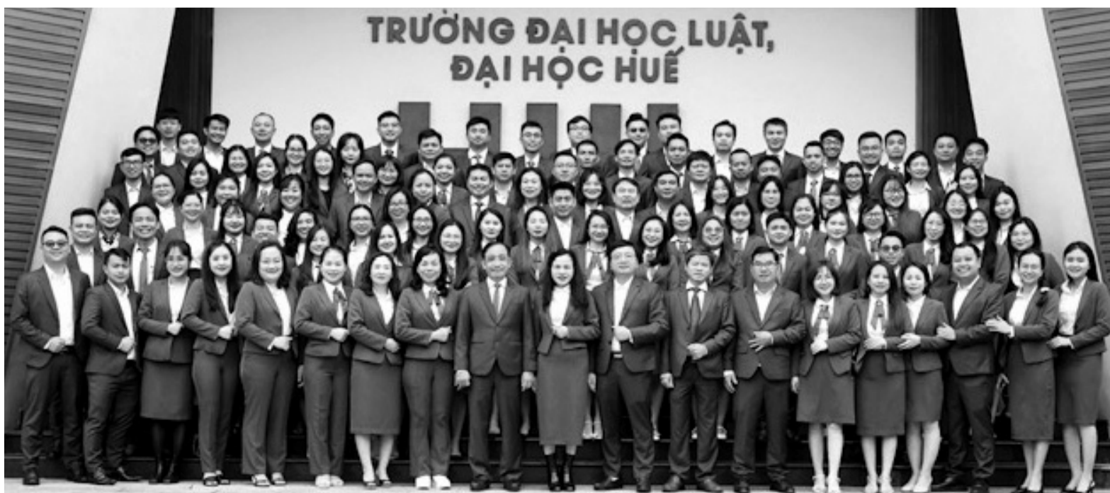
● Tập thể cán bộ, viên chức, lao động Trường Đại học Luật, Đại học Huế.

Phát huy những thành quả đã đạt được, đội ngũ cán bộ, viên chức, lao động Trường Đại học Luật Huế tiếp tục đoàn kết tạo nên sức mạnh, quyết tâm trở thành một trong những cơ sở giáo dục đại học uy tín, thương hiệu quốc tế, có vị thế trong và ngoài nước - đây chính là sứ mệnh của nhà trường để góp phần phục vụ trực tiếp cho sự phát triển của đất nước. QUANG TÂM