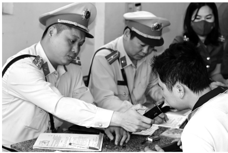
● Lực lượng chức năng lập biên bản với một trường hợp vi phạm.

Tại tuyến đường Nguyễn Bình Khiêm, một trong những "điểm nóng" về vận tải, lực lượng CSGT đã kiểm tra hơn 60 lái xe, bao gồm