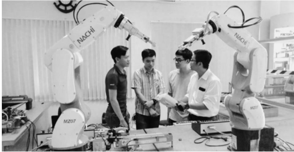
● Nhiều chuyên gia kiến nghị cần xây dựng hệ thống đào tạo liên kết giữa trường đại học, doanh nghiệp và chính quyền. (Hình minh họa)

Ngoài ra, các địa phương cần chú trọng đến hình thức đào tạo linh hoạt như học trực tuyến kết hợp thực tiễn, lý thuyết kết hợp thực hành, mô hình đại học chia sẻ, đào tạo