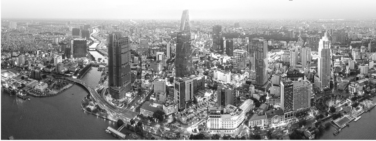
● Nhiều bản thảo về mô hình quản lý TTTCQT. (Ảnh minh họa)

Việc thay đổi hình thái của Trung tâm tài chính quốc tế (TTTCQT) theo cập nhật mới nhất đã đẩy lên những bản thảo về mô hình quản lý cũng như các vấn đề liên quan đến quản lý tại TTTCQT.