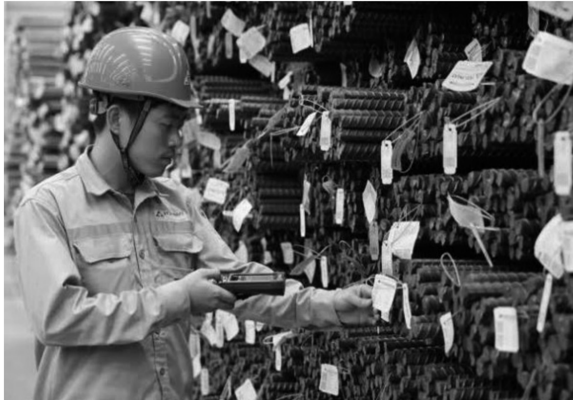
● Cán chú trọng bảo vệ quyền sở hữu trí tuệ, bảo đảm doanh nghiệp có thể bảo vệ sáng tạo của mình và ngăn chặn hành vi xâm phạm quyền lợi. (Ảnh minh họa)