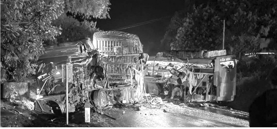
● Hiện trường vụ tai nạn tại Sơn La làm 6 người chết và 9 người bị thương.

Thời gian gần đây, một số vụ tai nạn giao thông nghiêm trọng xảy ra trên các tuyến đường đèo, núi quanh co, hiểm trở, cho thấy cần sớm triển khai những giải pháp cấp bách, hiệu quả nhằm giảm thiểu tai nạn giao thông tại khu vực này.