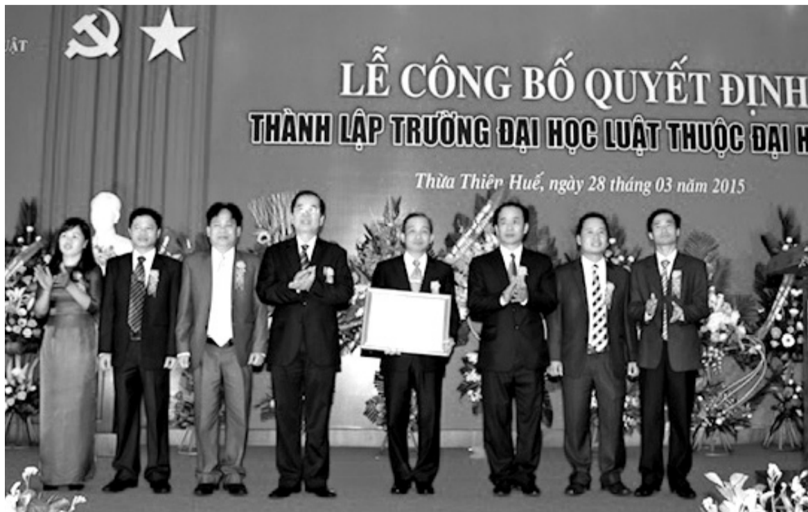
● Lễ công bố Quyết định thành lập Trường Đại học Luật, Đại học Huế (năm 2015).

Trường hiện có đội ngũ cán bộ quản lý với năng lực và chuyên môn cao, đáp ứng tốt yêu cầu nhiệm vụ. Nhà trường cũng tạo điều kiện thuận lợi để giảng viên nâng cao trình độ chuyên môn tại các cơ sở đào tạo danh tiếng trong và ngoài nước. Nhờ