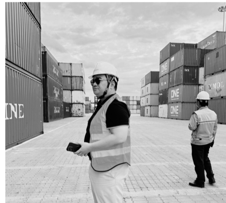
● Với tiềm năng lớn về logistics, hàng không, du lịch, thương mại dịch vụ khu vực Đông Nam Bộ cần nhân lực công nghệ cao, quản trị hiện đại, ngoại ngữ và tác phong chuyên nghiệp để bắt kịp tốc độ phát triển kinh tế số. (Hình minh họa)

phương cần tăng cường sự tham gia của người dân và doanh nghiệp trong việc đánh giá hiệu quả phục vụ của bộ máy công quyền. Các chỉ số như SIPAS, PAPI... cần được xem là công cụ phản ánh trung thực chất lượng nhân sự, từ đó điều chỉnh chính sách phù hợp hơn với thực tiễn.