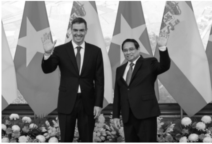
● Thủ tướng Phạm Minh Chính và Thủ tướng Tây Ban Nha Pedro Sánchez.

Thủ tướng Phạm Minh Chính khẳng định Việt Nam đang tập trung cao vào việc đa dạng hóa thị trường, nhất là các thị trường tiềm năng, đa dạng hóa các sản phẩm và các chuỗi cung ứng. Điều này cũng đặt ra yêu cầu đối với các doanh nghiệp trong nước, nước ngoài cần phải nâng cao năng suất và chất lượng sản