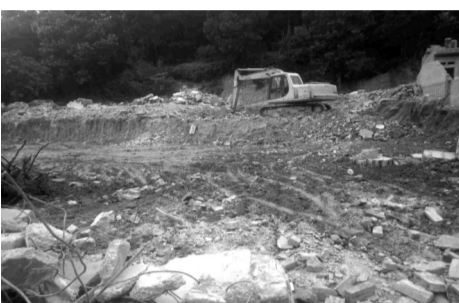
● Hiện trường một vụ nghi vấn khai thác đất rừng trái phép ở Sóc Sơn.

Sở NN&MT được giao phối hợp cùng các huyện, TX có rừng triển khai đồng bộ các giải pháp, nhằm nâng cao hiệu quả quản lý đất và tài nguyên rừng. Trong đó, Chi cục Kiểm lâm giữ vai trò chủ trì, tích cực tham mưu cho chính quyền các cấp và đẩy mạnh ứng dụng công nghệ cao trong công tác giám sát, bảo vệ rừng.