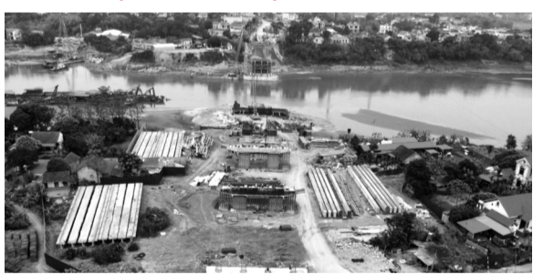
● Một góc công trường cầu Phong Châu.

Cầu được thi công bằng dầm bê tông cốt thép và bê tông cốt thép dự ứng lực. Phần cầu chính gồm 3 nhịp dầm liên tục, thi công theo phương pháp đúc hẫng cân bằng. Mố, trụ cầu sử dụng kết cấu bê tông cốt thép, móng cọc khoan nhồi. Đoạn đường dẫn hai đầu cầu được thiết kế theo tiêu chuẩn đường cấp III đồng bằng, vận tốc thiết kế 80km/h.