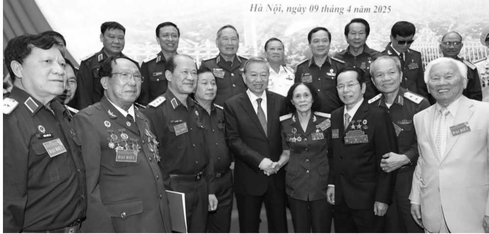
● Tổng Bí thư Tô Lâm với các đại biểu.

Tổng Bí thư Tô Lâm khẳng định, những ngày này cách đây 50 năm, với tinh thần: “Thần tốc, thần tốc hơn nữa, táo bạo, táo bạo hơn nữa”, dưới sự lãnh đạo của Đảng, Quân