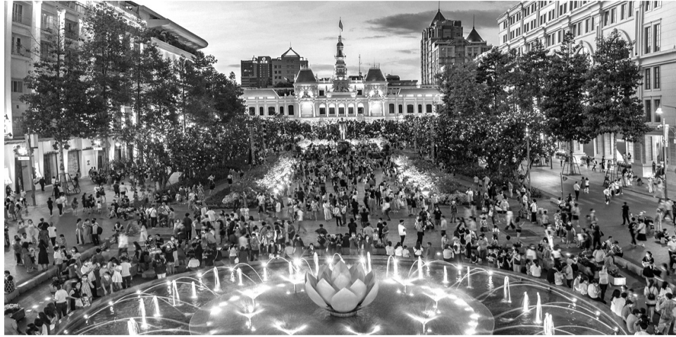
● TP Hồ Chí Minh sẽ được phát triển thành Trung tâm tài chính quốc tế.

Để có thể triển khai nhiệm vụ đặt ra, chúng ta rất cần có những cơ chế, chính sách đột phá, vượt trội nhằm xây dựng TTTCQT