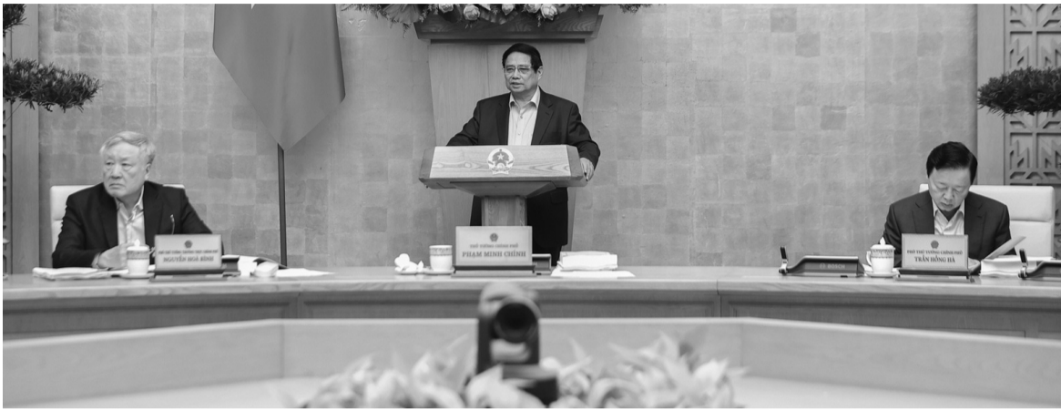
● Thủ tướng Phạm Minh Chính phát biểu kết luận phiên chuyên đề của Chính phủ về xây dựng pháp luật tháng 4/2025.