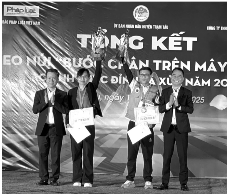
● Đại diện BTC trao cúp cho các nhà vô địch.