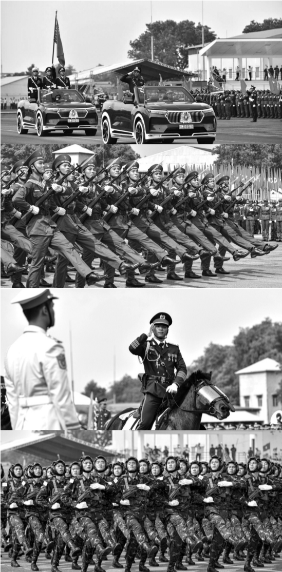
● Buổi tổng hợp luyện đấu tiên tại Trung đoàn Không quân 935 (Biên Hòa, tỉnh Đồng Nai).

cứu hỏa, nhà vệ sinh di động, trạm điện chính và trung tâm kỹ thuật.