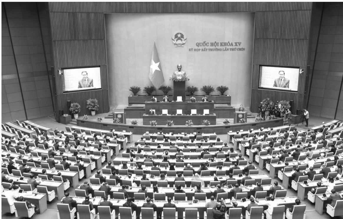
● Một trong những nội dung đặc biệt quan trọng của Kỳ họp bất thường lần thứ 9, Quốc hội khóa XV là tìm cách xử lý những “điểm nghẽn” về thể chế để bộ máy chính trị tinh gọn, hoạt động hiệu quả hơn. (Ảnh: quochoi.vn)

Tiếp đó, tháng 10/2017, Hội nghị lần thứ sáu Ban Chấp hành Trung ương khóa XII ban hành Nghị quyết số 18-NQ/TW về “Một số vấn đề về tiếp tục đổi mới, sắp xếp tổ chức bộ máy của hệ thống chính trị tinh gọn, hoạt động hiệu lực, hiệu quả” (Nghị quyết 18-NQ/TW). Một trong những mục tiêu cụ thể mà Nghị quyết hướng tới là từ năm 2021 đến năm 2030, phân định rõ chức năng, nhiệm vụ, quyền hạn của từng cơ quan, tổ chức, khắc phục được tình trạng chồng chéo, trùng lặp hoặc bỏ sót chức năng, nhiệm vụ giữa các cơ quan, tổ chức