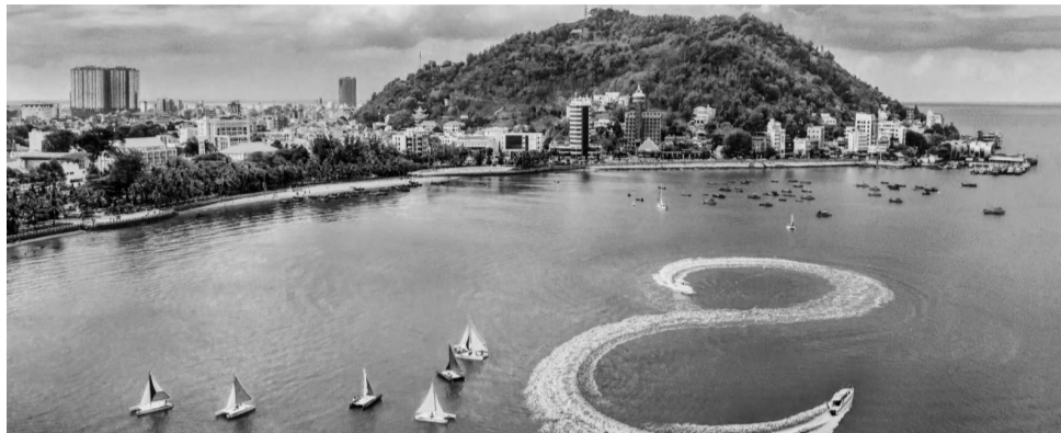
● Vùng Đông Nam Bộ từ lâu đã là đầu tàu phát triển kinh tế của cả nước.

Quy hoạch vùng Đông Nam Bộ mở ra một tầm nhìn chiến lược nhằm đưa khu vực trở thành trung tâm kinh tế năng động hàng đầu Đông Nam Á, thông qua tái cấu trúc không gian phát triển và mở rộng các đô thị chiến lược.