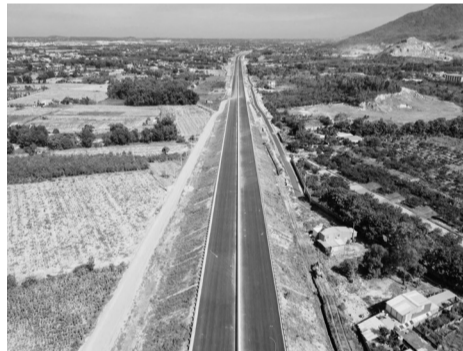
● Đồng Nai tích cực đẩy nhanh tiến độ giải phóng mặt bằng cao tốc Biên Hòa - Vũng Tàu, đây là công trình giao thông trọng điểm, kết nối vùng Đông Nam Bộ.

nông, thương, logistics, gắn với hành lang kinh tế Tây Nguyên và Campuchia.