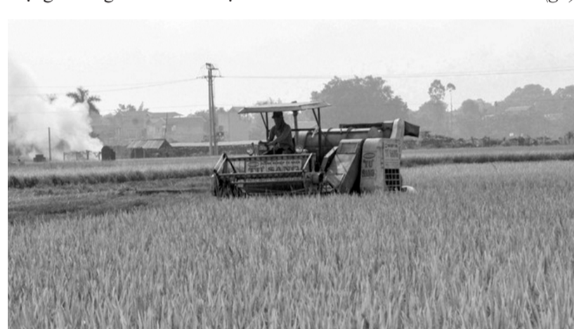
● Tên gọi “loại đất 03” chỉ gắn với đất nông nghiệp trên địa bàn tỉnh Hải Hưng cũ, nay là tỉnh Hưng Yên và tỉnh Hải Dương. (Ảnh minh họa: VGP)

Từ Nghị quyết này, các hộ gia đình trên địa bàn tỉnh Hải Hưng được giao đất ruộng ổn định lâu dài phục vụ sản xuất nông nghiệp. Tên gọi “loại đất 03” hay “ruộng 03” là cách gọi “tắt”, gọi kiểu “dân gian”, đặt tên gọi để gợi nhớ đến nguồn gốc văn bản của Ban Thường vụ Tỉnh ủy Hải Hưng chủ trương giao ruộng cho người dân trên địa bàn.