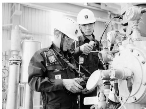
● Cụm Đông Nam Bộ được kỳ vọng trở thành cụm động lực kinh tế lớn nhất cả nước với các ngành nghề từ sản xuất, chế biến, công nghệ cao, logistics đến xuất khẩu.

Đây không chỉ là quyết sách đột phá về quản trị không gian, mà còn là đòn bẩy điều phối chính sách phát triển liên vùng, giảm chong lán quy hoạch, tối ưu nguồn lực đầu tư và thúc đẩy hình thành các chuỗi giá trị hoàn chỉnh, từ sản xuất, chế biến, logistics đến xuất khẩu. Hành lang kinh tế TP HCM - Bình Dương - Đồng Nai - Bà Rịa - Vũng Tàu được kỳ vọng trở thành cụm động lực kinh tế lớn nhất cả nước, trực tiếp kết nối với hệ thống cảng biển, sân bay, đường bộ, đường sắt và đường thủy quốc tế.