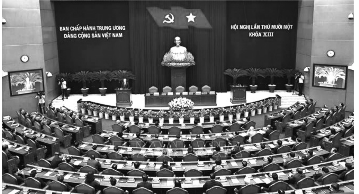
● Phiên bế mạc Hội nghị lần thứ 11 Ban Chấp hành Trung ương Đảng khóa XIII.

“Có thể khẳng định Hội nghị Trung ương 11 khóa XIII đã hoàn thành toàn bộ nội dung, chương trình đề ra. Rất nhiều đồng chí Trung ương đề nghị Bộ Chính trị ghi nhận đây là Hội nghị lịch sử, bàn về những quyết sách lịch sử trong giai đoạn cách mạng mới của nước ta” - Tổng Bí thư Tô Lâm nhấn mạnh khi phát biểu bế mạc Hội nghị lần thứ 11 Ban Chấp hành Trung ương Đảng khóa XIII diễn ra chiều 12/4.