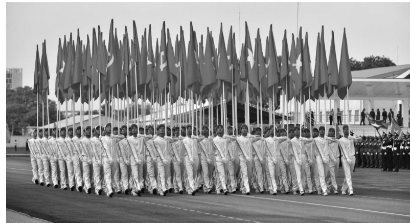
● Khởi cờ Đàng, cờ Tổ quốc tiến về lễ đài trong buổi họp luyện sáng 11/4.

Cùng với đó là một số điểm bắn trên xà lan tại khu vực Rạch Chiếc; khu vực sông Sài Gòn; khu vực Khu đô thị Vạn Phúc, cầu tàu Bến Bạch Đằng.