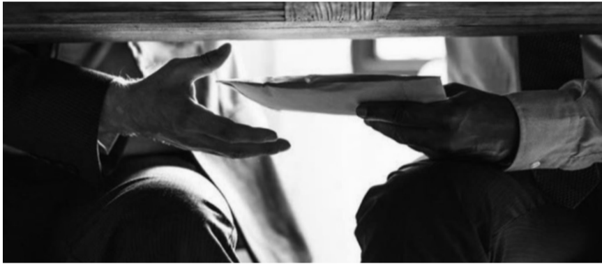
● Bộ Công an kiến nghị bỏ án tử hình đối với 8 tội danh, trong đó có tội Vận chuyển trái phép chất ma túy, tội Tham ô tài sản và tội Nhận hối lộ. (Ảnh minh họa: ITN)

Đặt trong bối cảnh nhiều quốc gia đang từng bước loại bỏ hình phạt tử hình, đề xuất này cho thấy Việt Nam đang cân nhắc điều chỉnh chính sách hình sự theo hướng nhân đạo hơn. Tuy nhiên, nhiều chuyên gia cho rằng, với những loại tội phạm nghiêm trọng, ảnh hưởng sâu đến an ninh xã hội và niềm tin công chúng, việc bỏ tử hình cần được đánh giá thấu đáo về hiệu quả răn đe, khả năng thu hồi tài sản, cũng như năng lực kiểm soát hậu quả trong thực tiễn thi hành pháp luật.