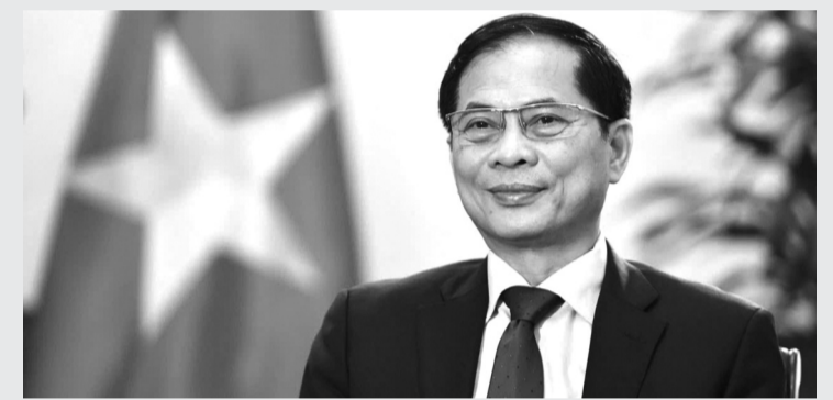
● Phó Thủ tướng, Bộ trưởng Bộ Ngoại giao Bùi Thanh Sơn.

Phó Thủ tướng, Bộ trưởng Ngoại giao Bùi Thanh Sơn cho biết, diễn ra chưa đầy một năm sau chuyến thăm cấp Nhà nước đến Trung Quốc của Tổng Bí thư Tô Lâm, chuyến thăm cấp Nhà nước đến Việt Nam lần này của Tổng Bí thư, Chủ tịch nước Tập Cận Bình là sự kiện chính trị đối ngoại quan trọng của hai Đảng, hai nước, có ý nghĩa chiến lược, tác động lâu dài đến sự phát triển của quan hệ Việt - Trung trong bối cảnh hai nước đều đang bước vào kỷ nguyên mới, thời đại phát triển mới.