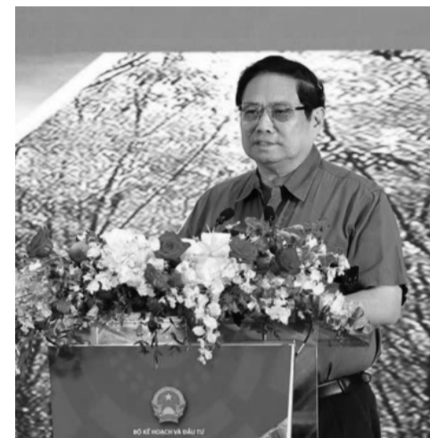
● Thủ tướng Phạm Minh Chính chủ trì Hội nghị lần thứ 5 Hội đồng điều phối vùng Đông Nam Bộ (ngày 02/12/2024).