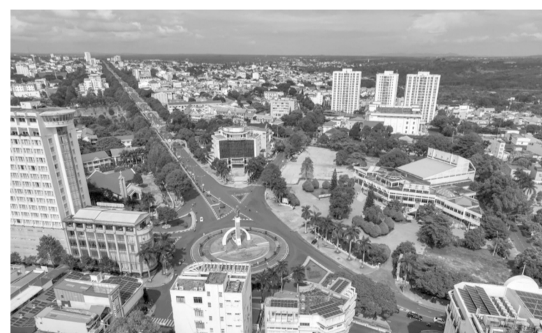
● Quý I/2025, Đắk Lắk dẫn đầu khu vực Tây Nguyên về tỷ lệ giải ngân vốn đầu tư công với gần 20% kế hoạch. (Một góc thành phố Buôn Ma Thuột)

nhiều giải pháp quyết liệt trong đó có việc thành lập 4 tổ công tác kiểm tra, đôn đốc, tháo gỡ khó khăn, vướng mắc trong giải ngân vốn đầu tư công và thu ngân sách nhà nước năm 2025 trên địa bàn. Các Tổ công tác sẽ triển khai kiểm tra định kỳ từ ngày 10 đến ngày 25 hàng tháng. Kết quả kiểm tra cùng các đề xuất giải