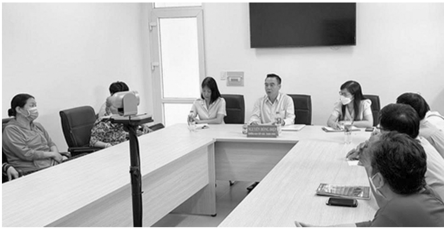
● Một buổi tiếp công dân tại TP Hồ Chí Minh.