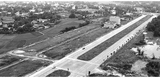
● Dự án đường Thăng Lợi kéo dài TP Sông Công đã thực hiện từ nhiều năm nhưng vẫn dang dở.

Bên cạnh khu trung tâm, TP HCM còn bố trí thêm 22 màn hình led lớn tại các quận, huyện và Thủ Đức, tận dụng cả các màn hình quảng cáo thương mại và hộ dân để truyền hình trực tiếp Lễ kỷ niệm, giúp người dân dễ dàng theo dõi. Ngoài ra, buổi lễ cũng sẽ được phát sóng trực tiếp trên truyền hình và nhiều nền tảng khác. BÙI YÊN