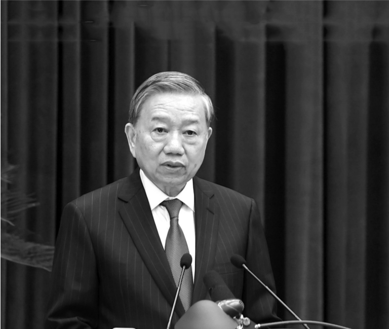
● Tổng Bí thư Tô Lâm phát biểu bế mạc Hội nghị lần thứ 11 Ban Chấp hành Trung ương Đảng khóa XIII.