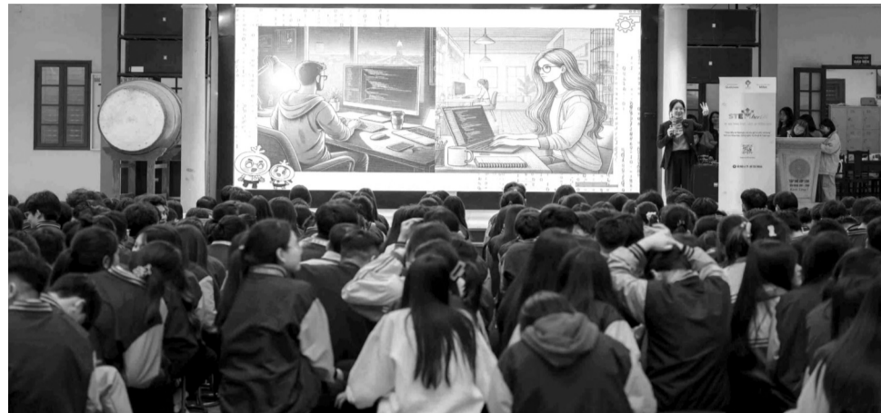
● Dự án STEMherVN là một điểm sáng trong nỗ lực thu hẹp khoảng cách giới trong lĩnh vực STEM tại Việt Nam.

Mới đây, tại sự kiện truyền thông “Nữ giới trong STEM - Sáng tạo không kém”, gần 200 nữ sinh từ các trường THPT và cao đẳng tại TP HCM đã tham gia chuỗi hoạt động khám phá, học hỏi và kết nối với những người truyền cảm hứng - từ sinh viên đại học đến các chuyên gia doanh nghiệp. Qua đó, các em không chỉ được “nghe để biết”, mà còn “trải nghiệm để tin”