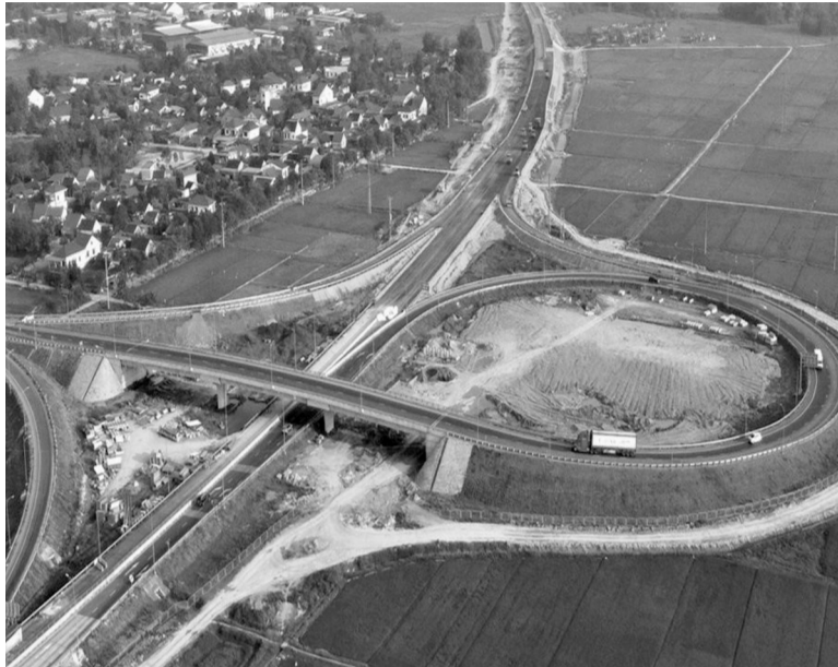
● Các nhà thầu tăng ca, tăng kíp để kịp tiến độ cam kết.