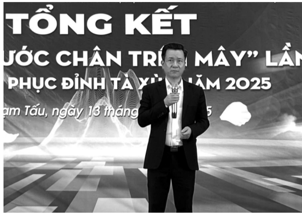
● Chủ tịch UBND huyện Trạm Tấu phát biểu tại lễ Tổng kết.