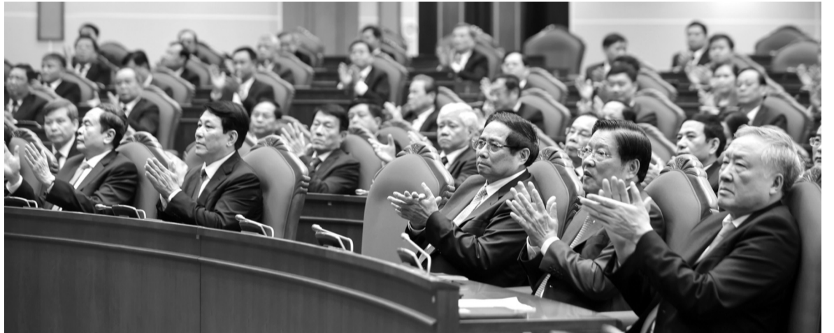
● Sau ba ngày làm việc khẩn trương với tinh thần trách nhiệm cao, Hội nghị lần thứ 11 BCH Trung ương Đảng khóa XIII đã hoàn thành toàn bộ nội dung chương trình đề ra.

“Về nhân sự: Nhiều đồng chí băn khoăn vấn đề sắp xếp nhân sự khi sáp nhập, hợp nhất và sắp xếp nhân sự Đại hội. Các cơ quan Trung ương sẽ có hướng dẫn cụ thể về tiêu chí, tiêu chuẩn. Tôi đề nghị phải lấy tiêu chuẩn cao nhất là vì yêu cầu công việc, sau đó mới đến các tiêu chí khác. Ban Thường vụ cấp tỉnh (có sáp nhập, hợp nhất) phải bàn kỹ với nhau về vấn đề này, tạo sự thống nhất cao trong thực hiện, nhất là bố trí người đứng đầu các cơ quan sau khi sáp nhập” - Tổng Bí thư Tô Lâm yêu cầu.