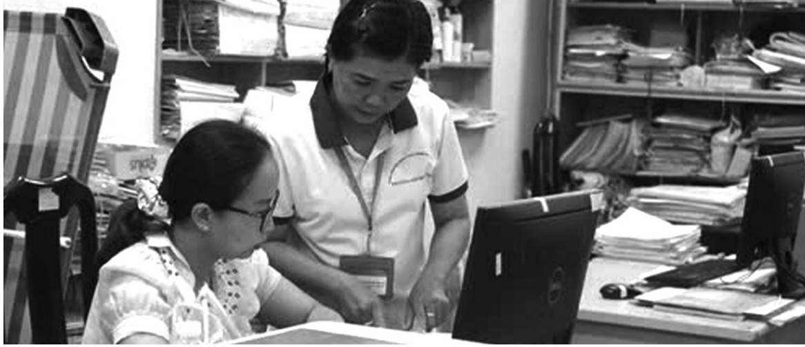
● Dự thảo Nghị quyết thể hiện chế độ đãi ngộ tương xứng với vị trí việc làm xây dựng pháp luật và nhiệm vụ của cán bộ, công chức, viên chức tham gia công tác xây dựng pháp luật. (Ảnh minh họa)

Thông báo số 108-TB/VPTW ngày 18/11/2024 của Văn phòng Trung ương Đảng về Kết luận của đồng chí Tổng Bí thư Tô Lâm tại buổi làm việc với Ban Cán sự Đảng Bộ Tư pháp nêu rõ: "Tăng nguồn lực đầu tư, có cơ chế tài chính đặc thù cho công tác xây dựng chính sách, xây dựng pháp luật, đáp ứng yêu cầu nhiệm vụ chính trị ngày càng cao trong kỷ nguyên mới; hiện đại hóa môi trường và điều kiện làm việc để đội ngũ cán bộ, công chức tham mưu xây dựng pháp luật yên tâm công tác, tận tụy cống hiến cho sự nghiệp chung. Có cơ chế phù hợp thu hút nhân lực chất lượng cao cho công tác xây dựng pháp luật. Đẩy mạnh chuyển đổi số trong công tác xây dựng pháp luật và thi hành pháp luật"