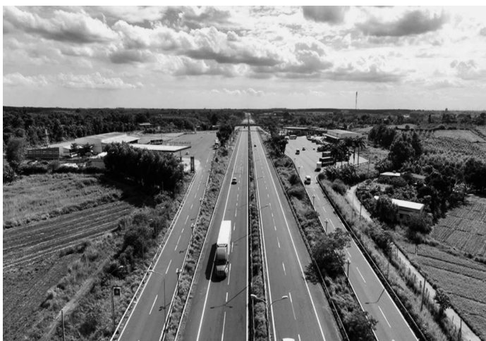
● Đông Nam Bộ cần phát triển nguồn nhân lực chất lượng cao thông qua đào tạo gắn với thị trường.

Việc tái cấu trúc hành chính, phân vai chiến lược và thiết lập thể chế điều phối đủ mạnh sẽ là tiền đề để Đông Nam Bộ vươn lên trở thành vùng kinh tế, tài chính, sáng tạo hàng đầu khu vực châu Á - Thái Bình Dương, hiện thực hóa tầm nhìn đến năm 2050. DUY KHƯƠNG