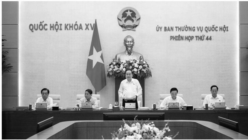
● Chủ tịch Quốc hội cho biết đây là Phiên họp chuẩn bị cho Kỳ họp có nhiệm vụ lập pháp nhiều nhất từ đầu nhiệm kỳ khóa XV.

Bên cạnh những nội dung chính thức đã được đưa vào chương trình, còn rất nhiều nội dung trong chương trình dự phòng cần xem xét để phục vụ sắp xếp tổ chức bộ máy nhà nước, sắp xếp các đơn vị hành chính (ĐVHC), xây dựng mô hình tổ chức chính quyền địa phương 2 cấp; thực hiện yêu cầu của Ban Chỉ đạo Trung ương về phục vụ phát triển khoa học,