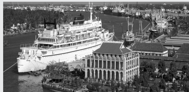
● Một góc TP HCM. (Ảnh: Trường Giang)

Theo ý kiến đề xuất, TP HCM mới sau khi sáp nhập từ TP HCM, Bình Dương, Bà Rịa - Vũng Tàu và một phần của tỉnh Đồng Nai sẽ có diện tích 6.772,65km 2 , dân số khoảng 13,706 triệu người; có quy mô kinh tế lớn nhất cả nước.