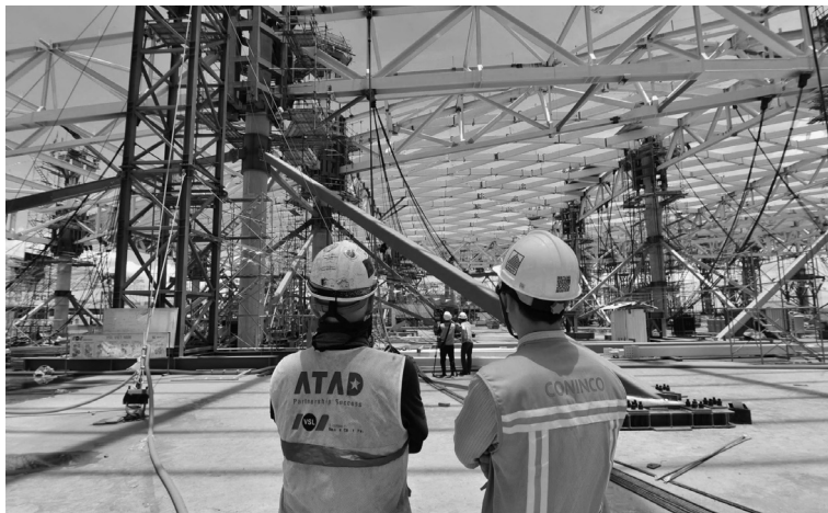
● Hạ tầng là một trong 3 trụ cột chính để vùng Đông Nam Bộ vươn lên trở thành vùng kinh tế, tài chính, sáng tạo hàng đầu khu vực châu Á - Thái Bình Dương.