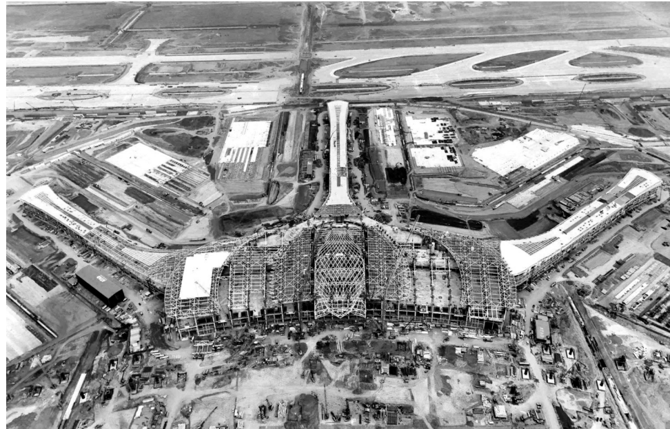
● Sân bay quốc tế Long Thành là một trong những dự án hạ tầng chiến lược đóng vai trò then chốt trong kết nối vùng và hội nhập quốc tế.

Không dừng ở hạ tầng giao thông, Đông Nam Bộ cần đi đầu trong phát triển hạ tầng số, trụ cột mới của nền kinh tế số. Vùng cần đầu tư đồng bộ vào hạ tầng viễn thông, dữ liệu lớn (big data), trung tâm số, trí tuệ nhân tạo (AI), cùng với các nền tảng quản trị đô thị thông minh. Song song là hạ tầng năng lượng, đặc biệt là năng lượng sạch, điện áp cao,