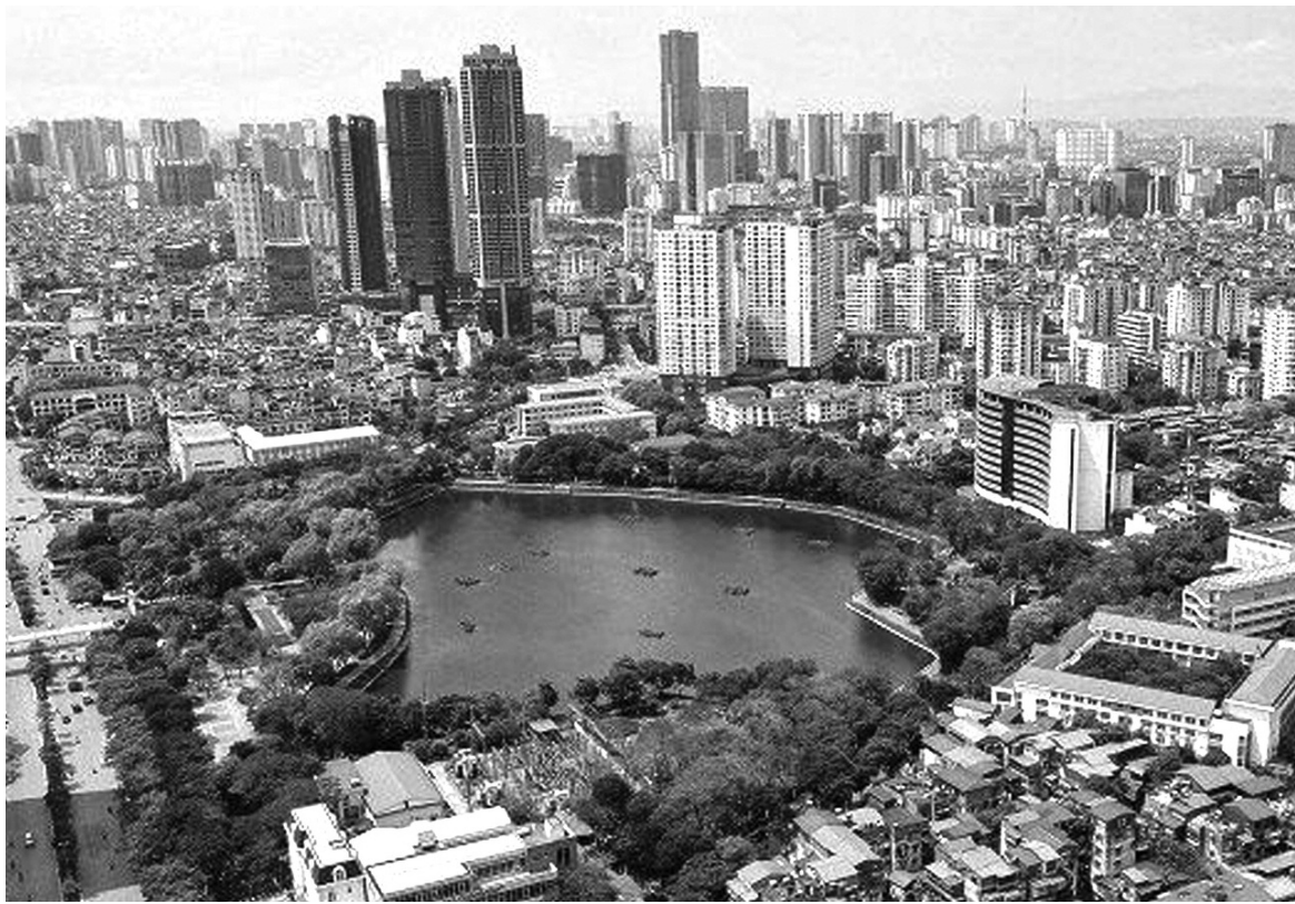
● Sau 17 năm mở rộng địa giới hành chính, Hà Nội luôn duy trì mức tăng trưởng cao, giữ vai trò, vị thế là trung tâm kinh tế của Vùng Đông bằng sông Hồng cũng như cả nước.

Để tháo gỡ kịp thời những vướng mắc trong triển khai thực hiện Kết luận số 126-KL/TW và Kết luận 127-KL/TW, Ban Tổ chức Trung ương, Văn phòng Trung ương Đảng đã tham mưu tổ chức 19 Đoàn kiểm tra của Bộ Chính trị, Ban Bí thư, làm việc với 69 Đảng ủy, tỉnh ủy, thành ủy trực thuộc Trung ương để nắm