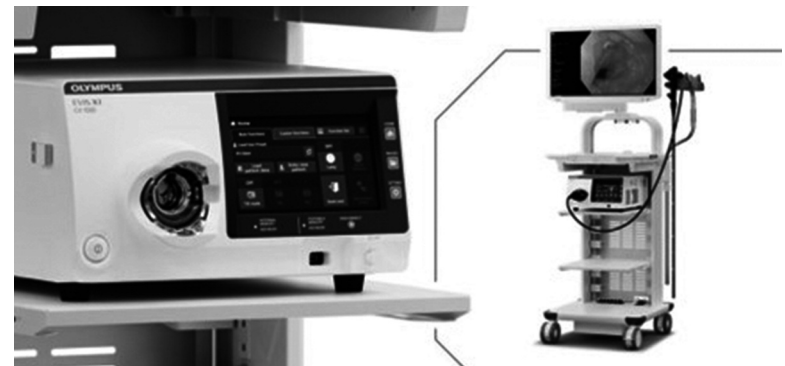
● Máy nội soi Olympus Evis X1 CV1500 giúp phát hiện các ổ viêm loét, tổ chức tiền ung thư từ rất sớm.

Thành công trong điều trị ca bệnh này chính là minh chứng cho hiệu quả vượt trội của kỹ thuật ESD trong việc triệt tiêu ung thư sớm, giúp bệnh nhân