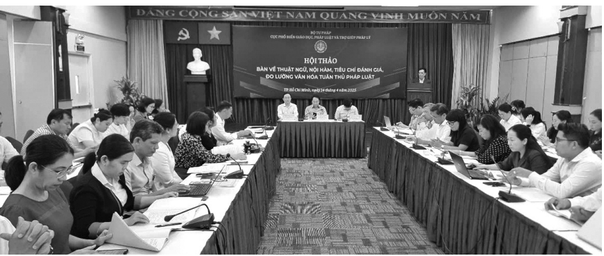
● Hội thảo bàn về “văn hóa tuân thủ pháp luật” do Cục PBGDPL&TGPL tổ chức.

Tại Hội thảo, cũng có ý kiến cho rằng, để tuân thủ pháp luật trở thành một nét văn hóa thì cần hội tụ nhiều yếu tố như: Cần xây dựng hệ thống luật pháp hoàn thiện, công khai, minh bạch, sát thực tế, phù hợp với lợi ích của đại đa số người dân, bảo đảm tính công bằng; tuyên truyền, GDPB kiến thức pháp luật tới mọi tầng lớp nhân dân một cách gần gũi, thiết thực, dễ hiểu, dễ nhớ... Đặc biệt, người dân cũng cần nỗ lực để không ngừng học hỏi để nâng cao nhận thức về pháp luật một cách đầy đủ... .