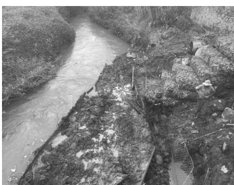
● Dự án kè chống sạt lở, giảm ngập lụt suối Đa Tam cũng đang dừng thi công.

Hai dự án quan trọng tại huyện Đức Trọng (Lâm Đồng) đang gặp khó khăn về giải phóng mặt bằng (GPMB), chênh lệch thông tin địa chất so với thiết kế và nguy cơ đội vốn khiến tiến độ thi công đình trệ.