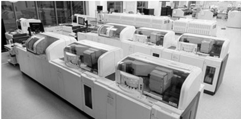
● Hệ thống Labo Xét nghiệm MEDLATEC hiện đại, công nghệ cao được đầu tư ở nhiều chi nhánh trên toàn quốc.

Quý khách hàng có nhu cầu thăm khám, tầm soát các bệnh lý đường tiêu hóa, liên hệ ngay hotline 1900 56 56 56. P.V