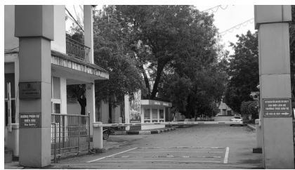
● Công ty CP Nhiệt điện Ninh Bình.

Từ tháng 9/2024 đến nay, hệ thống theo dõi thông số môi trường làm việc