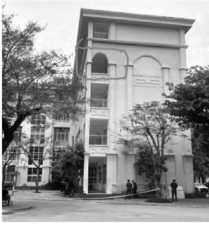
● Thanh lan can kim loại từ tầng 4 rơi xuống sân trường.

viện cho biết, lúc đó là giờ nghỉ giải lao giữa tiết. Các giáo viên đang ở văn phòng bỗng thấy một nữ sinh chạy lên kêu cứu trong tình trạng bị thương vùng đầu, máu chảy nhiều. Thầy cô đã nhanh chóng diu cháu đến trạm xá trường sơ cứu, đồng thời khẩn trương đưa các học sinh bị thương nhập viện. Tai nạn bất ngờ khiến cả trường lo lắng tập trung cấp cứu cho các em.