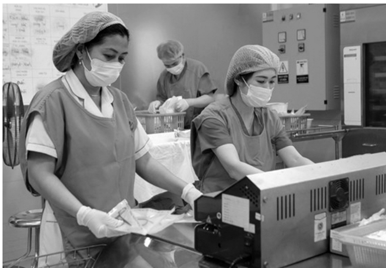
● Kiểm soát tốt nhiễm khuẩn sẽ bảo đảm năng lực ứng phó của hệ thống y tế. (Ảnh minh họa.)

Là bệnh viện (BV) đa khoa Trung ương hạng đặc biệt của Bộ Y tế và là tuyến cuối phía Nam, BV Chợ Rẫy thường xuyên tiếp nhận các ca bệnh nặng, đặc biệt là những ca bệnh kháng thuốc, đa kháng thuốc từ cộng đồng và tuyến dưới chuyên đến. Tại đây, trung bình mỗi tháng có 480 ca nhiễm khuẩn Gr(-) đa kháng khó điều trị và khoảng 200 ca nhiễm khuẩn Gr(+) kháng thuốc, với nguyên nhân chủ yếu là do nhiễm khuẩn cộng đồng gây ra. Tuy nhiên, ngoài nguồn nhiễm khuẩn từ cộng đồng và BV tuyến dưới, BV Chợ Rẫy cũng xác định bệnh nhân có nguy cơ nhiễm khuẩn ngay tại BV.