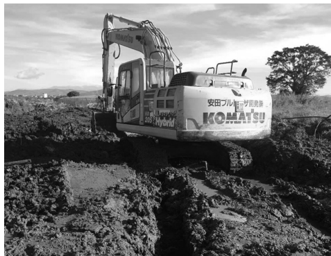
● Dự án thi công xây dựng cống thoát nước hạ lưu khu vực trung tâm huyện Đức Trọng đang tạm dừng thi công.