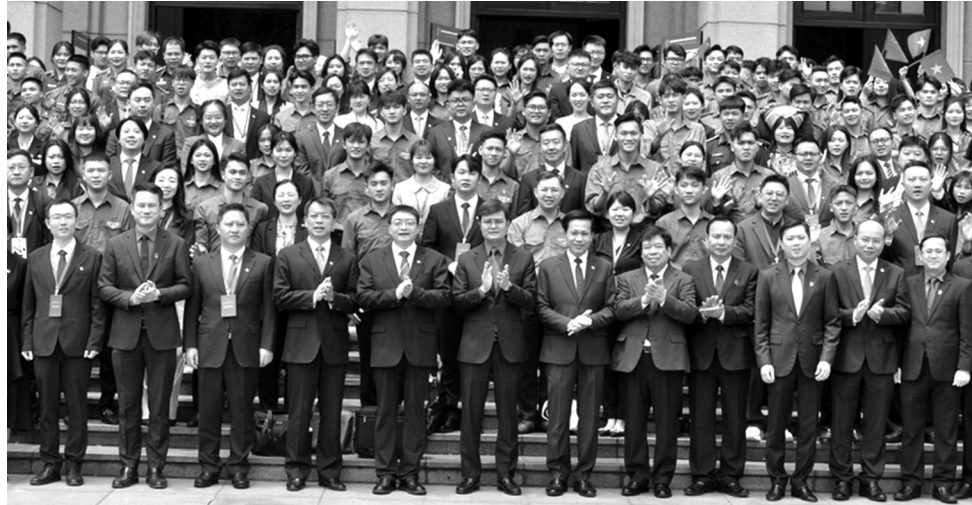
● Các đại biểu chụp ảnh lưu niệm tại chương trình.

Nhận thức sâu sắc điều đó, nhiều năm qua, tổ chức Đoàn Thanh niên hai nước đã thúc đẩy hợp tác thanh niên Việt Nam - Trung Quốc phát triển mạnh mẽ và đạt được nhiều kết quả. Các chương trình đào tạo, giao lưu thanh niên, các diễn đàn hợp tác thanh niên đã tạo cơ hội cho hàng nghìn thanh niên hai nước hiểu rõ hơn về văn hóa, truyền thống và phong tục của nhau. Điều này không chỉ giúp củng cố tình hữu