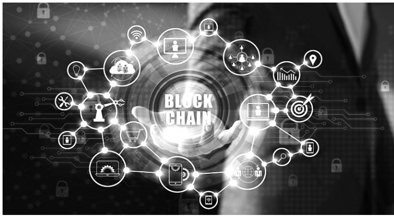
● Có chuyên gia khuyến nghị Việt Nam xây dựng thị trường chứng khoán phi tập trung sử dụng công nghệ blockchain. (Ảnh minh họa: vneconomy.vn)

Chiến lược phát triển kinh tế - xã hội 10 năm 2021 - 2030 được Đại hội XIII của Đảng thông qua đã giao nhiệm vụ: "Thúc đẩy phát triển TP Hồ Chí Minh trở thành Trung tâm tài chính quốc tế (TTTCQT)".