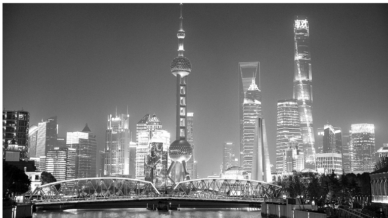
● Khung cảnh về đêm của Trung tâm tài chính Thượng Hải.

Thượng Hải - cái nôi của ngành công nghiệp tài chính hiện đại của Trung Quốc, đang khẳng định tên tuổi của mình là một trong những trung tâm tài chính quốc tế (TTTCQT) top 10 thế giới. Năm 2024, tổng doanh thu của thị trường tài chính Thượng Hải đạt 3.650 nghìn tỷ nhân dân tệ, tăng 8,2% so với cùng kỳ năm trước.