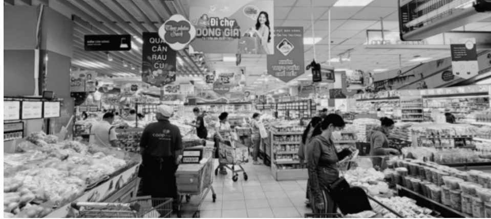
● Đẩy mạnh tiêu dùng nội địa để đạt mục tiêu tăng trưởng năm 2025.

Ngân hàng Nhà nước (NHNN) cũng đang tích cực gỡ vướng để đưa nguồn vốn vào nền kinh tế mạnh hơn. Trong đó, quyết liệt và tích cực chỉ đạo gia tăng các gói tín dụng mang lại hiệu quả cao, vào các lĩnh vực ưu tiên như gói tín dụng cho thủy sản. Gói tín dụng này đã liên tục được các ngân