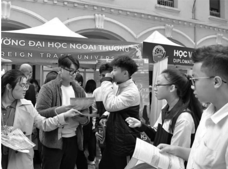
● Học sinh lớp 12 trong Ngày hội tuyển sinh.

Thí sinh là học sinh lớp 12 thực hiện khai thông tin đăng ký dự thi trực tuyến theo tài khoản