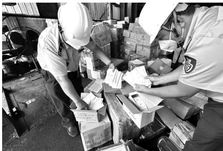
● Lực lượng QLTT TP HCM kiểm tra nguồn gốc, xuất xứ hàng hóa của một cơ sở.

Để tiếp tục ngăn chặn vấn nạn hàng giả, hàng kém chất lượng, đặc biệt là mặt hàng sữa nói riêng và các mặt hàng thực phẩm nói chung, trong thời gian tới, Chi cục QLTT tăng cường giám sát, kiểm tra, kiểm soát thị trường.