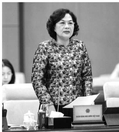
● Thống đốc Ngân hàng Nhà nước Việt Nam Nguyễn Thị Hồng trình bày Tờ trình.

Việc xây dựng dự án Luật sửa đổi, bổ sung một số điều của Luật các TCTD được thực hiện theo quan điểm thể chế hóa các quan điểm, chủ trương, đường lối của Đảng, pháp luật của Nhà nước đối với công tác xử lý nợ xấu. Bảo đảm tính hợp hiến, hợp pháp, tính thống nhất với các văn bản quy phạm pháp luật có liên quan. Tiếp tục luật hóa các quy định tại Nghị quyết số 42 đã phát huy tốt hiệu quả trong quá trình Nghị quyết có hiệu lực.