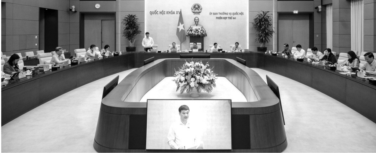
● Quang cảnh Phiên họp ngày 24/4.

Ngày 24/4, tiếp tục chương trình Phiên họp thứ 44, Ủy ban Thường vụ Quốc hội (UBTVQH) cho ý kiến về dự án Luật sửa đổi, bổ sung một số điều của Luật Các tổ chức tín dụng (TCTD).