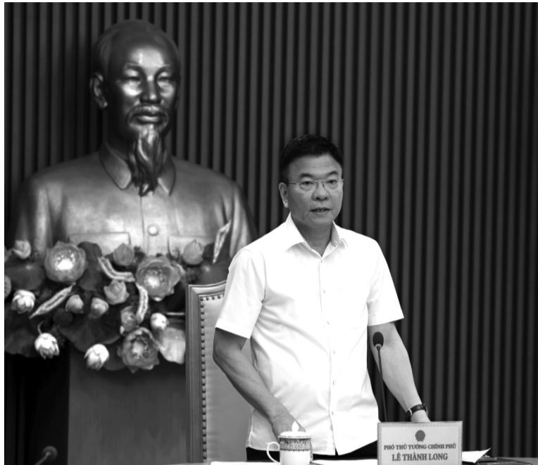
● Phó Thủ tướng Lê Thành Long đề nghị phấn đấu giải ngân 100% vốn đầu tư công năm 2025 - năm diễn ra nhiều sự kiện, lễ kỷ niệm lớn của đất nước.

Với tinh thần chung đó, Phó Thủ tướng Lê Thành Long đề nghị các Bộ, ngành, cơ quan, địa phương tập trung cao độ, phấn