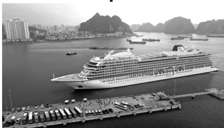
● Dự kiến năm 2025 sẽ có khoảng 60 chuyến tàu biển từ nhiều quốc gia đến Quảng Ninh.

Những chương trình đặc sắc mà khách du lịch không thể bỏ lỡ khi đến với Quảng Ninh năm nay phải kể đến Chương trình Carnival Hạ Long 2025, Lễ hội truyền thống Bạch Đằng, Ngày hội văn hóa các dân tộc tỉnh Quảng Ninh năm 2025, Giải Aqua Warriors Ha-Long Bay 2025, Hội chợ OCOP Quảng Ninh hè 2025, Lễ hội điều bay có động cơ và dù lượn, Liên hoan lân sư rồng... Ngoài ra, quý III, IV/2025 diễn ra Tuần Du lịch