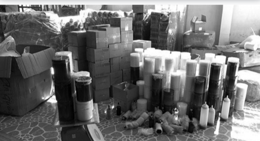
● Mỹ phẩm không có nguồn gốc, xuất xứ bị lực lượng chức năng phát hiện.

Chỉ được phép đưa mỹ phẩm ra lưu thông khi đã được cơ quan quản lý nhà nước có thẩm quyền cấp số tiếp nhận phiếu công bố sản phẩm mỹ phẩm và phải hoàn toàn chịu trách nhiệm về tính an toàn, chất lượng và hiệu quả sản phẩm.