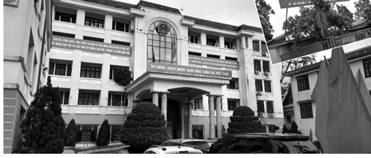
●Trụ sở UBND huyện Thanh Trì.

Liên quan đến sự việc bị phản ánh “làm giả chữ ký, chữ viết trong hợp đồng chuyển nhượng sử dụng đất (SDĐ)” tại bãi Tân Bồi 3, xã Vạn Phúc, huyện Thanh Trì, TP Hà Nội, đại diện UBND huyện cho biết vụ việc là tranh chấp dân sự.