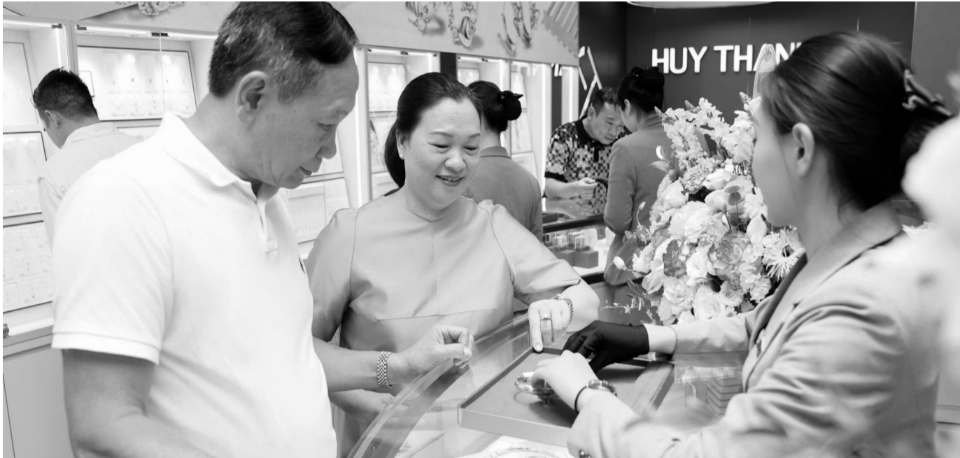
● Ở Việt Nam, tâm lý “chuộng vàng” trong dân còn khá phổ biến. (Ảnh: ĐVCC)

Cần nâng cao năng lực cho thị trường tài chính - ngân hàng, tạo thêm kênh đầu tư hấp dẫn, minh bạch; đồng thời tuyên truyền để người dân hiểu: đầu tư vào sản xuất, vào hoạt động doanh nghiệp mới là con đường phát triển bền vững, ổn định, qua đó giảm bớt tình trạng “vàng hóa” trong dân.