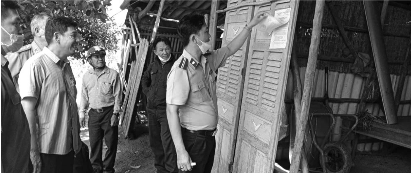
● Chấp hành viên Cục THADS tỉnh Long An làm nhiệm vụ.

Trong thời gian tới, các cơ quan thi hành án dân sự (THADS) tỉnh Long An xác định trọng tâm là tập trung xử lý các vụ việc lớn, phức tạp và những án điểm nóng kéo dài nhiều năm, trong đó có các vụ việc liên quan tín dụng, ngân hàng và doanh nghiệp có giá trị thi hành đặc biệt lớn. Trước áp lực khối lượng tăng đột biến và hàng loạt đại án đang chờ tháo gỡ, toàn ngành đang dồn tổng lực, siết chặt kỷ cương, quyết liệt chỉ đạo để tạo chuyển biến rõ rệt trong giai đoạn nước rút cuối năm.