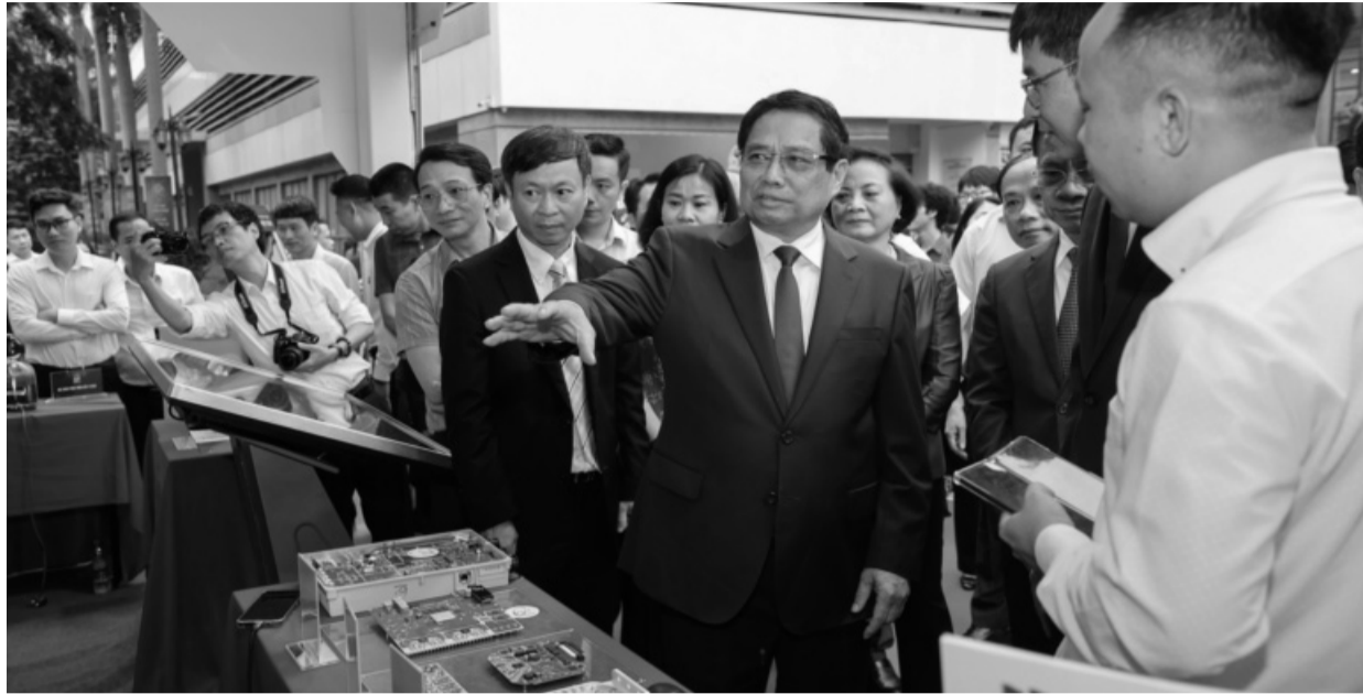
Thủ tướng Phạm Minh Chính thăm gian trưng bày đổi mới sáng tạo và chuyển đổi số của Học viện Công nghệ Bưu chính Viễn thông.