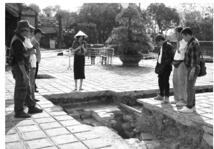
● Khai quật khảo cổ di tích Đại Cung Môn - Đại nội Huế.