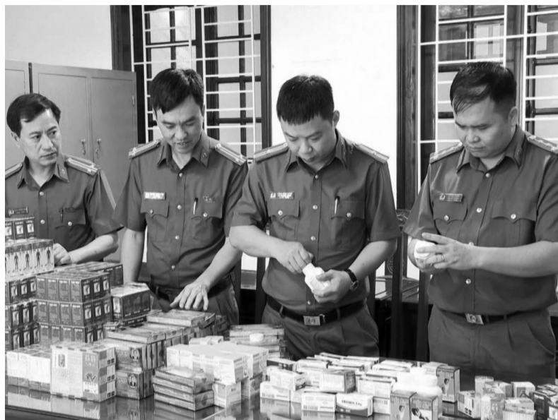
● Lực lượng công an kiểm tra số thuốc giả thuộc đường dây sản xuất, buôn bán thuốc giả quy mô lớn.

Theo Bộ Y tế, trong số 21 sản phẩm bị thu giữ, có 4 loại được xác định là giả mạo các loại thuốc đã được Bộ Y tế cấp phép lưu hành. 16 sản phẩm còn lại không có tên trong danh mục các loại thuốc đã được Bộ Y tế cấp giấy đăng ký lưu hành, đồng nghĩa với việc đây là các sản phẩm không rõ nguồn gốc, không được phép lưu hành tại Việt Nam.