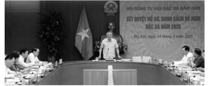
Phó Thủ tướng Thường trực Chính phủ Nguyễn Hòa Bình phát biểu chỉ đạo tại cuộc họp.

Chiều 24/4, Phó Thủ tướng Thường trực Chính phủ Nguyễn Hòa Bình, Chủ tịch Hội đồng Tư vấn đặc xá năm 2025 chủ trì cuộc họp Hội đồng Tư vấn đặc xá năm 2025 để xét duyệt hồ sơ, danh sách đề nghị đặc xá năm 2025 nhân dịp kỷ niệm 50 năm Ngày Giải phóng miền Nam, thống nhất đất nước.