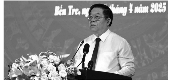
● Trưởng Ban Tuyên giáo và Dân vận Trung ương Nguyễn Trọng Nghĩa phát biểu tại Lễ kỷ niệm.

Phát biểu tại buổi lễ, Trưởng Ban Tuyên giáo và Dân vận Trung ương Nguyễn Trọng Nghĩa cho biết, Bến Tre là vùng đất truyền thống cách mạng, địa linh nhân kiệt, là “cái nôi” của phong trào Đồng khởi với 8 chữ vàng “Anh dũng Đồng khởi, thắng Mỹ, diệt ngụy” đã trở thành biểu tượng tiêu biểu cho tinh thần cách mạng tiến công, thắp lên ngọn lửa đấu tranh trong lòng miền Nam, đưa phong trào kháng chiến lên một tầm cao mới.